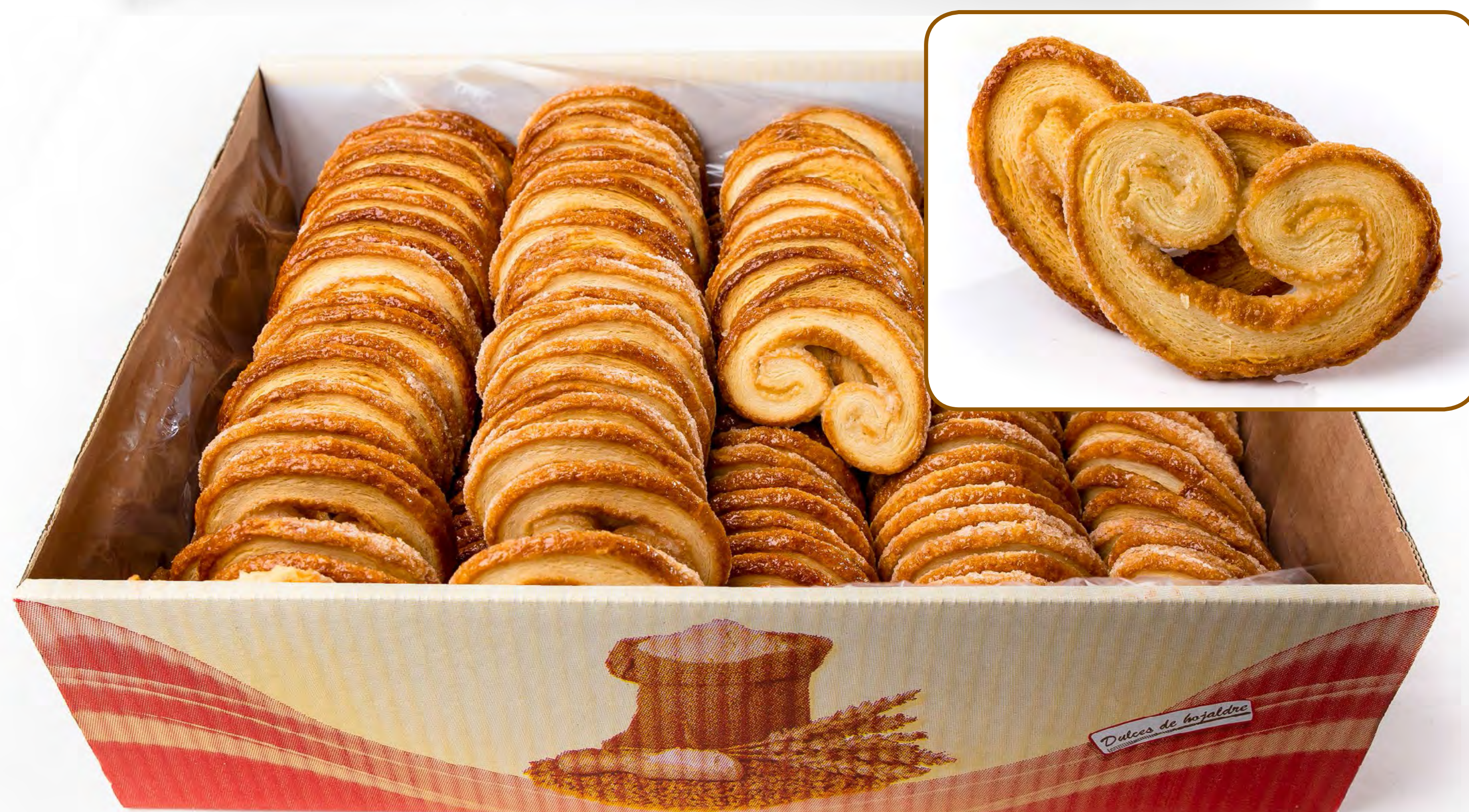
Cod. 018009 - Palmeras Seca 2 Kg.