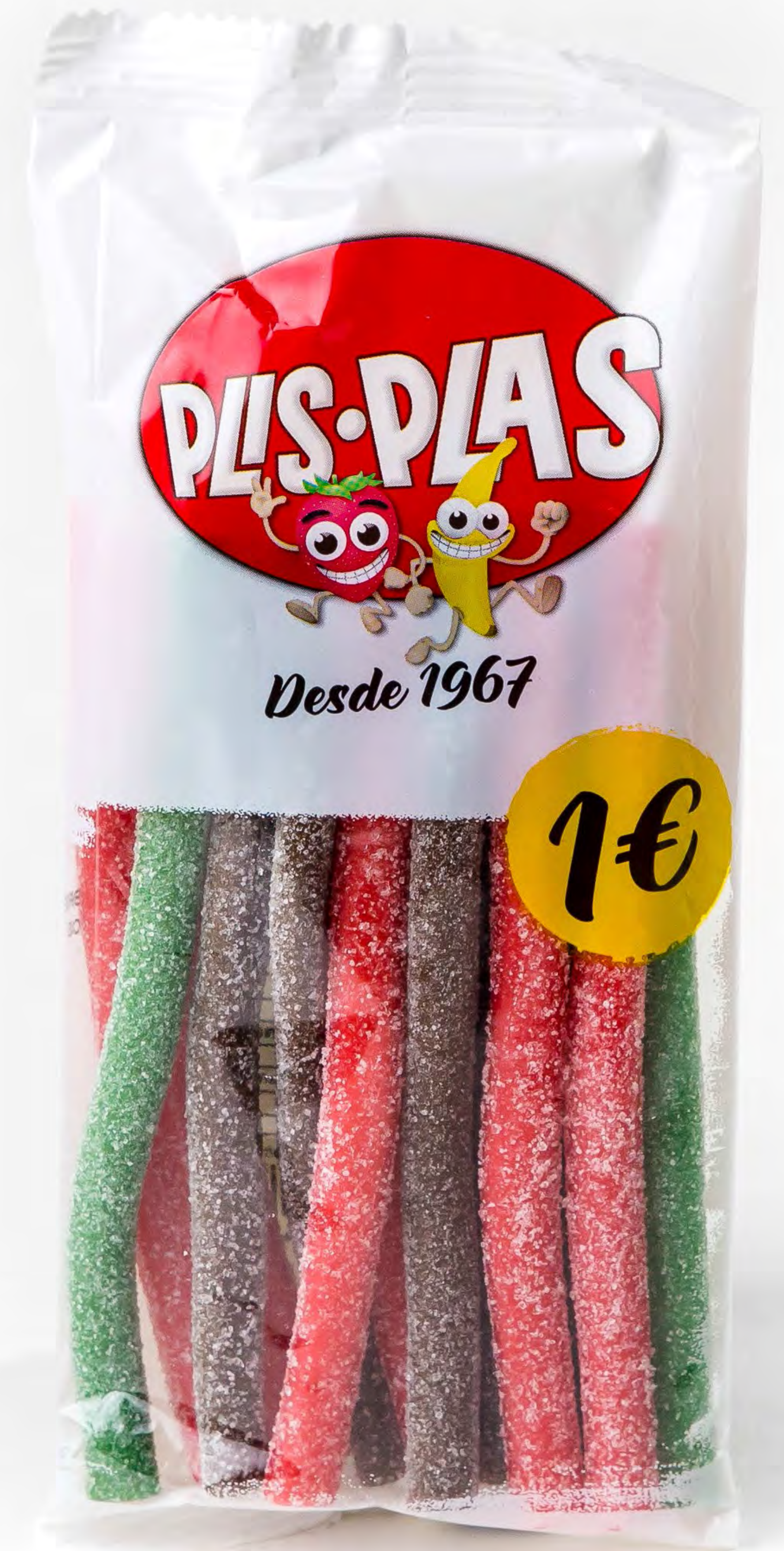
Plispalitos Pica 12und/caja