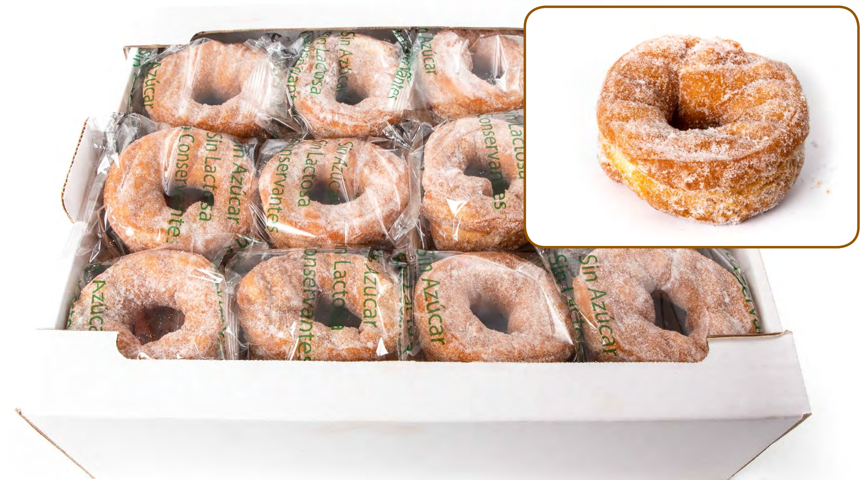
Rosco Frito S/A SIN LACTOSA S/A 2 Kg.