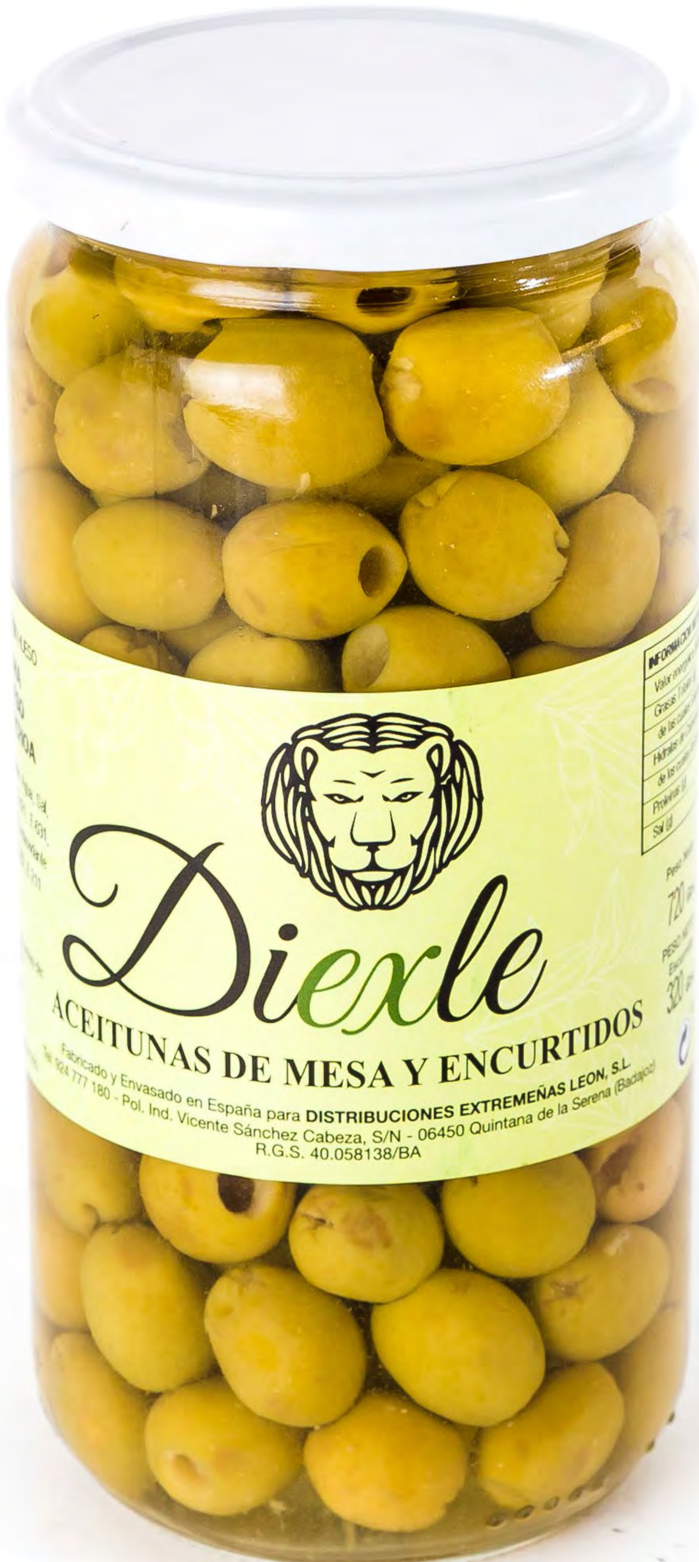
Aceituna Diexle Sin Huevo 8 uds/caja