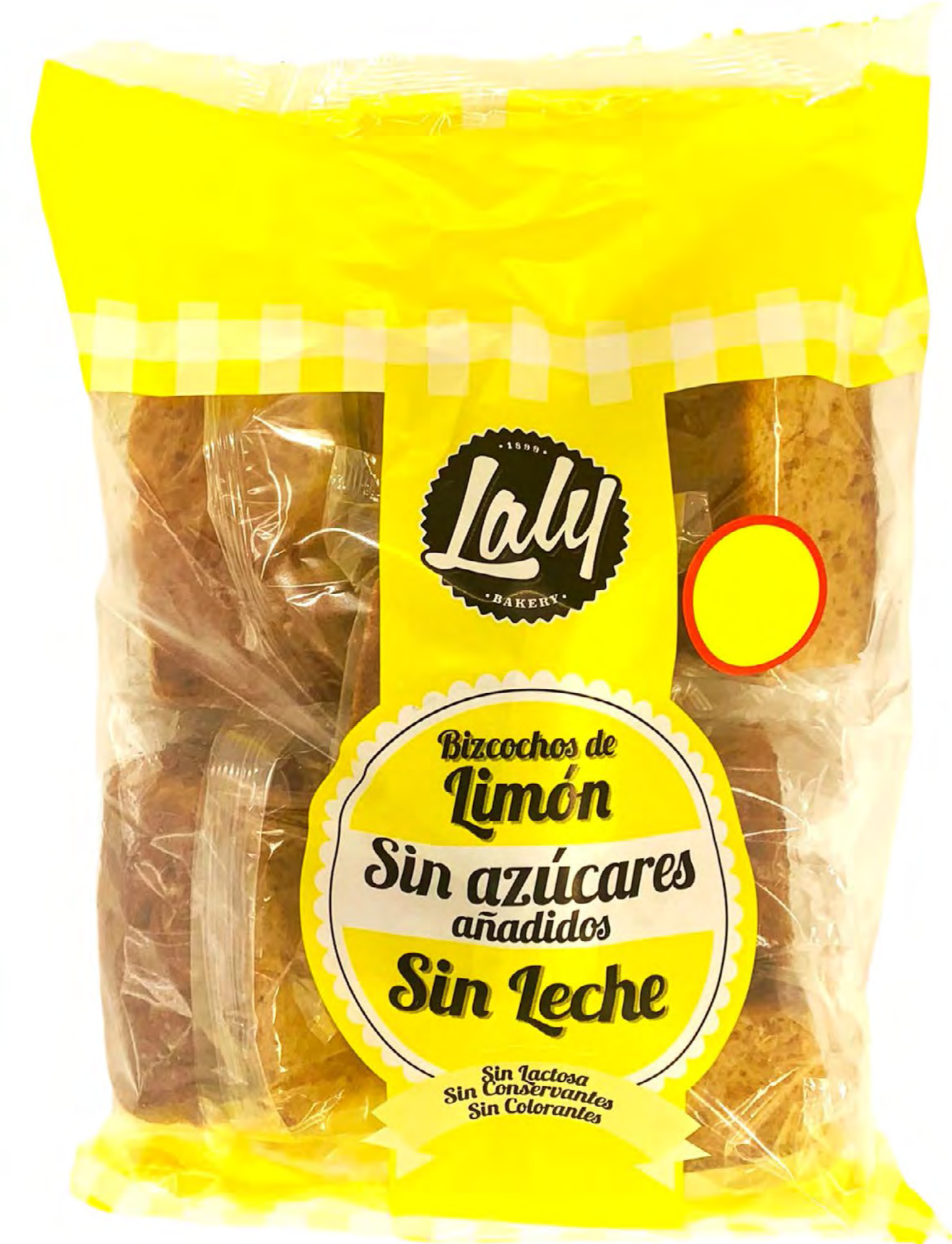
Bolsón Bizcochos Limón SIN LACTOSA 5 uds/caja