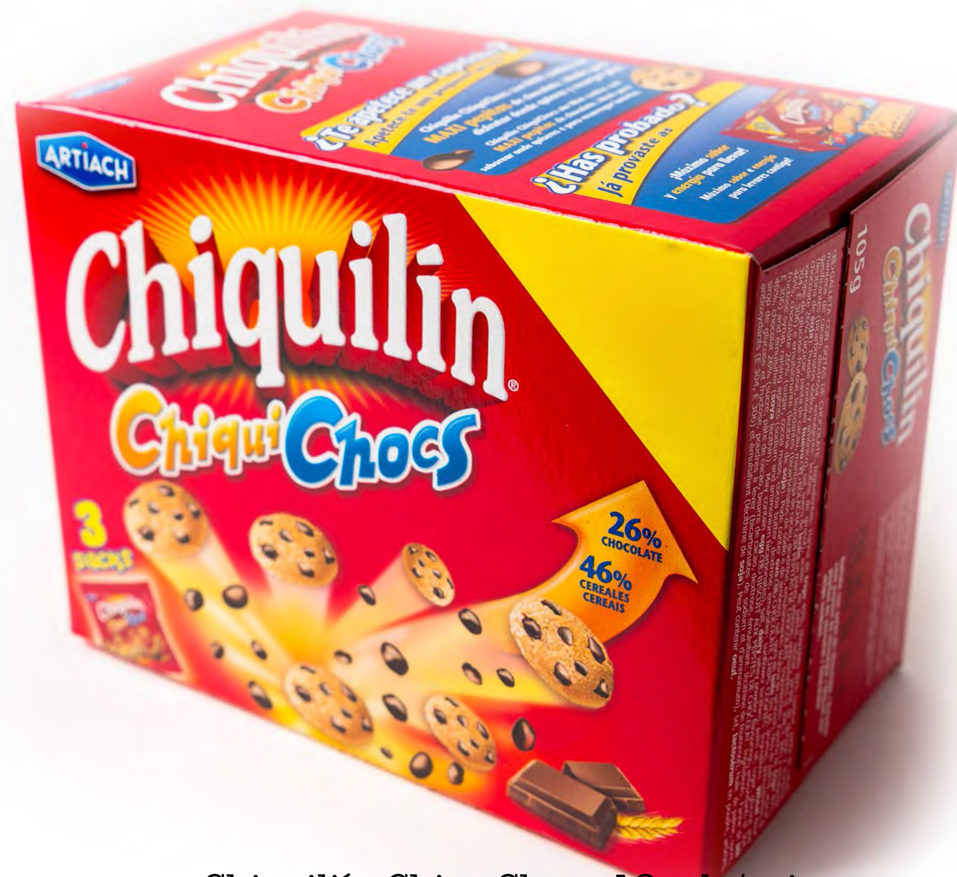
Chiquilín Chips Chocs 12 uds/caja