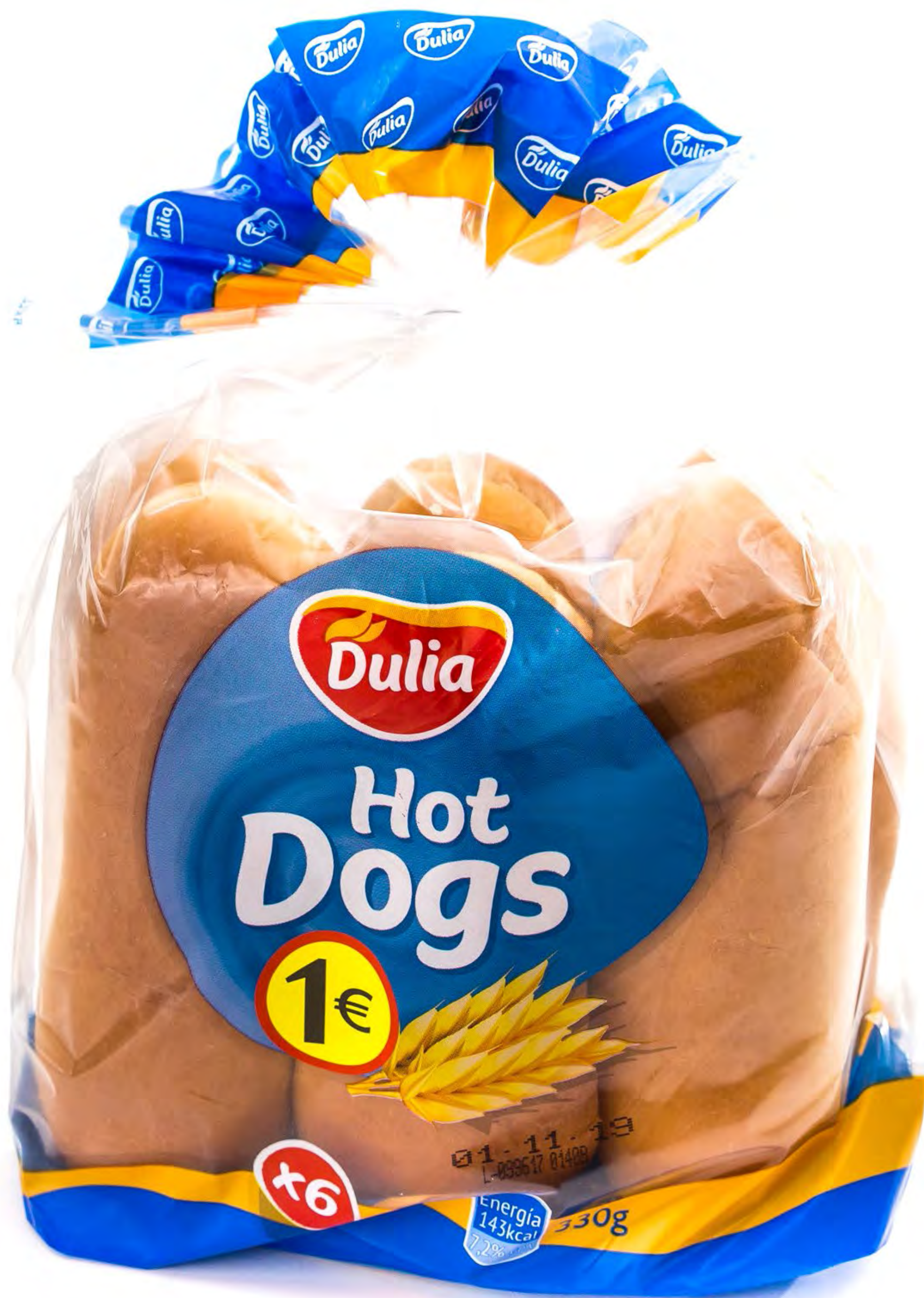
Cod. 124003 Pan de Perrito 6 uds/caja