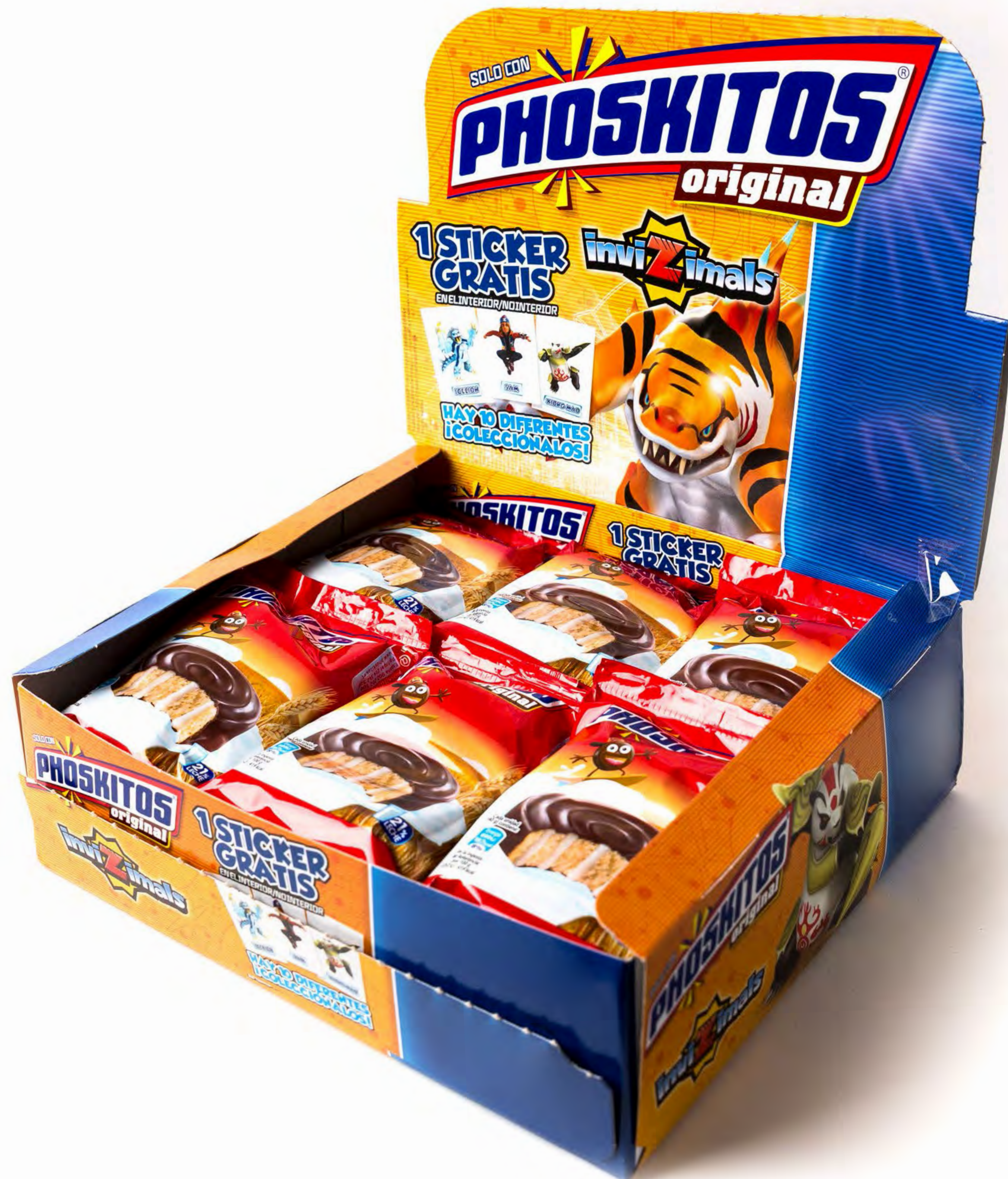
Phoskitos 9 uds/caja