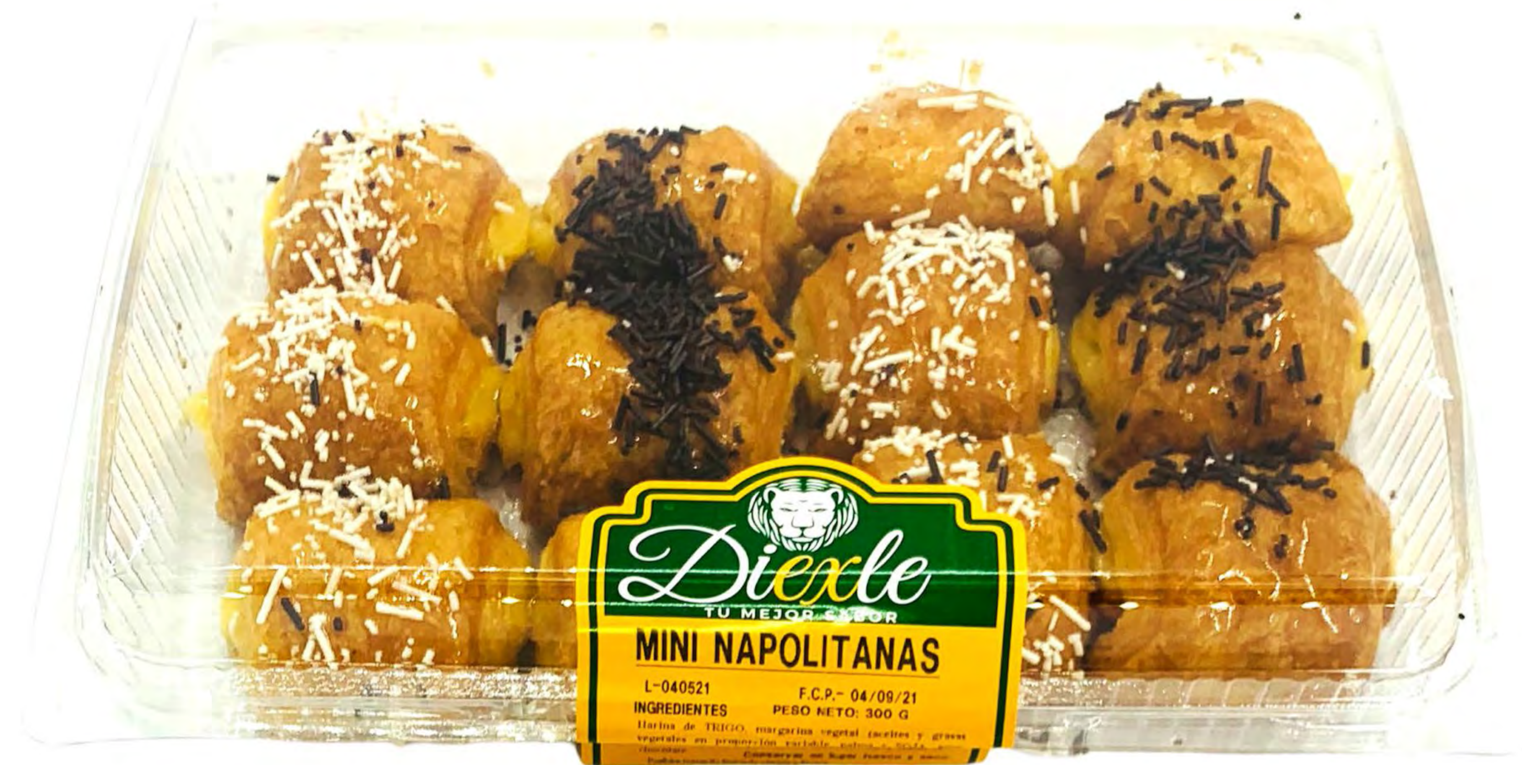
Napolitana Crema-fideos 8 uds/caja