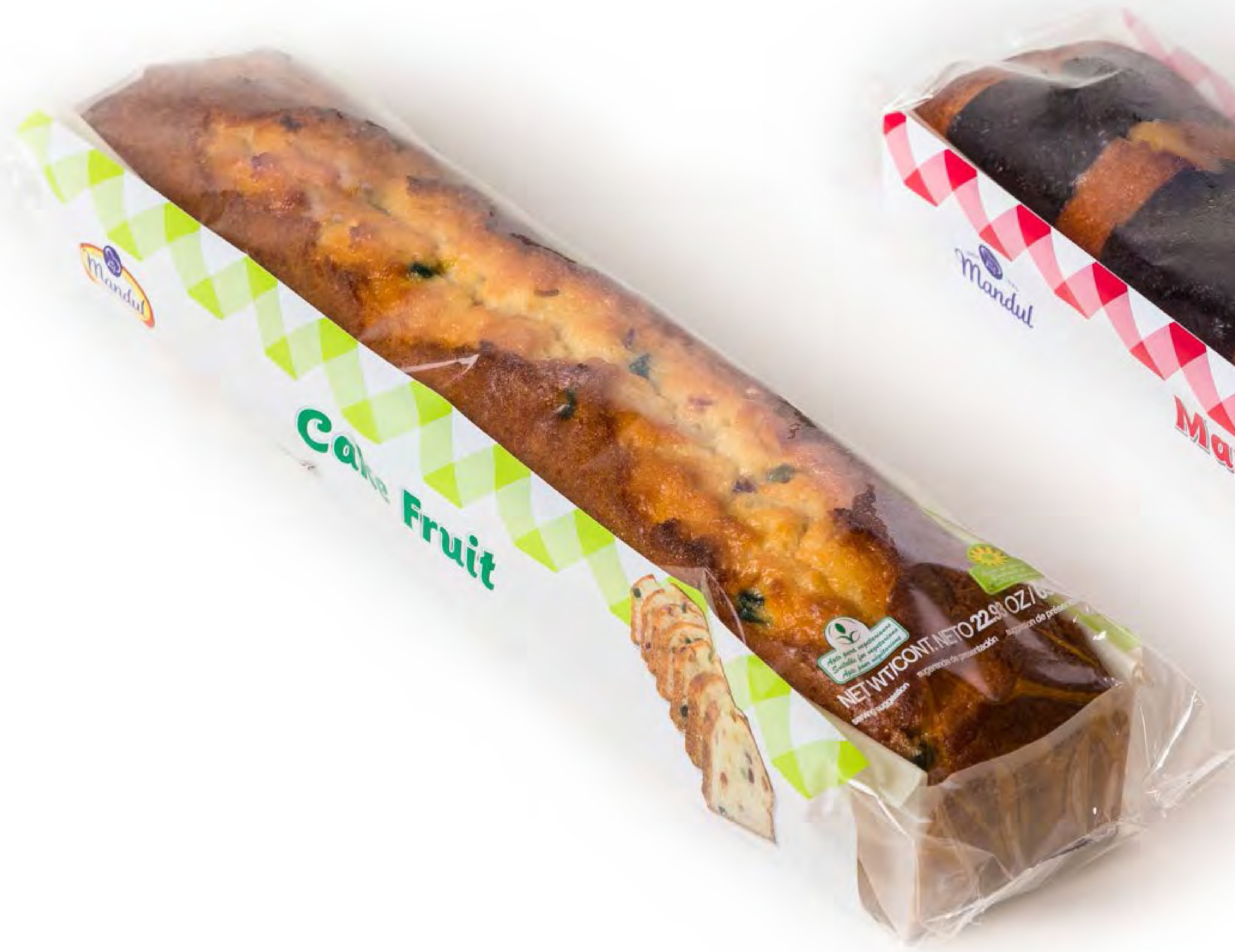
Cake Fruit 5 uds/caja 500g.