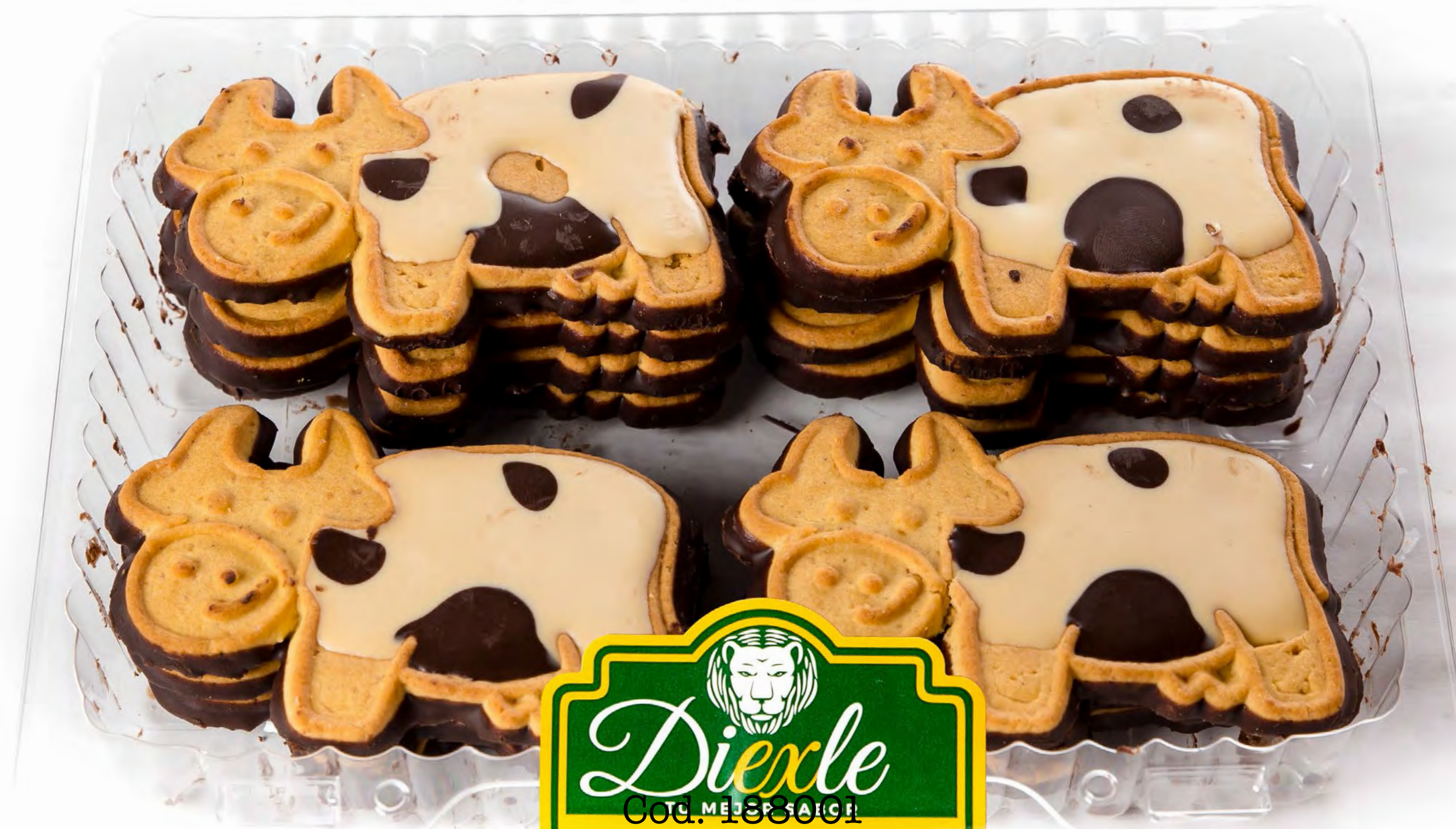
Dutico Galletas Vacas 6und/caja