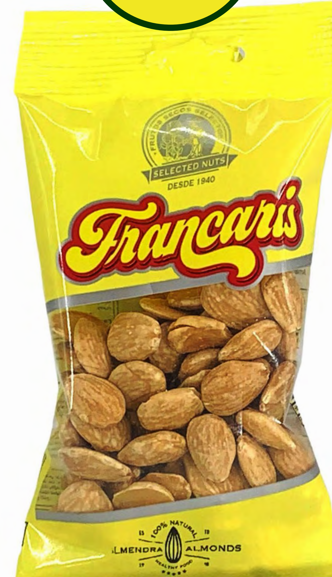
Almendra 8 und/caja