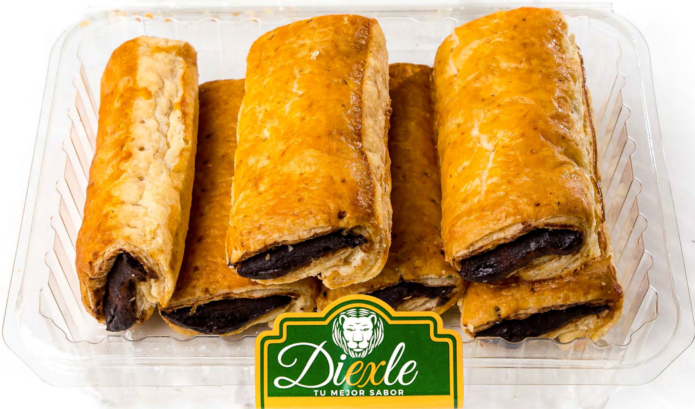
Cod.066037 Cañas Choco Sin Azúcar 8 uds/caja