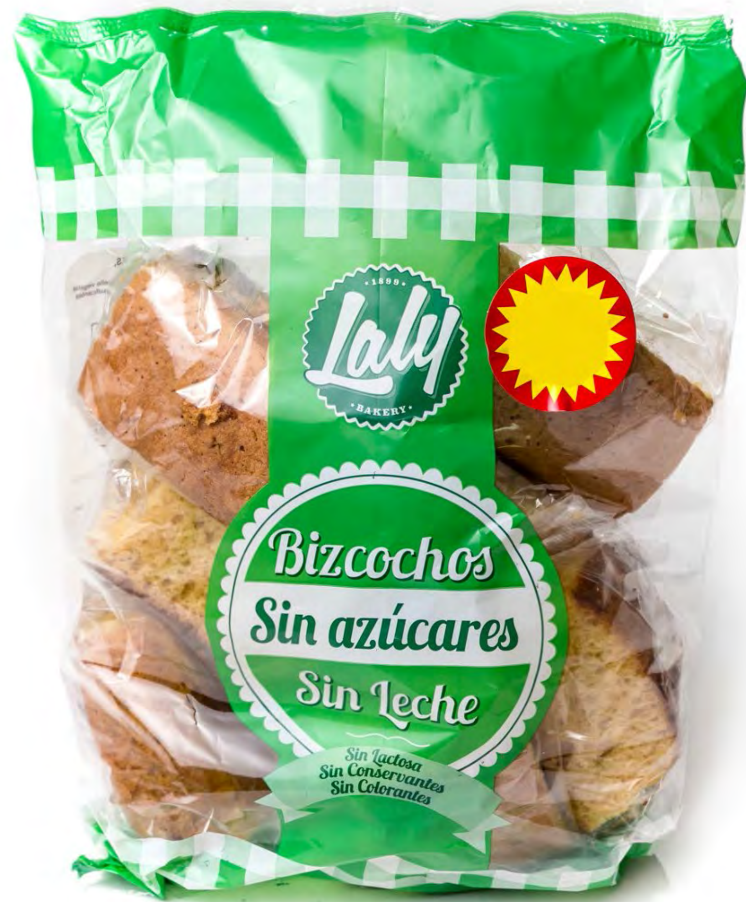
Bolsón Bizcochos S/A SIN LACTOSA 10 uds/caja