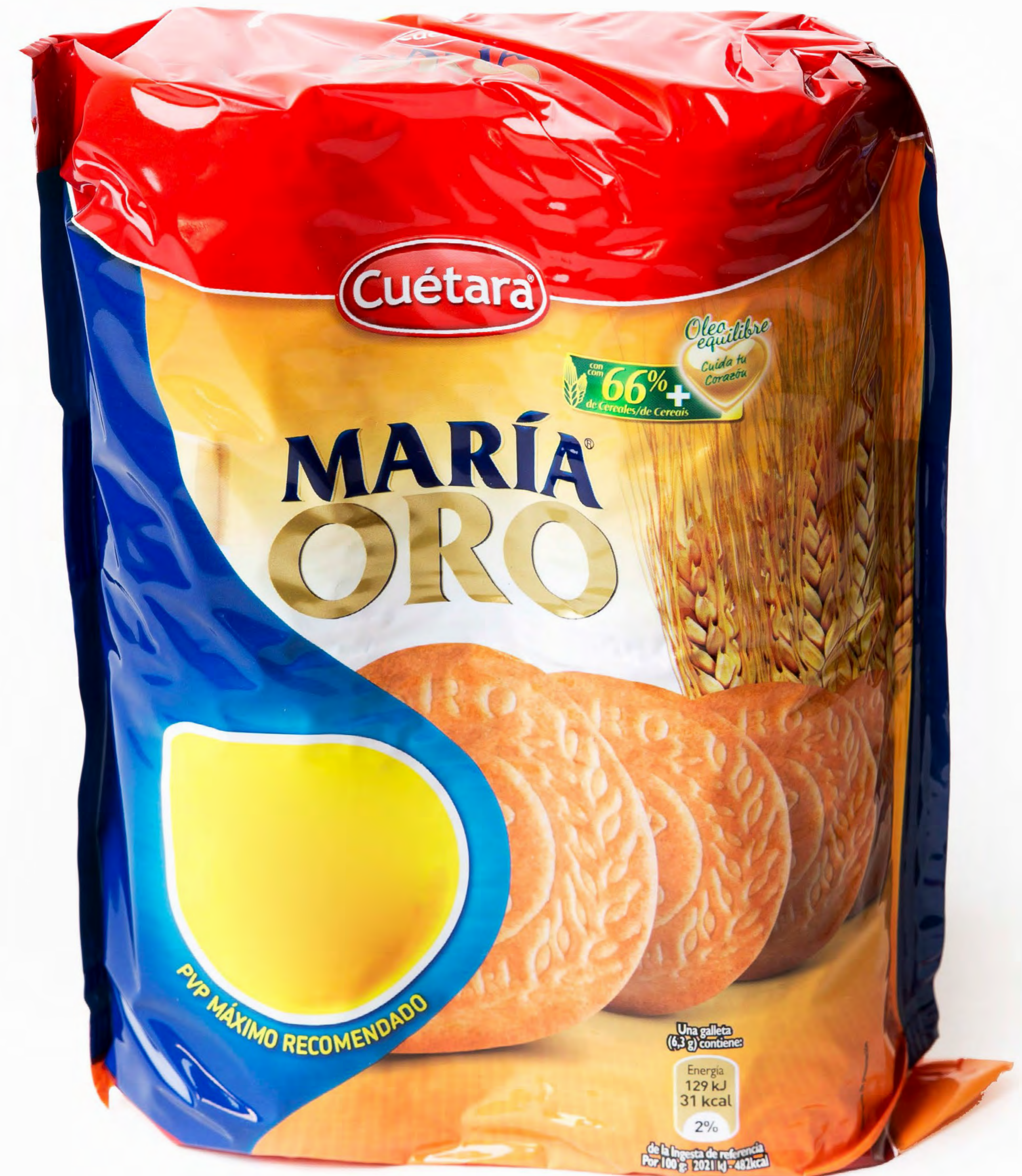
María Oro 24 uds/caja