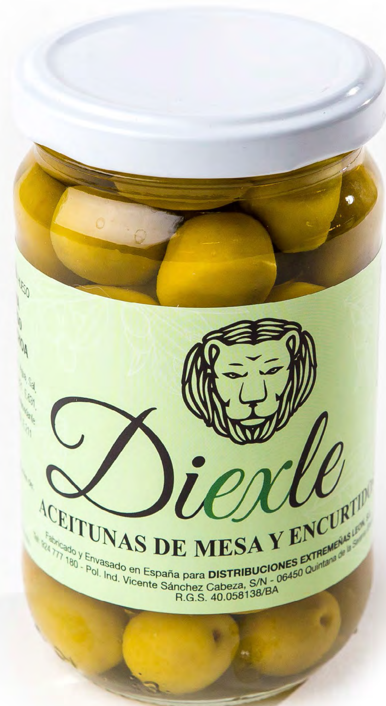
Cod. 185014 Aceitunas HUESO SABOR ANCHOA 12 uds/caja