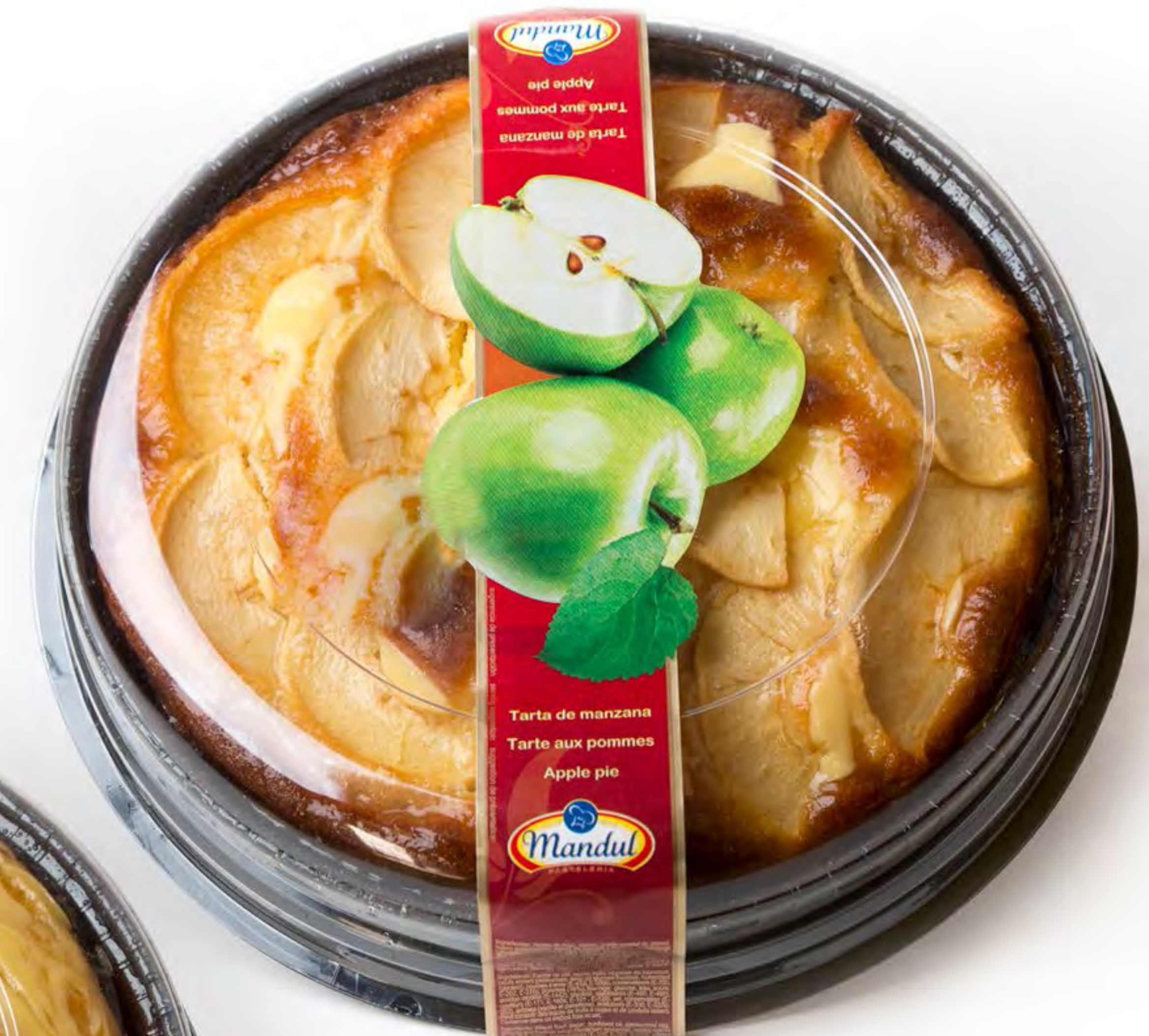
Tarta Manzana 6 uds/caja