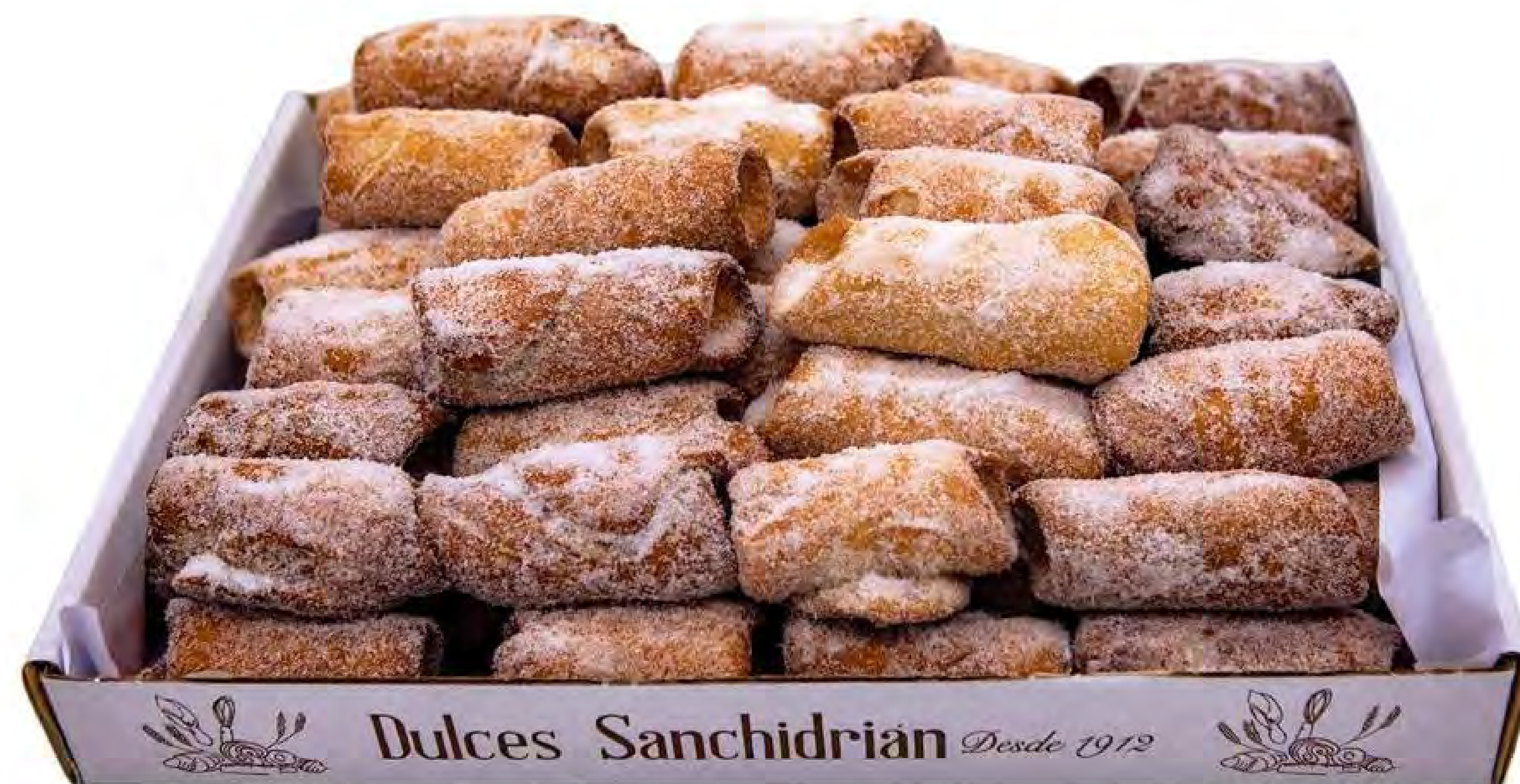
Cod. 260003 - Rulitos Rellenos Crema 2kg.