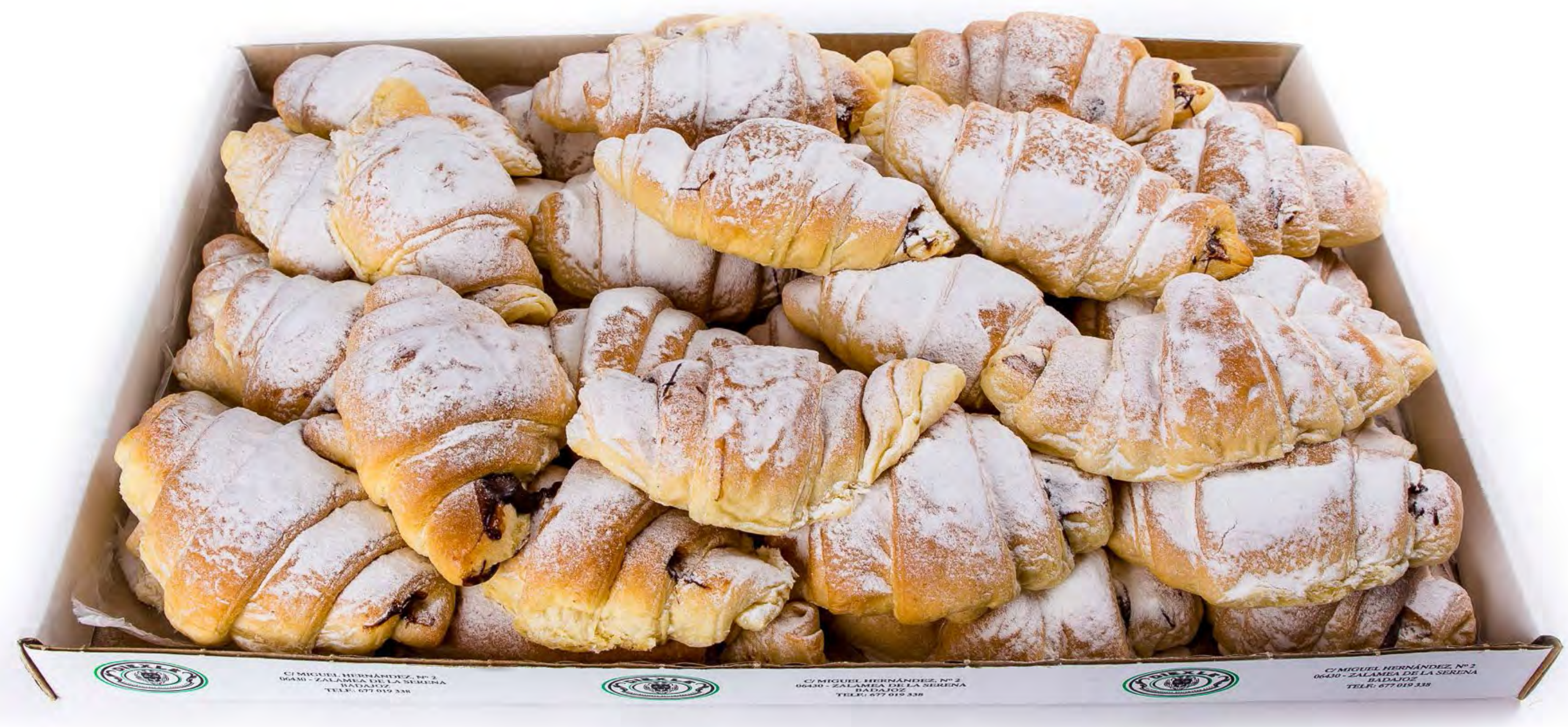
cod. 122002 Croissant Glass Choco 2kg