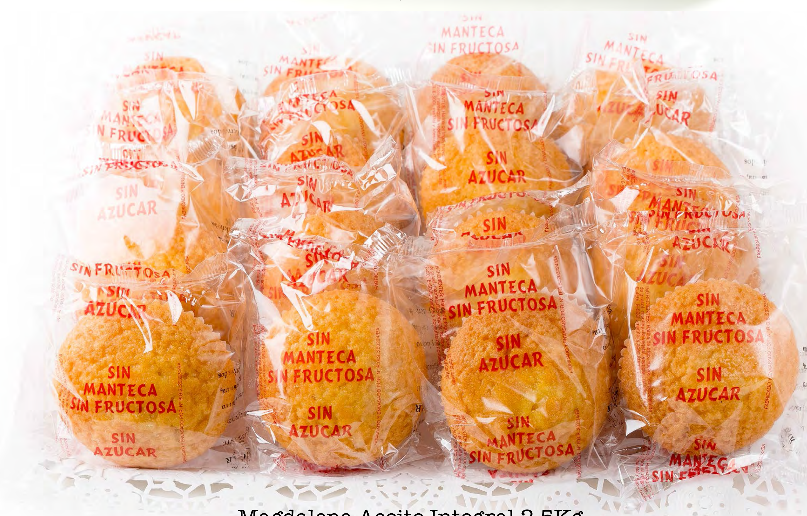
Magdalena Aceite Integral 2,5Kg.