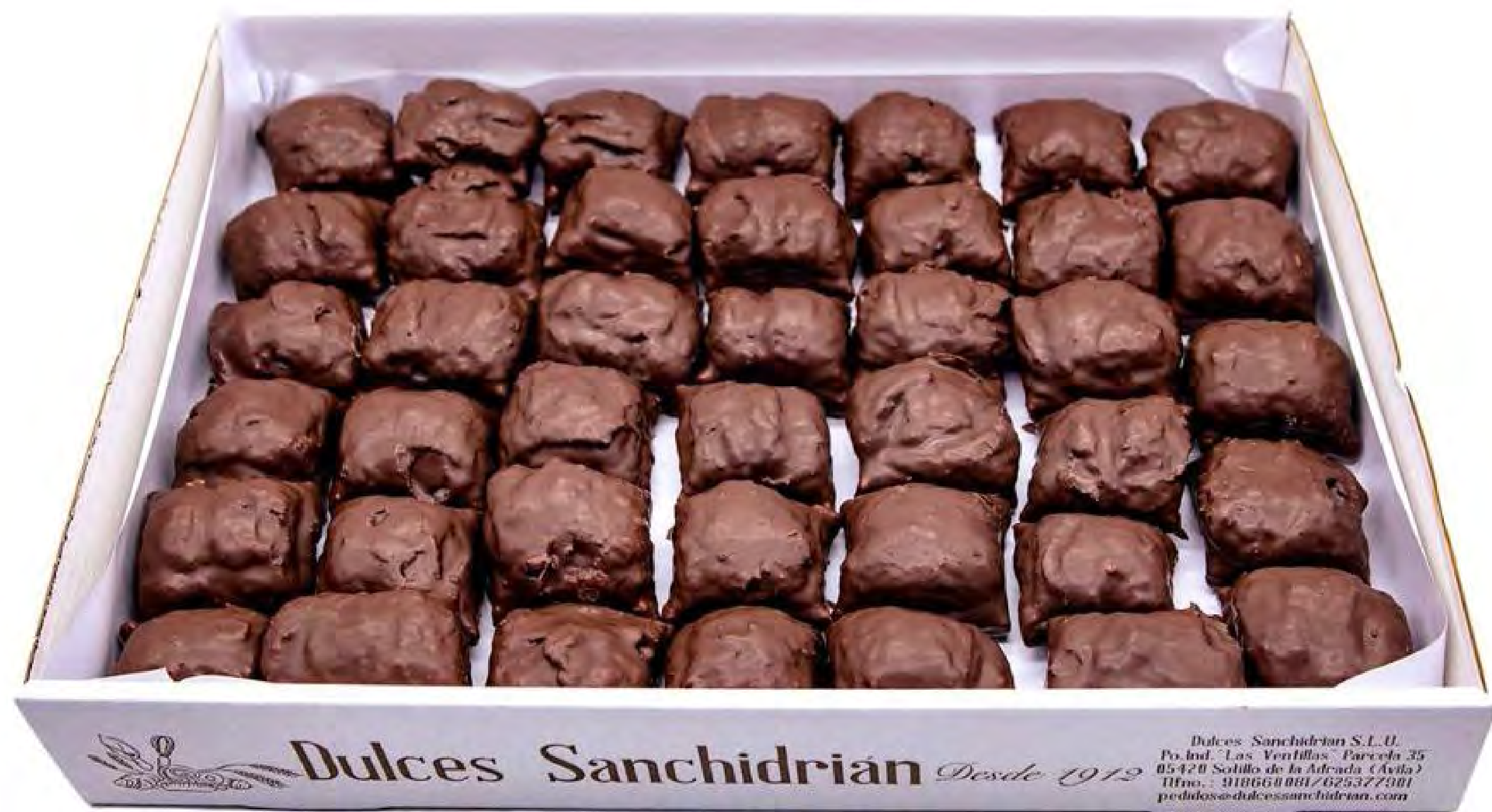
Cod. 260002 - Canelitos Chocolate 2Kg