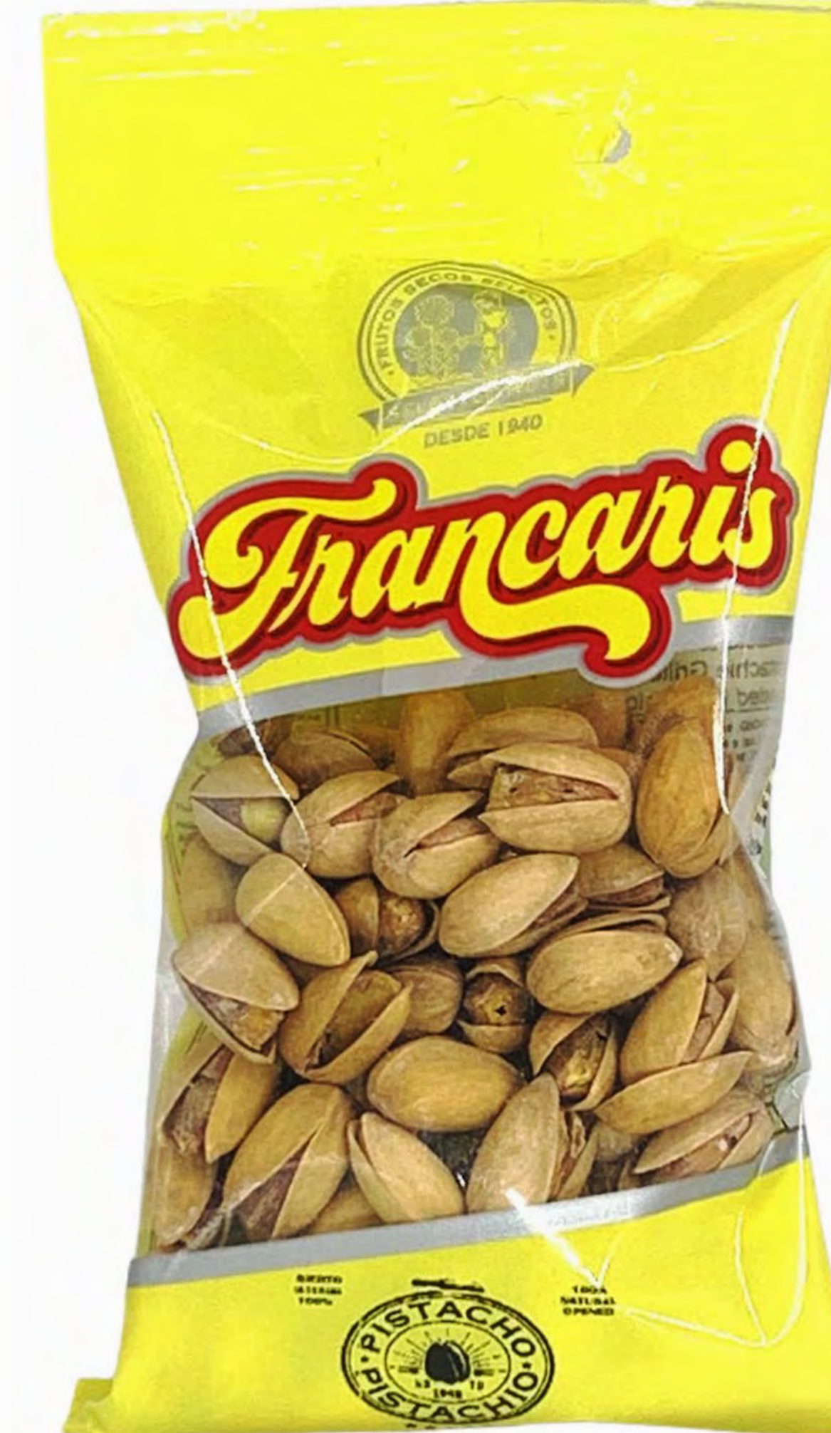
Pistacho 8 und/caja