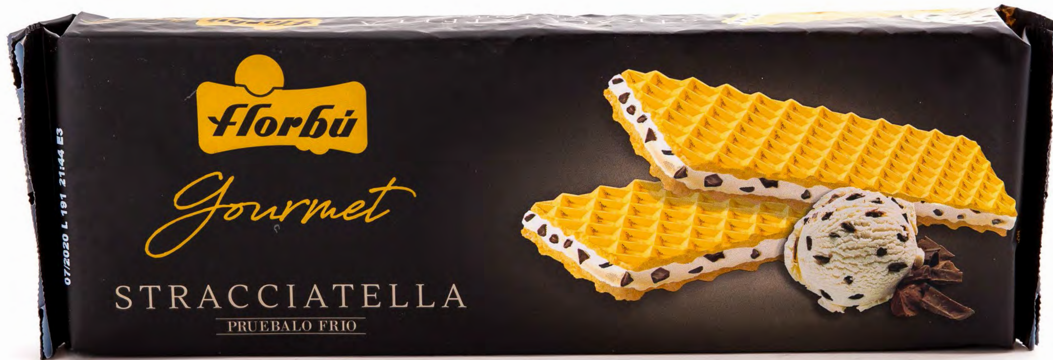
Boe Stracciatella 26 uds/cajo