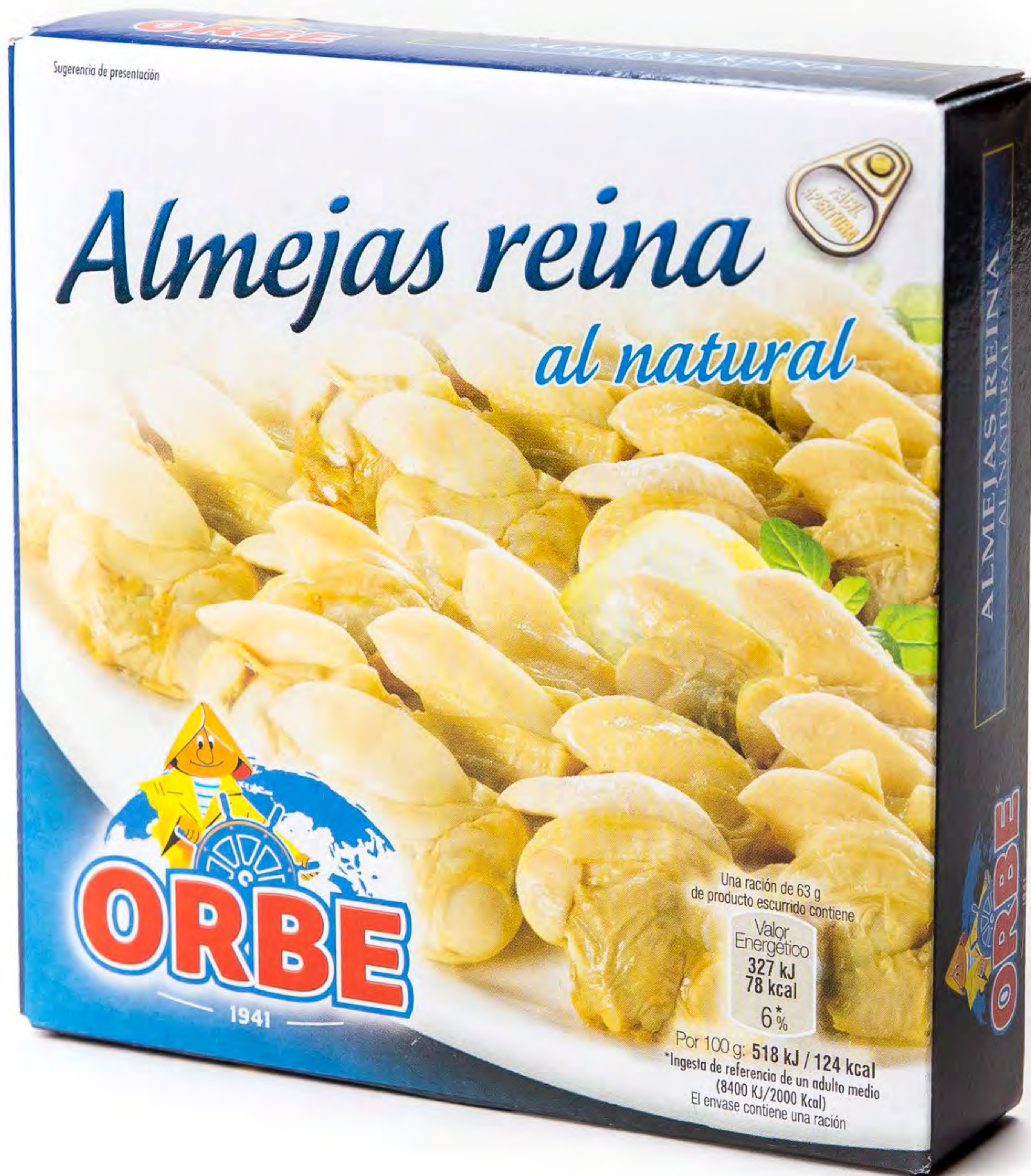
256008 - Almejas Reina al Natural 12 uds/caja