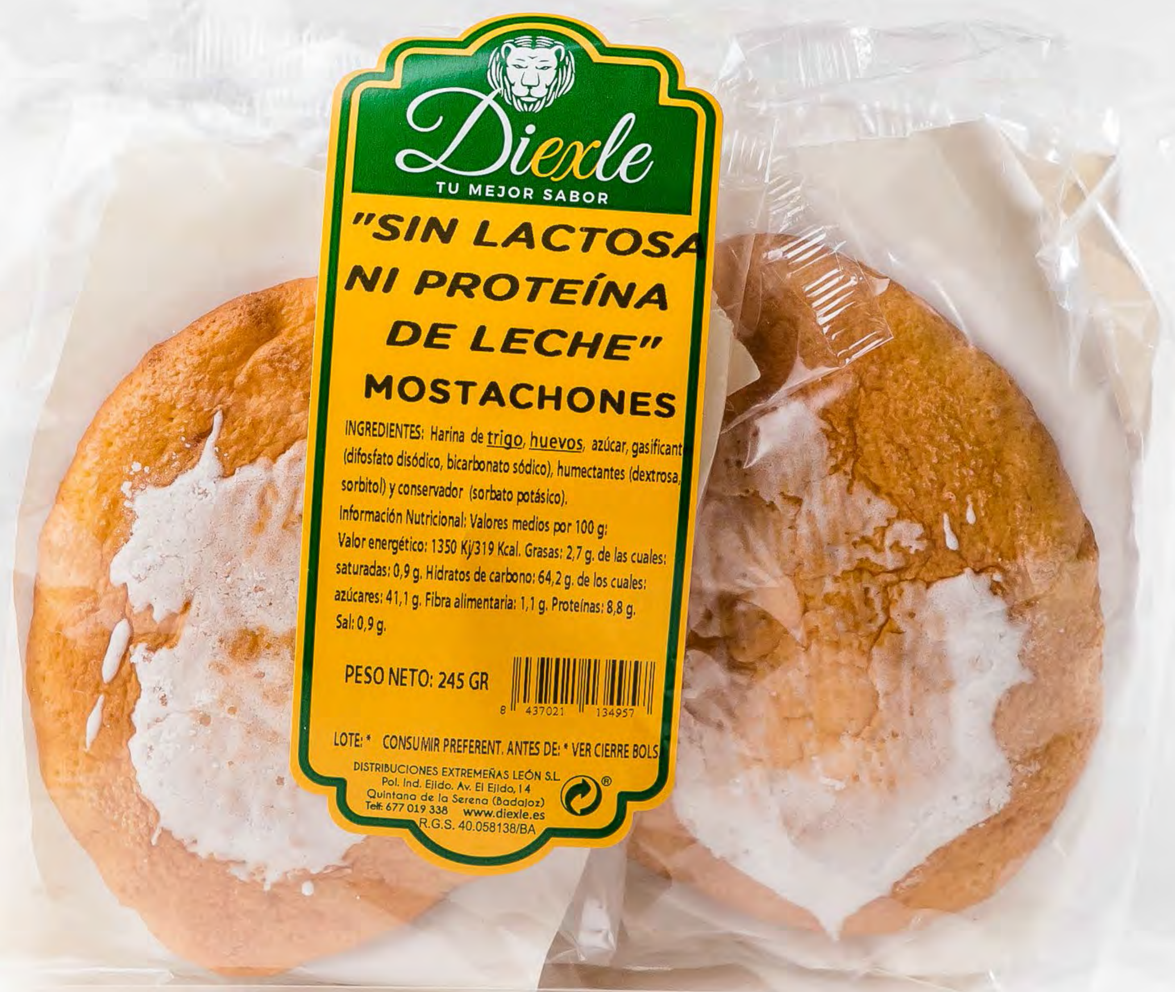
Cod. 004006 Mostachones Diexle 8 und/caja