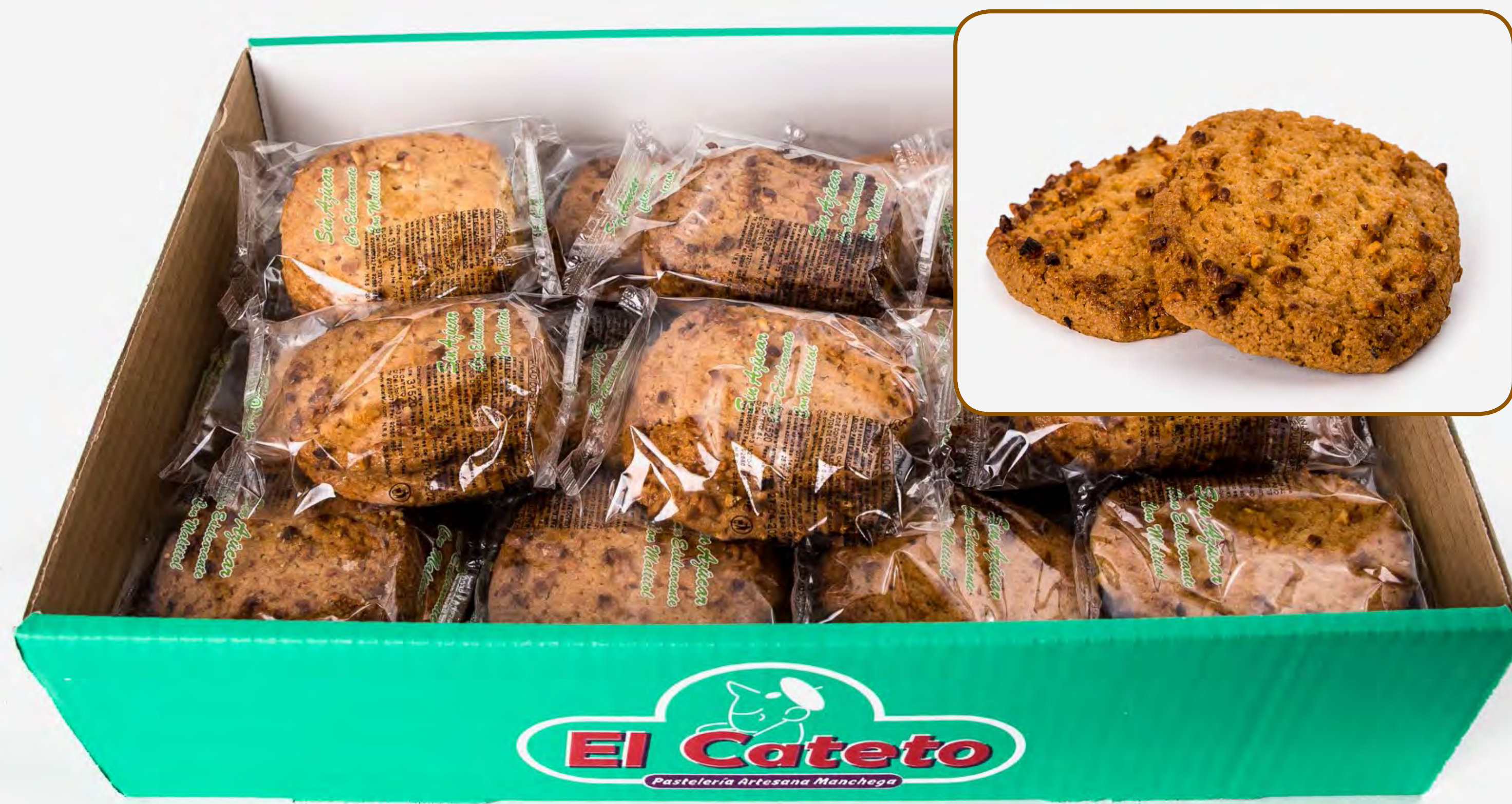
Pastas Naranja S/A 2 Kg.