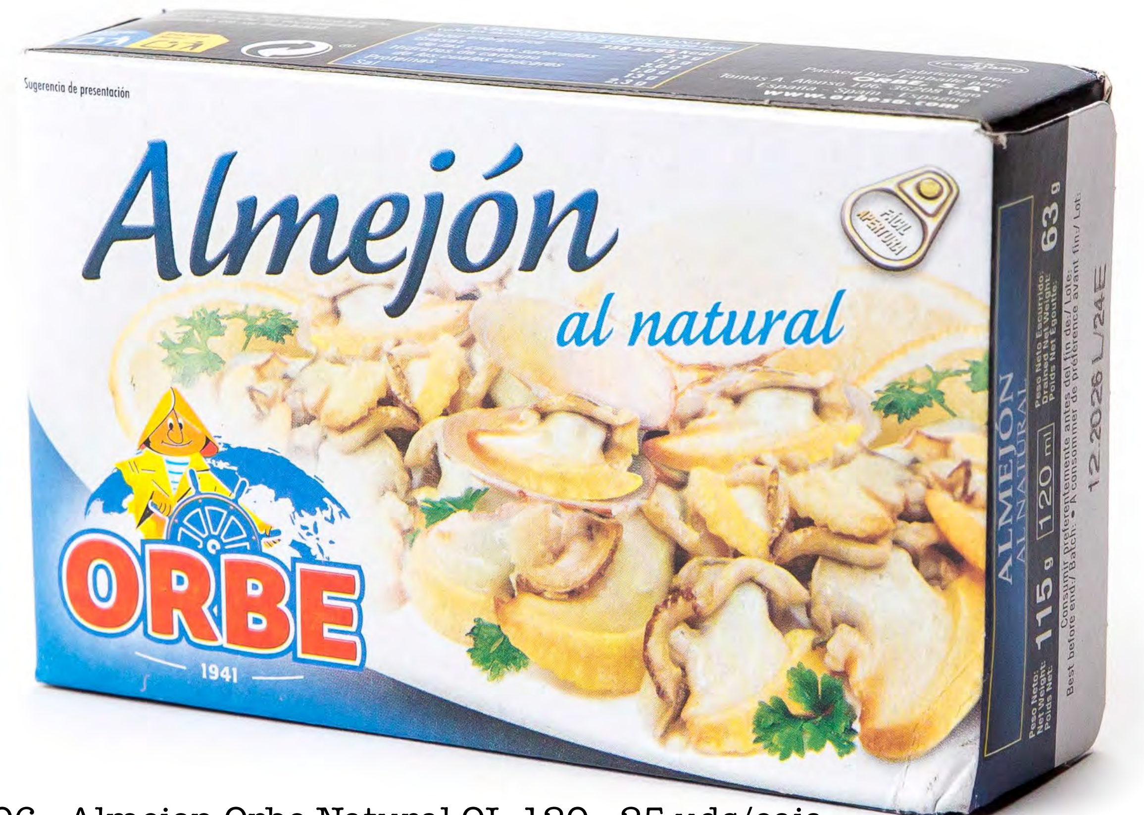
Cod. 256006 - Almejón Orbe Natural OL-120 - 25 uds/caja