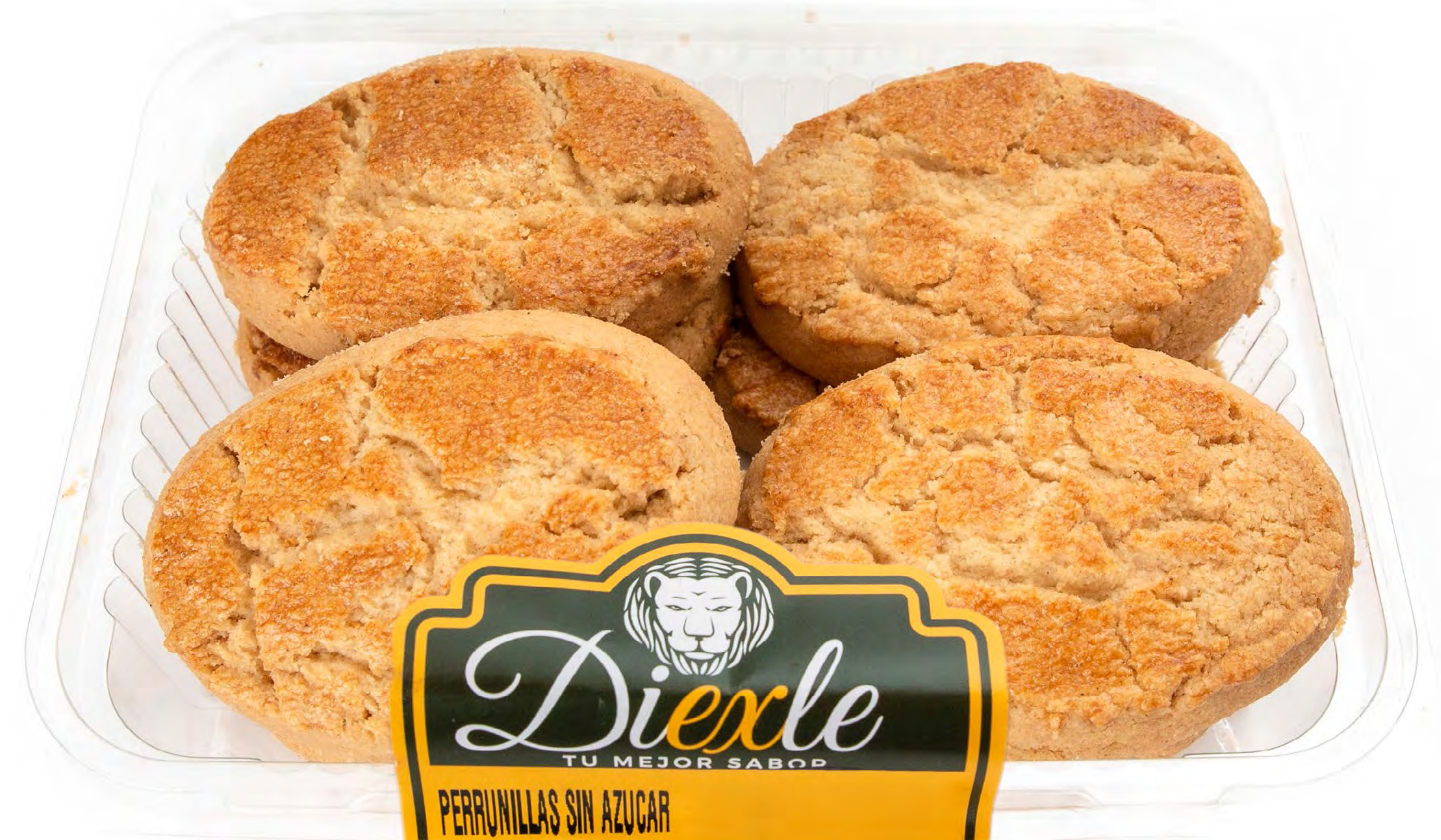
Perrunillas S/A 10 und/caja