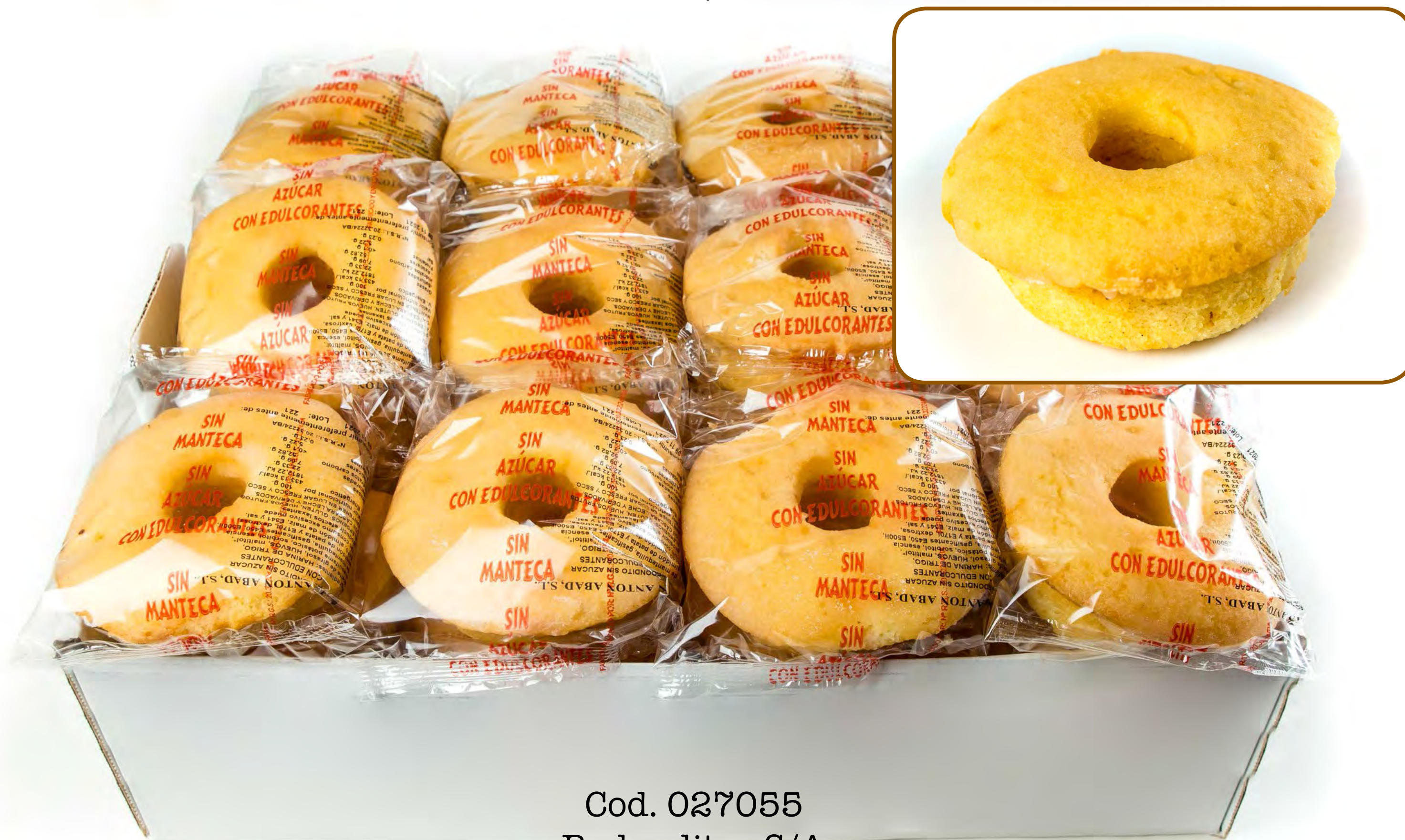
Cod. 027055 Redonditos S/A