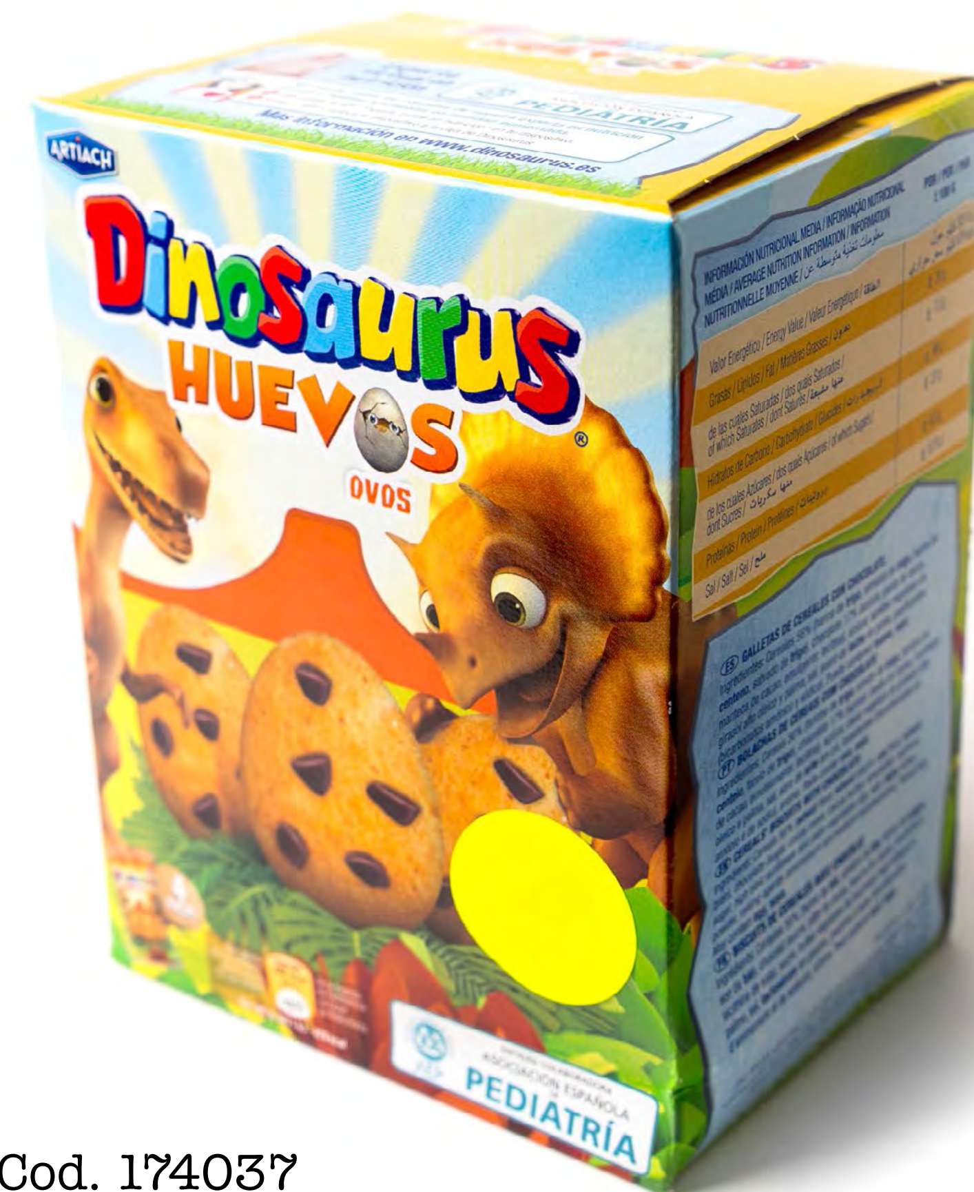
Cod. 174037 Dinosaurus Huevo 12 uds/caja