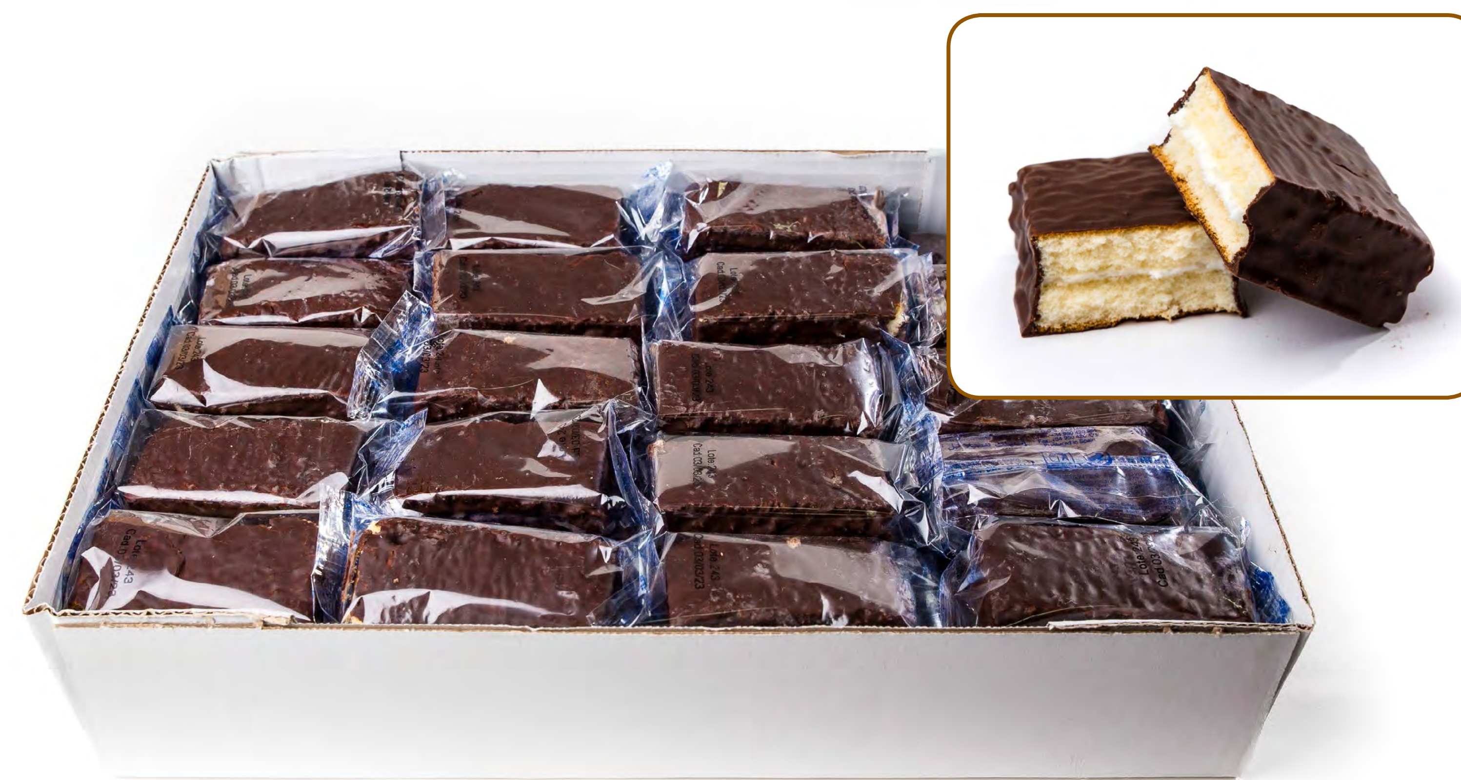
Cod. 026016 - Sara Cacao 1x1 2 kg.