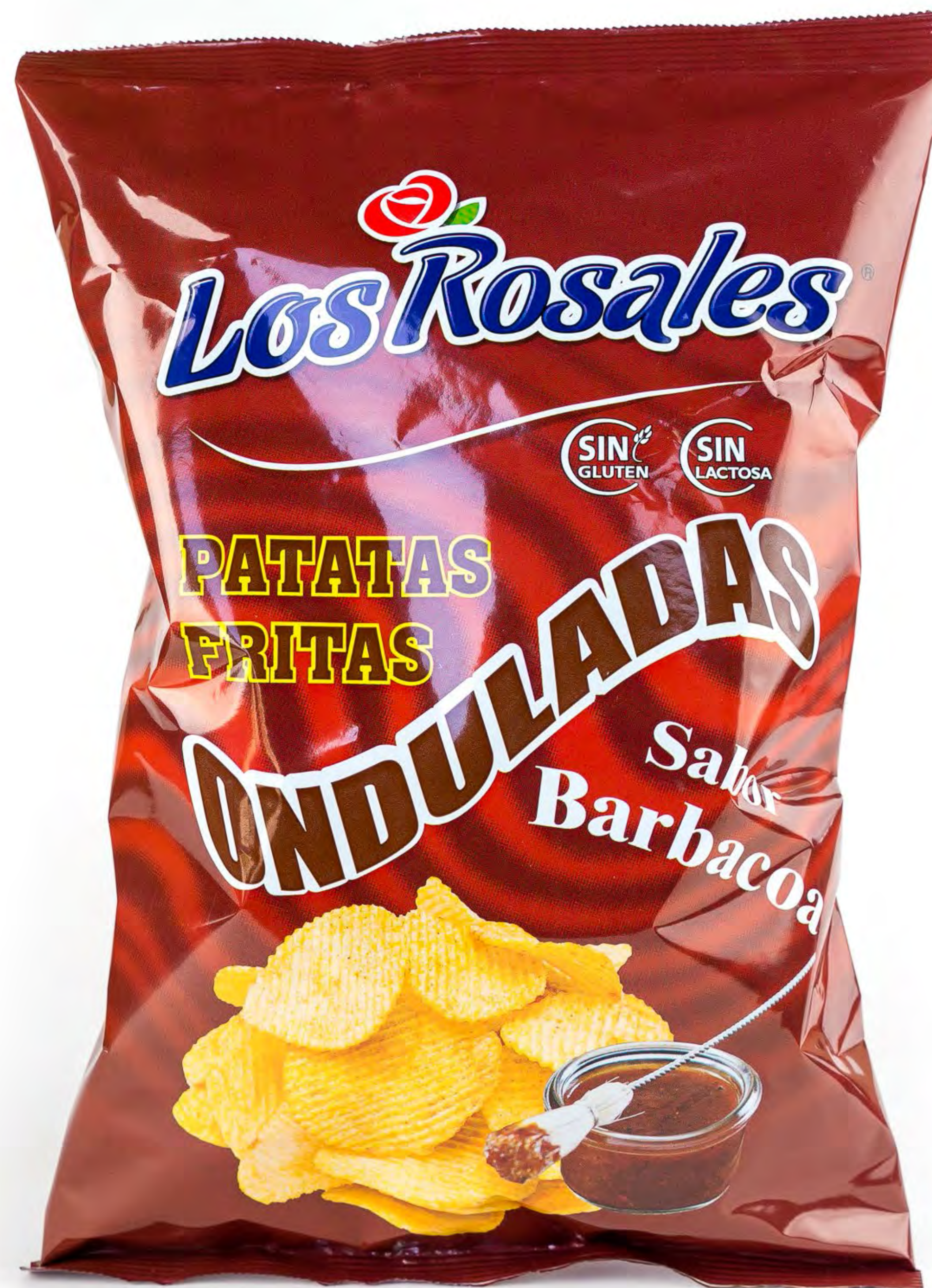
Cod.002011 Patatas Sabor Barbacoa 140 g. x 12 uds/caja