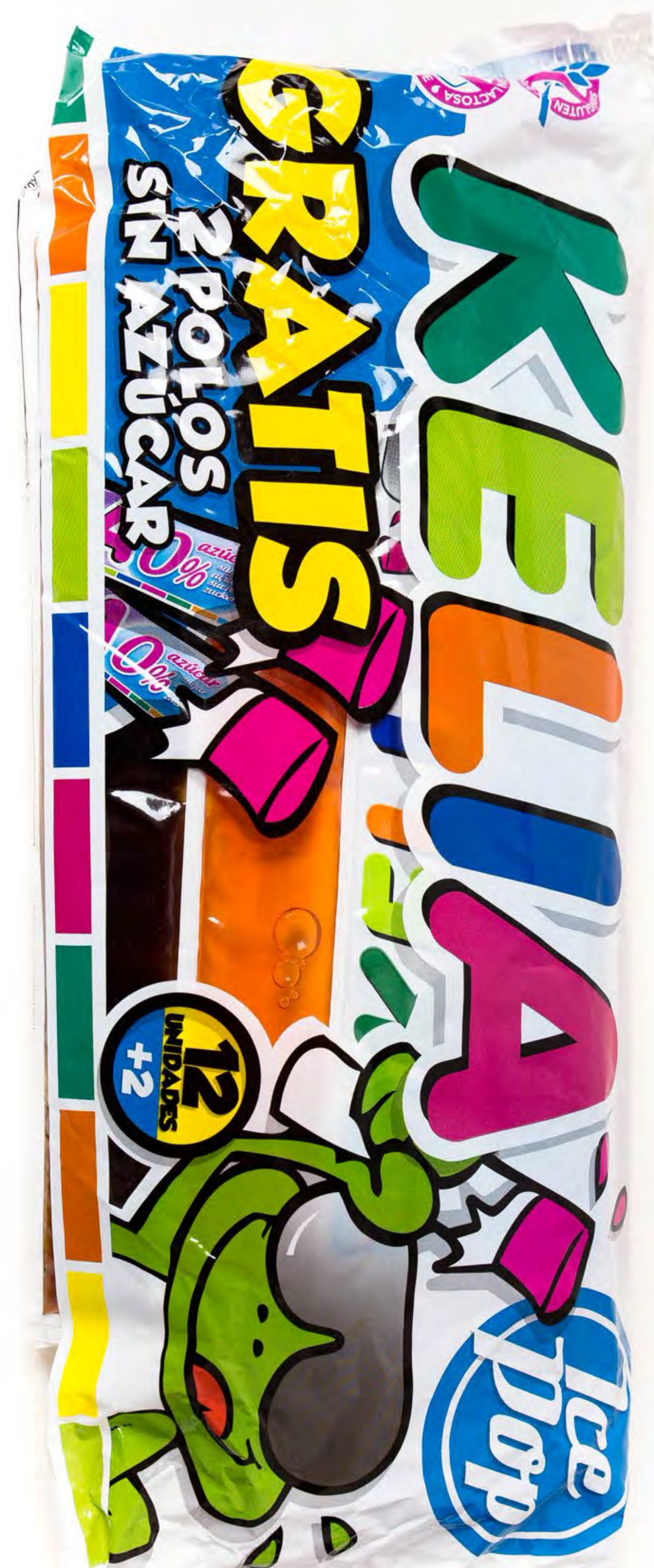
Polos Kelia 12 uds/bolsa