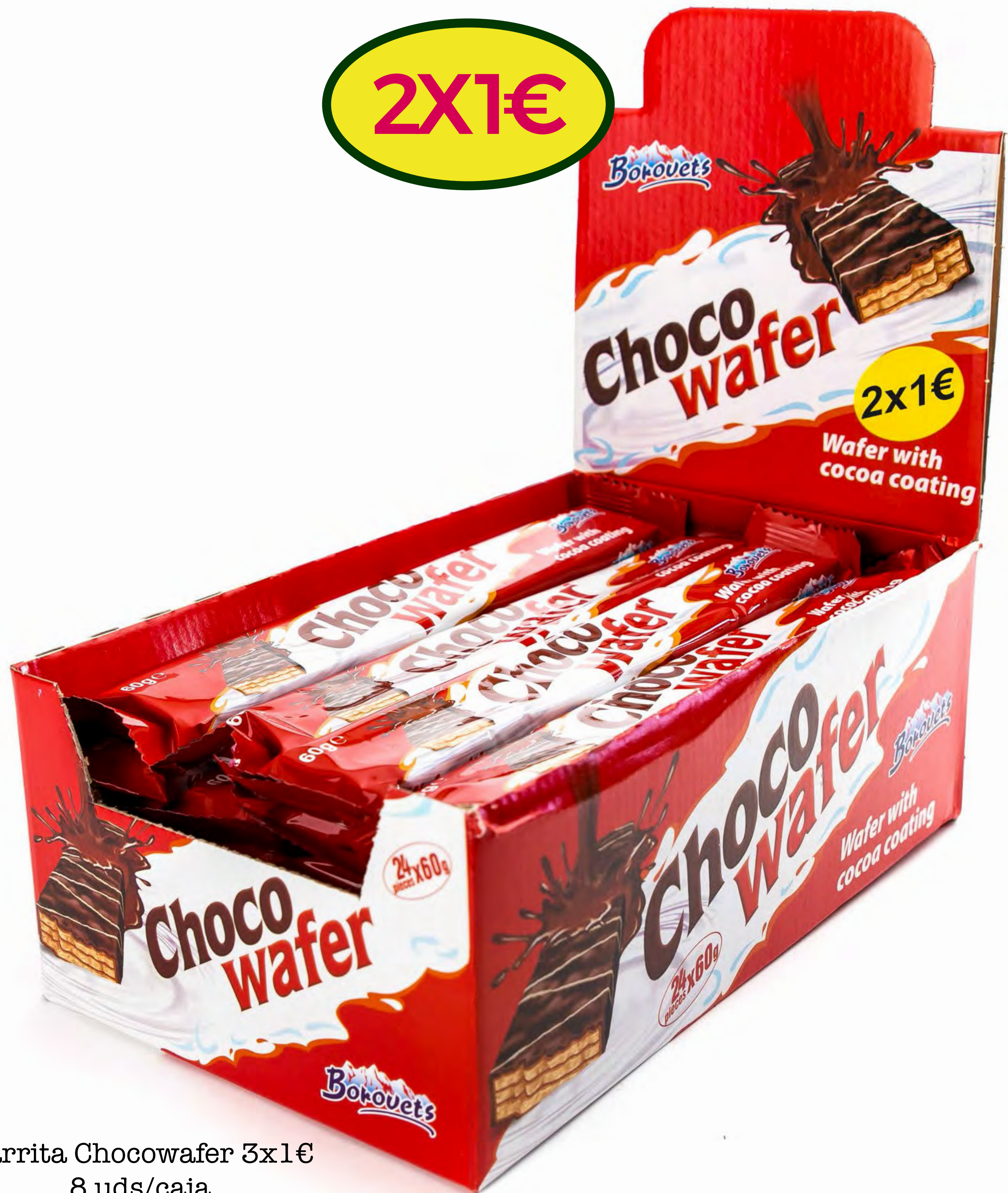
Barrita Chocowafer 3x1€ 8 uds/caja