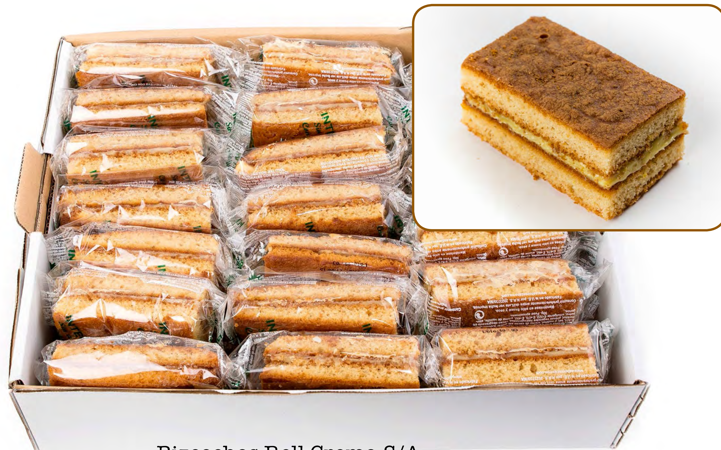
Biscochos Rell Crema S/A Maltitol Sin Lactosa 2 Kg.