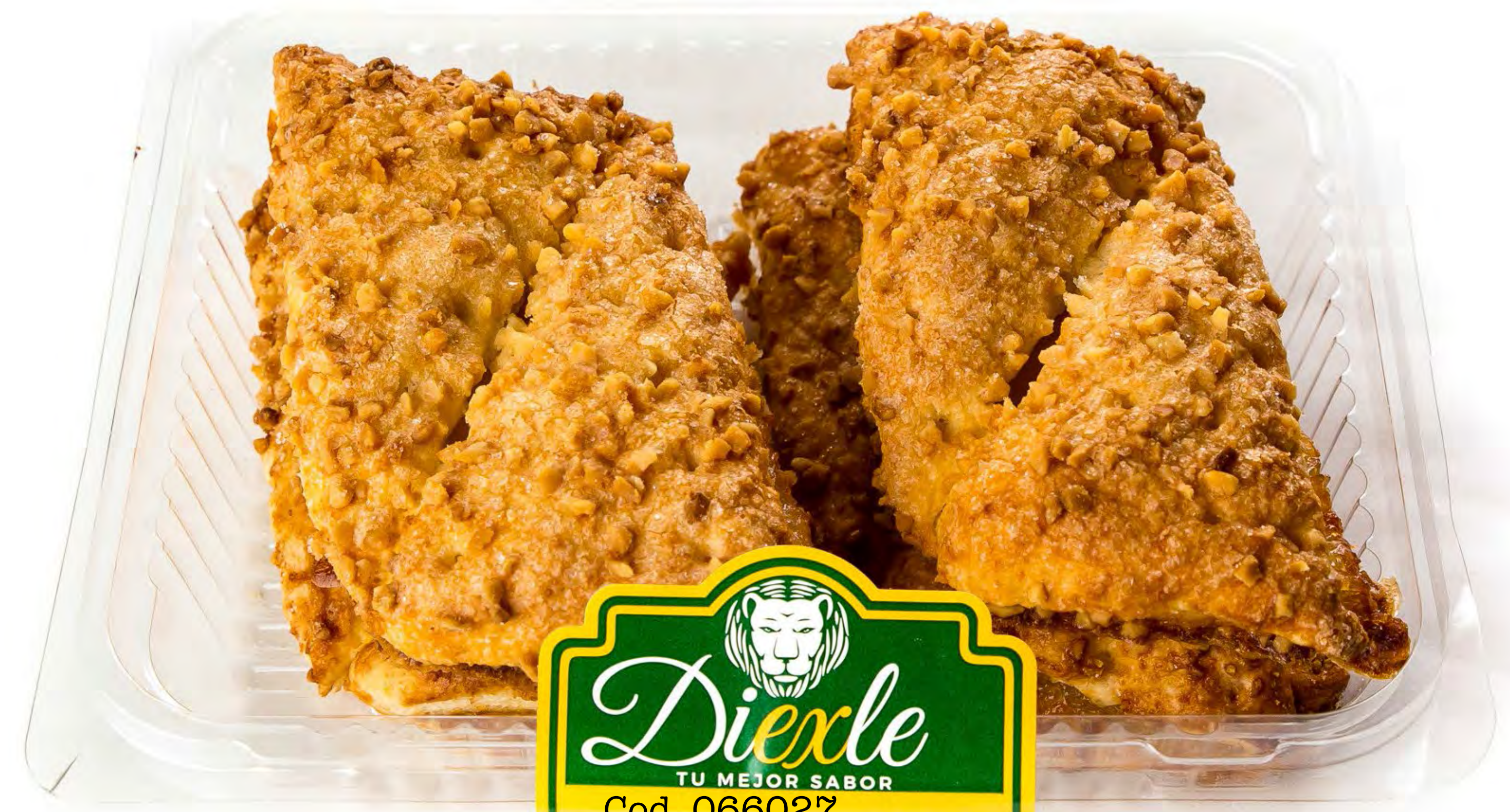
Cod. 066027 Triángulos Cabello 8 und/caja