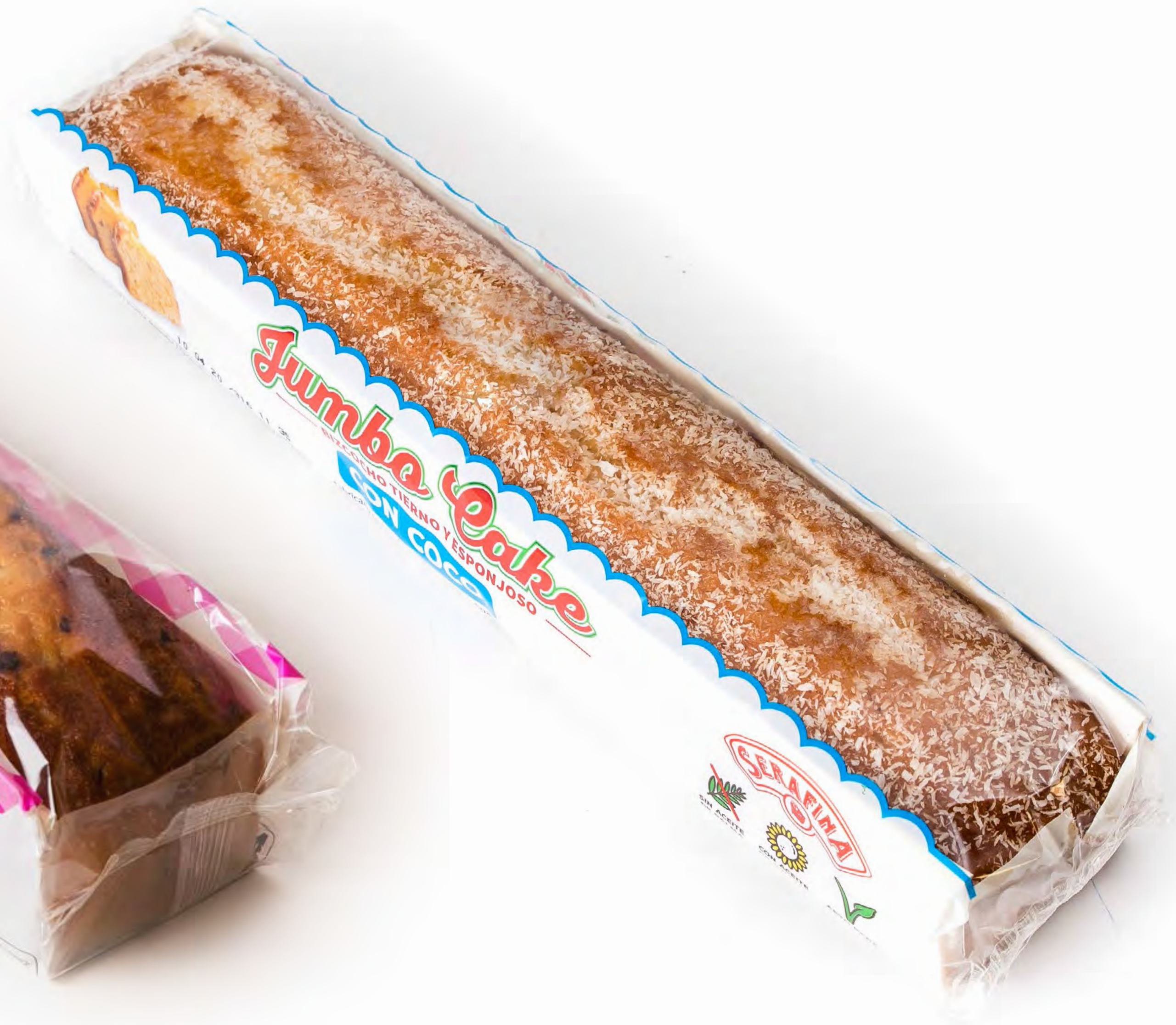
Cake Jumbo Coco 8 uds/caja 500g.