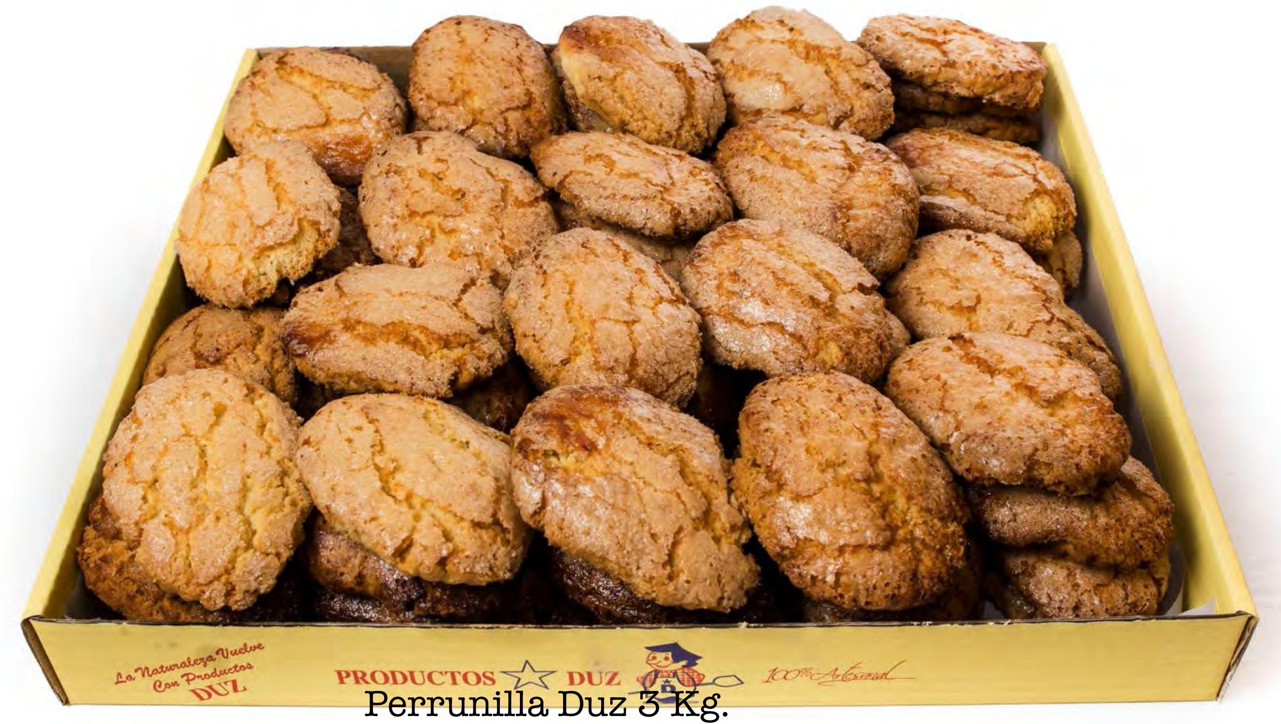
Perrunilla Duz 3 Kg.