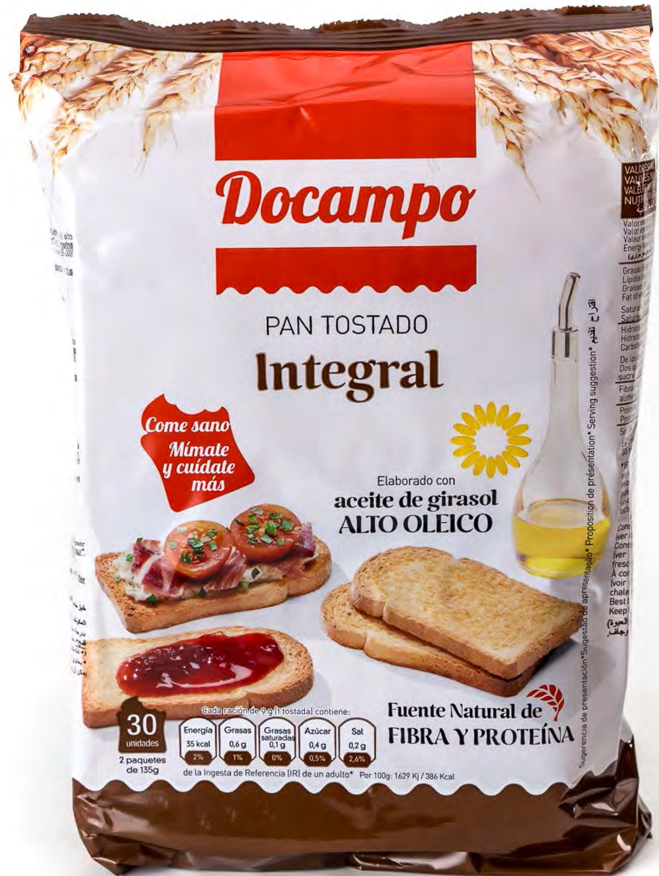
Pan Tostado Integral 16 uds/caja