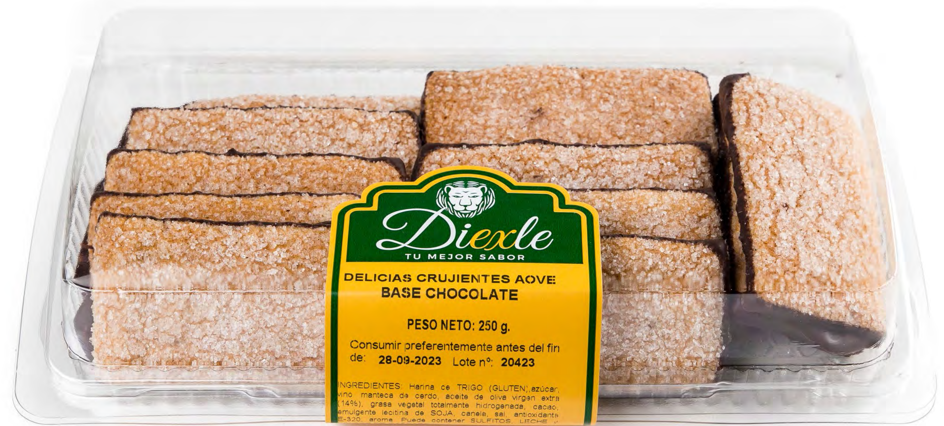
Cod. 148022 - Blister Delicias Crujientes 8 und/caja