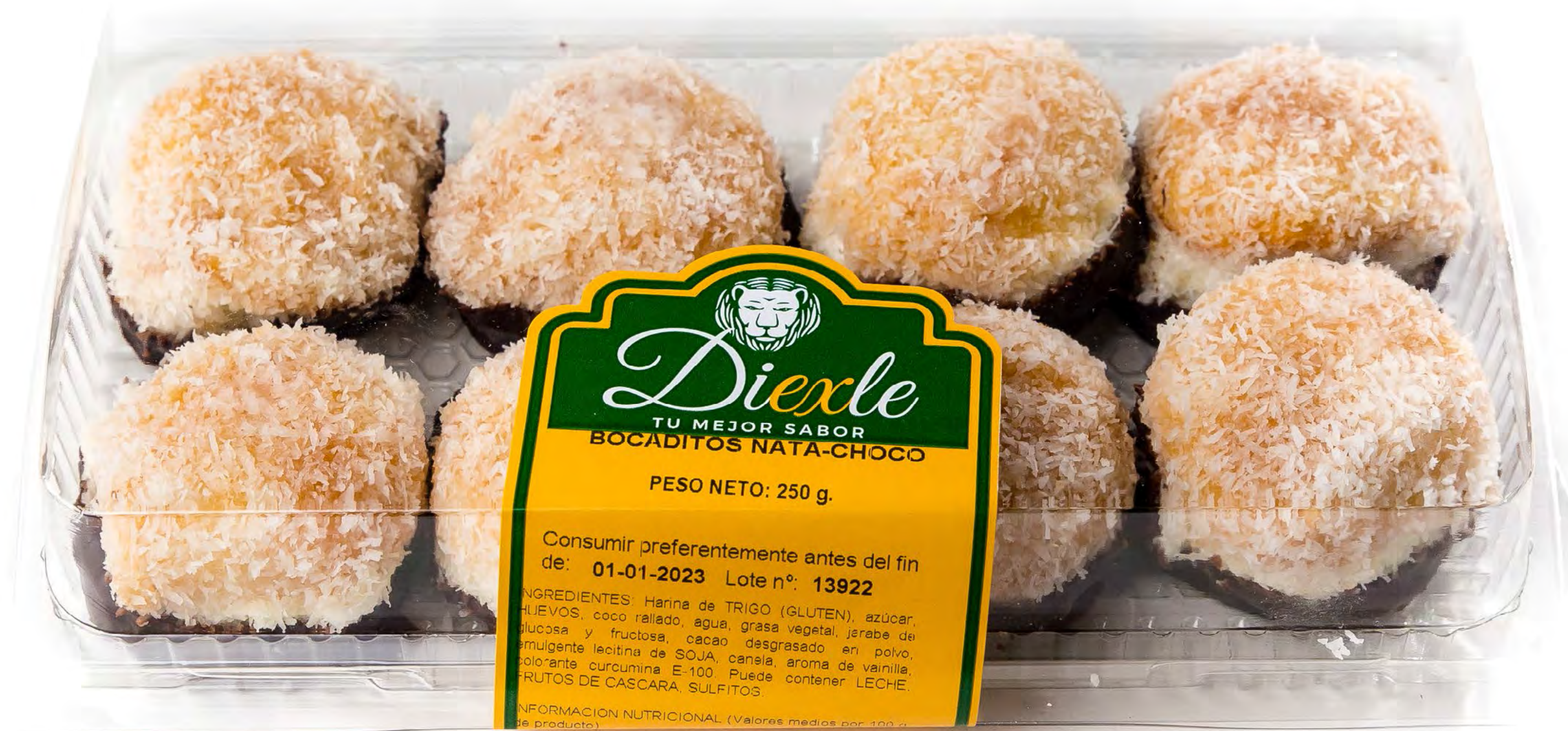
Cod. 148008 Blister Bocaditos Nata-Choco 8 uds/caja