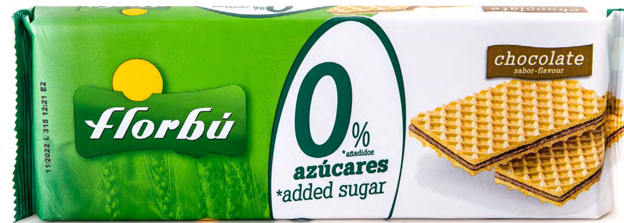
Barquillo Choco S/A 26 uds/caja Cod: 003049