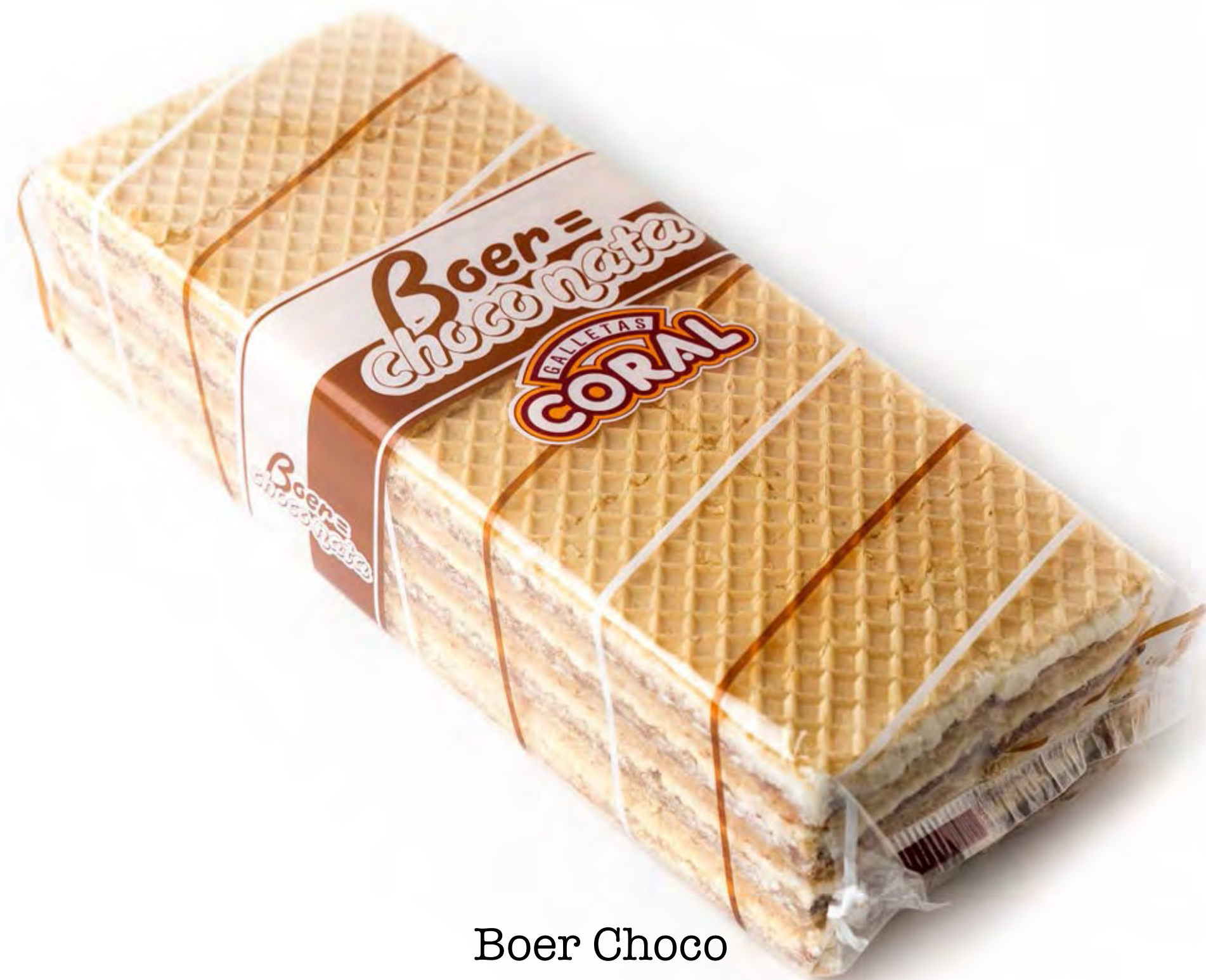
Boer Choco 400g. x 12 uds/caja