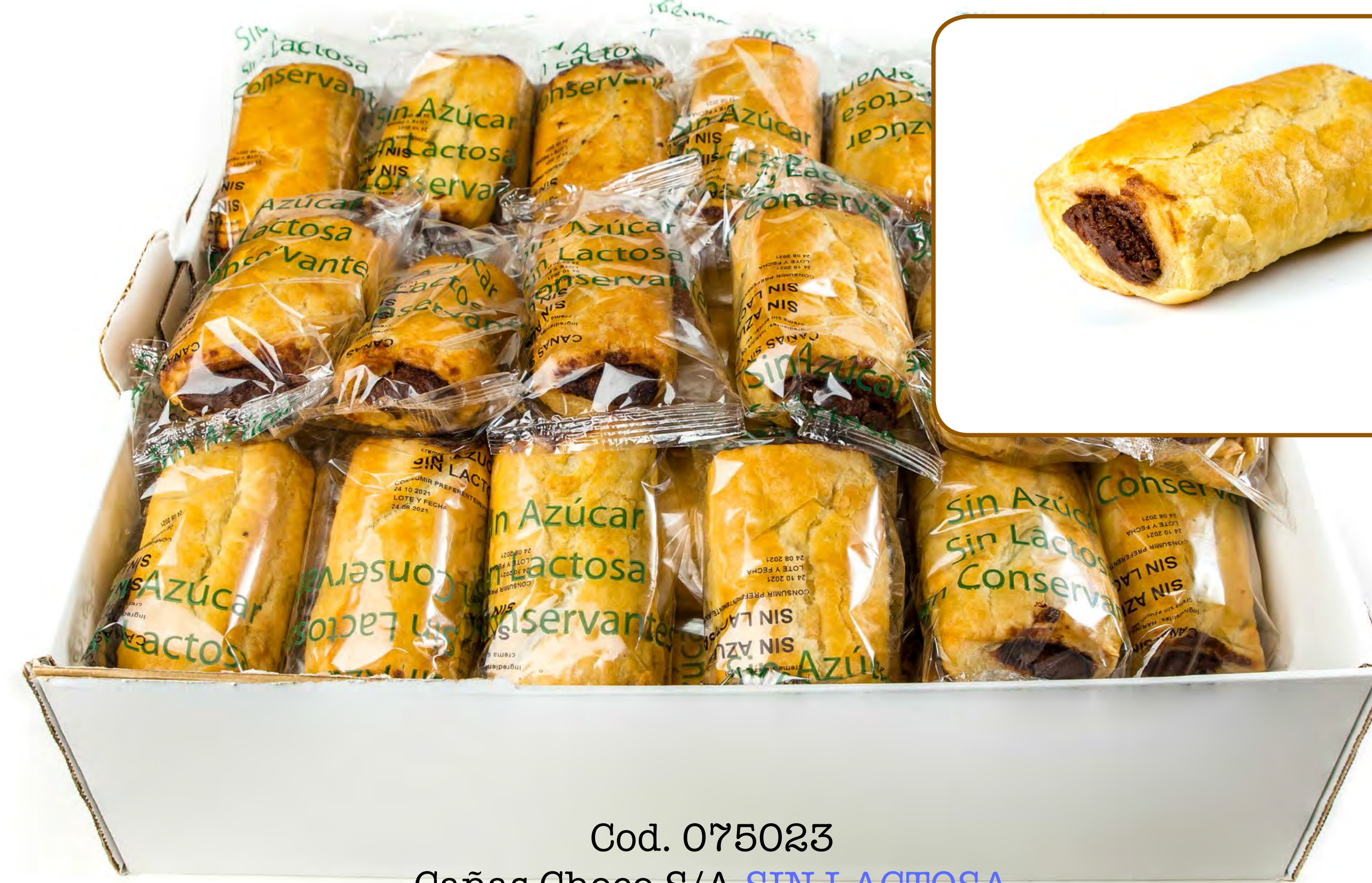
Cod. 075023 Cañas Choco S/A SIN LACTOSA