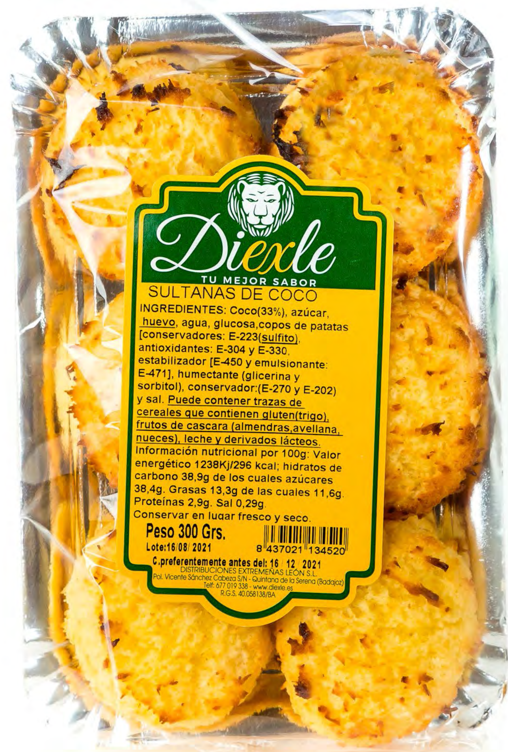
Cod. 203001 - Sultanas coco 8 uds/caja