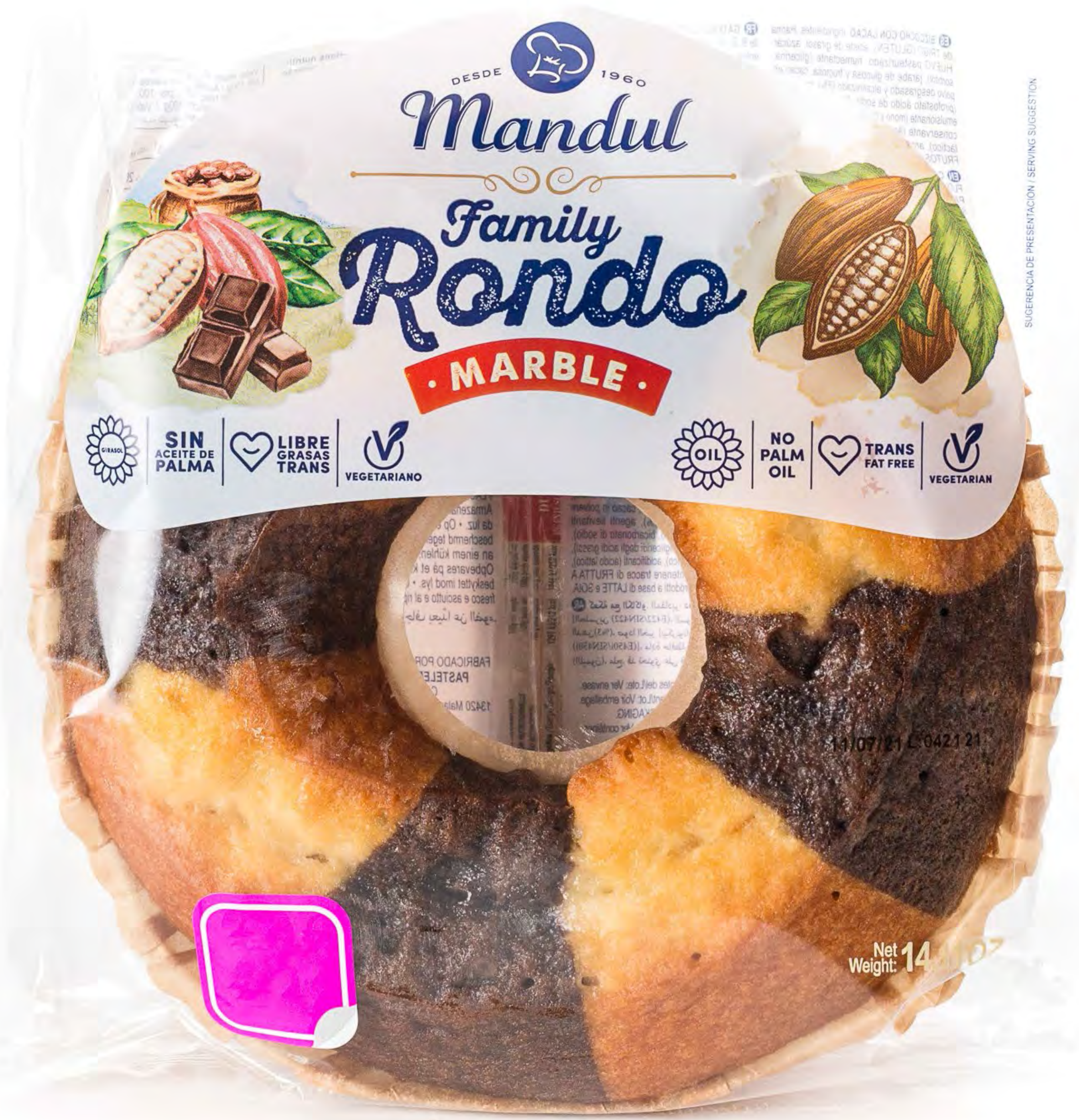
Cod. 041021 Rondo Familiar Marble 4 uds/caja