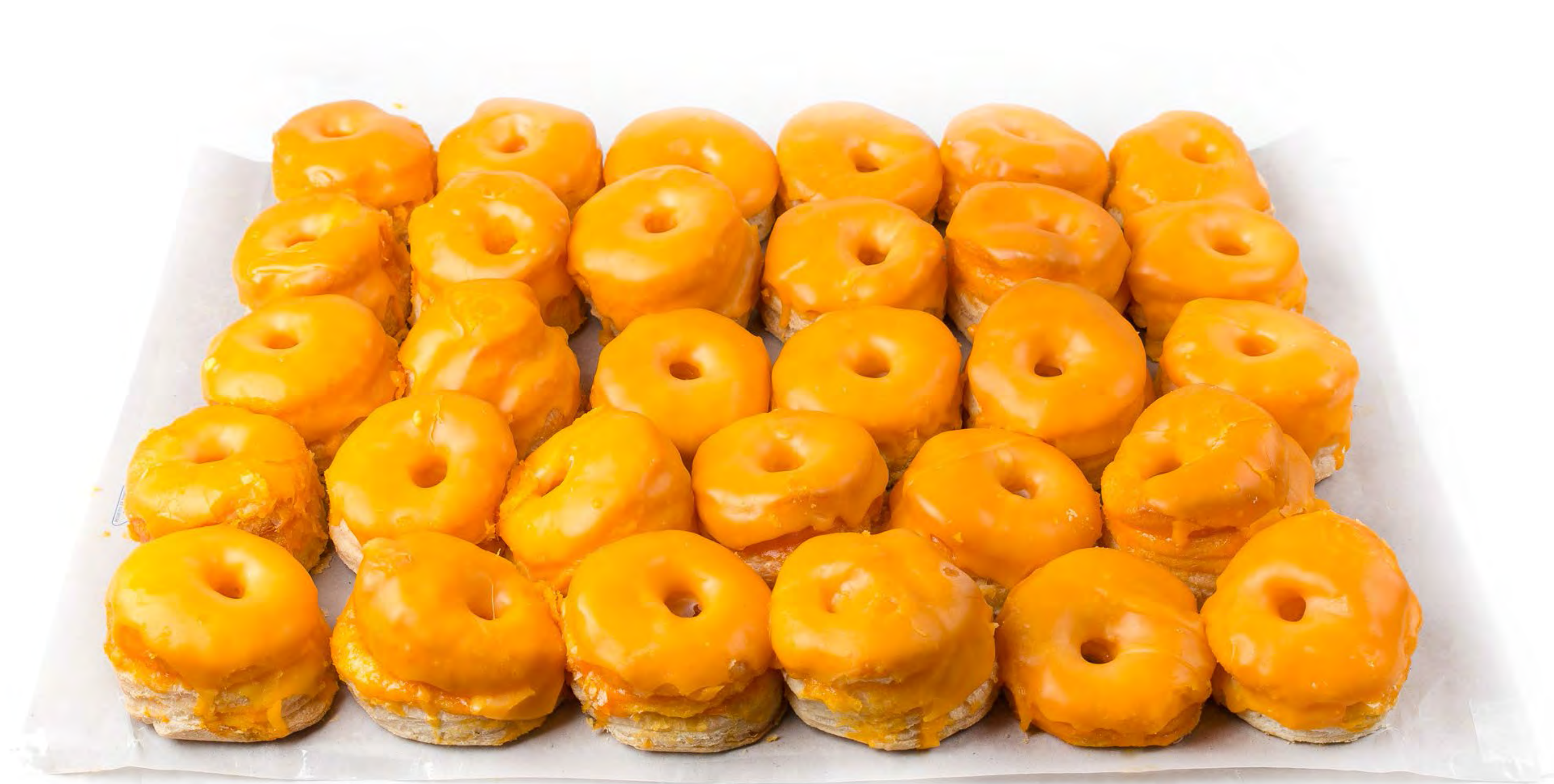
Cod. 027001 Roscos Yema 1.750Kg.