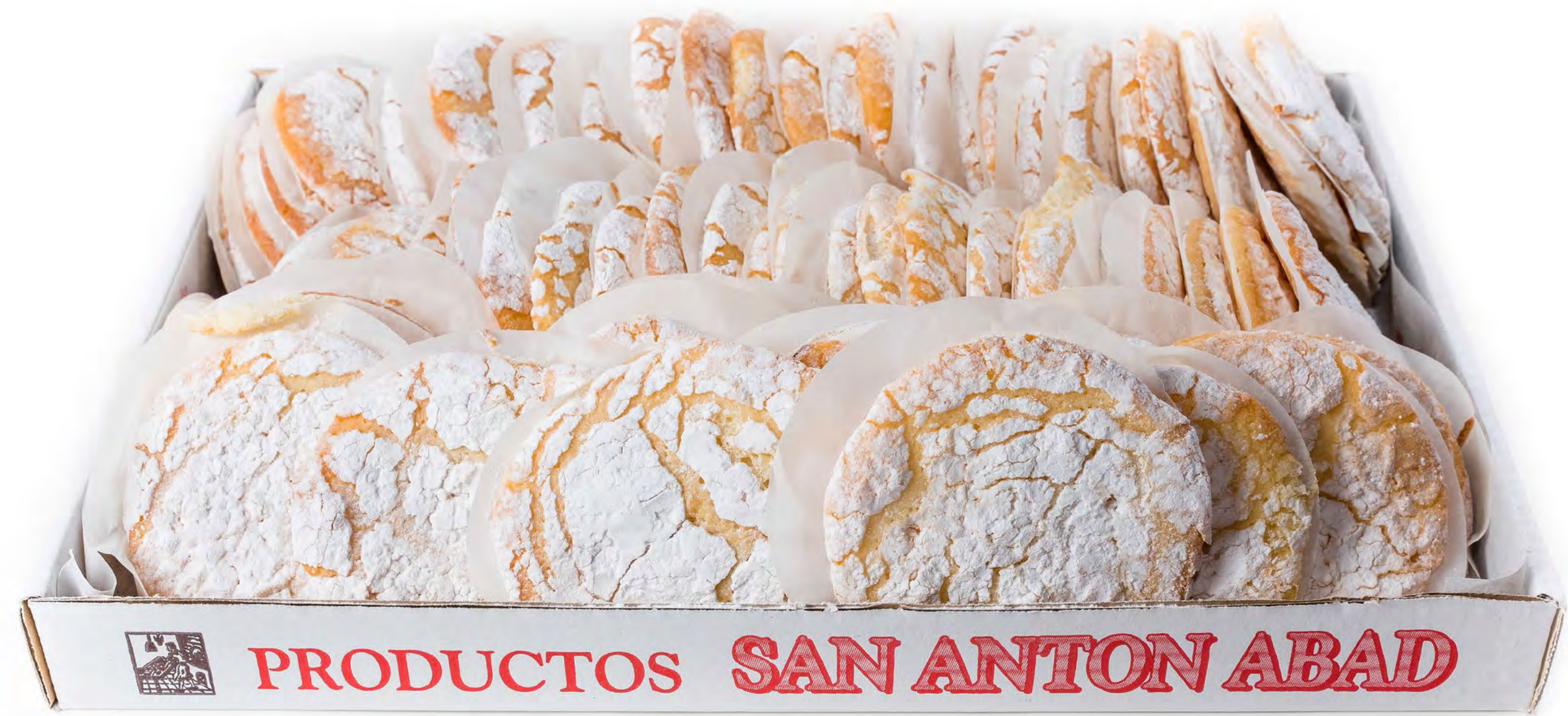
cod. 02726 Bolluela de Nata 2,5 Kg.