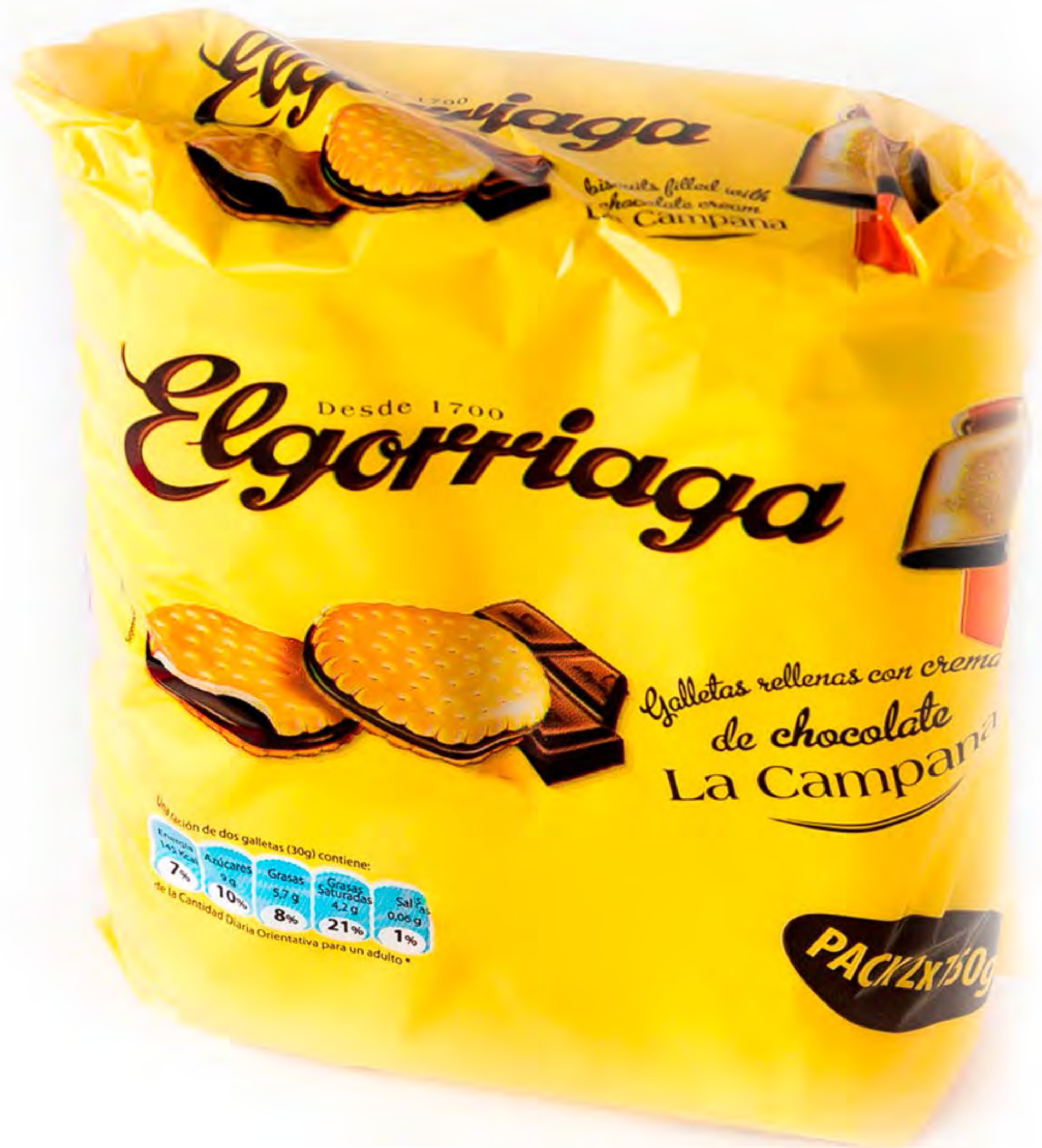
Elgorriaga rell. Choco 2x1€ 12 uds/caja