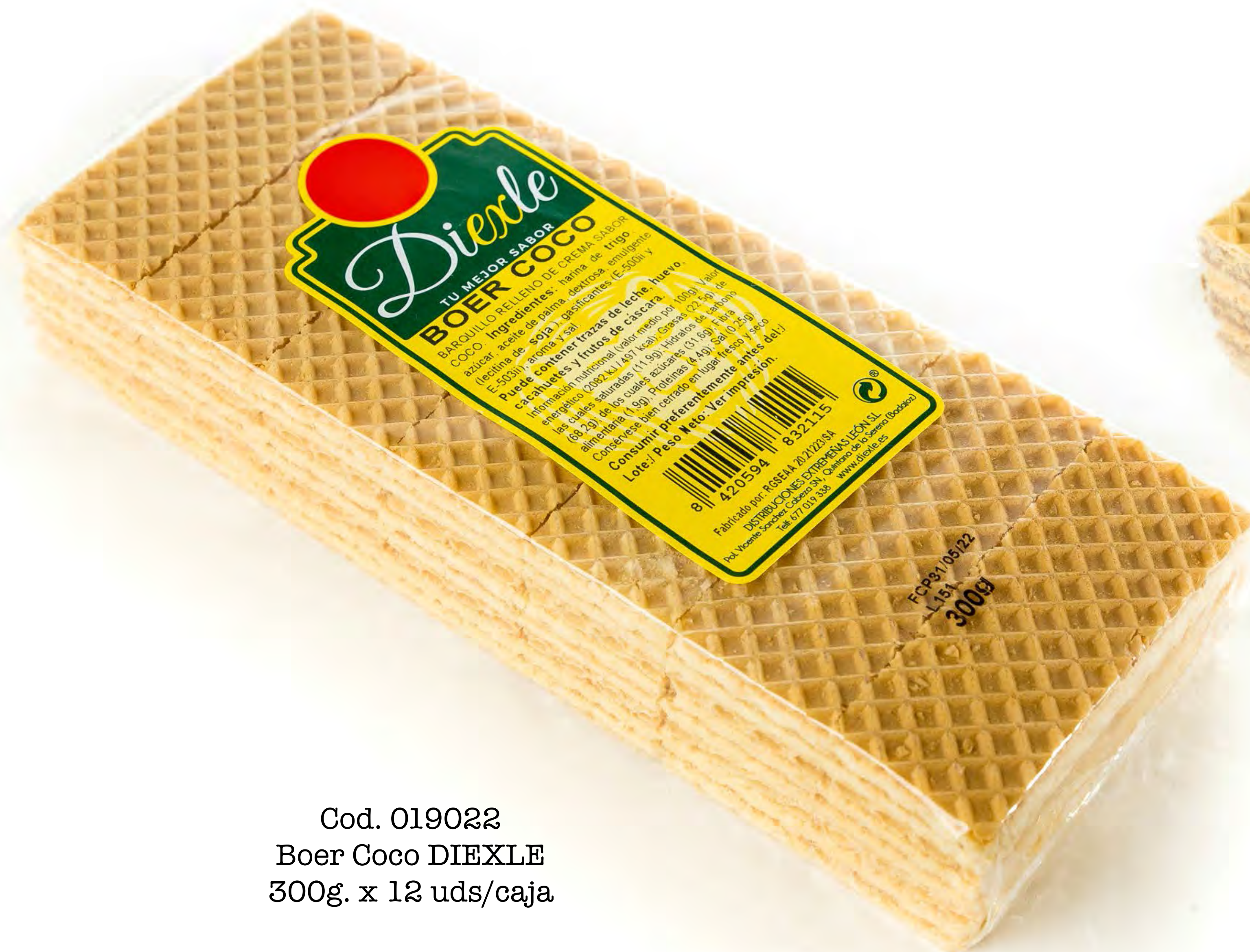
Cod. 019022 Boer Coco DIEXLE 300g. x 12 uds/caja