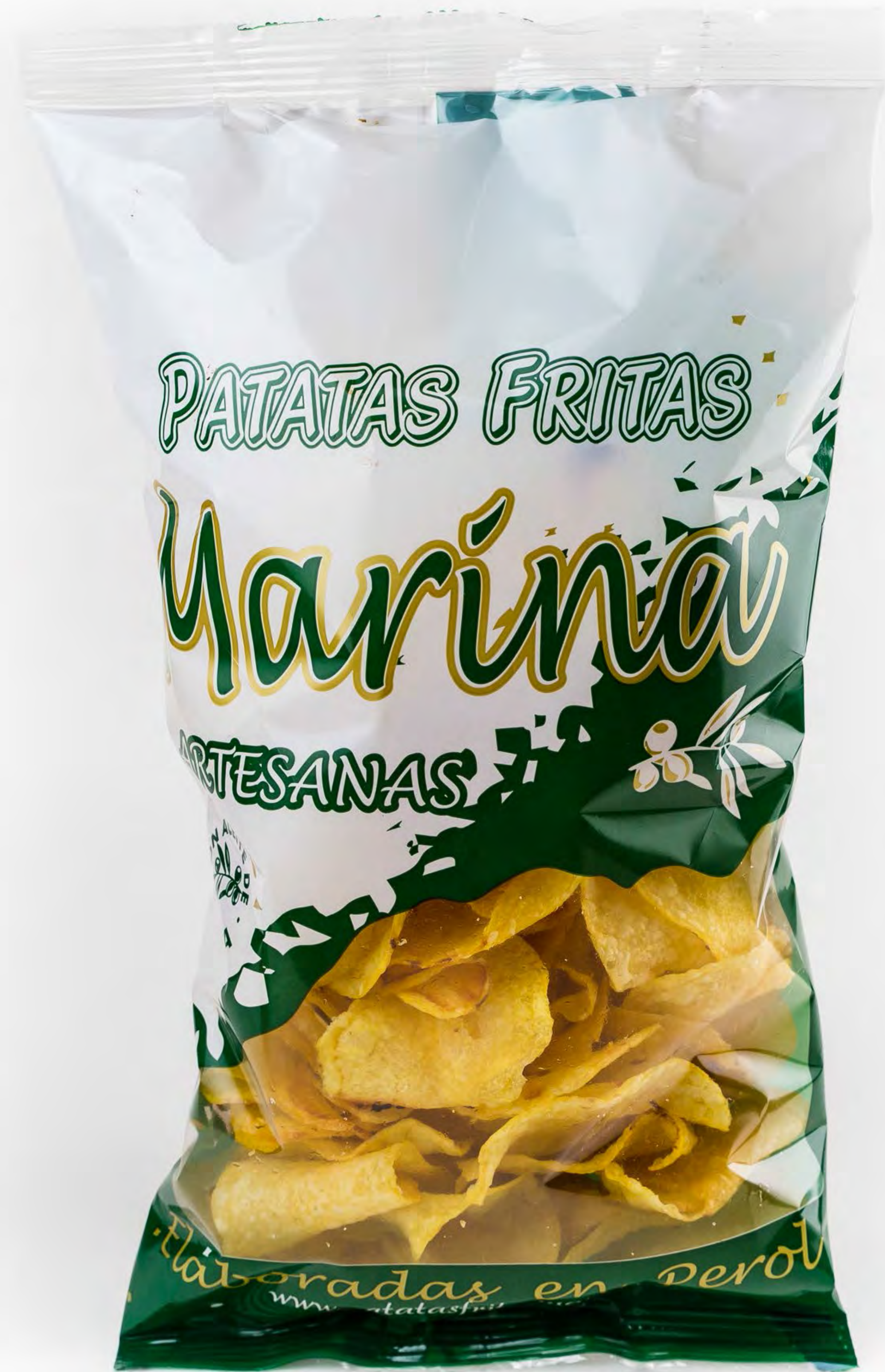
Cod. 254000 - Patatas Marina - 14 uds/caja