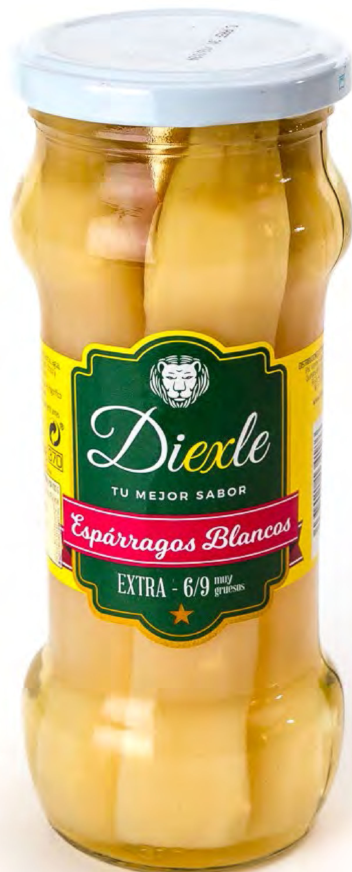
cod.089003 Espárragos 12 uds/caja