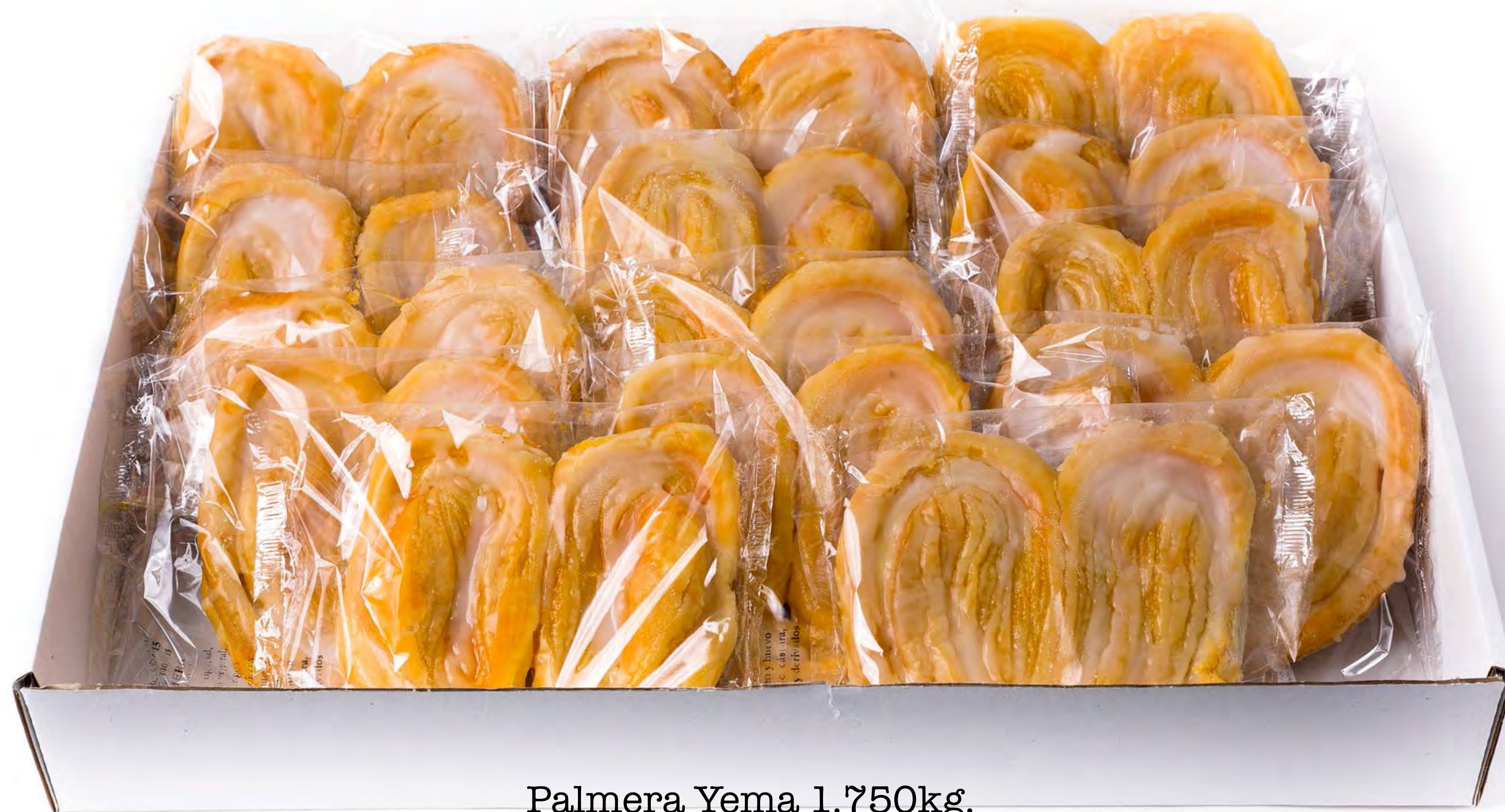
Palmera Yema 1.750kg.