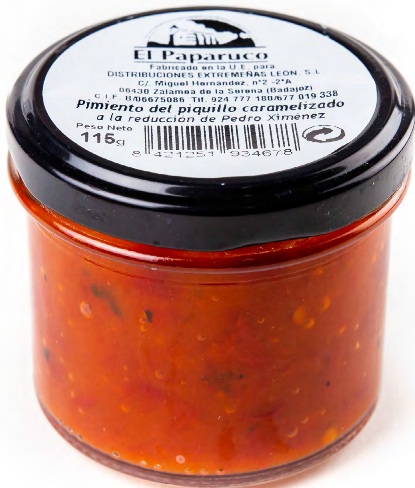
Cod. 048010 - Pimientos Caramelizado - 12 uds/caja