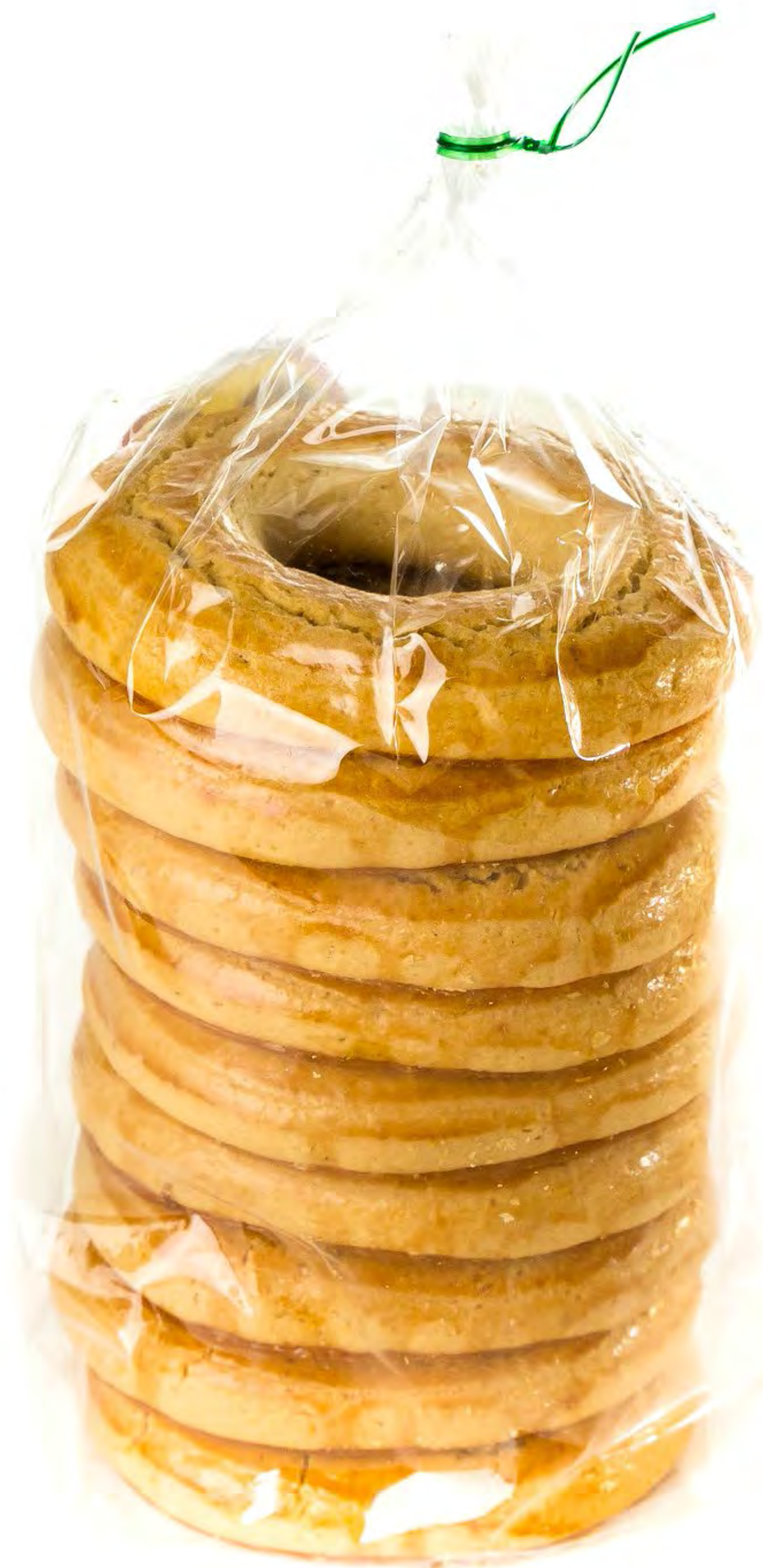
Cod. 207007 Rollo Naranja 6 und/caja