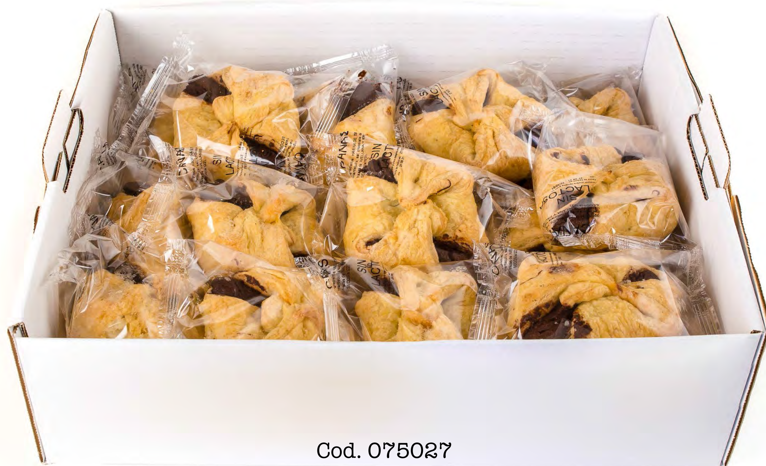
Cod. 075027 Pañuelos Choco 1X1