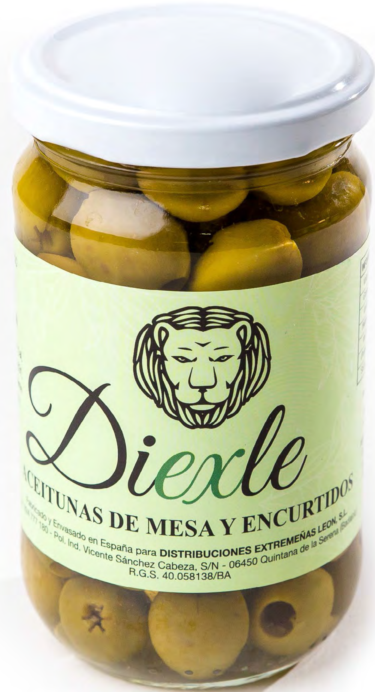
Cod. 185015 Aceitunas SIN HUESO 12 uds/caja