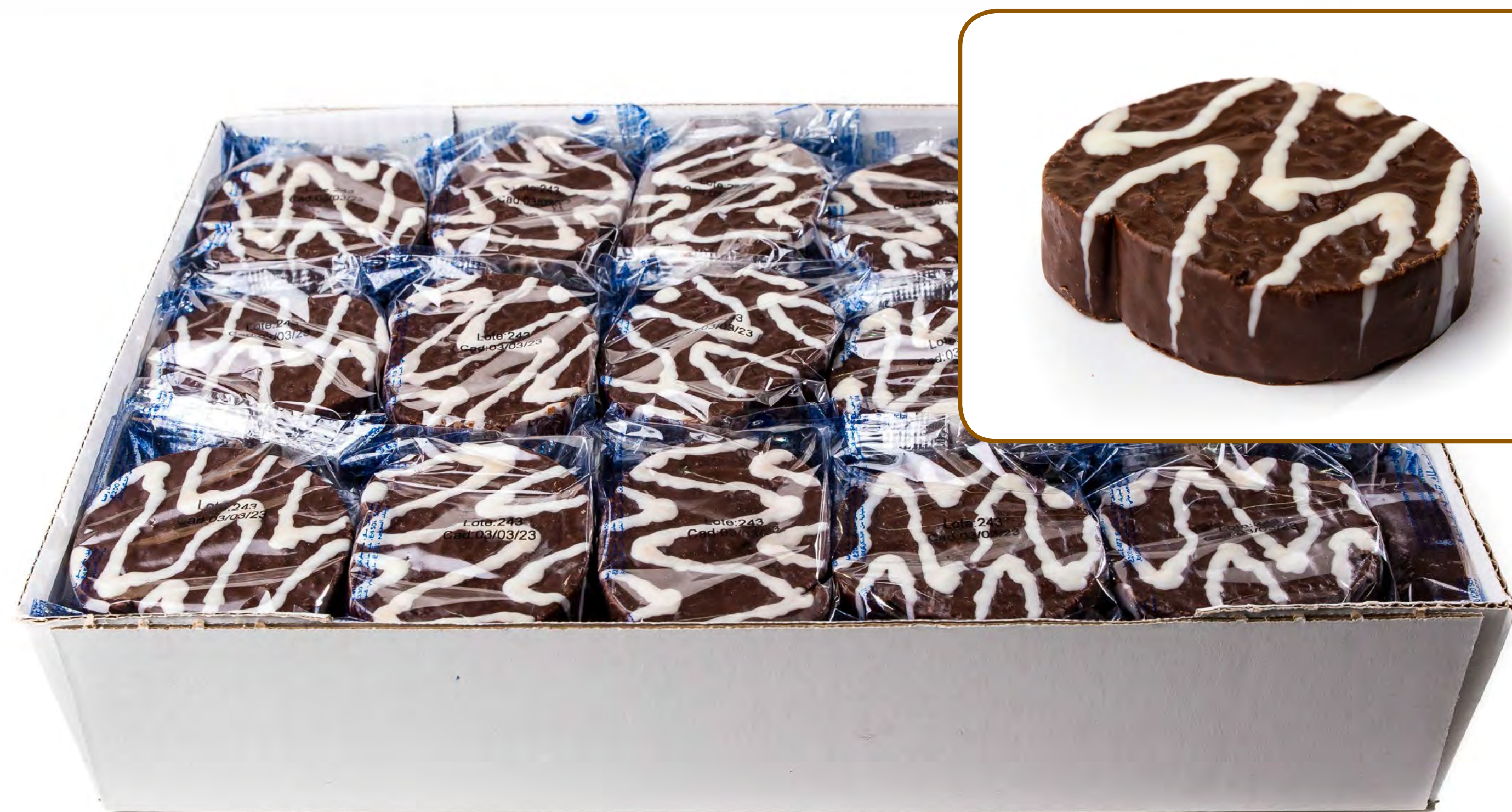
Cod. 026015 - Dianas Cacao 2,5 Kg.