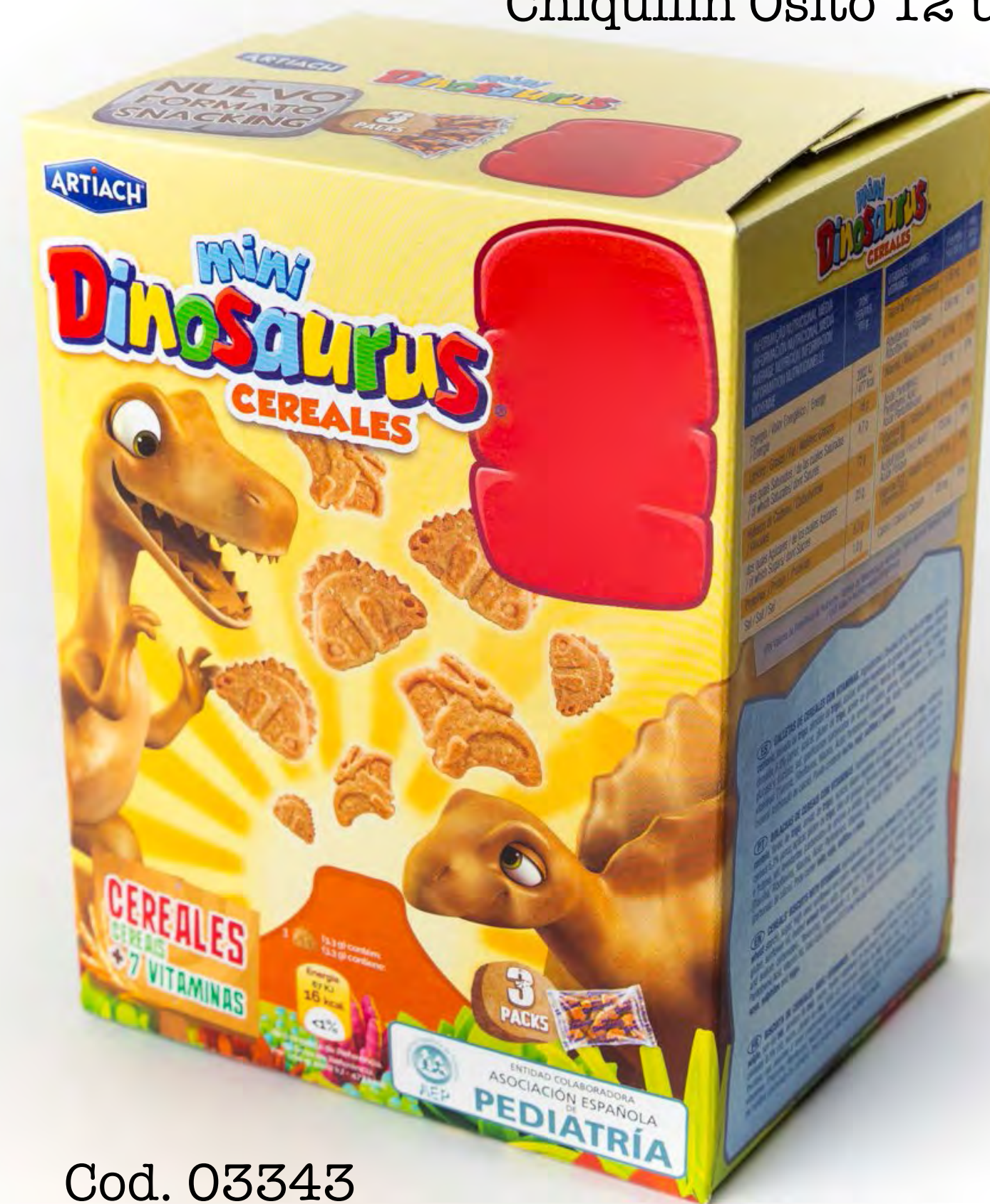
Cod. 03343 Dinosaurio Artiach 12 uds/caja