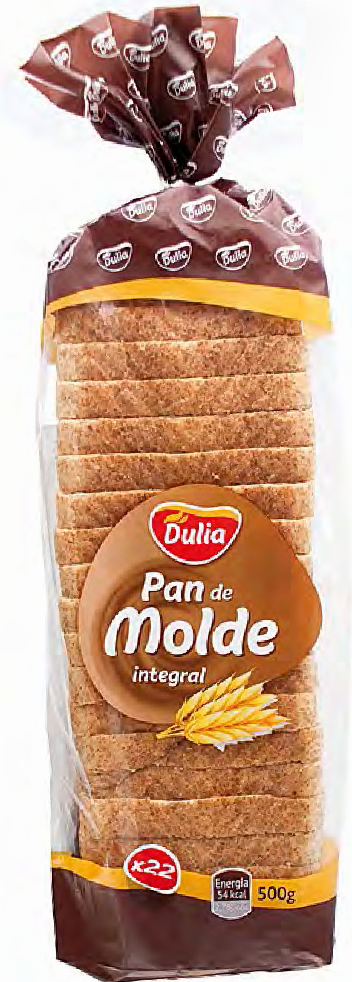
Pan de Molde integral 500g. x 7 uds/caja