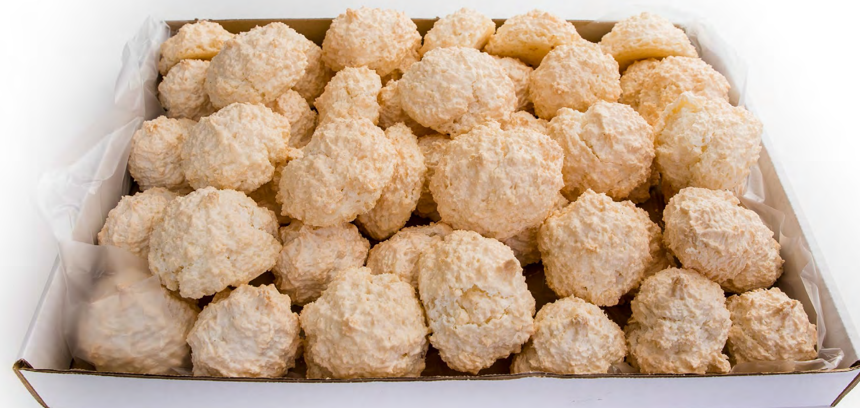
Sultana Blanca 2Kg