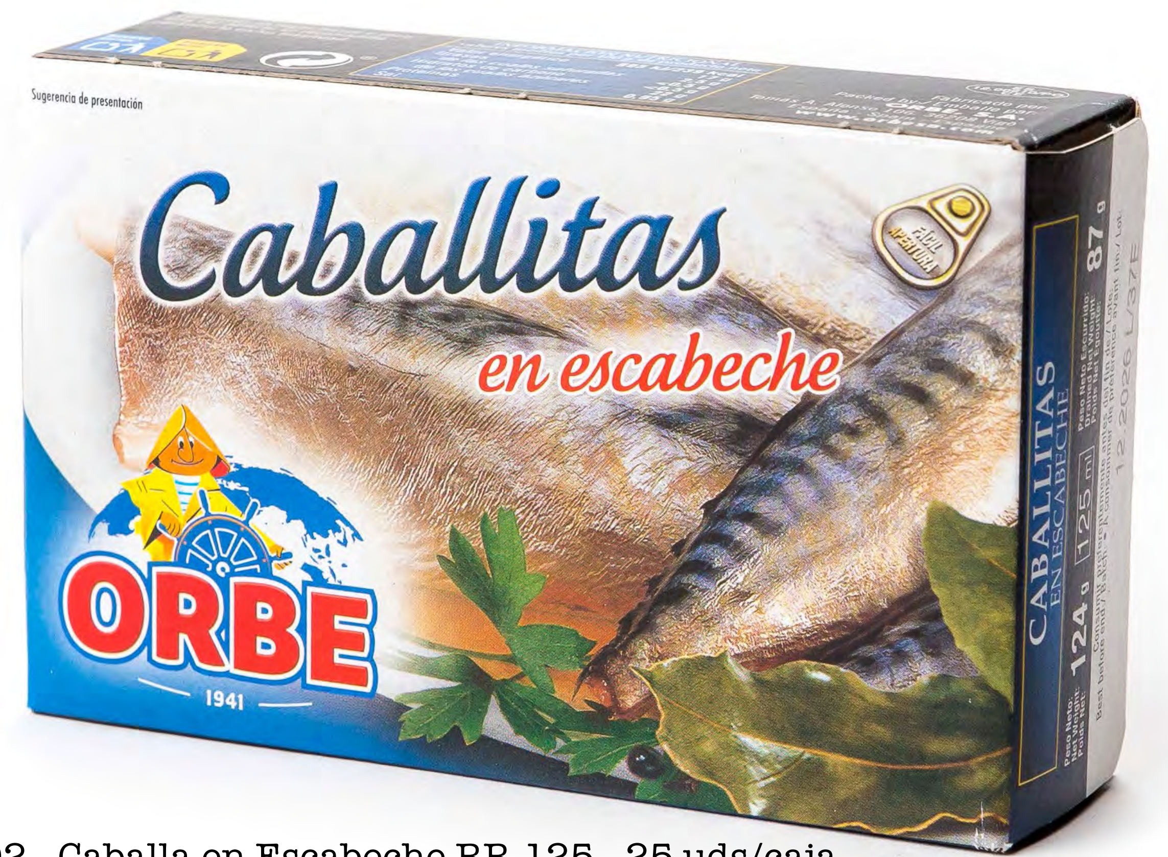
Cod. 256002 - Caballa en Escabeche RR-125 - 25 uds/caja