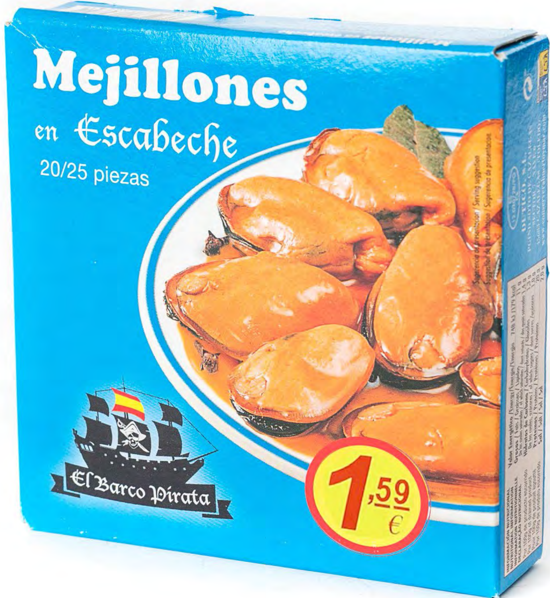
Mejillones Escabeche 26 und/caja