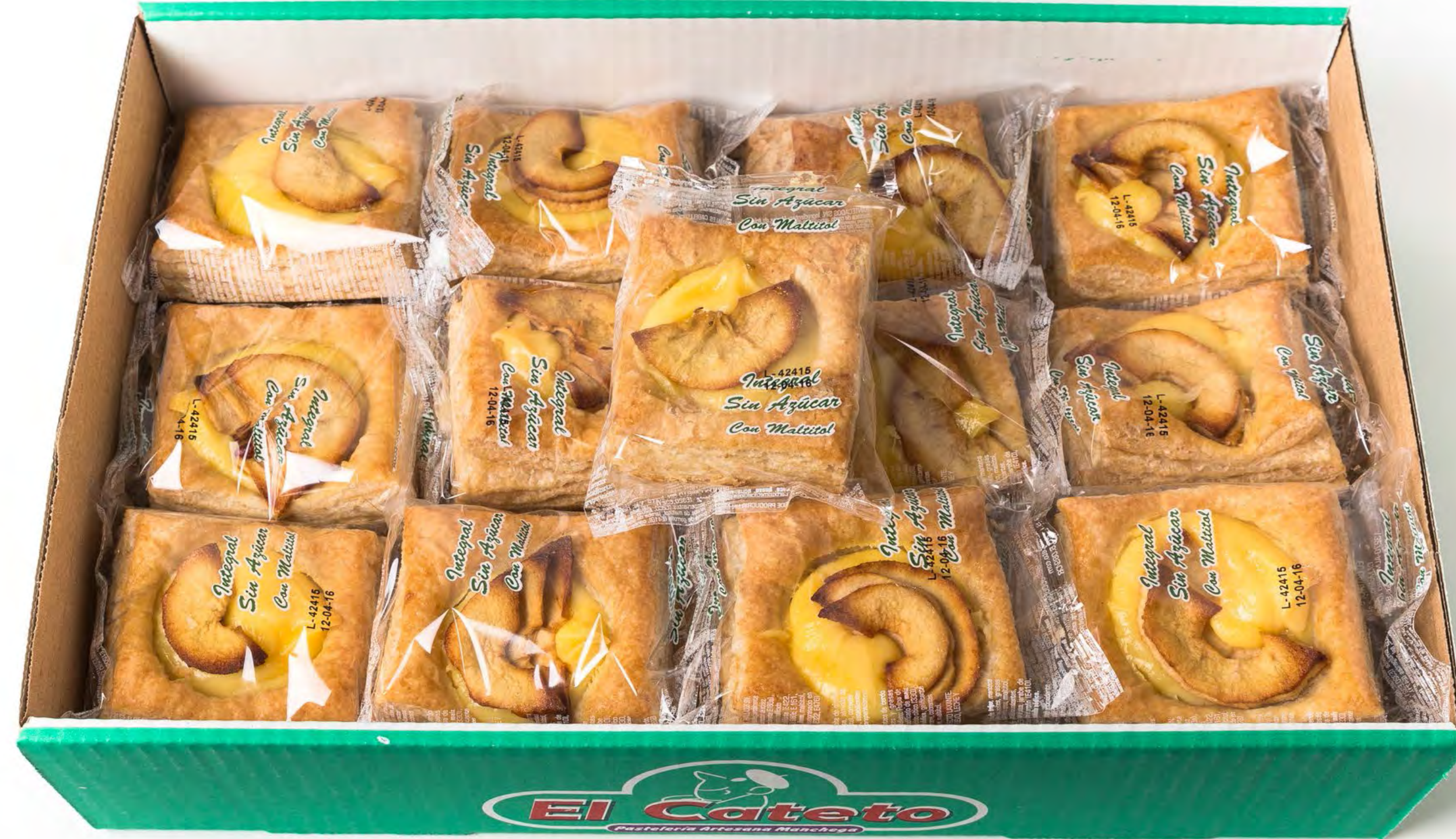
Tarta Manzana S/A 2 Kg.