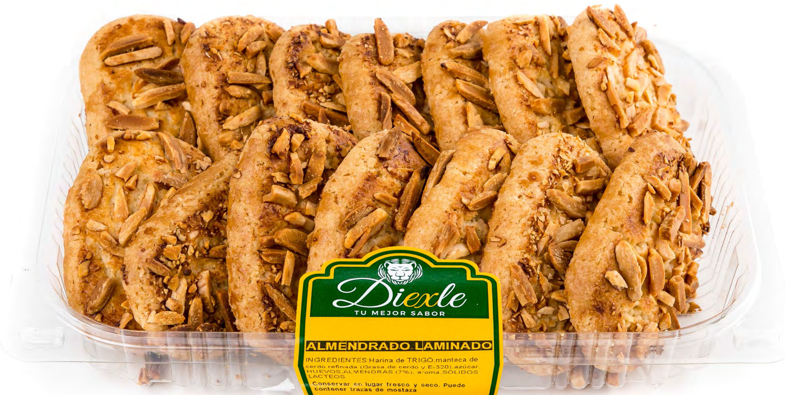
Cod. 258005 - Blister Laminado Almendra 8 uds/caja