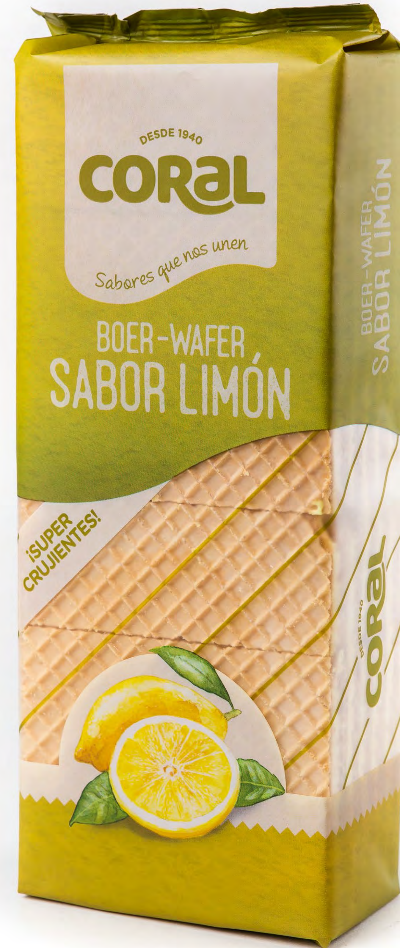
012020 - Boer Limon Coral 330g - 10 uds/caja