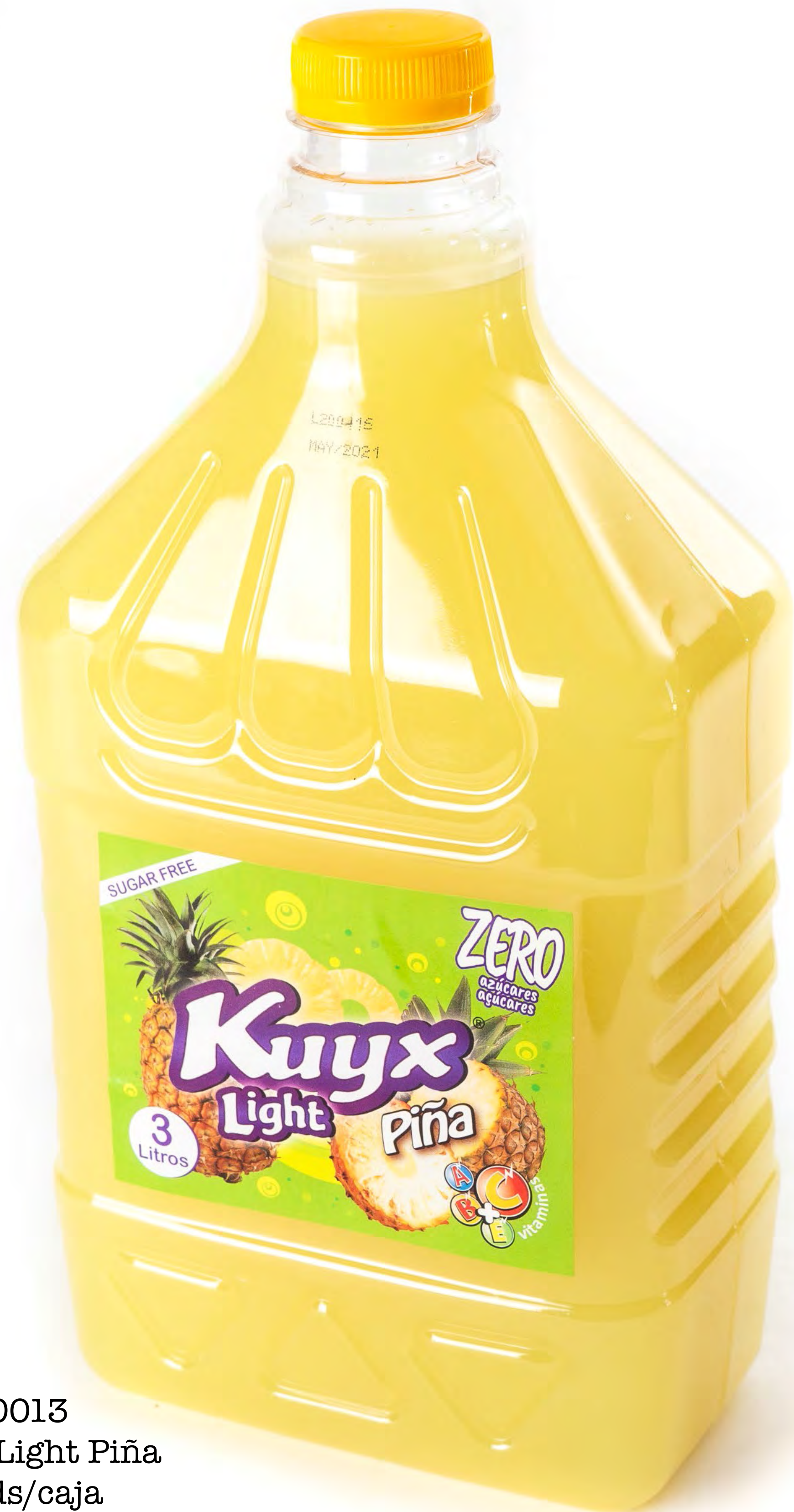
Cod. 50013 Zumó Kuyx Light Piña 3L x 4 uds/caja