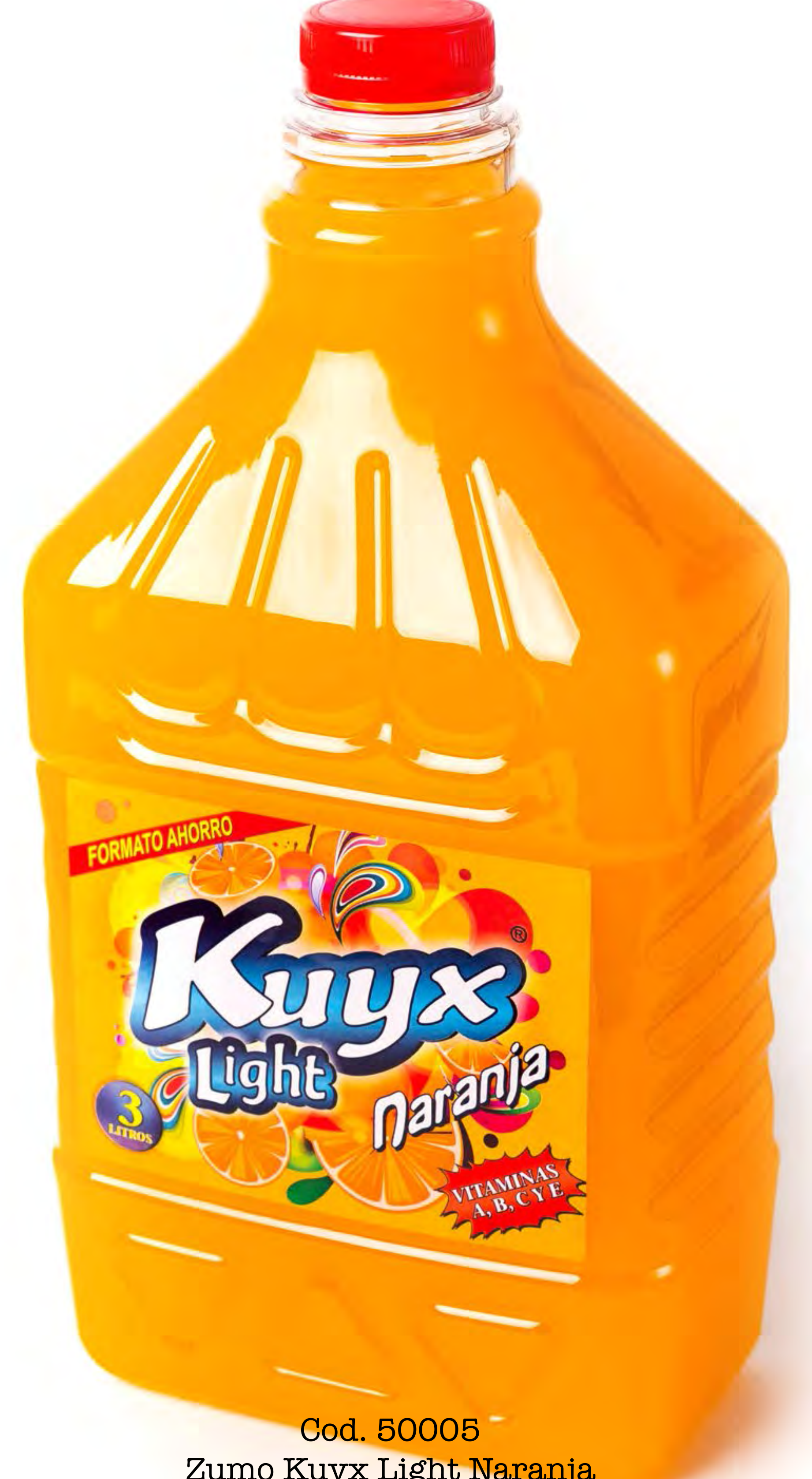
Cod. 50005 Zumo Kuyx Light Naranja 3L x 4 uds/caja