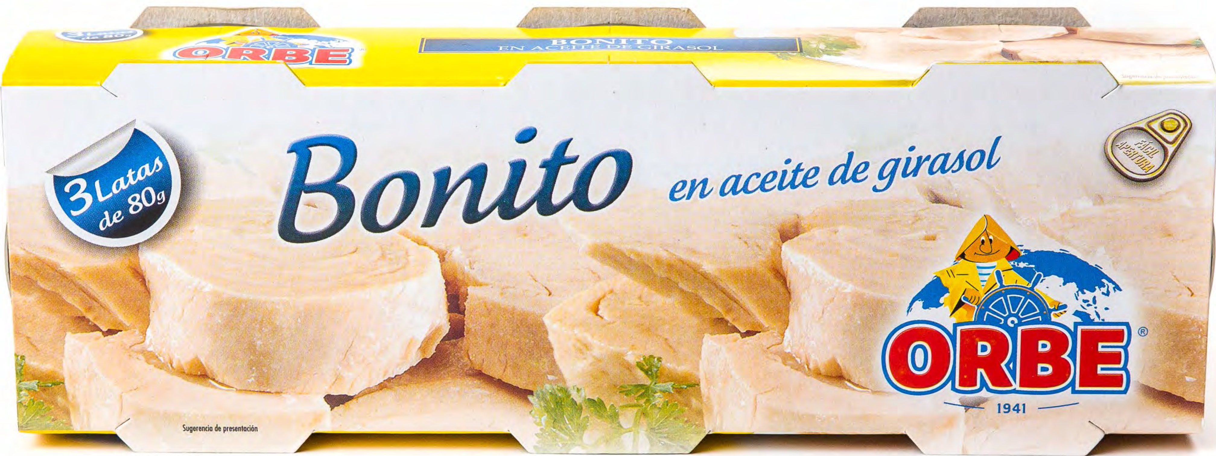
Cod. 256007 Bonito en Aceite Girasol RO-85 32 und/caja