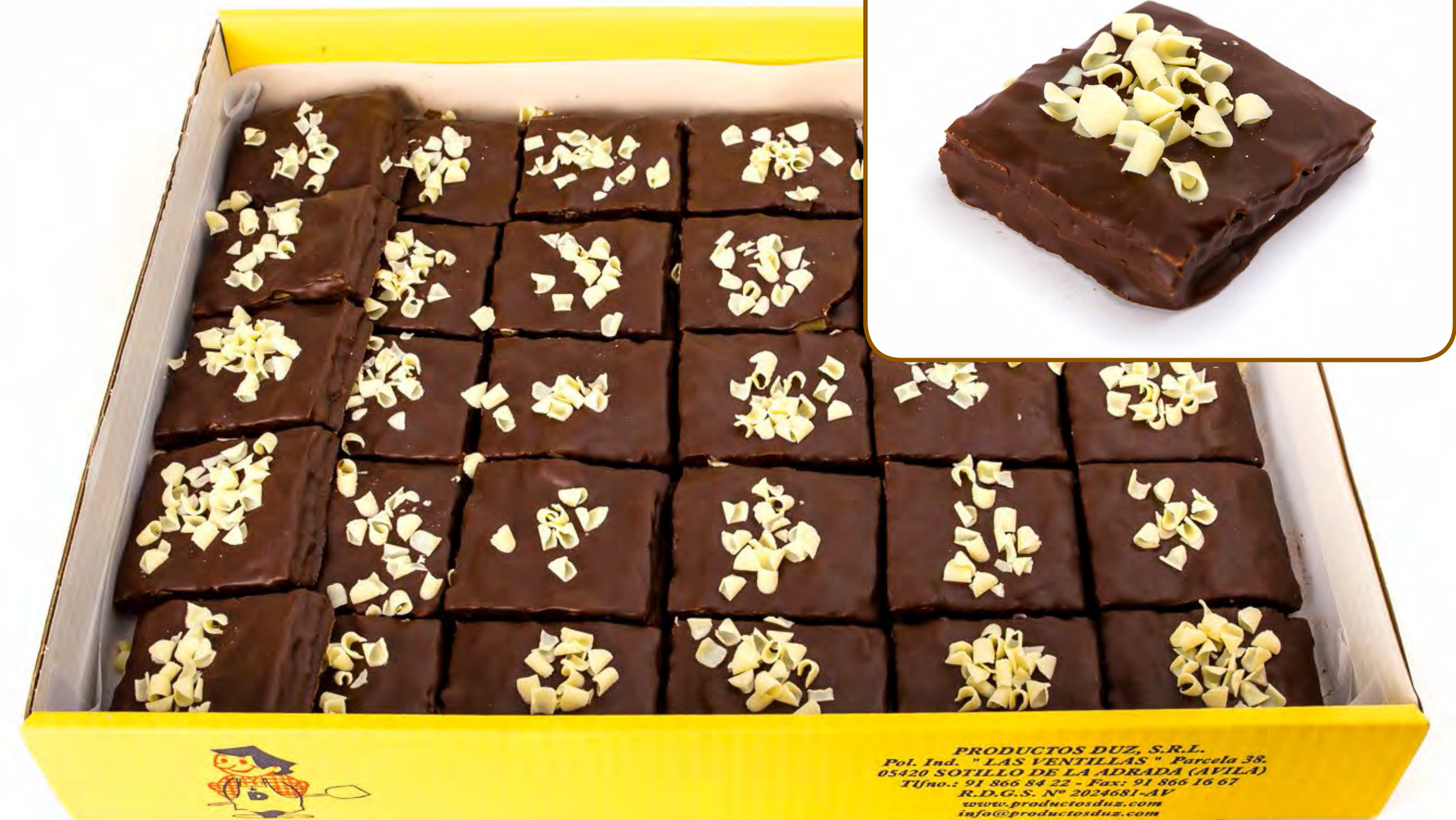
Rusos de Crema 2Kg.