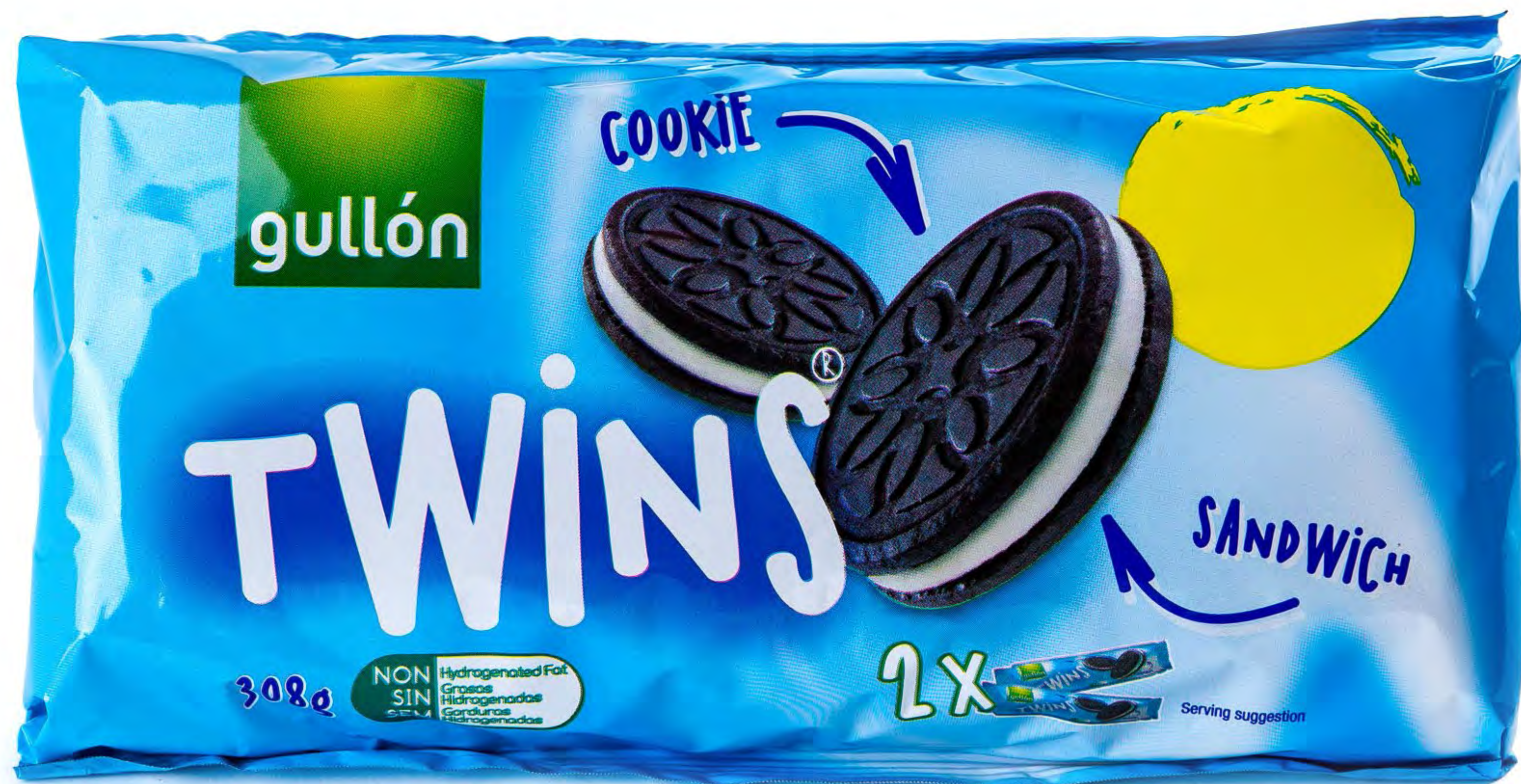
Galletas Twins Pack 2 12 und/caja