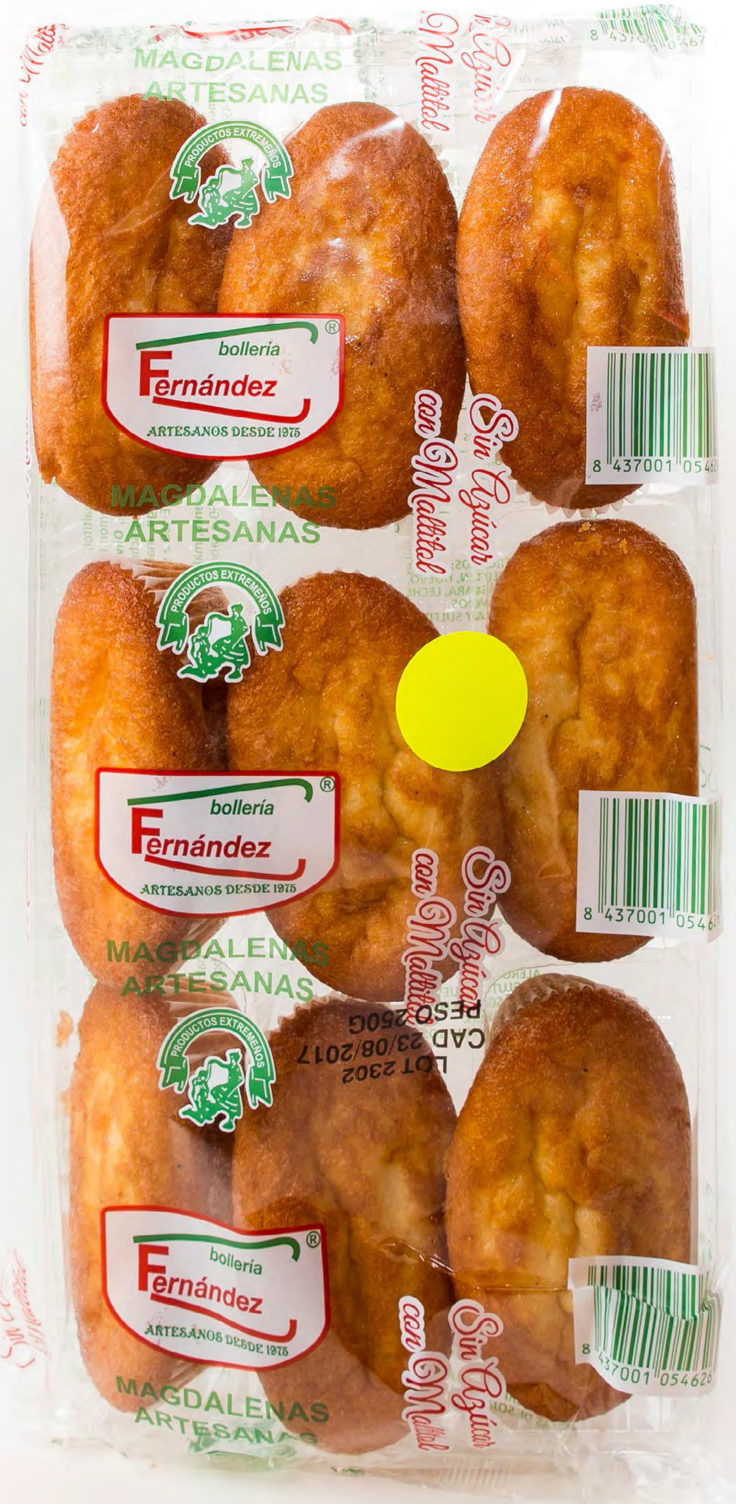
Magdalenas Largas S/A 9 uds/caja