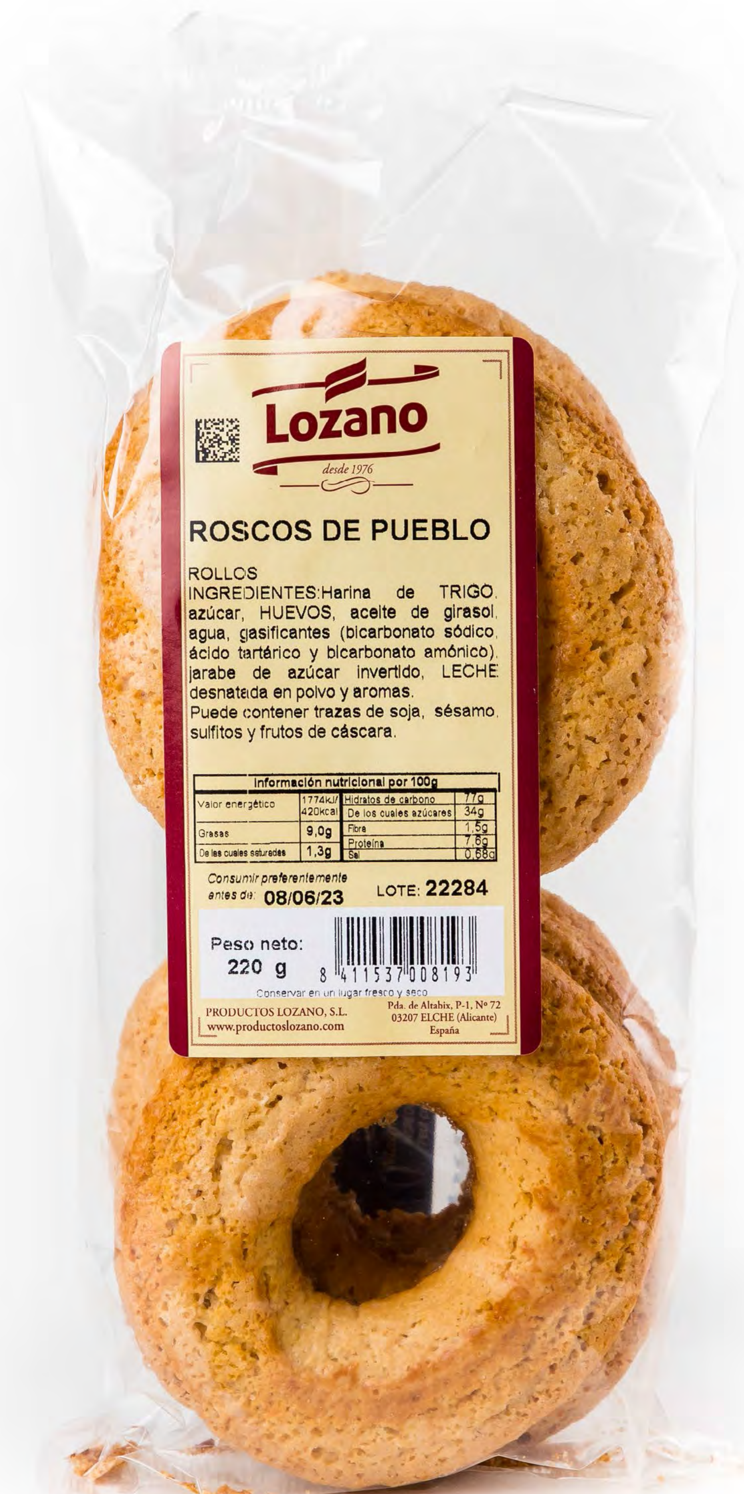
Cod. 207008 Roscos Pueblo Llozano 5und/caja