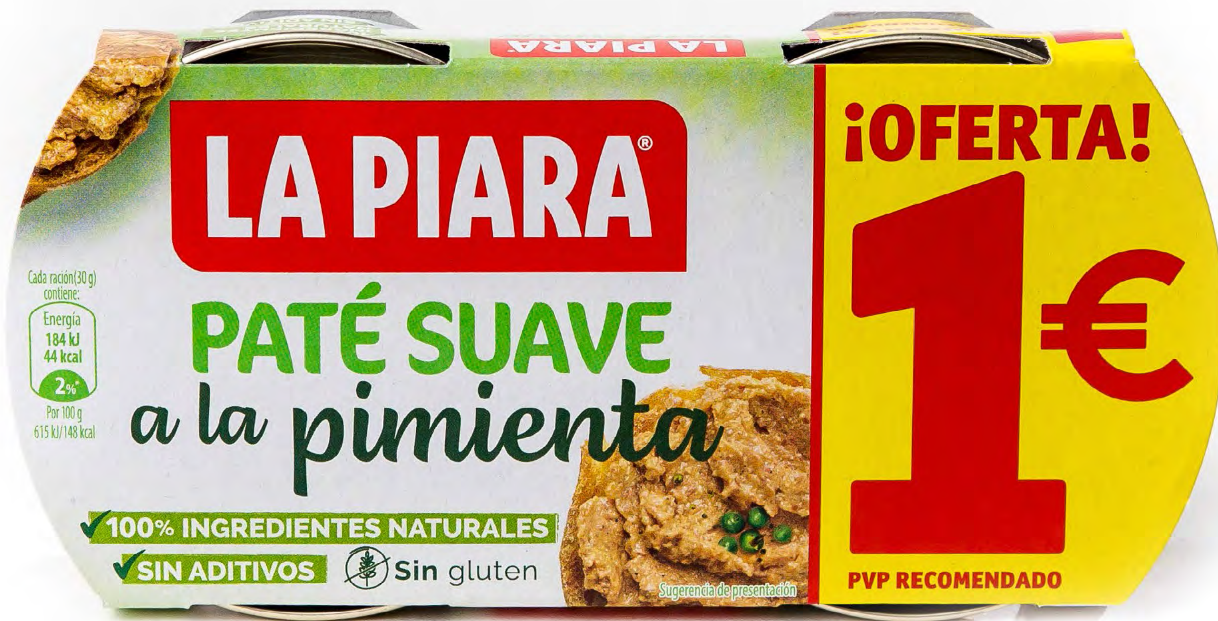
Paté Suave a la Pimienta