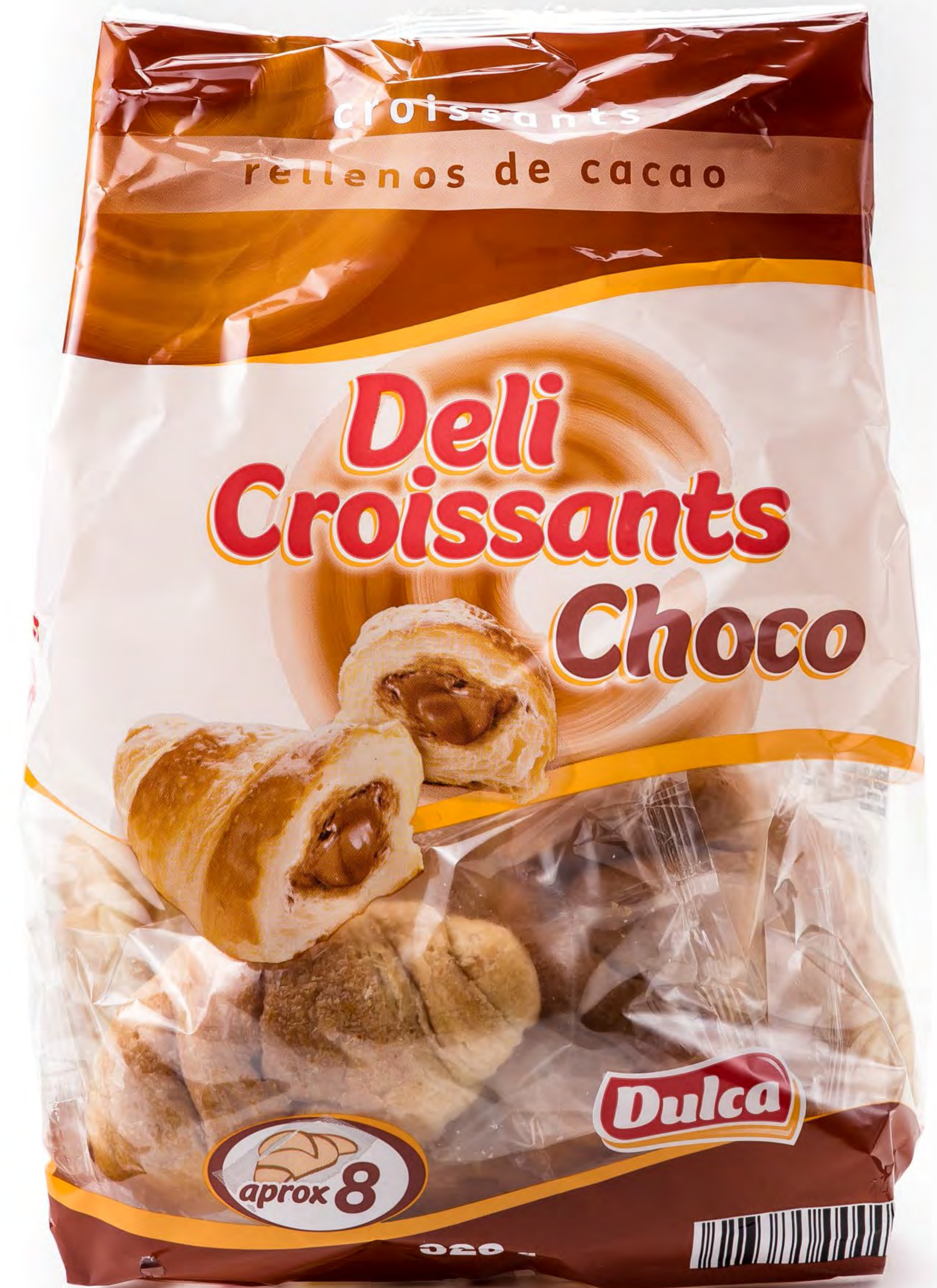
Deli Croissants Choco