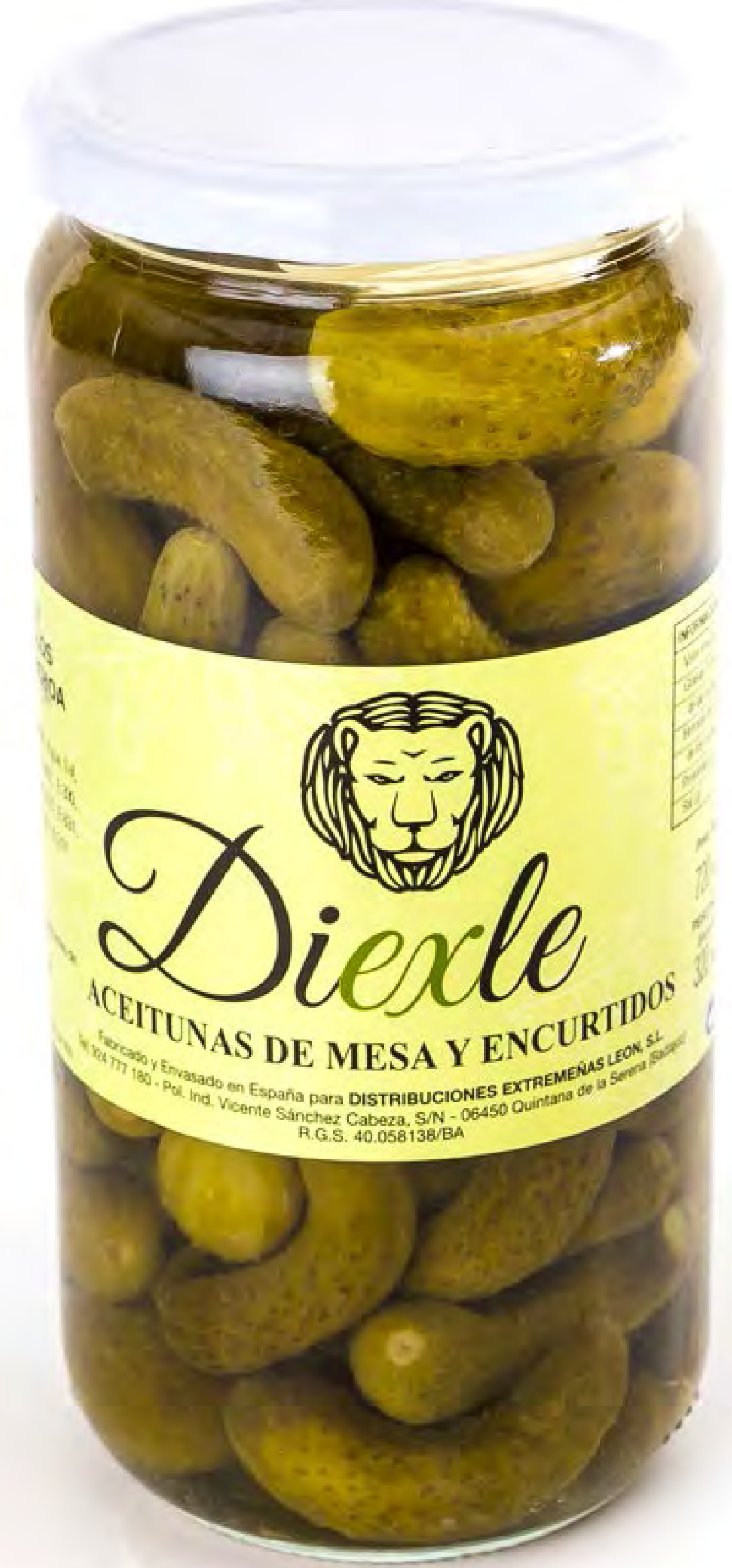
cod.185007 Pepinillos 8 uds/caja