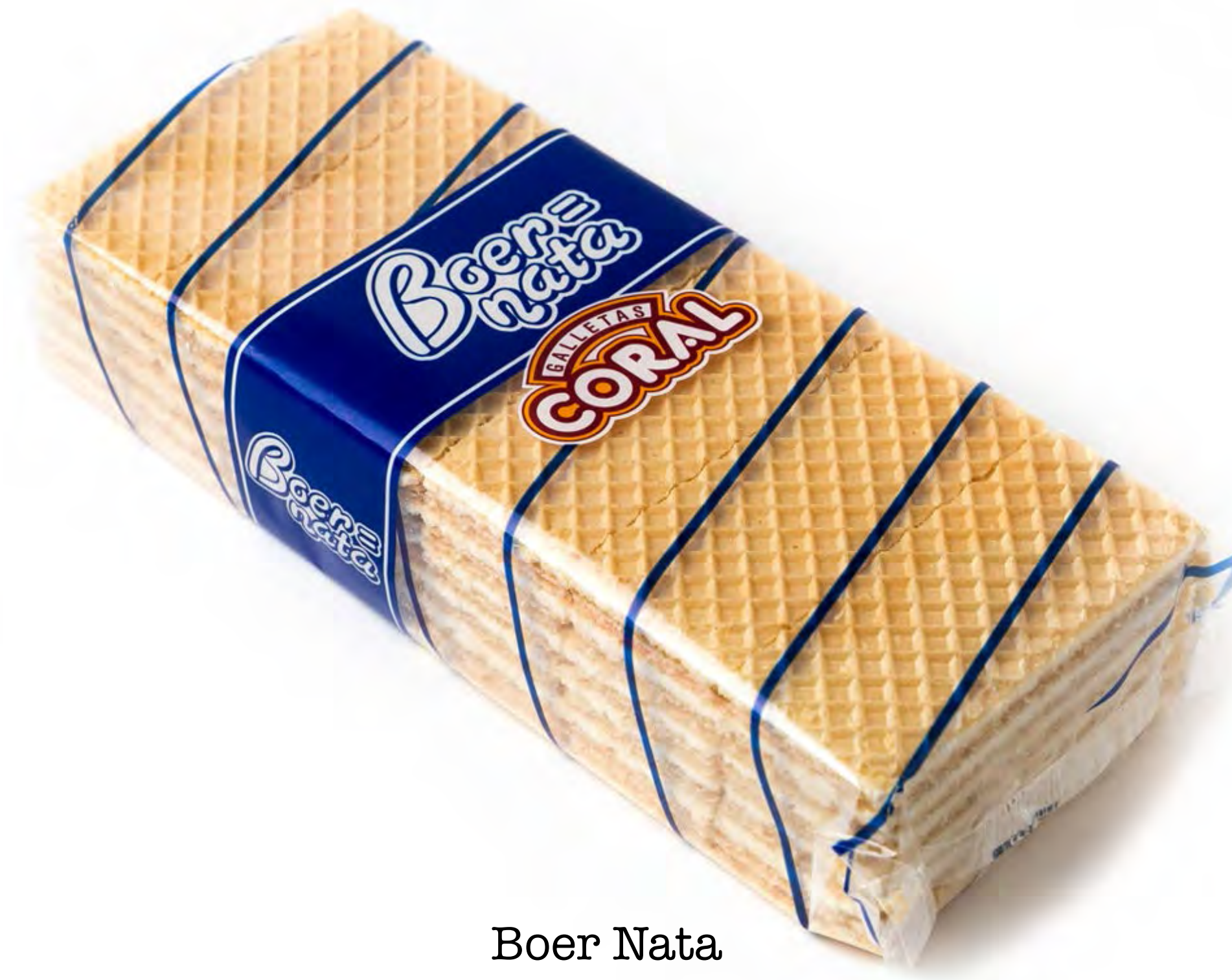
Boer Nata 330g. x 12 uds/caja