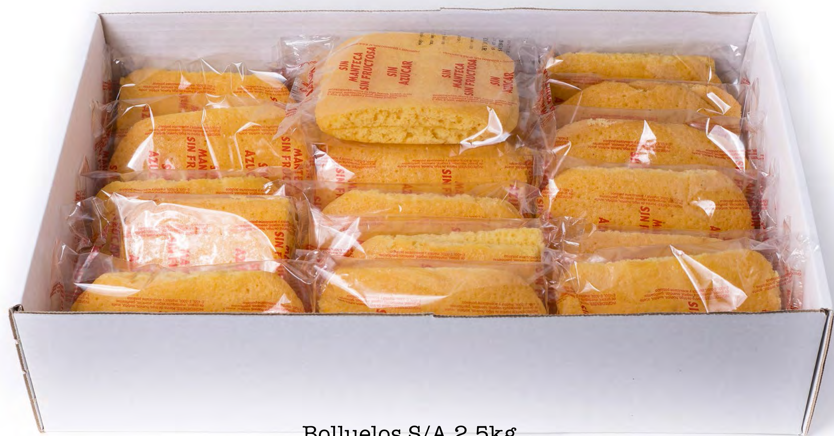
Bolluelos S/A 2,5kg.