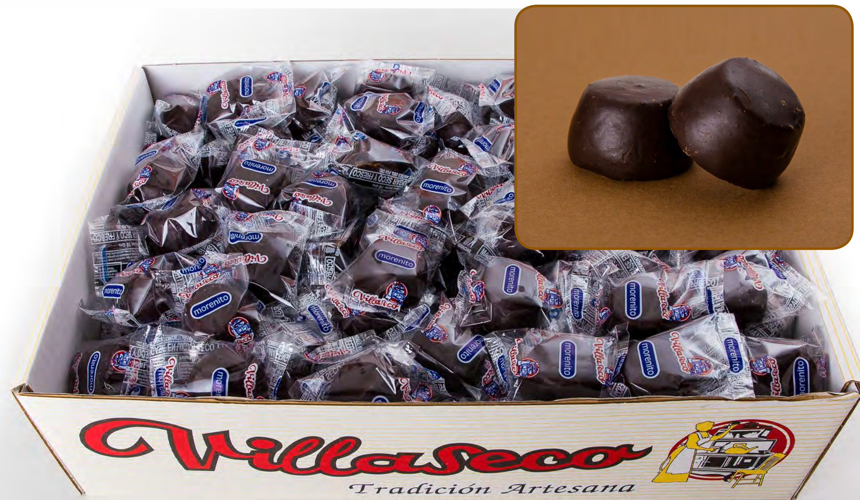
Morenito Chocolate 3 Kg