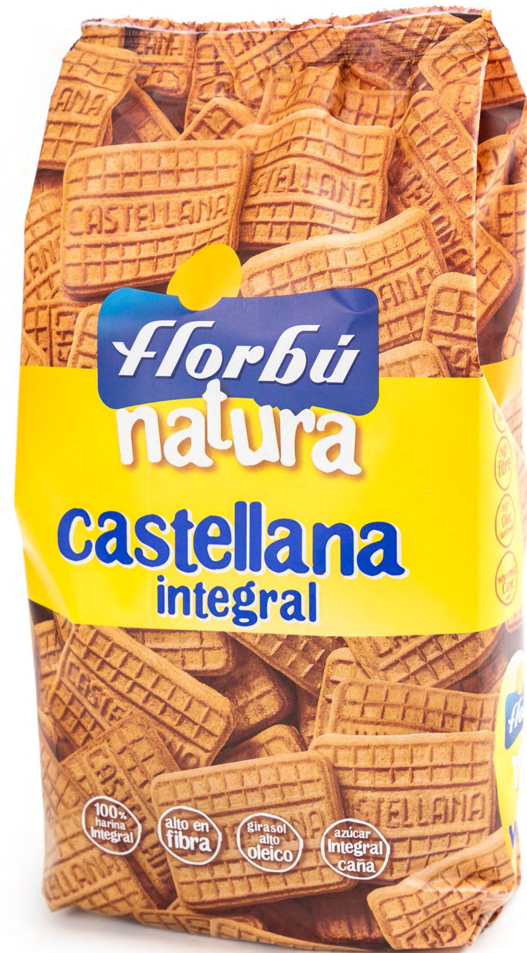
Galletas Castellanas 500g. x 10 uds/caja