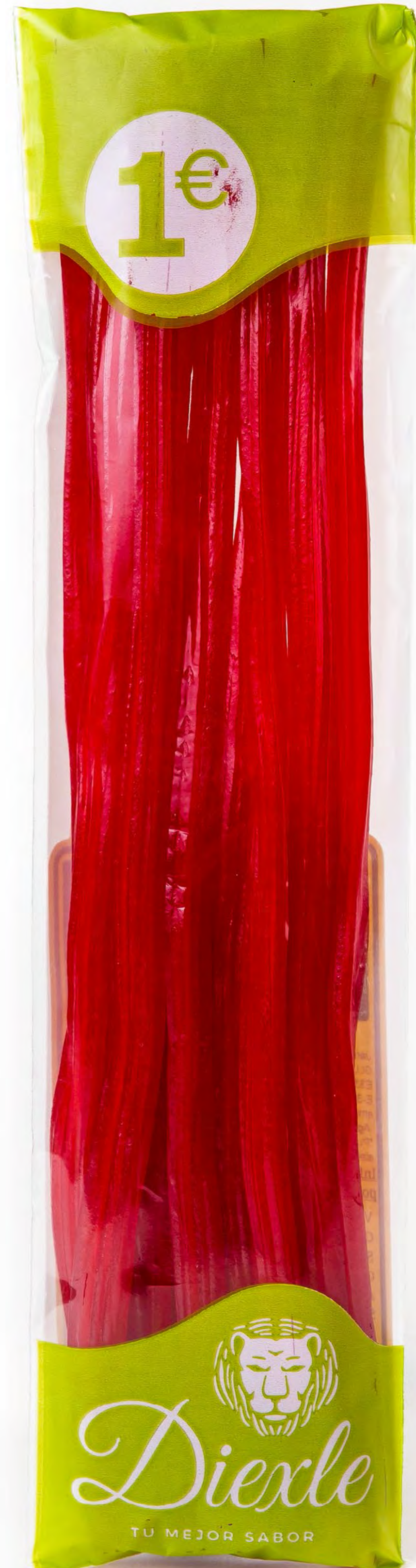
Regaliz Torcido Rojo