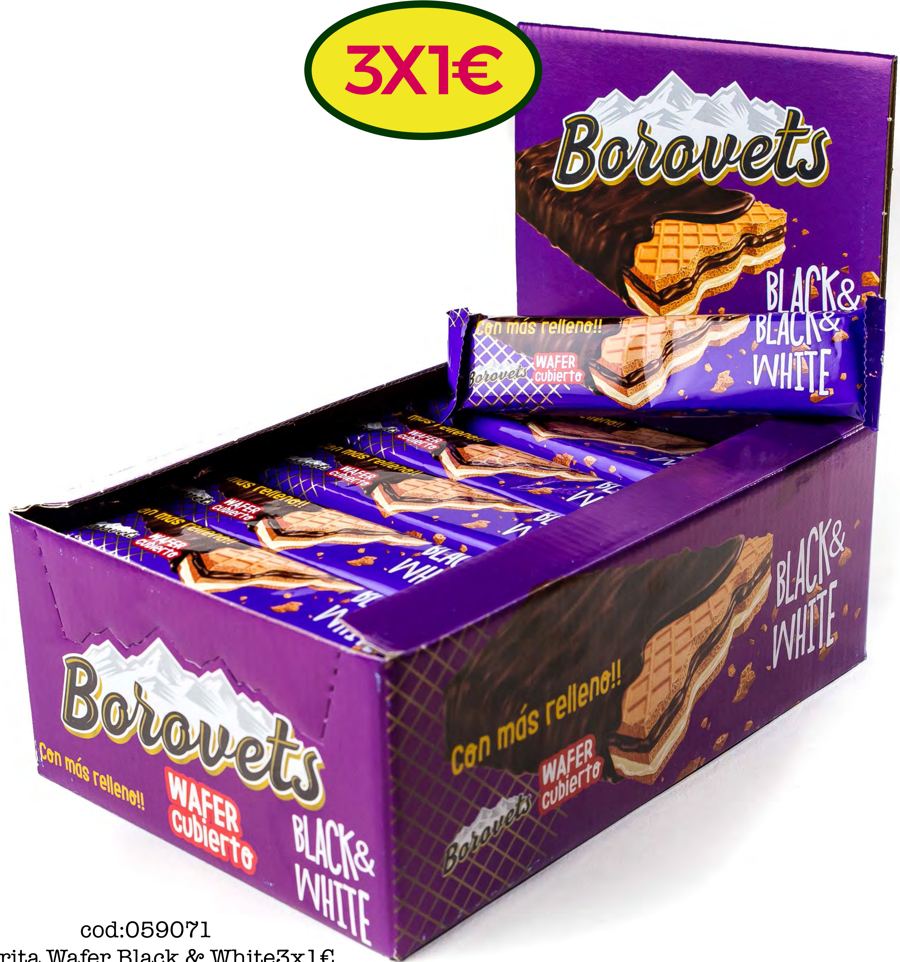
cod:059071 Barrita Wafer Black & White 3x1€