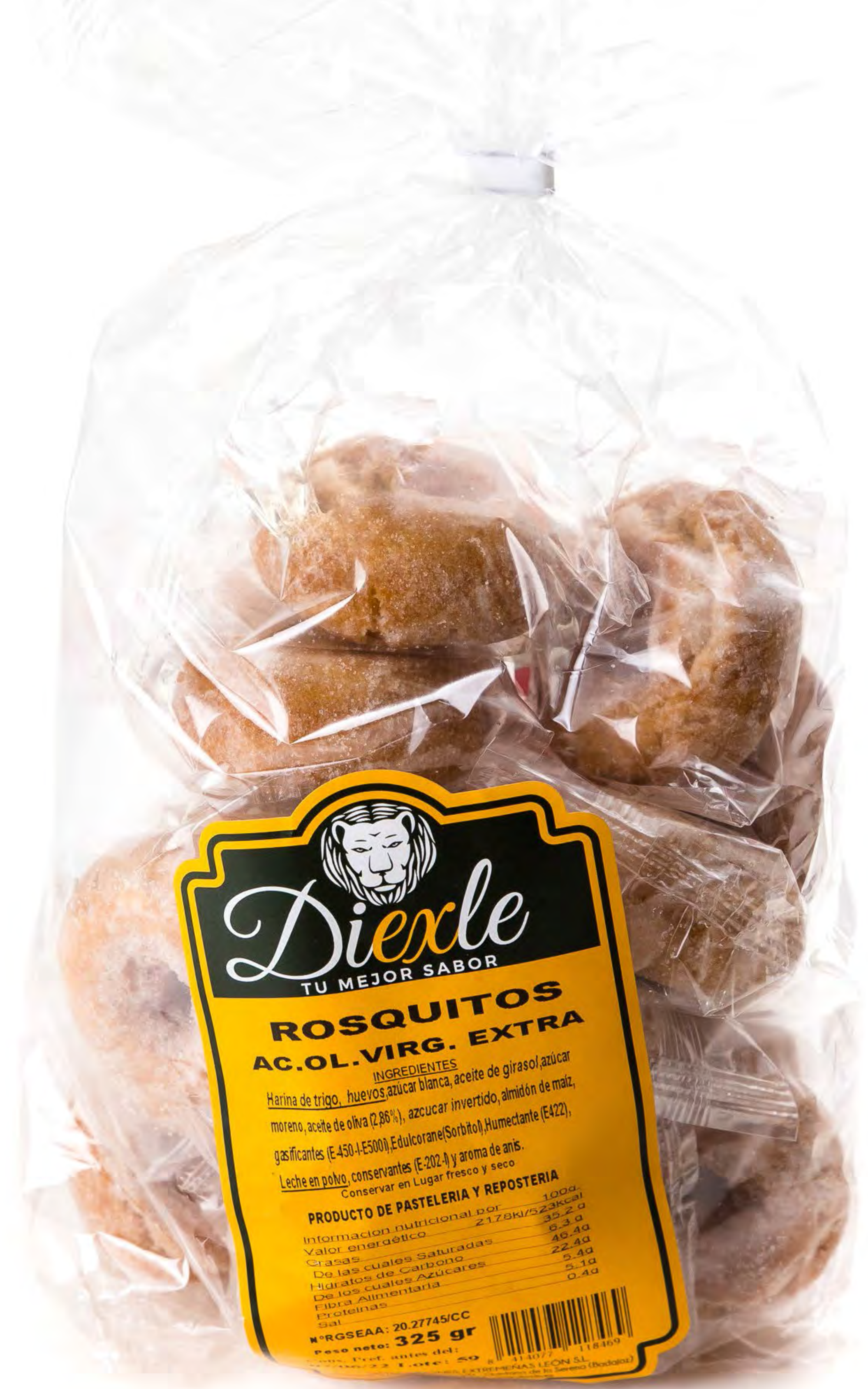
Roscas Fritas Diexle

Diexle TU MEJOR SABOR ROSQUITOS AC. OL. VIRG. EXTRA INGREDIENTES Harina de trigo, huevos, azúcar blanca, aceite de girasol, azúcar moreno, aceite de oliva (2,86%), azúcar invertido, almidón de maíz, gasificantes (E-450-I-E500), Edulcorante (Sorbitol), Humectante (E422), Leche en polvo, conservantes (E-202-I) y aroma de anís. Conservar en Lugar fresco y seco PRODUCTO DE PASTERIA Y REPOSTERIA Información nutricional por 100g. Valor energético 2178kJ/523kcal Grasas 35,2 g De las cuales Saturadas 6,3 g Hidratos de Carbono 46,4g De los cuales Azúcares 22,4g Fibra Alimentaria 5,4g Proteínas 5,1g Sal 0,4g Peso neto: 325 gr Nº RGSEAA: 20.27745/CC Cons. Pref. antes del: 29/08/20 Lote: 06 DISTRIBUCIONES EXTREMEÑAS LEÓN S.L. Pol. Vicente Sánchez Cabeza S/N - Quintana de la Serena (Badajoz) Telf: 677 019 338 - www.diexle.es R.G.S. 40.058135/BA