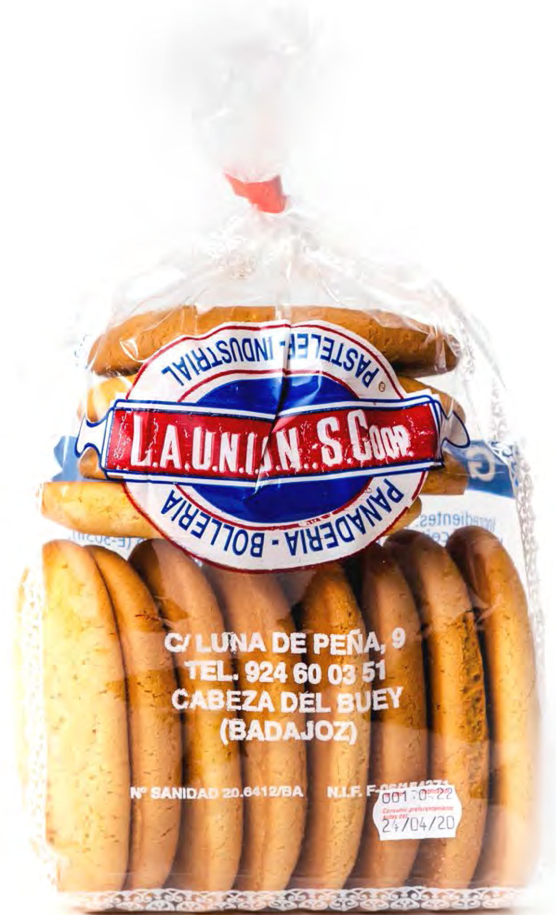
Galletas Lisa 12 und/caja