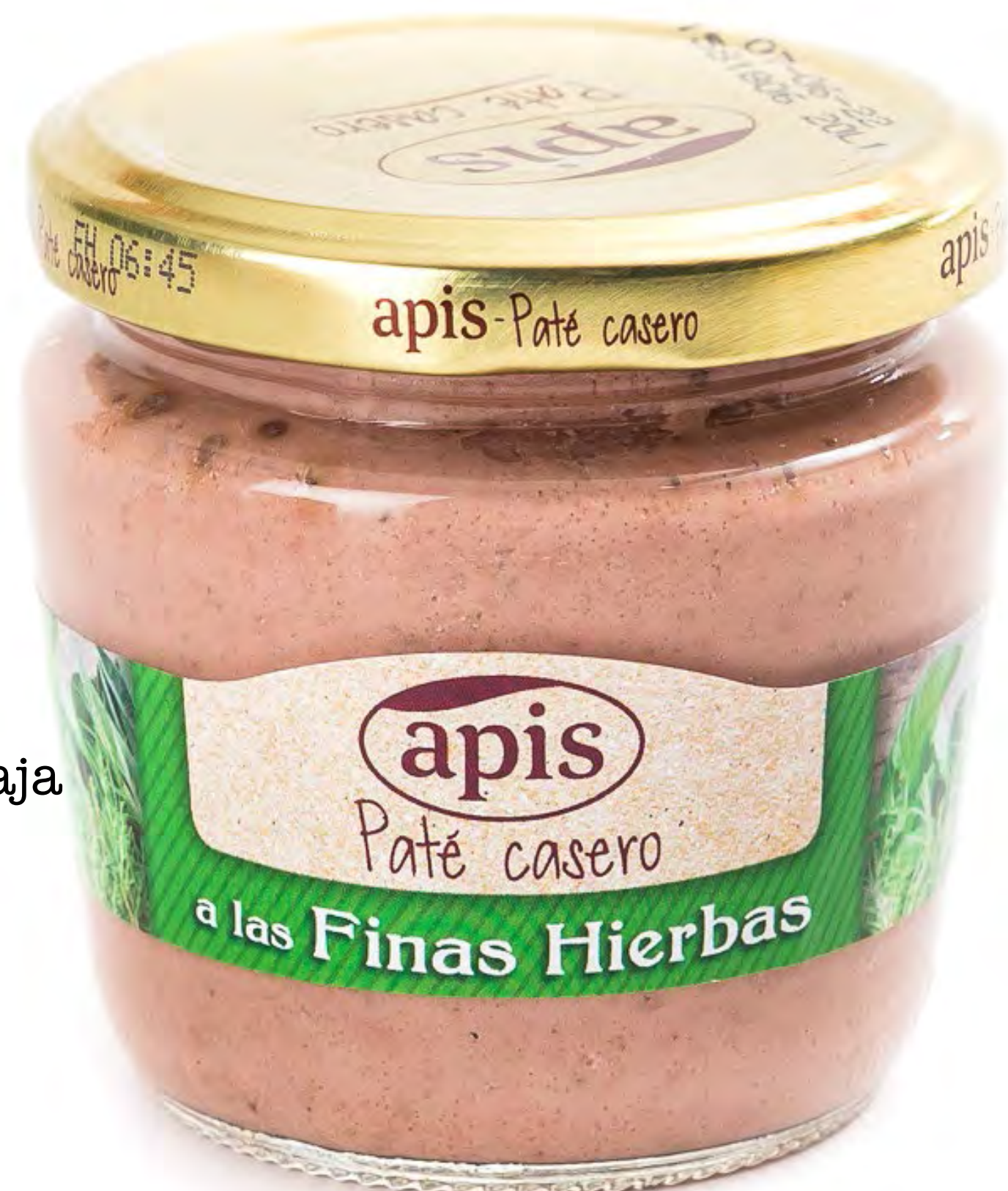
cod.156006 Paté Finas Hierbas 15 uds/caja