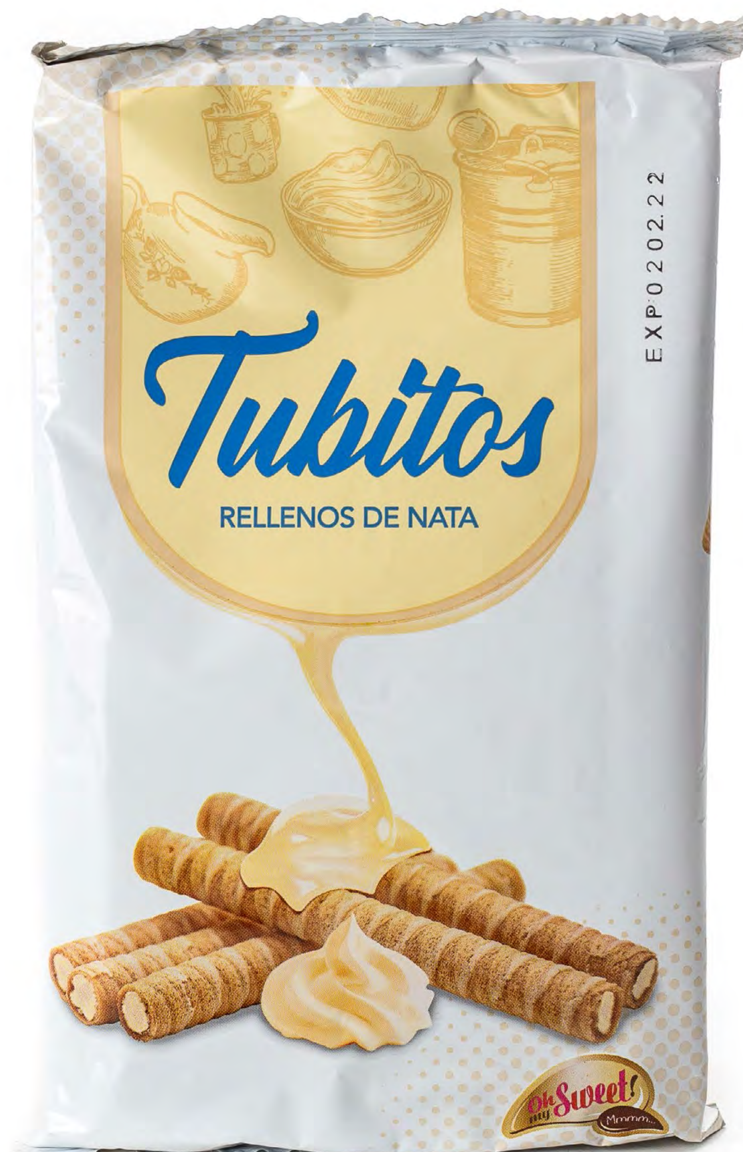
Cod. 059046 Gloski Tubito Nata 12 und/caja