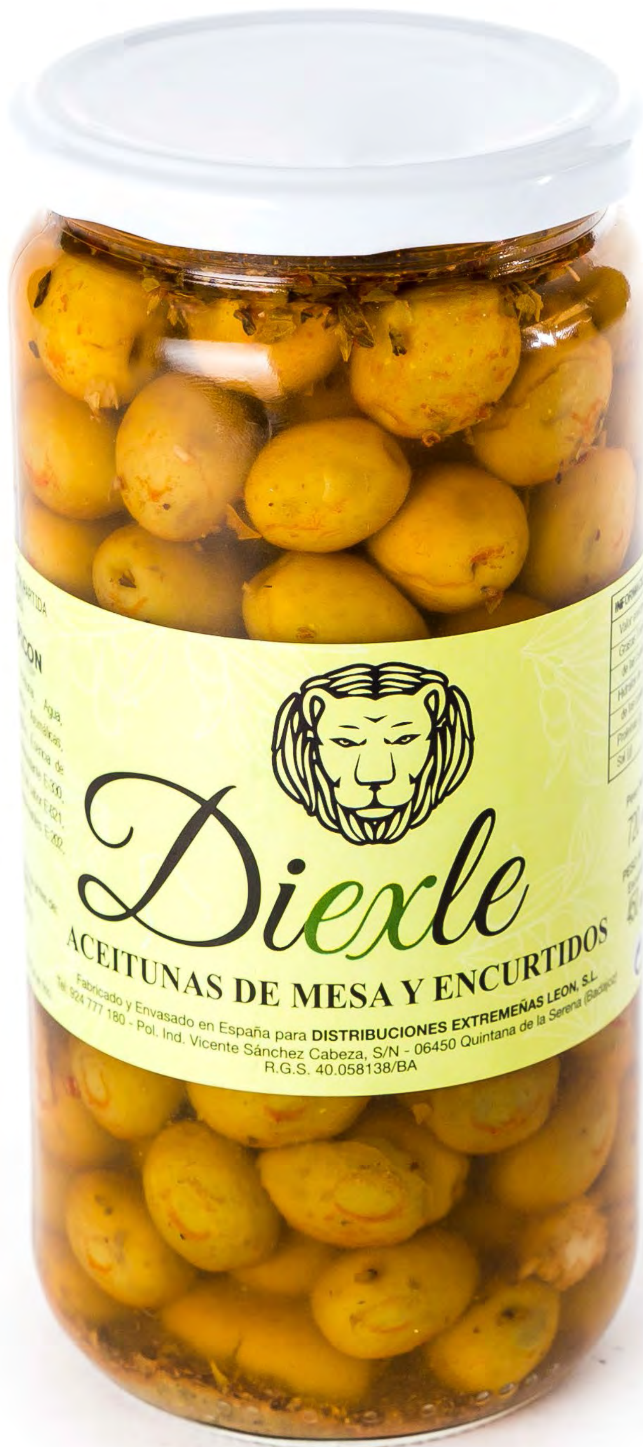
Aceituna Diexlez 8 uds/caja