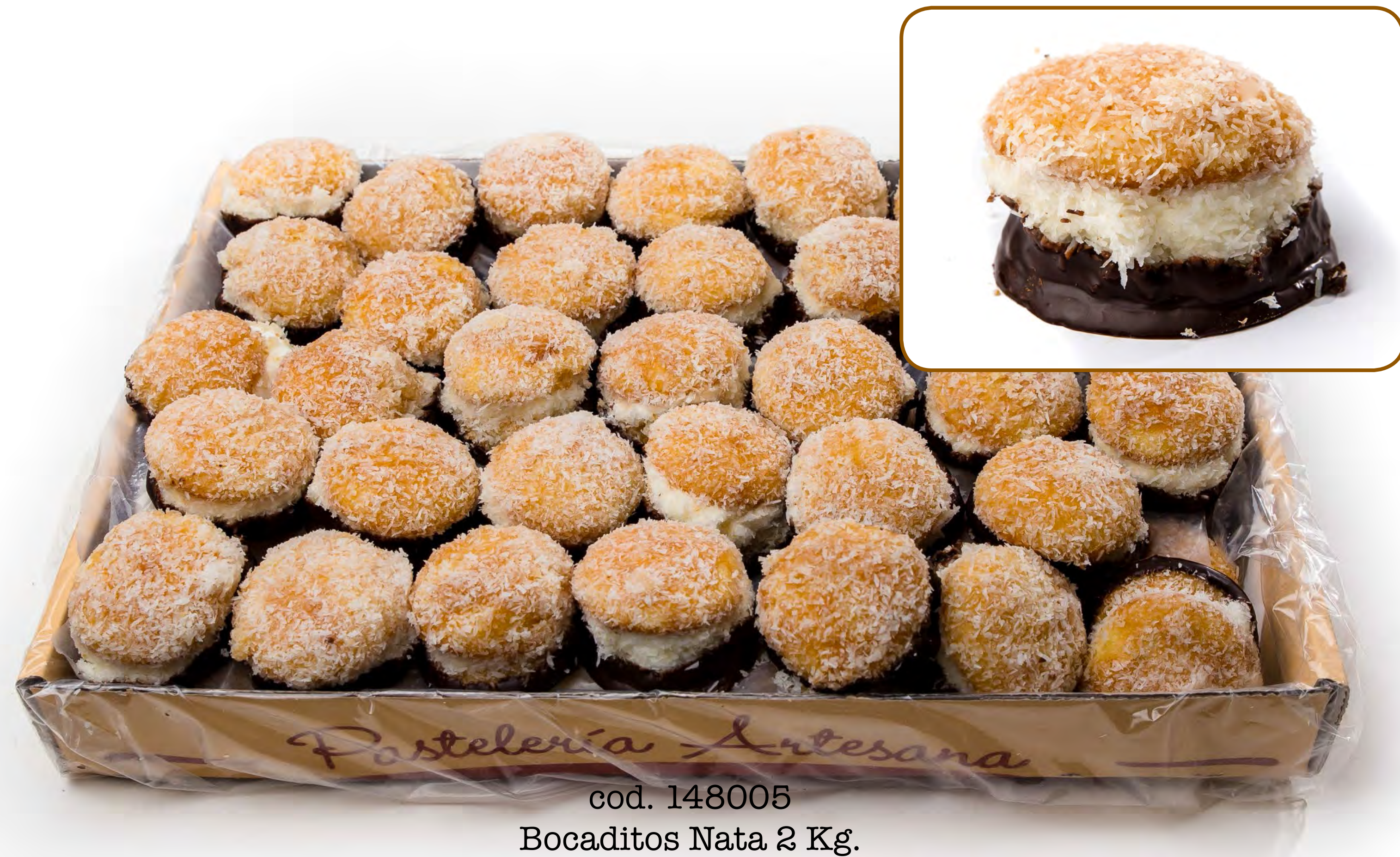
cod. 148005 Bocaditos Nata 2 Kg.