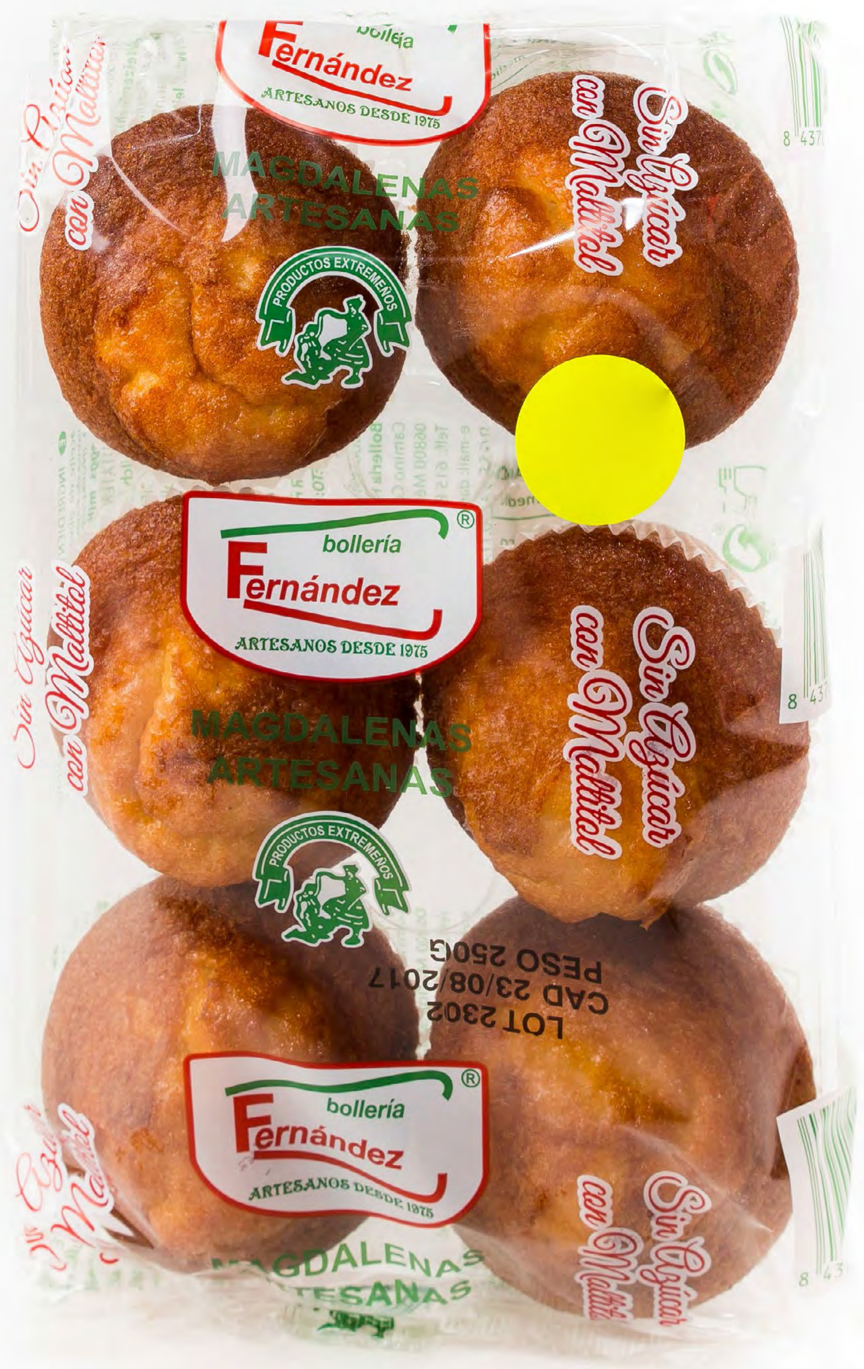
Magdalenas Redondas S/A 10 uds/caja