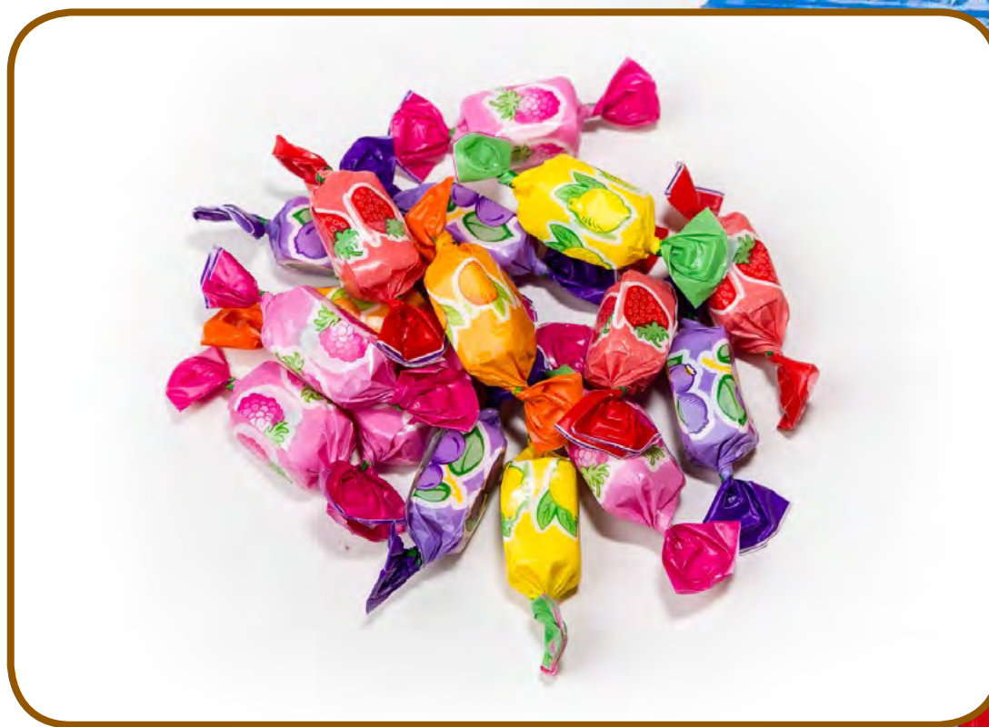
Cod: 118006 Caramelos Blando Fruta 16 und/caja