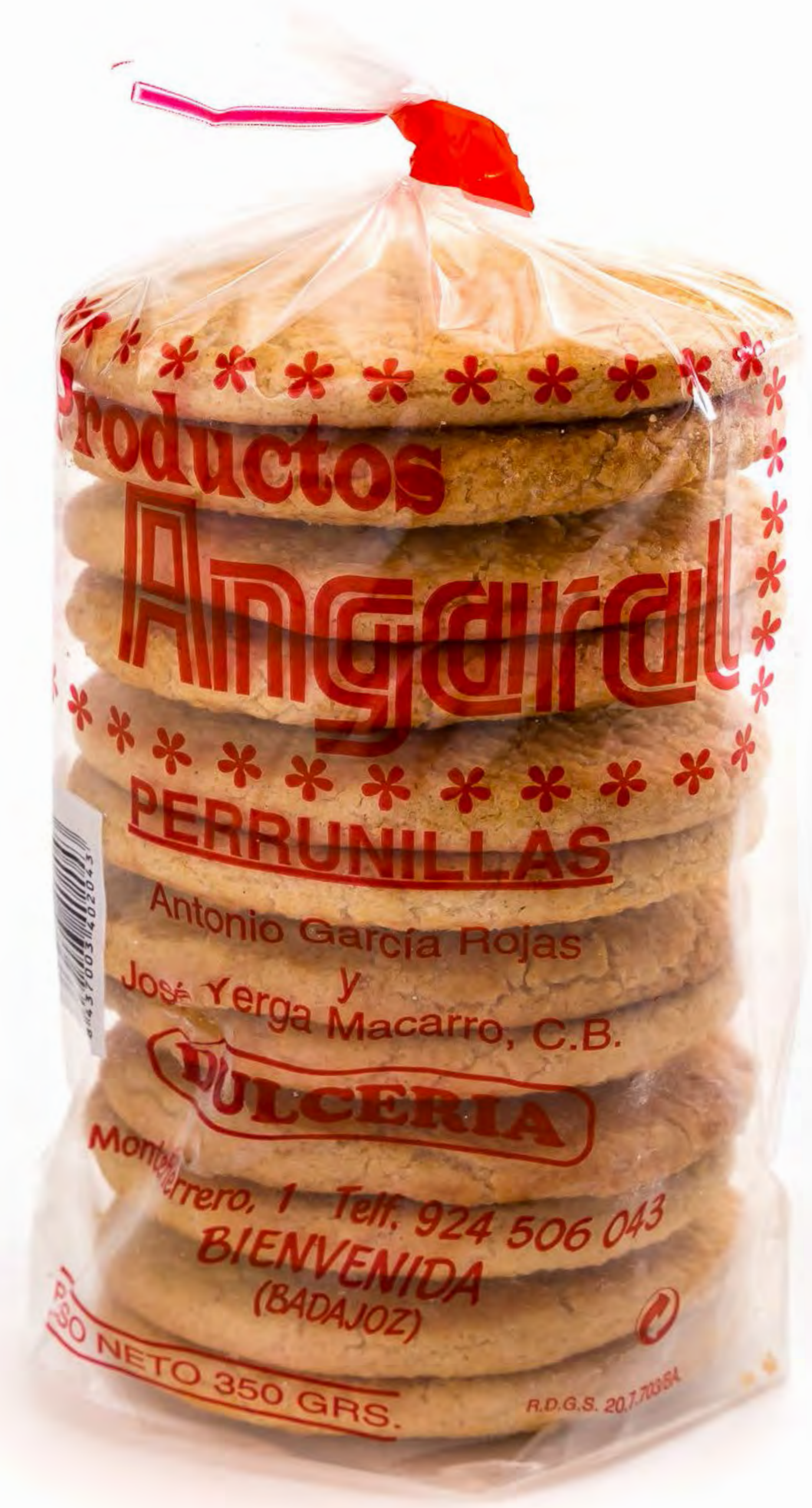
Perrunilla Angaral 12 und/ caja