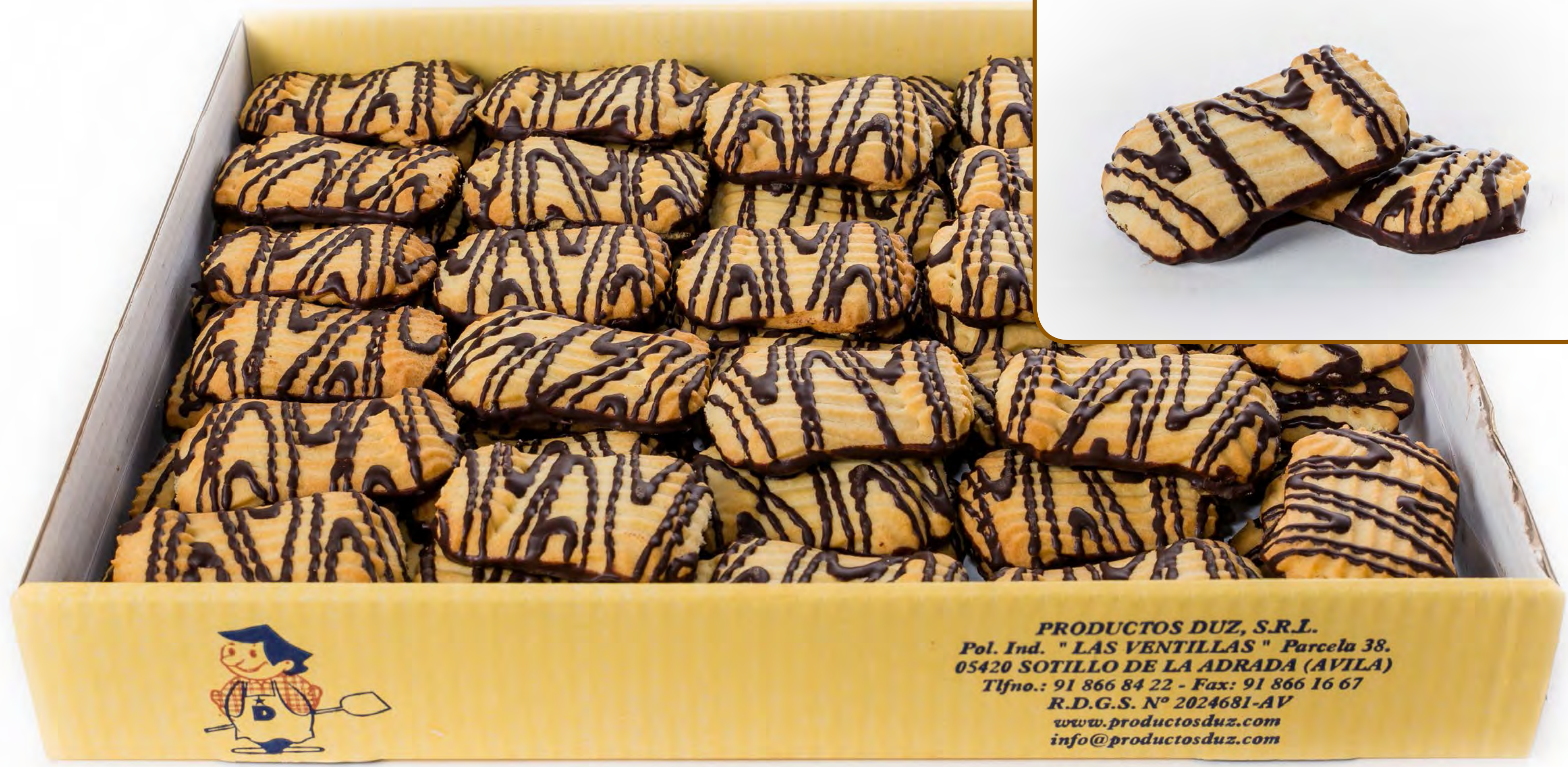
Rizadas Mantequilla Choco 2,5 Kg.