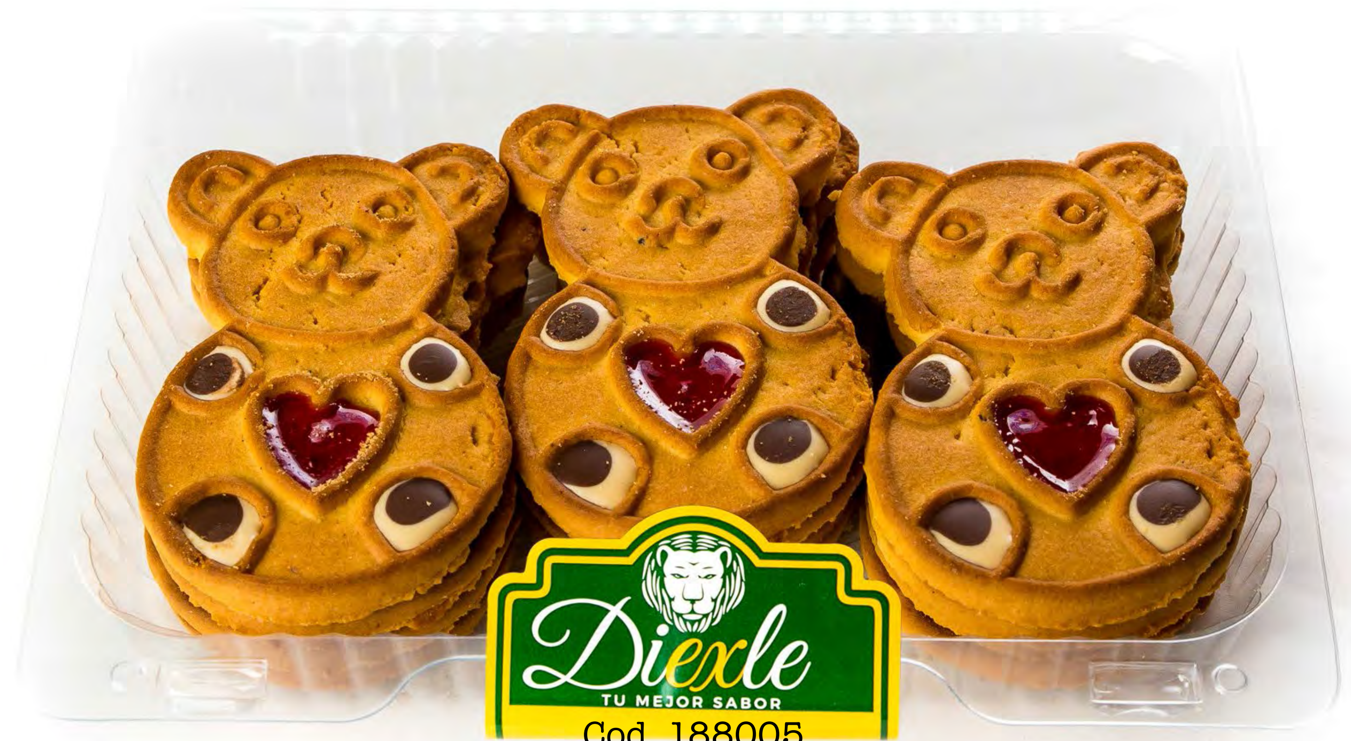
Dutico Galletas Osito 6und/caja