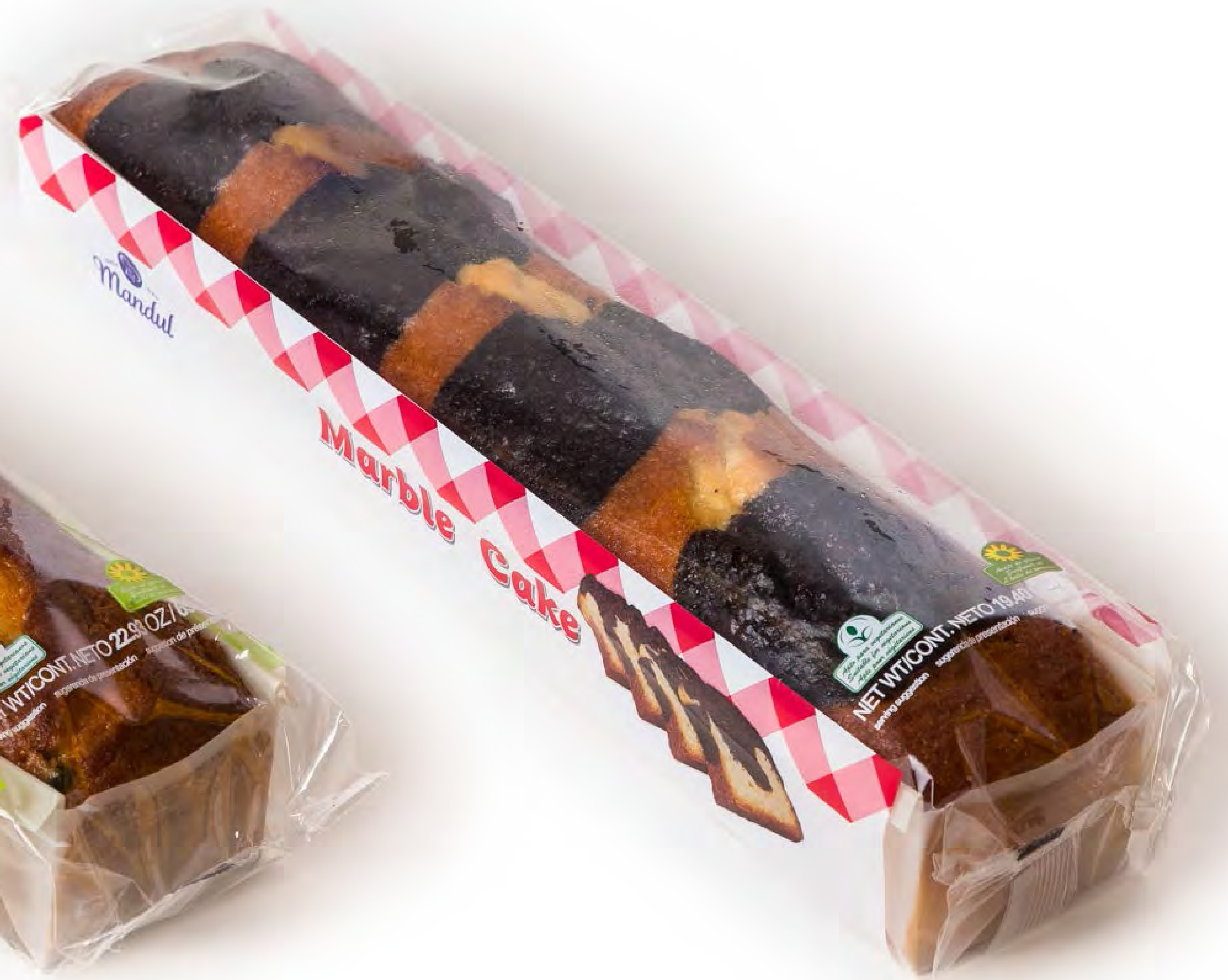
Cake Marble 5 uds/caja 500g.