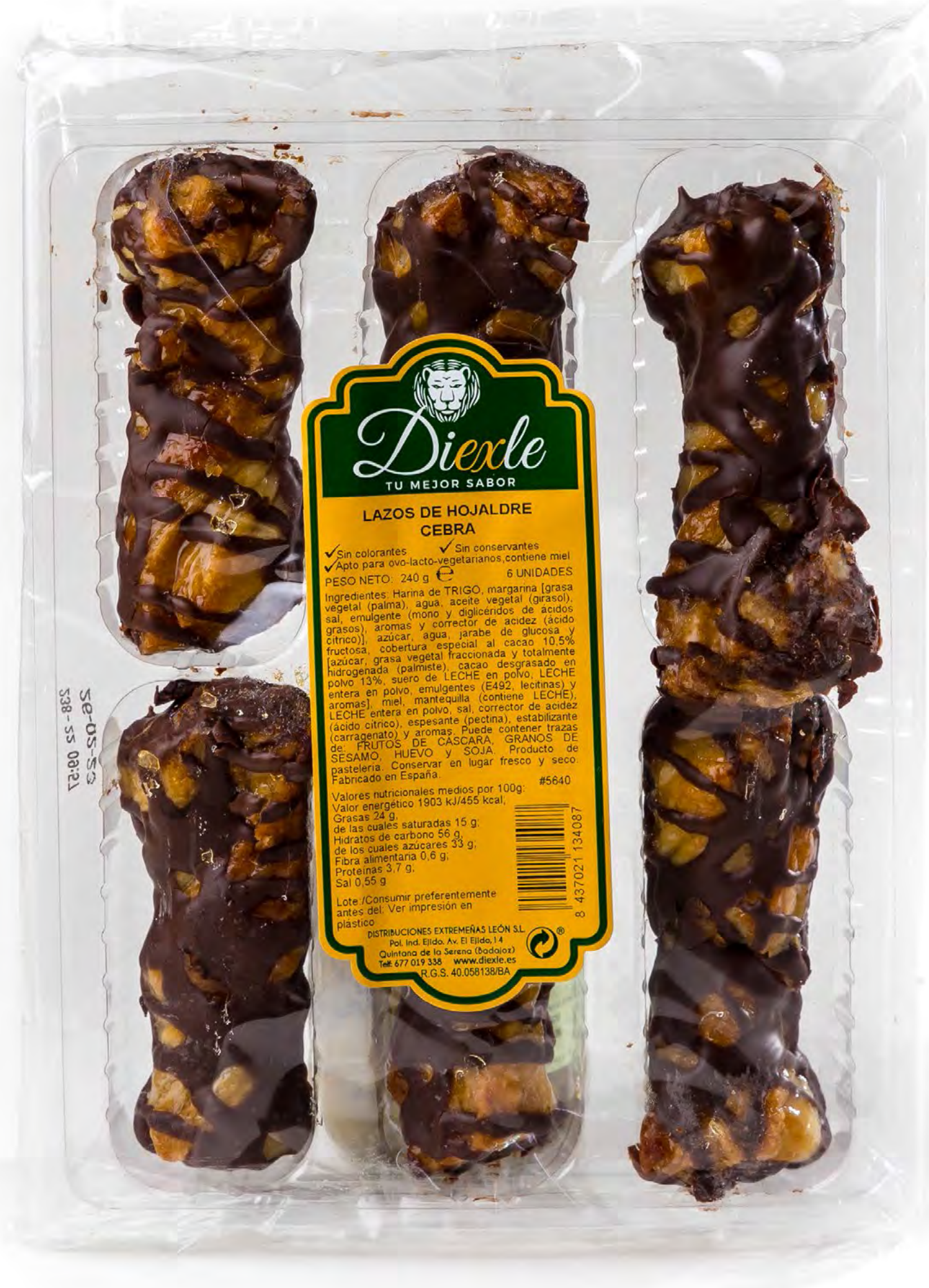
Cod. 054006 Lazos Cebra 15 uds/caja