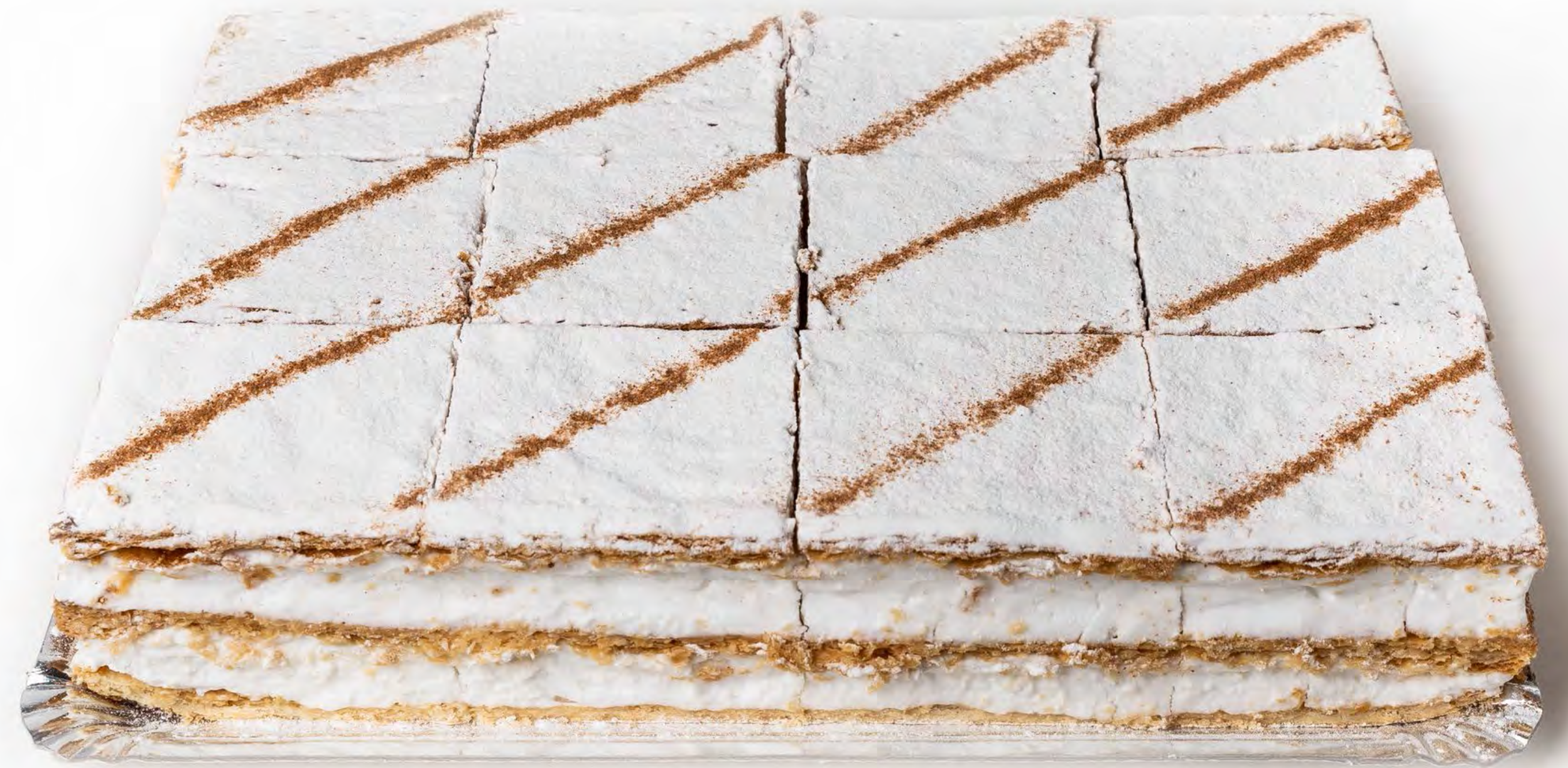
Milhojas 1,8 Kg.