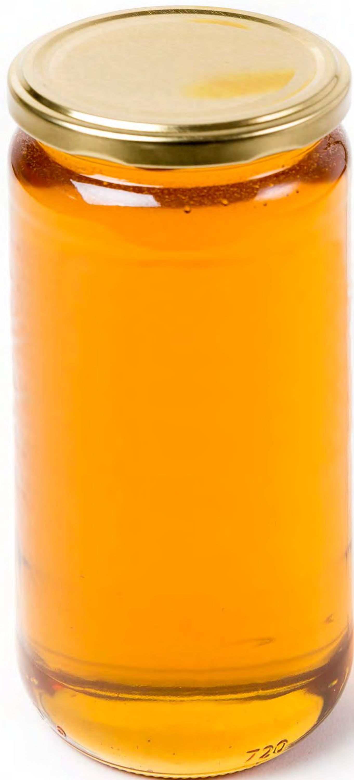
Arromiel 1 Kg.