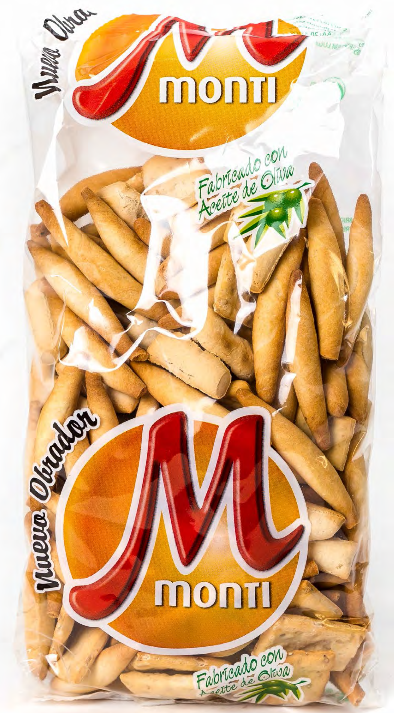
Coctel de Picos 12 uds/Caja