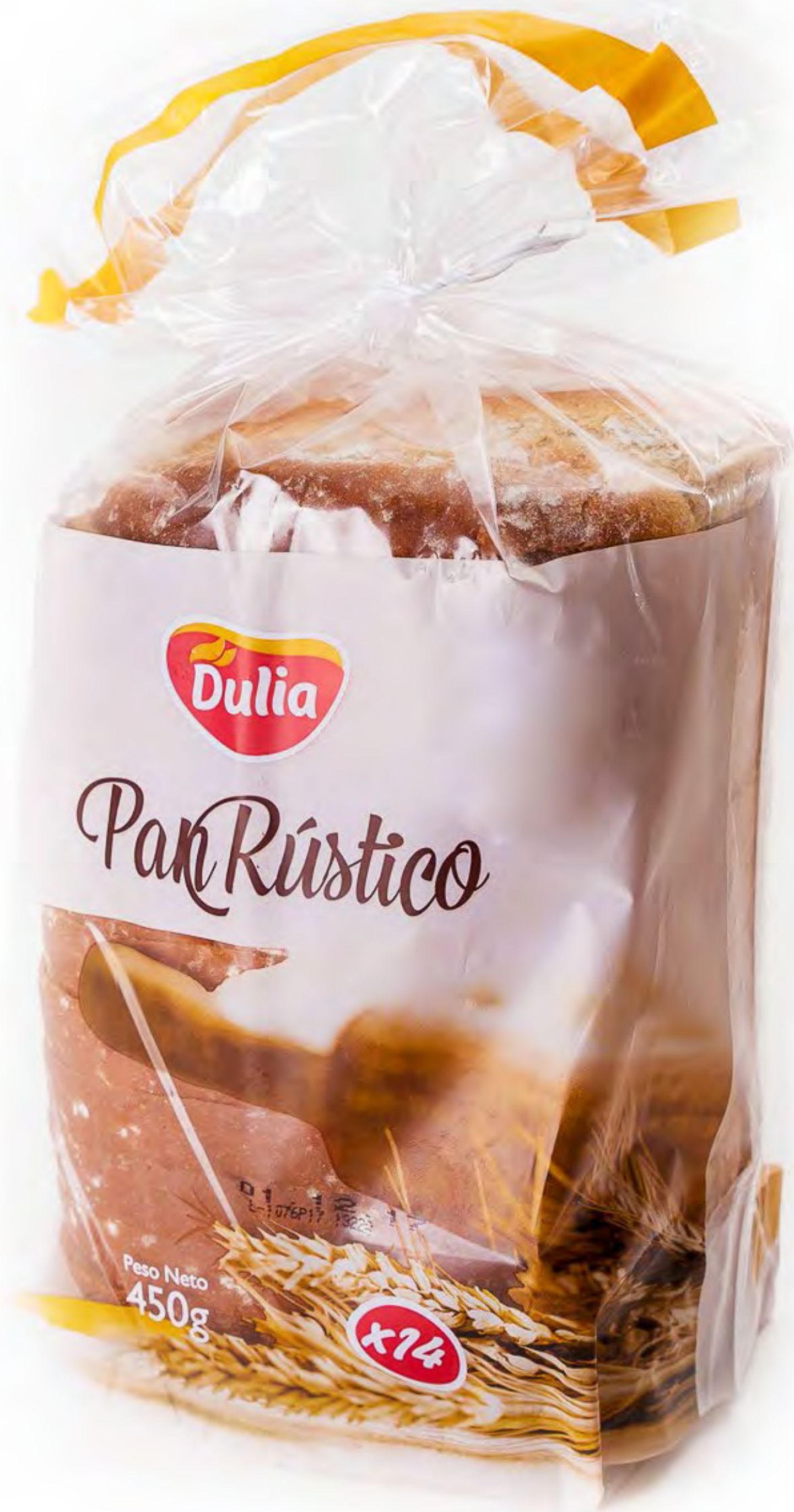
Pan de Molde Rústico 450g x 6 uds/caja