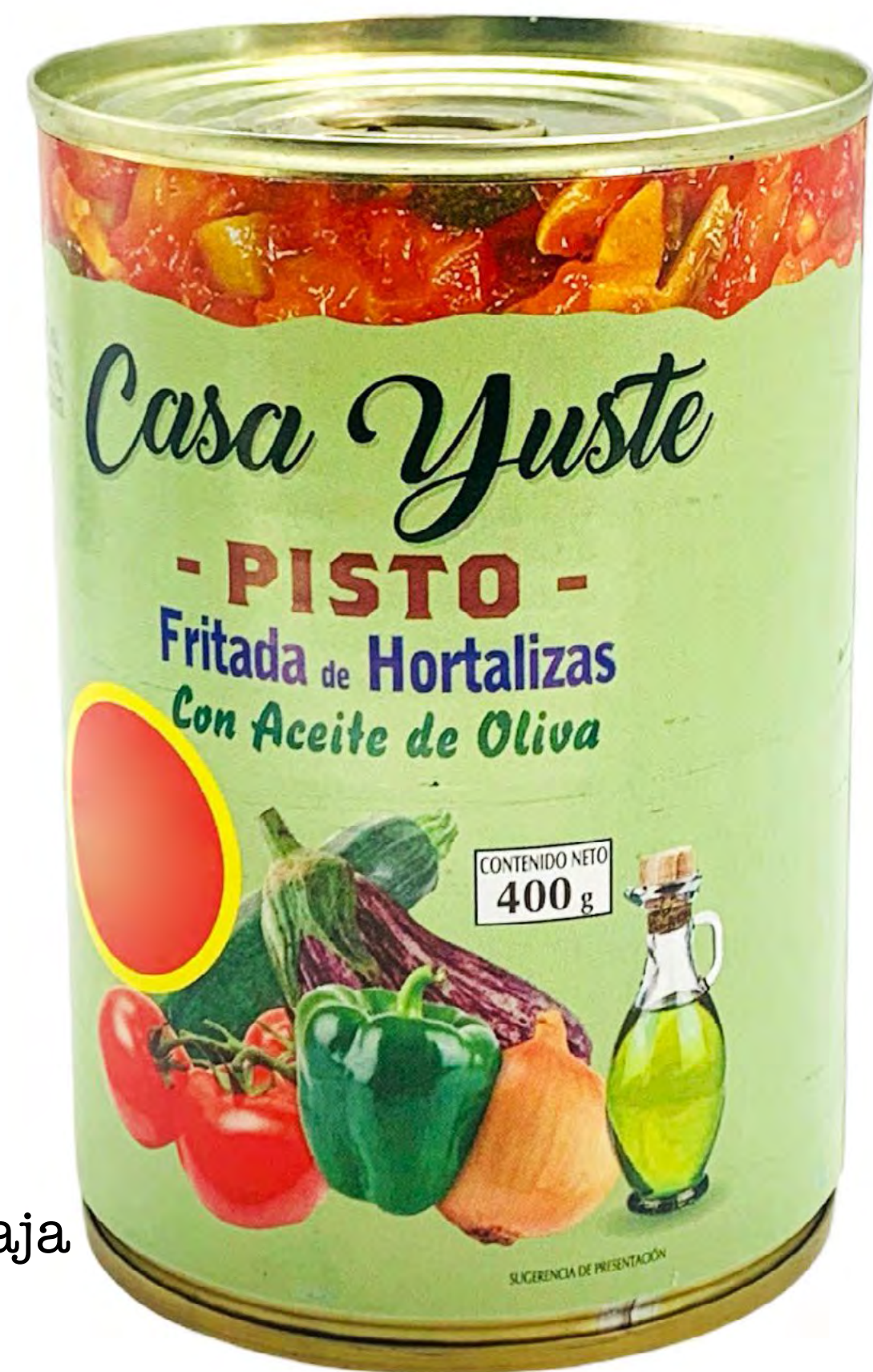
Tomate Frito Aceite de Oliva 12 und/caja