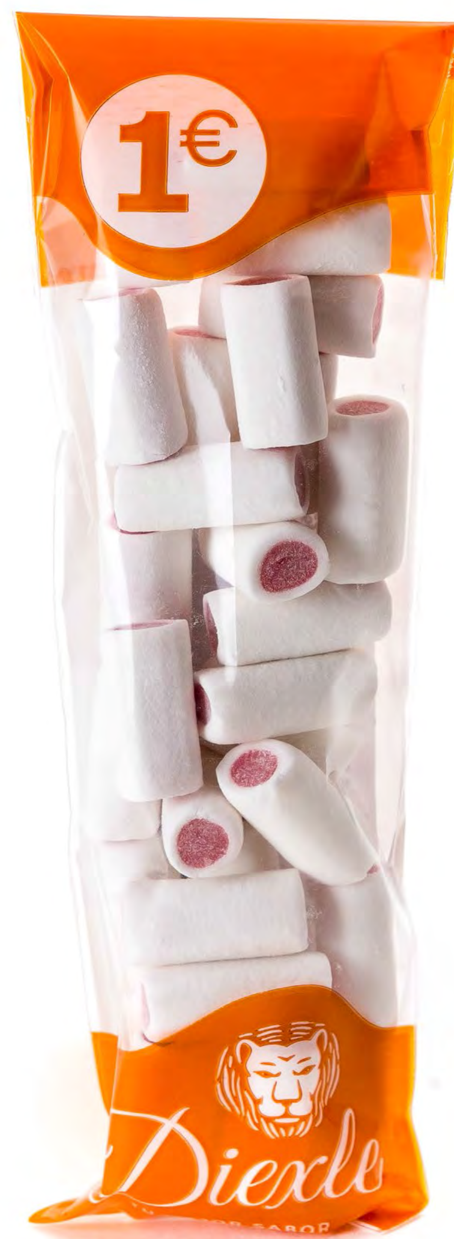
Cod: 193065 Tacos Lápiz Nata-Fresa 20 und/caja