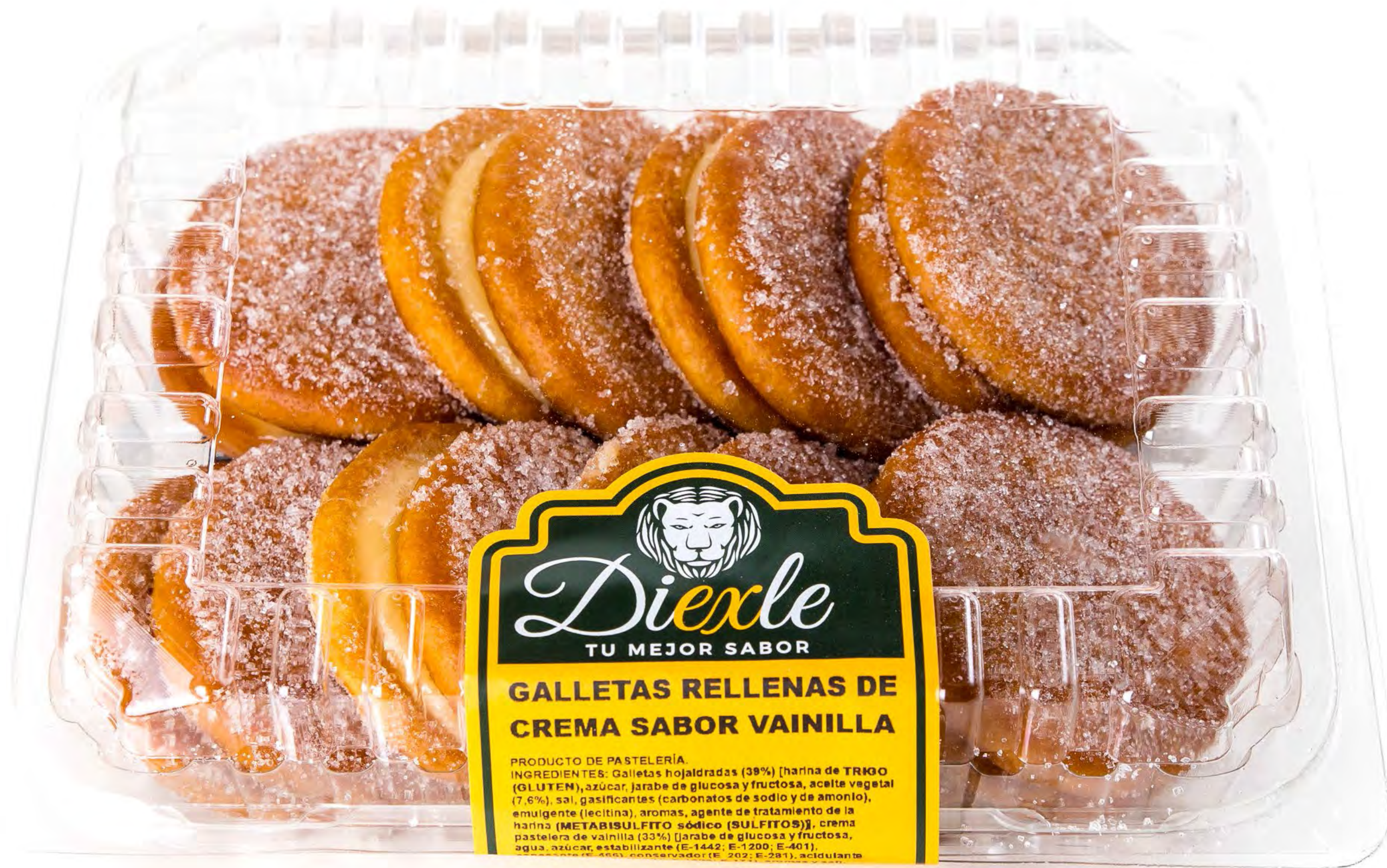
Cod. 106005 - Galletas Crema 300g. 12 und/caja