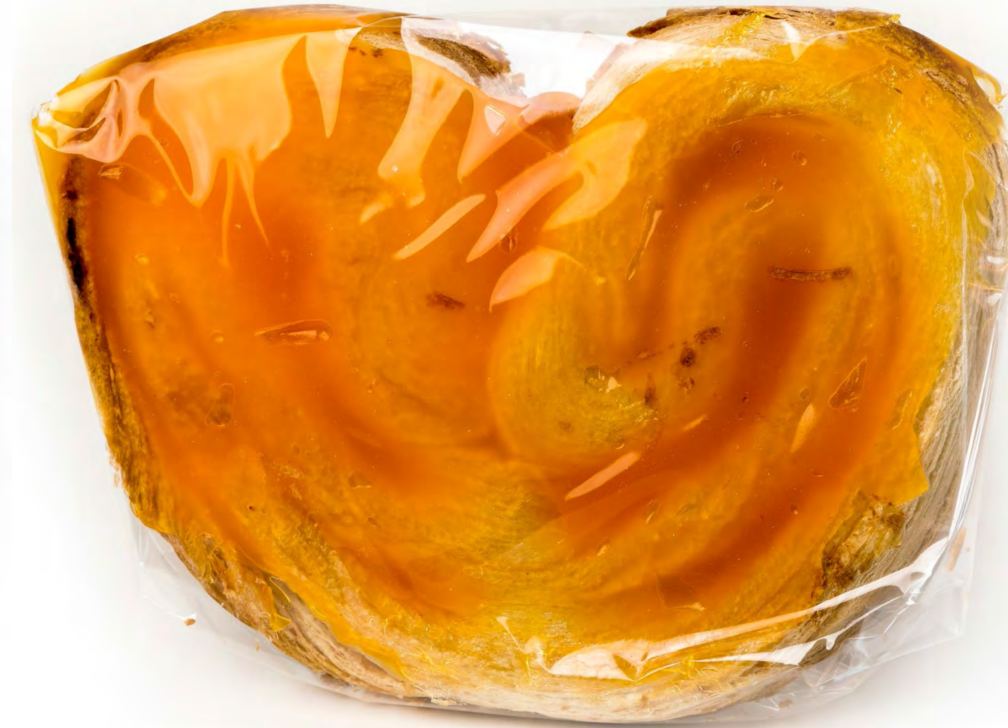
Palmera Yema 12 uds/caja