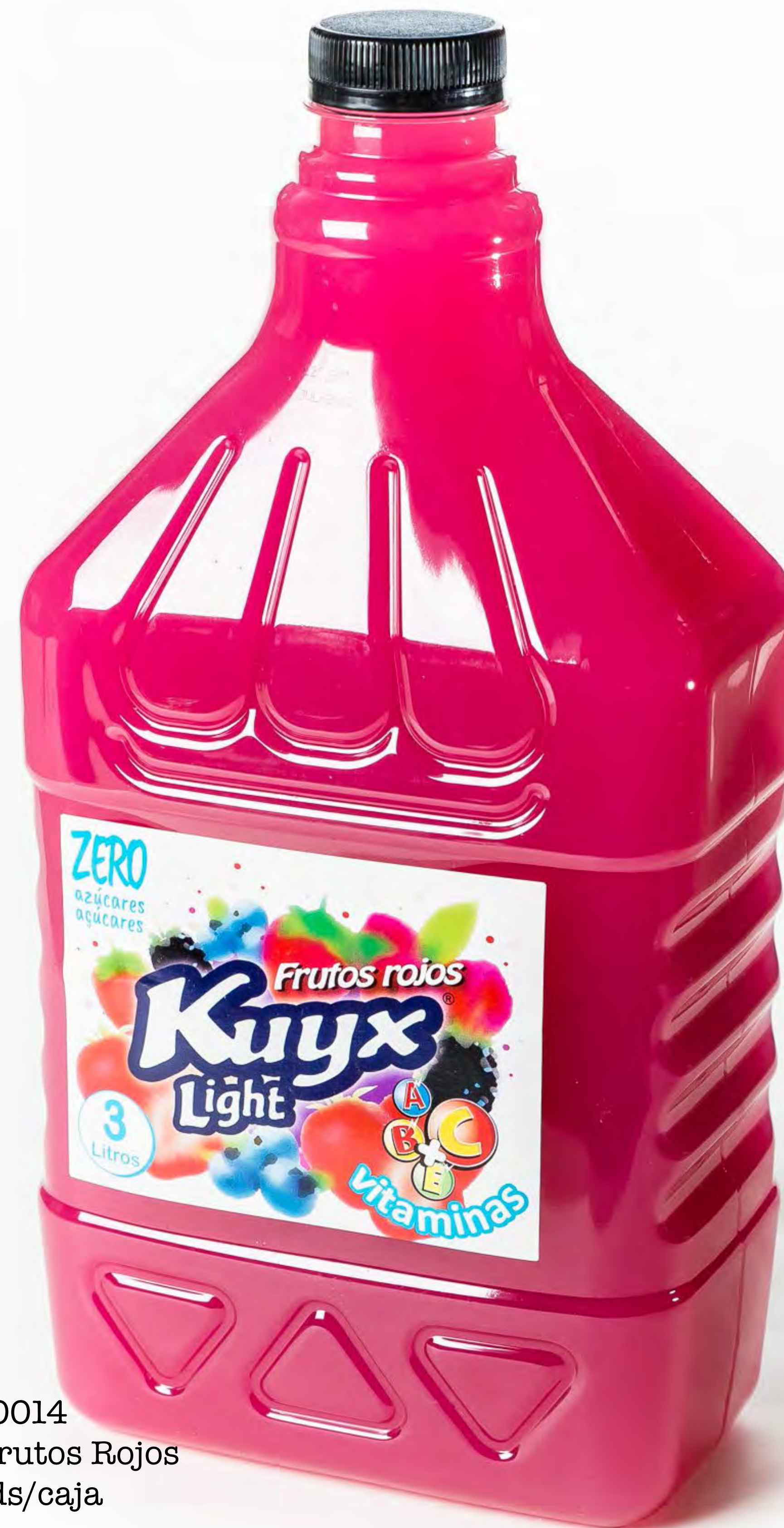
Cod. 50014 Zumó Kuyx Frutos Rojos 3L x 4 uds/caja