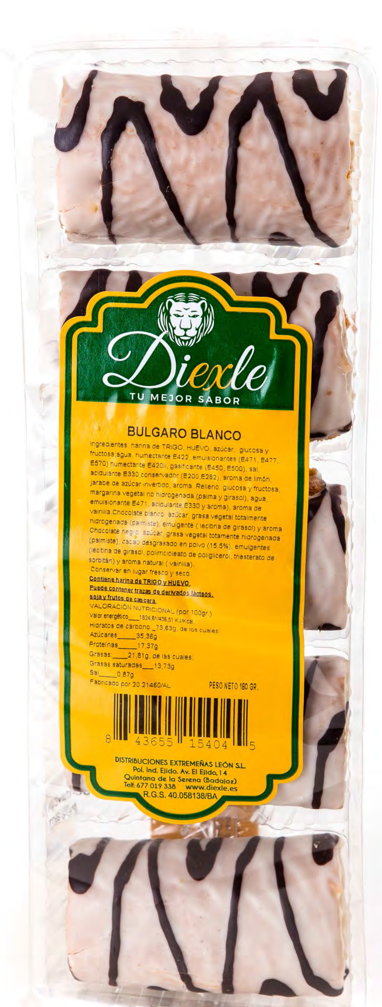
Búlgaros Choco Blanco 180g. x 16 uds/caja