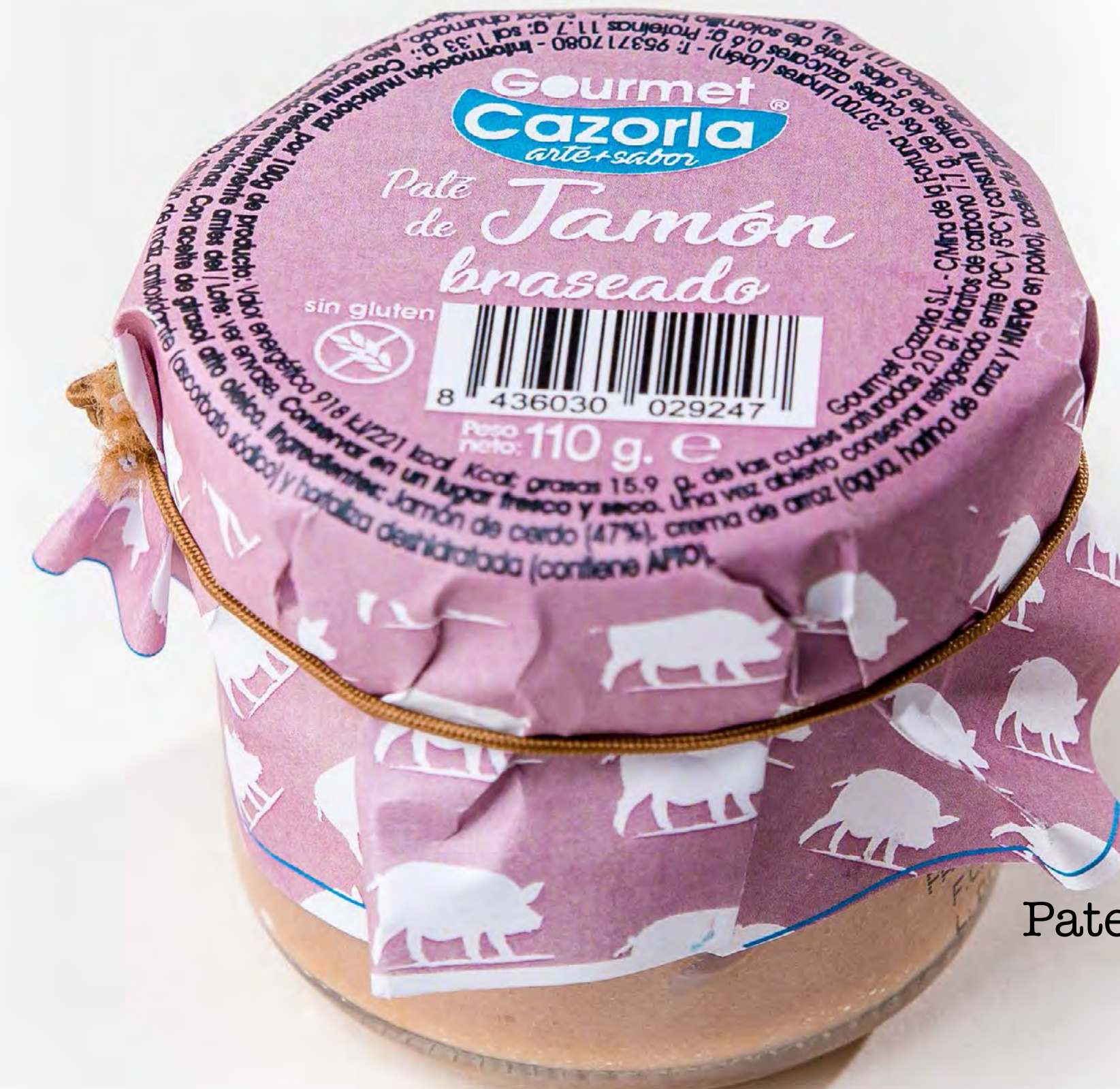
cod.249002 Pate Jamón Braseado 12 uds/caja