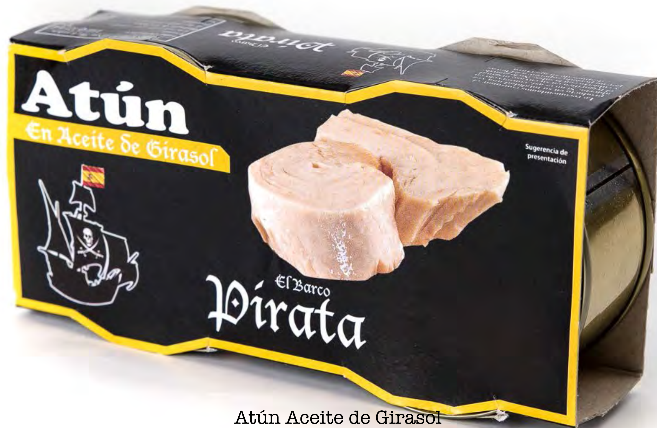
Atún Aceite de Girasol