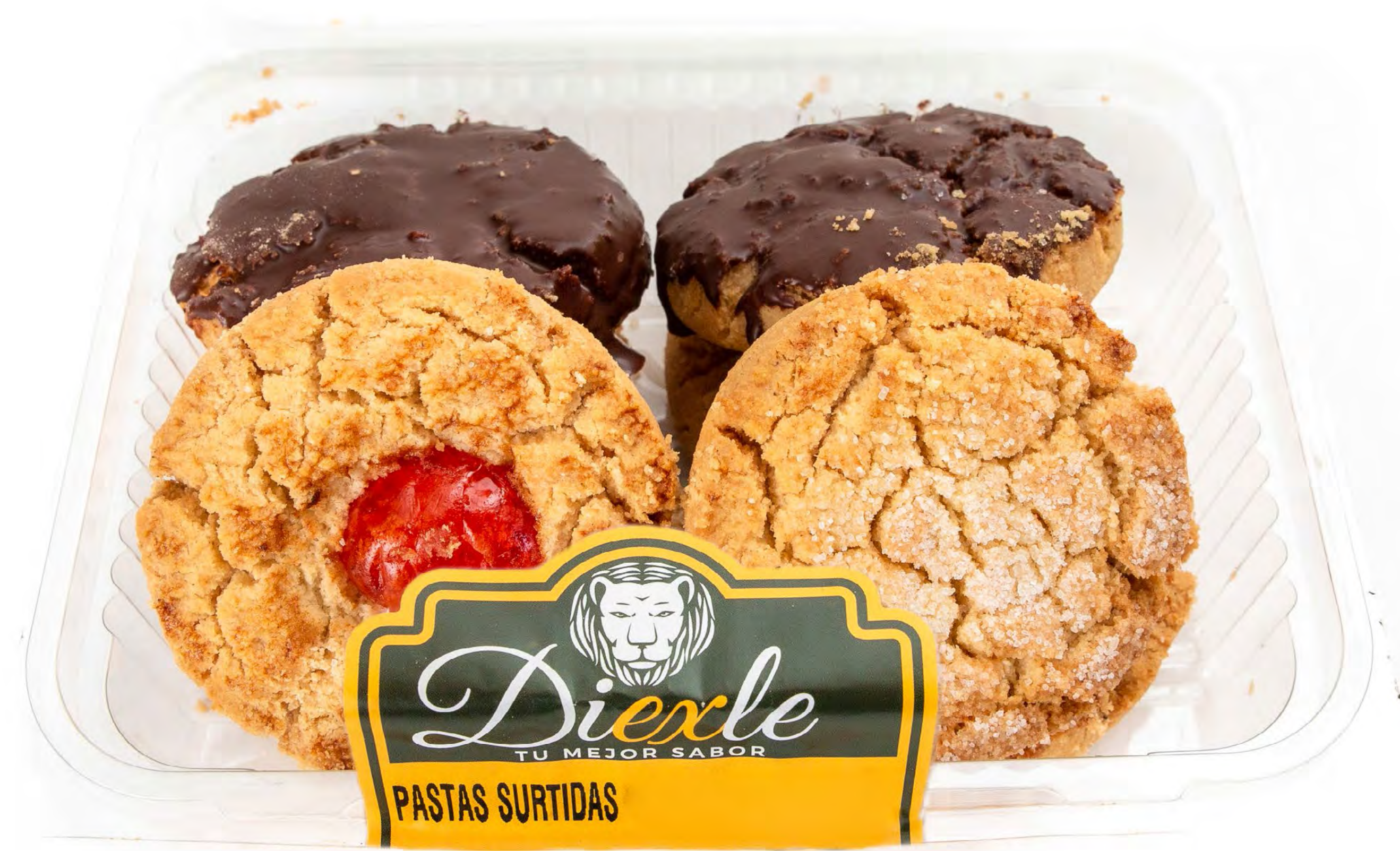
Pasta Surtidas 10 und/caja