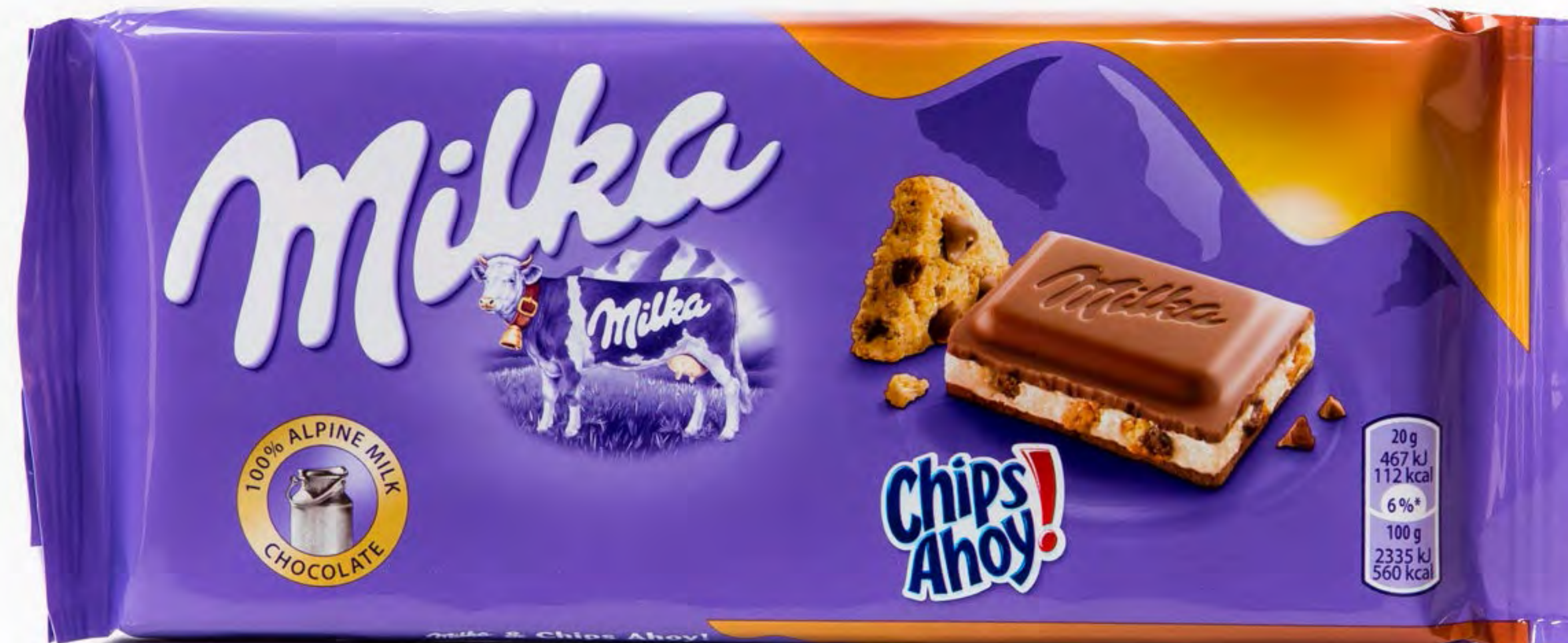
Milka Chips Ahoy