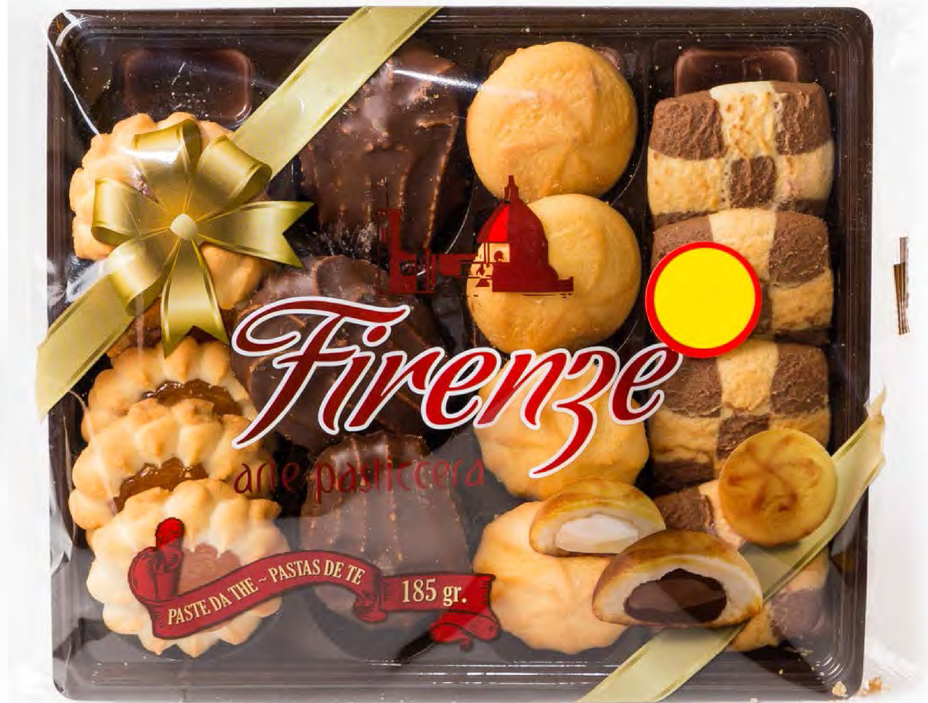
Pastas de Té Rellenas 10 uds/caja