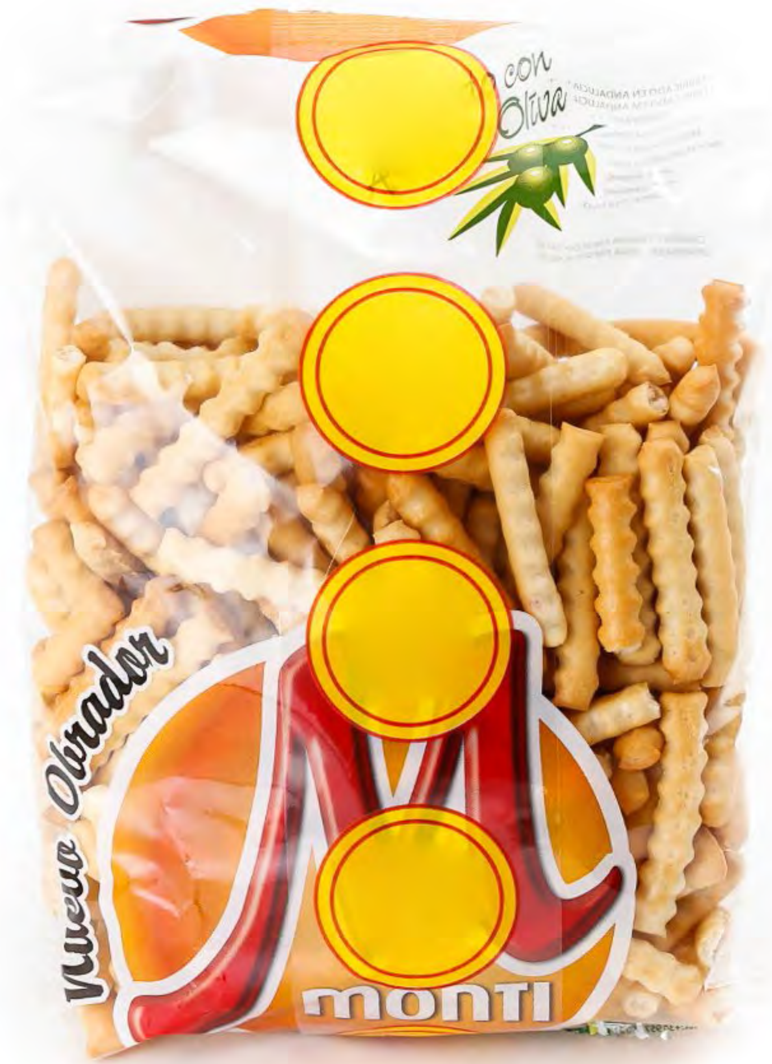
Trencinas Aceite de Olivas 12 uds/Caja