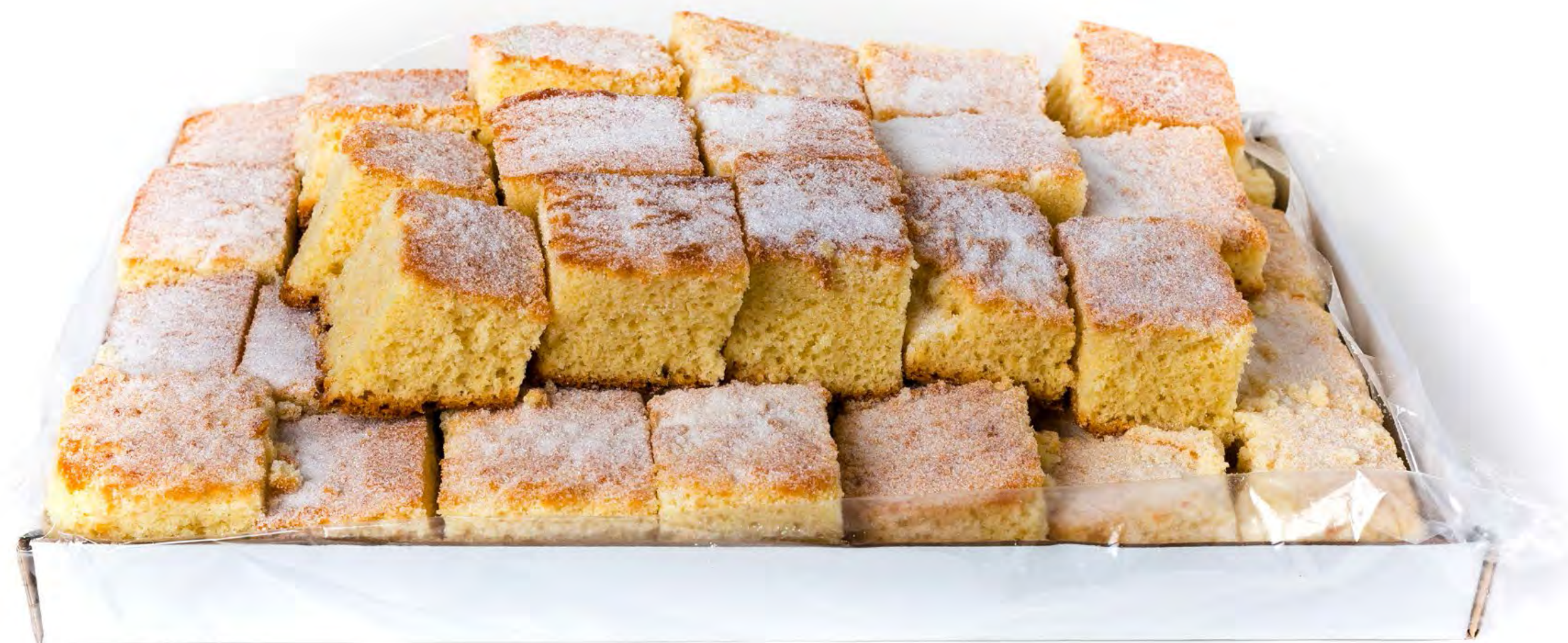
Bizcocho Almendra 3 Kg.