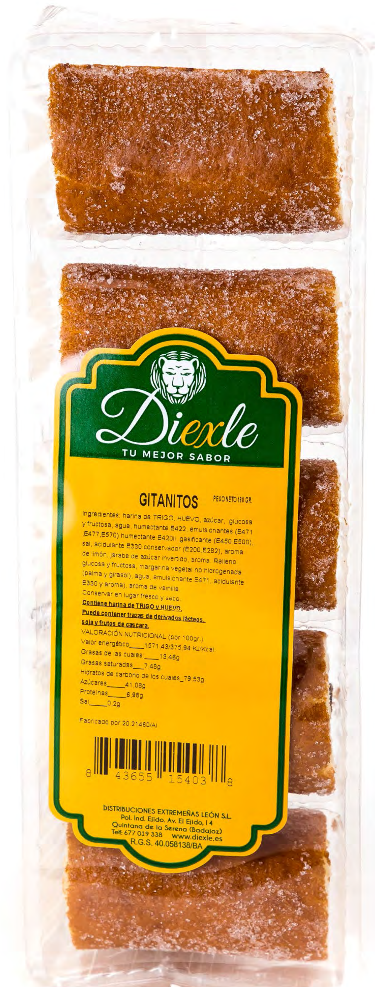
Gitanitos 180g. x 16 uds/caja