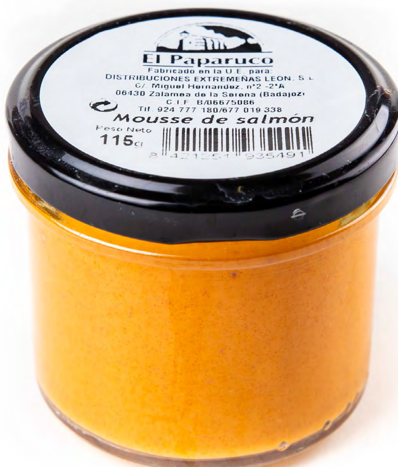
Cod. 048014 - Mousse Salmón - 12 uds/caja