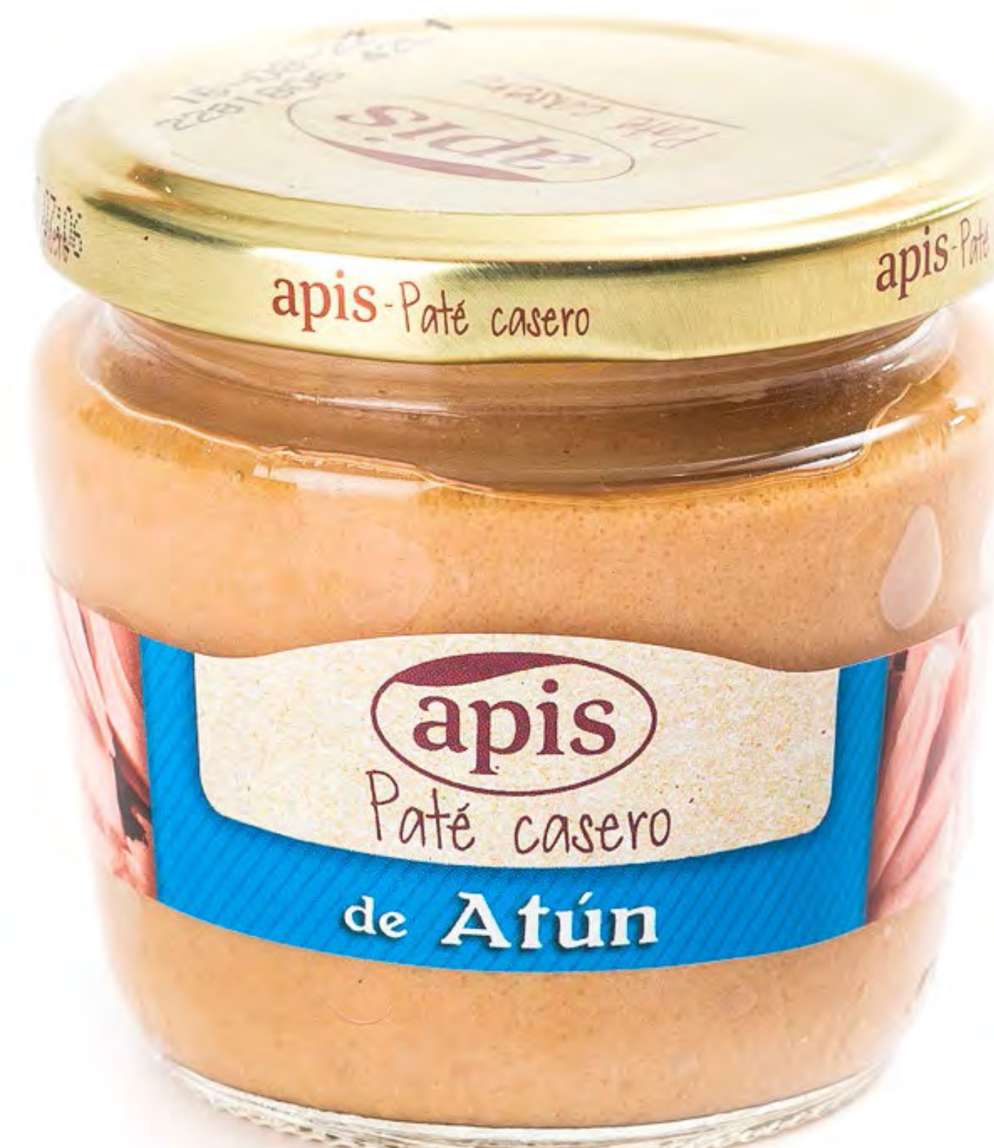
cod.115002 Paté Atún 15 uds/caja