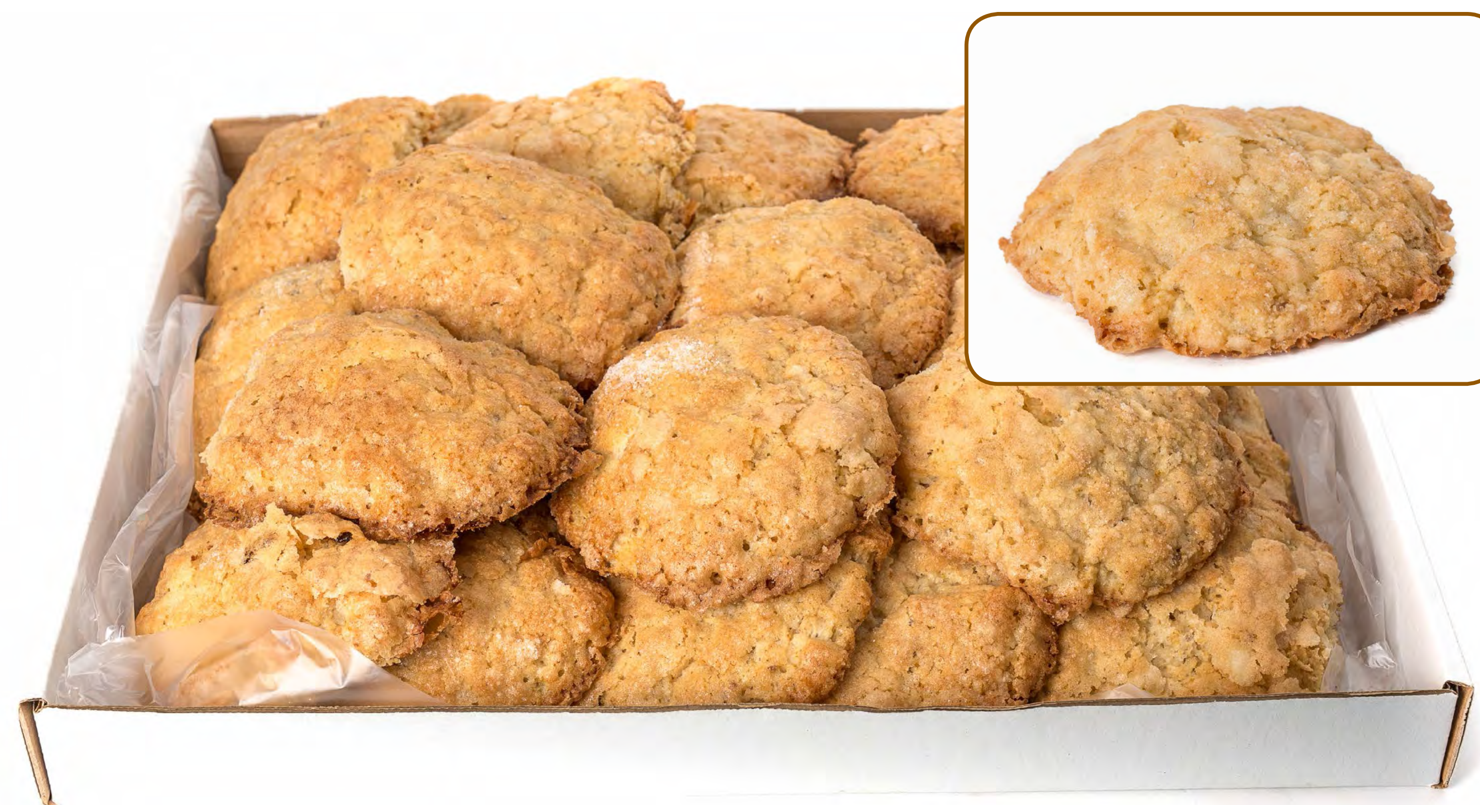
Bollas Aceite 2,5 Kg.