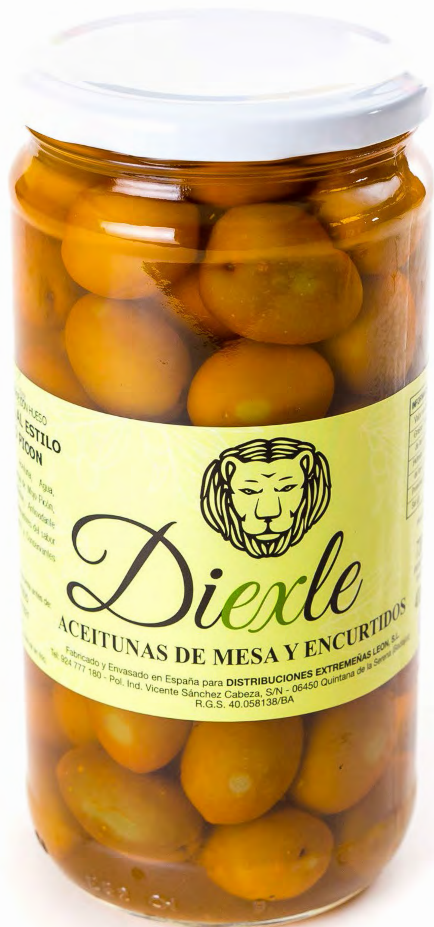
Cod. 185010 Tarro Gordal al Estilo Mojo Picón 8 und/caja