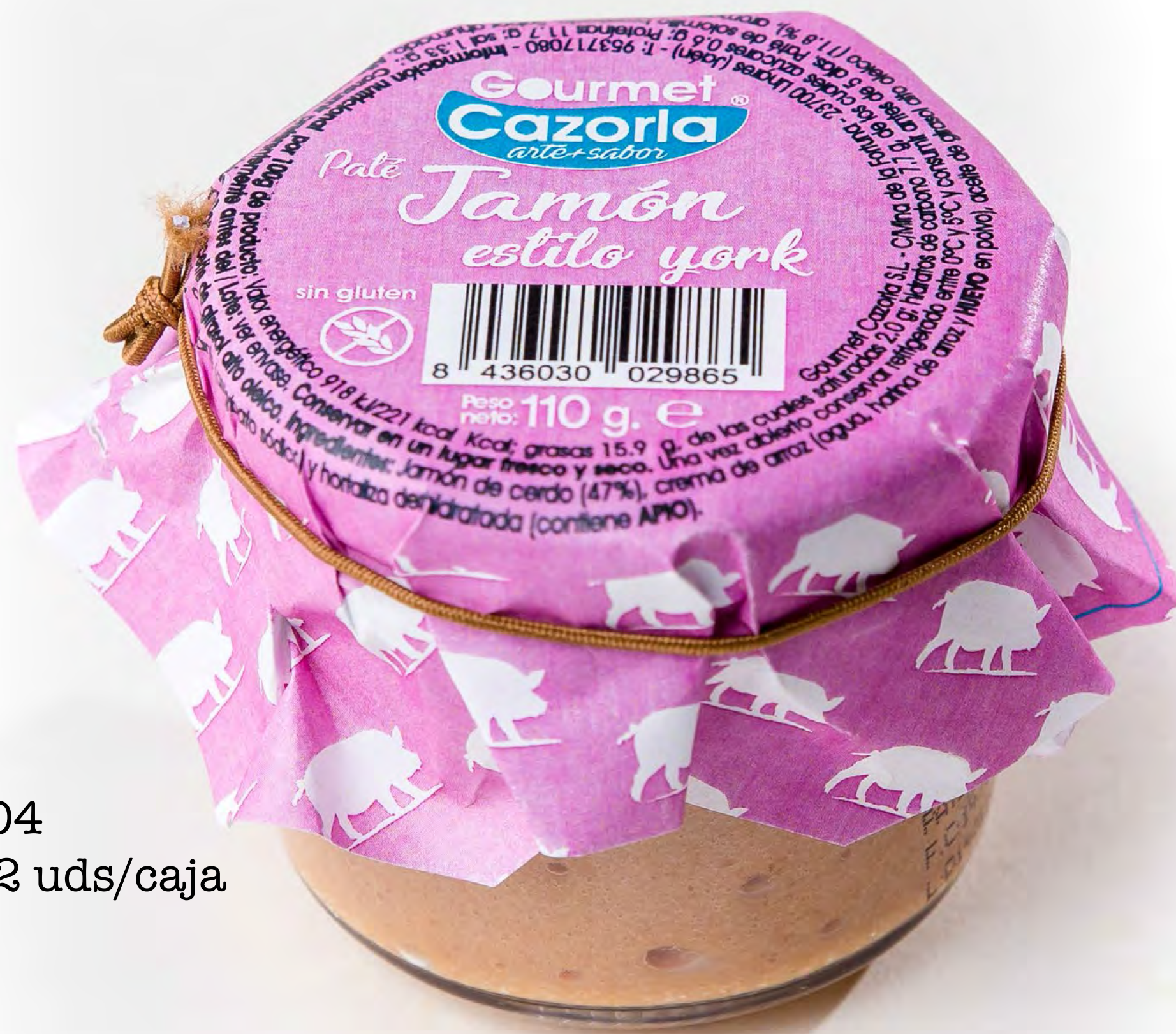
cod.249004 Pate Estilo York 12 uds/caja