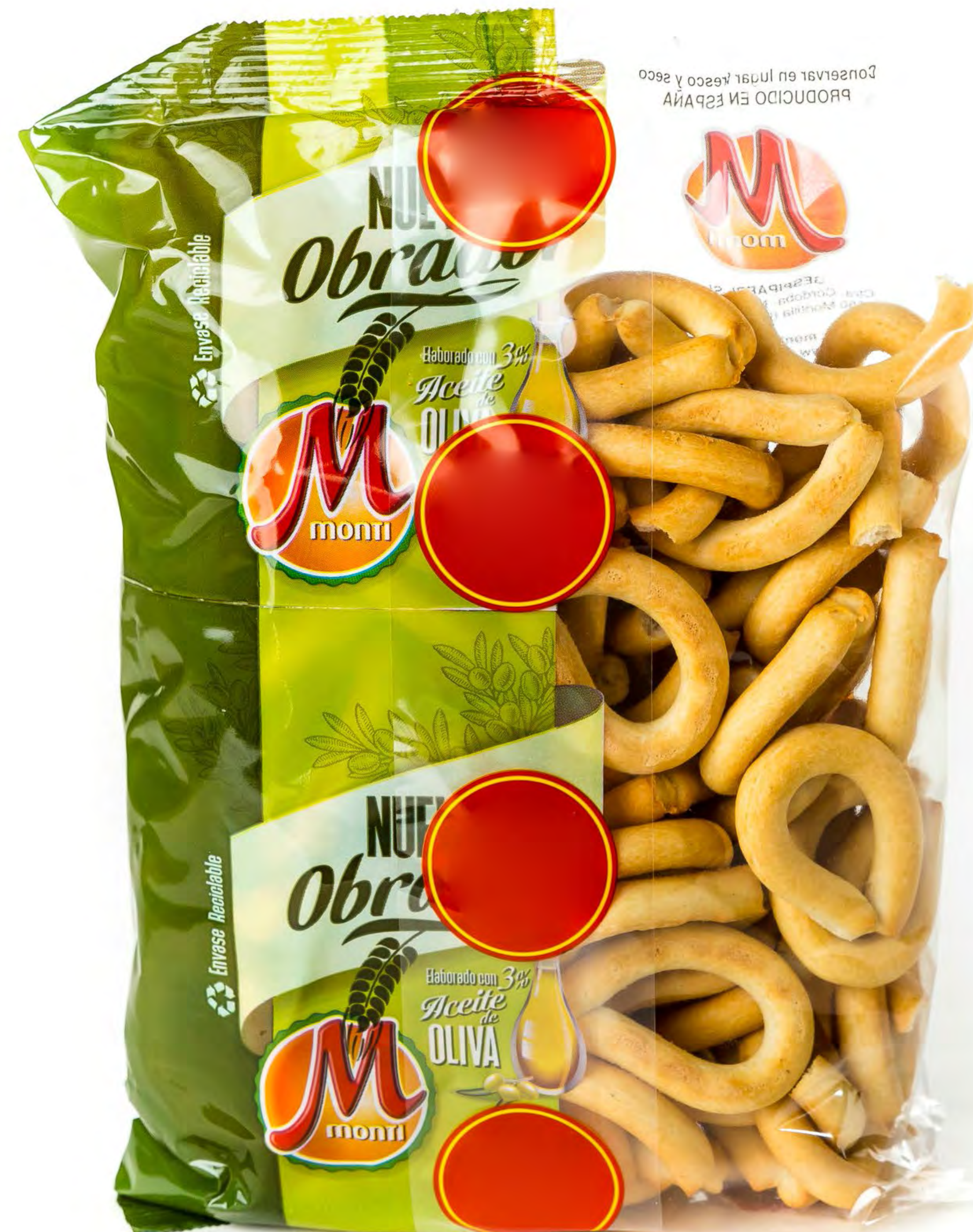
Cod. 164014 Rosquillas de Pan 12 uds/caja