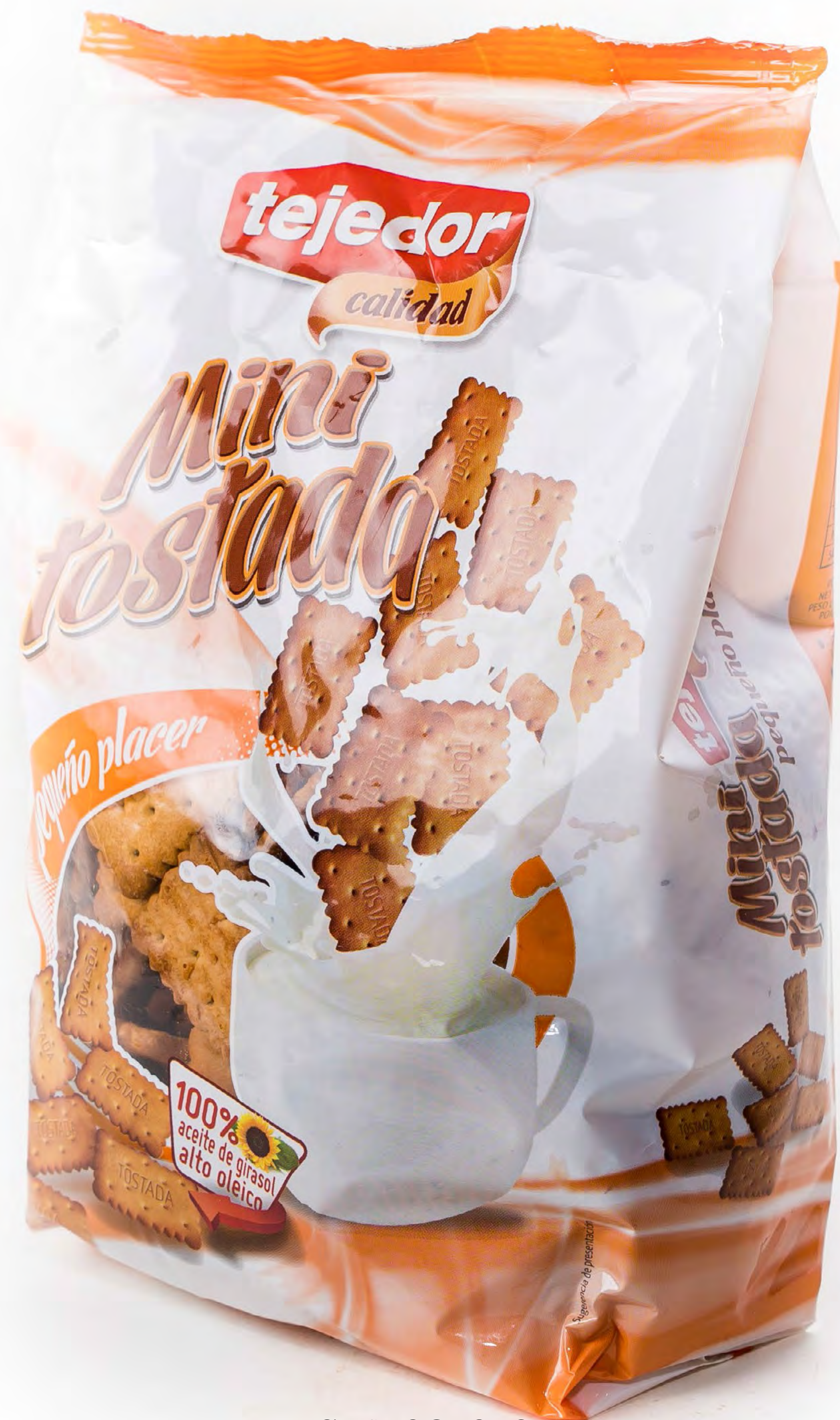
Cod. 021016 Mini Tostadas Tejedor 10 uds/caja