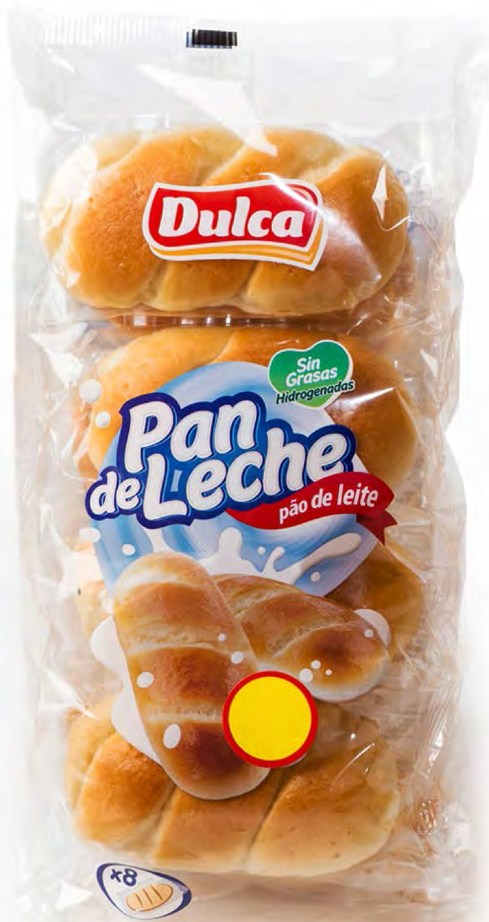
Pan Leche 10 uds/caja