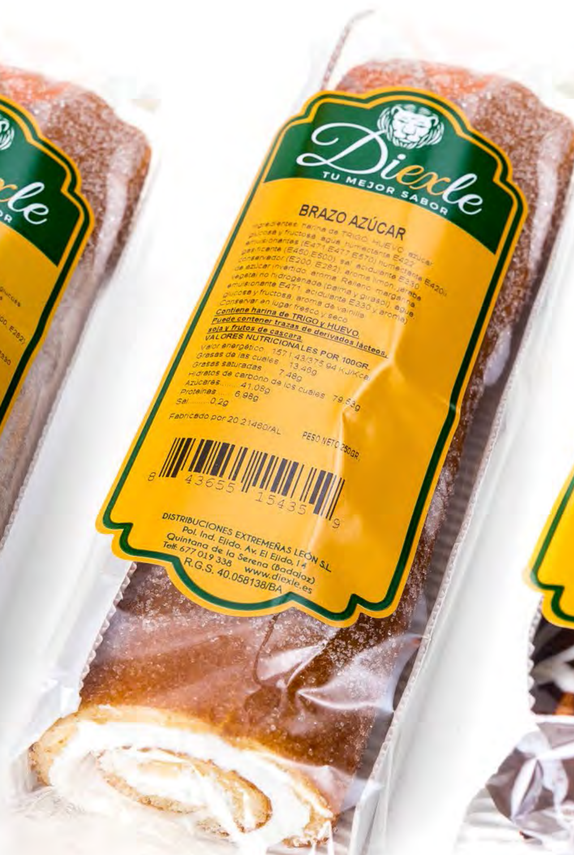
Brazo de Nata 10 uds/caja