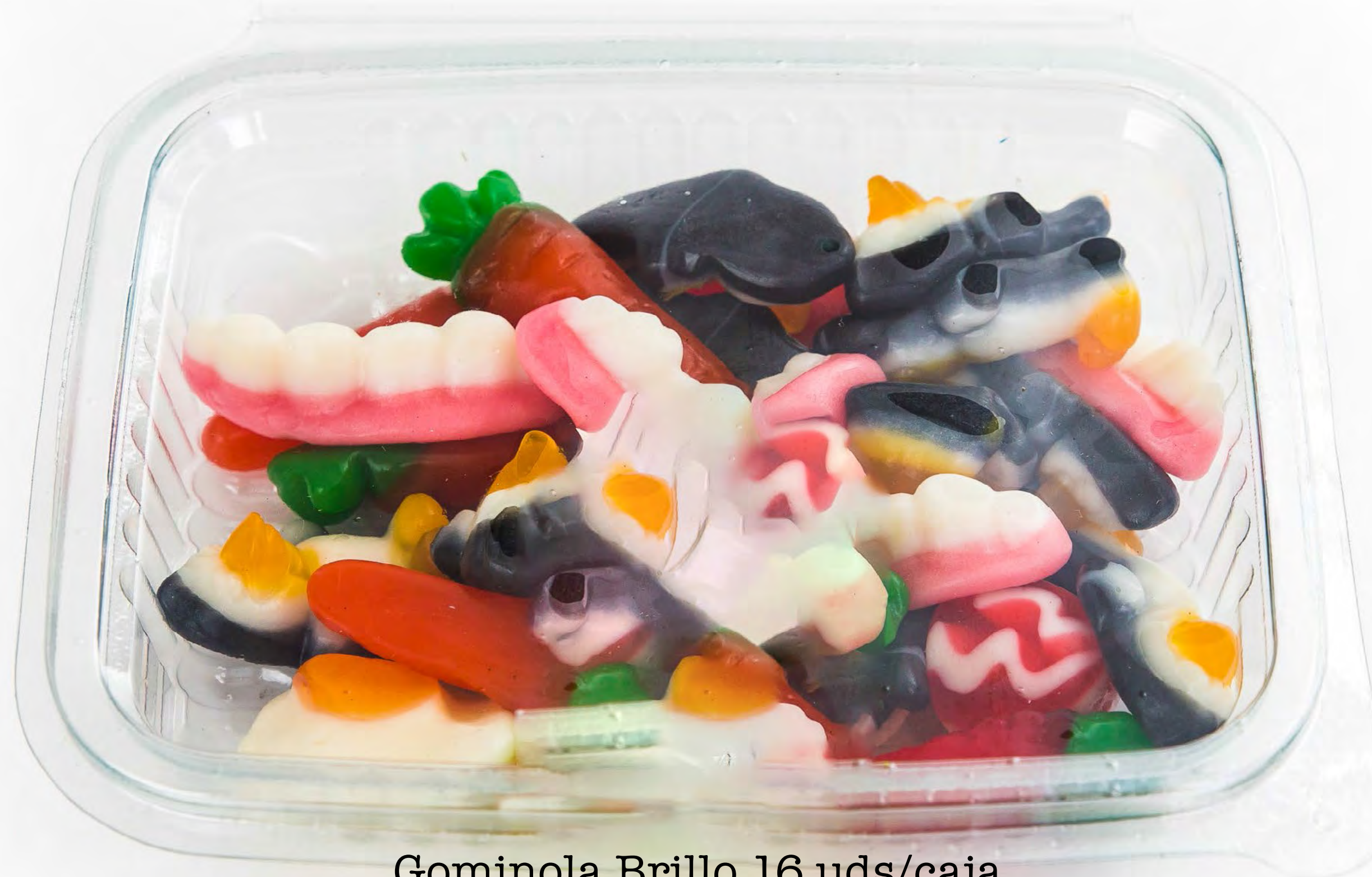
Gominola Brillo 16 uds/caja