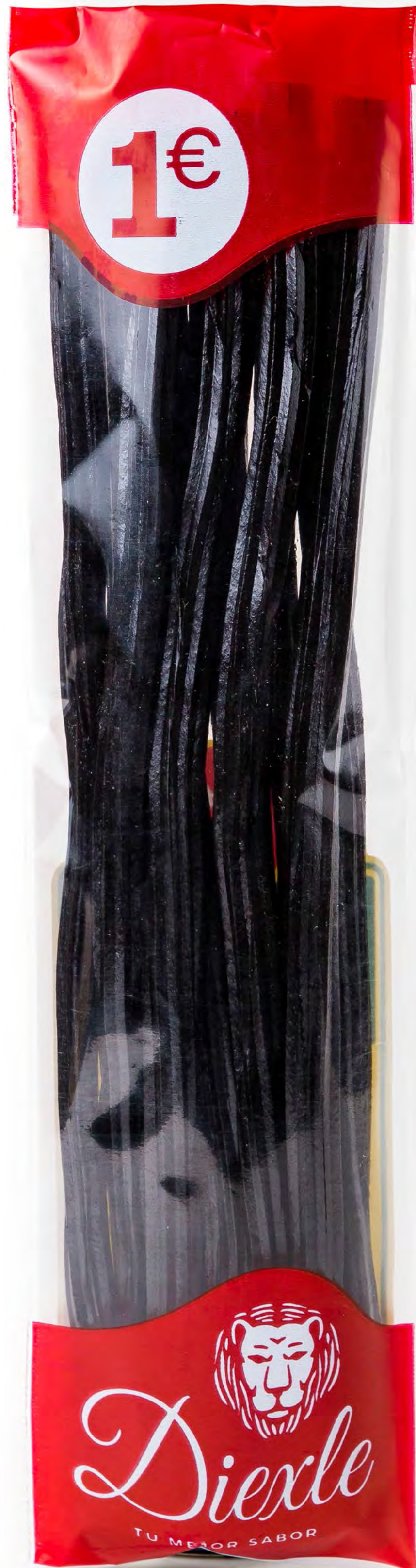
Regaliz Torcido Negro