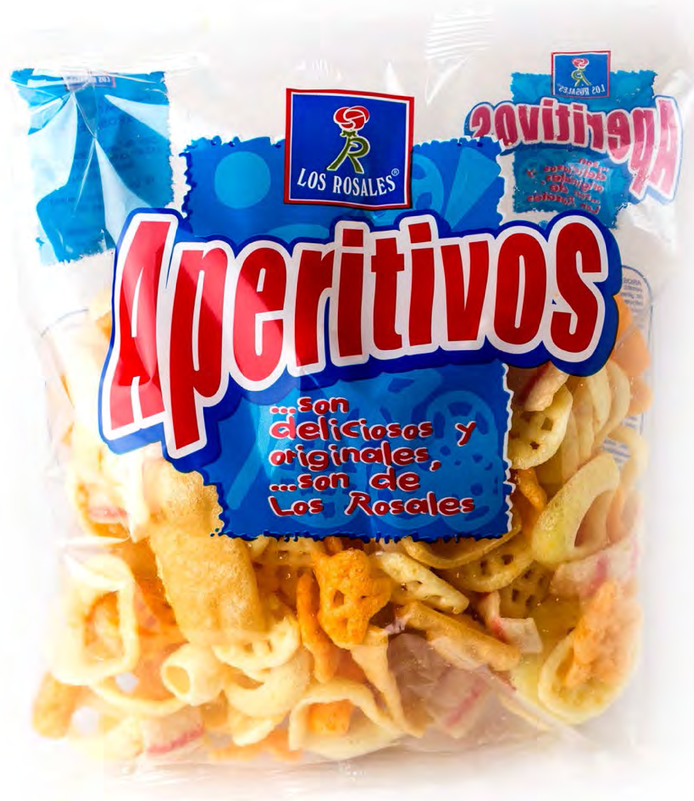
Cod. 002006 - Cocktail Aperitivos - 100g. x 12 uds/caja