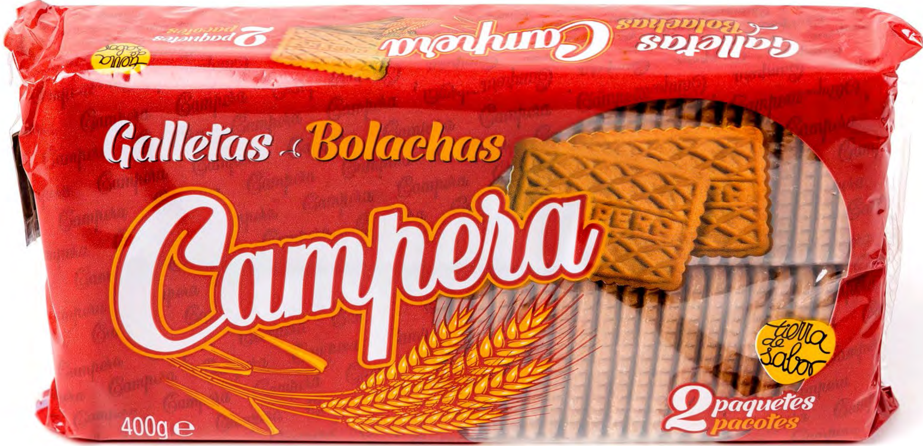
Galletas Camperas 16 uds/caja