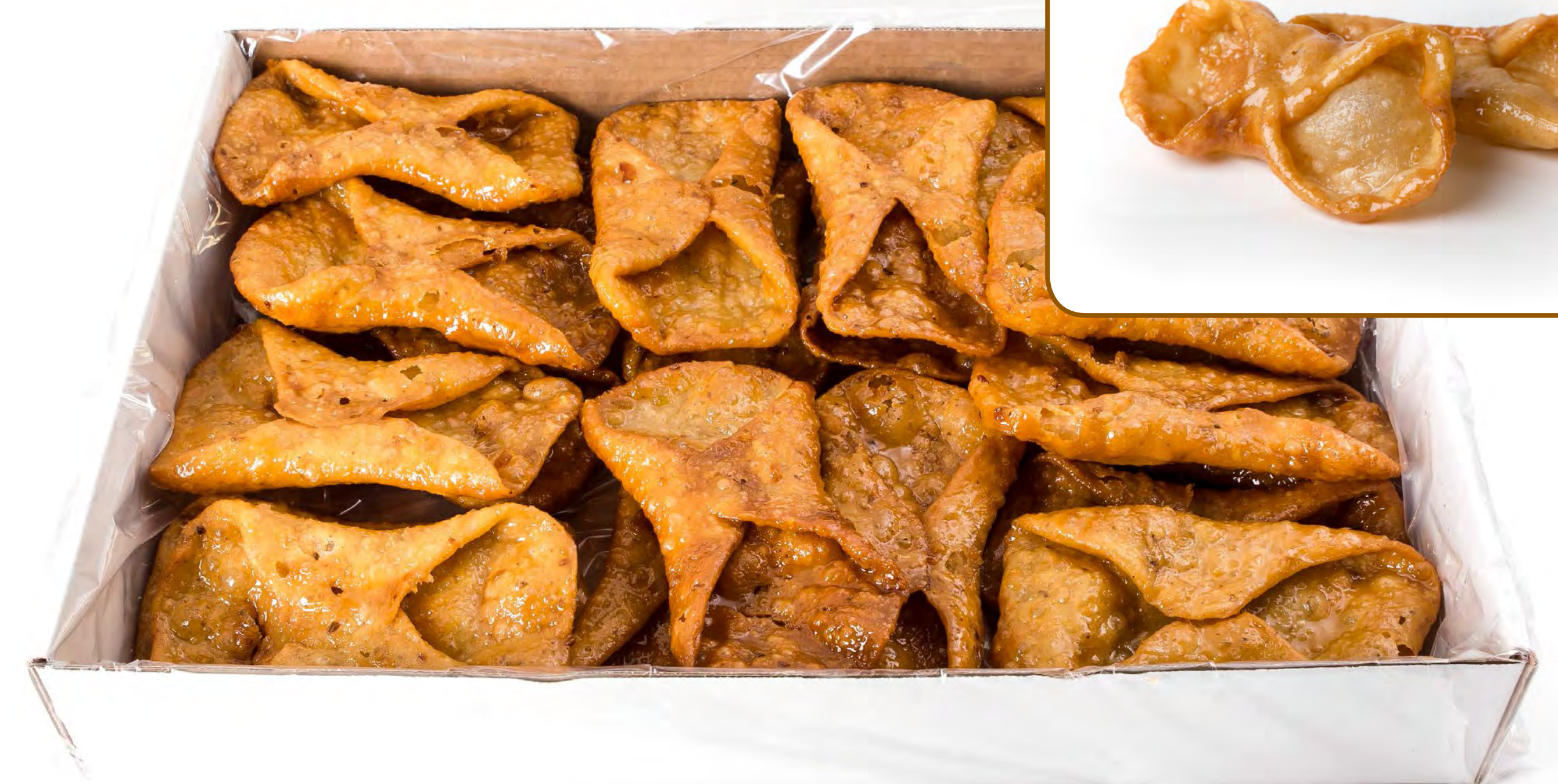
Pestiños Miel 1.5 Kg