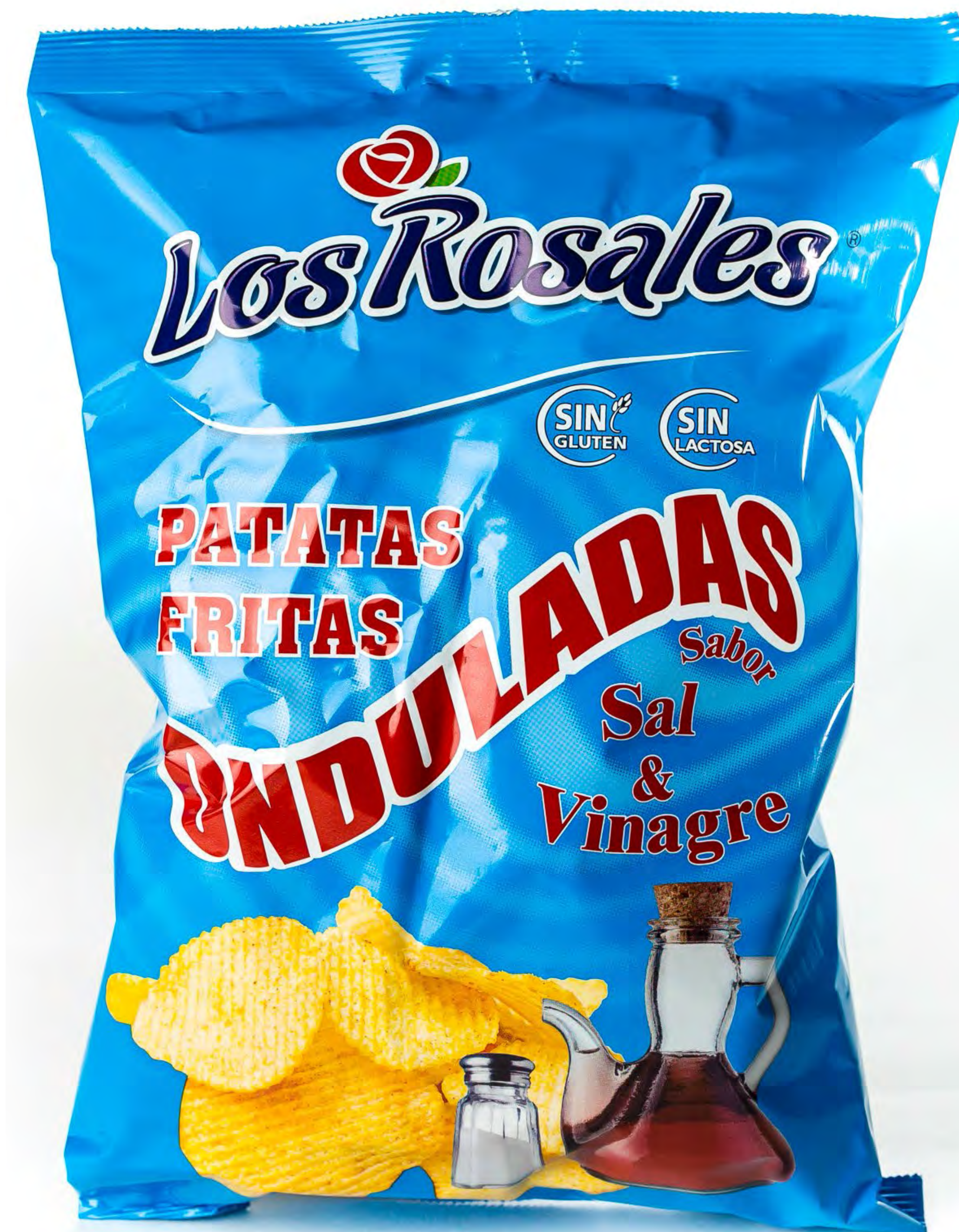
Cod.002012 Patatas Sabor Vinagre 140 g. x 12 uds/caja