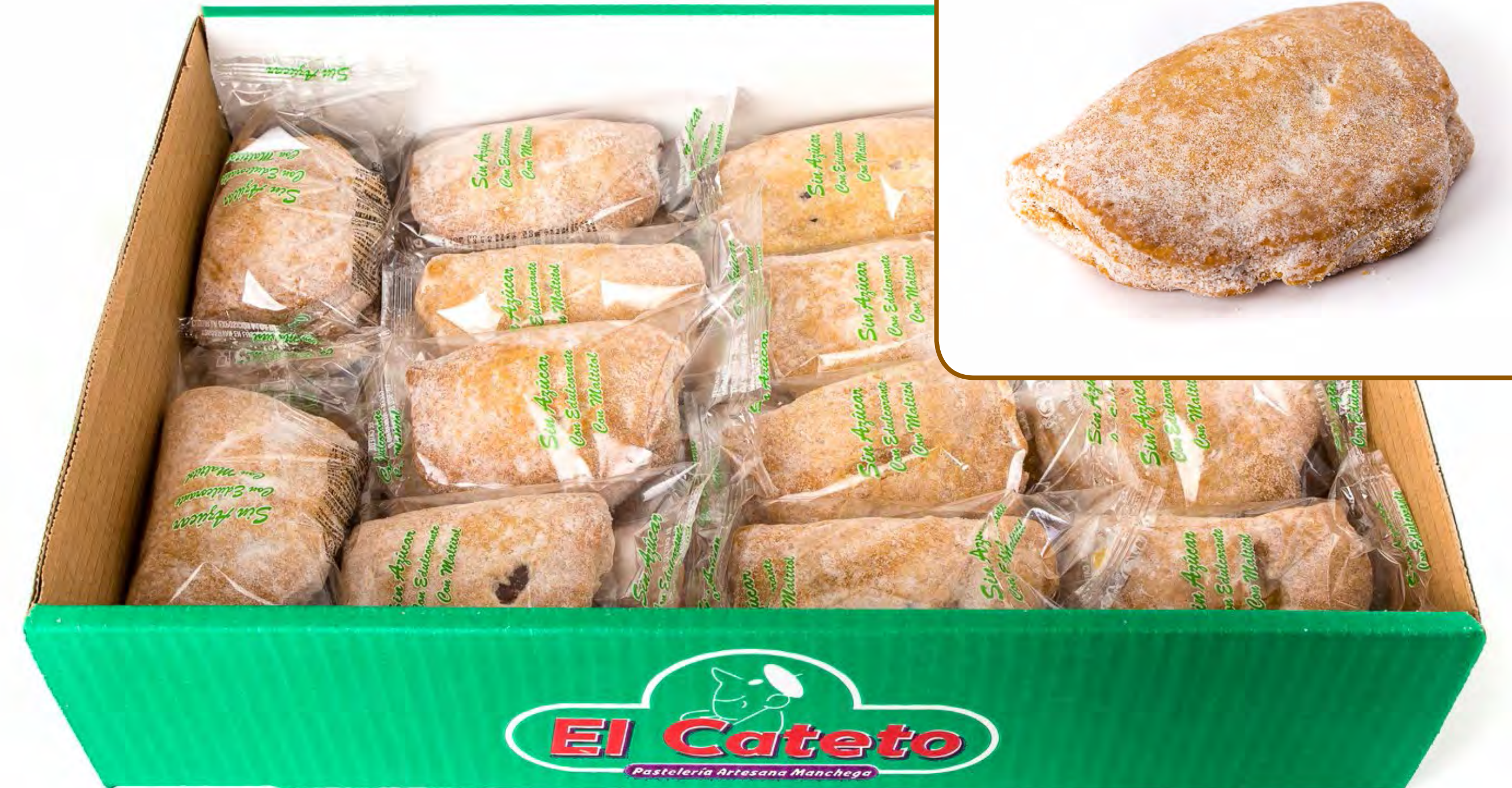
Empanada Manteca S/A 2 Kg.