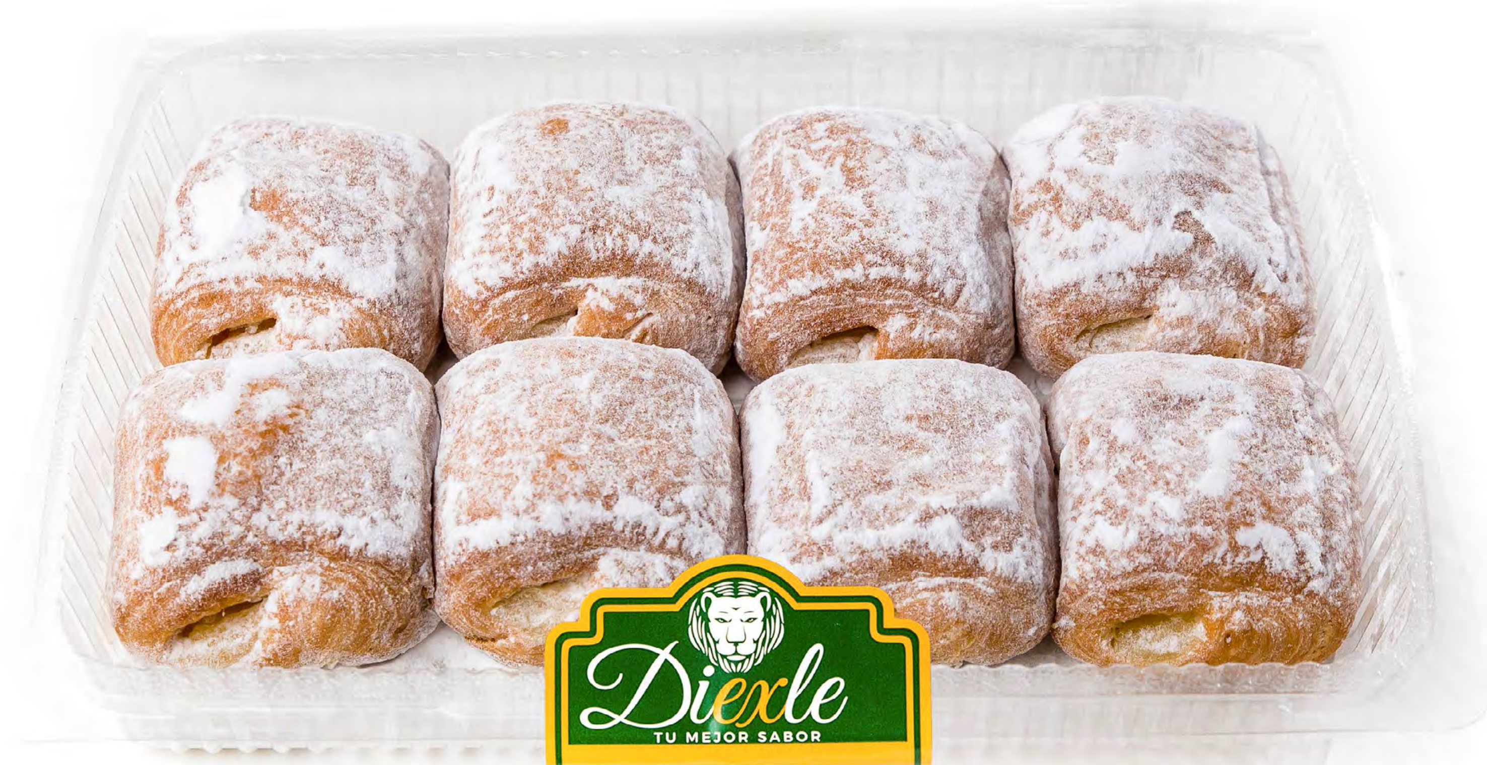
Cod. 216012 Mini Napolitanas Glass 8 uds/caja