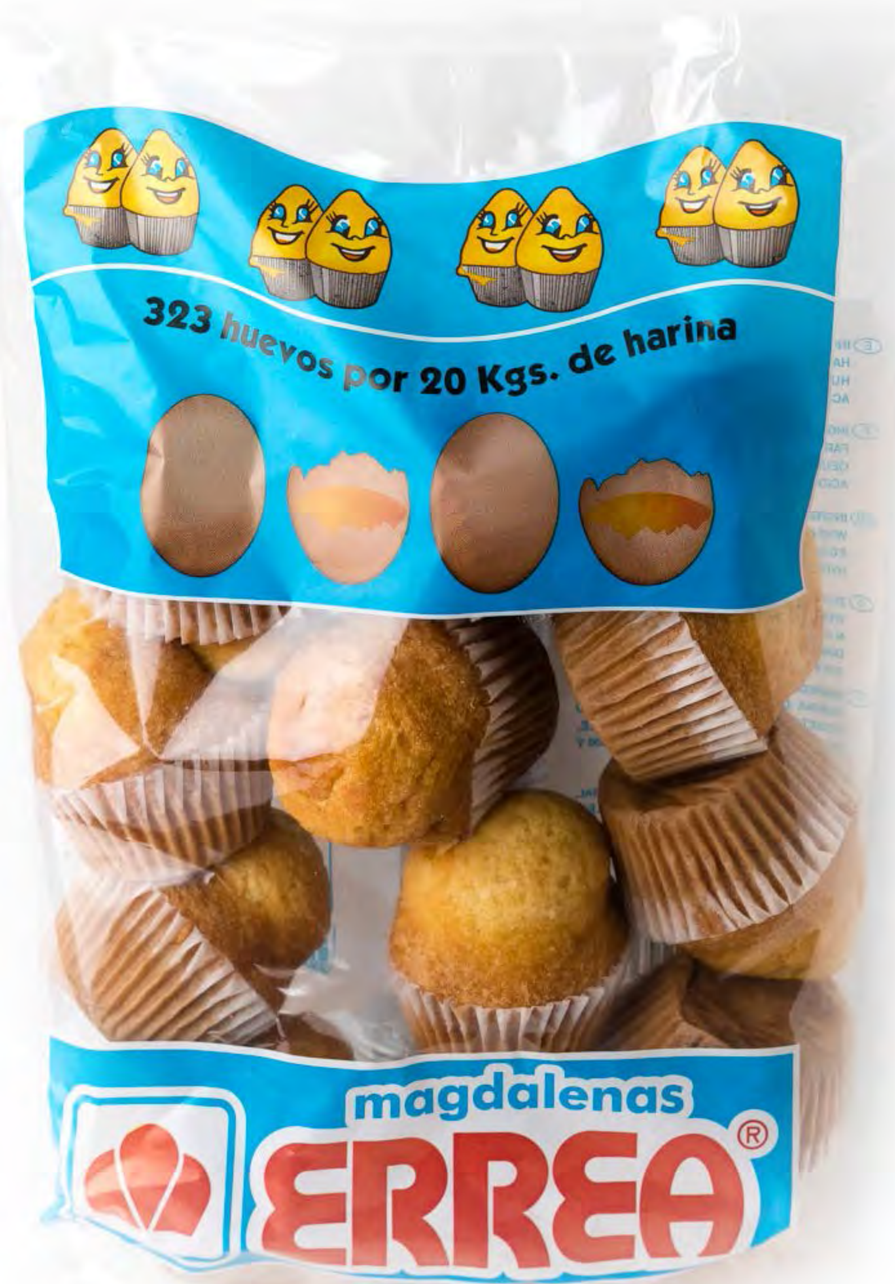
Magdalena Errea 300g. x 14 uds/caja