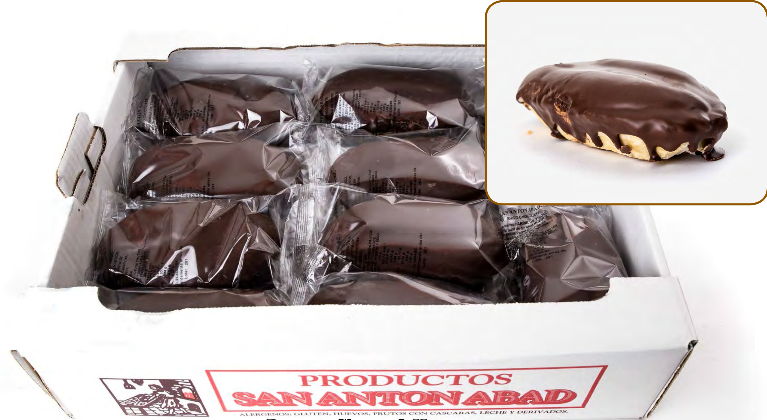
Barcos Choco 2 Kg