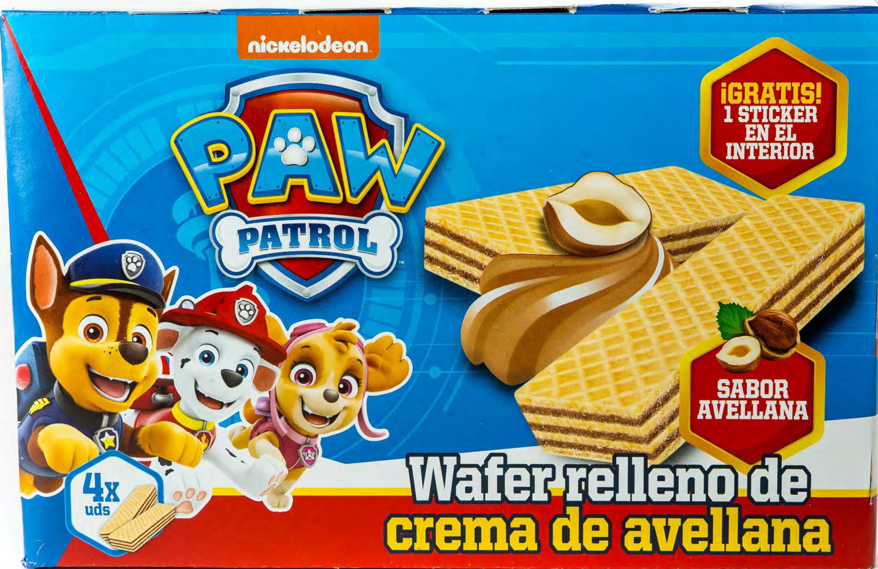
Cod. 095054 Men You Patrulla Canina 15 uds/caja