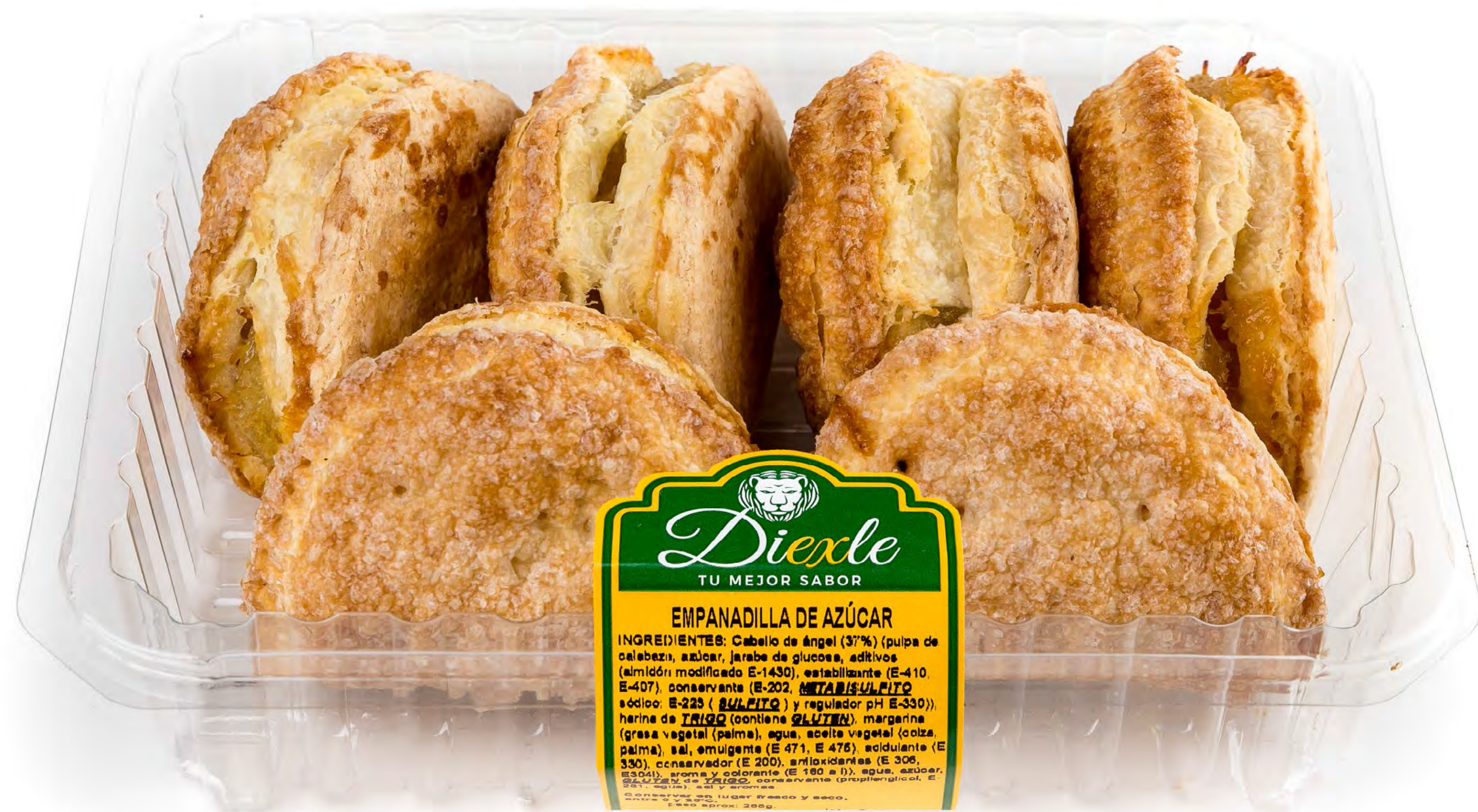
Cod. 126013 - Blister Empanadillas Artesanas 8 uds/caja