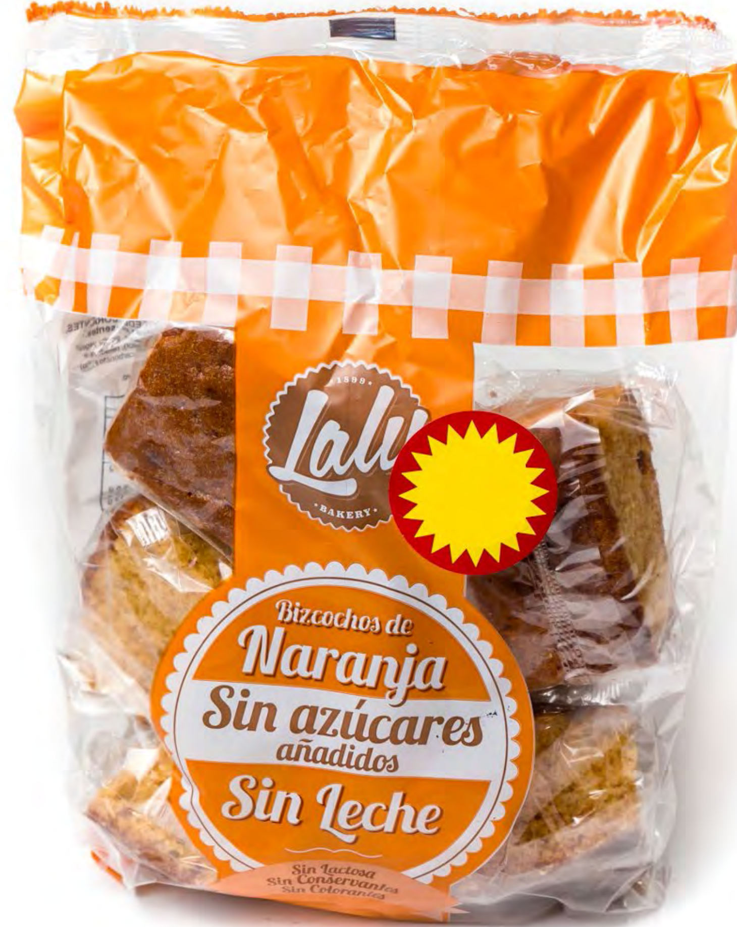
Bolsón Bizcochos Naranja S/A SIN LACTOSA 10 uds/caja