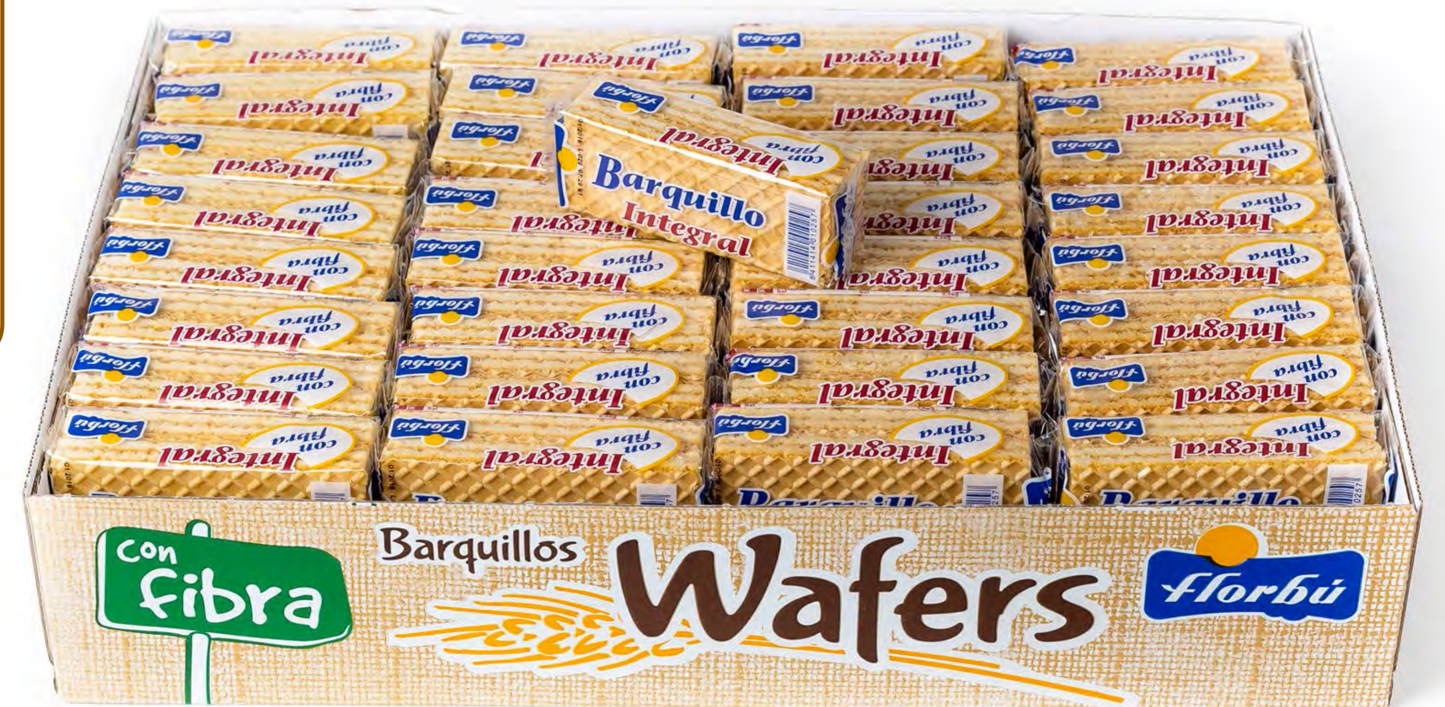
Barquillos S/A 2 Kg.