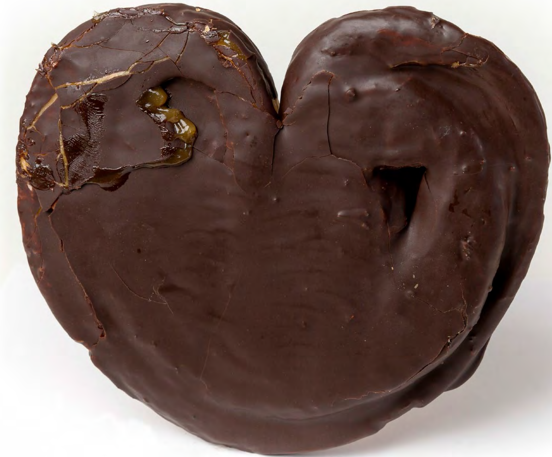
Palmera Rell. Crema 12 uds/caja