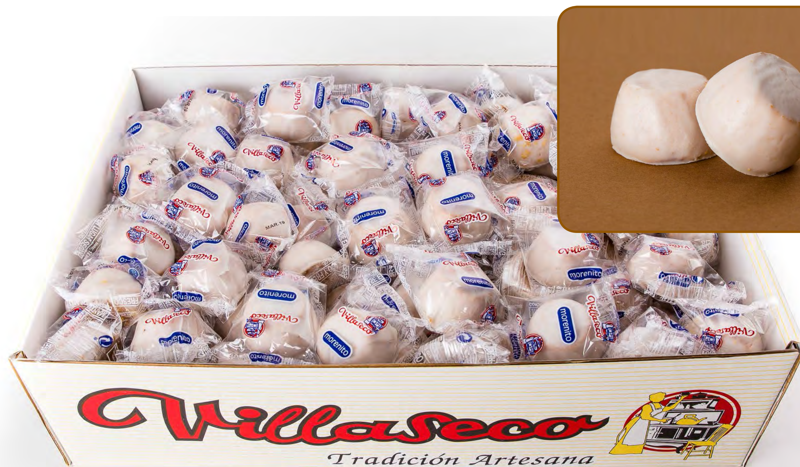
Morenito Blanco 3 Kg