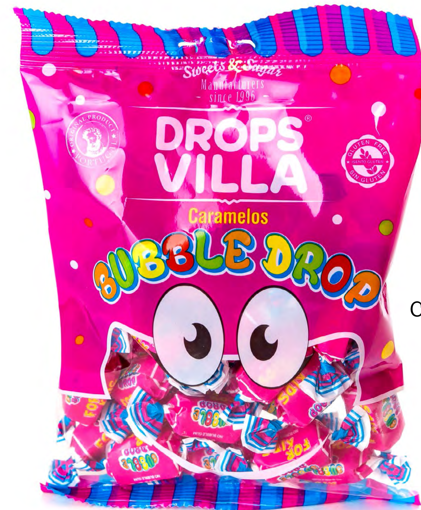
Cod: 110007 Caramelos Bubble Drop 16 und/caja