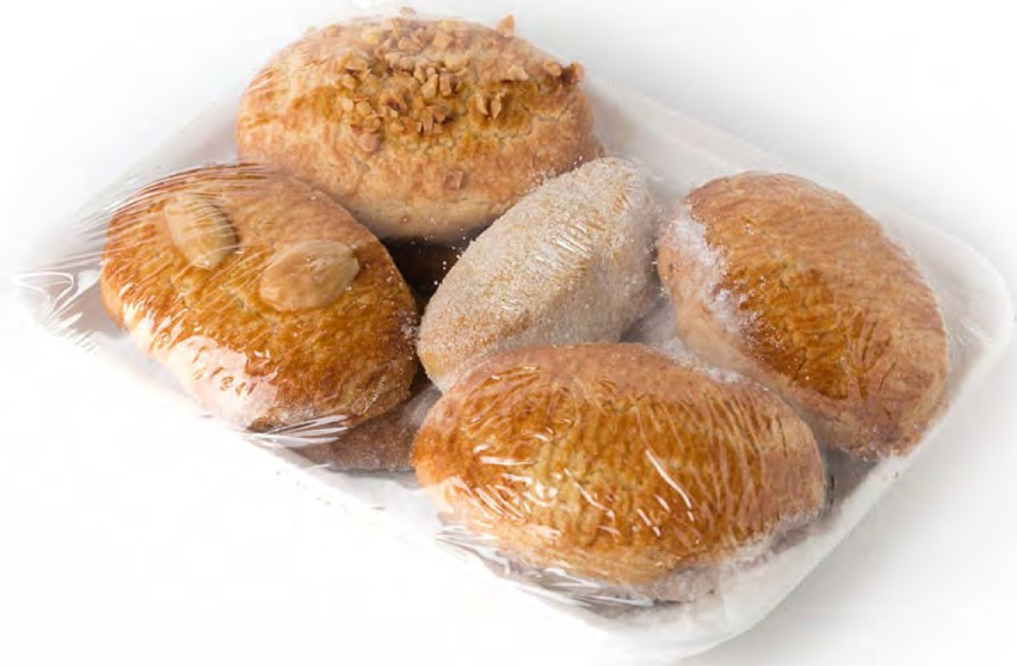
Pastas Caseras 15 uds/caja