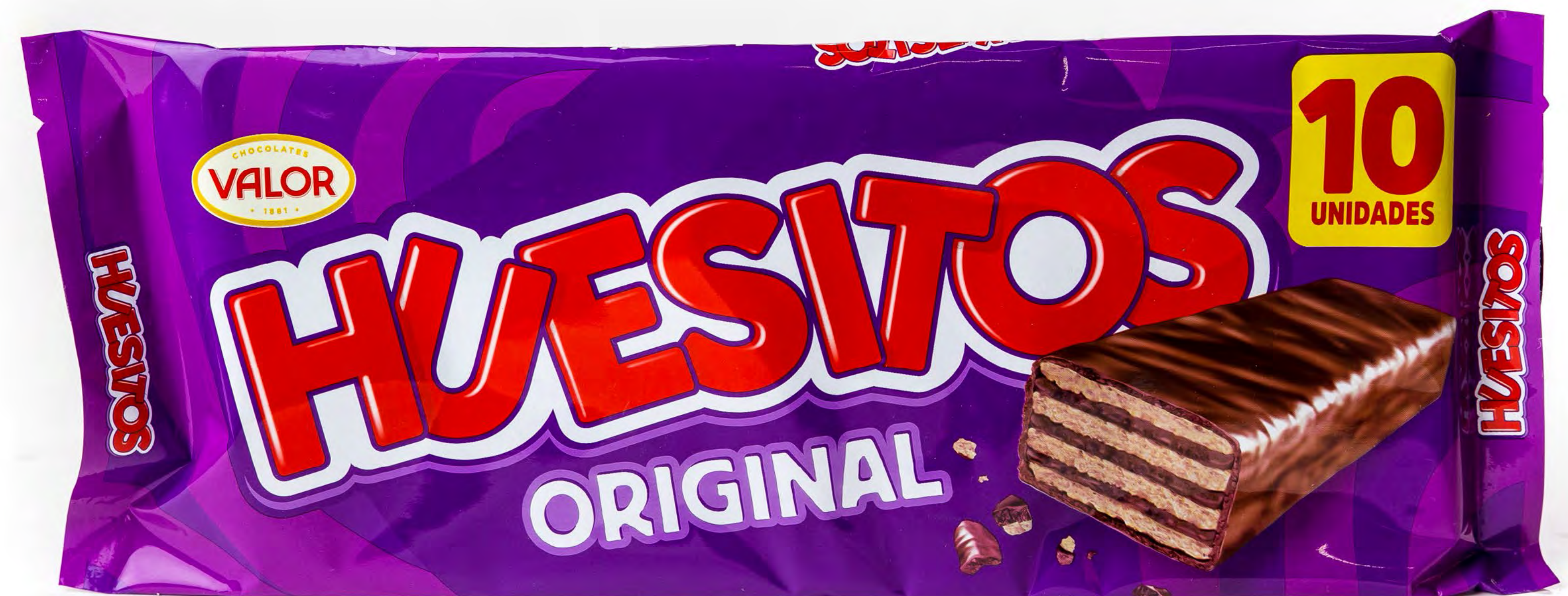
Cod. 243001 HUEDITOS PACK 10 X 20g. 25 uds/caja