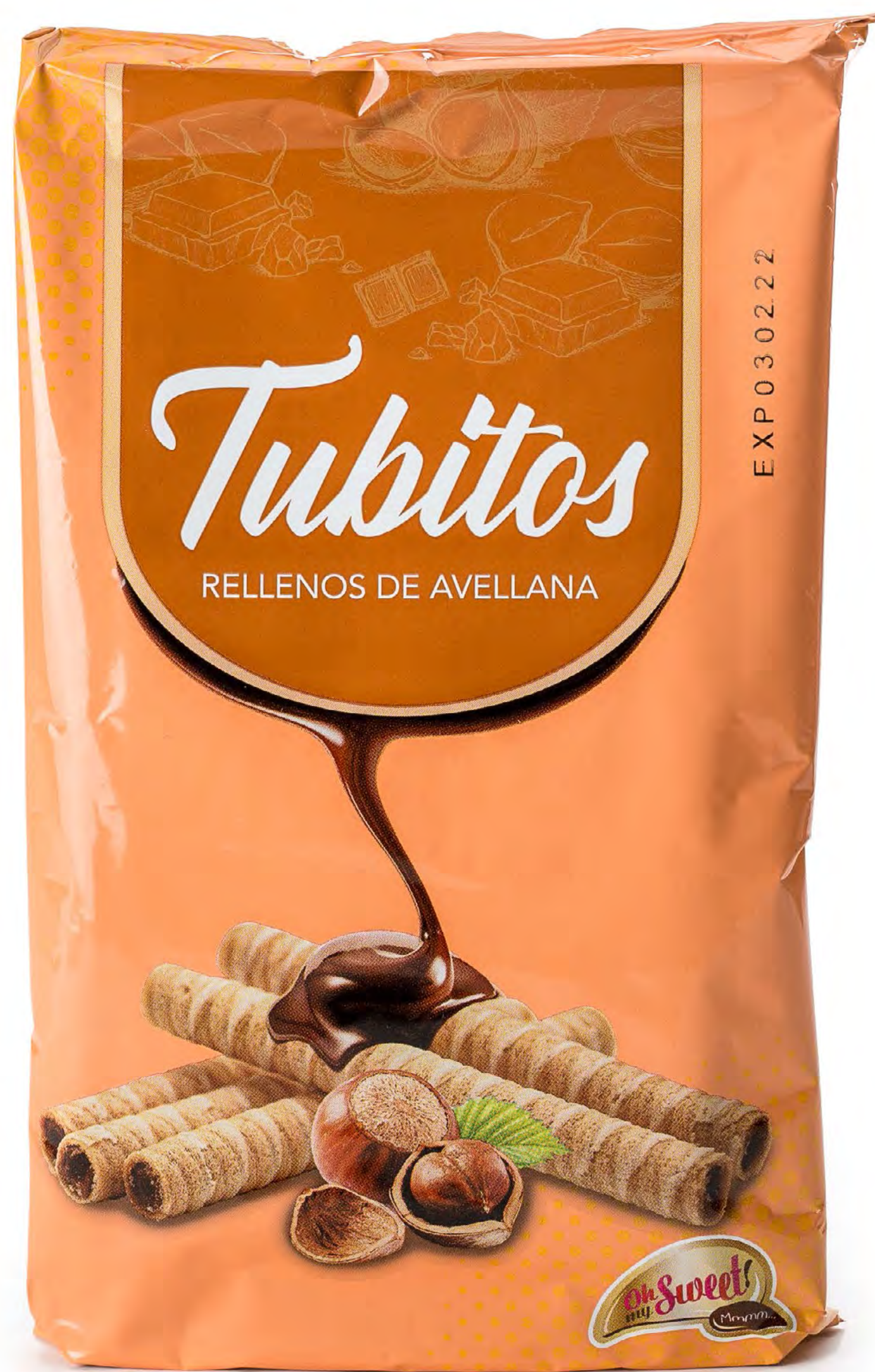
Cod. 059058 Gloski Tubitos Avellana 12 und/caja