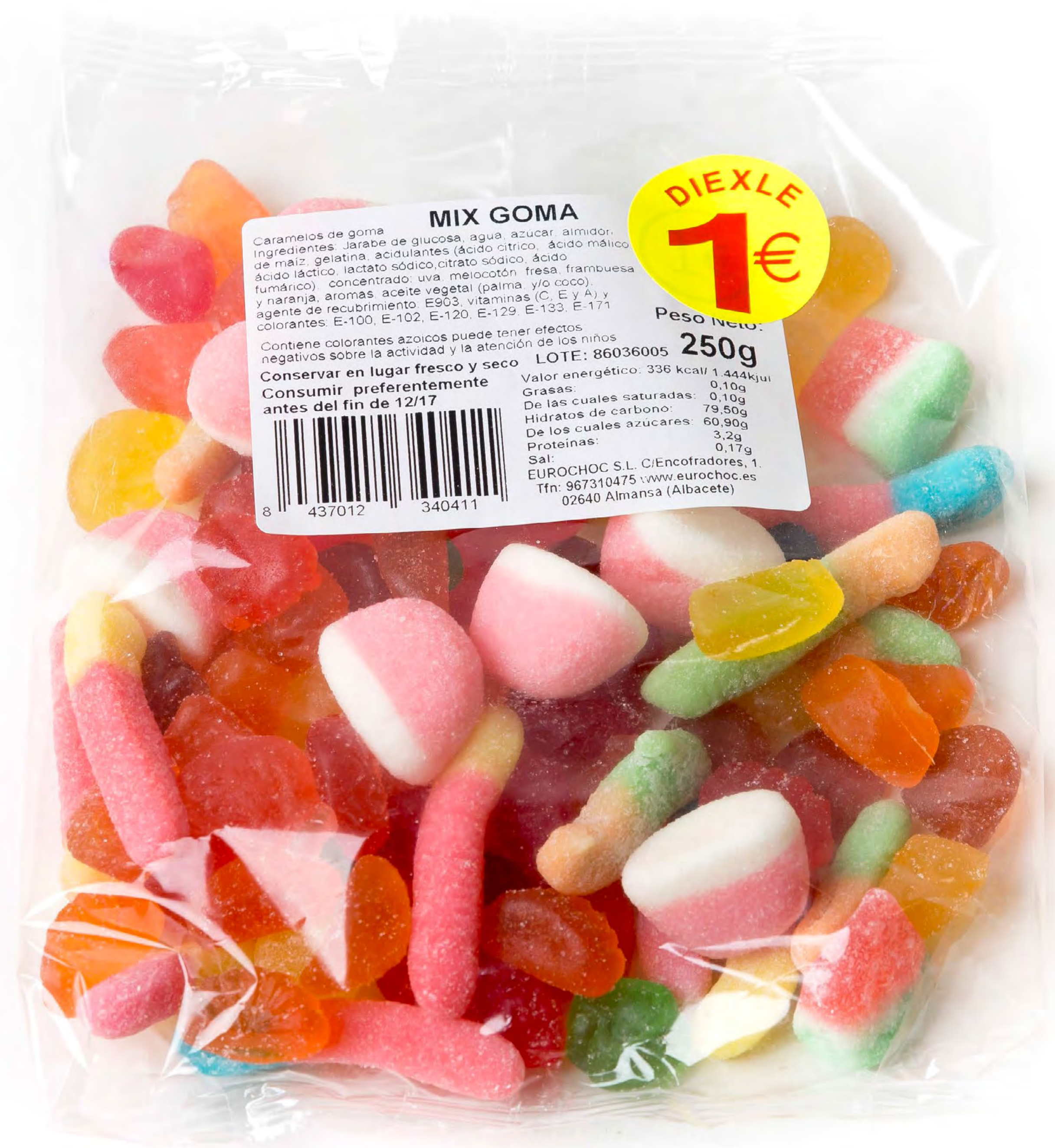
Gominola Surtida 250g 12 uds/caja

MIX GOMA Caramelos de goma Ingredientes: Jarabe de glucosa, agua, azúcar, almidón, de maíz, gelatina, acidulantes (ácido cítrico, ácido málico, ácido láctico, lactato sódico, citrato sódico, ácido fumárico), concentrado de uva melocotón, fresa, frambuesa y naranja, aromas, aceite vegetal (palma y/o coco), agente de recubrimiento E903, vitaminas (C, E y A) y colorantes: E-100, E-102, E-120, E-129, E-133, E-171 Contiene colorantes azoicos puede tener efectos negativos sobre la actividad y la atención de los niños Conservar en lugar fresco y seco Consumir preferentemente antes del fin de 12/17 Valor energético: 336 kcal/ 1.444kJ Grasas: 0,10g De las cuales saturadas: 0,10g Hidratos de carbono: 79,50g De los cuales azúcares: 60,90g Proteínas: 3,2g Sal: 0,17g EUROCHOC S.L. C/Encofrades, 1. Tfn: 967310475 www.eurochoc.es 02640 Almansa (Albacete) 8 437012 340411