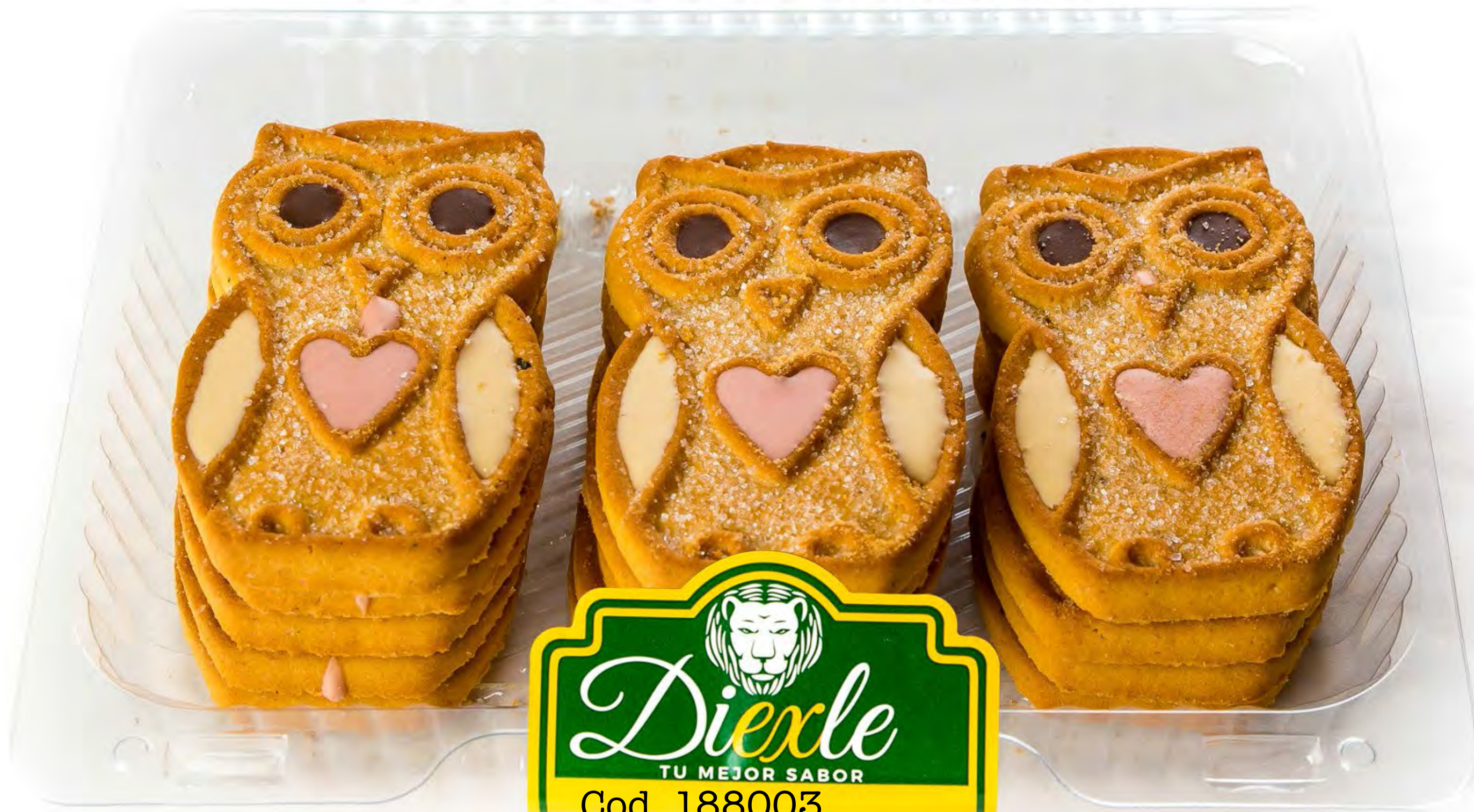
Duticos galletas búho 6und/caja