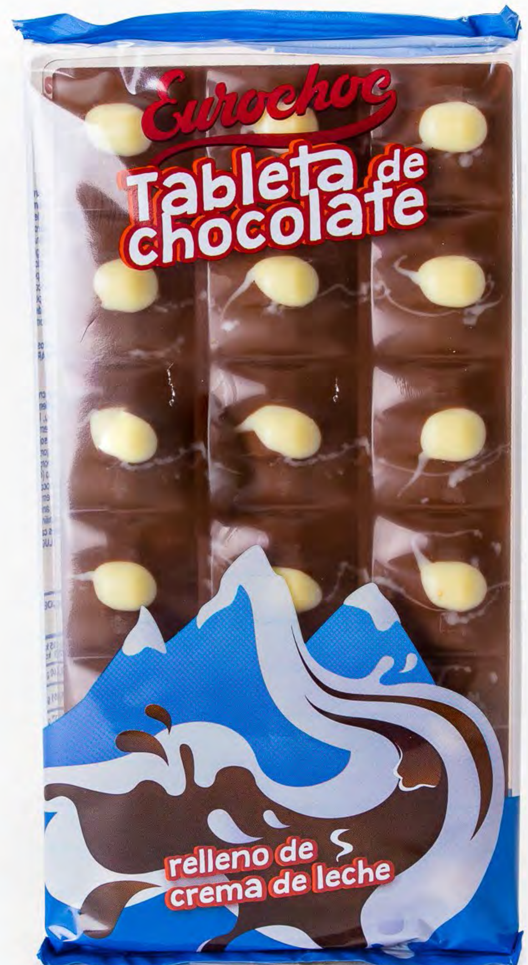
Chocolate Relleno Crema 15 uds/caja