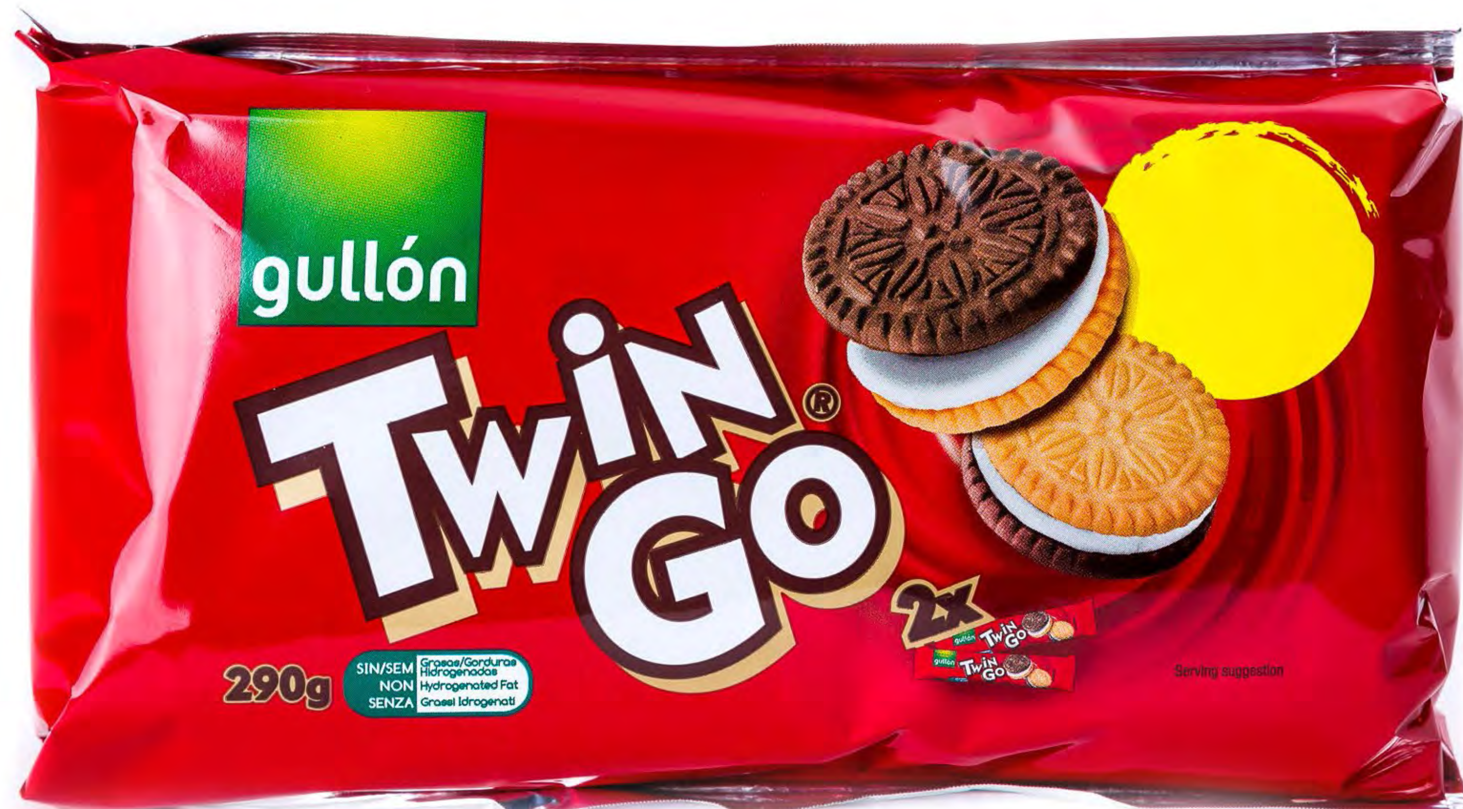
Galletas Twin go 12 uds/caja