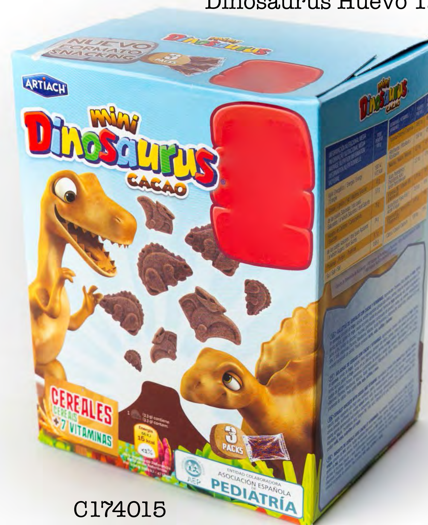
C174015 Dinosaurio Choco 12 uds/caja