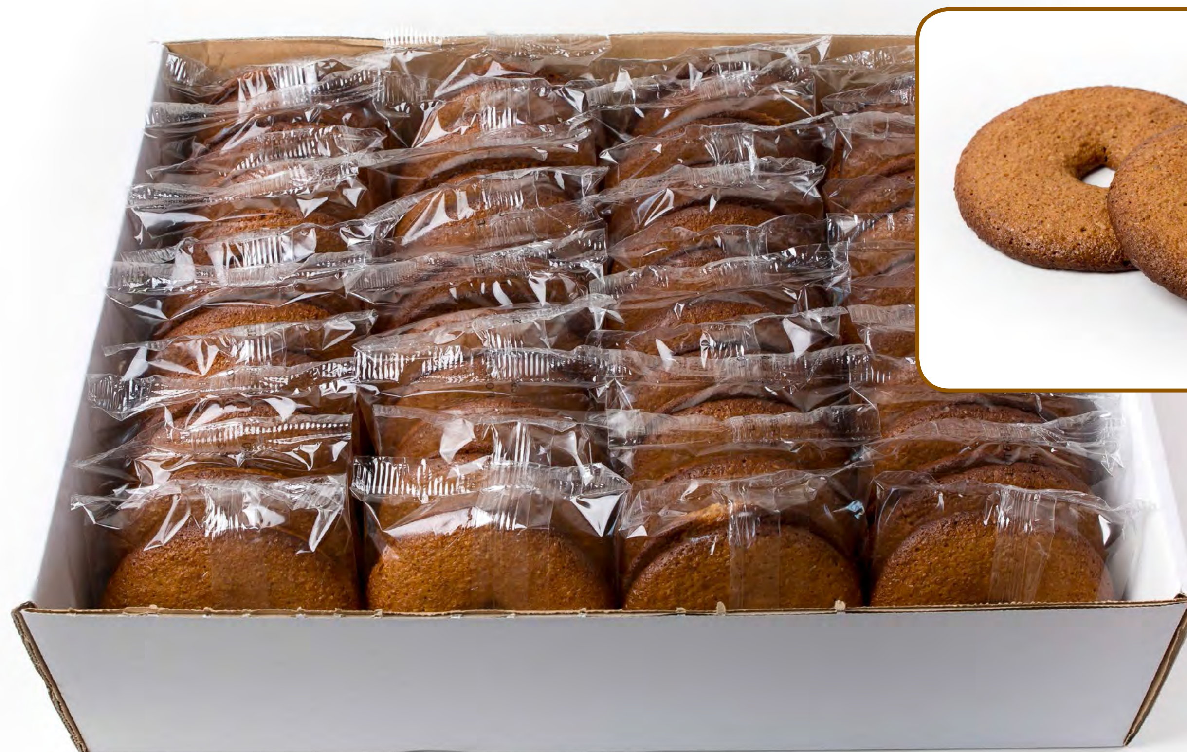
Rosquillas Integrales Huevo (con sacarosa) 2 Kg.