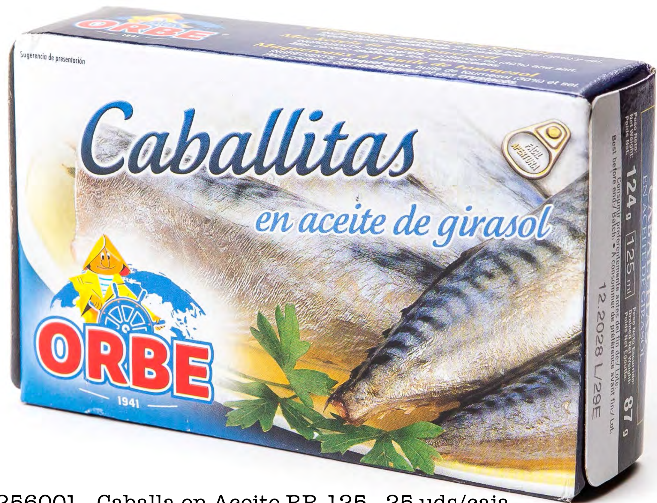
Cod. 256001 - Caballa en Aceite RR-125 - 25 uds/caja