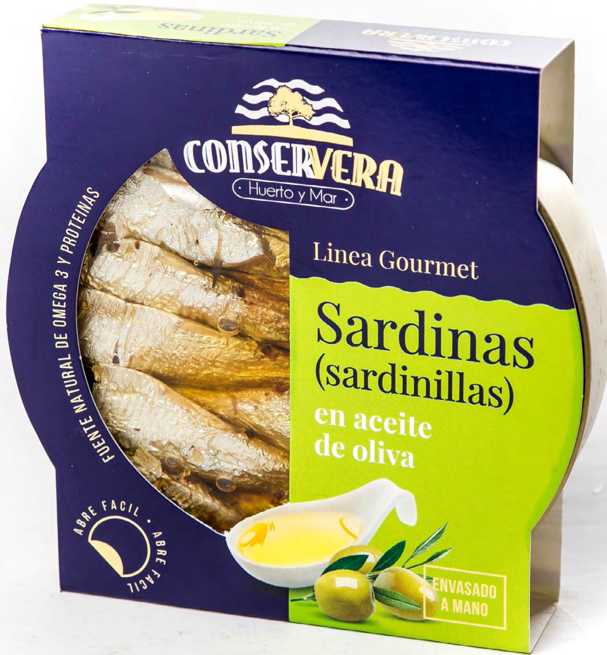
Sardinas en Aceite de Oliva