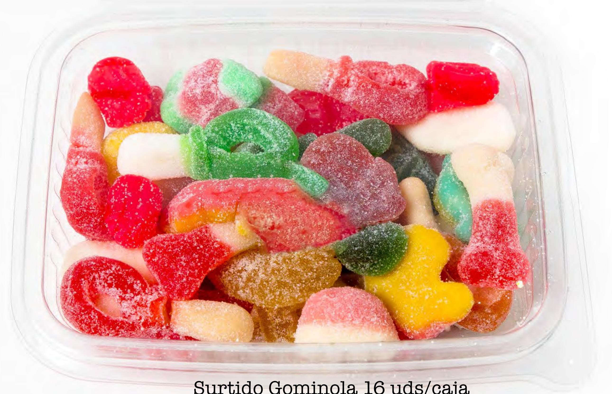
Surtido Gominola 16 uds/caja