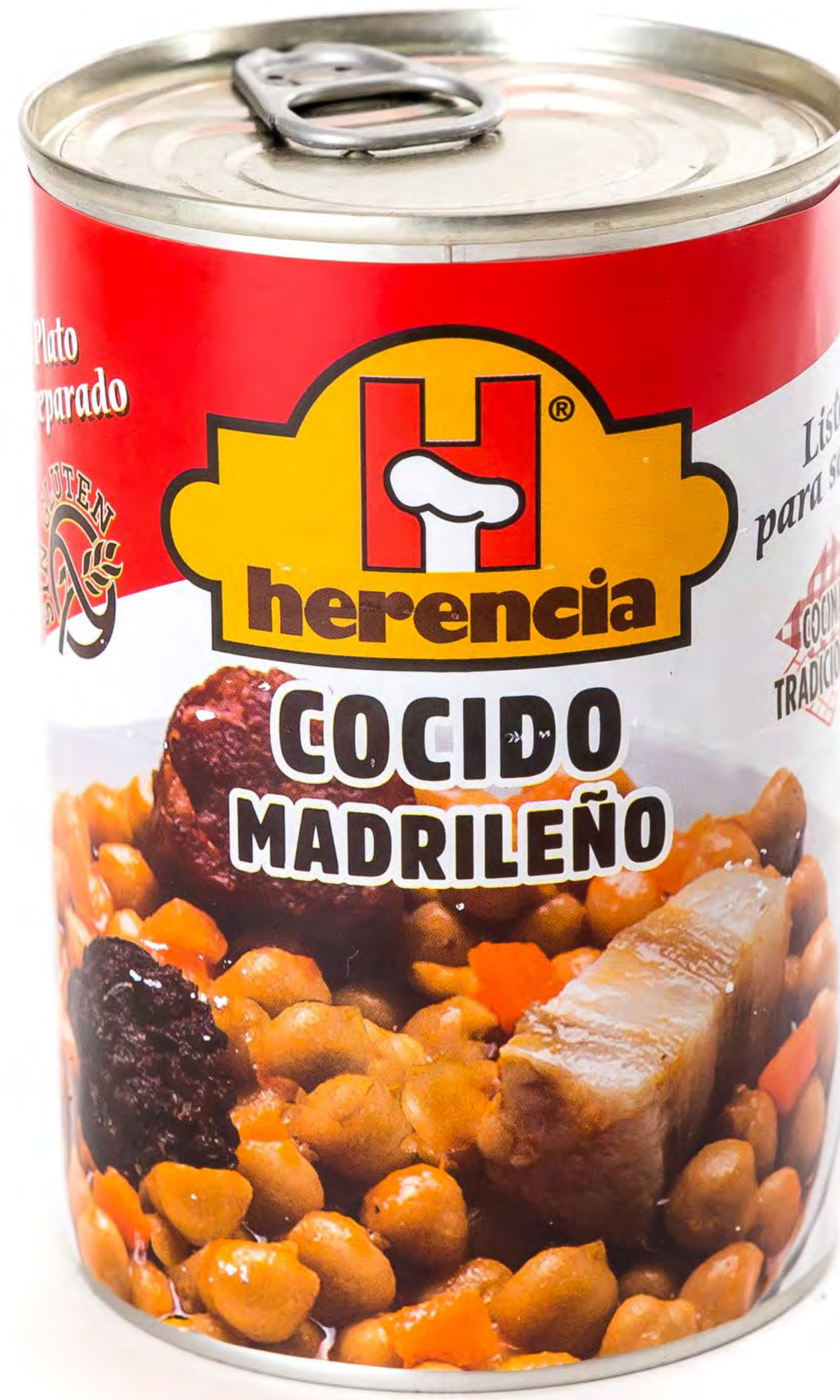
Cod. 225015 Cocido Madrileño Herencia 12 uds/caja