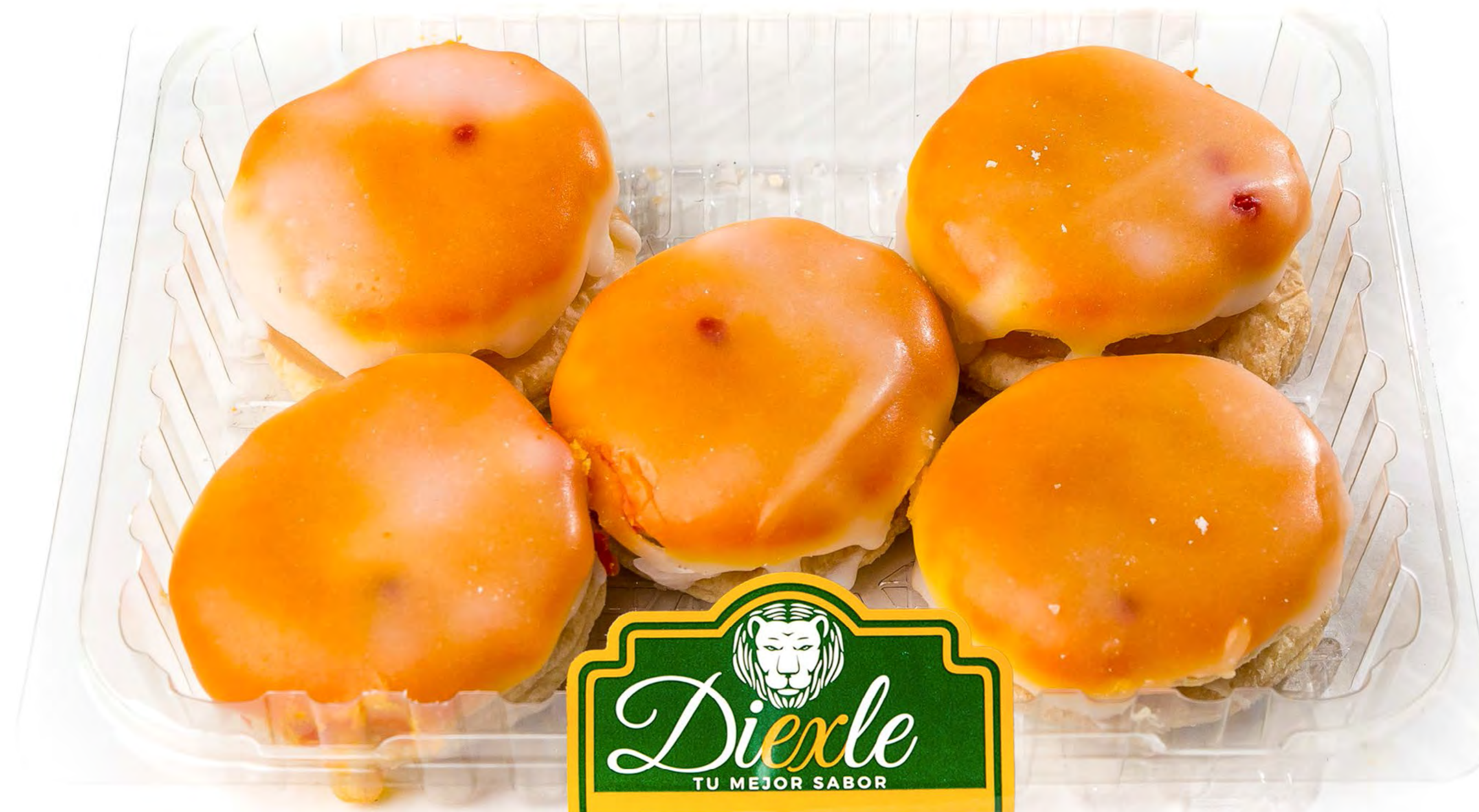
Cod. 253001 Blister Loquitas 12 uds/caja