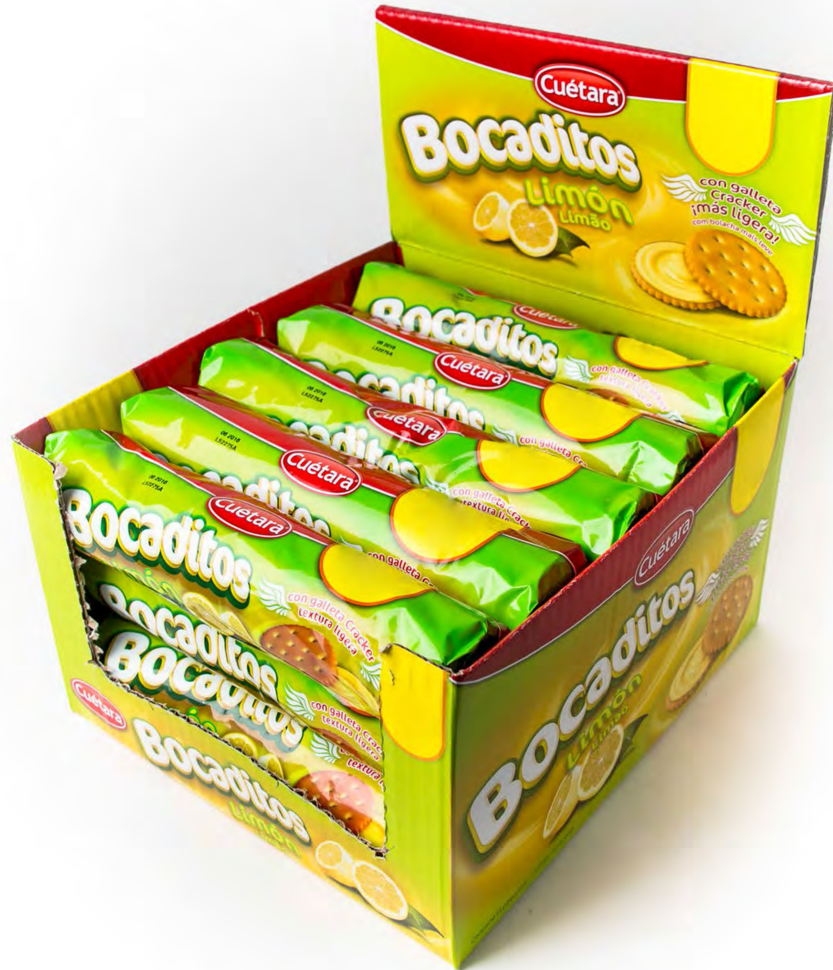
Bocaditos Cuétara Limón 15 uds/caja