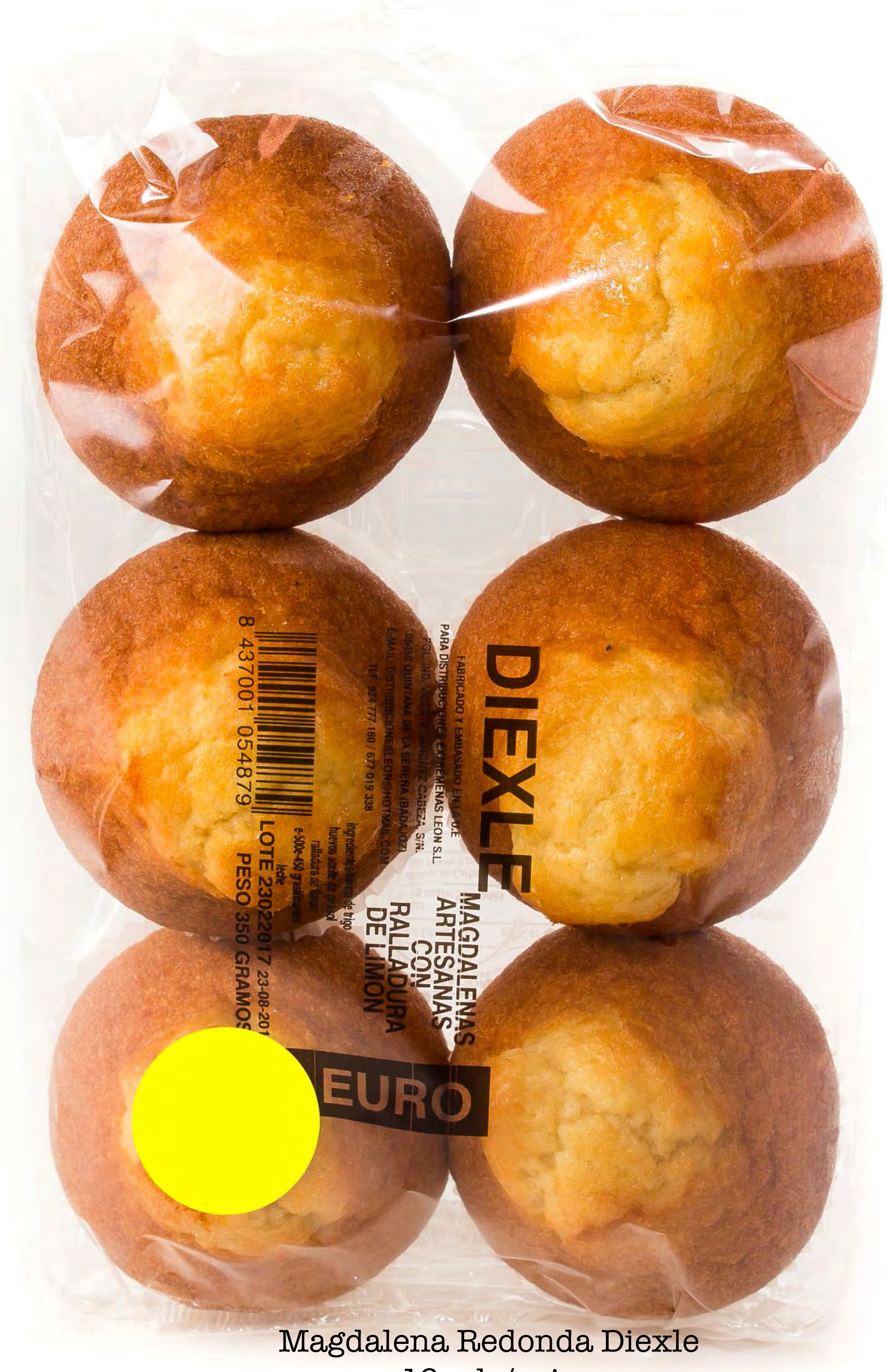
Magdalena Redonda Diexle 16 uds/caja