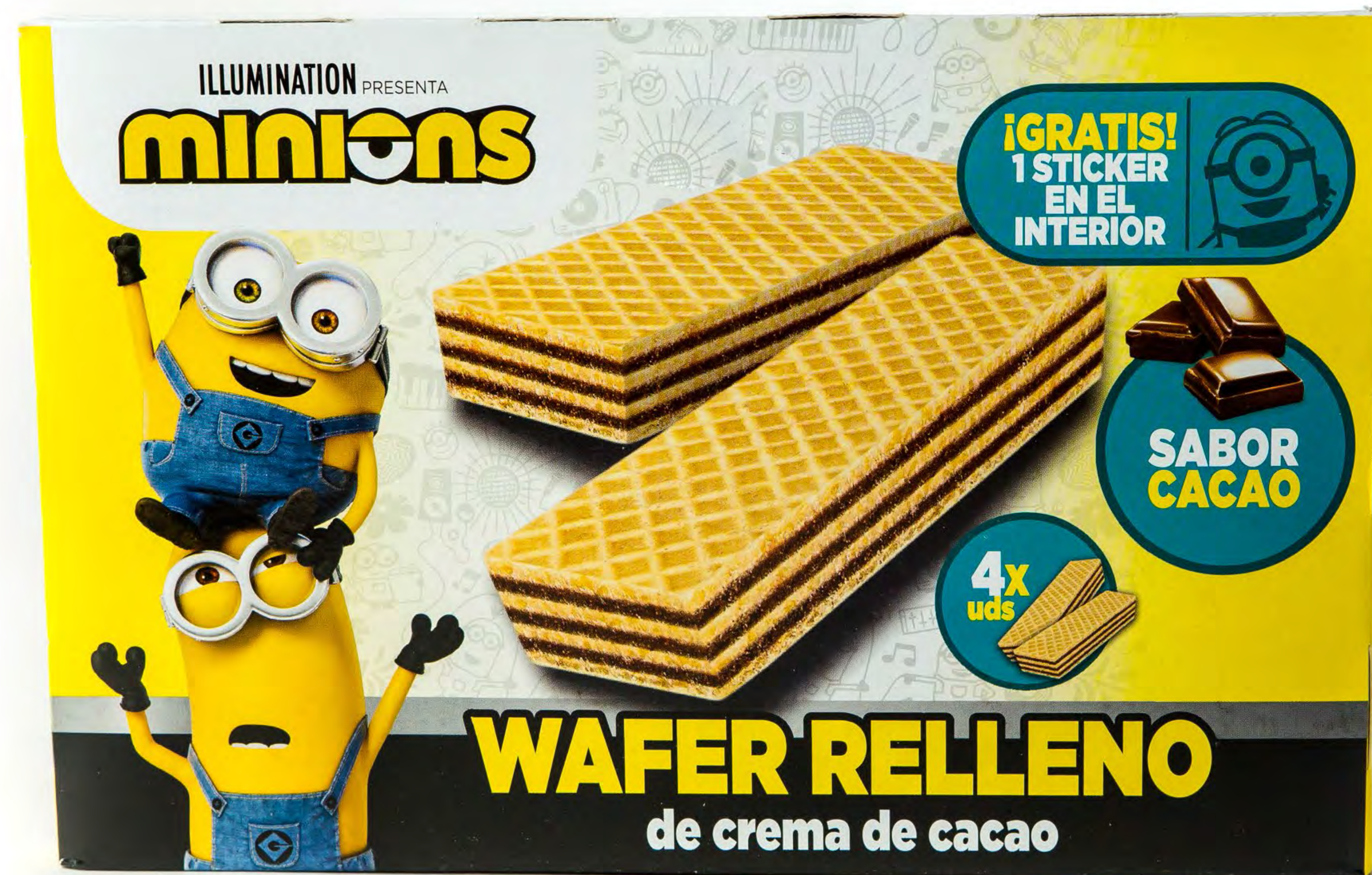
Cod.152019 Men You Minions 15 uds/caja