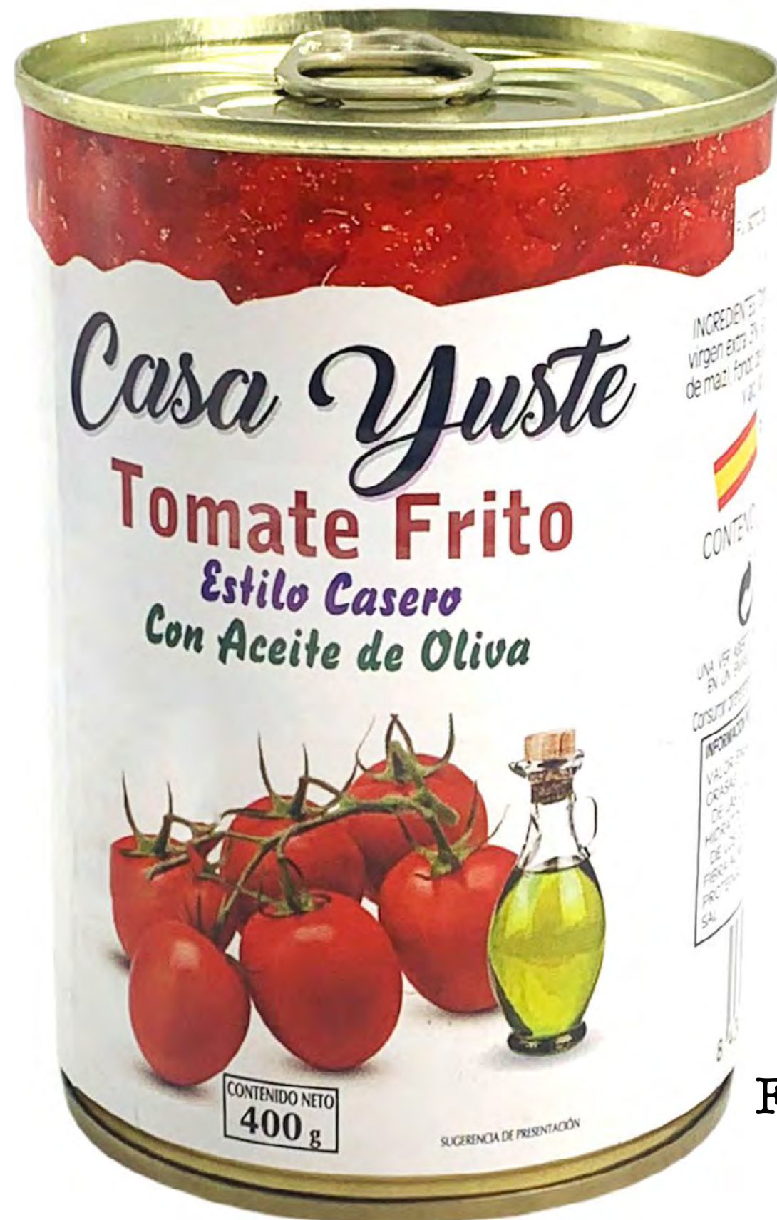
Fritada de Hortalizas PISTO 12 und/caja