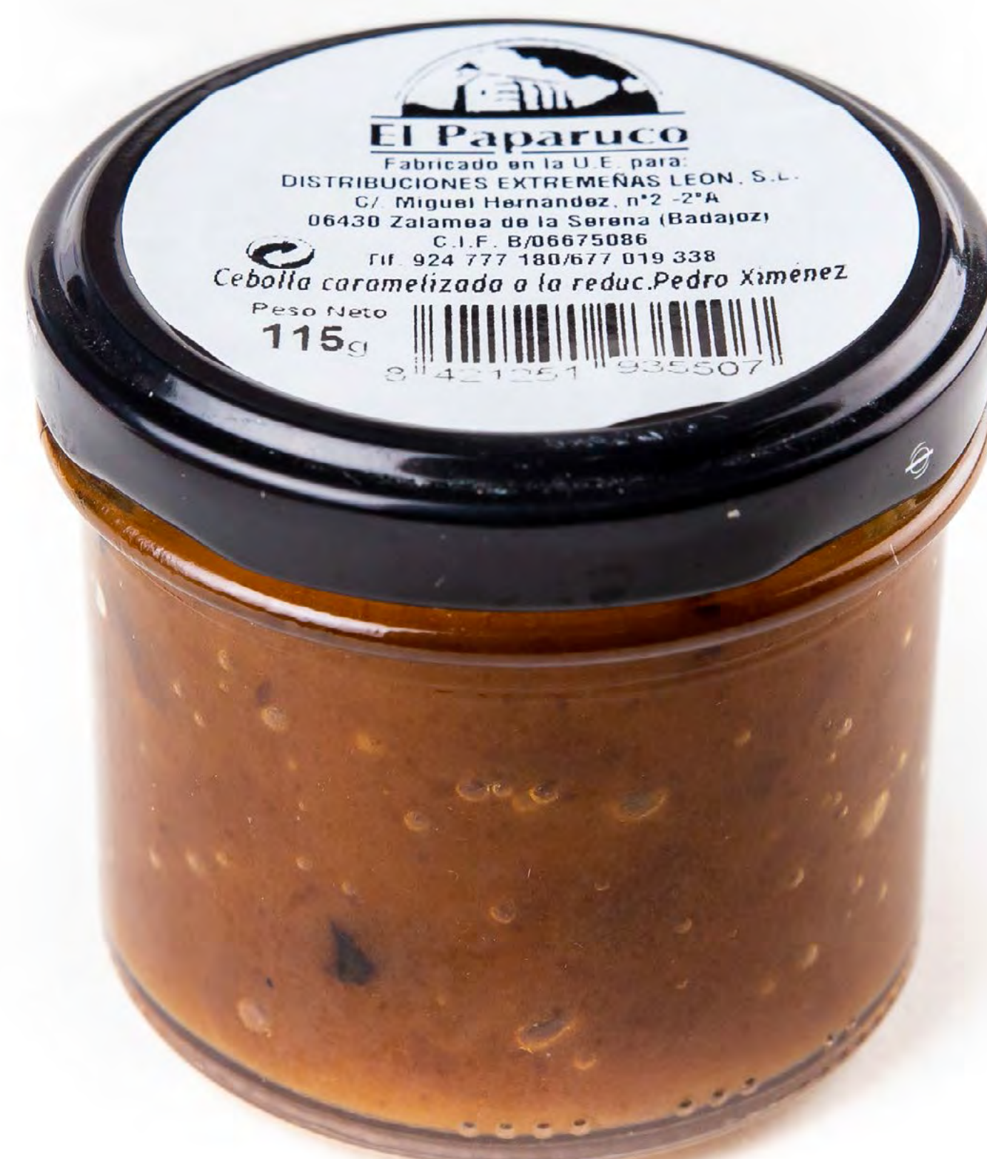
Cod. 048015 - Cebolla Caramelizada - 12 uds/caja