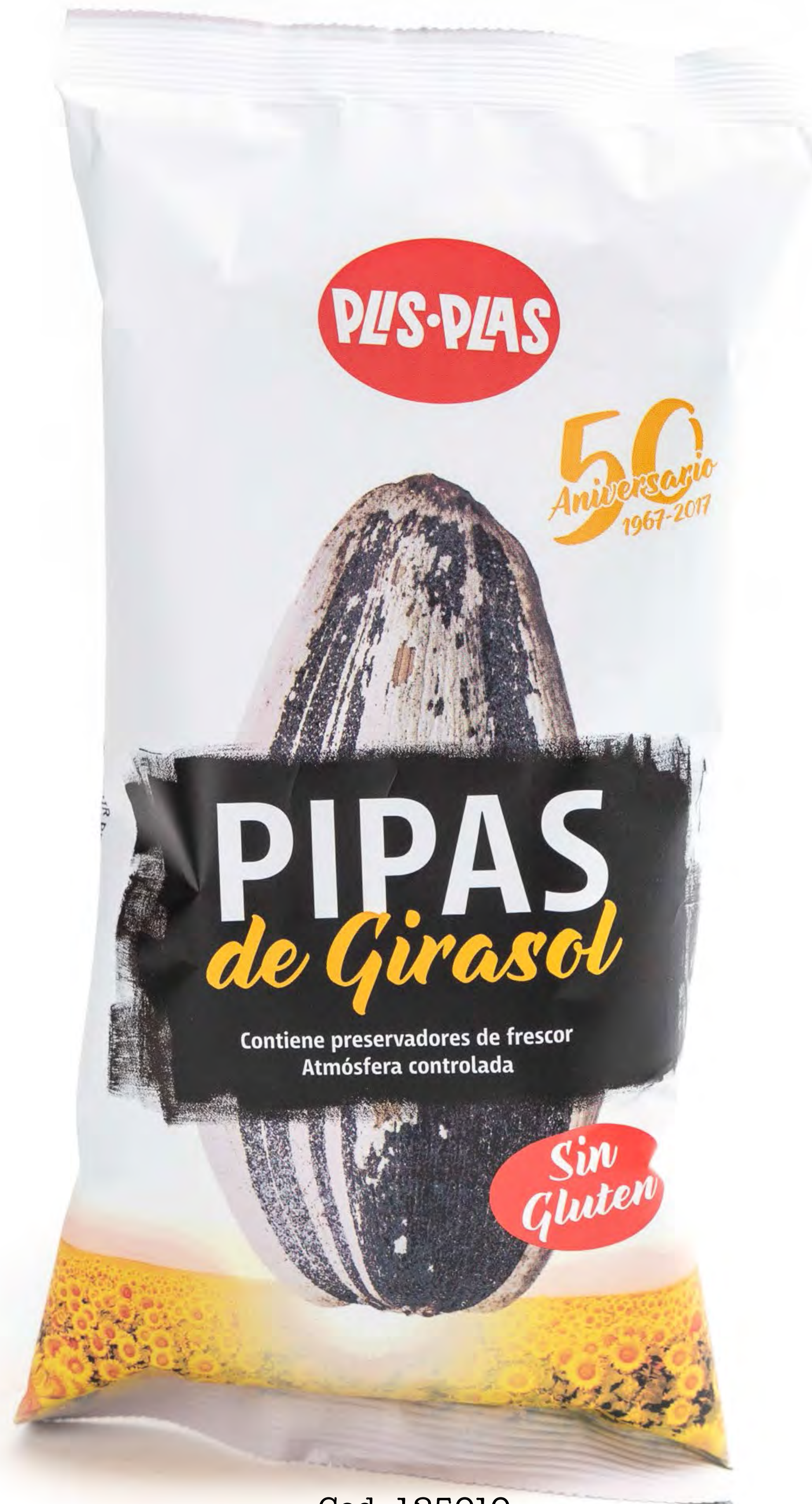
Cod. 125010 Pipas Aguasal 16 und/caja