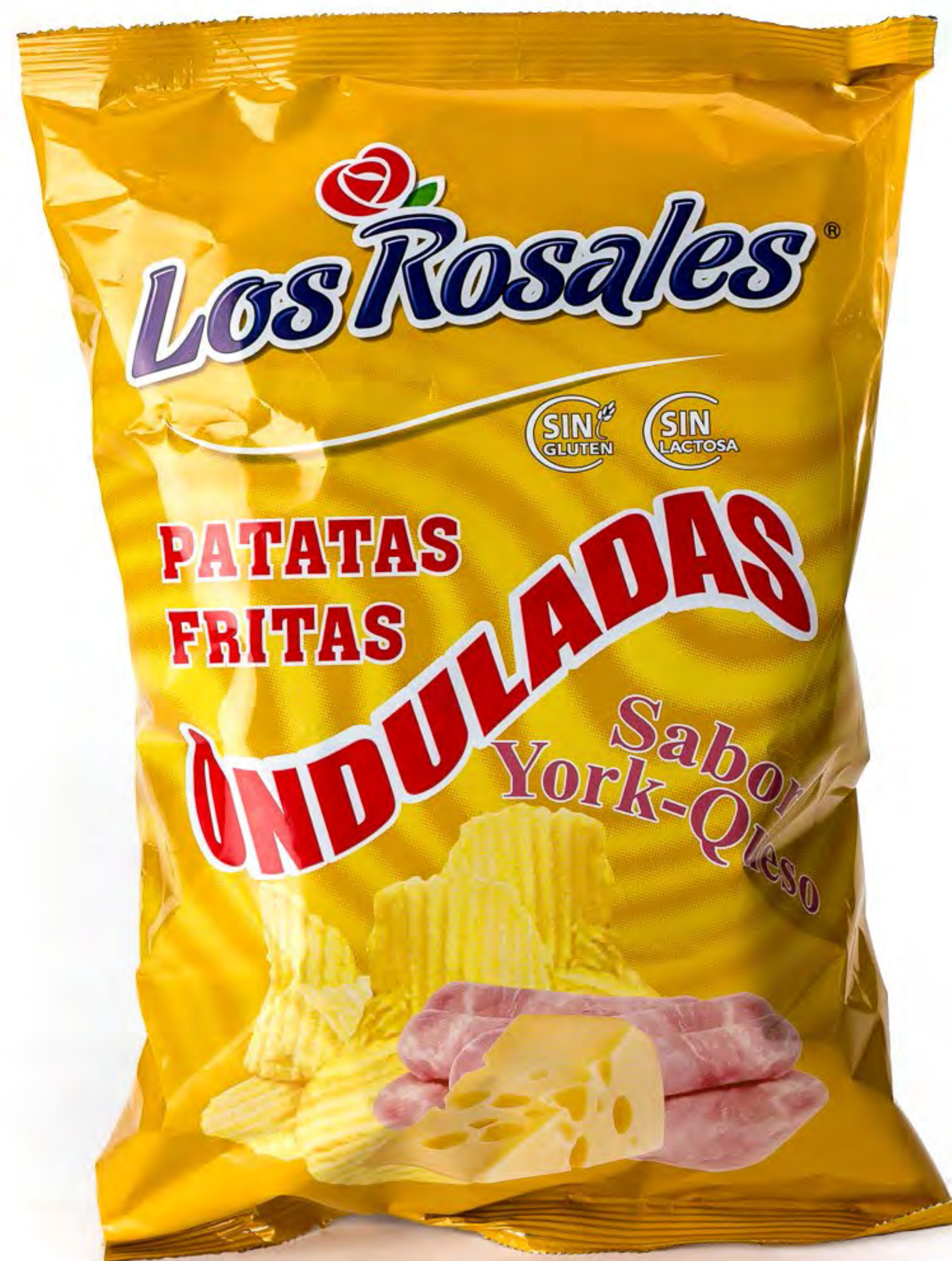
Patatas Onduladas York-Queso 150g. x 12 uds/caja