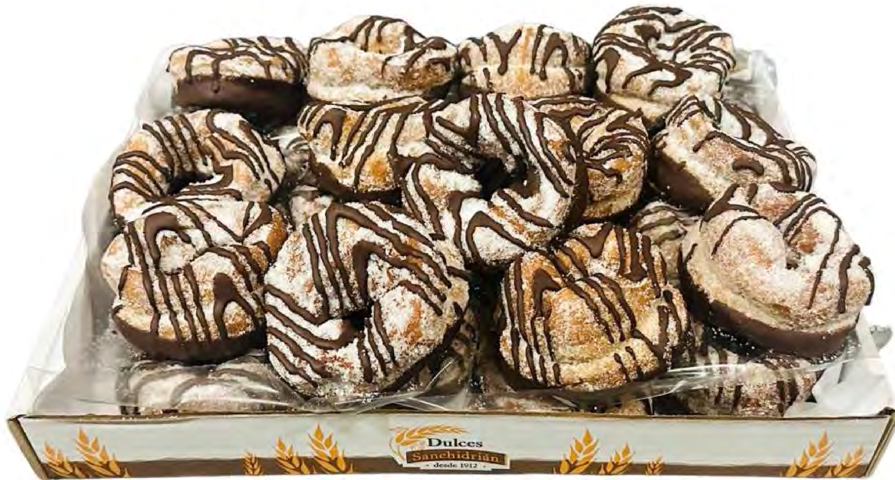
Cod. 260004 - Rosquillas Choco 2Kg.