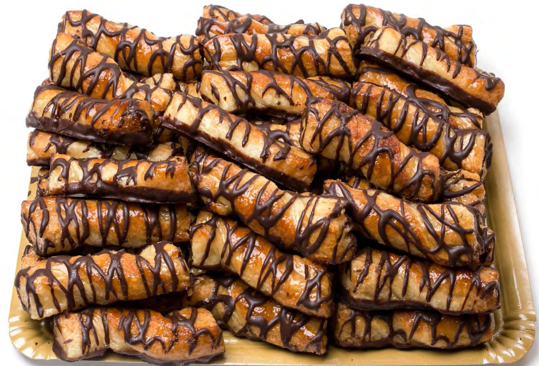
Lazos Choco-Miel 2kg