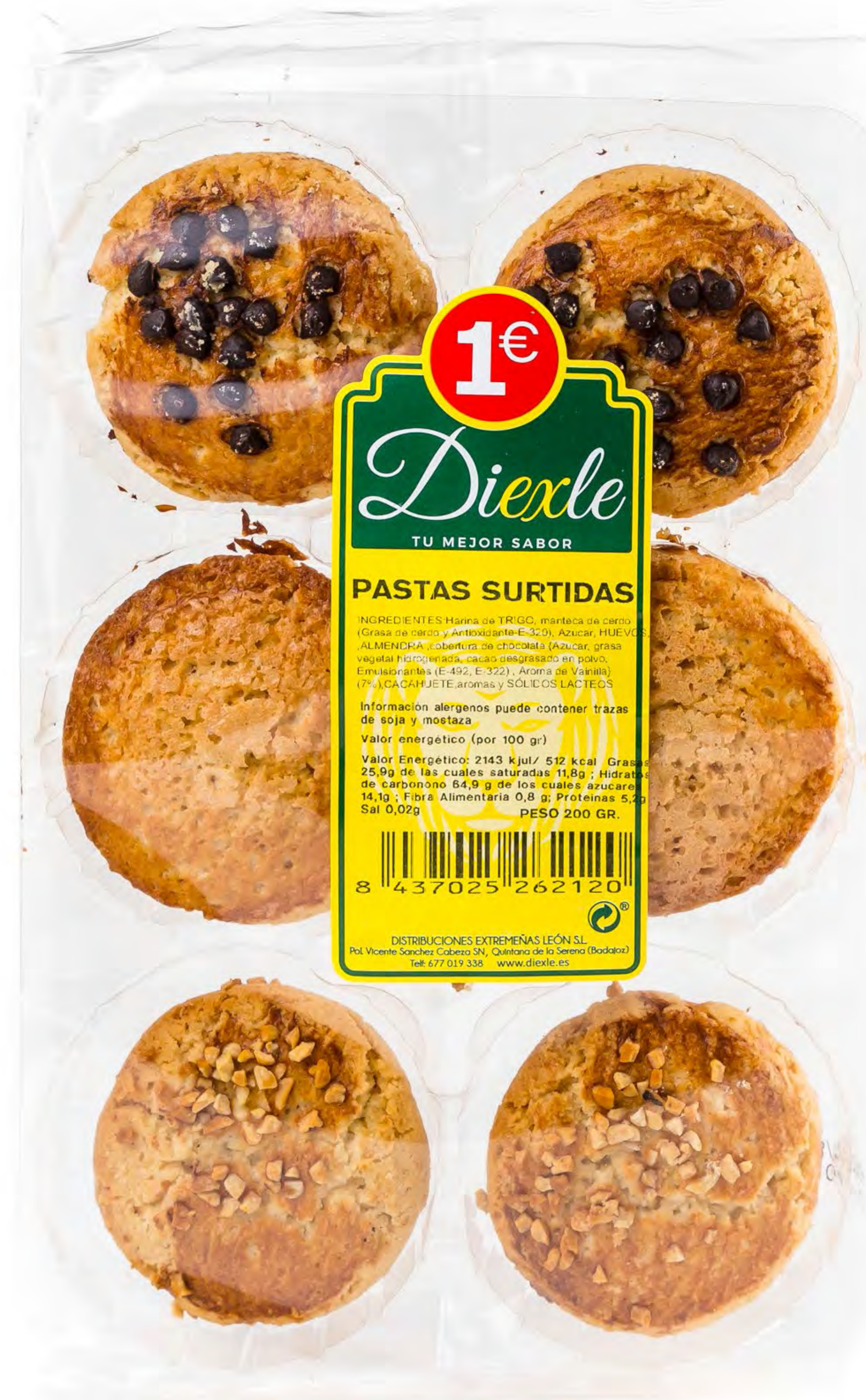
Cod. 19010 Bandeja Pasta Surtidas 15 uds/caja