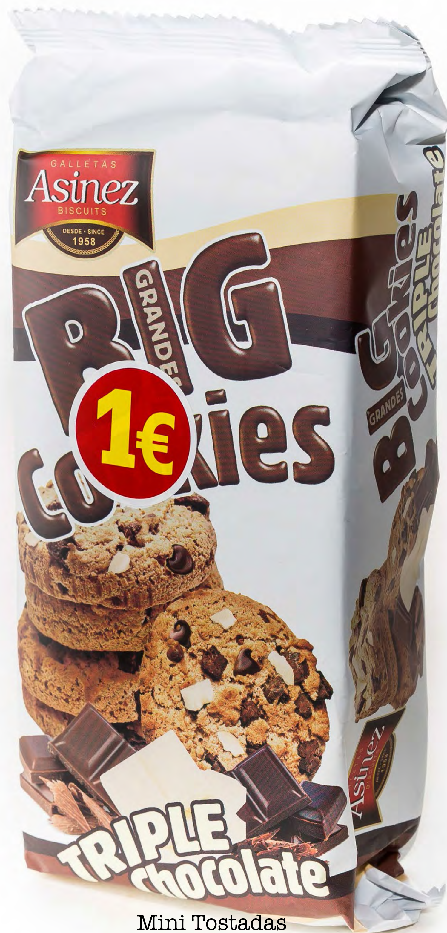
Mini Tostadas 10 uds/caja