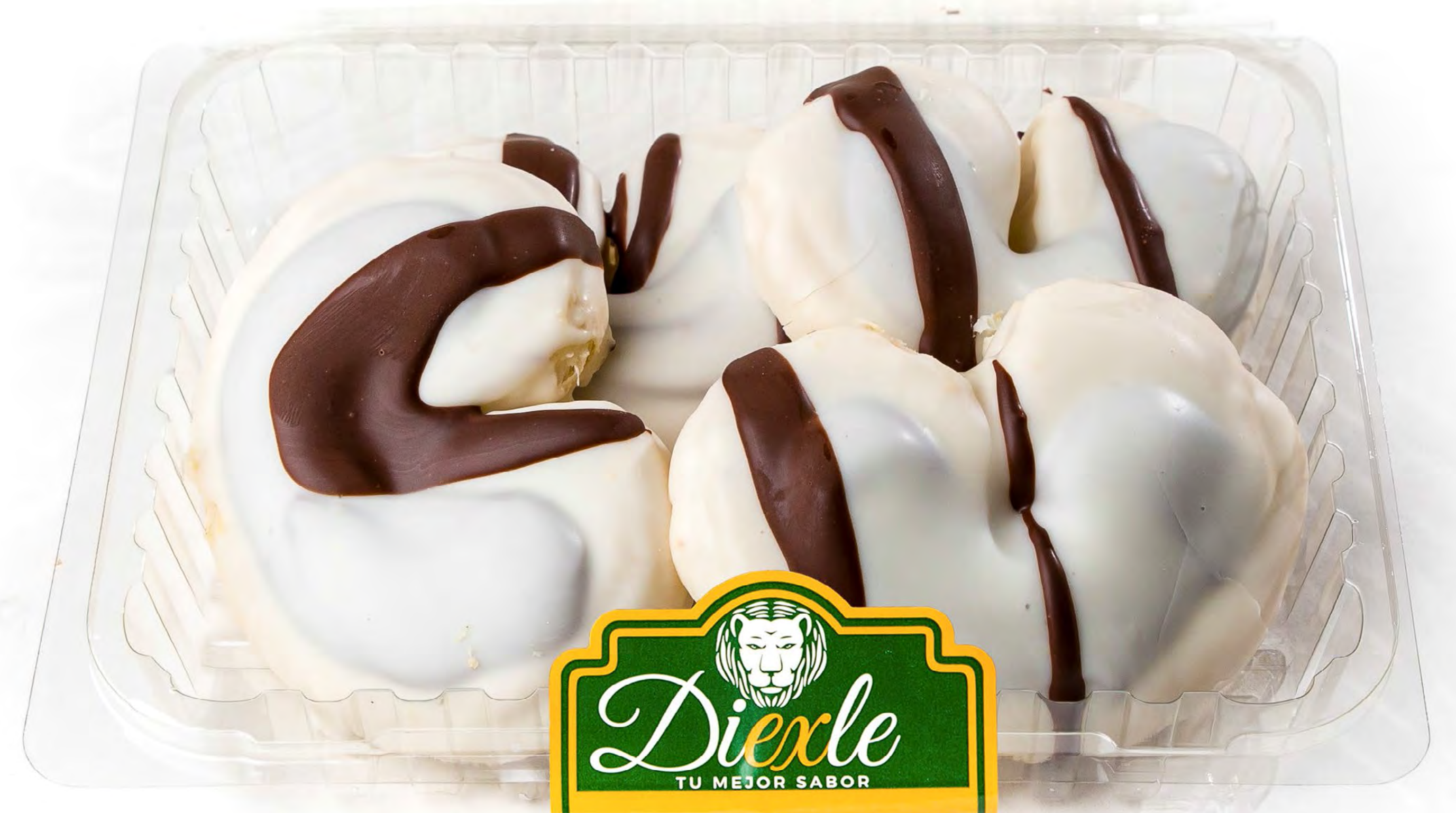
Cod. 253002 Blister Palmeritas CHOCO 12 uds/caja