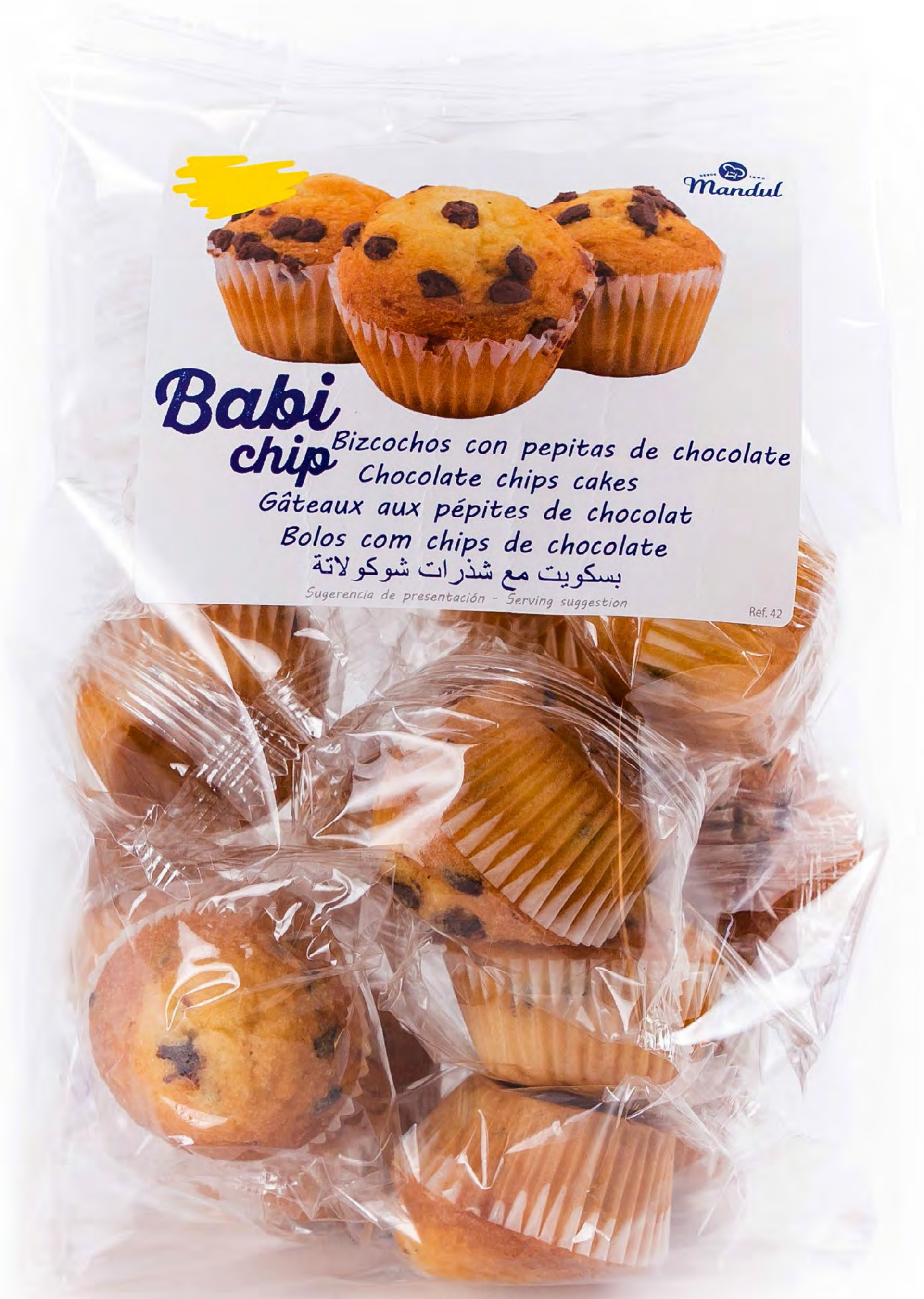
Minimagdalenas Babi Choc 10 uds/caja

Babi chip Bizcochos con pepitas de chocolate Chocolate chips cakes Gâteaux aux pépites de chocolat Bolos com chips de chocolate بسكويت مع شذرات شوكولاتة Sugerencia de presentación - Serving suggestion Ref. 42