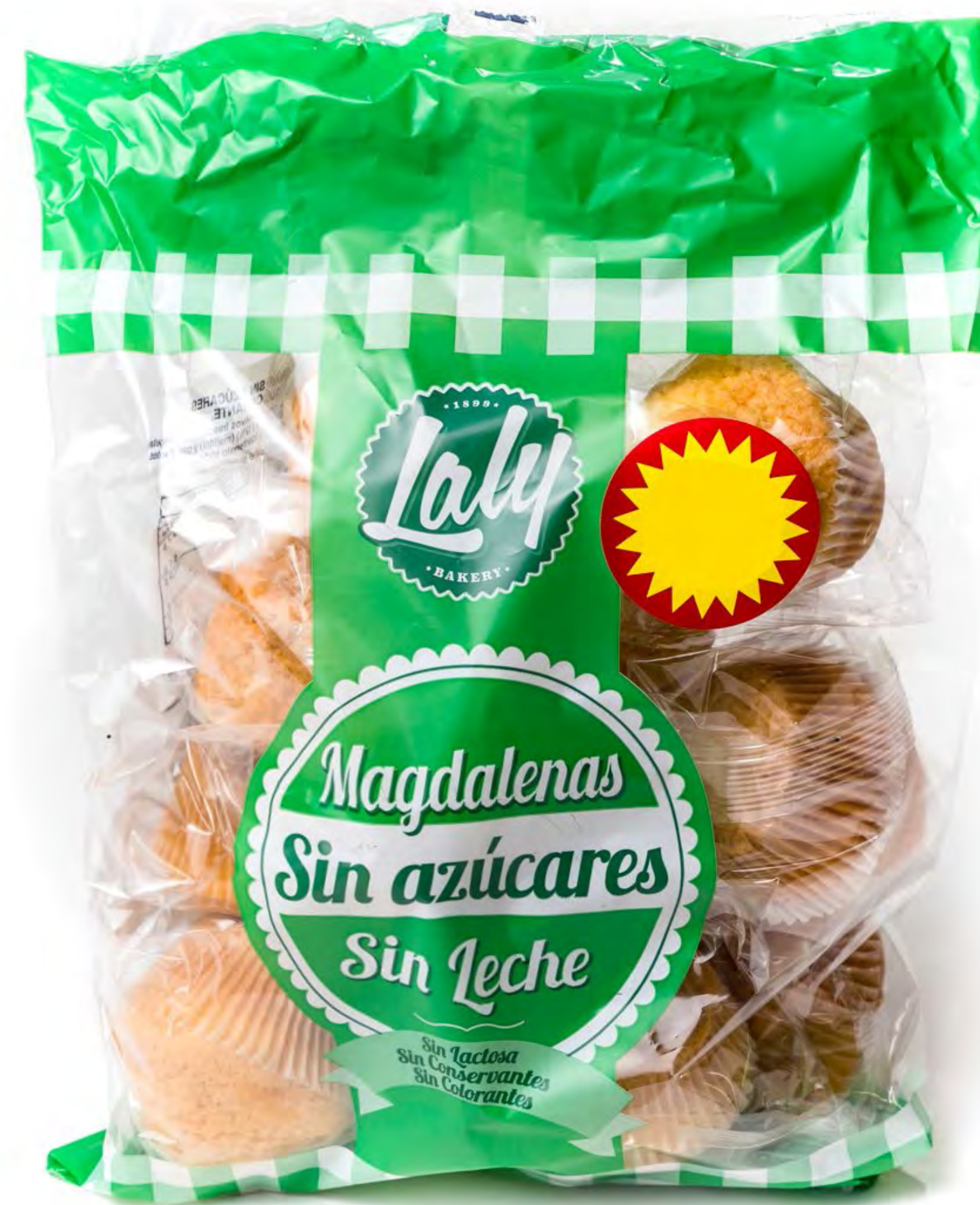
Bolsón Magdalena S/A SIN LACTOSA 10 uds/caja