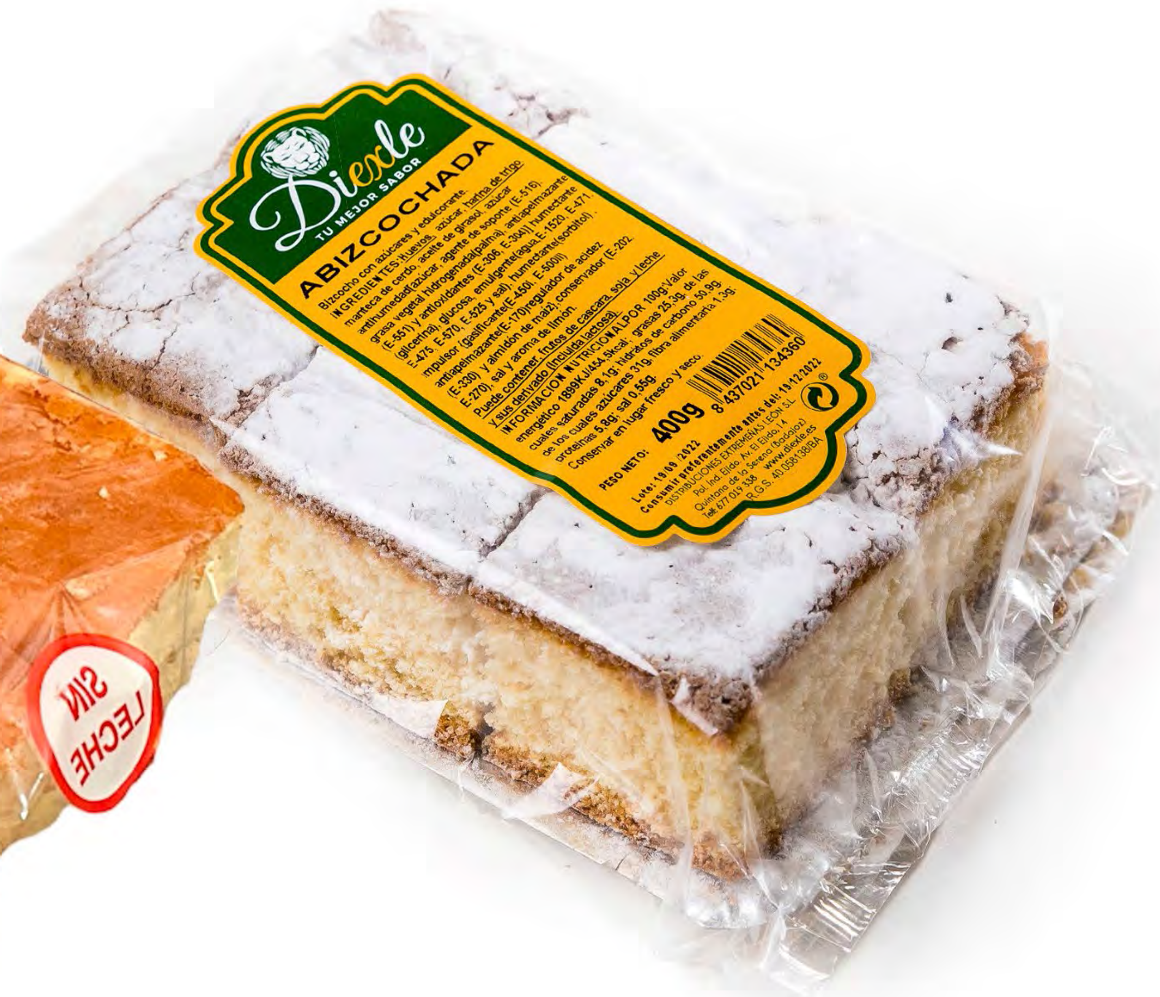
Cod. 203002 Abizcochadas Glass 6 und/caja