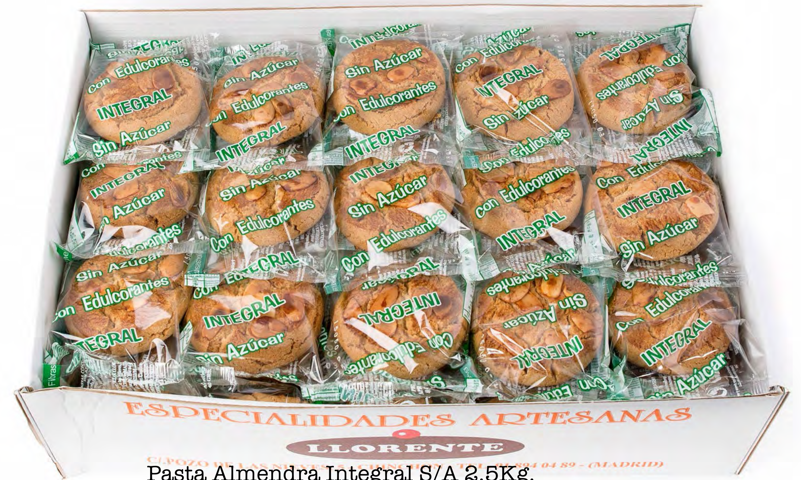
Pasta Almendra Integral S/A 2.5Kg.