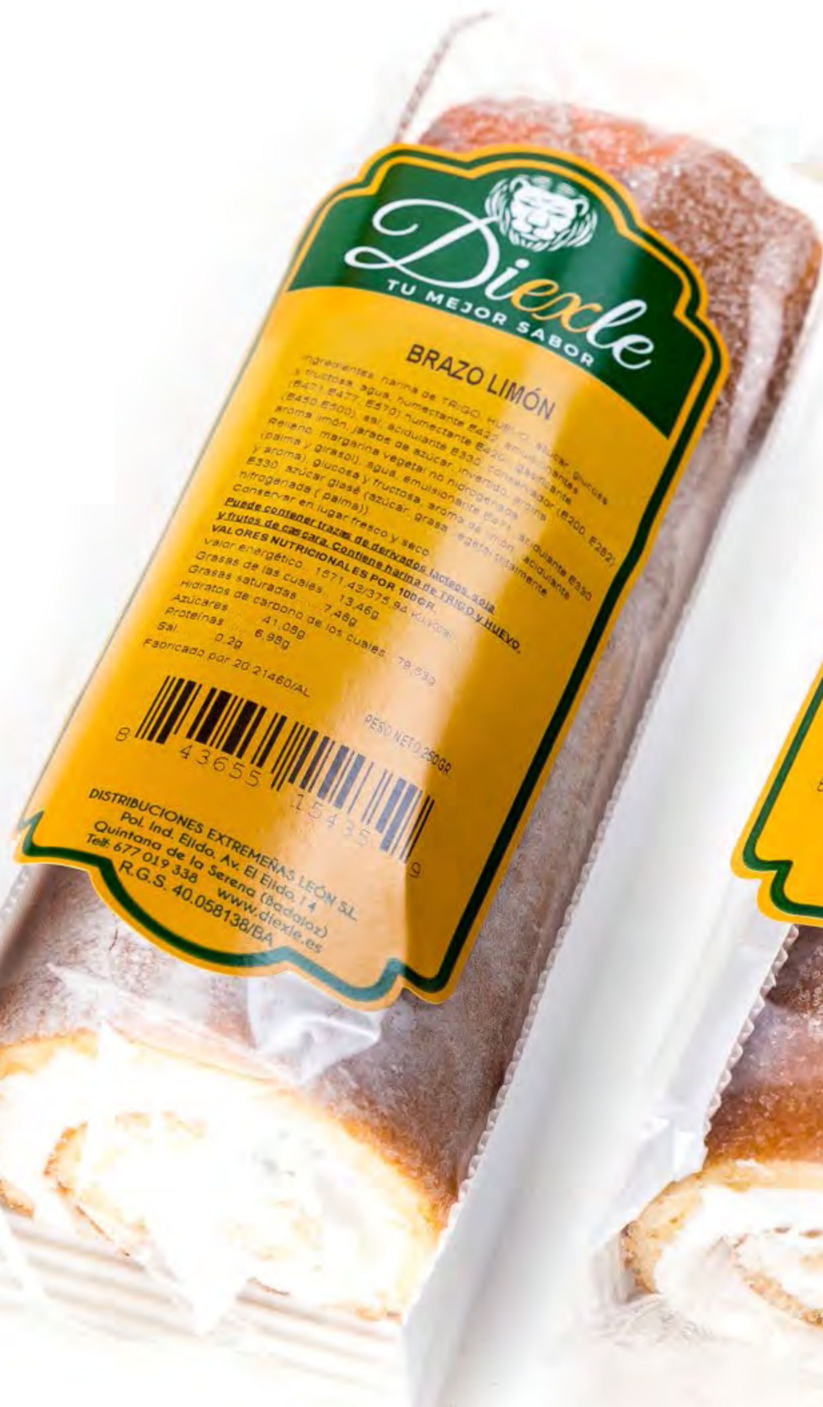
Brazo de Limón 10 uds/caja