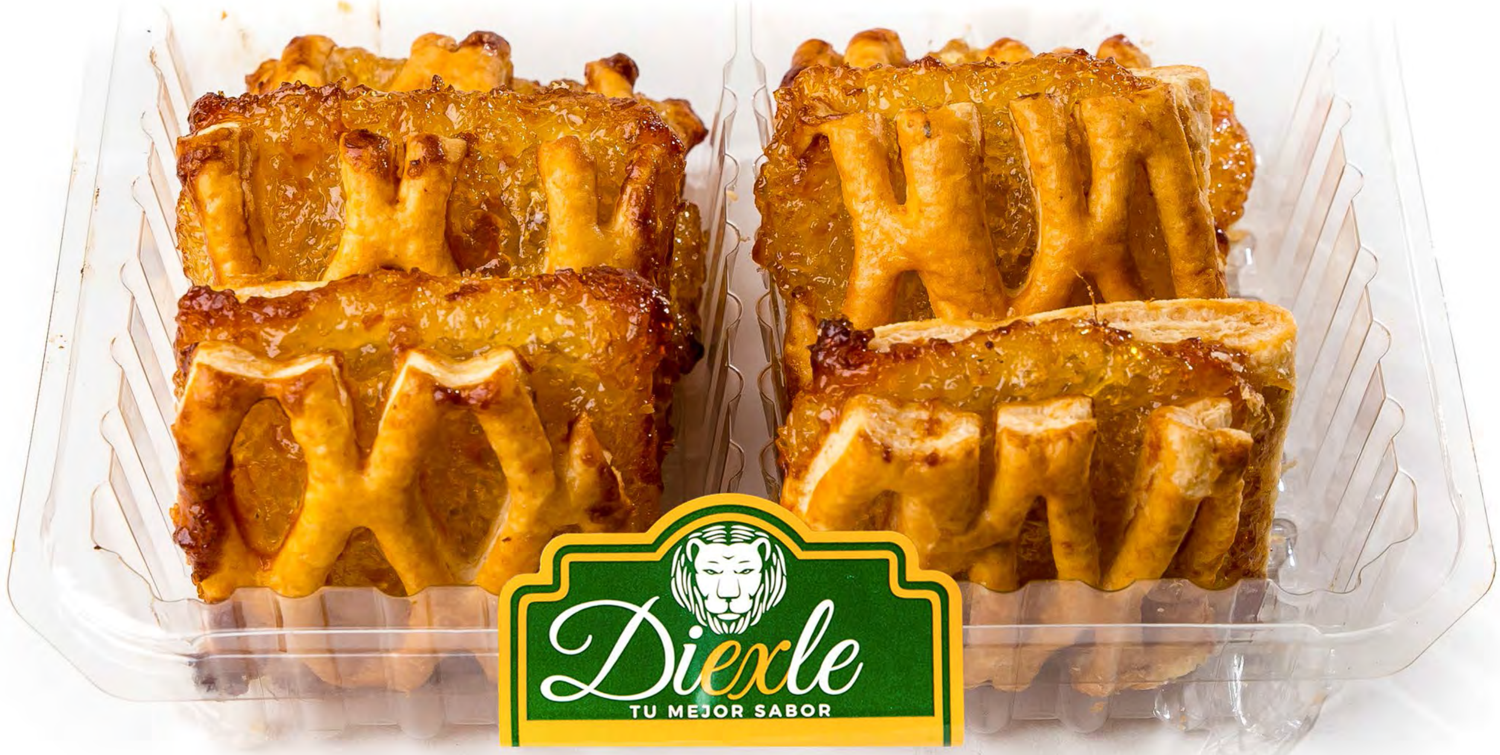
Cod.066036 Paneles Cabello Sin Azúcar 8 uds/caja