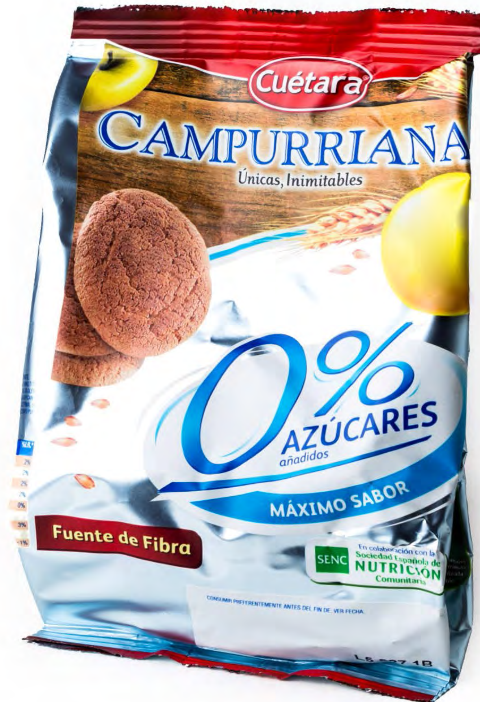
Galletas Campurrianas S/A 0% 7 uds/caja