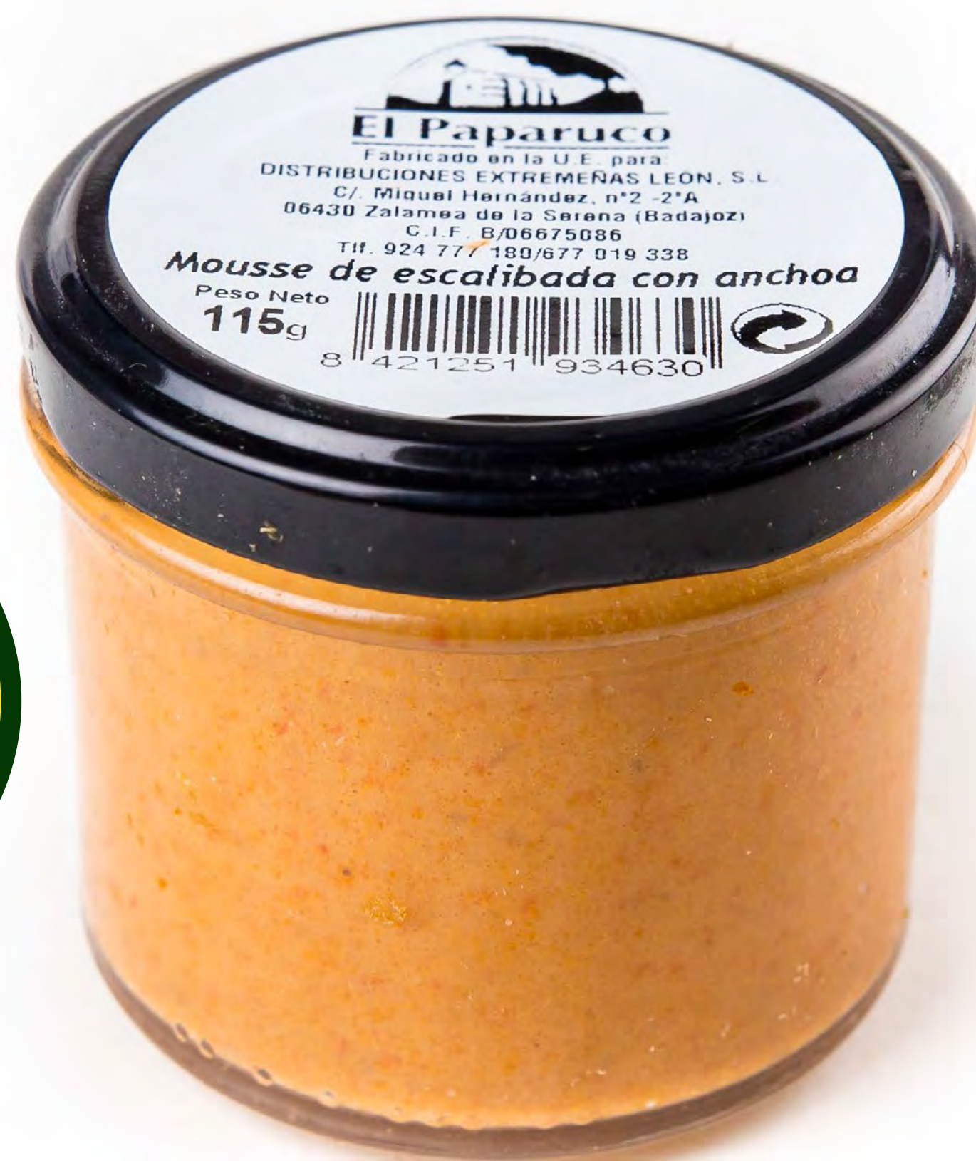
Cod. 048006 - Mousse escalibada con Anchoa - 12 uds/caja