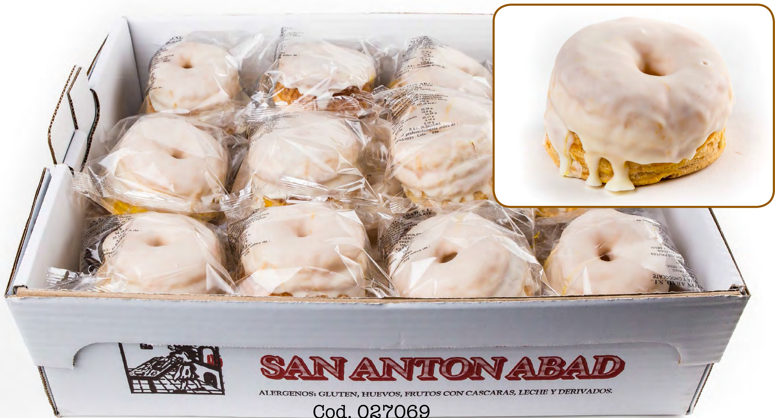
Cod. 027069 Roscas Yema Choco Blanco 2k