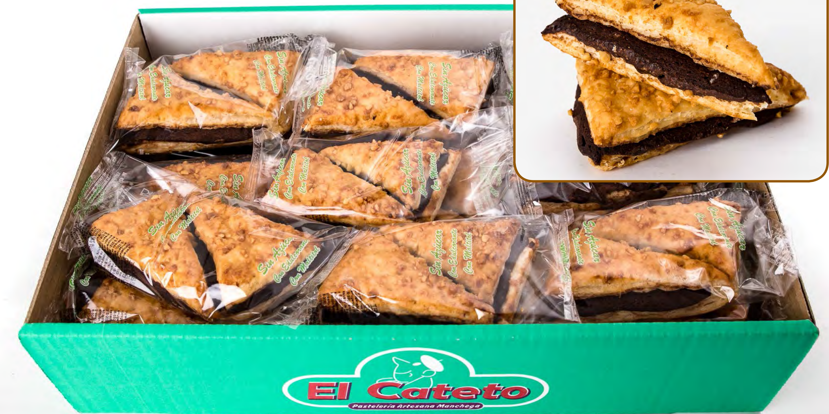
Triangulos Choco S/A 2 Kg.