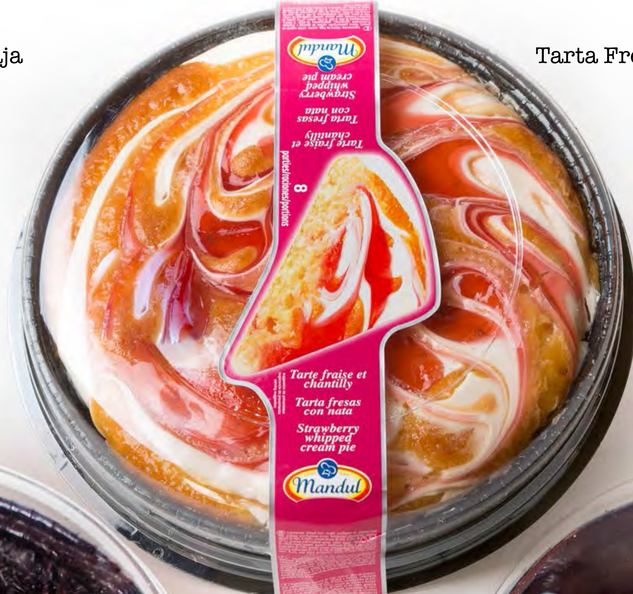
Tarta Fresa 6 uds/caja