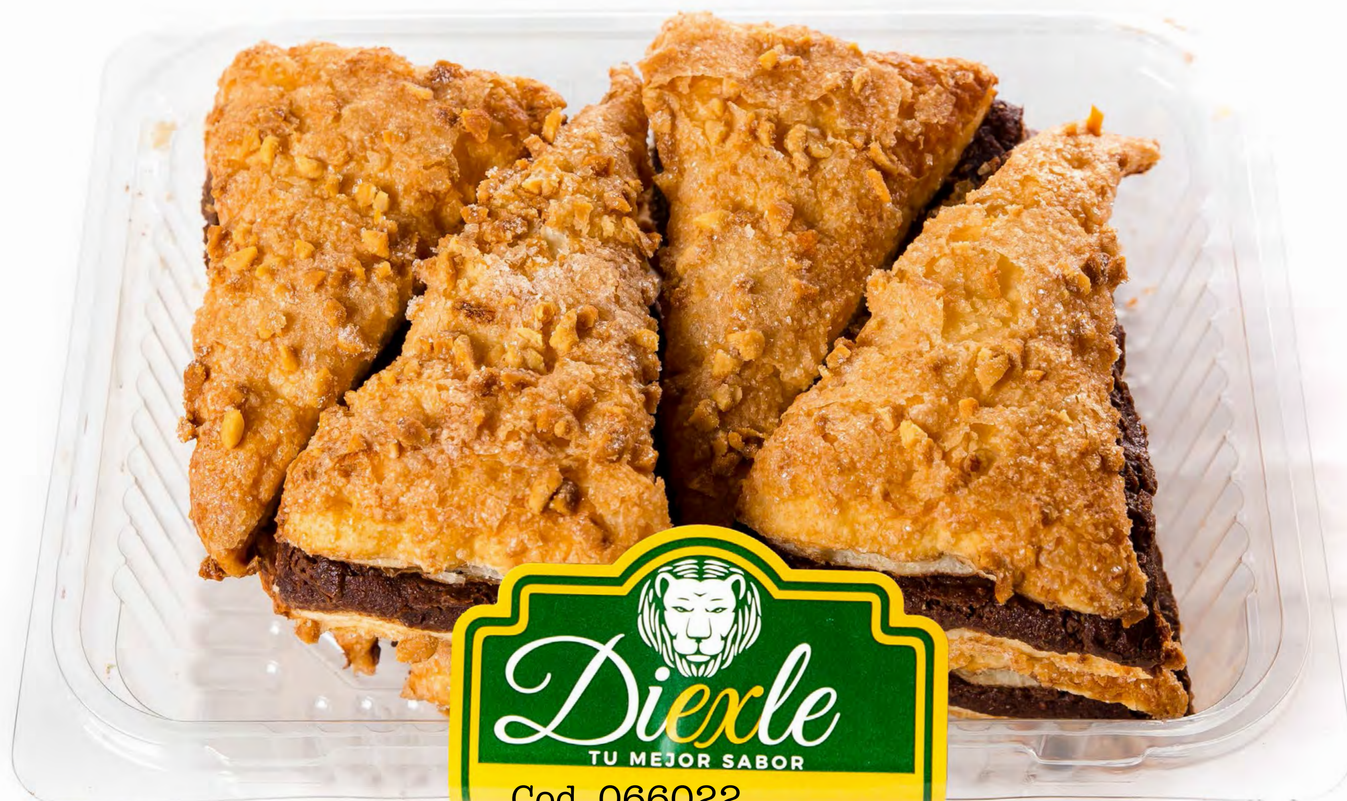
Cod. 066022 Triángulos Choco 8 und/caja