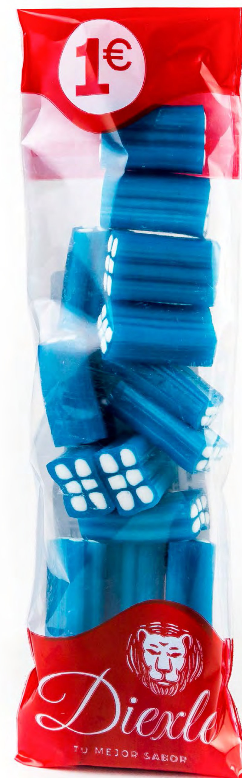
Cod: 193069 Ladrillo Frambuesa 20 und/caja