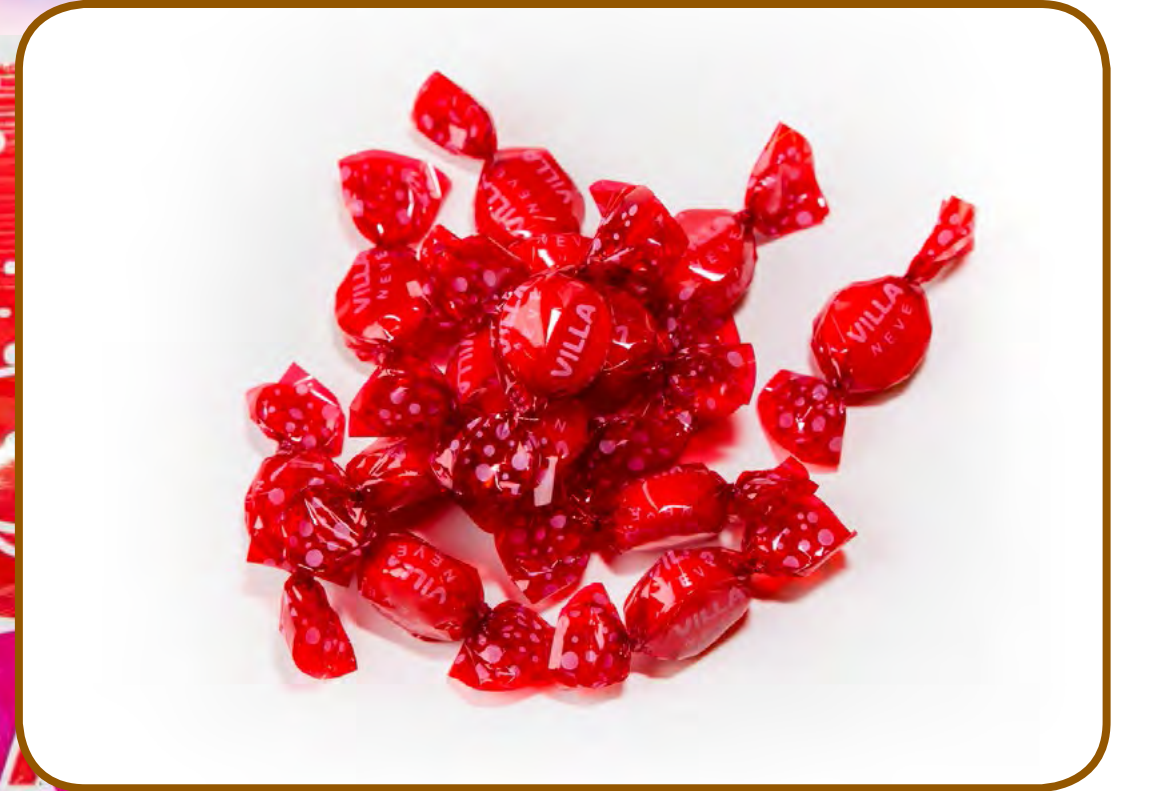
Cod: 118014 Caramelos Bola Nieve 16 und/caja