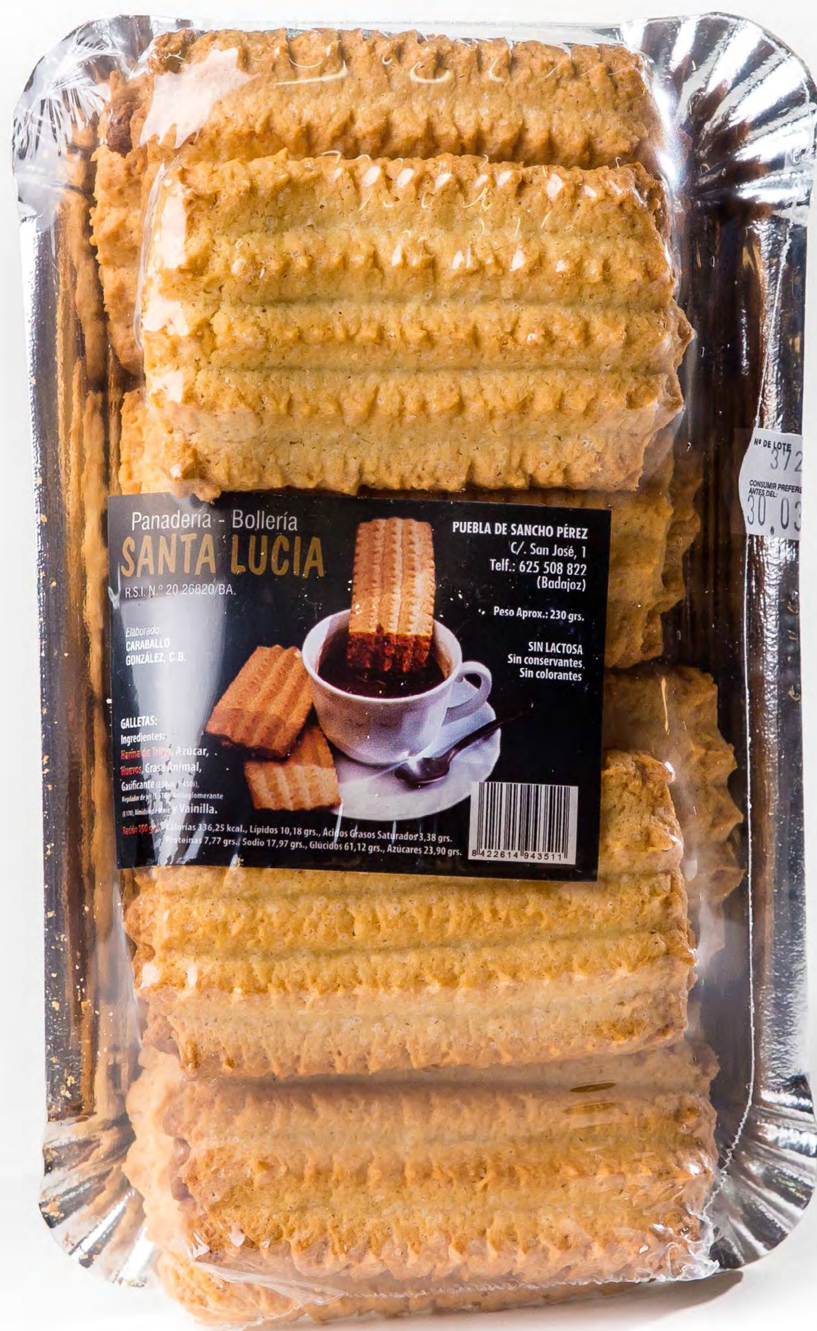
Cod. 252001 Rizadas Santa Lucia 12 uds/caja