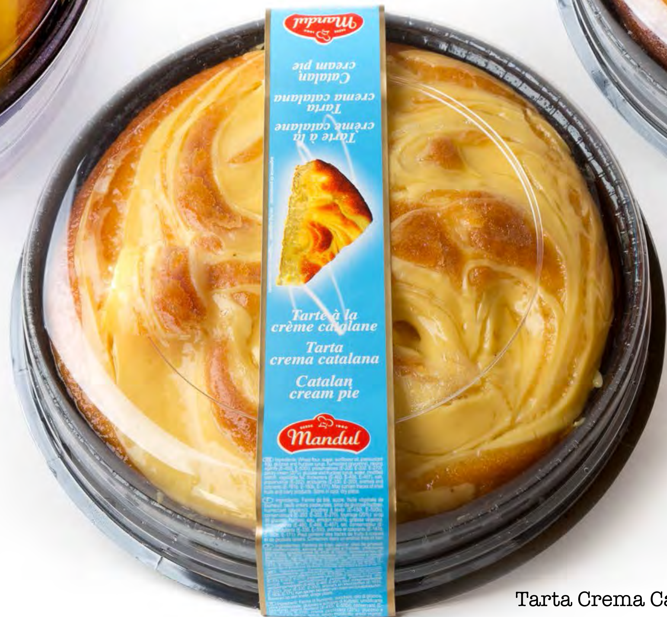
Tarta Crema Catalana 6 uds/caja