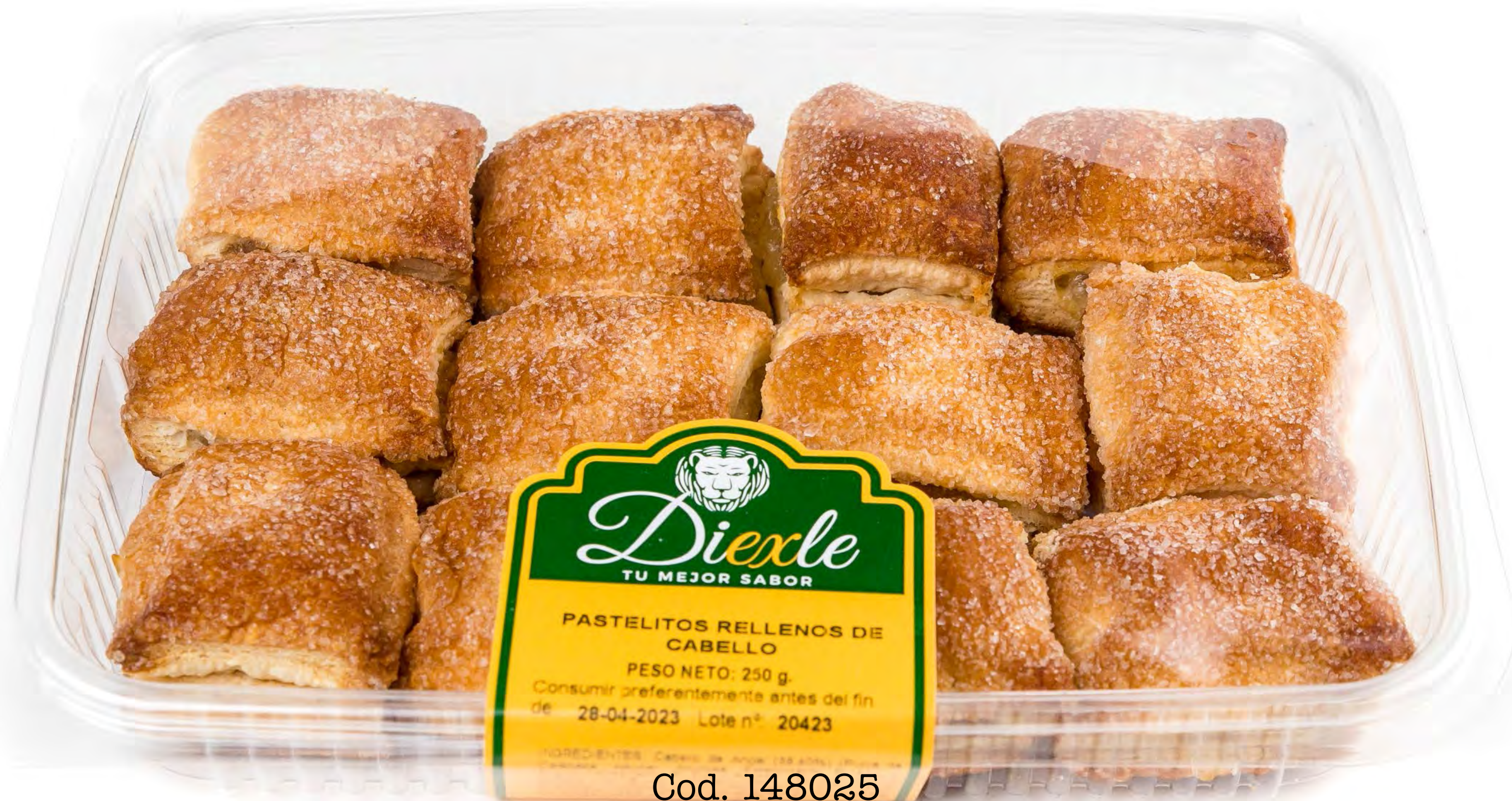
Cod. 148025 Pastelitos Rell. Cabello 11 uds/caja