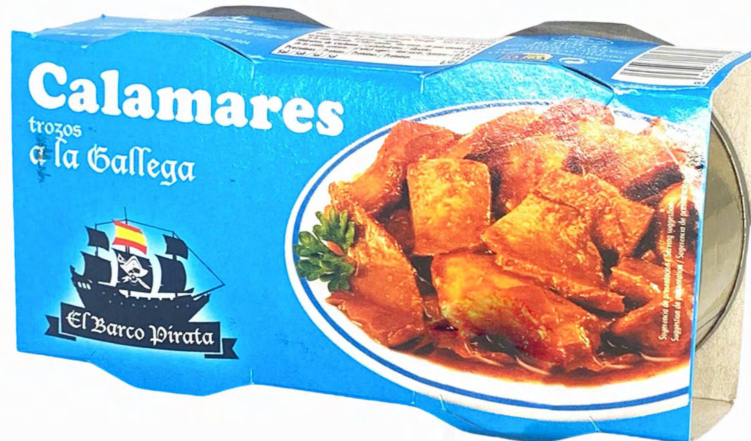
Calamares a la Gallega