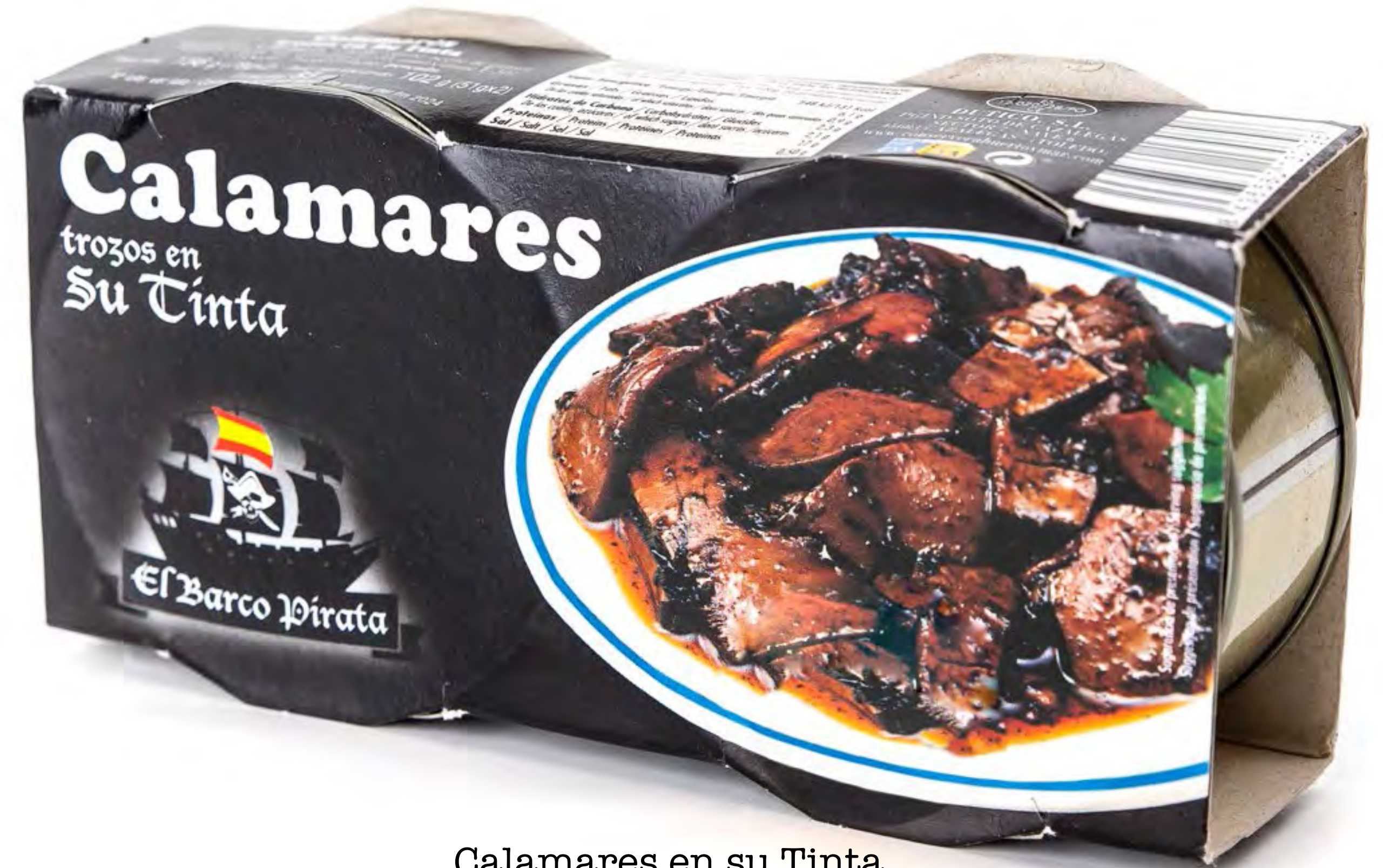
Calamares en su Tinta