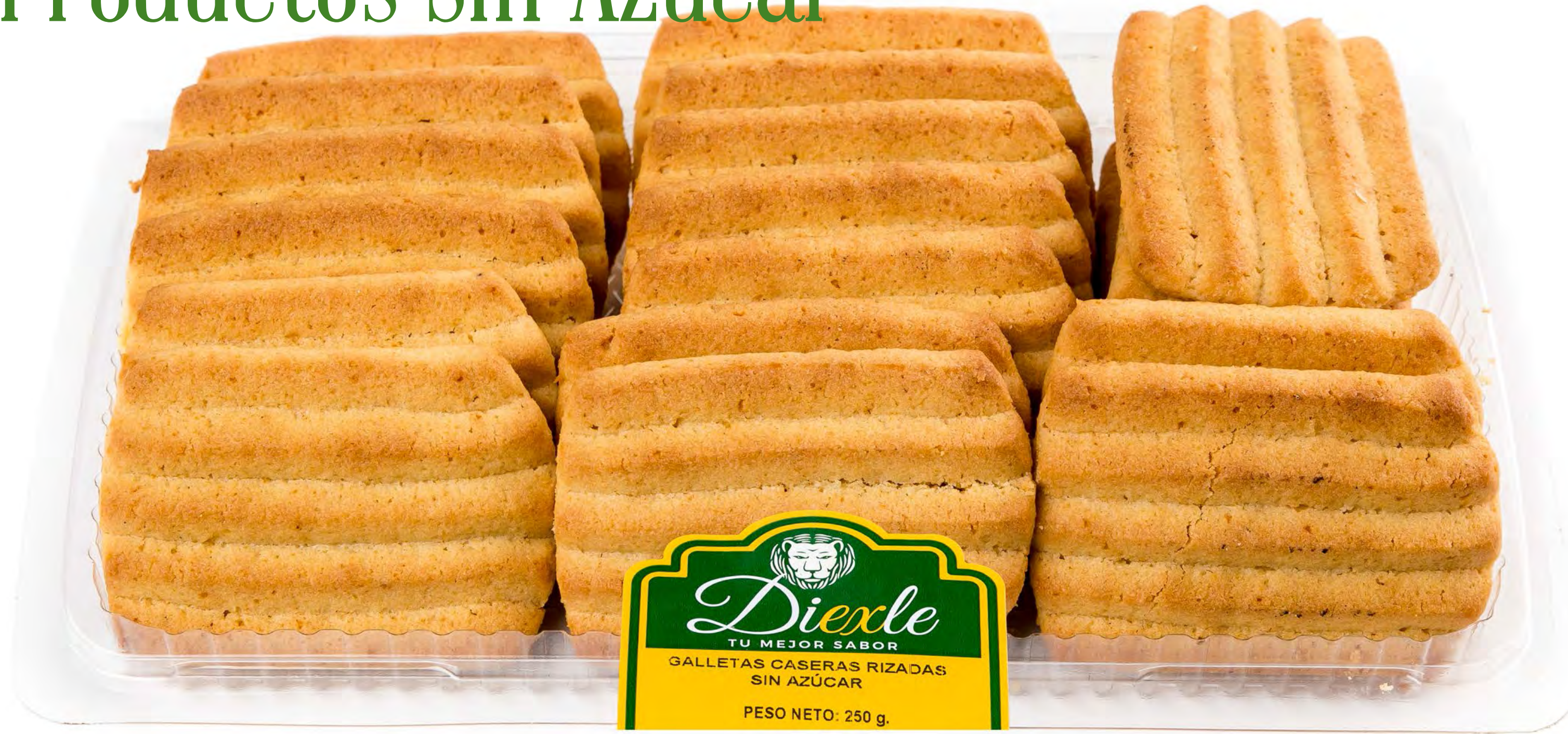
Cod. 148021 - Blister Galletas Rizadas S/A 8 uds/caja