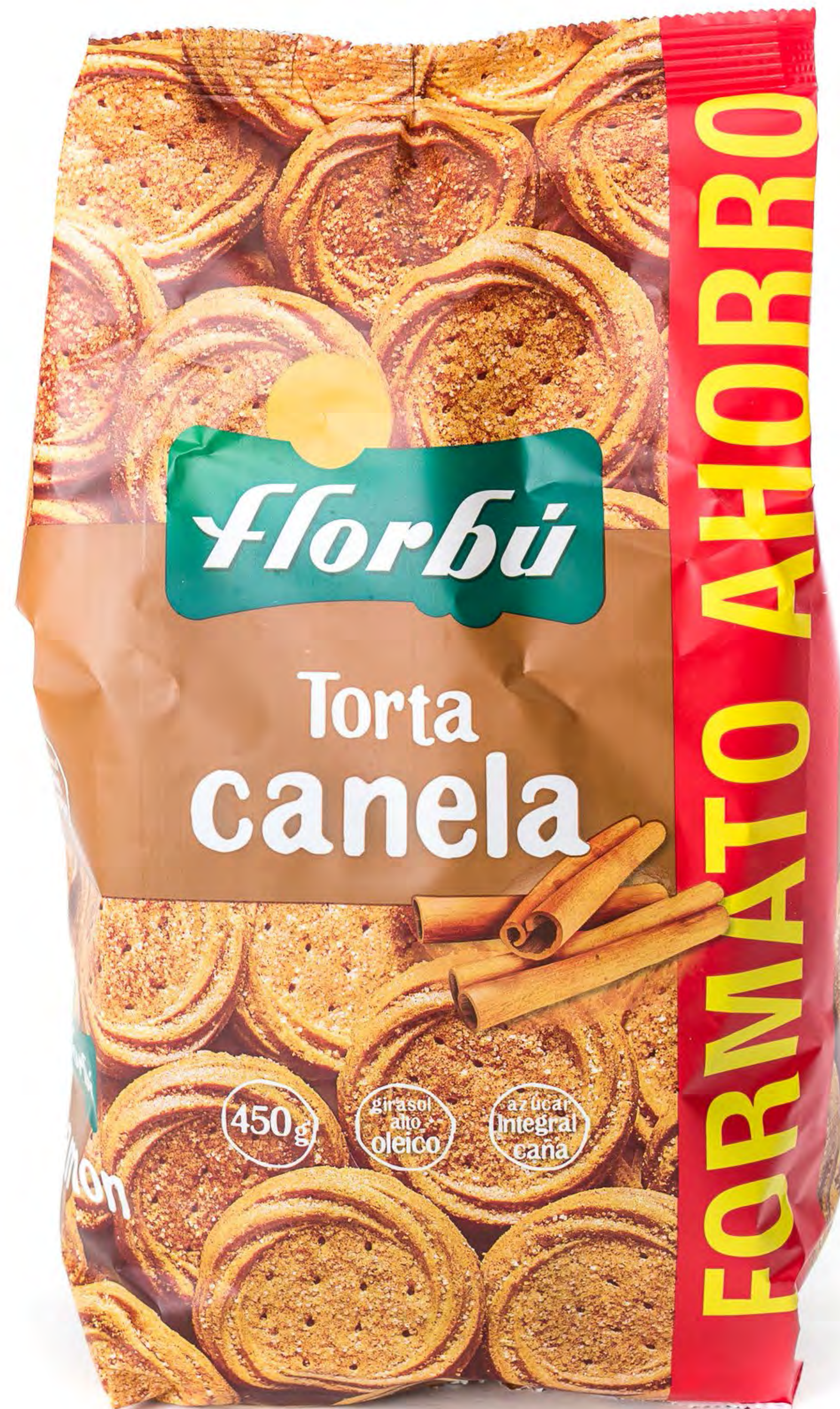
Cod. 174044 Torta Canela 6 uds/caja