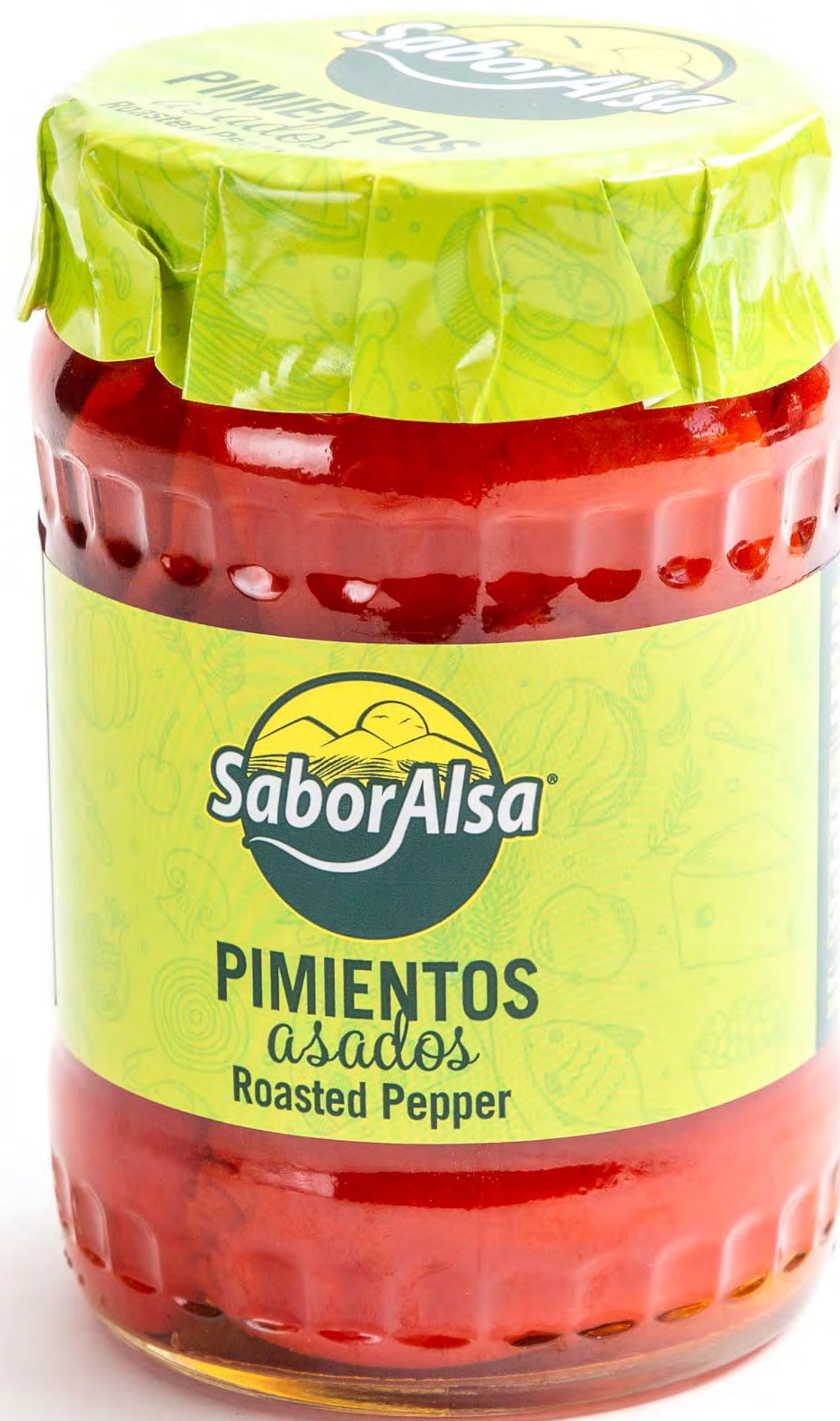
cod.190001 Pimiento Piquillo Asado 12 uds/caja