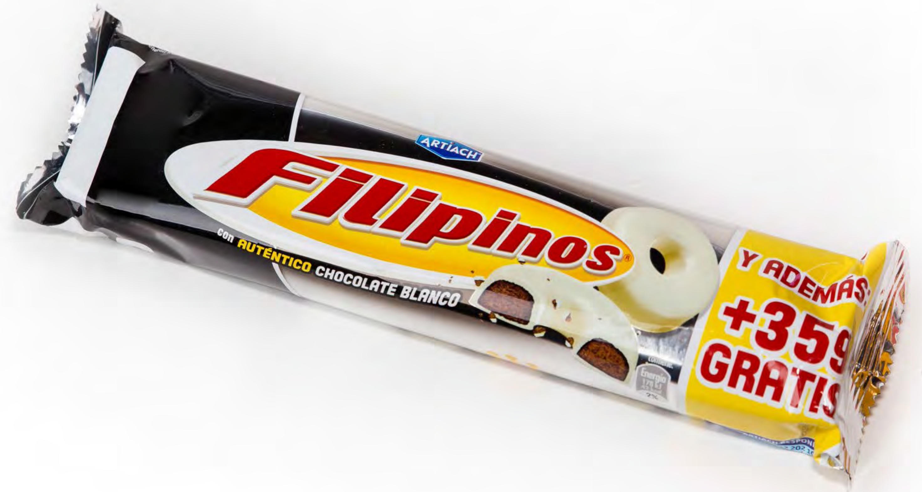
Filipinos Choco Blanco uds/Caja