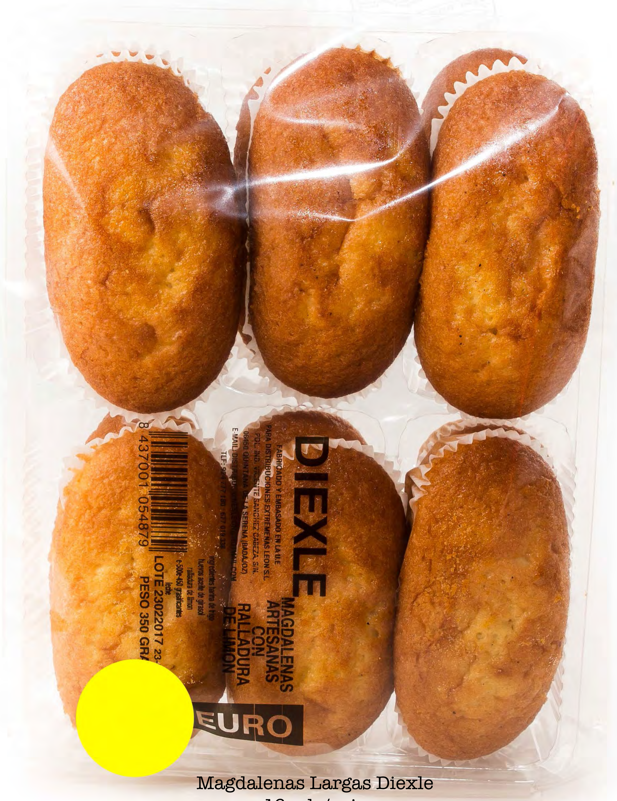
Magdalenas Largas Diexle 16 uds/caja