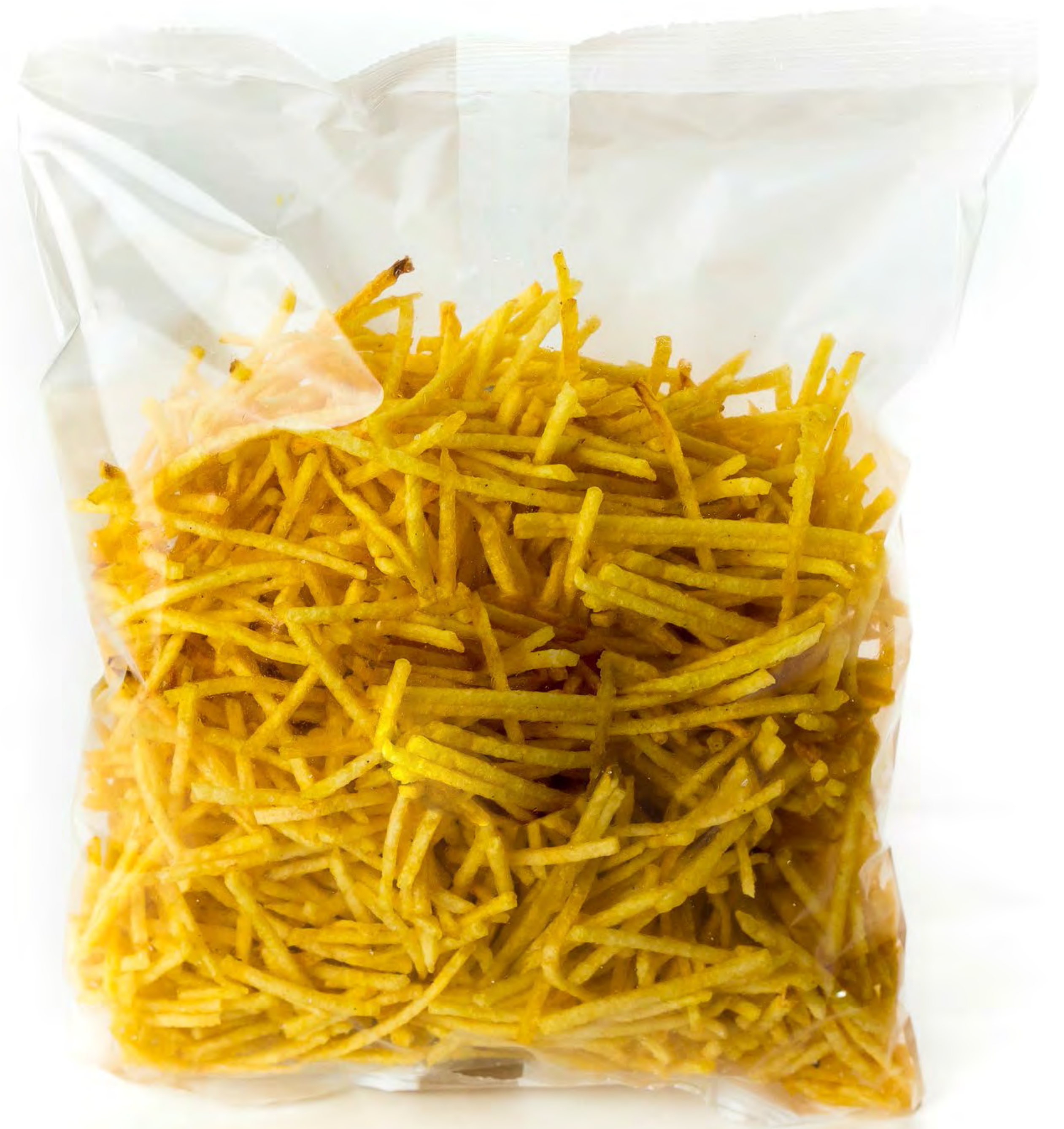
Cod. 164007 - Paja Monti - 14 uds/caja