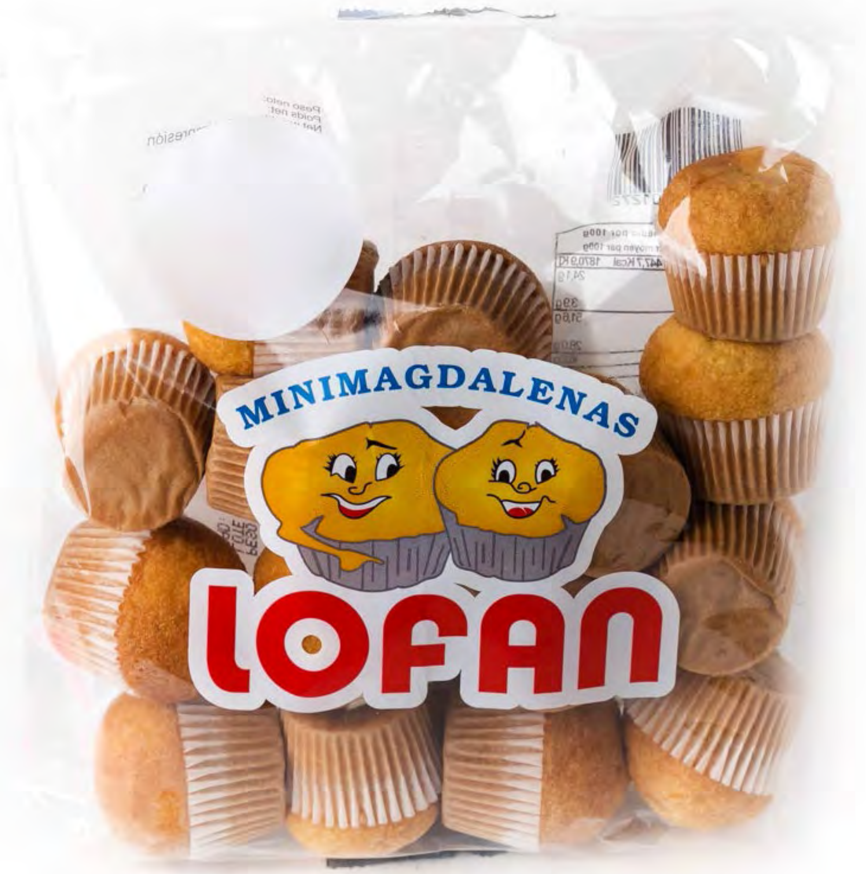
Mini Errea 195g. x 16 uds/caja