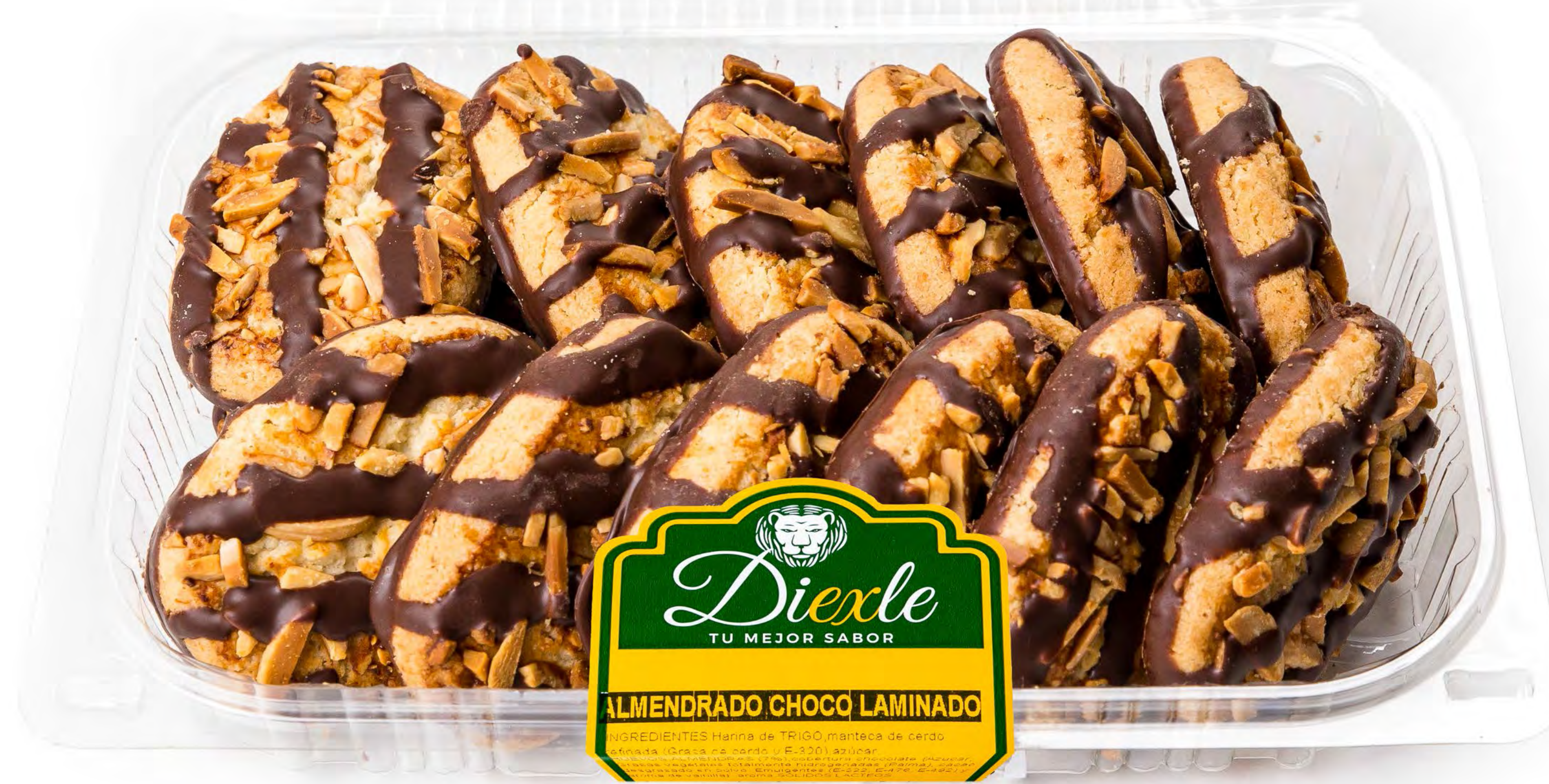
Cod. 258004 - Blister Choco Laminado Almendra 8 und/caja