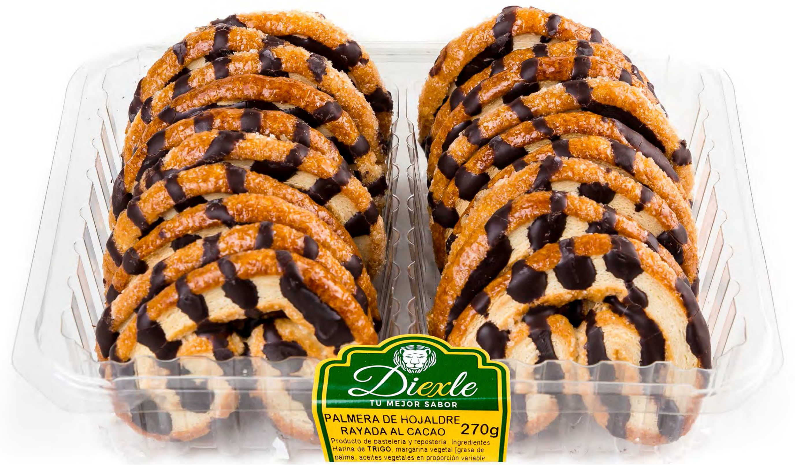
Cod. 018010 - Blíster Palmera Rayada 8 und/caja