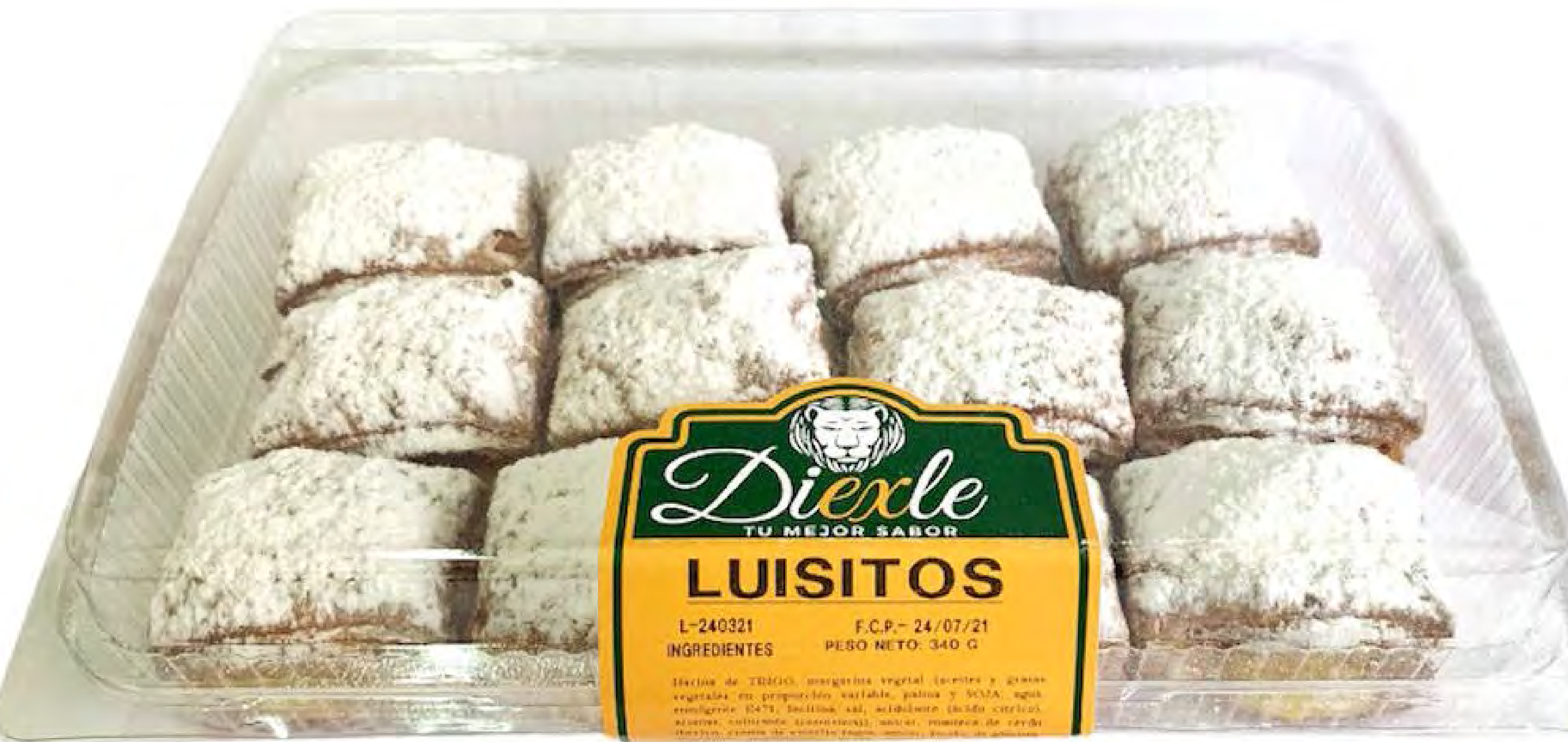
Cod. 216004 - Luisitos Crema 8 uds/caja