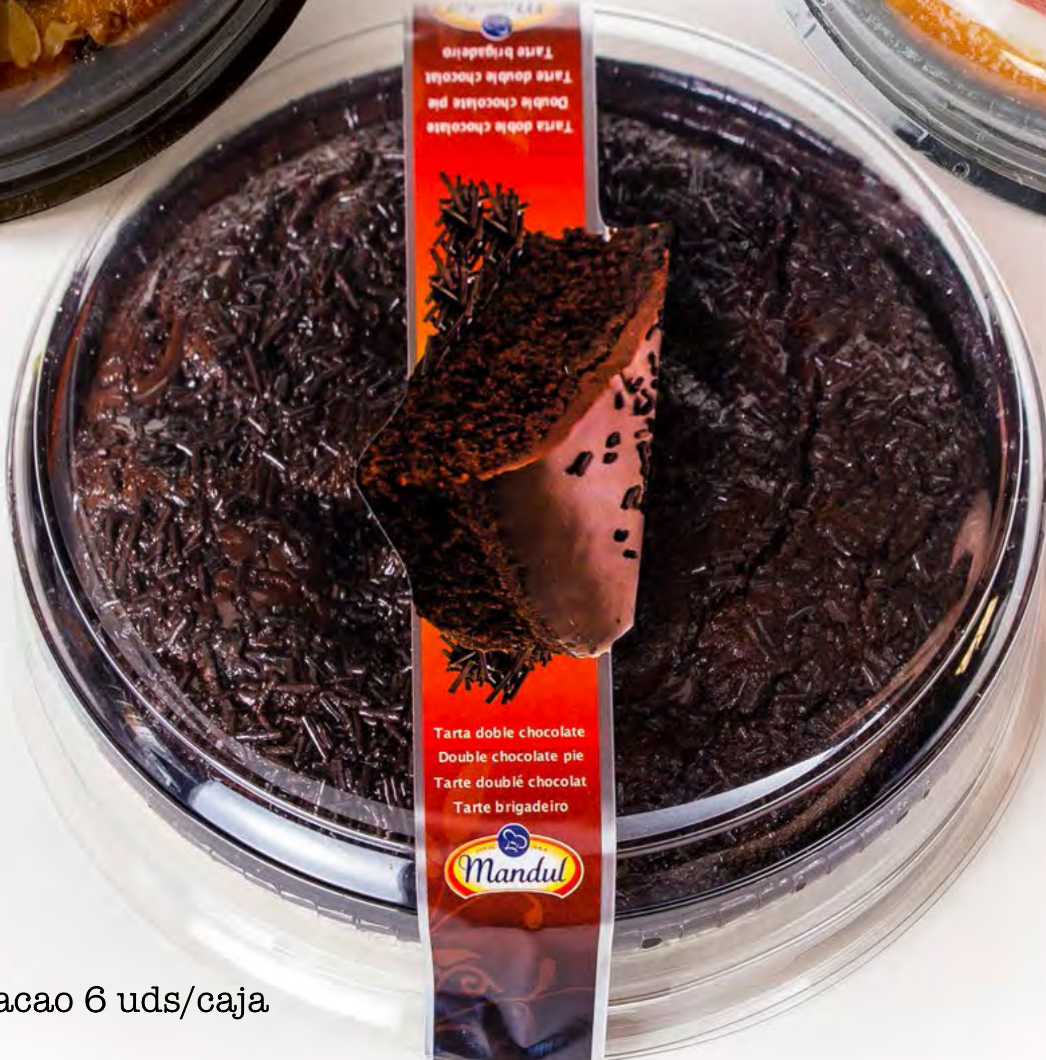
Tartas Cacao 6 uds/caja