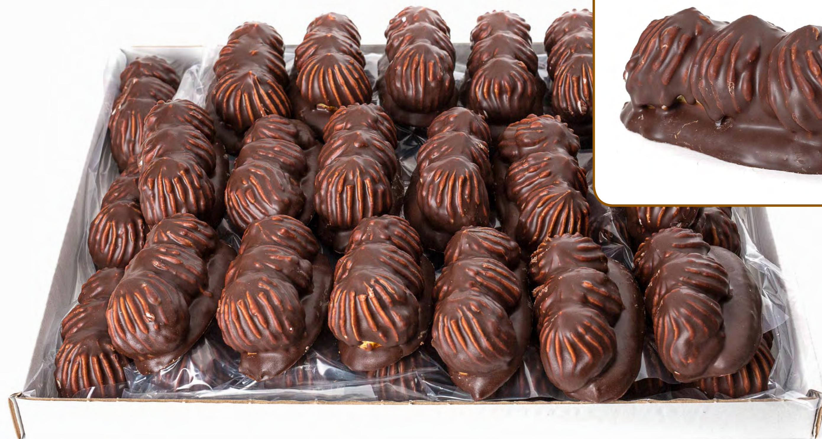
Crestas Rell. Nata 2 Kg.