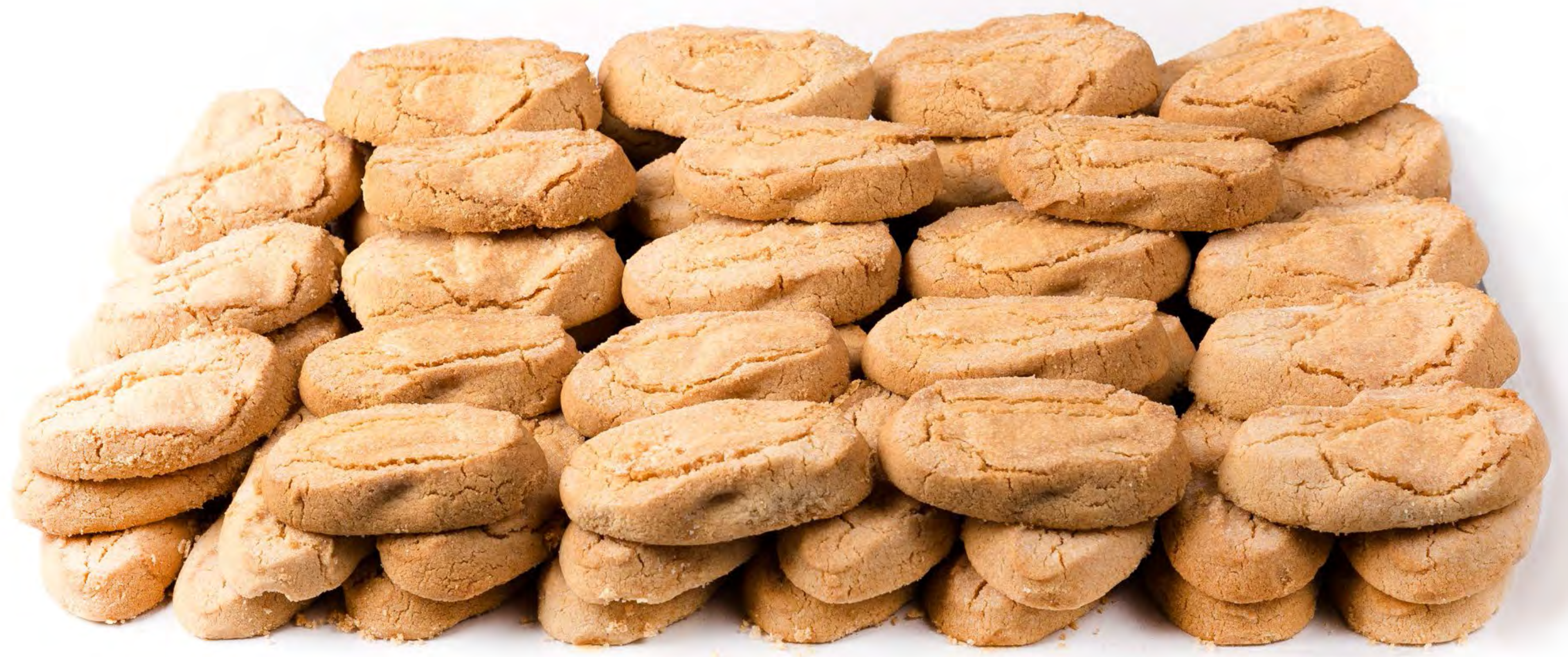
Cod. 071001 Perrunillas Pueblo 3Kg.