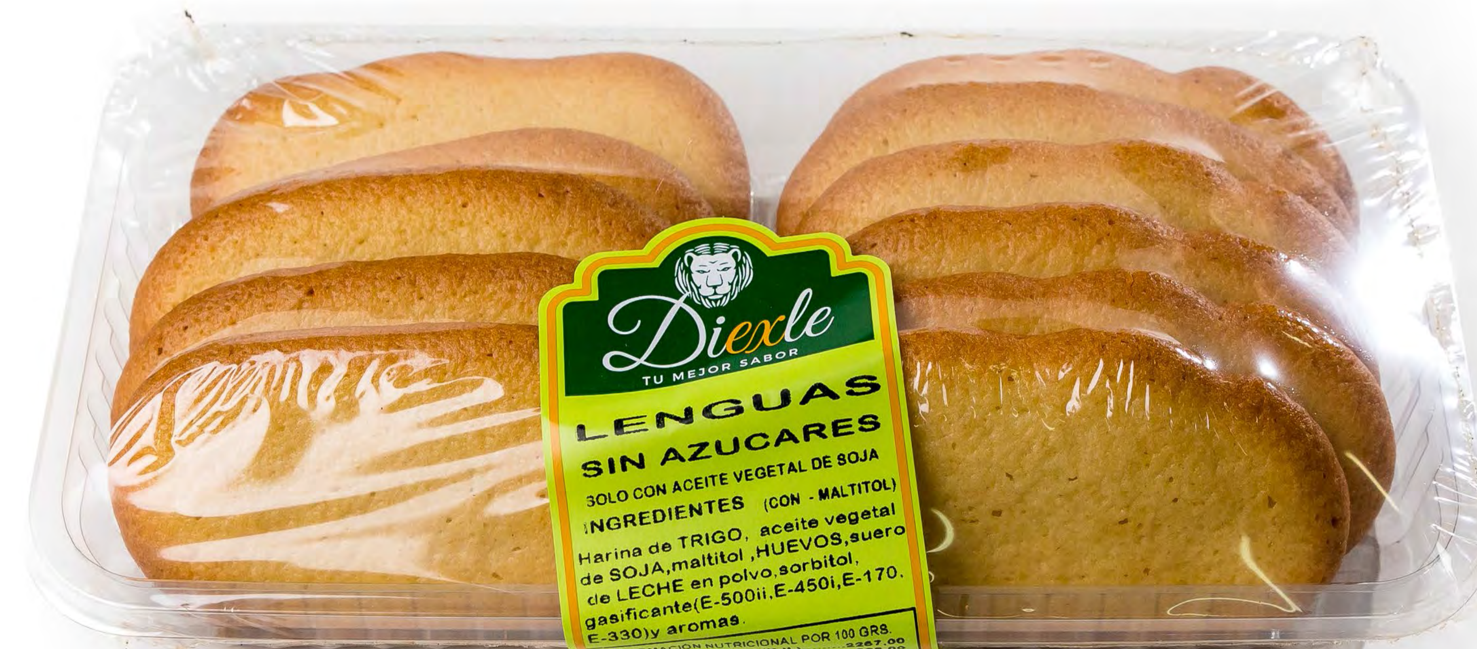
Cod. 055008 - Bodega Lenguas Sin Azucar 16 uds/caja