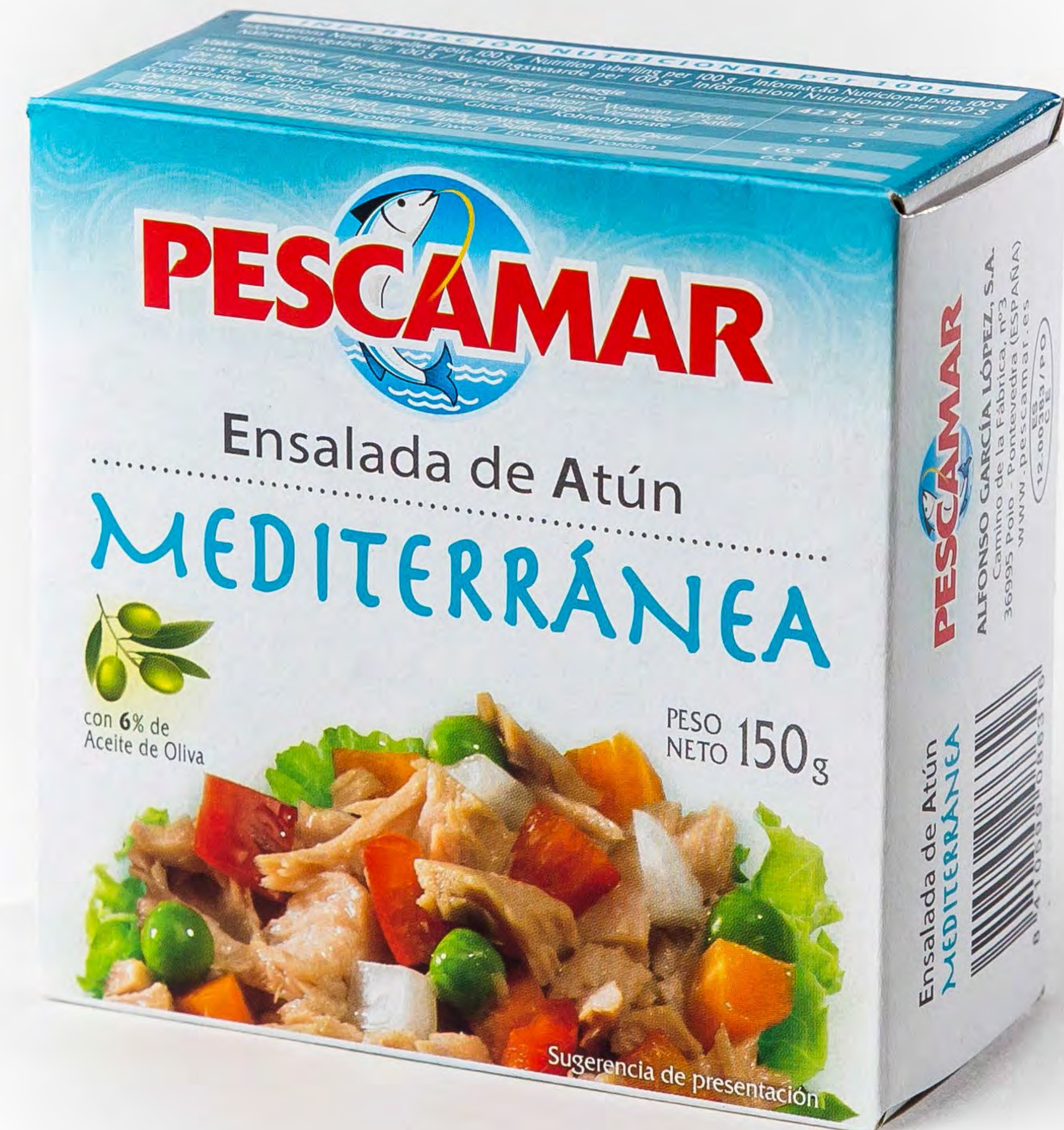
Cod. 188082 Ensalada Mediterránea 24 und/caja