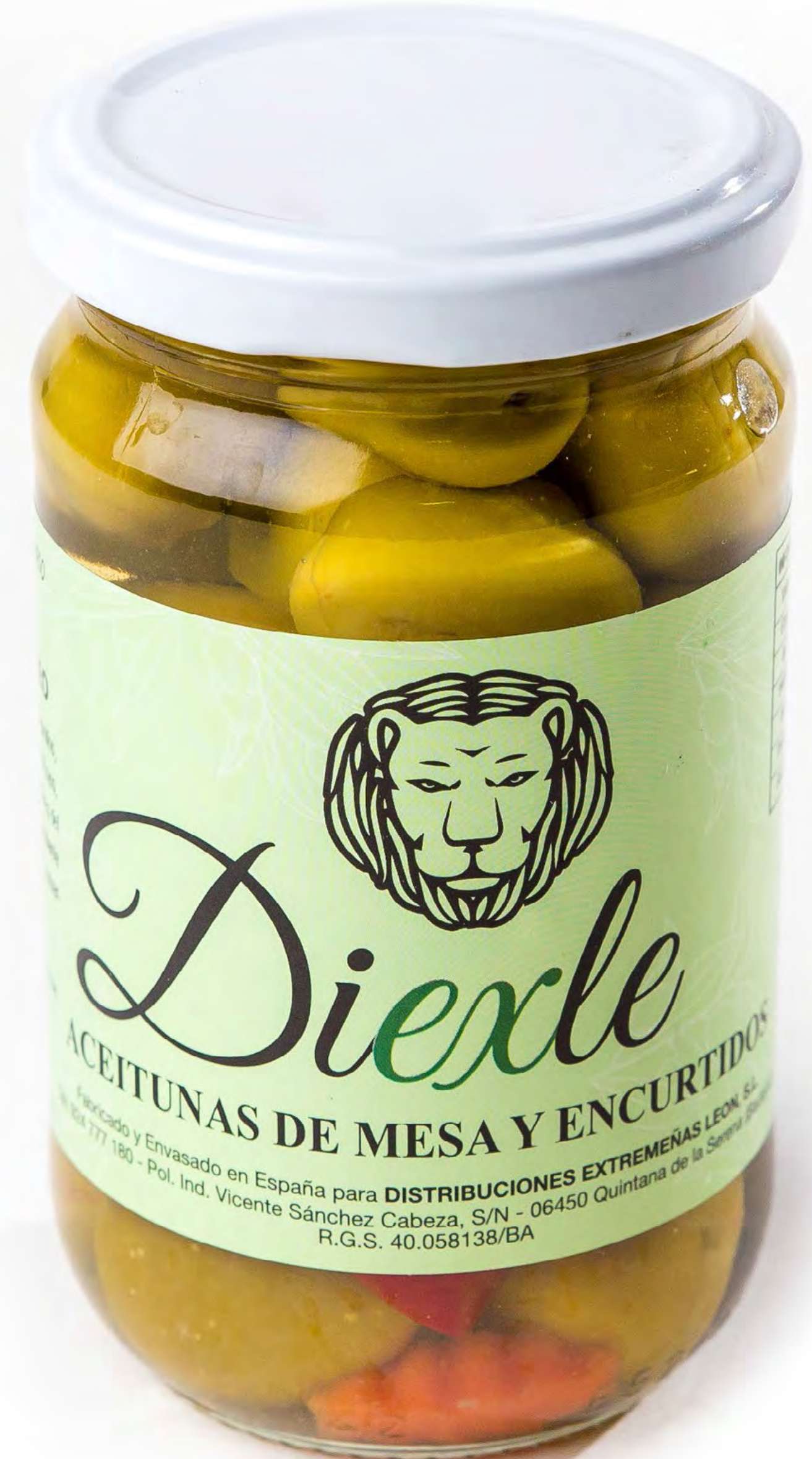
Cod. 185016 Revuelto Mediterránea 12 uds/caja