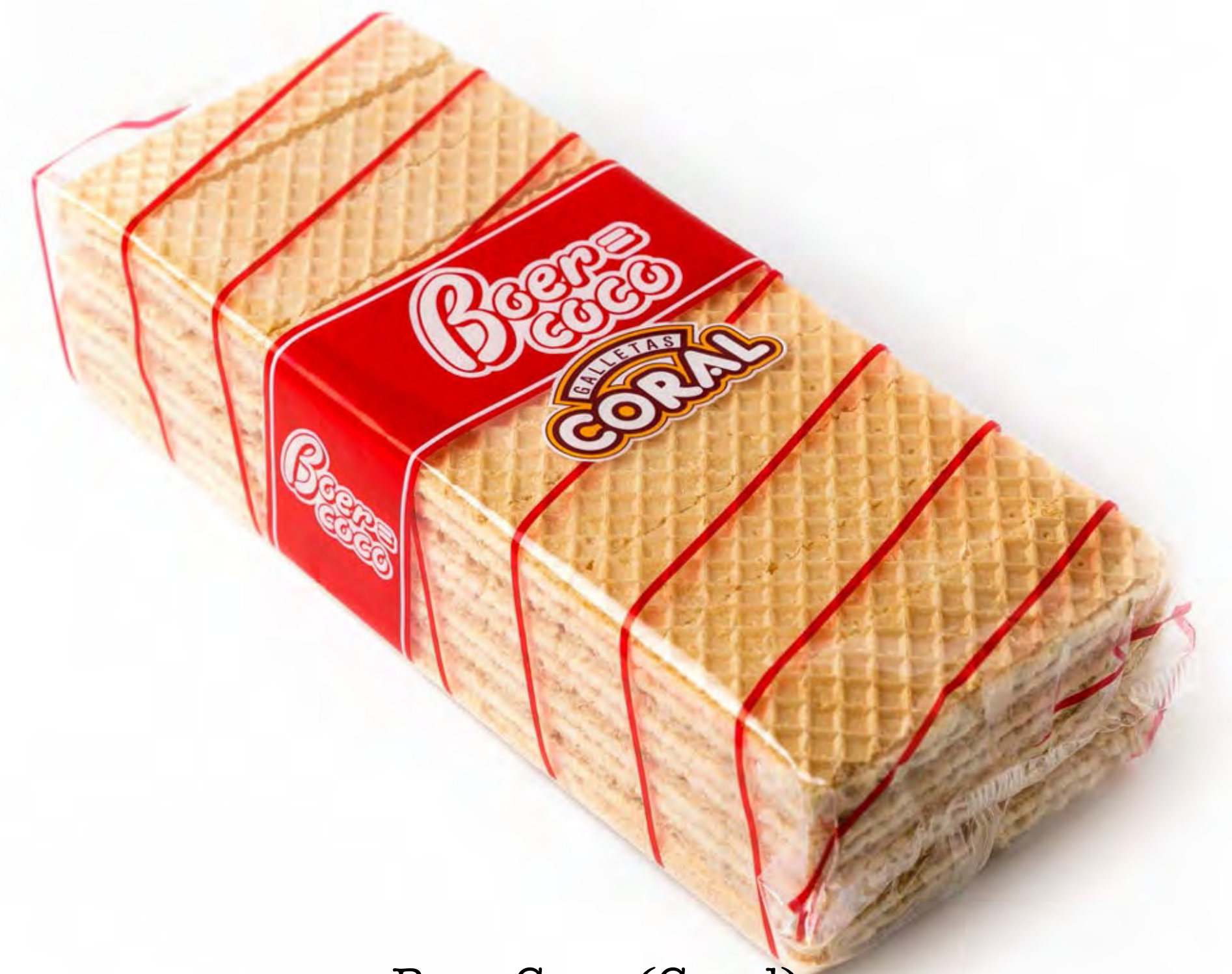
Boer Coco (Coral) 450g. x 12 uds/caja