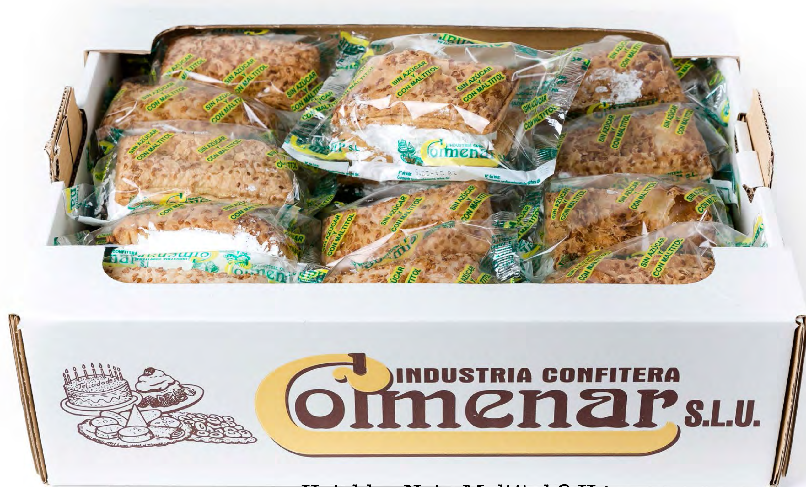
Hojaldre Nata Maltitol 2 Kg.