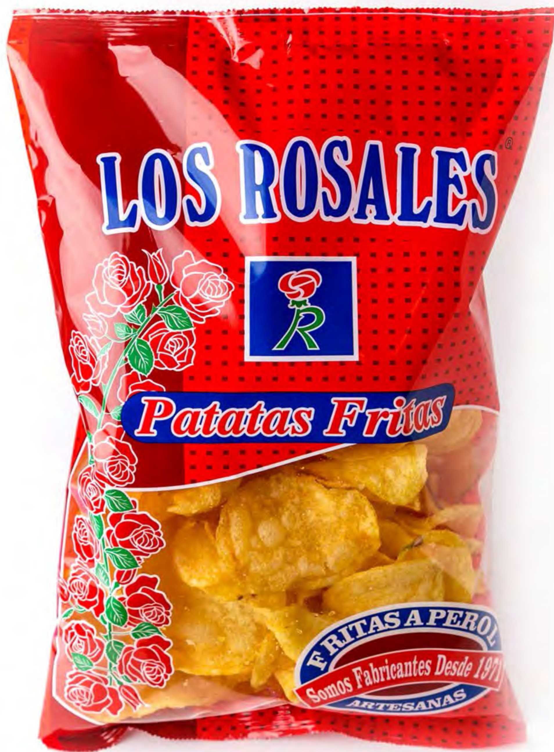
Cod.002001 Patatas Fritas 150g. x 12 uds/caja