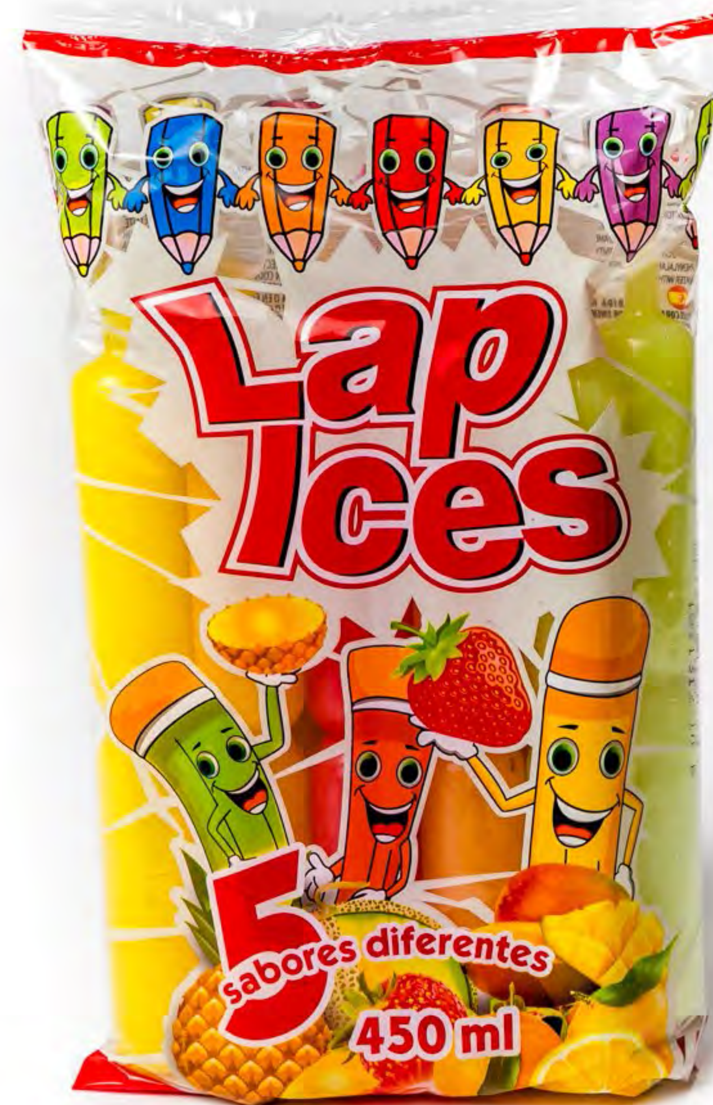
Polos Yogoice 16 uds/caja