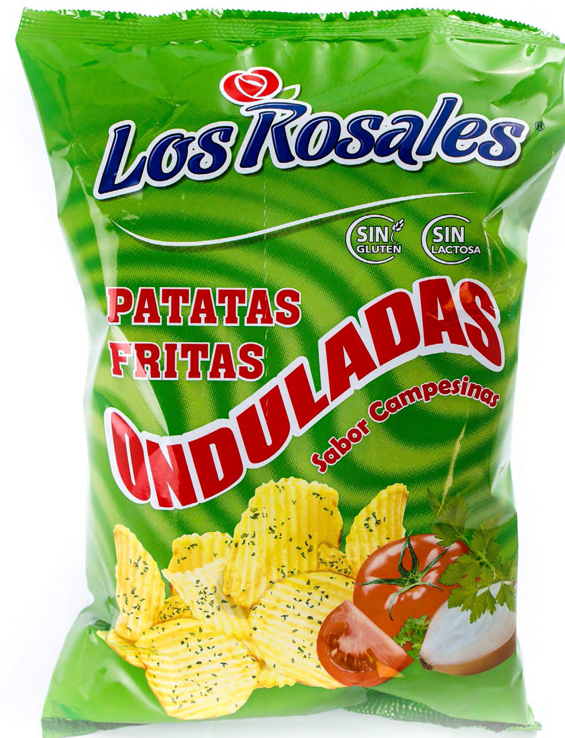
Patatas Onduladas Campesinas Sabor Jamón 140 g. x 12 uds/caja