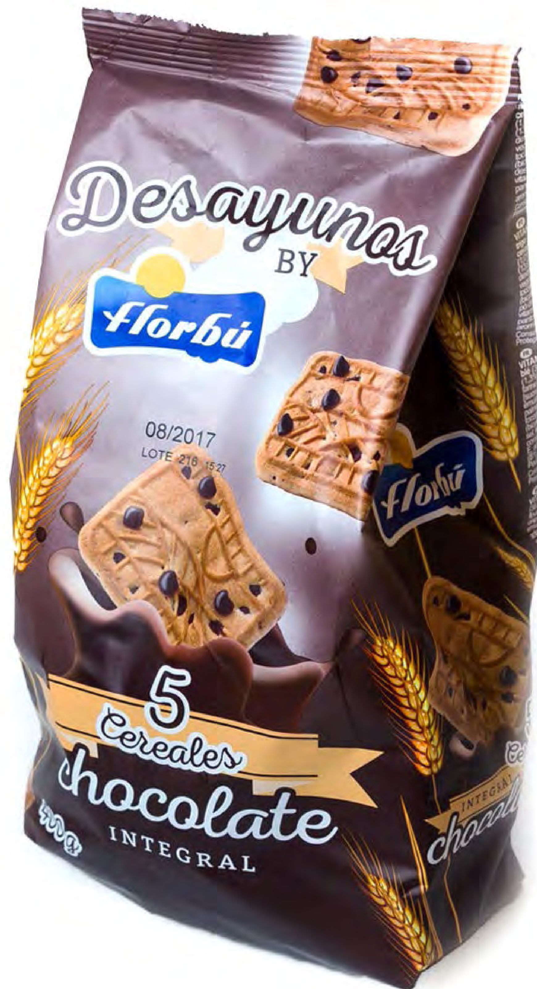
Desayunos 5 Cereales Choco 6 uds/caja