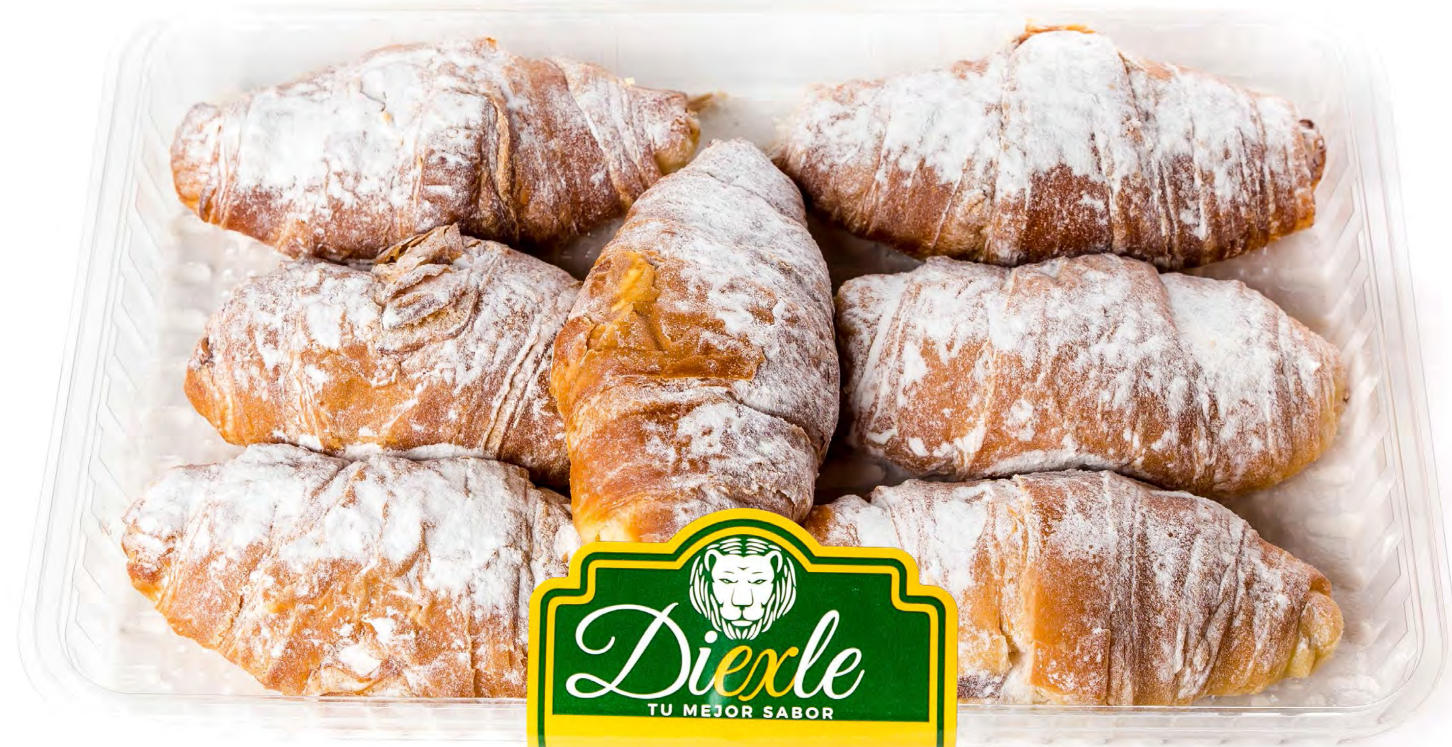
Croissant bombón v10 und/caja