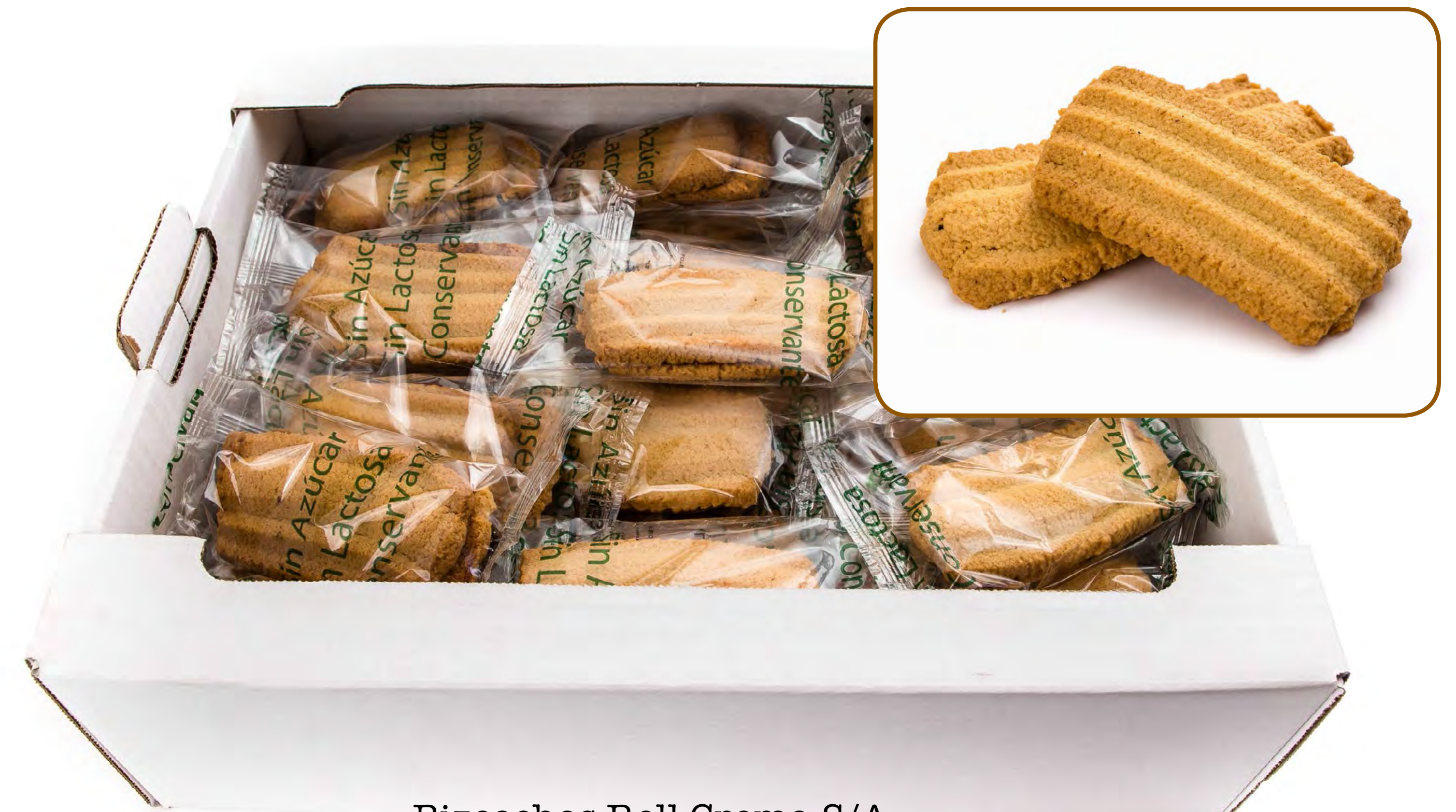
Biscochos Rell Crema S/A Maltitol Sin Lactosa 2 Kg.