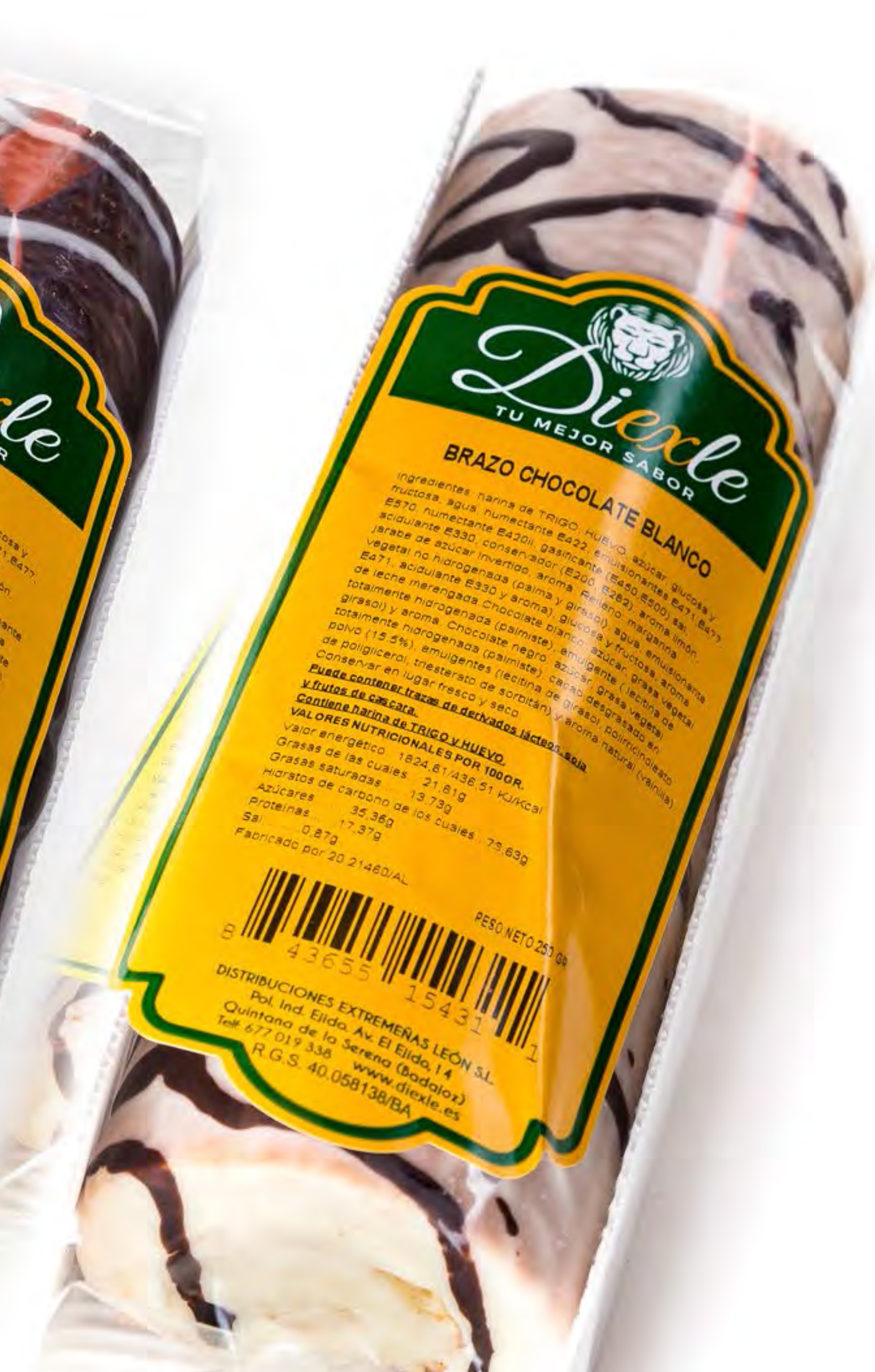
Brazo de Chocolate Blanco 10 uds/caja