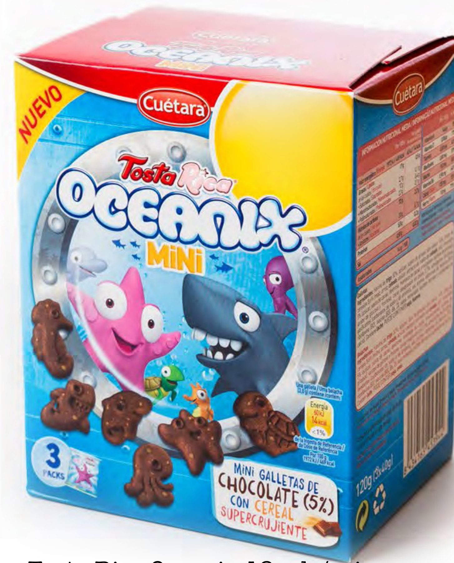
Tosta Rica Oceanix 12 uds/caja