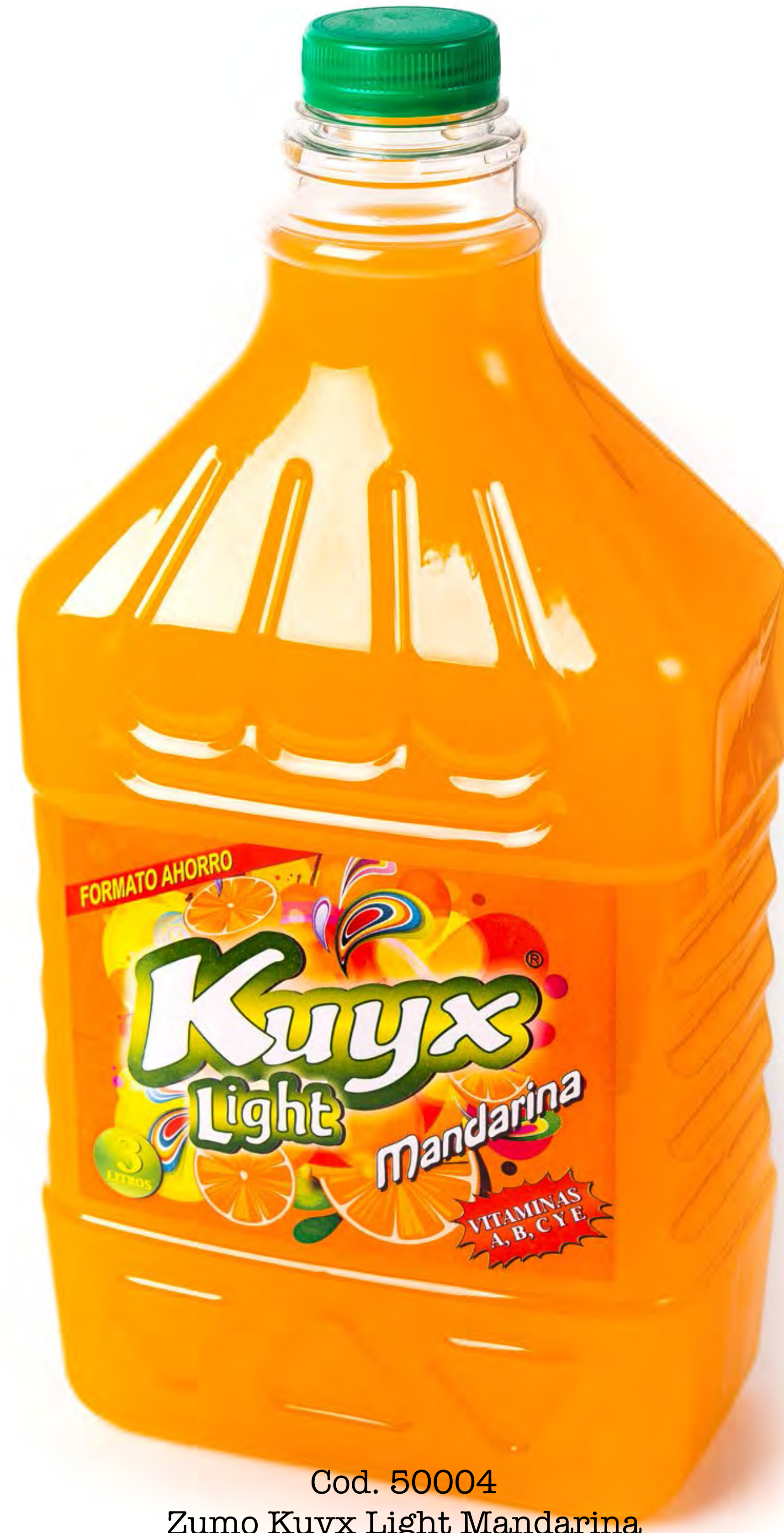
Cod. 50004 Zumo Kuyx Light Mandarina 3L x 4 uds/caja