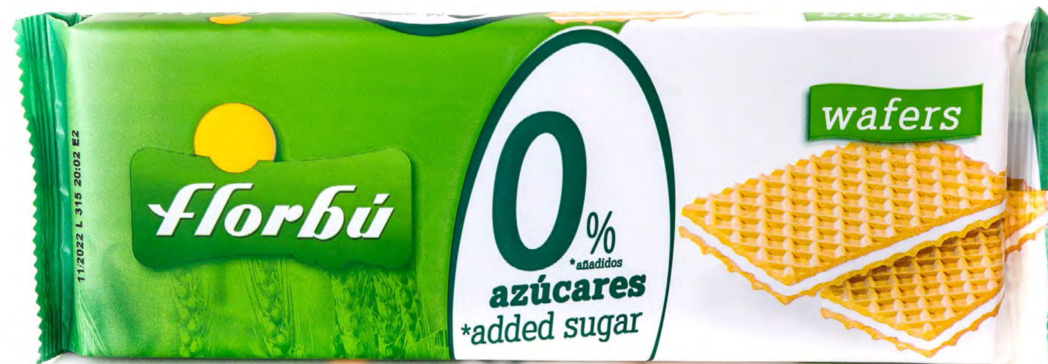
Barquillo Coco S/A 26 uds/caja Cod: 003007