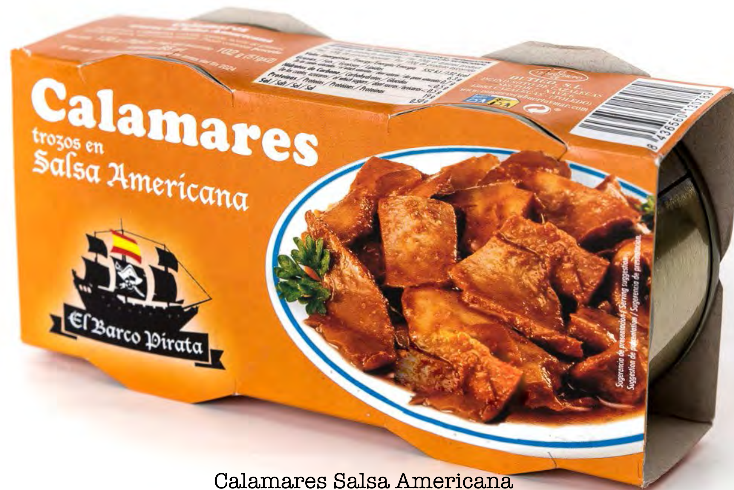
Calamares Salsa Americana