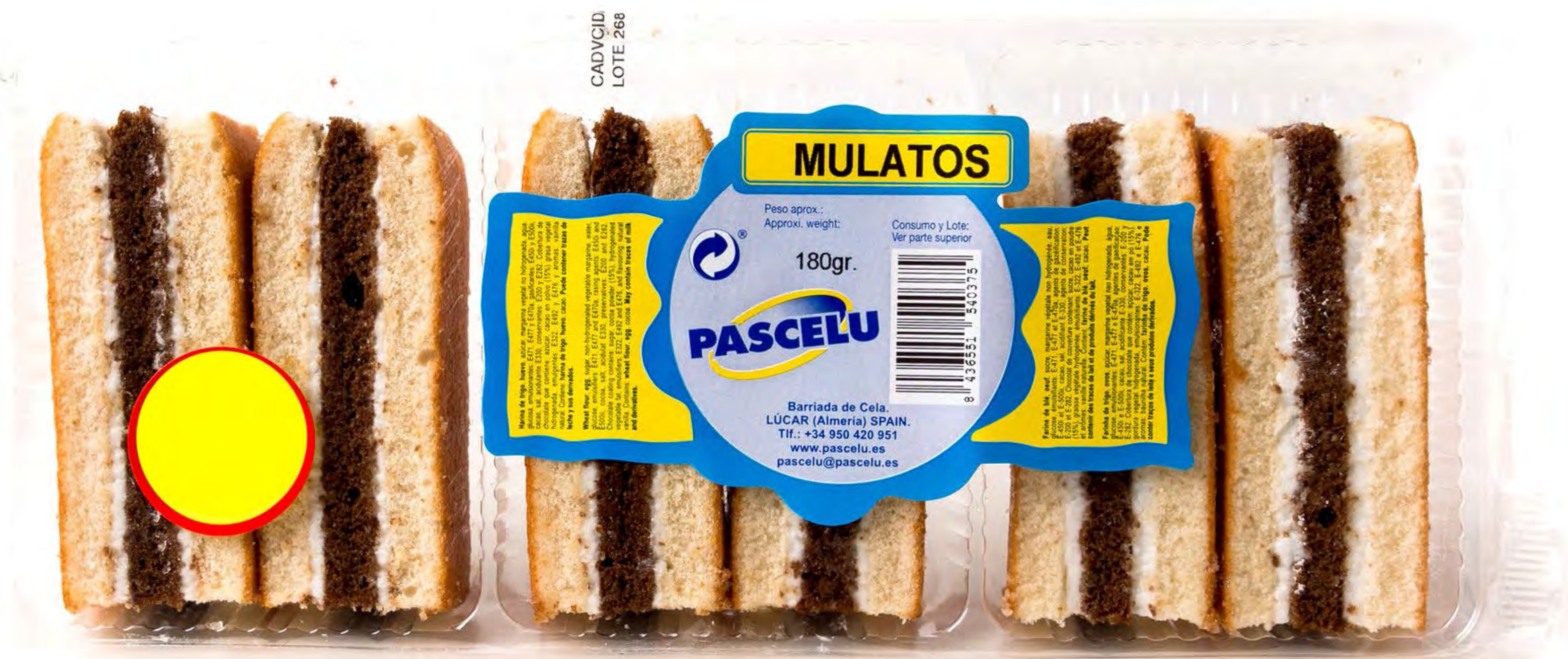
Mulatos 17 uds/caja