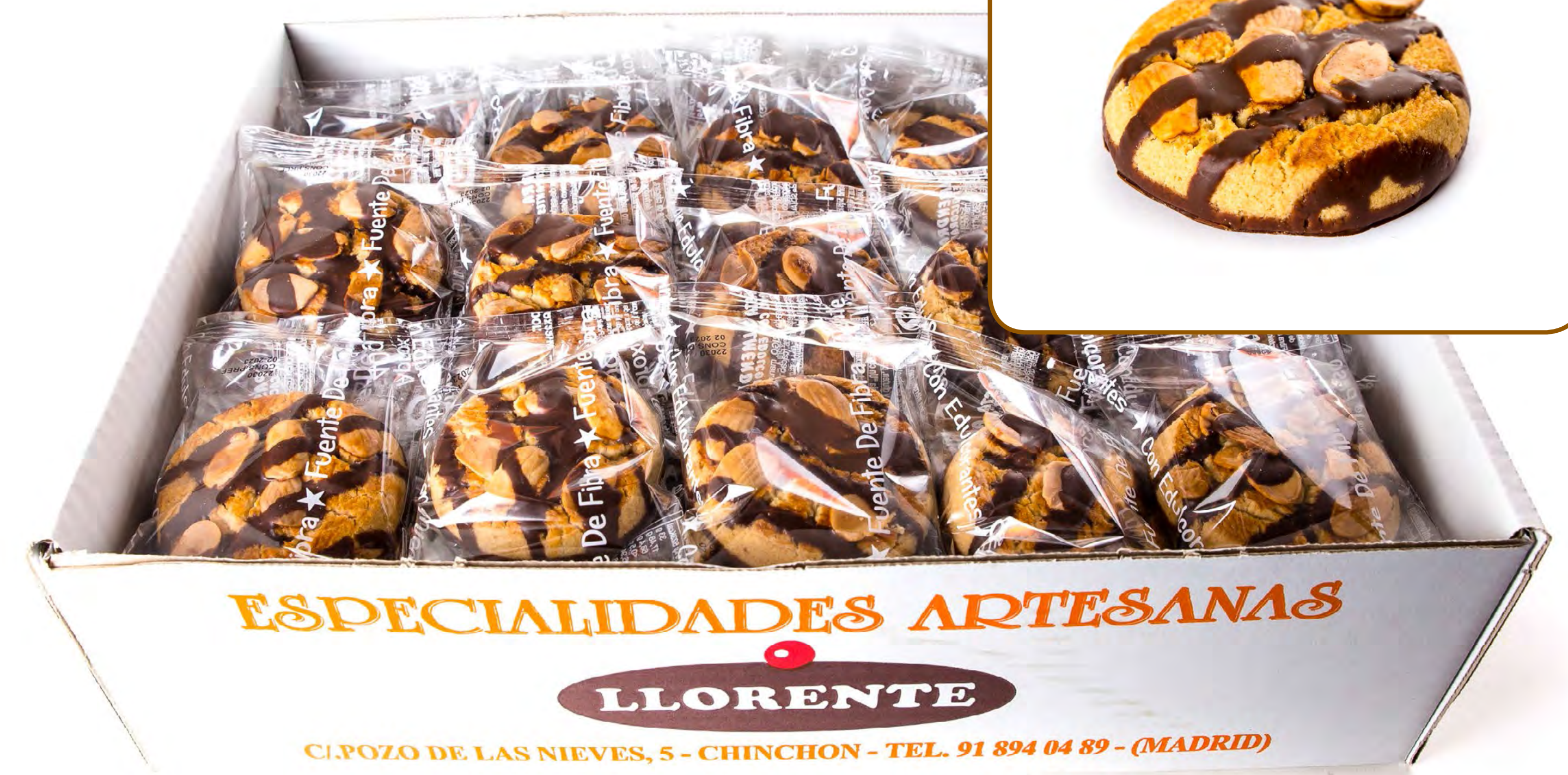
Cod. 006006 Pasta Almendra Choco S/A 2,750kg.