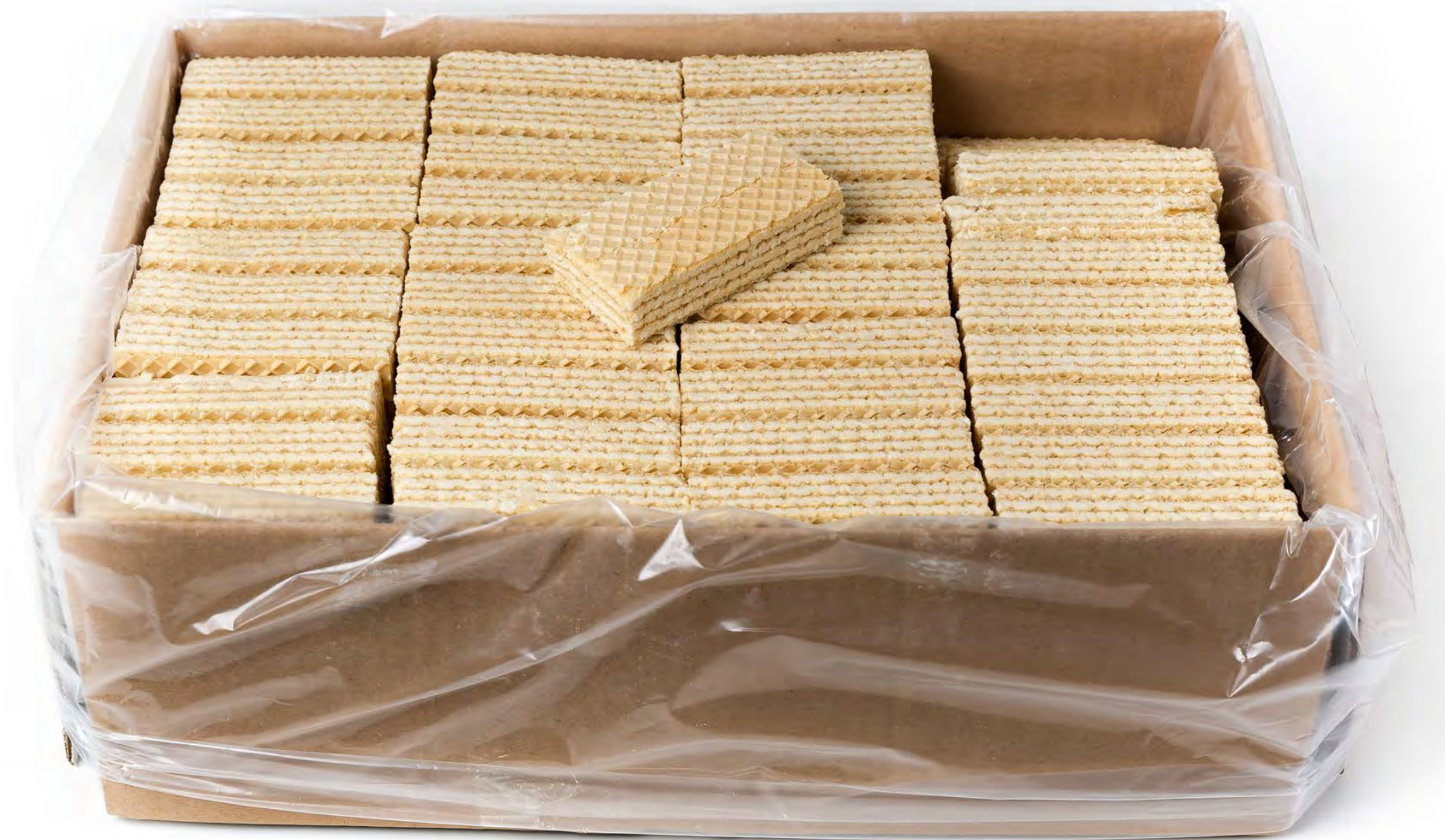
Galleta Coco 5 Kg.