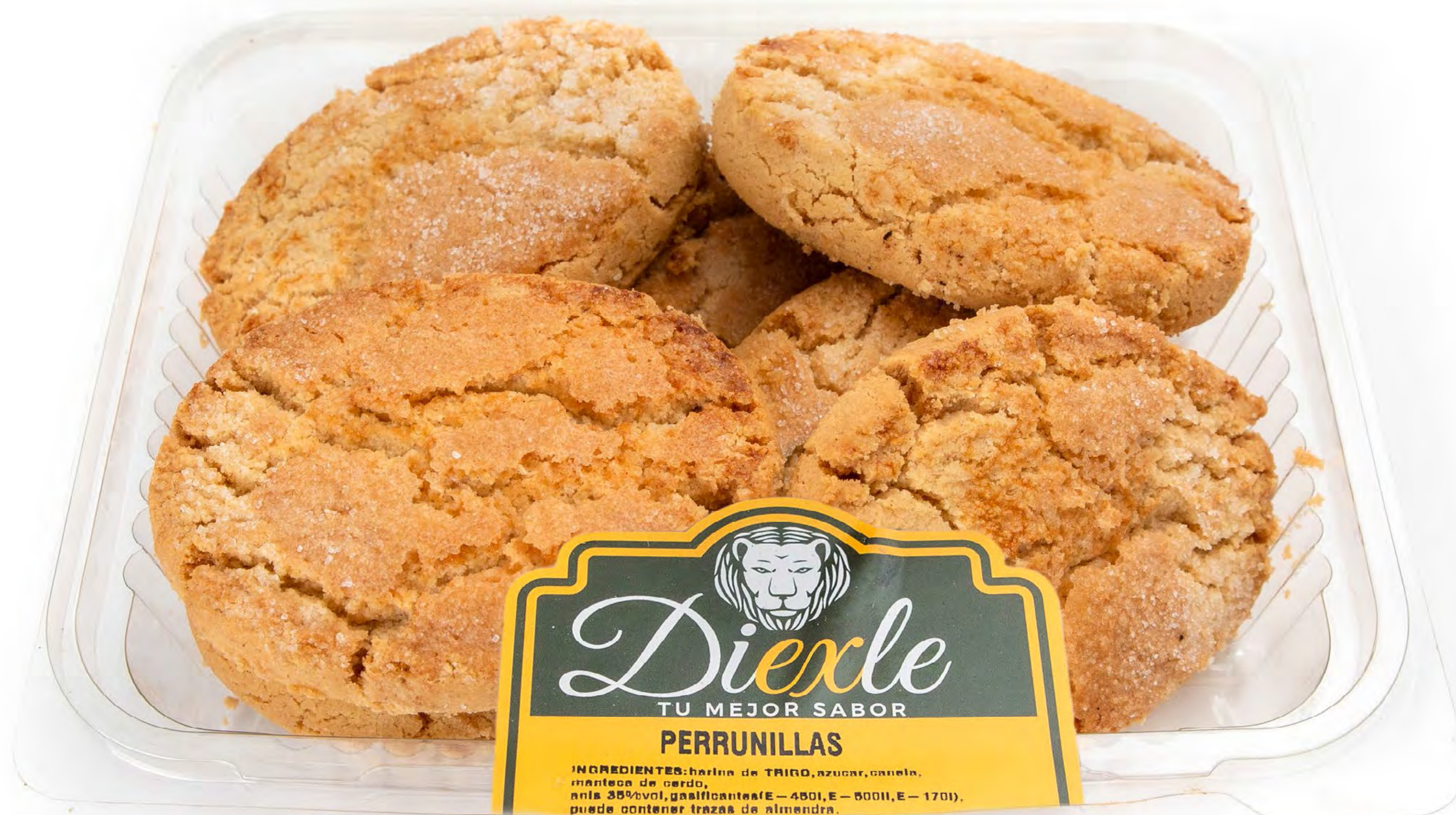
Perrunillas 10 uds/caja