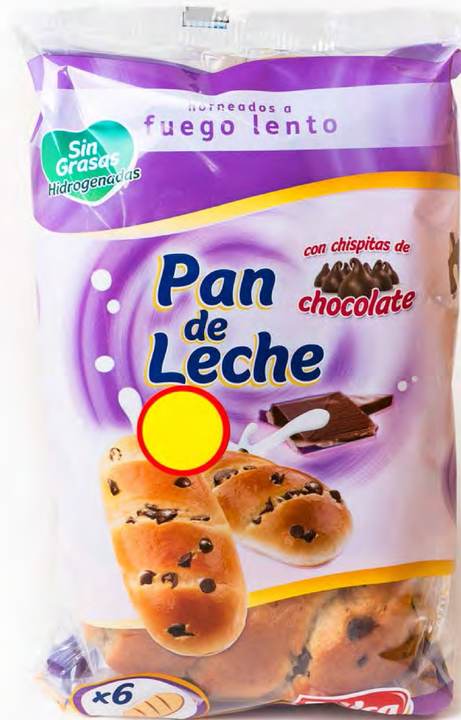
Pan Chispitas Choco 14 uds/caja