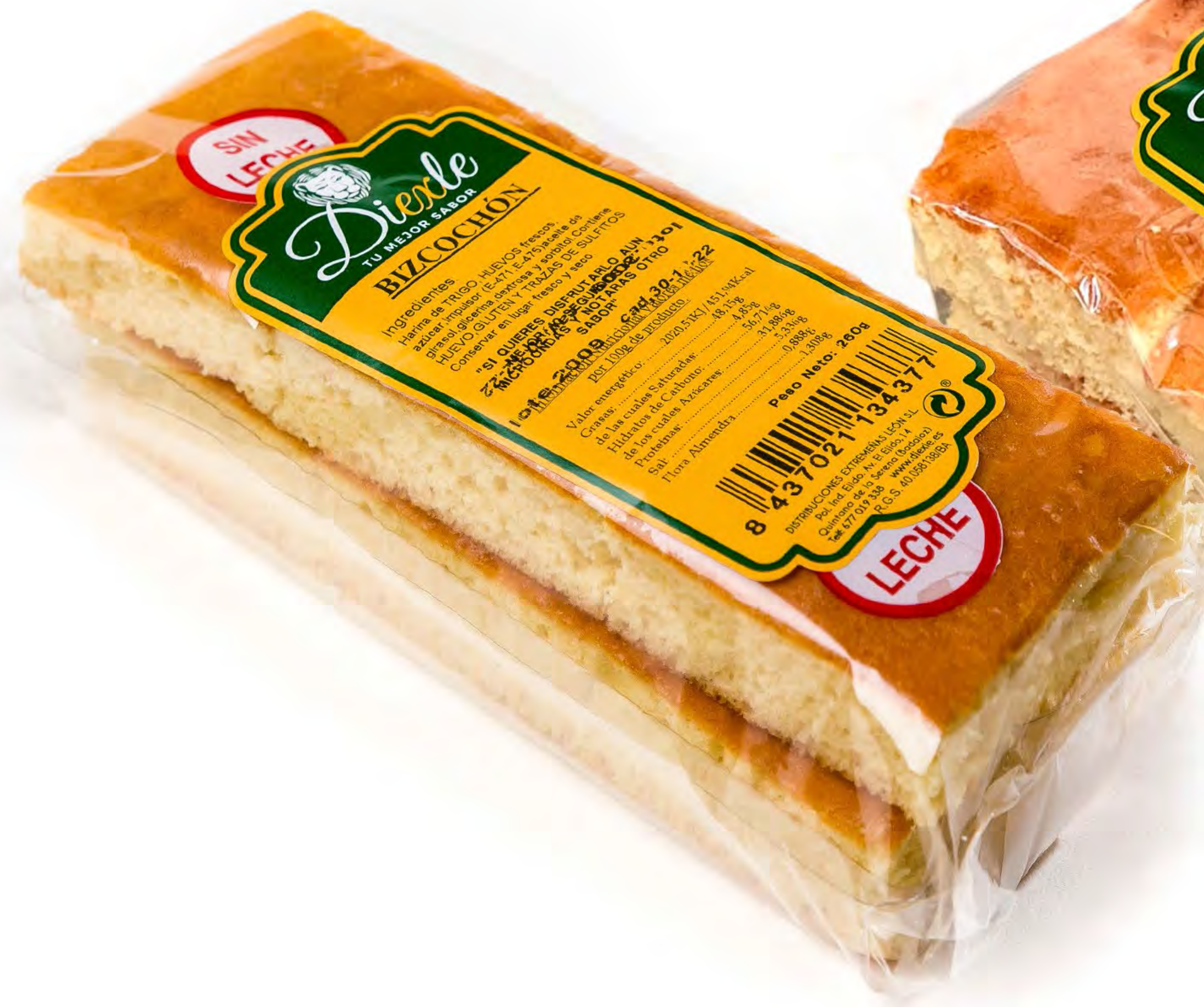
Cod. 242001 Bizcochón Artesano Diexle 260g. 6 und/caja