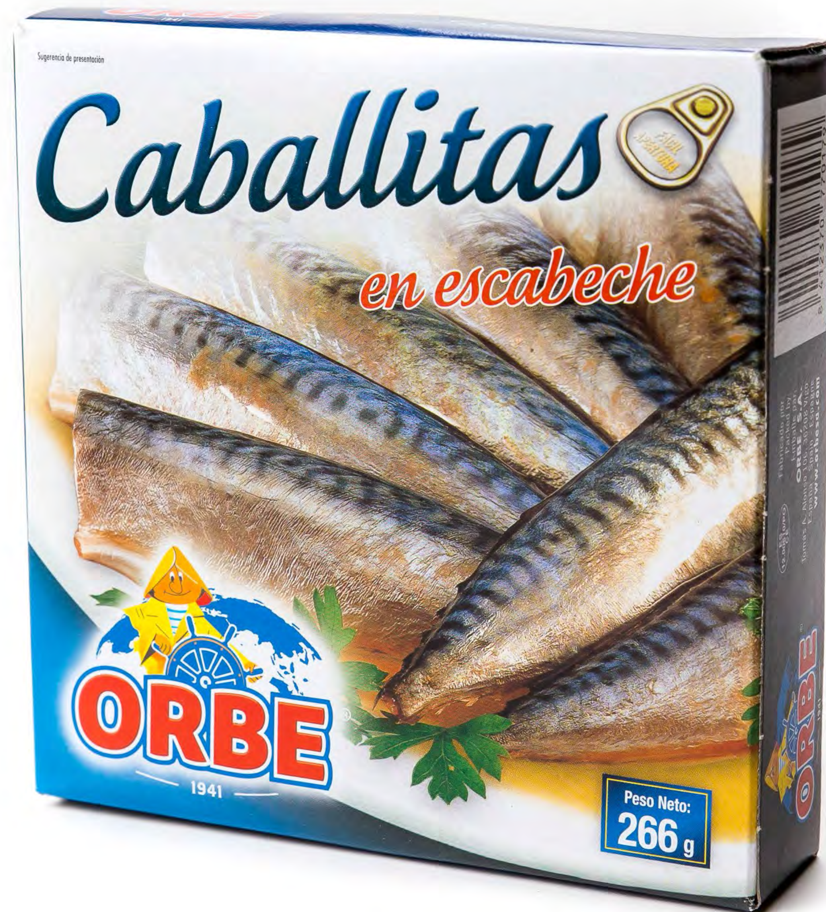
256004 - Caballa en Escabeche 12 uds/caja