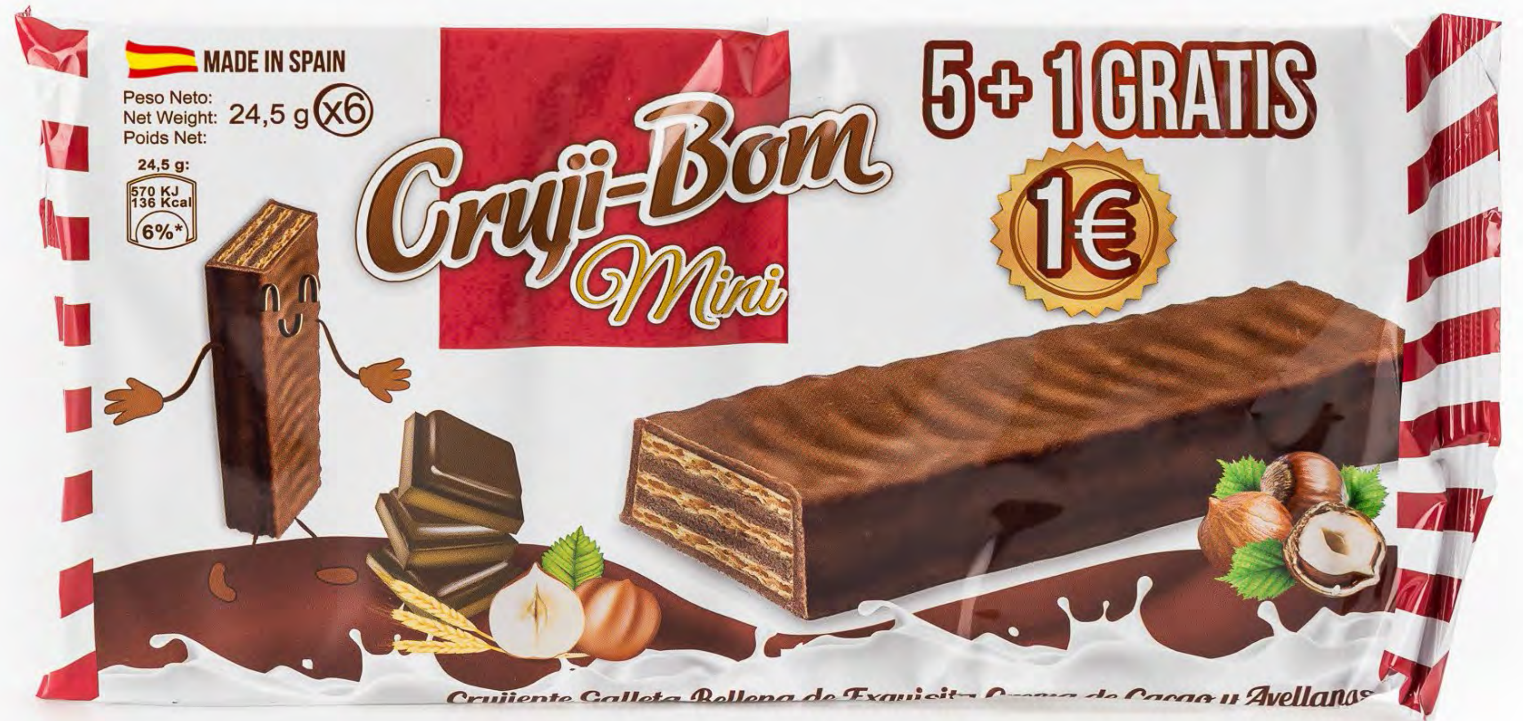
Cruji-Bom Choco 12 uds/caja