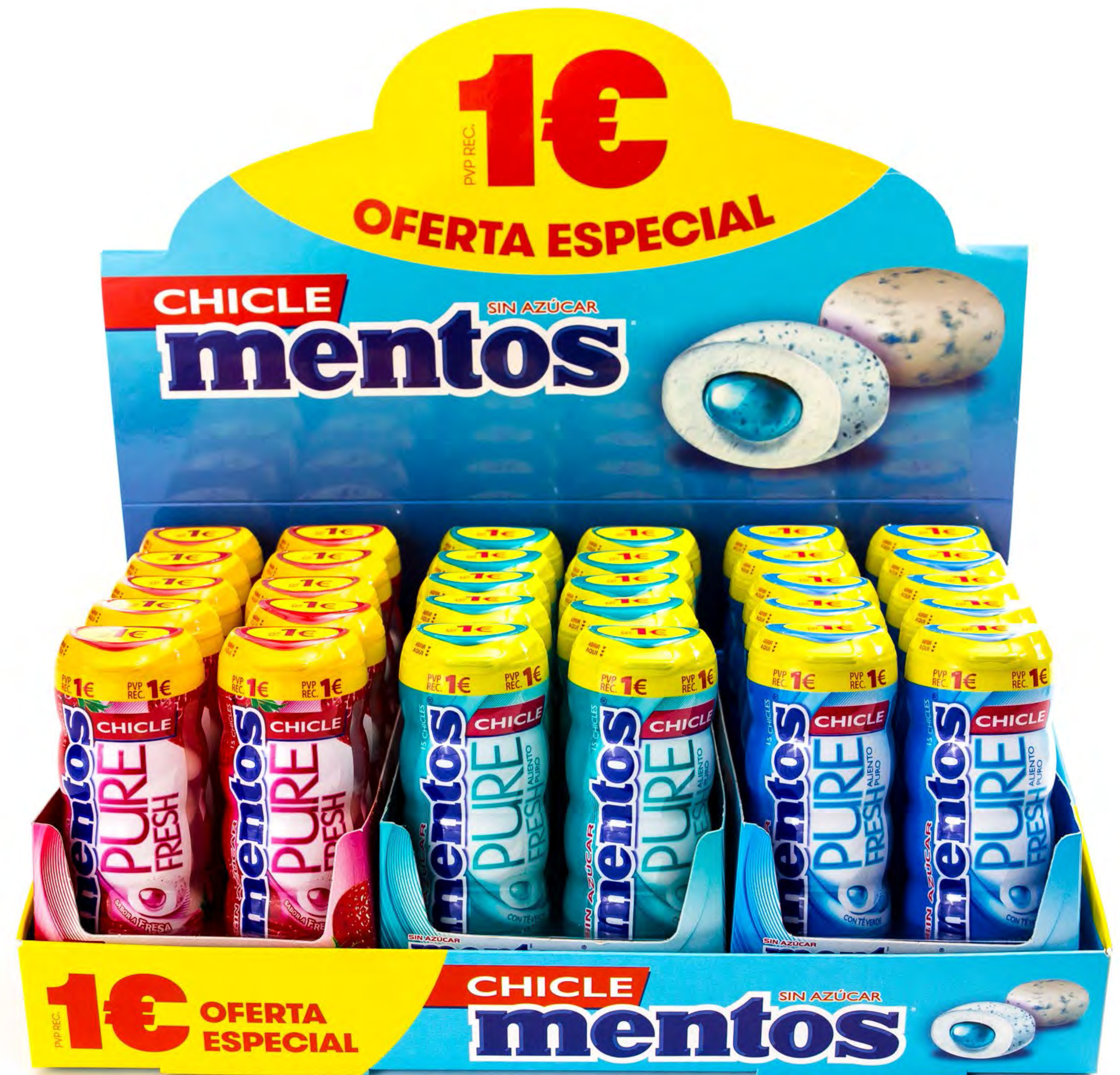
Chicles Mentos 10 uds/caja