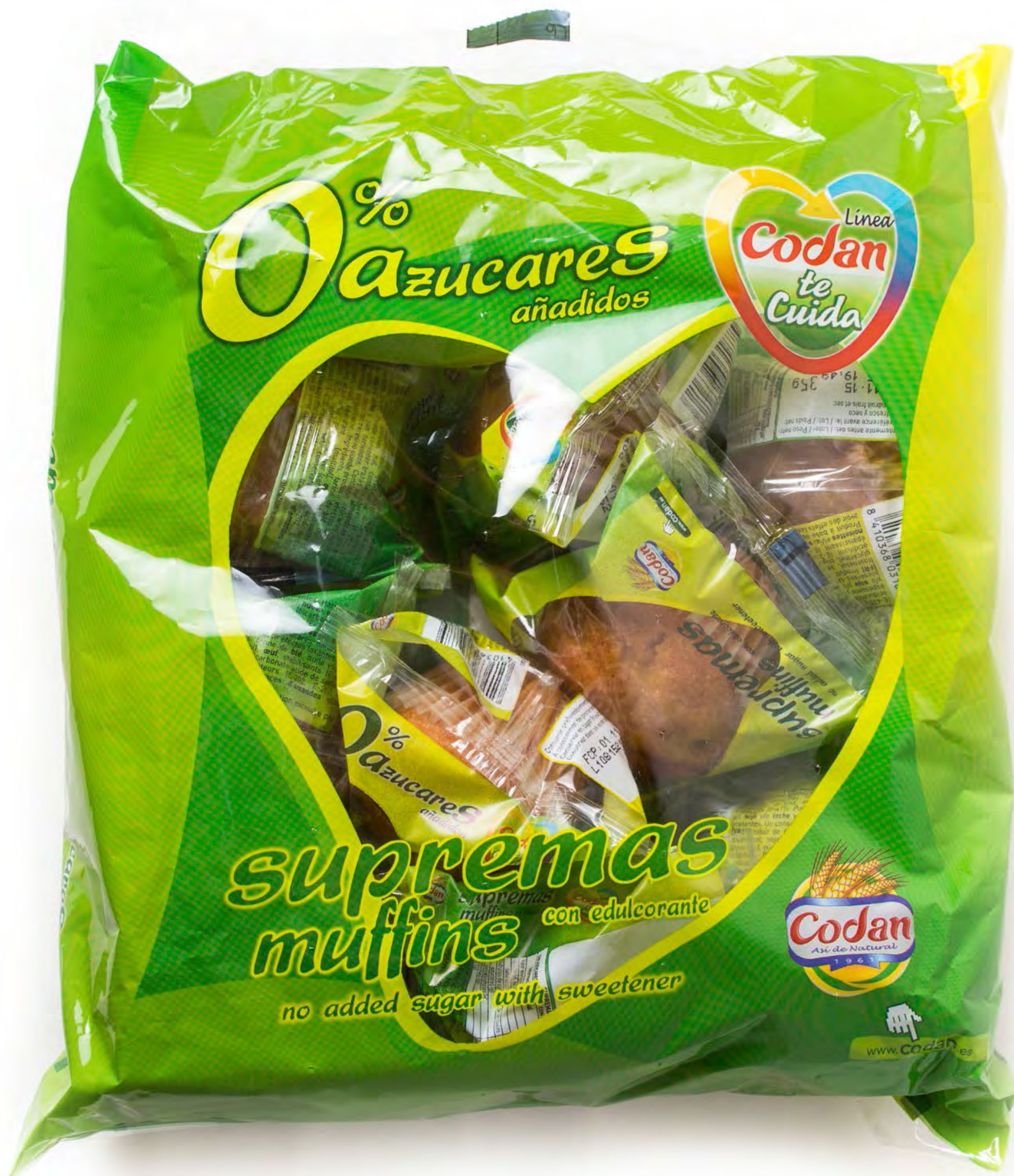
Magdalenas Codan S/A 350g. x 6 uds/caja