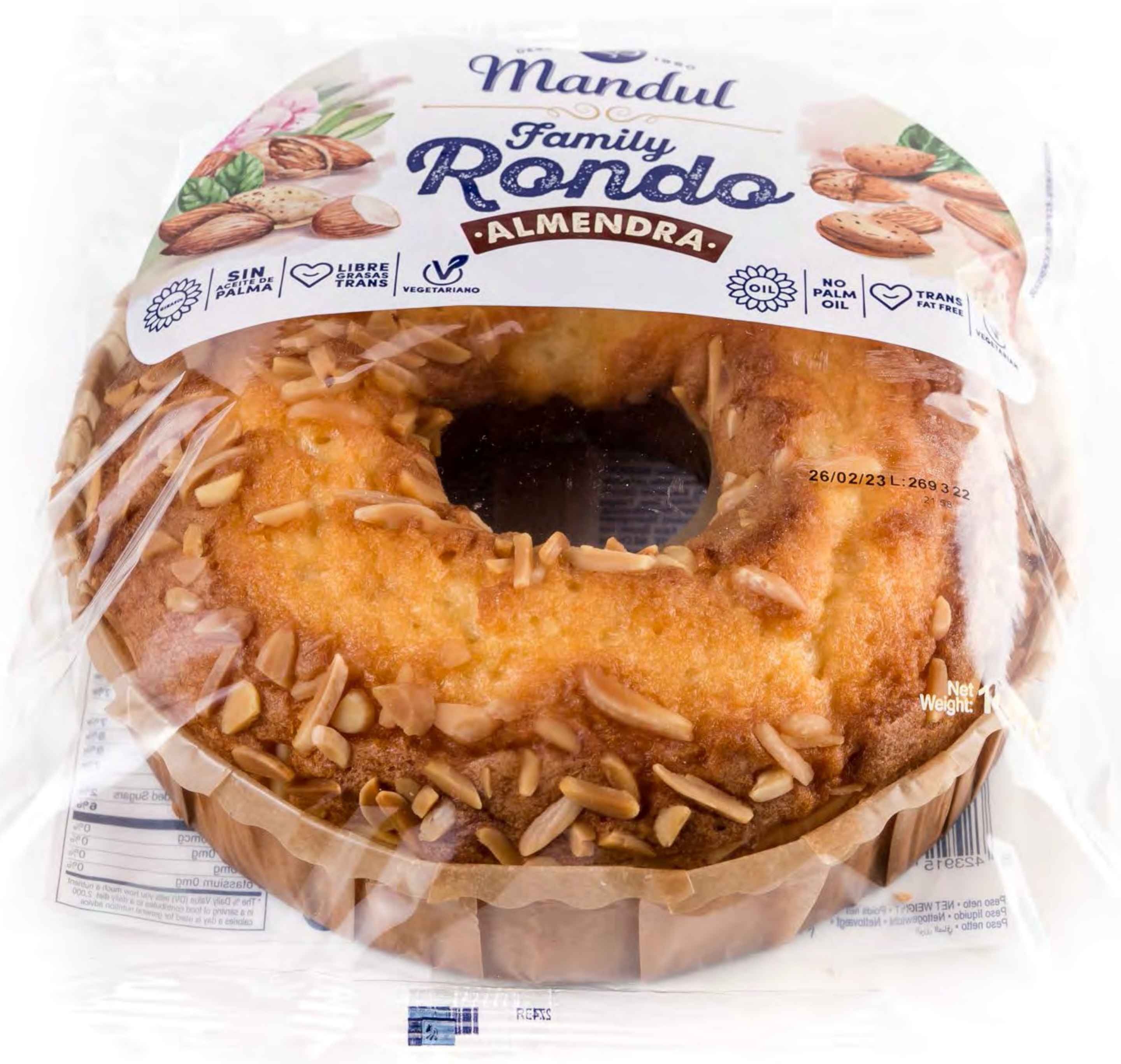
Rondo Almendra Familiar 4 uds/caja