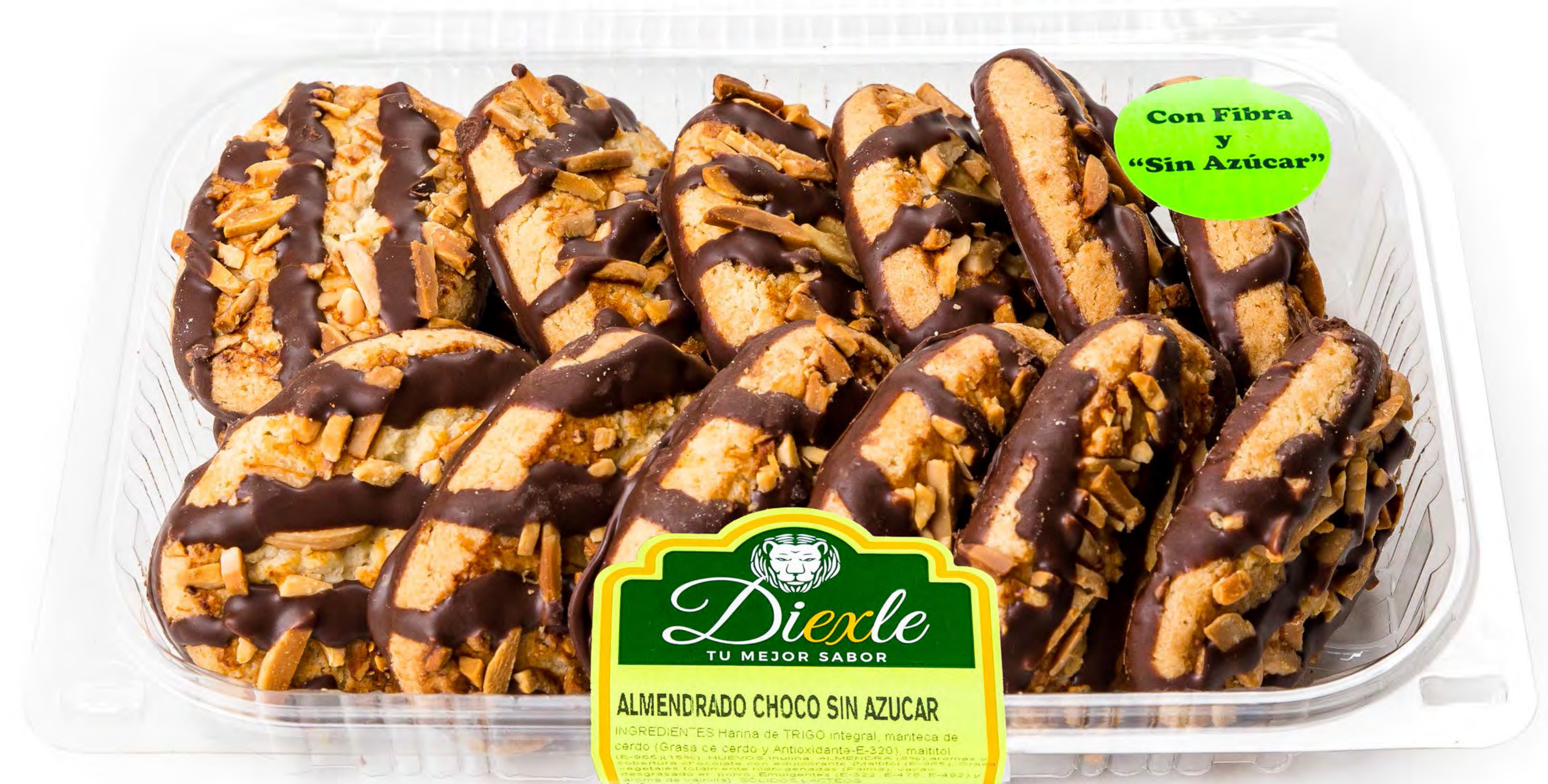
Cod. 258003 - Blister Choco Almendrado S/A 8 uds/caja