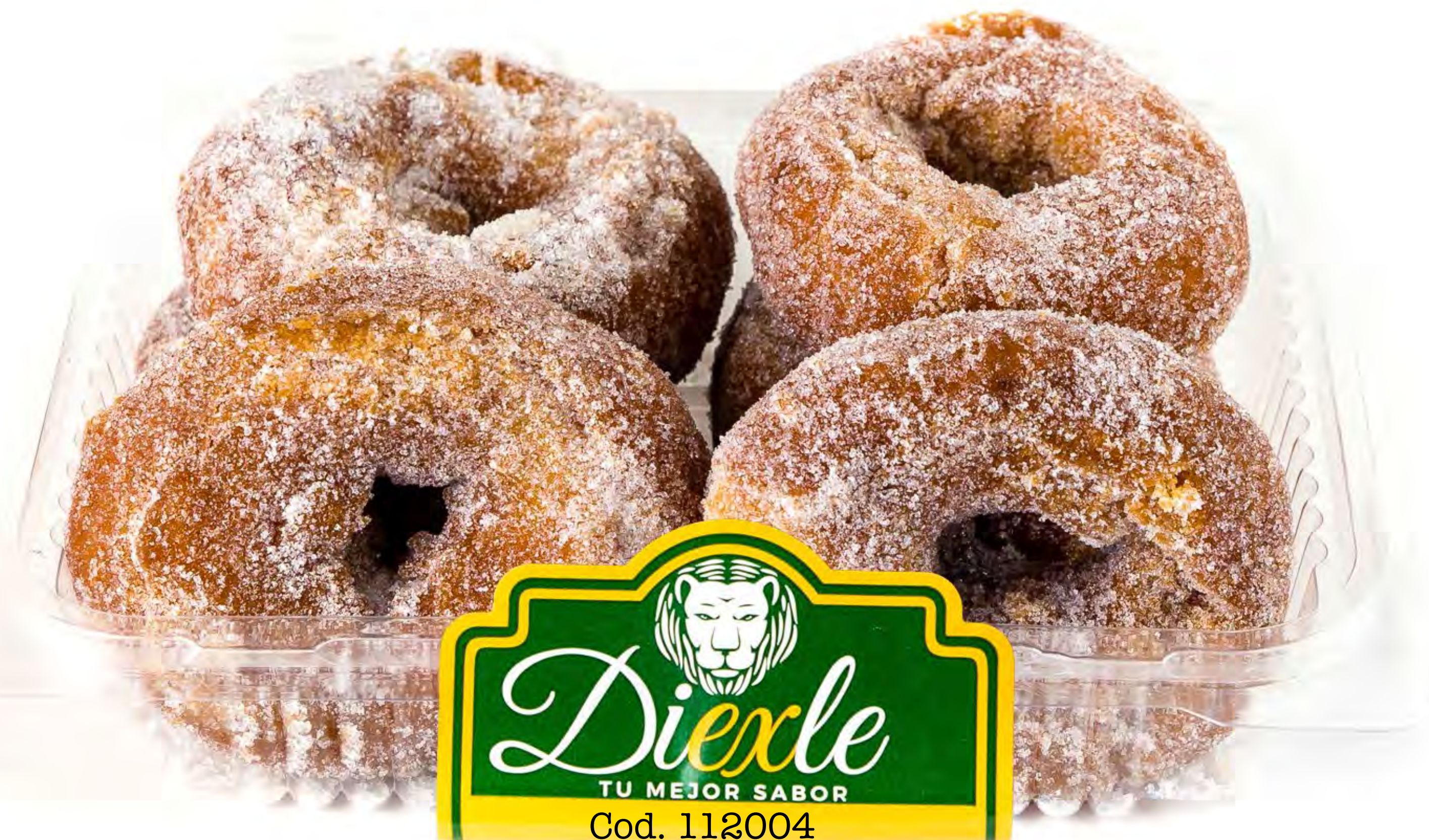
Cod. 112004 Blister Roscas Fritas 480g 8 uds/caja