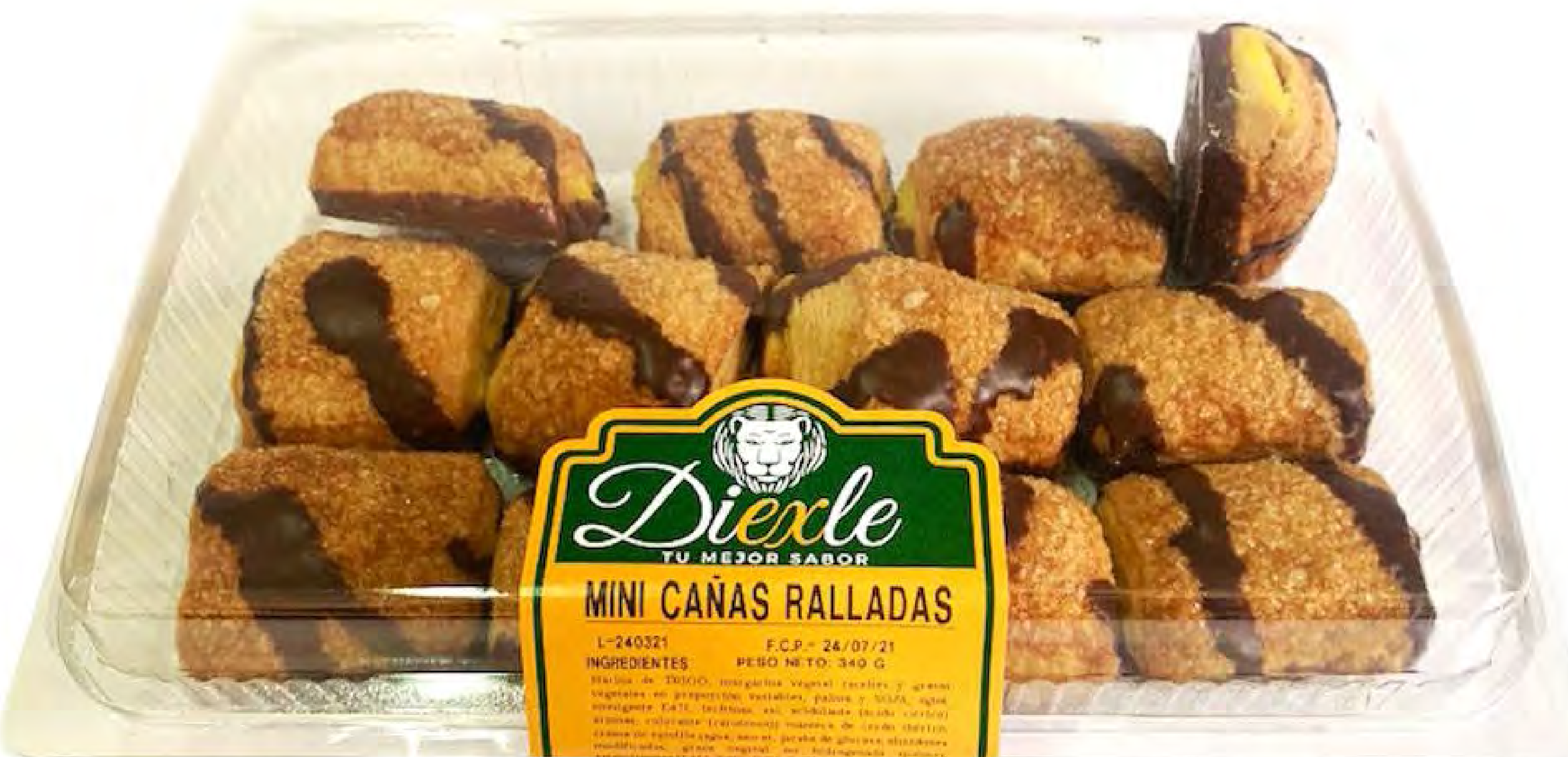
Cod.216002 - Mini Cañas Ralladas 8 uds/caja