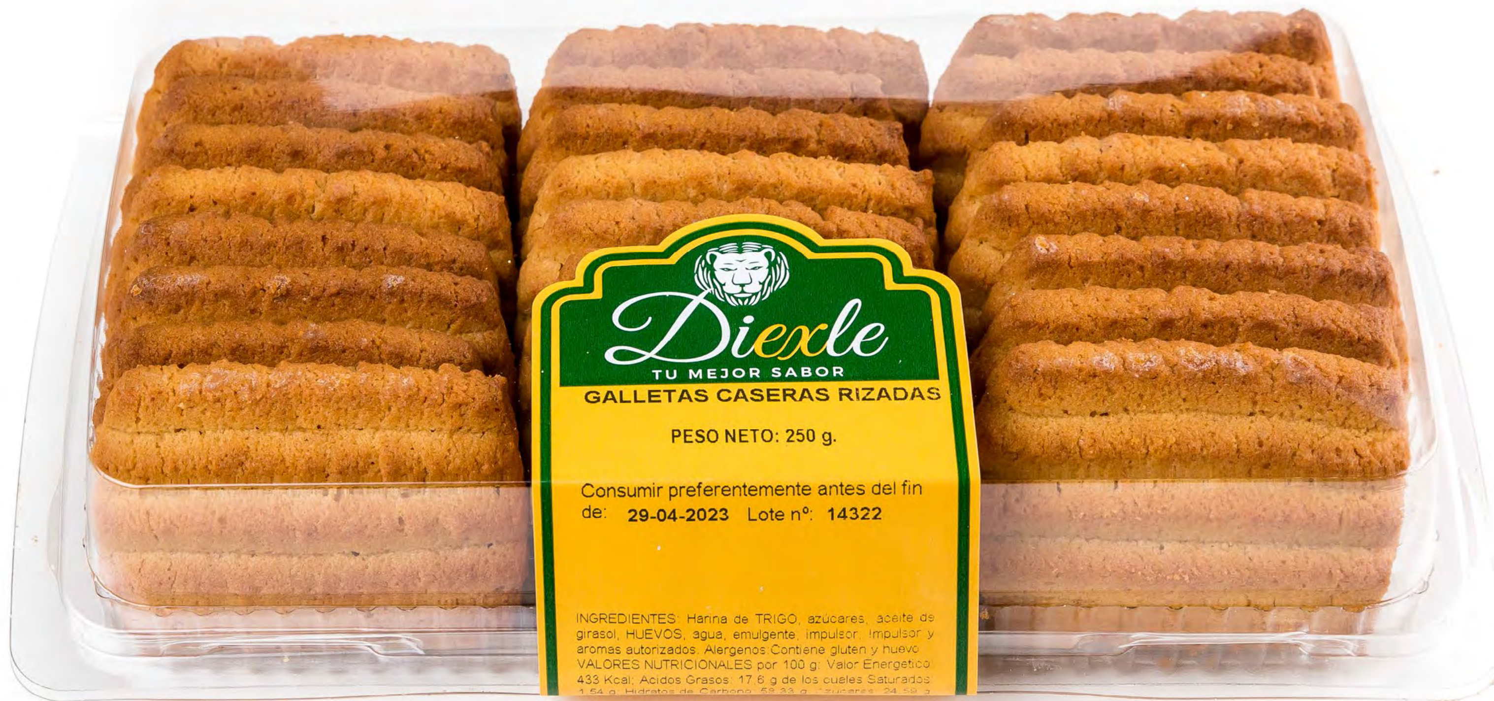
Cod. v 8 und/caja