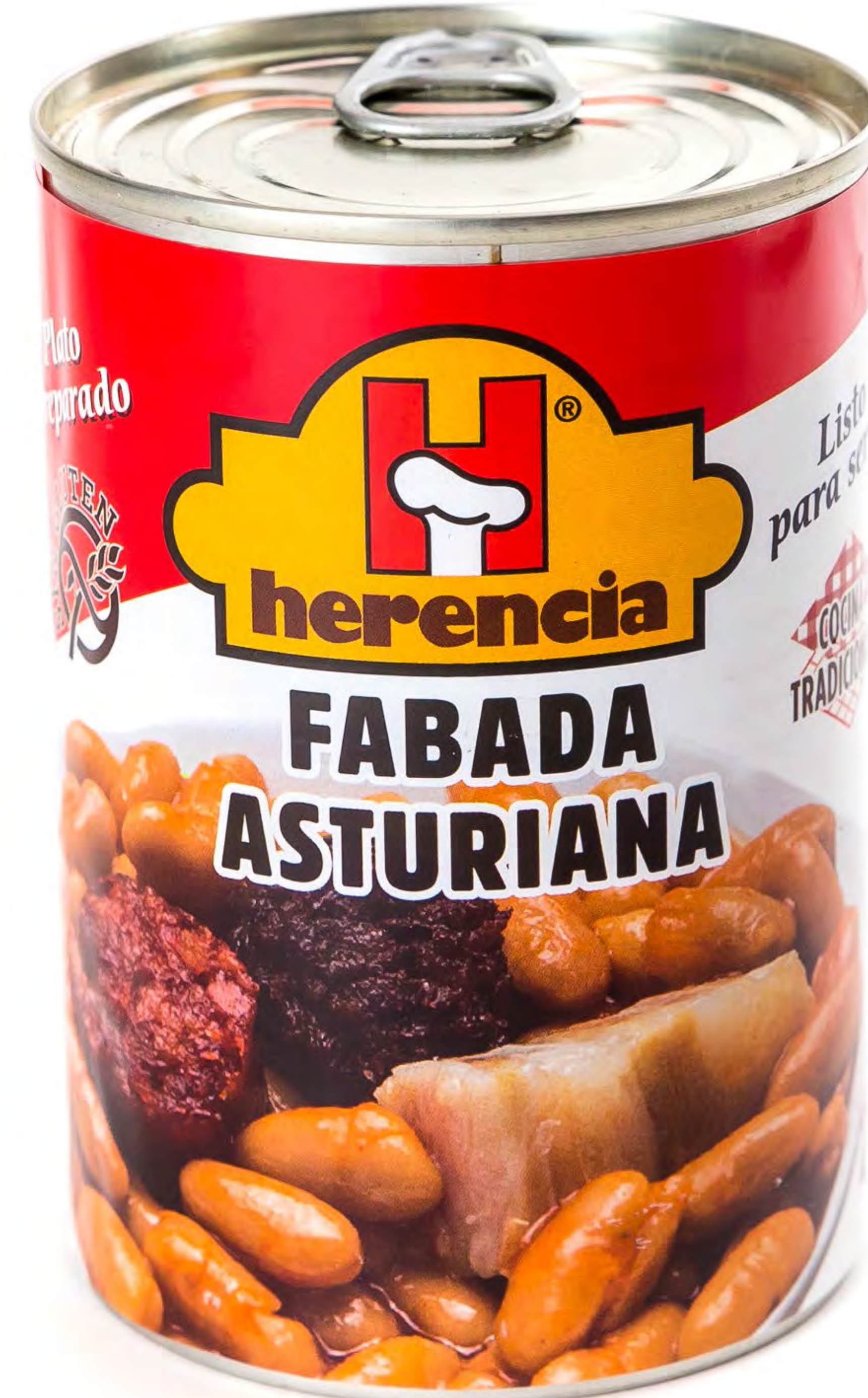
Cod. 225014 Fabada Herencia 12 uds/caja