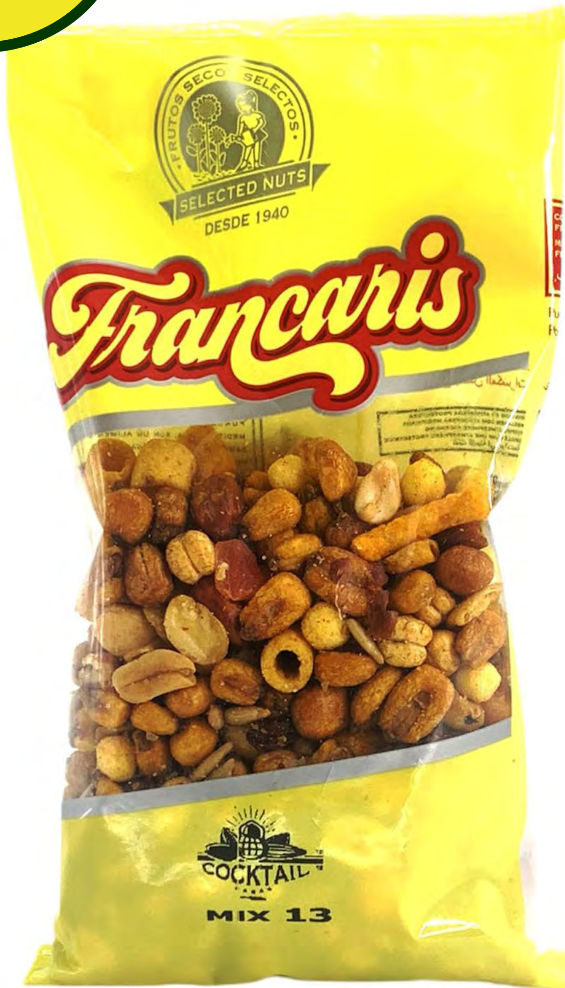
Mix frutos secos 12V und/caja