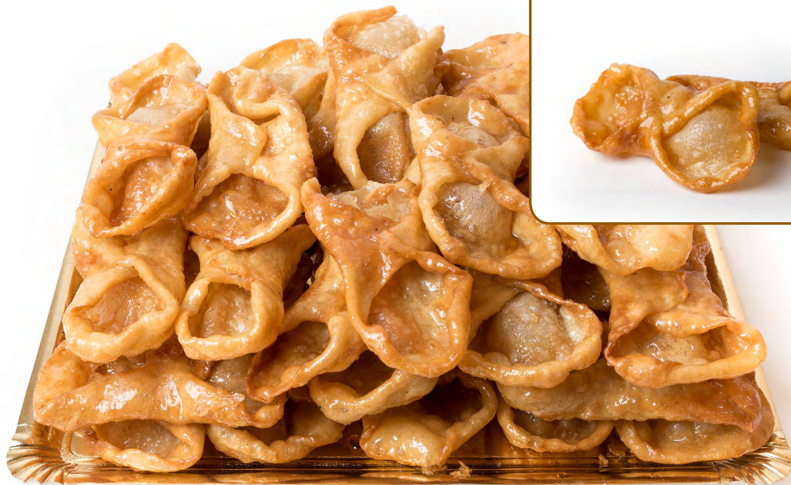
Gañotes Miel 2 Kg.