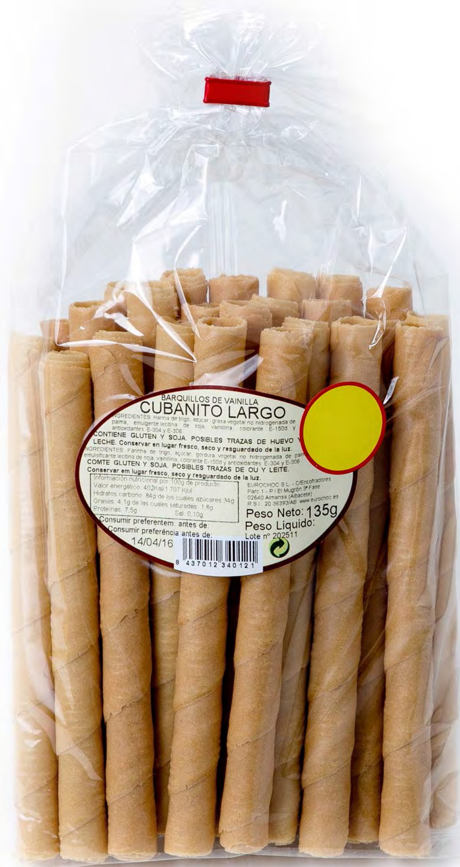
Cubanitos Largos 12 uds.