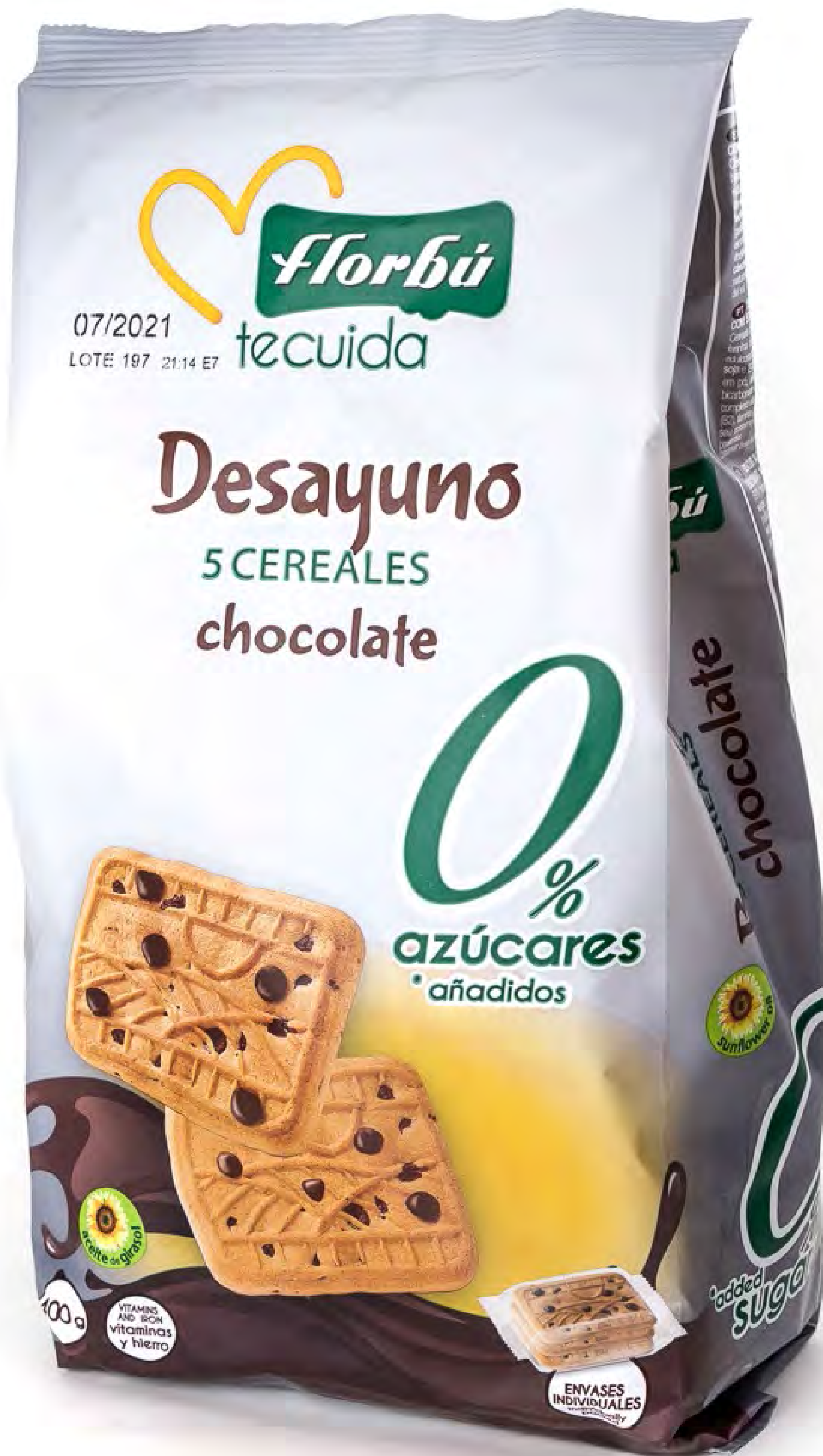
Desayuno 5 Cereales choco 0% 6 uds/caja