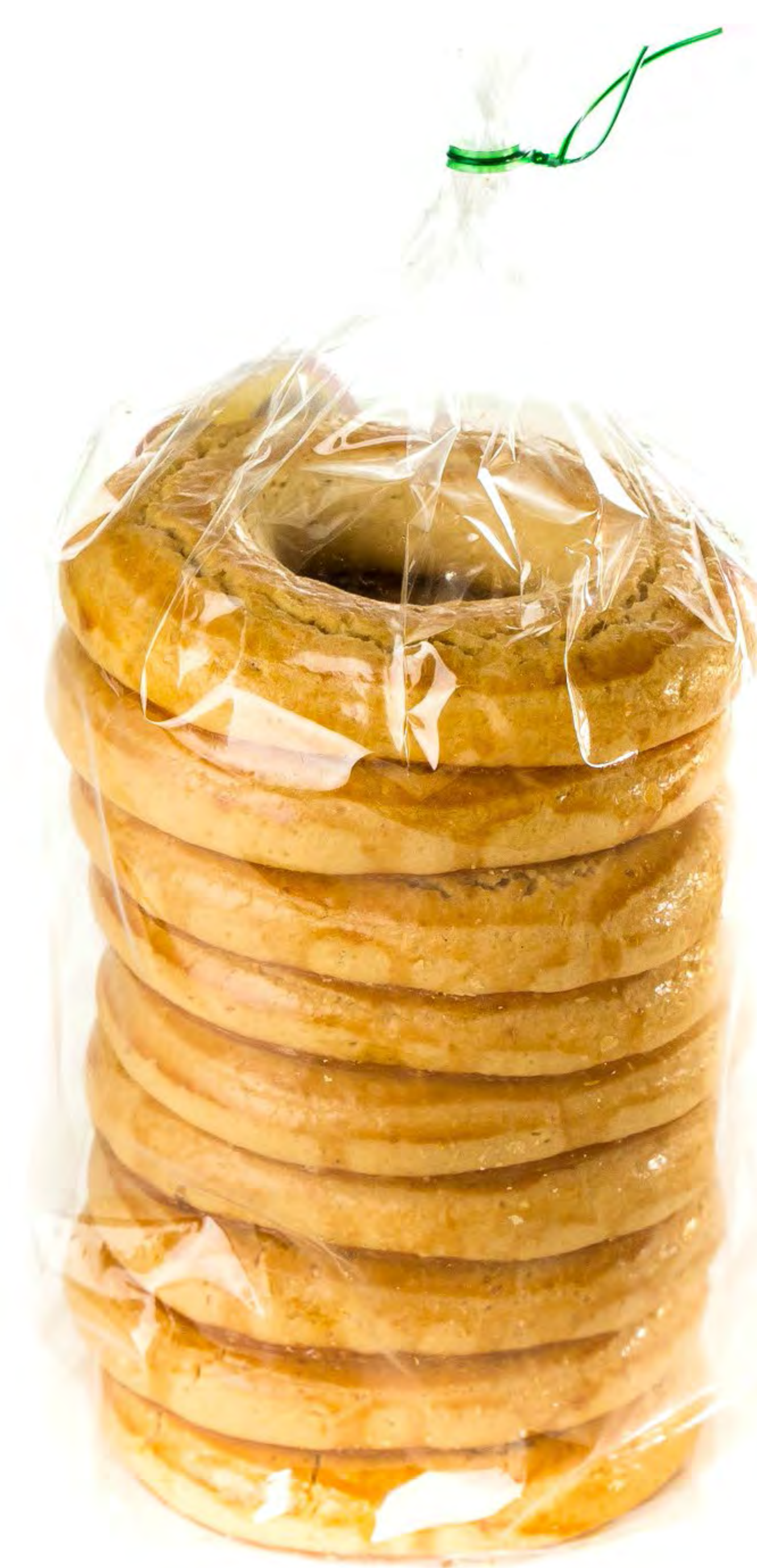
Cod. 207009 Rollo Naranja Llozano S/A 6 und/caja