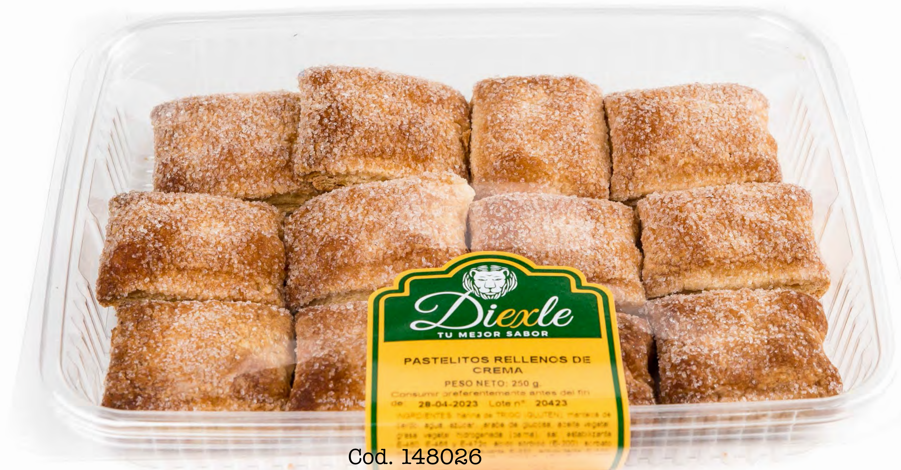
Cod. 148026 Pastelitos Rell. Crema 11 uds/caja