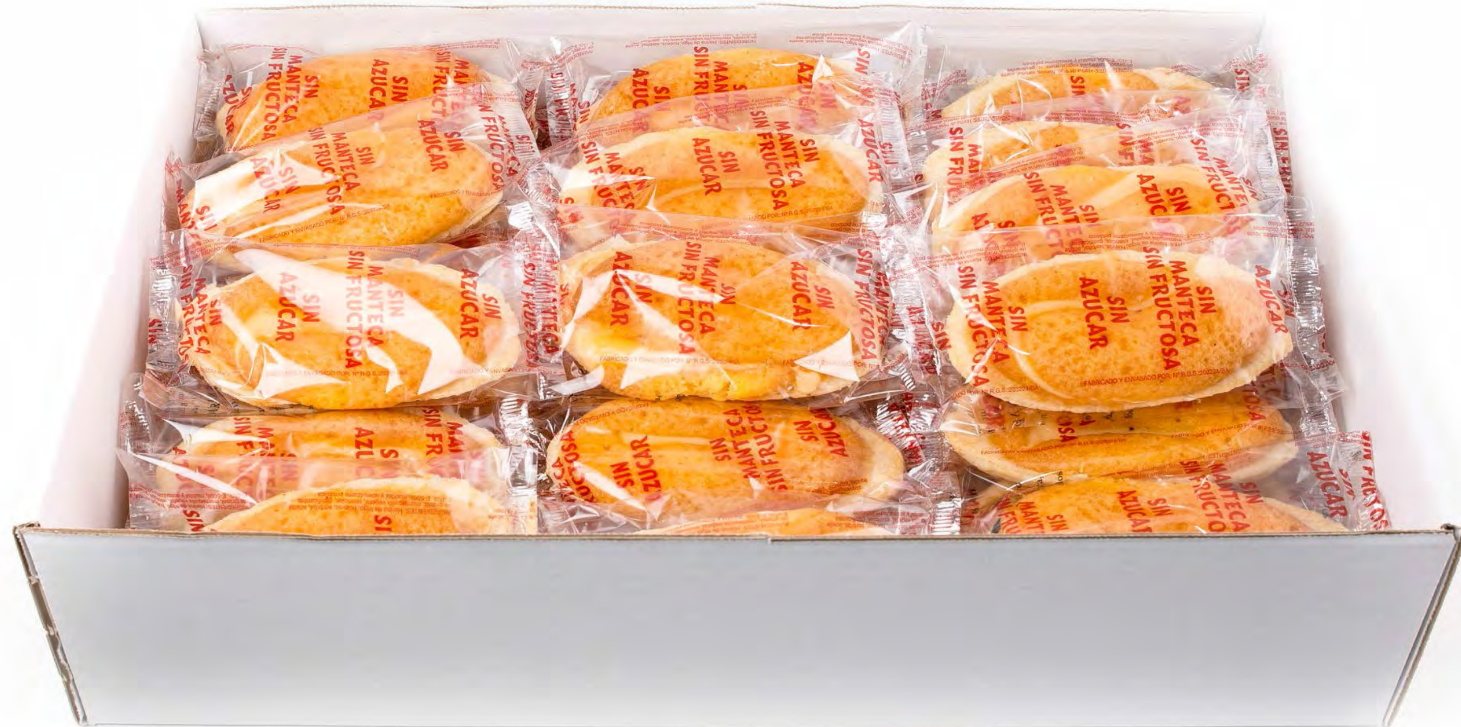
Barcos Crema S/A 2,5Kg.