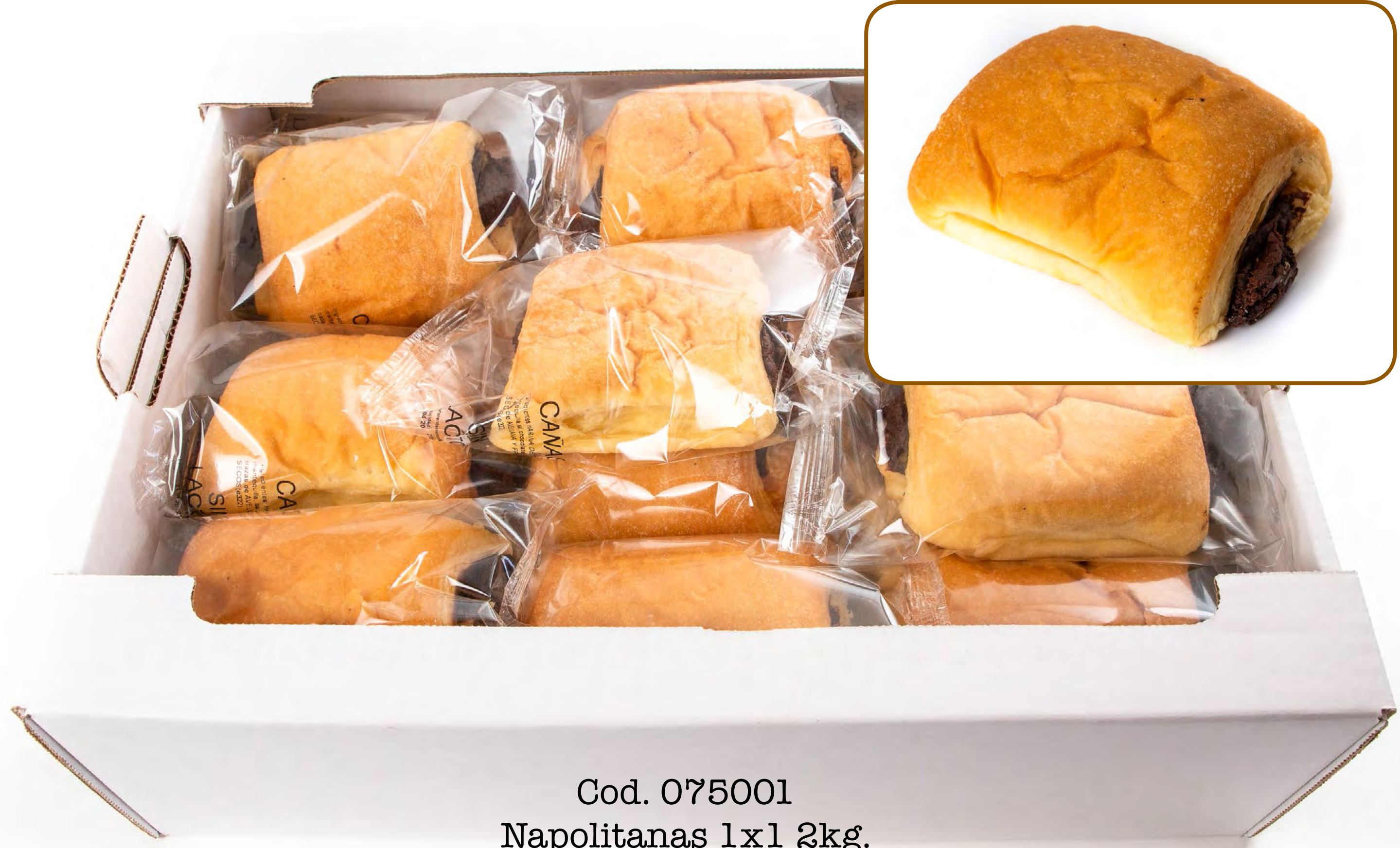
Cod. 075001 Napolitanas 1x1 2kg.