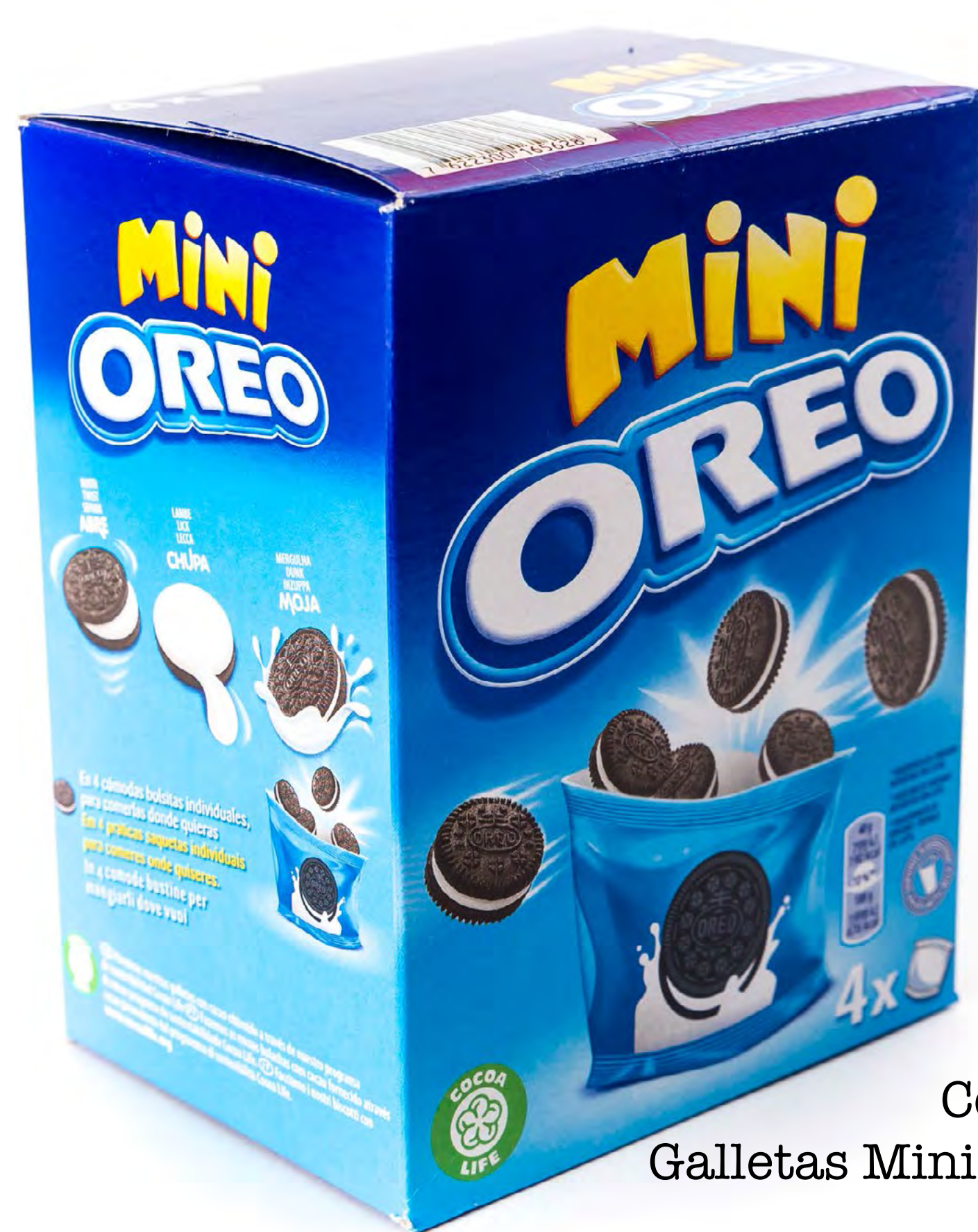
Cod. 190006 Galletas Mini Oreo 160g 12 und/caja