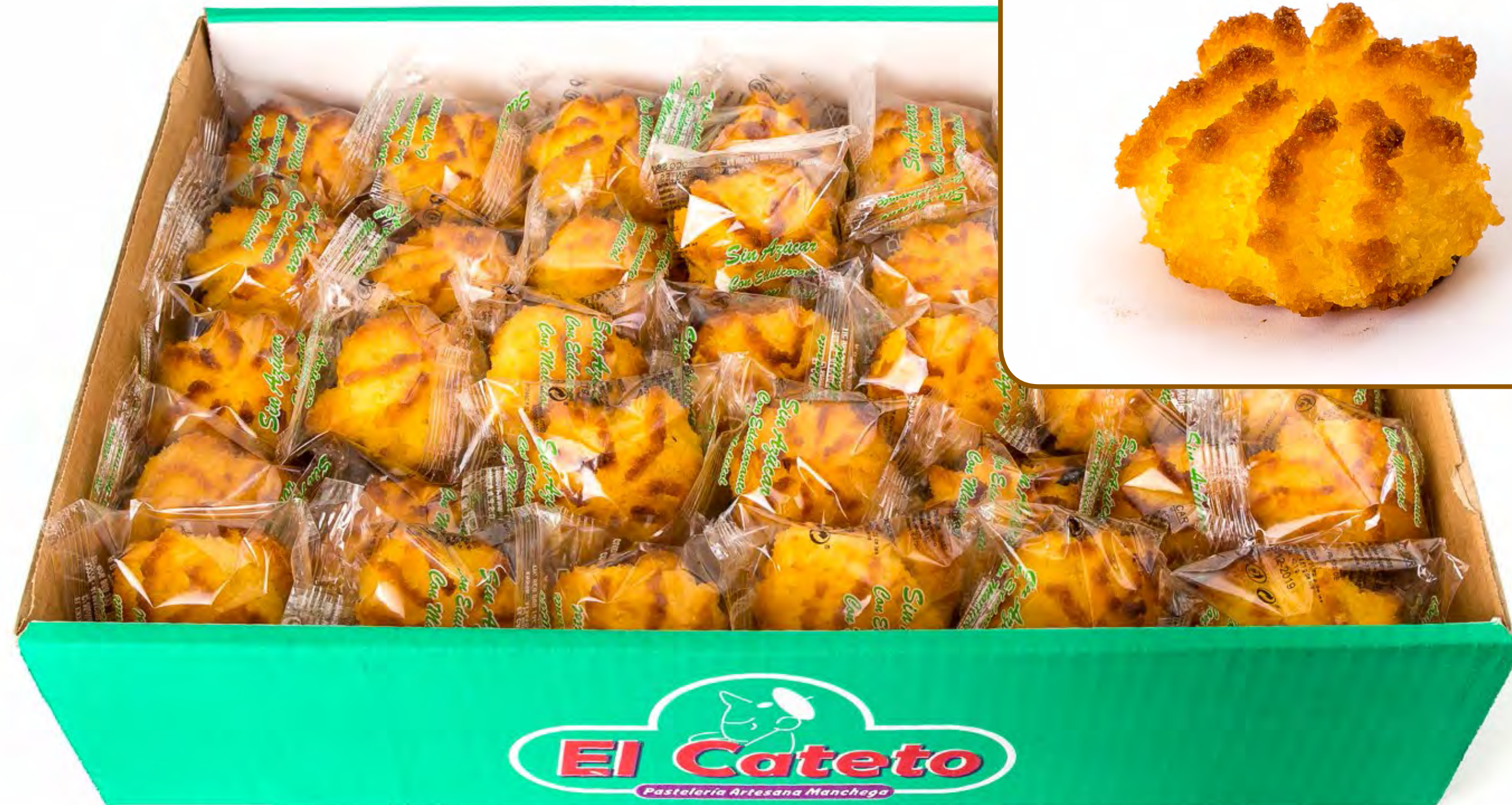
Sultana de Coco S/A 2 Kg.