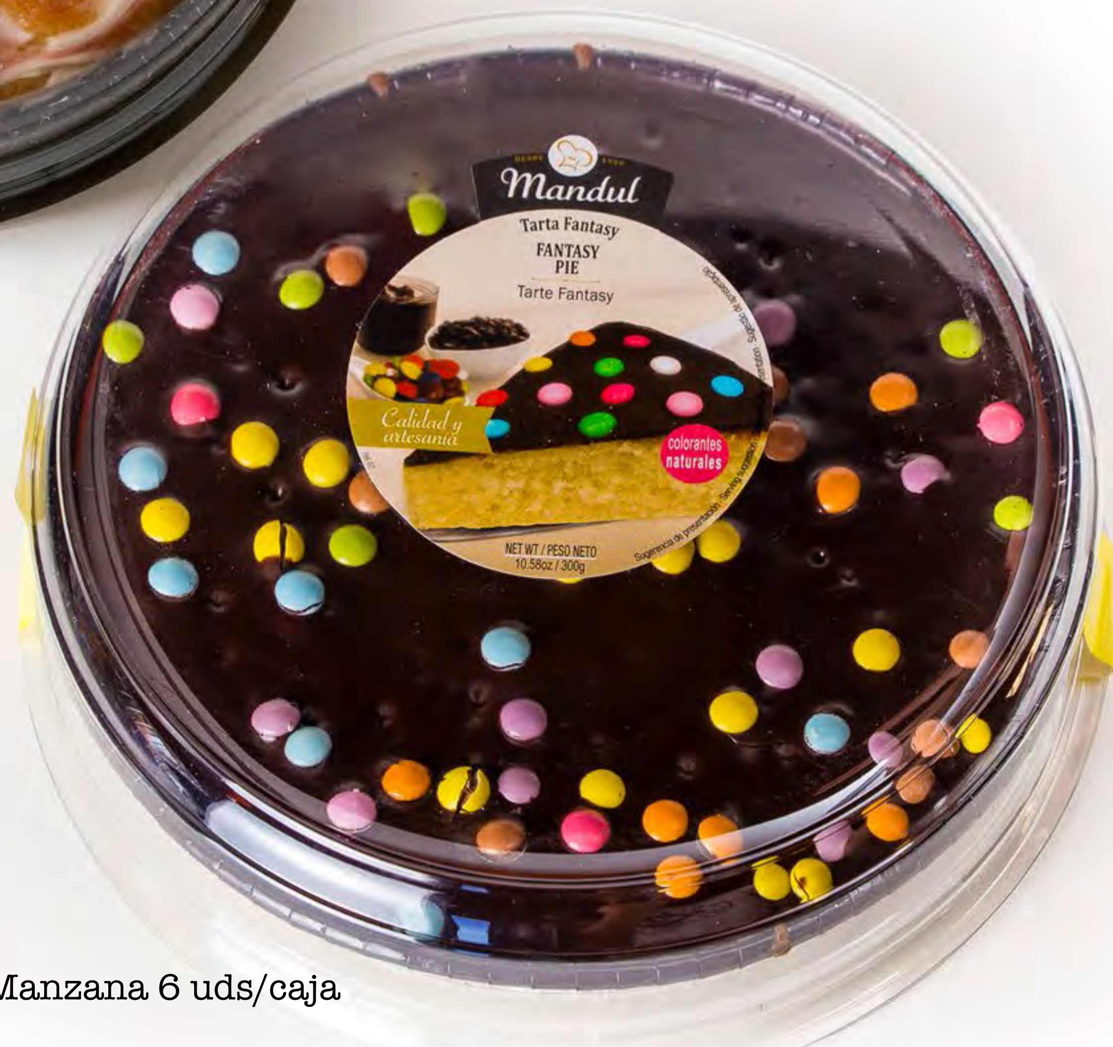
Tarta Manzana 6 uds/caja