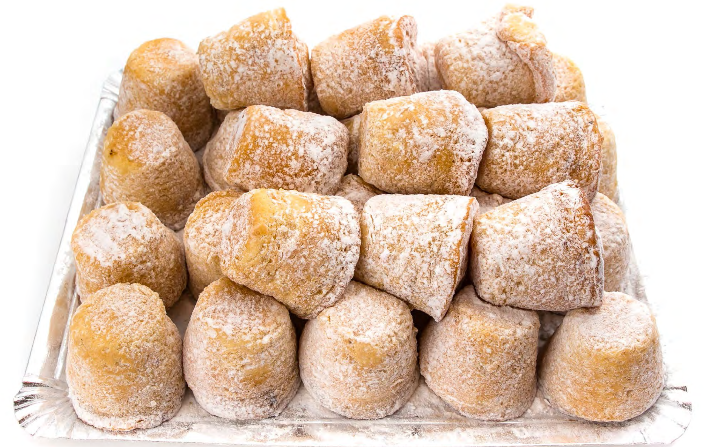
Mojicón Almendra Glass 2 kg