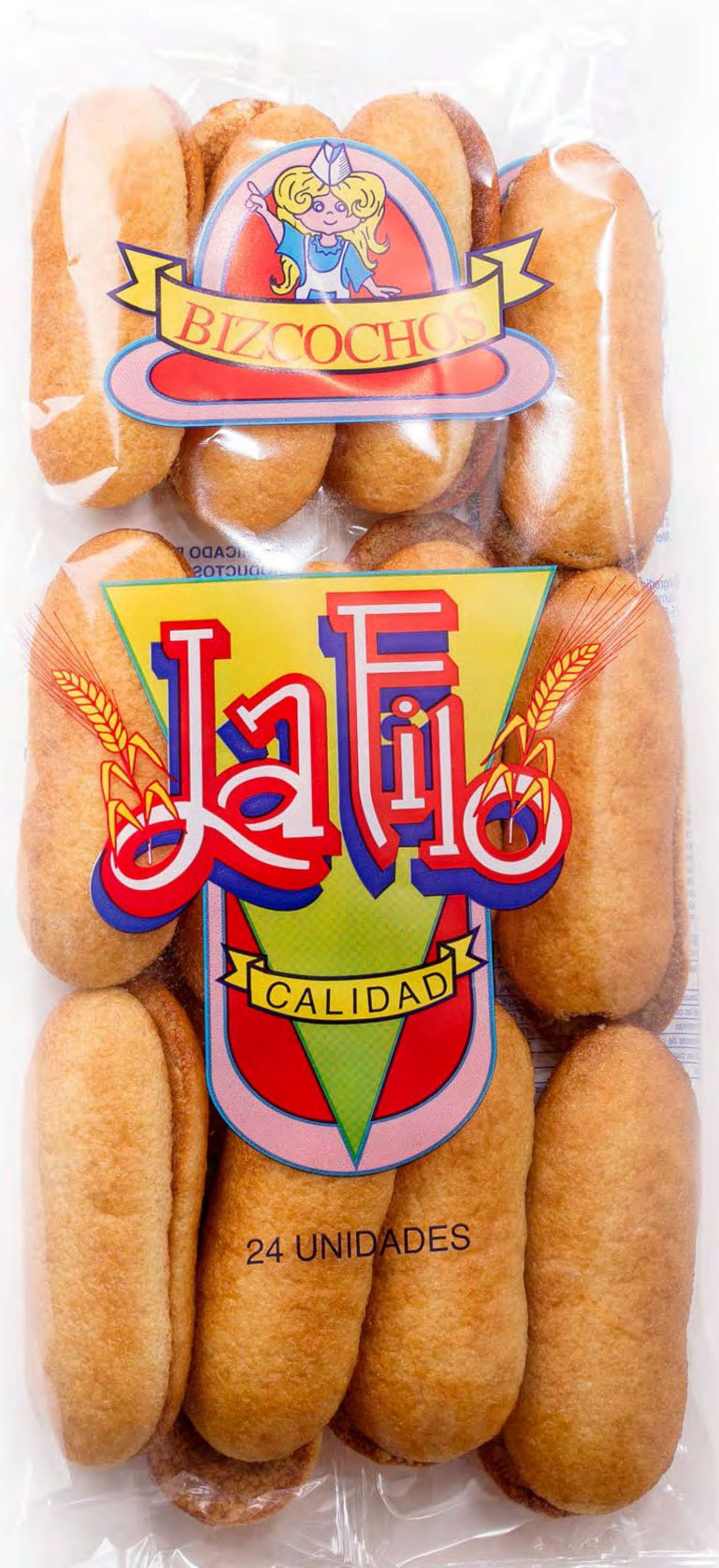
Biz. Soletilla 12 uds/caja