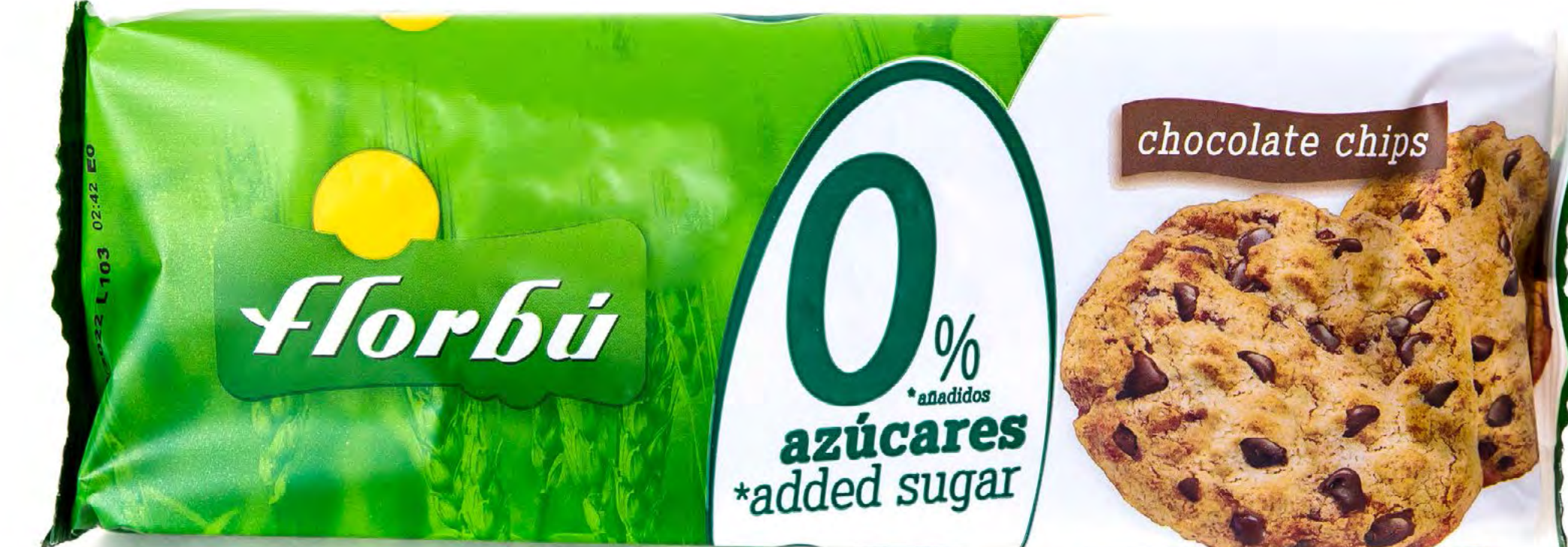
Cookies Choco S/A 20 uds/caja Cod: 174100