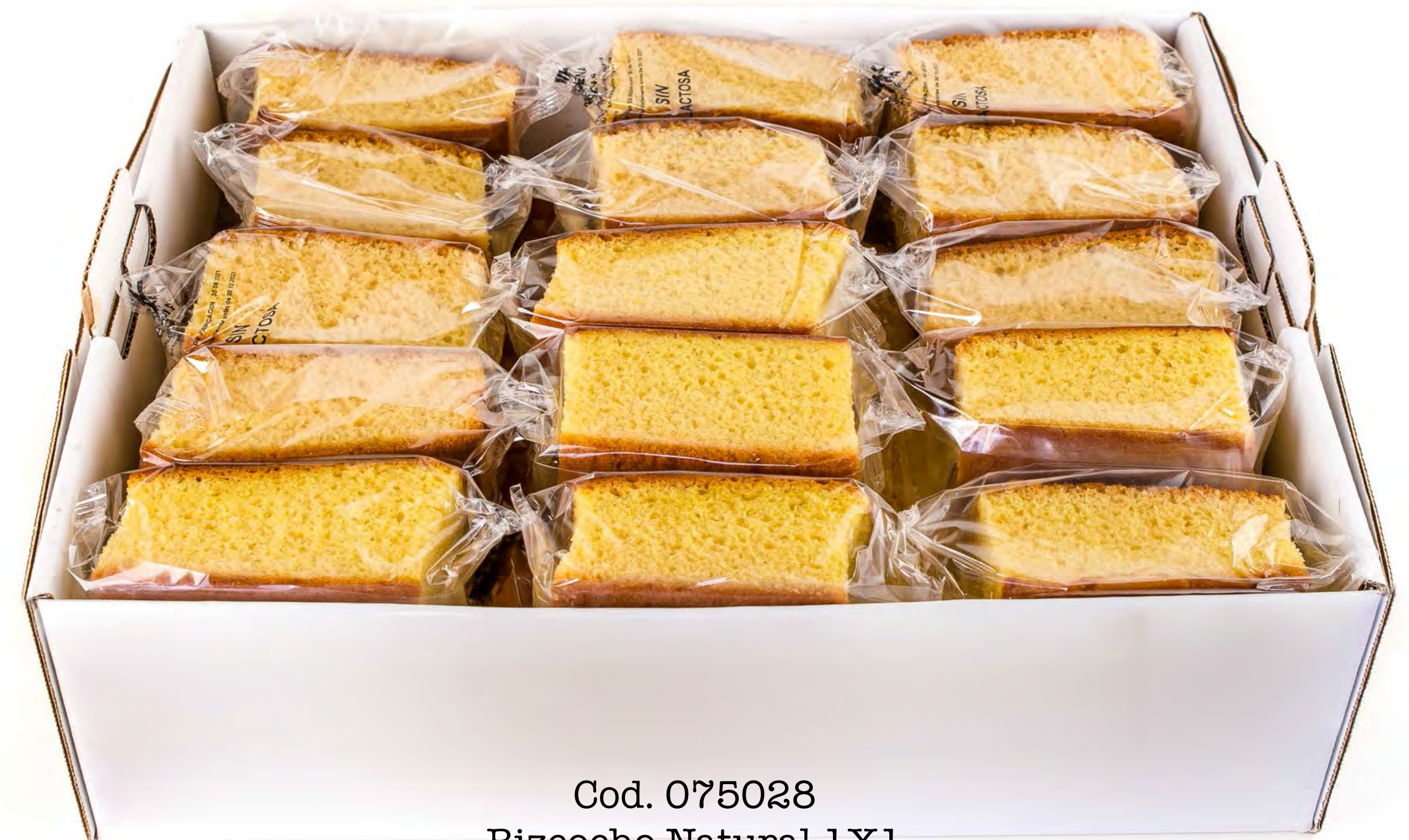
Cod. 075028 Bizcocho Natural 1X1