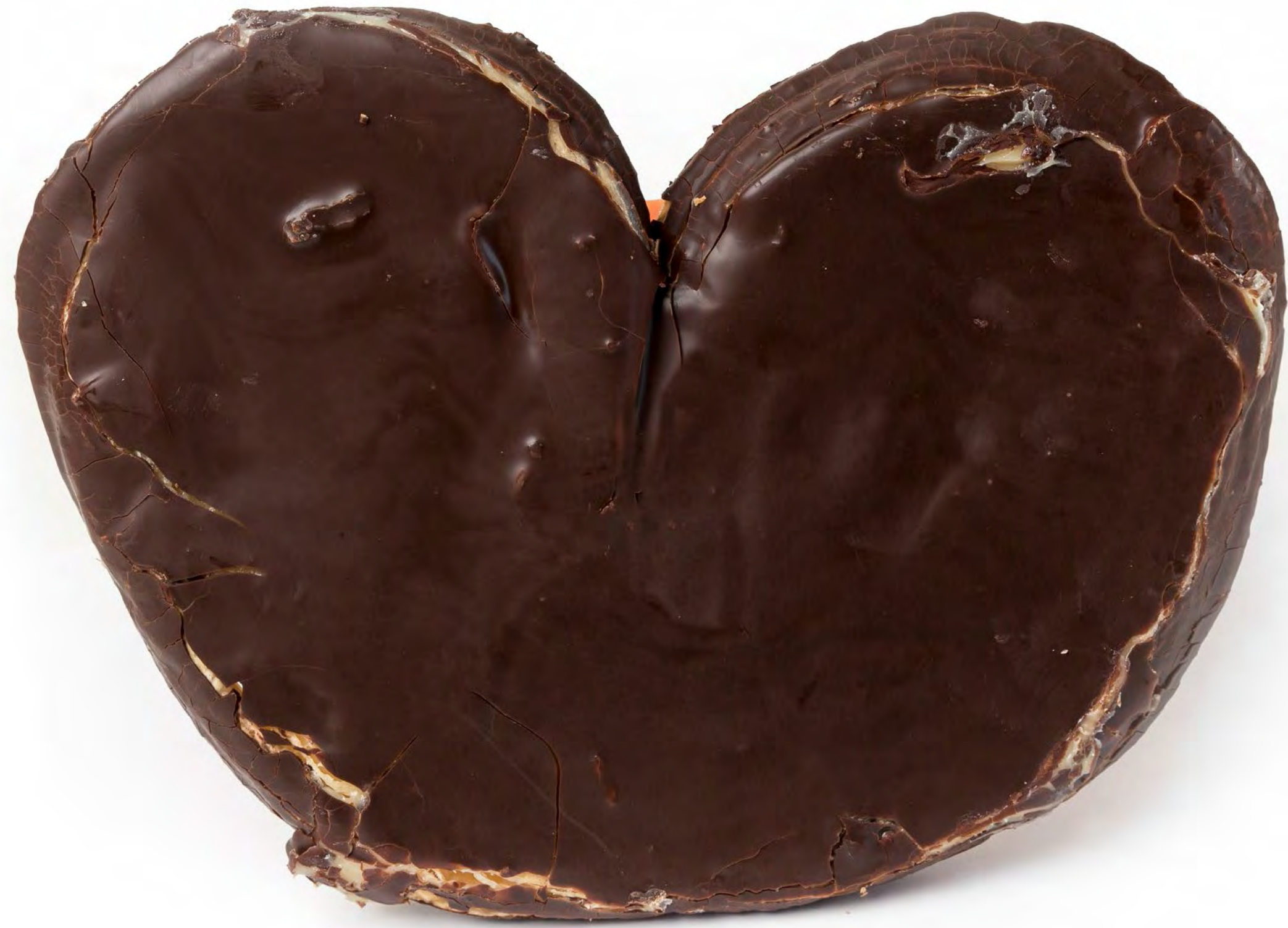
Palmera Rell. Natilla 12 uds/caja