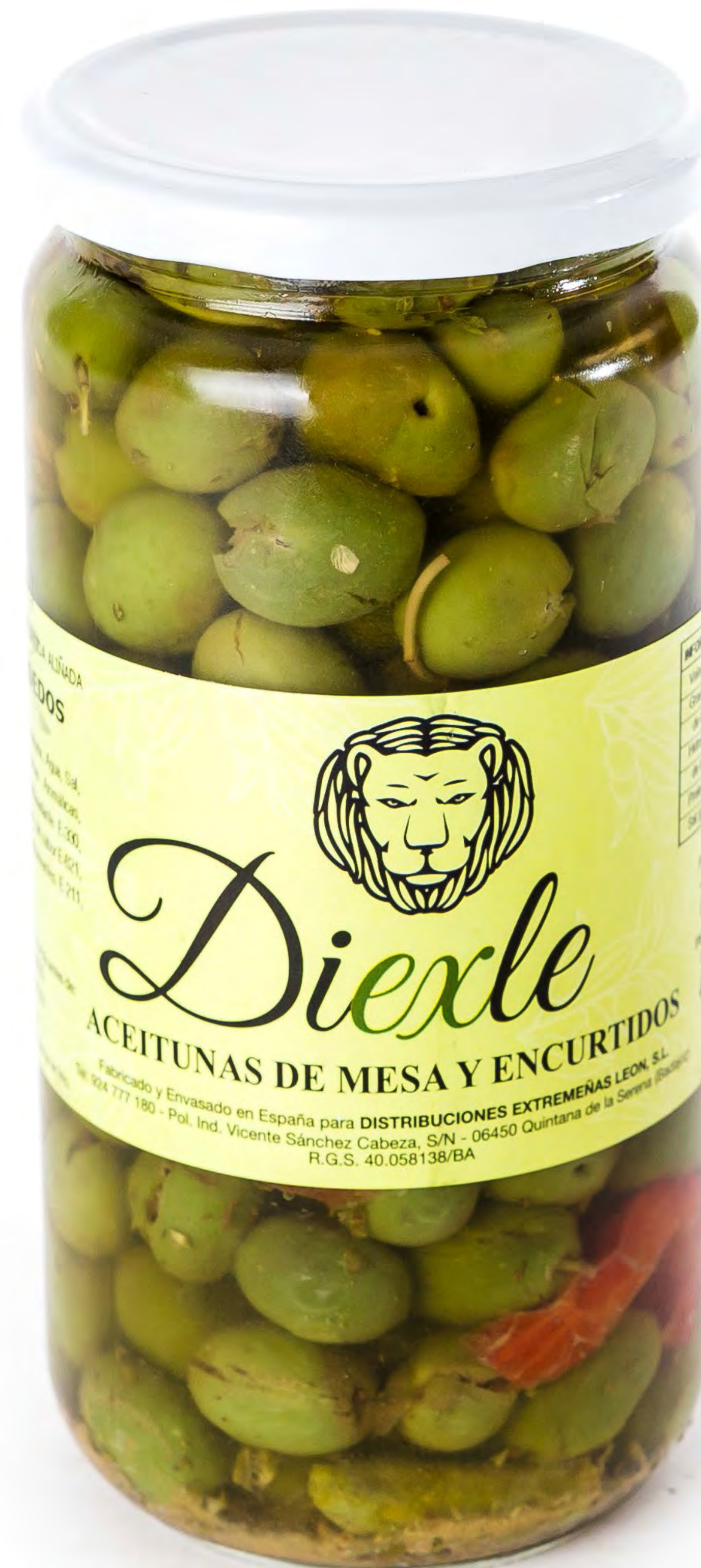
Aceituna Diexle Chupadado 8 uds/caja