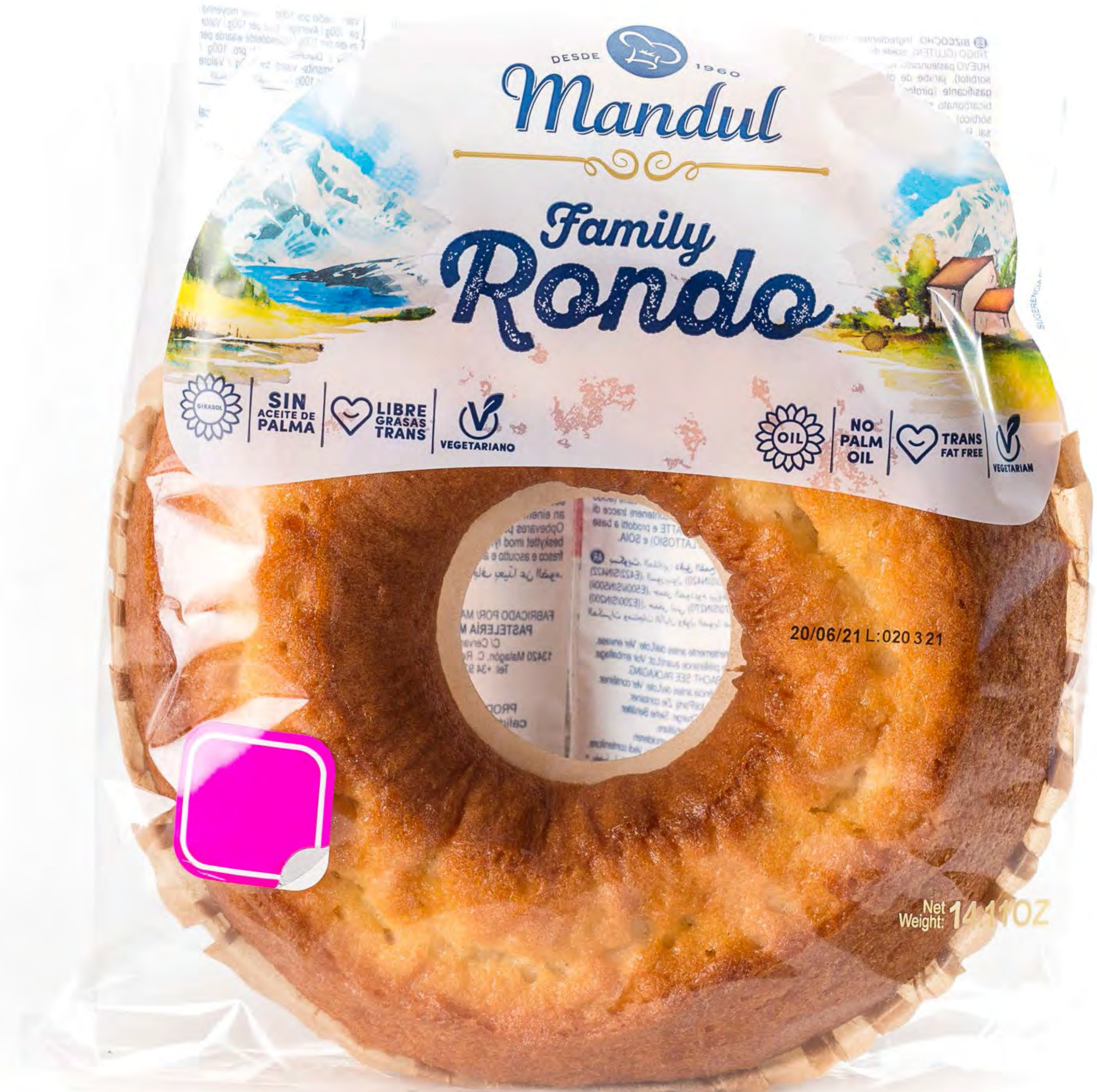
Cod. 041015 Rondo Familiar 4 uds/caja