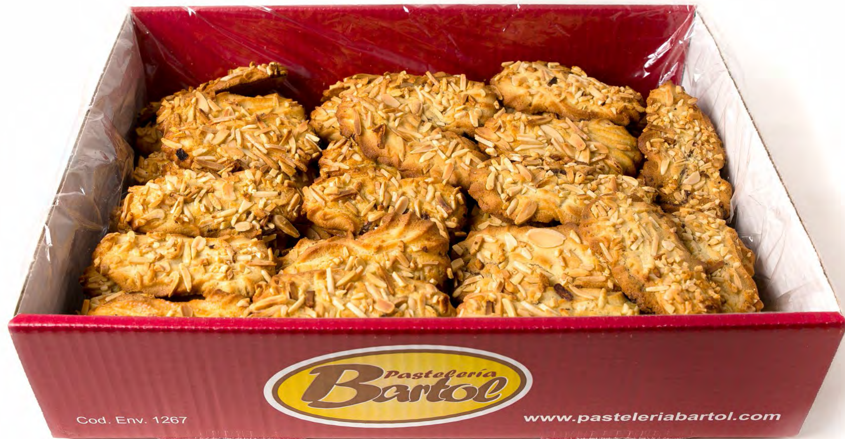
Palitas Choco Almendras 2,5 Kg