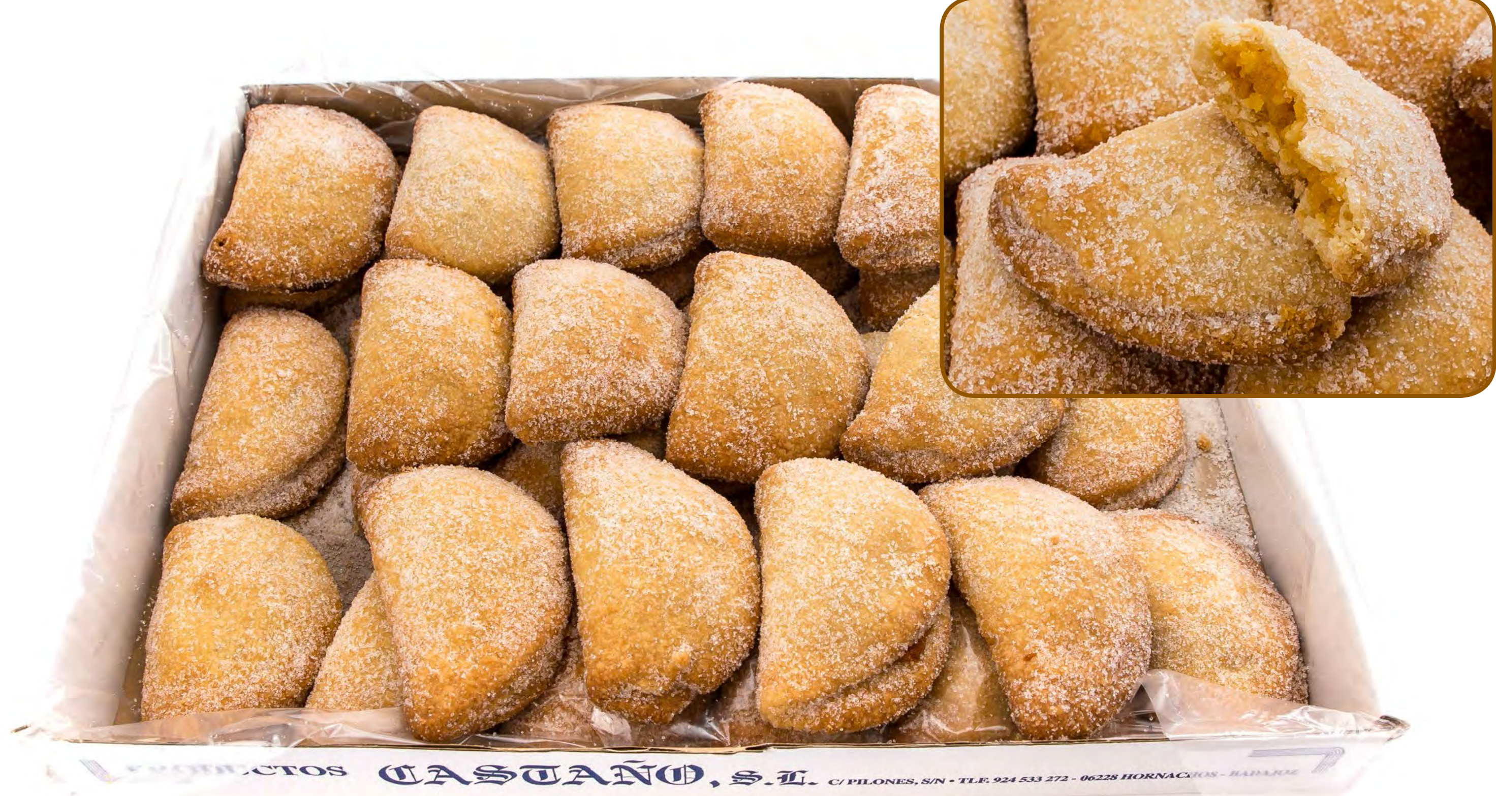
Empanadilla de Almendra 2kg.