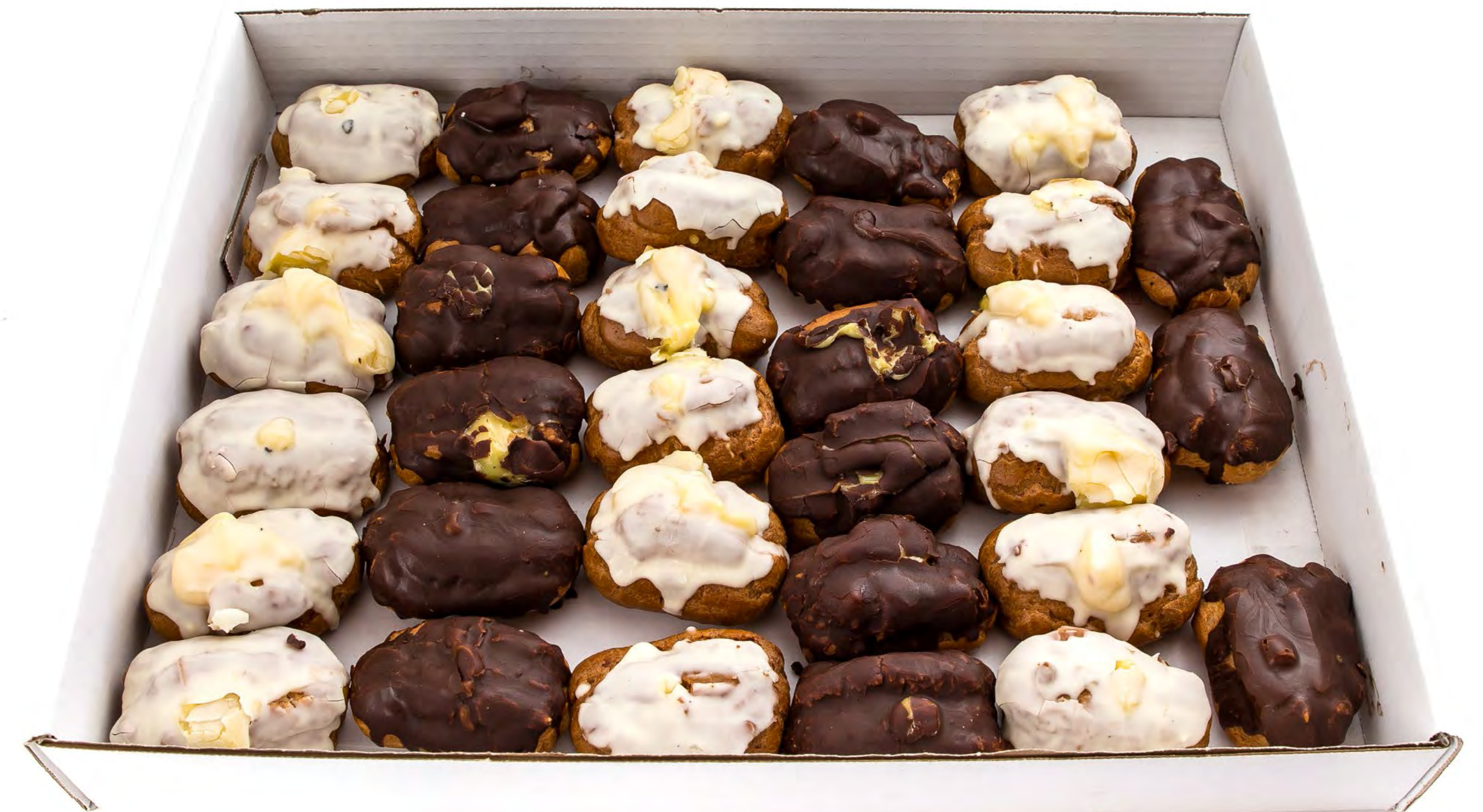
Petisu Mixto 2kg.