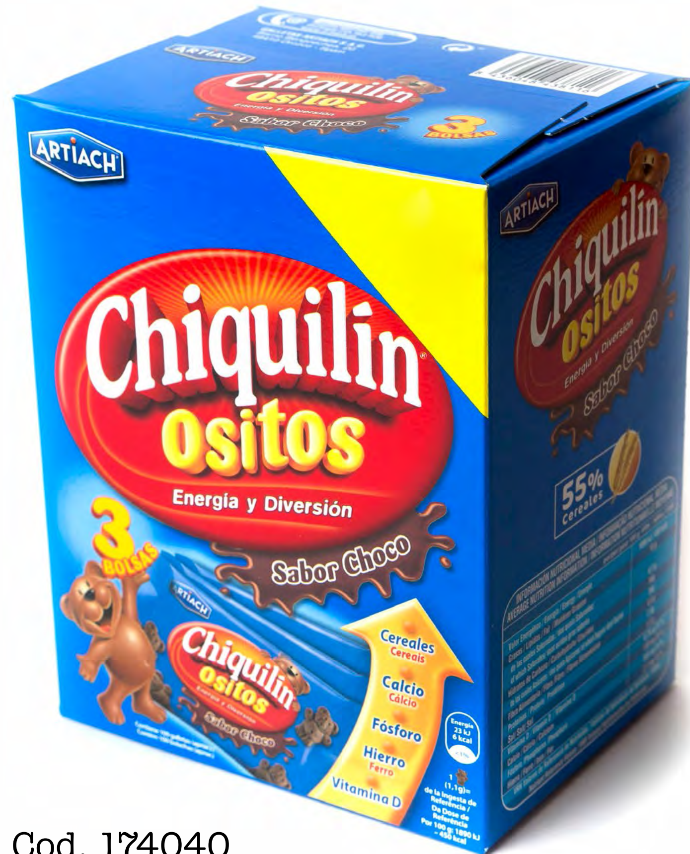
Cod. 174040 Chiquilin Osito 12 uds/caja