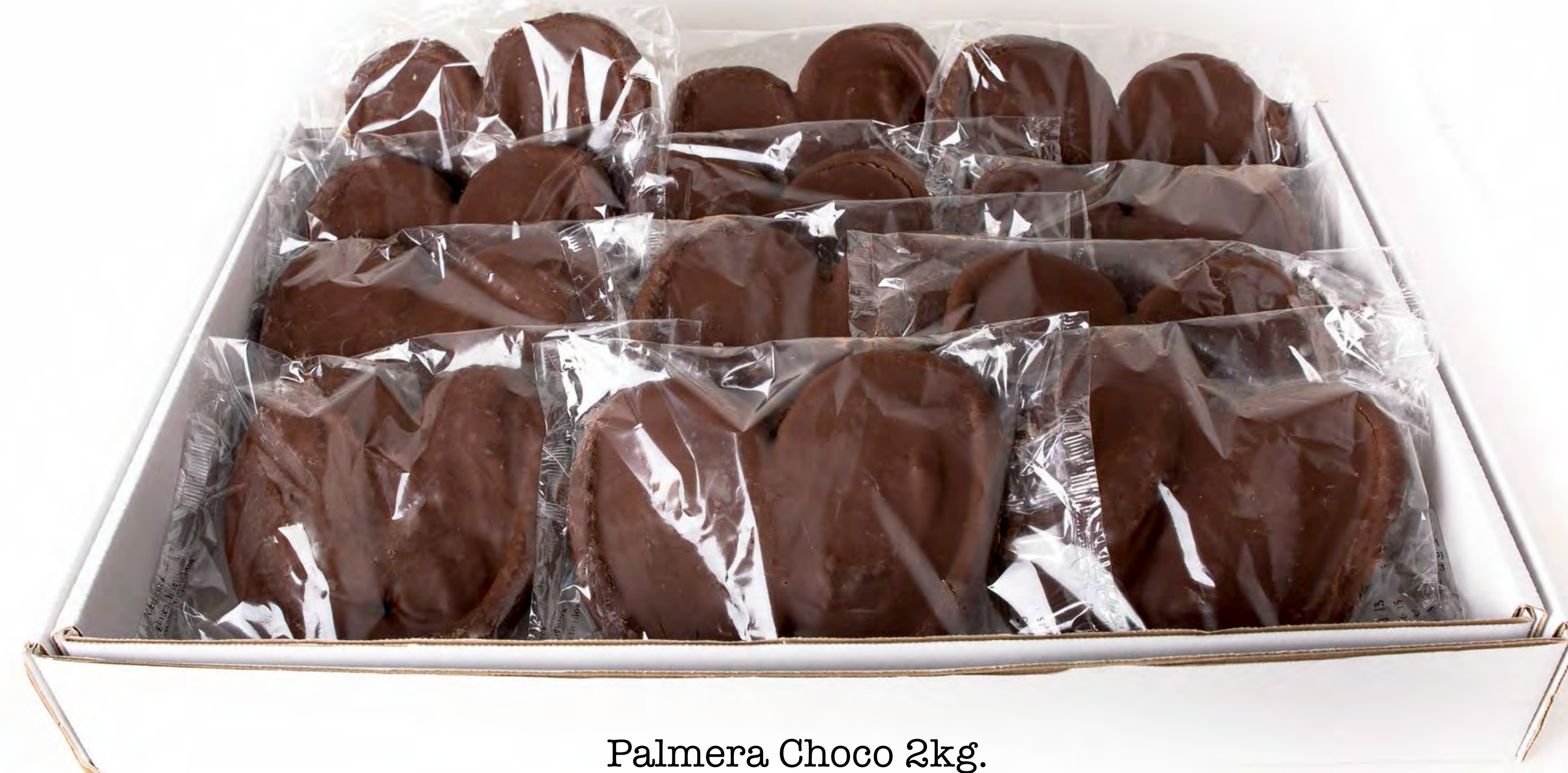
Palmera Choco 2kg.