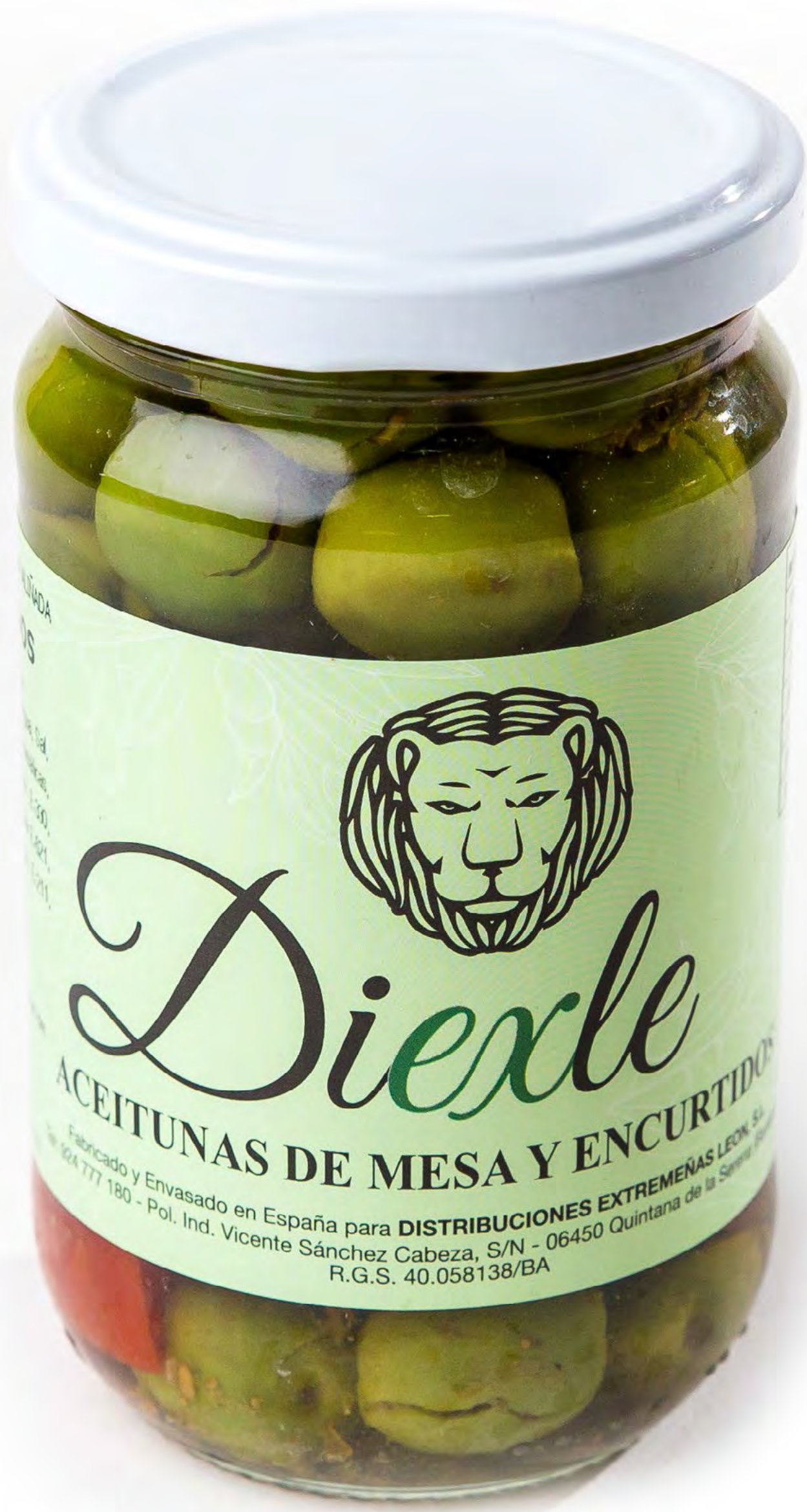
Cod. 185013 Aceitunas CHUPADEDOS 12 uds/caja