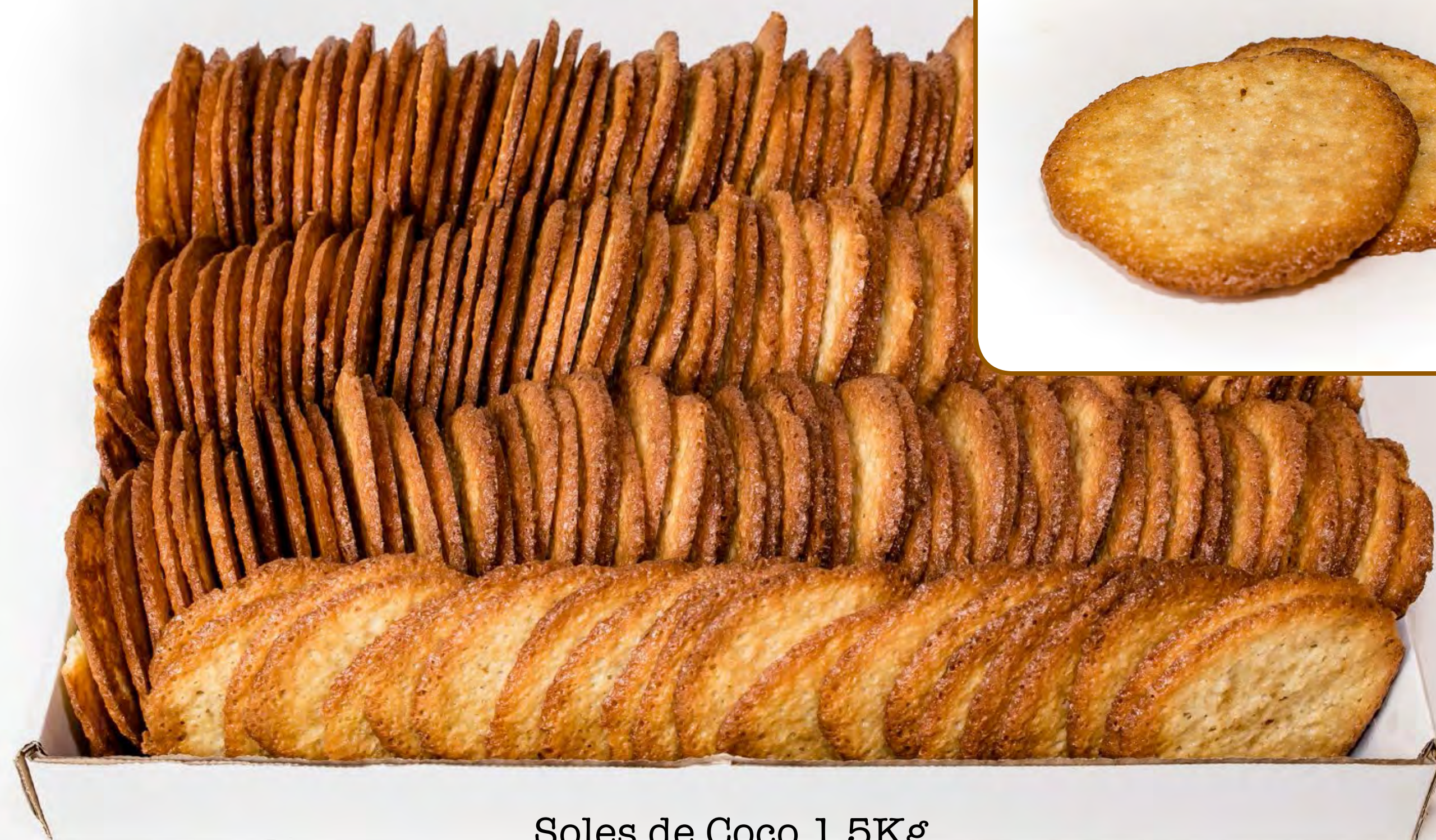
Soles de Coco 1.5Kg