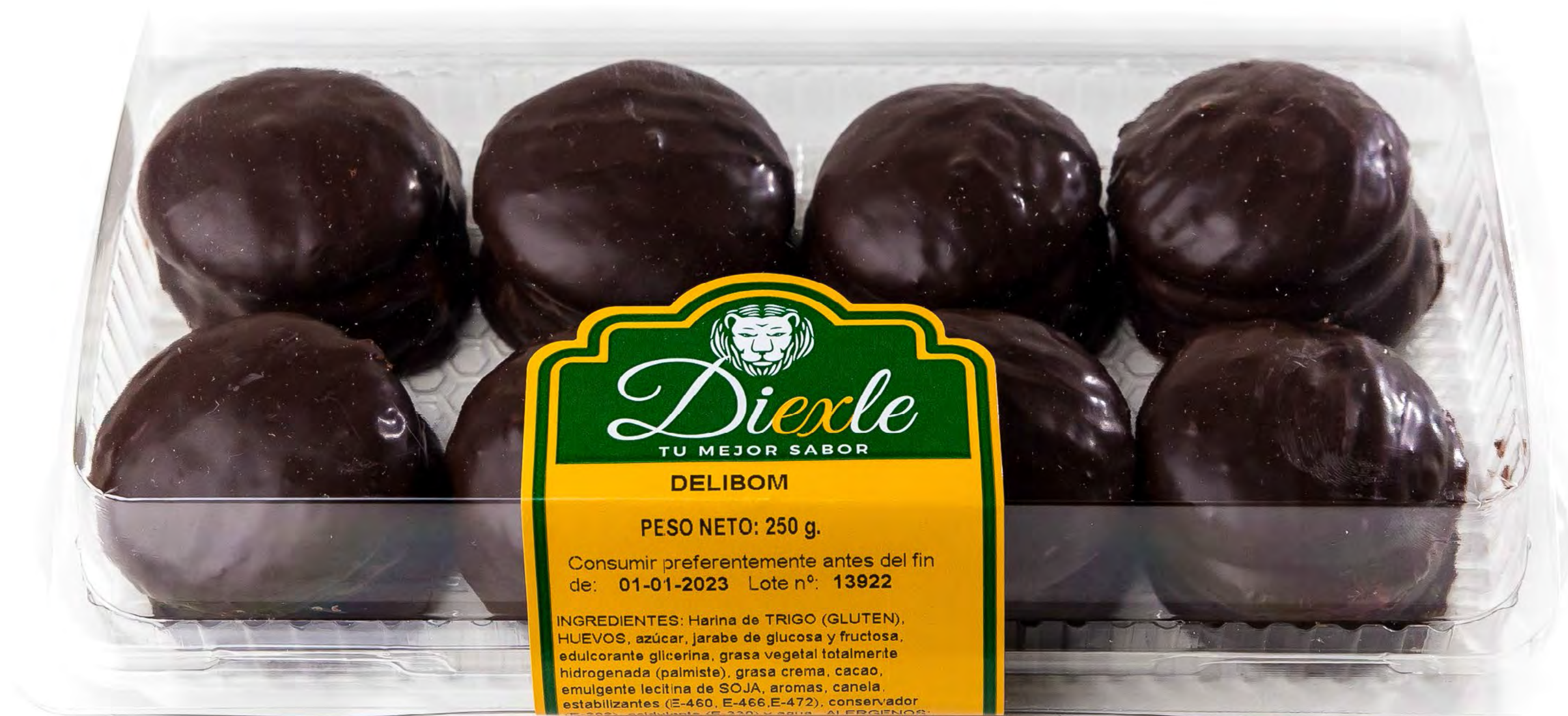
Cod. 148014 Blister Delibom 8 uds/caja