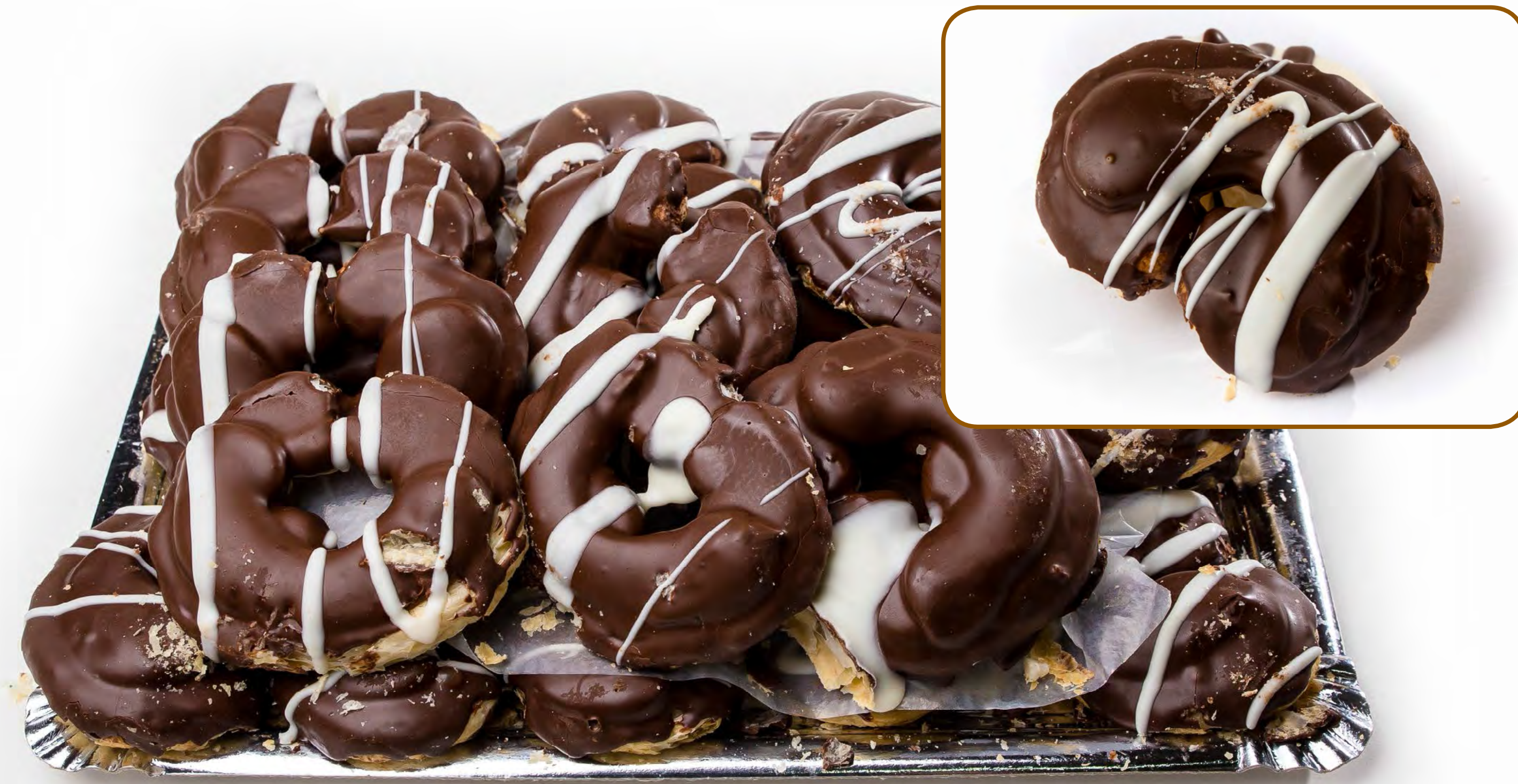
Cod. 253004 - Palmeritas Cacao - 1,5 Kg.