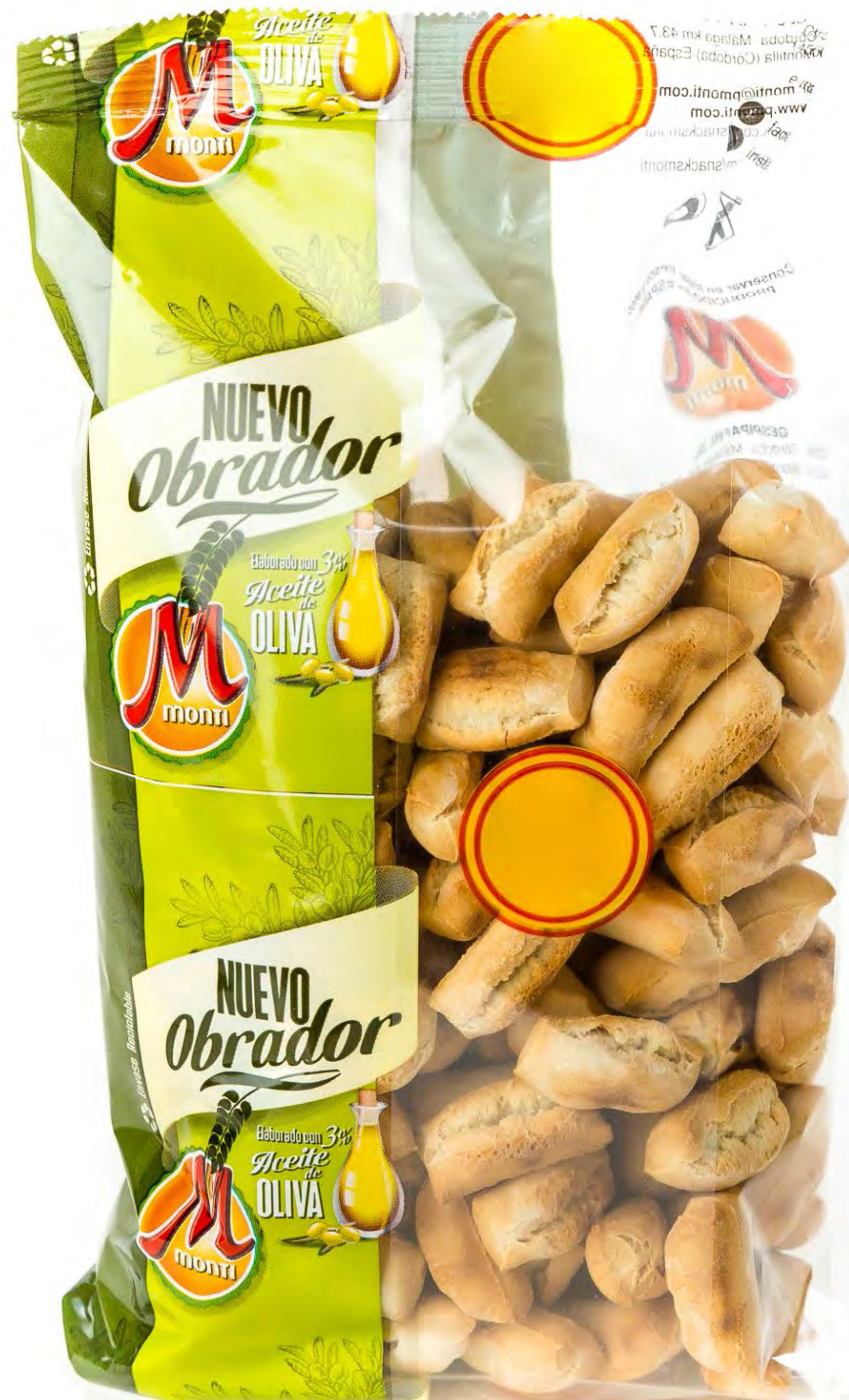
Cod. 164013 Picos Montillanitos 12 uds/caja