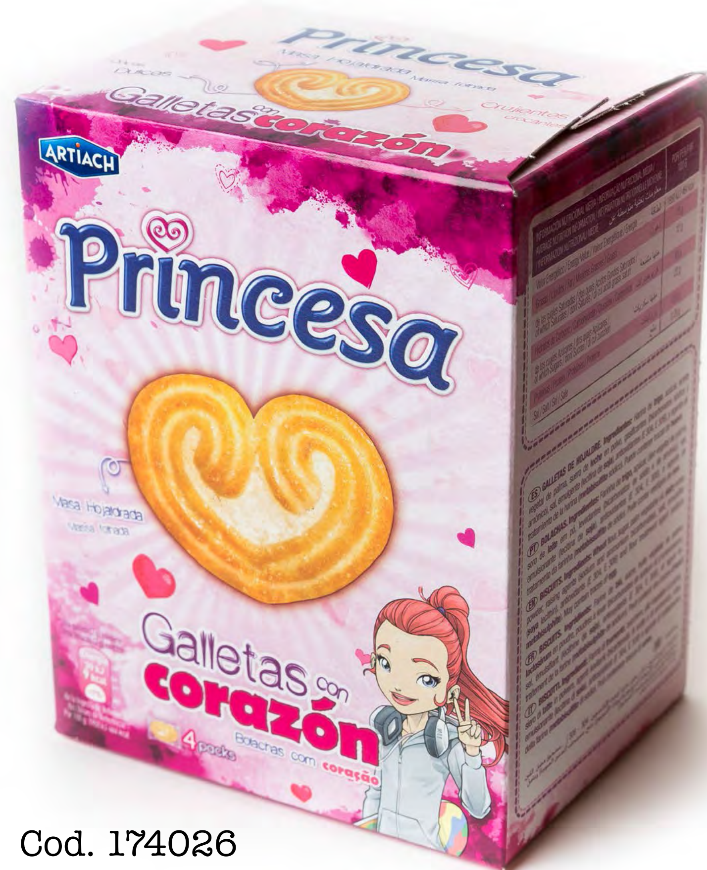
Cod. 174026 Galleta Princesa 12 uds/caja