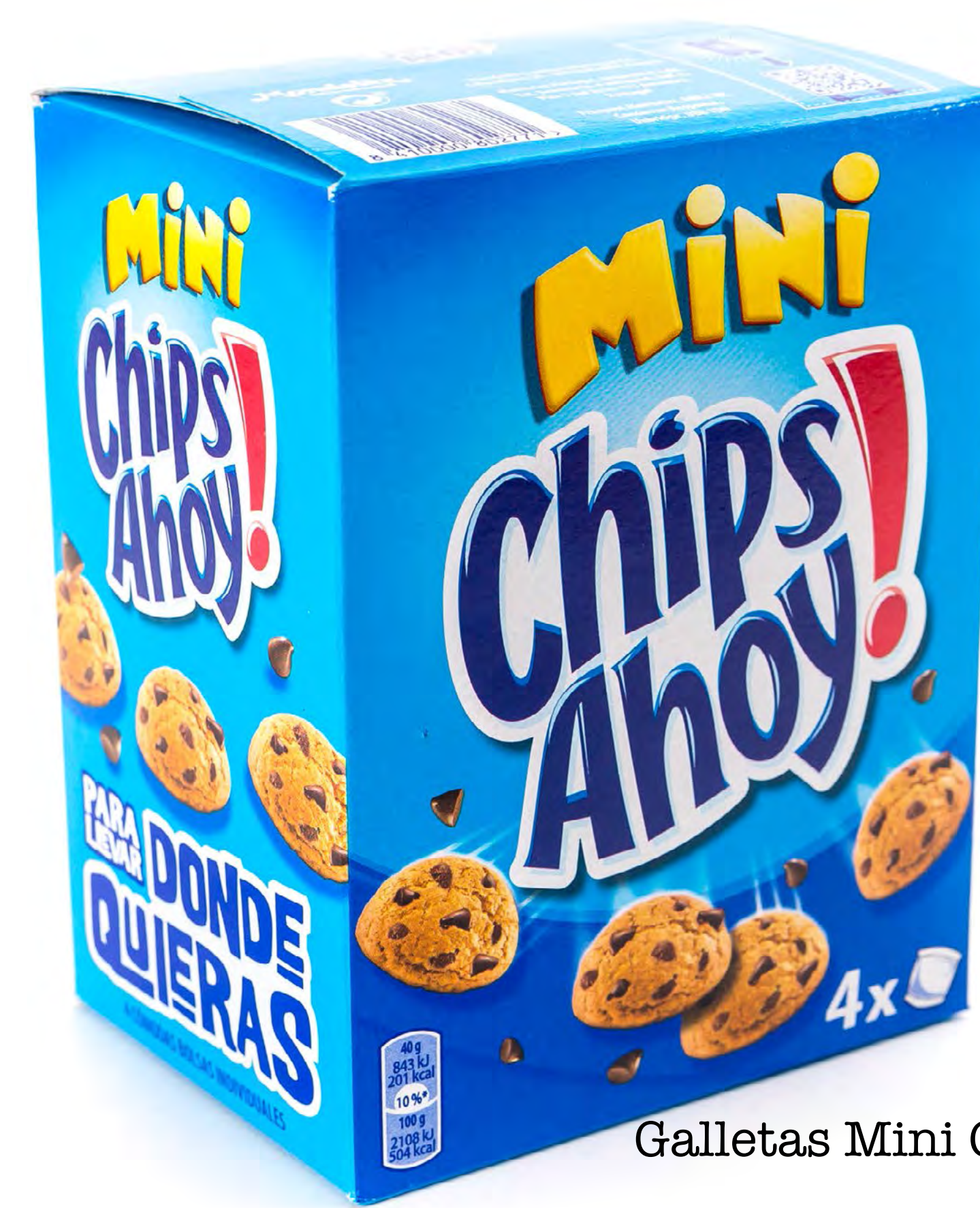
Cod. 190008 Galletas Mini Chips Ahoy 160g 12 und/caja