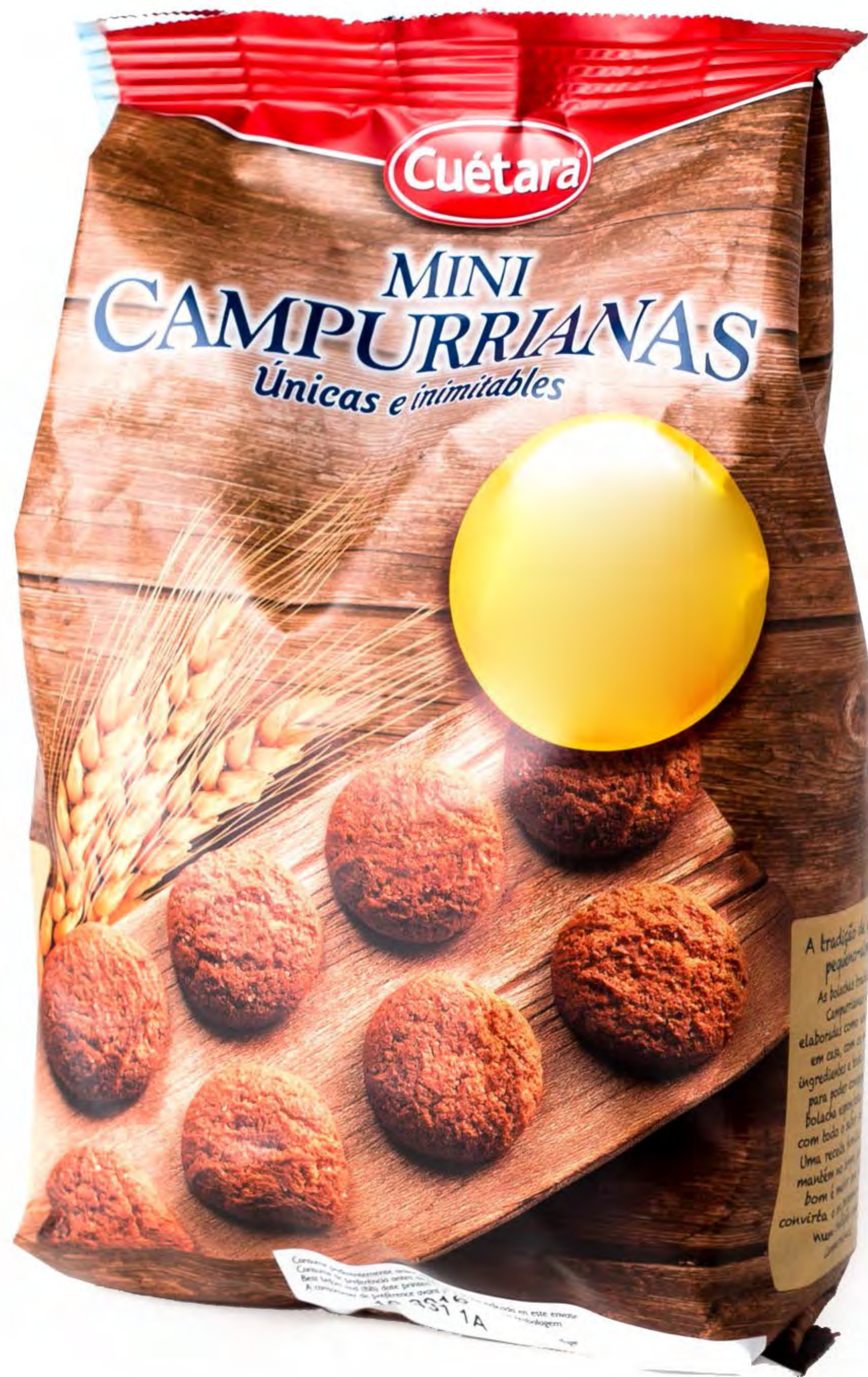
Galletas Campurrianas 6 uds/caja