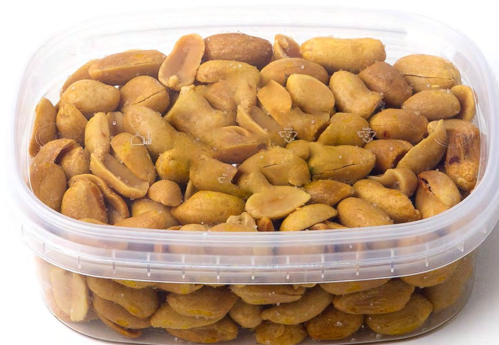
Panchitos 12 uds/Caja