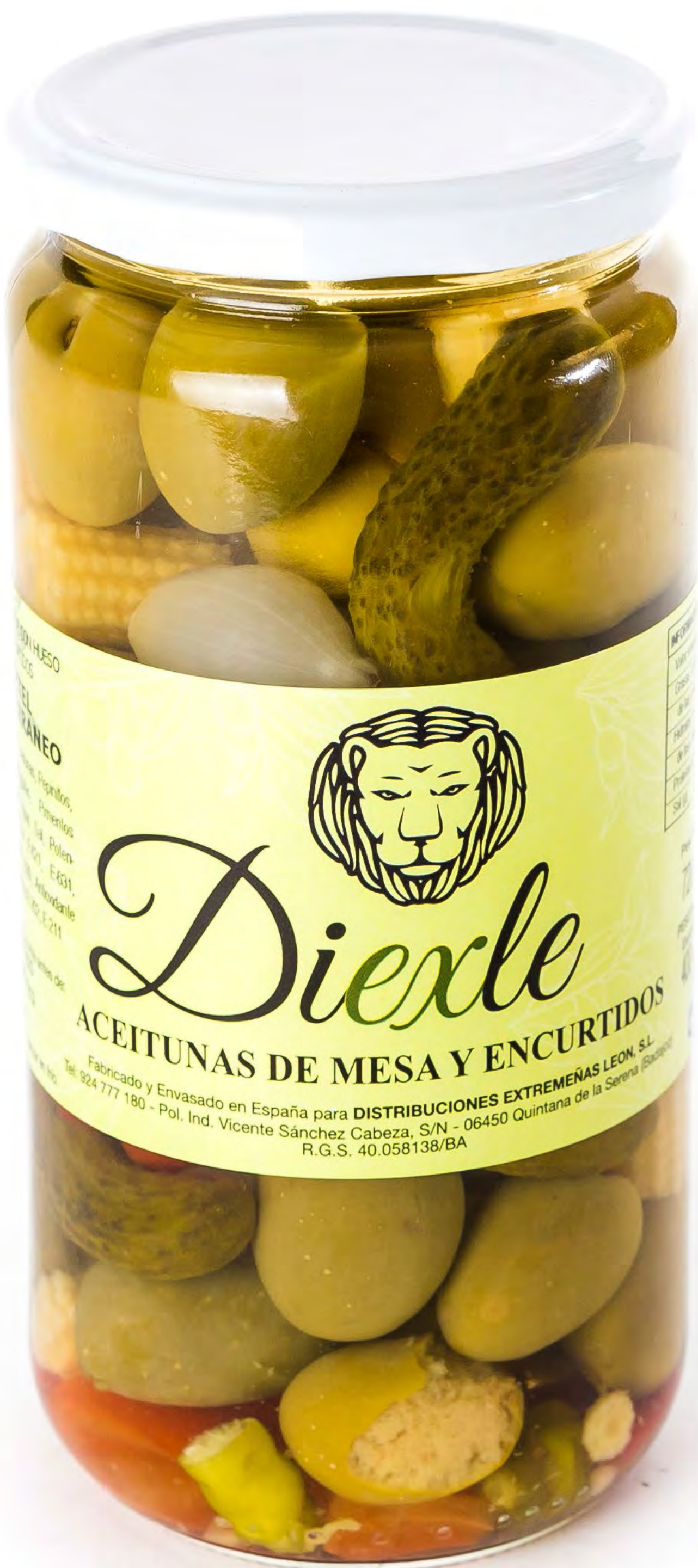
Aceituna Diexle Mediterranea 8 uds/caja