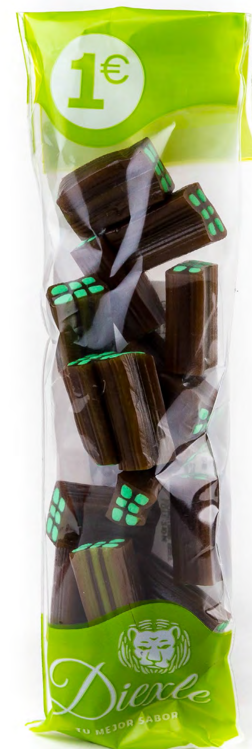
Cod: 193068 Ladrillo Cola 20 und/caja