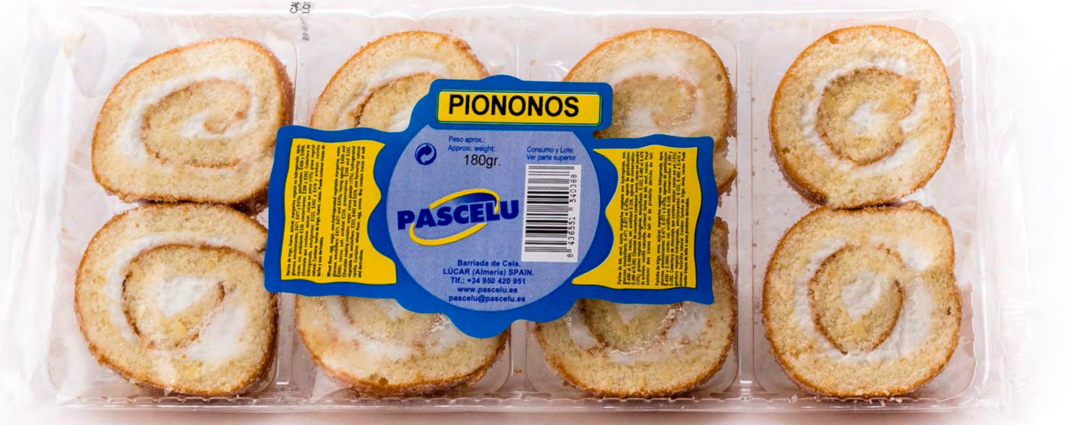
Piononos Rell. Crema 12 uds/caja