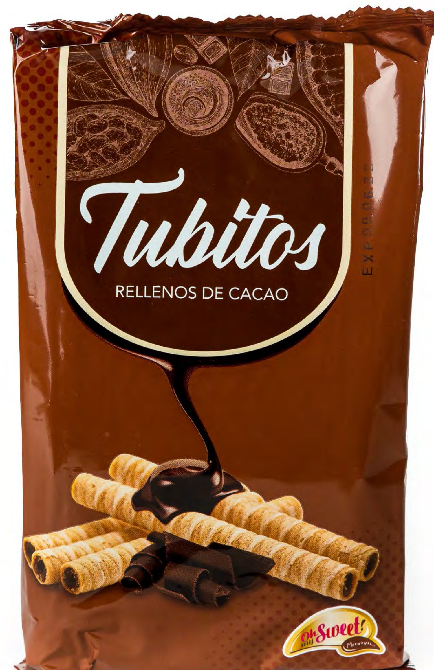
Cod. 059045 Gloski Tubitos Cacao 12 und/caja