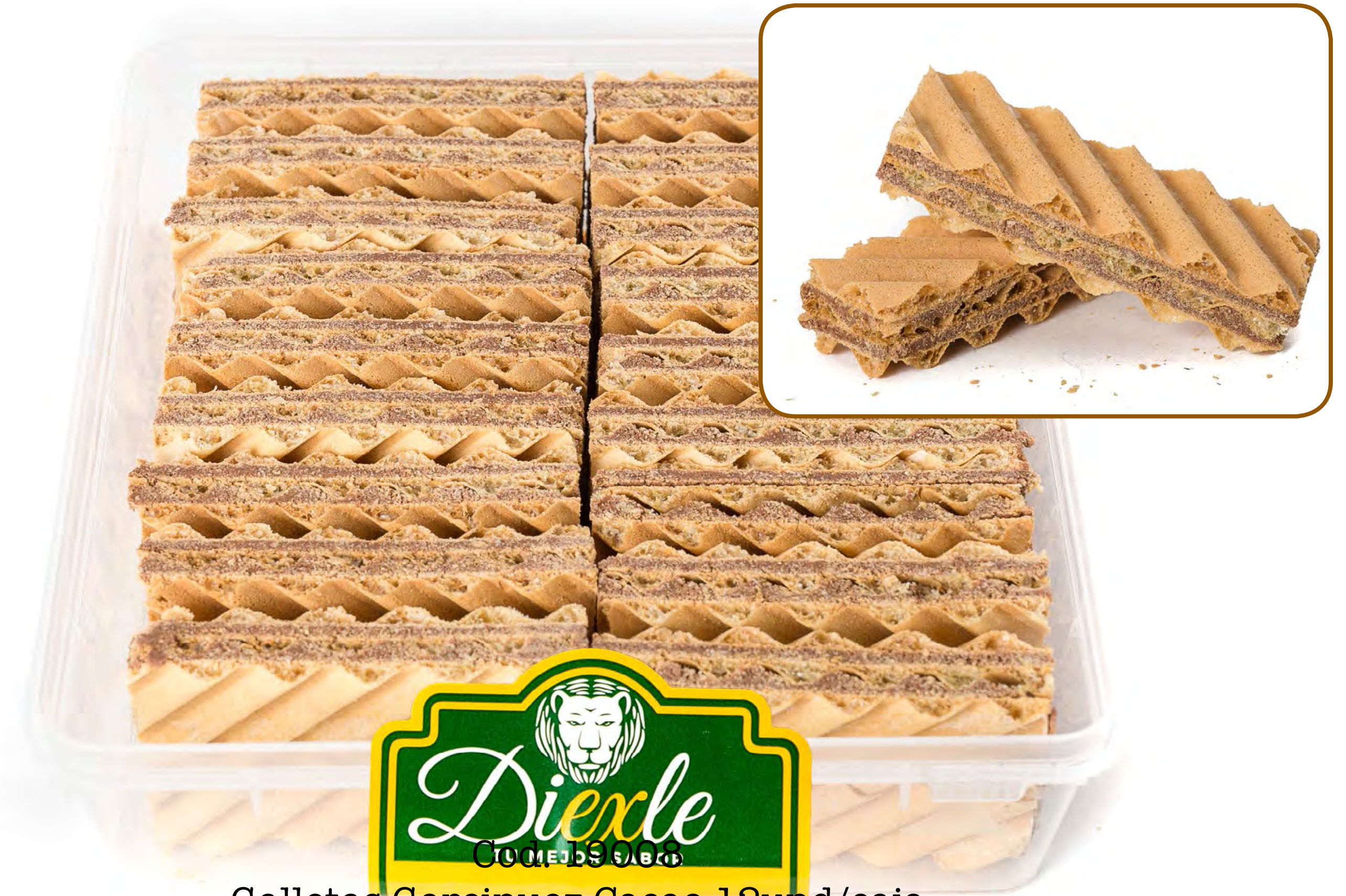
Galletas Garcinuez Cacao 12und/caja