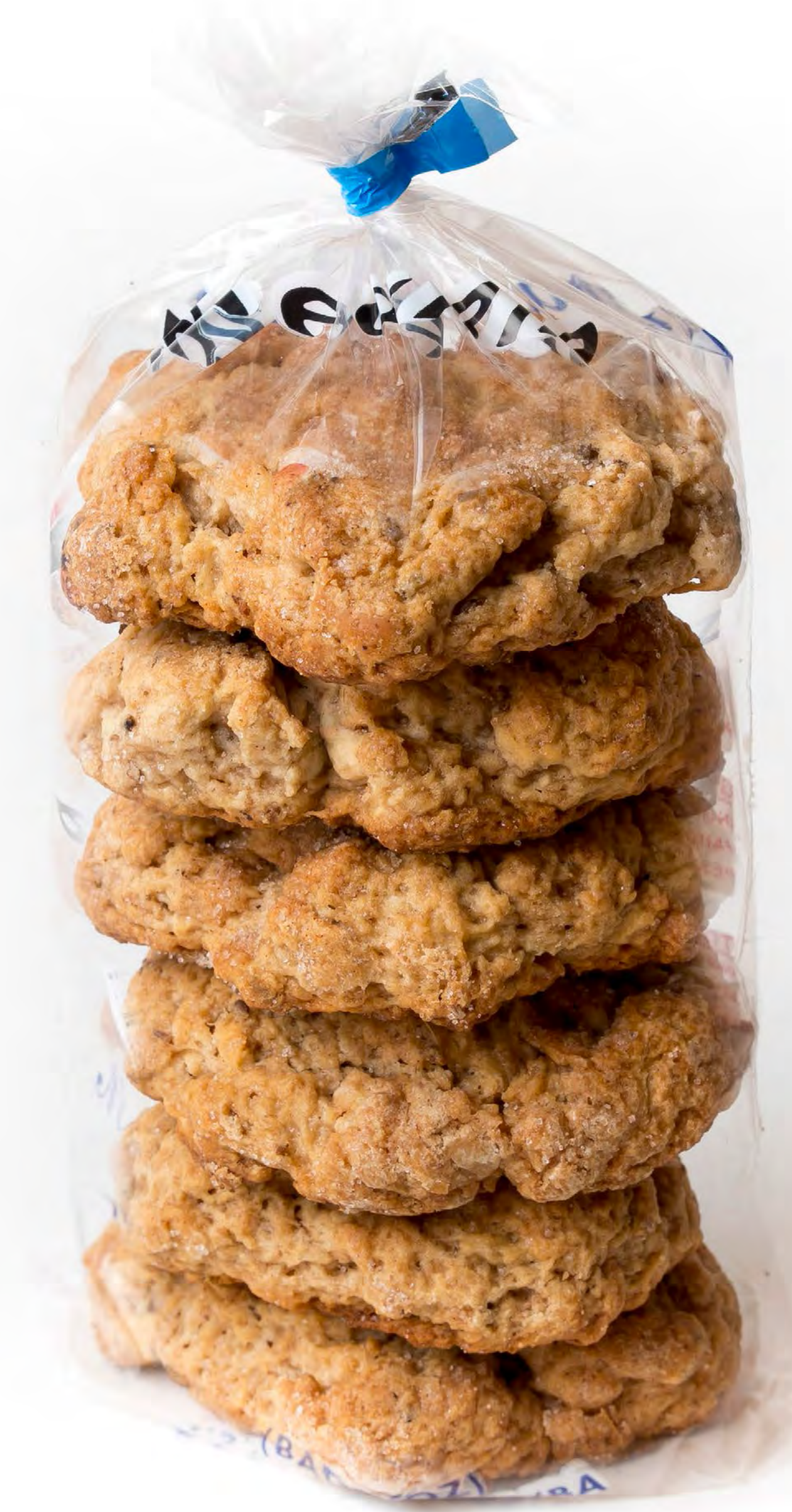
Tortas Chicharrones 18 uds/caja