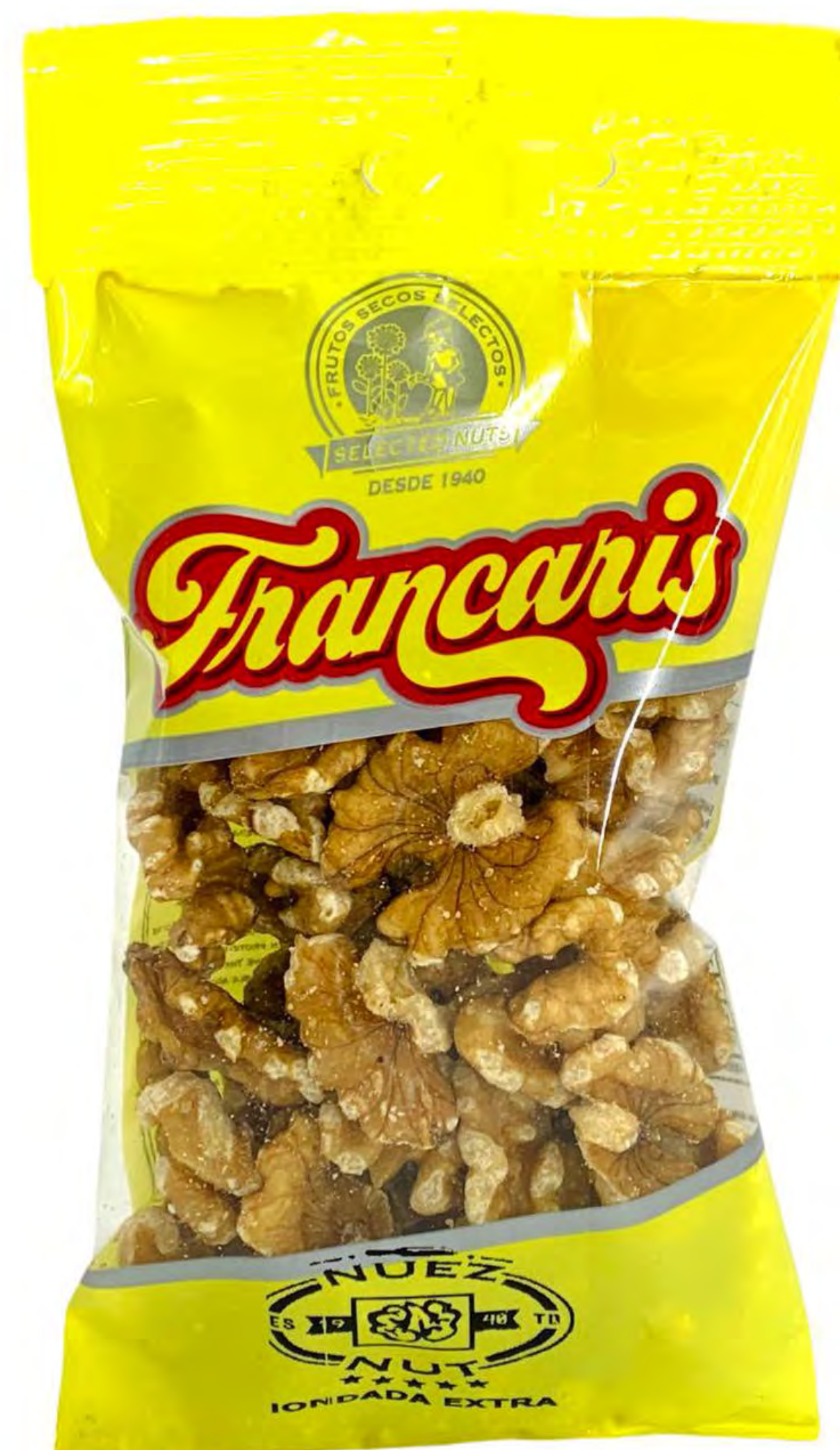
Nuez mondada USA 8 und/caja