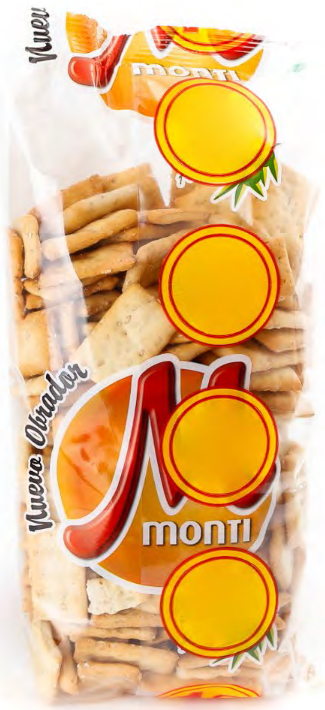
Regañadas Aceite de Oliva 12 uds/Caja