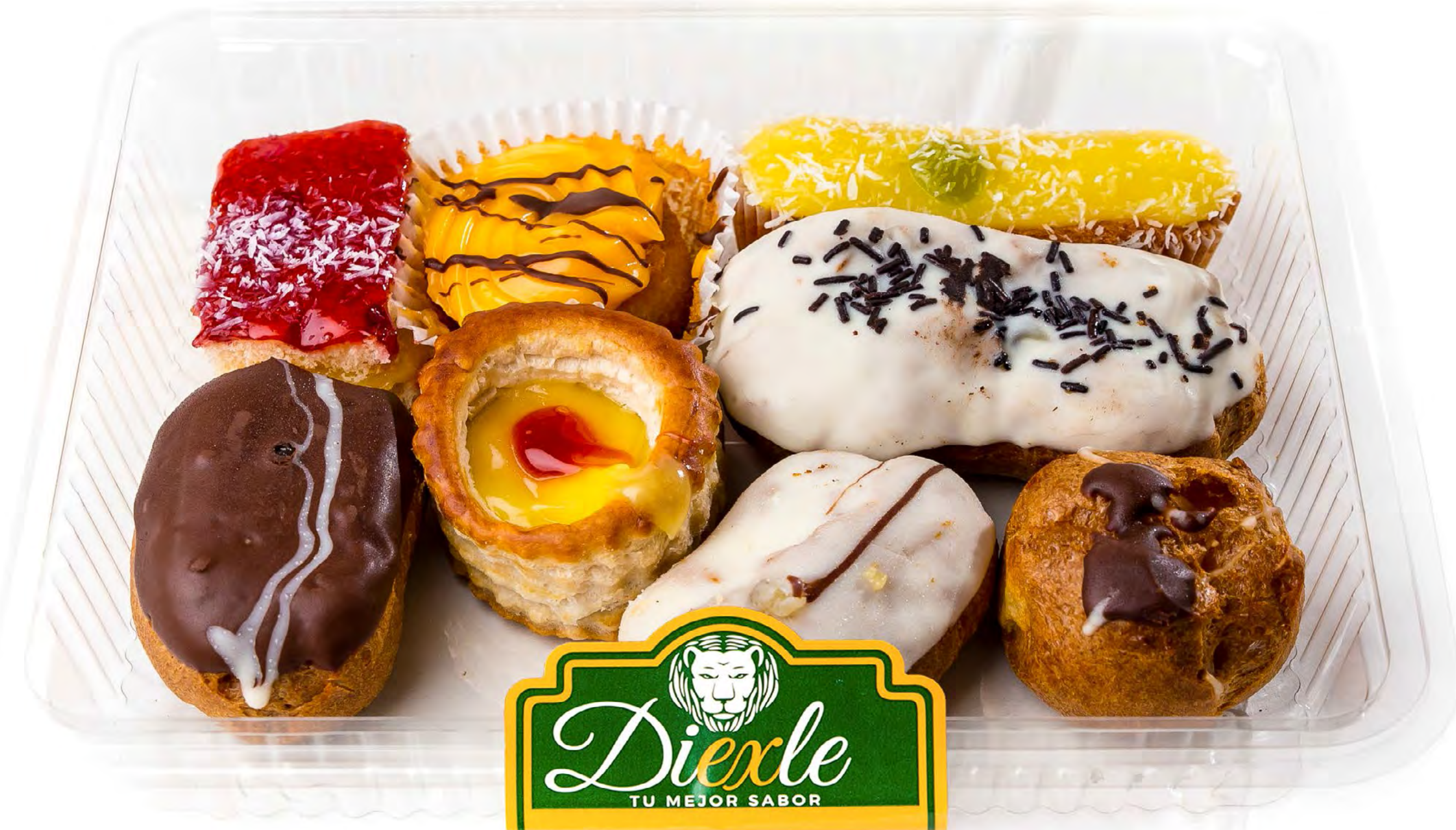
Cod. 128011 Pastel Surtido Diexle 6 uds/caja