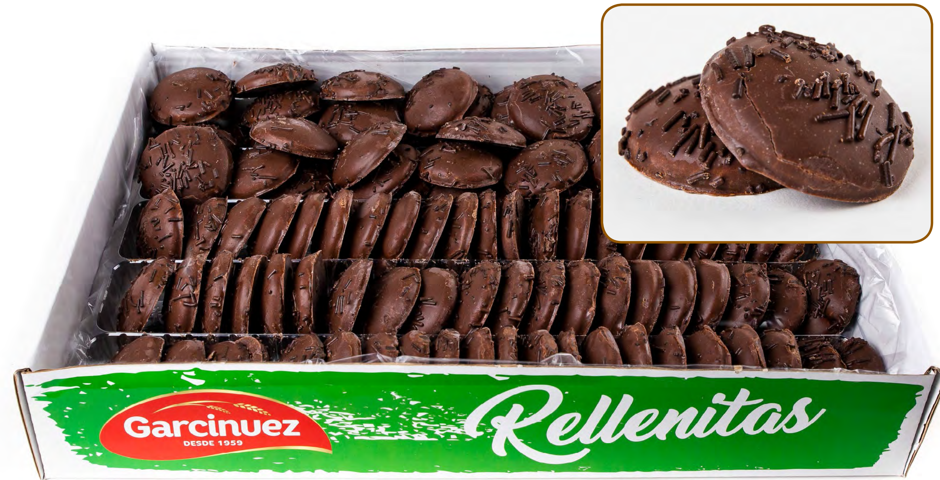
Cod. 19010 Mexicanitos Trufa 1,7 Kg.