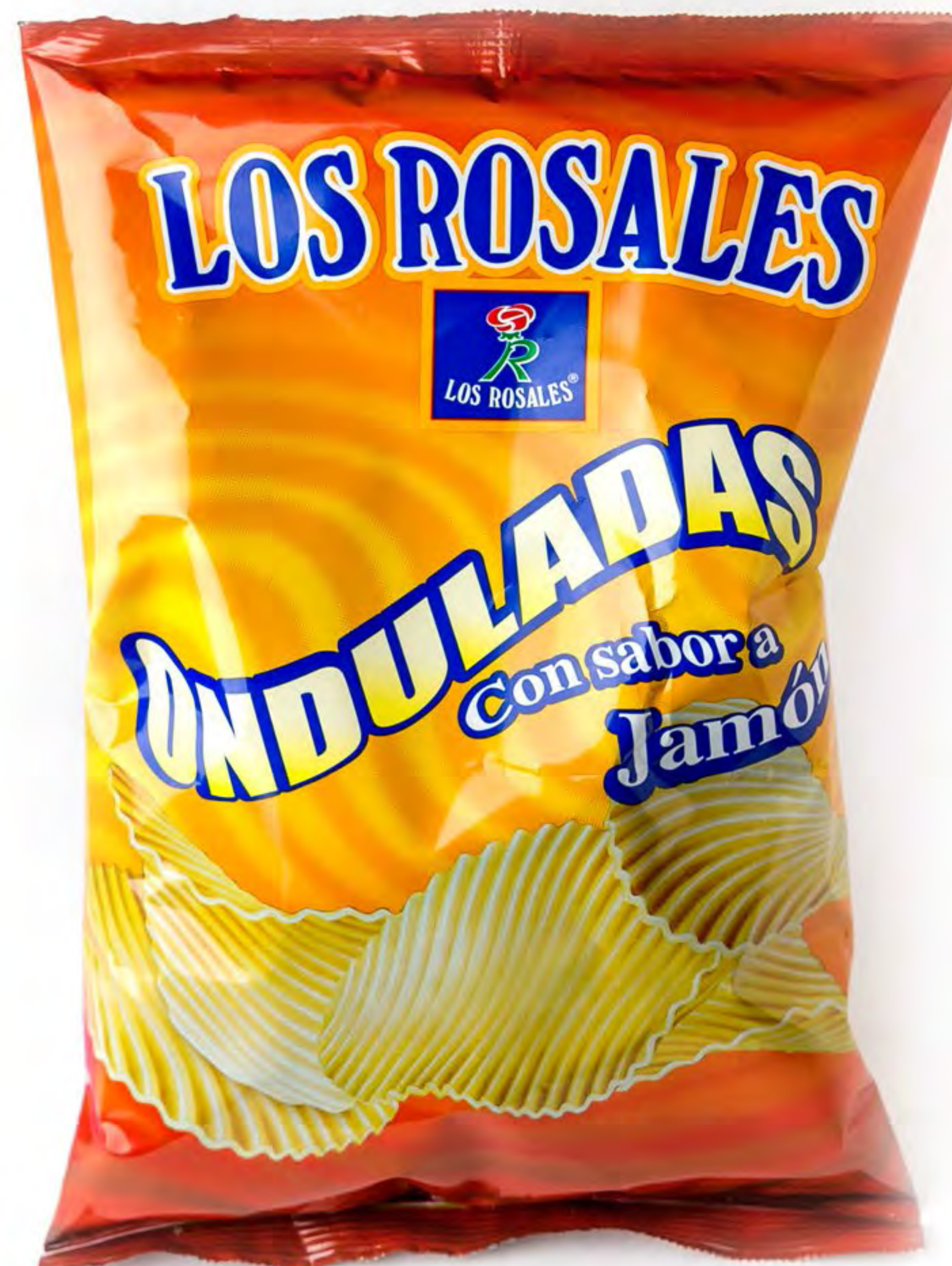
Patatas Onduladas Jamón Sabor Jamón 140 g. x 12 uds/caja