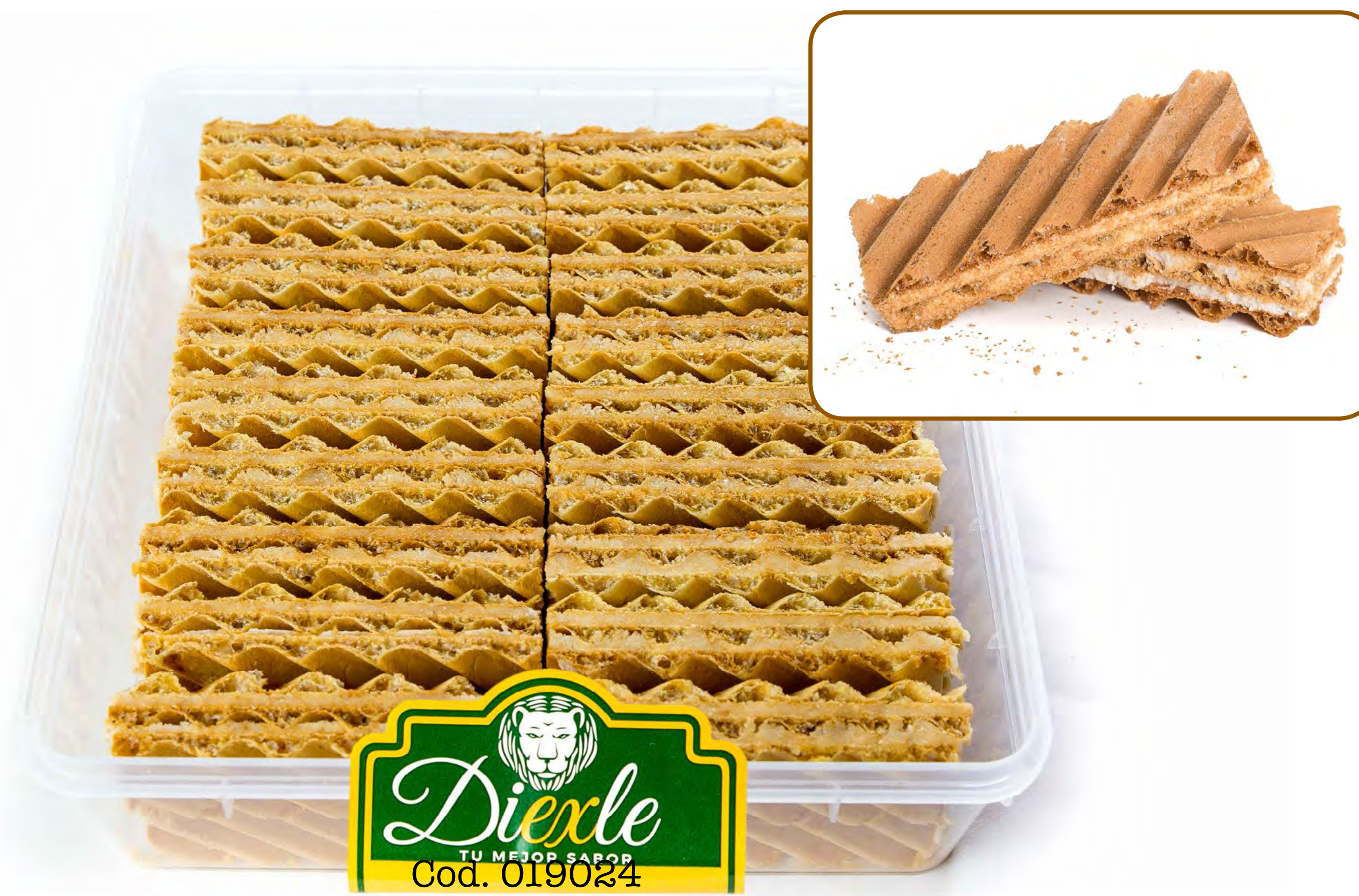
Galletas Garcinuez Nata 400g 12und/caj