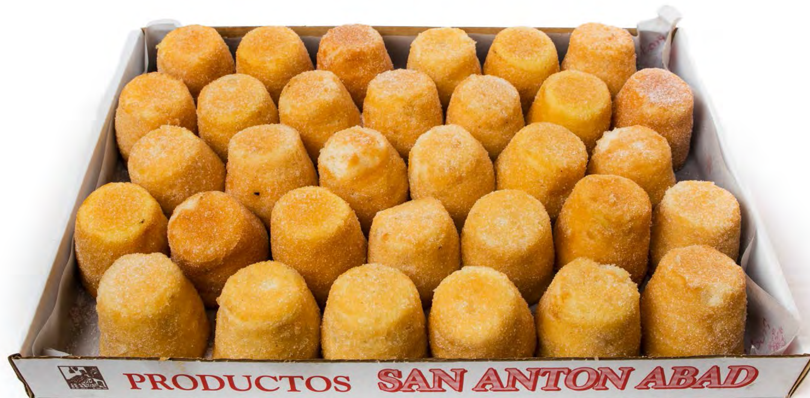
Mojicón Almendra 2,5 Kg.