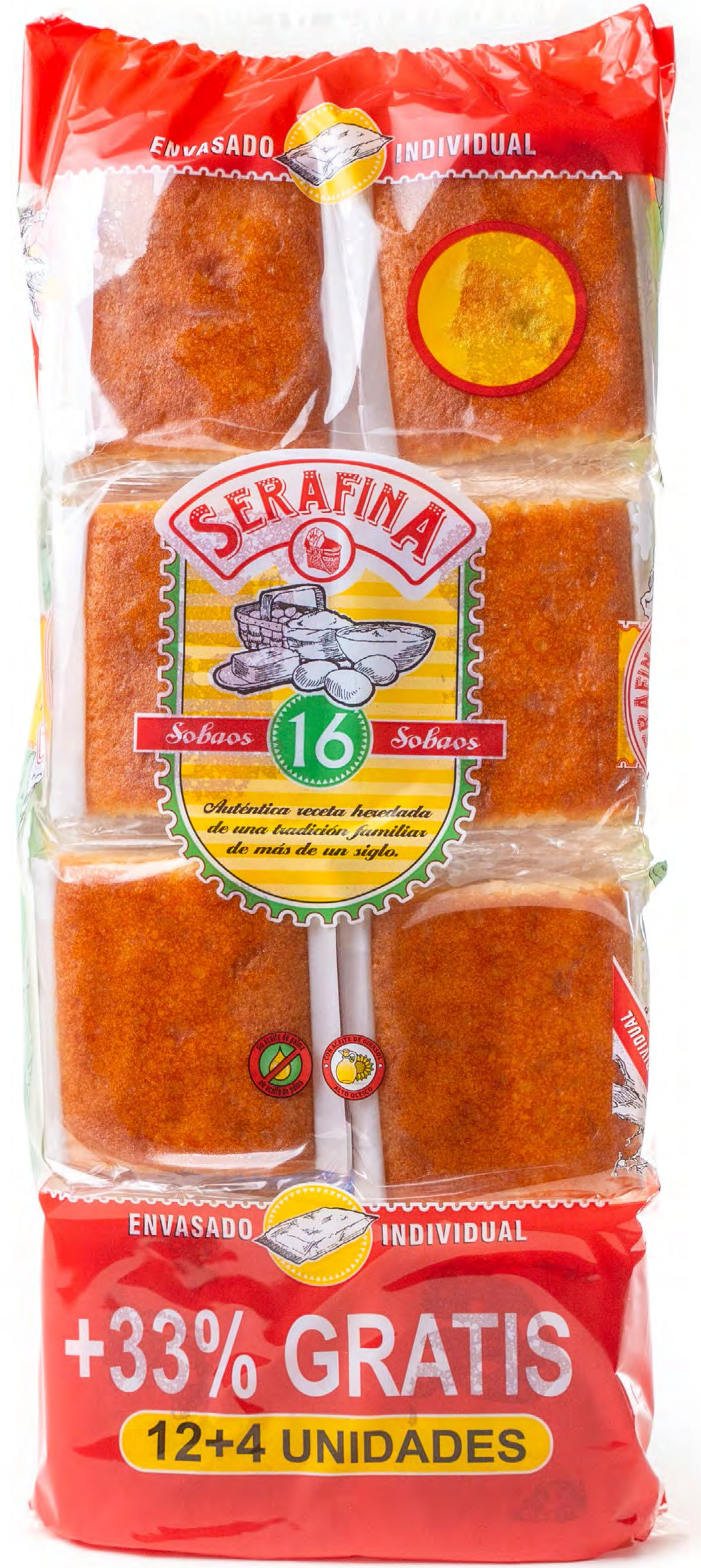
Sobaos familiar 9 und/caja