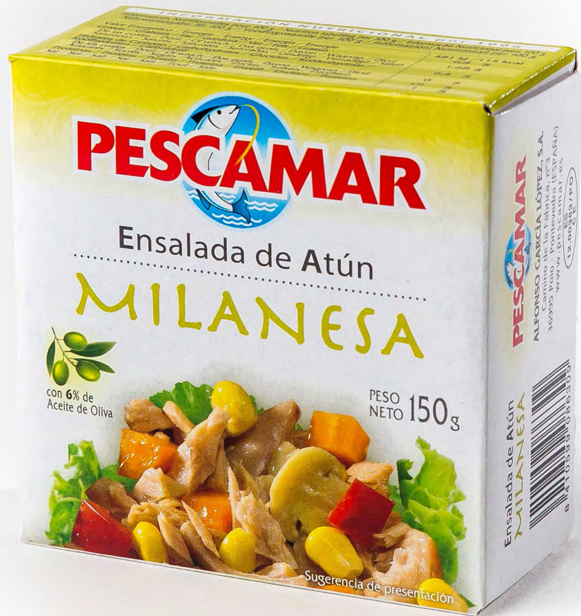
Cod. 188081 Ensalada Milanesa 24 und/caja