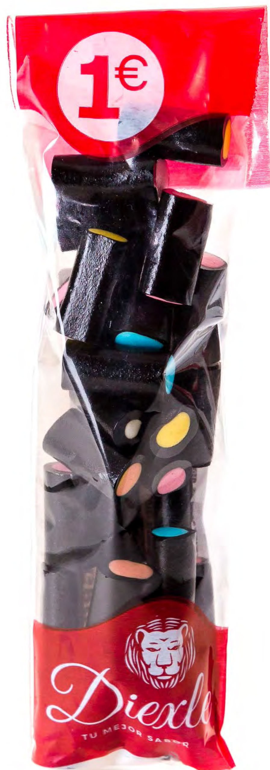
Cod: 193063 Tacos Rell. Negro 20 und/caja