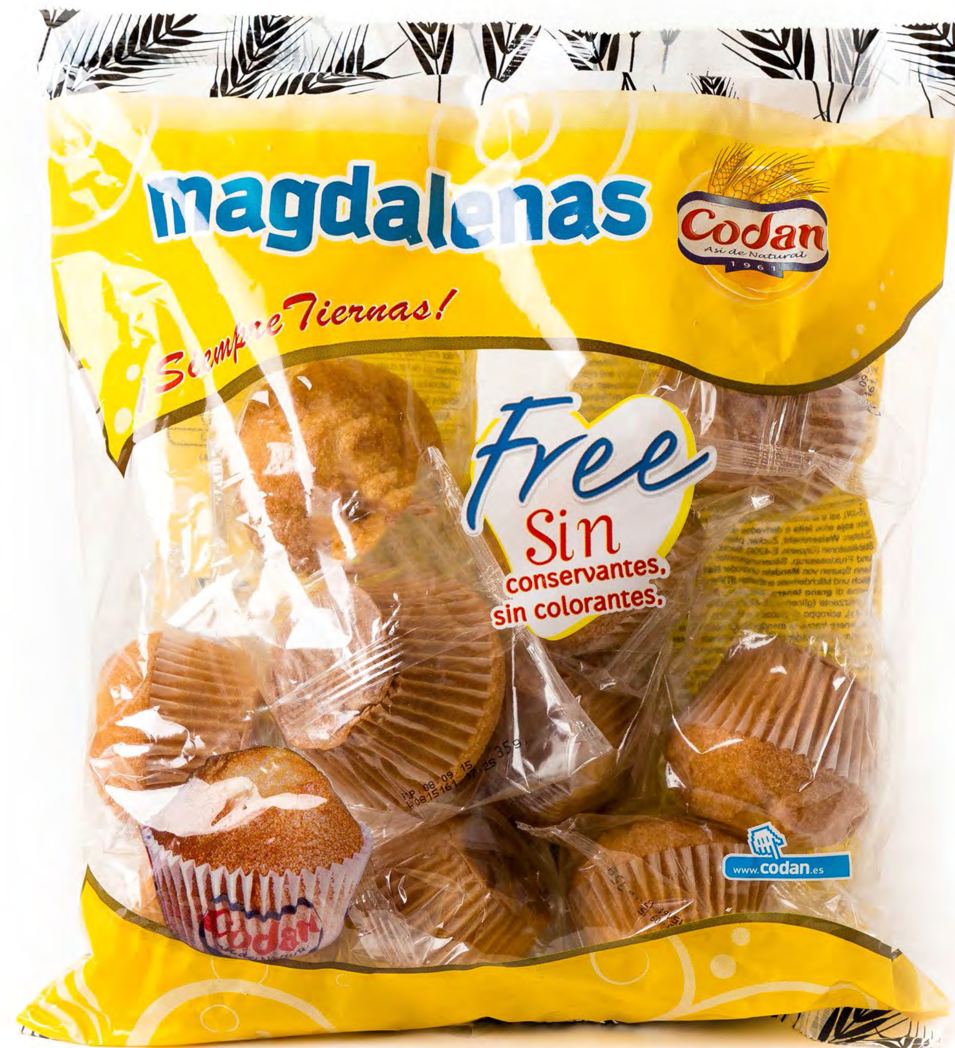
Magdalenas Free Codan 350g x 6 uds/caja