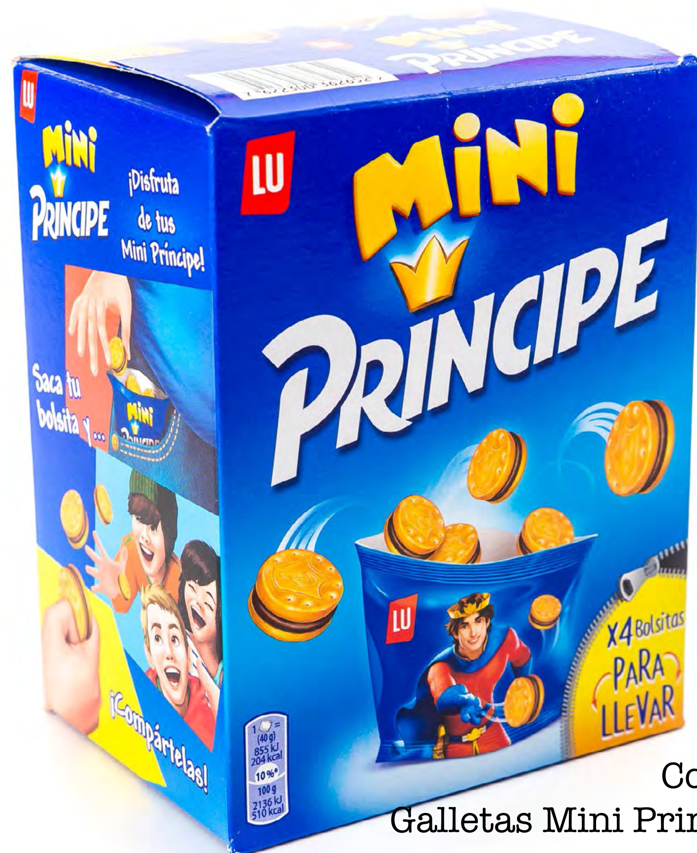
Cod. 190007 Galletas Mini Principe LU 160g 12 und/caja