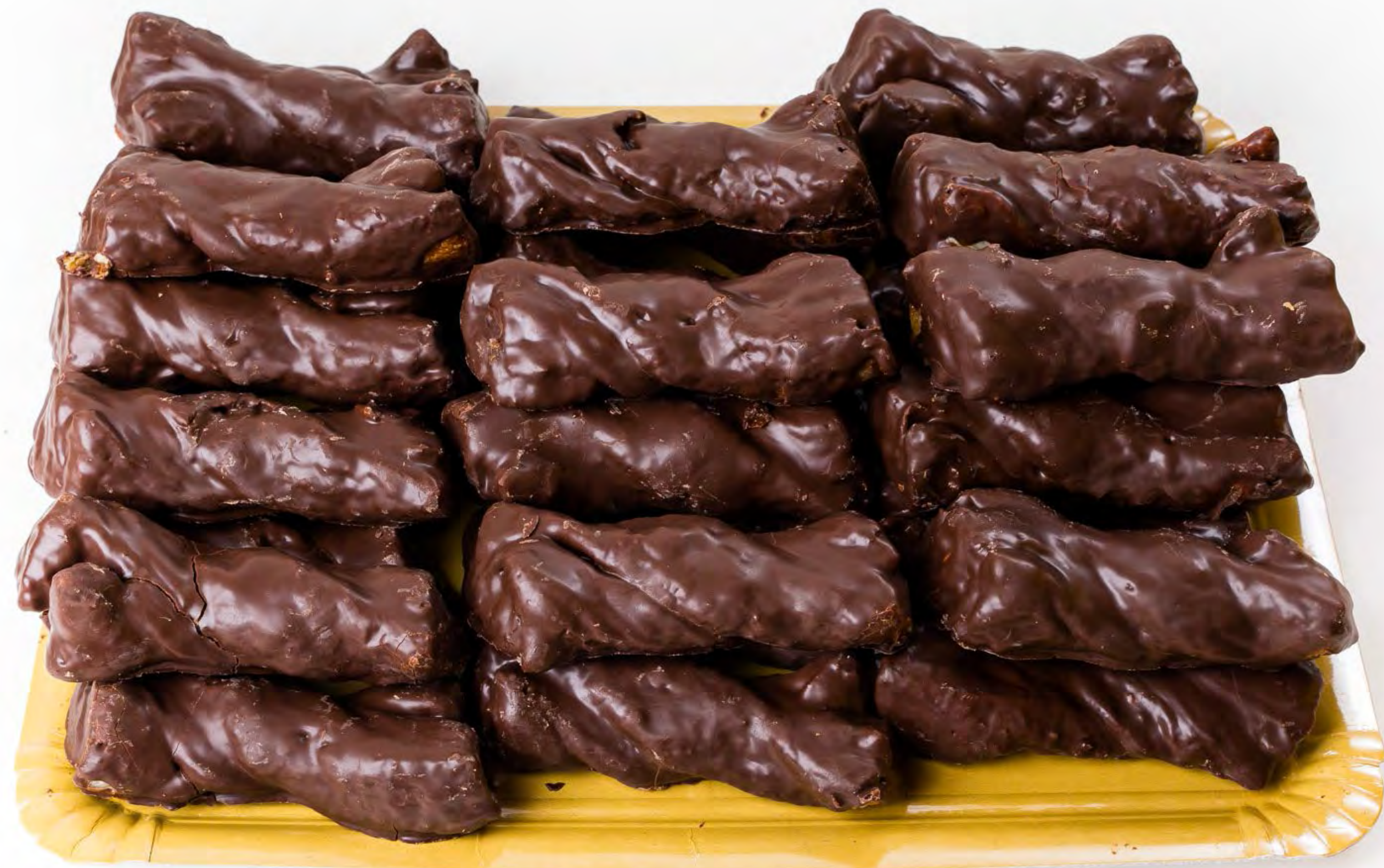
Lazos Choco 2kg.