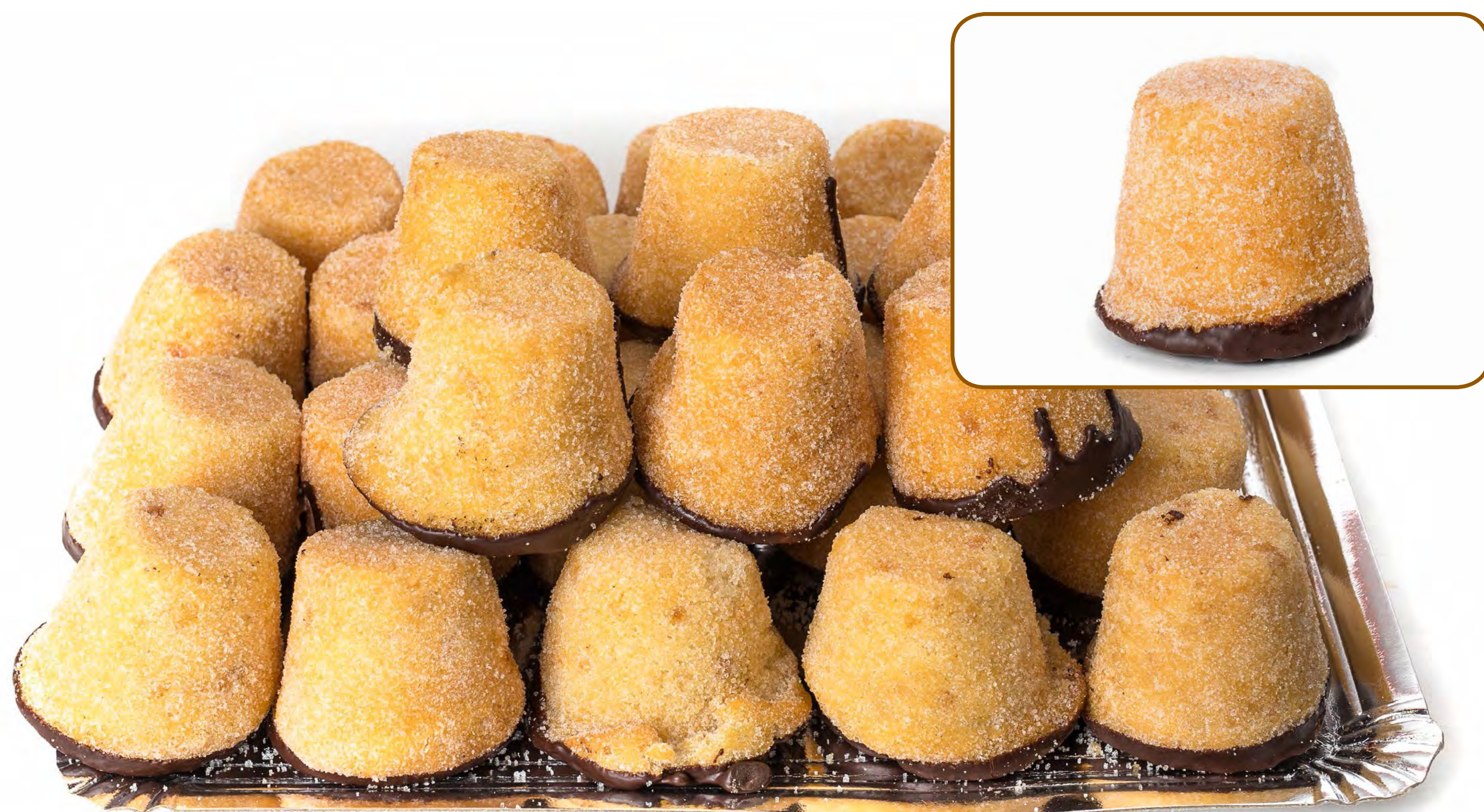
Mojicón Choco 2 Kg.