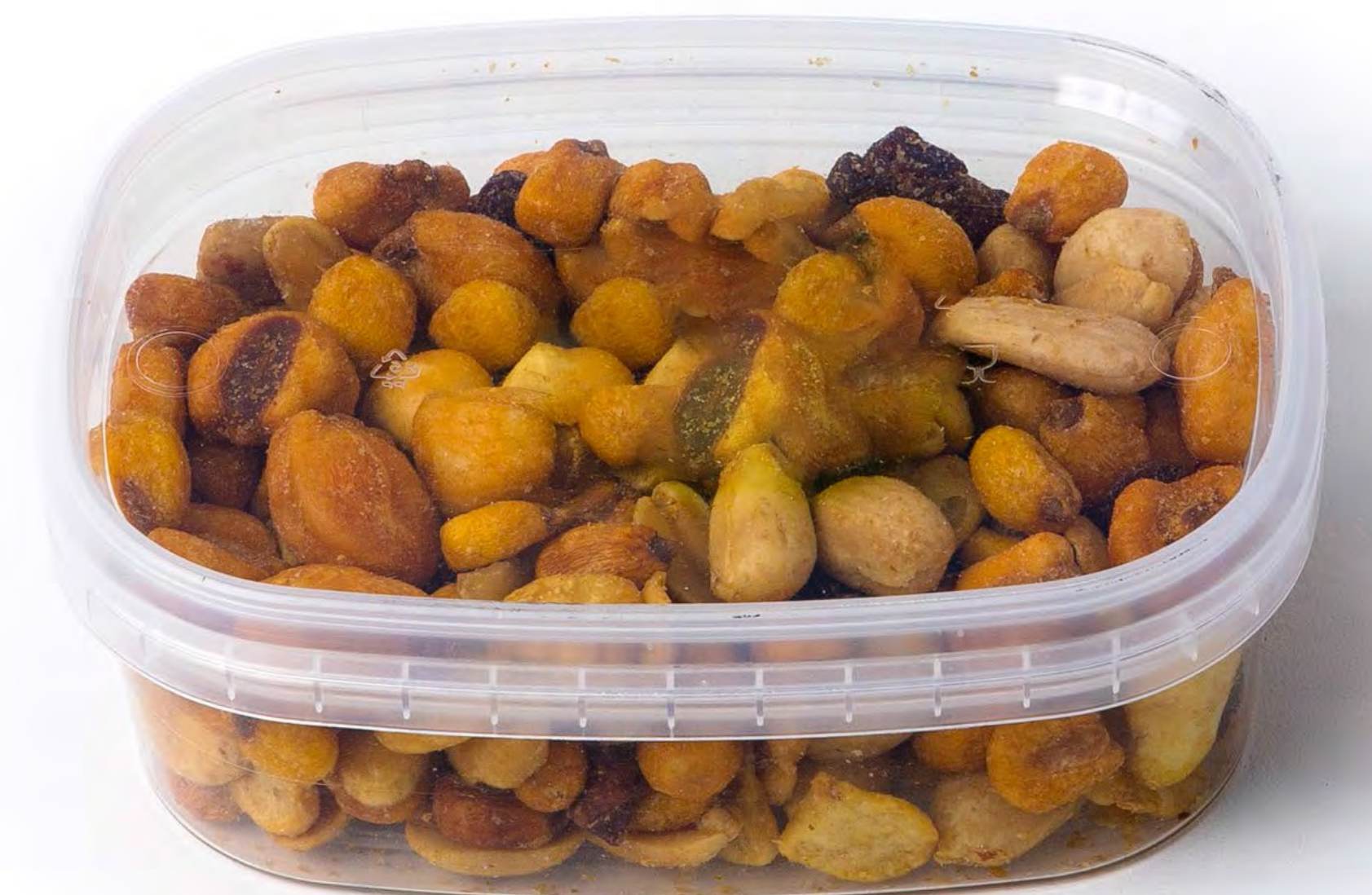
Coctel Frutos Secos 12 uds/Caja