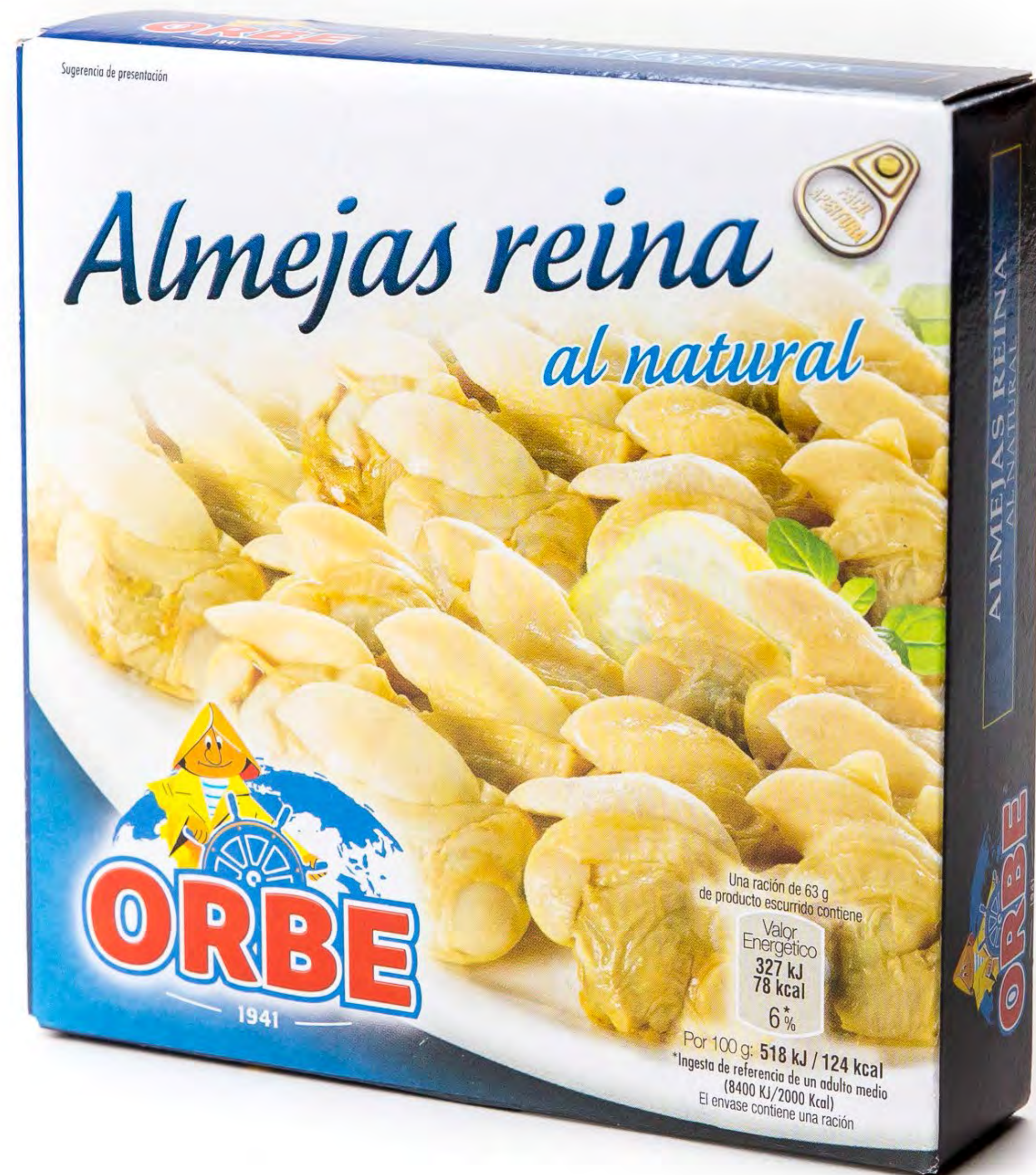
256008 - Almejas Reina al Natural 26 uds/caja