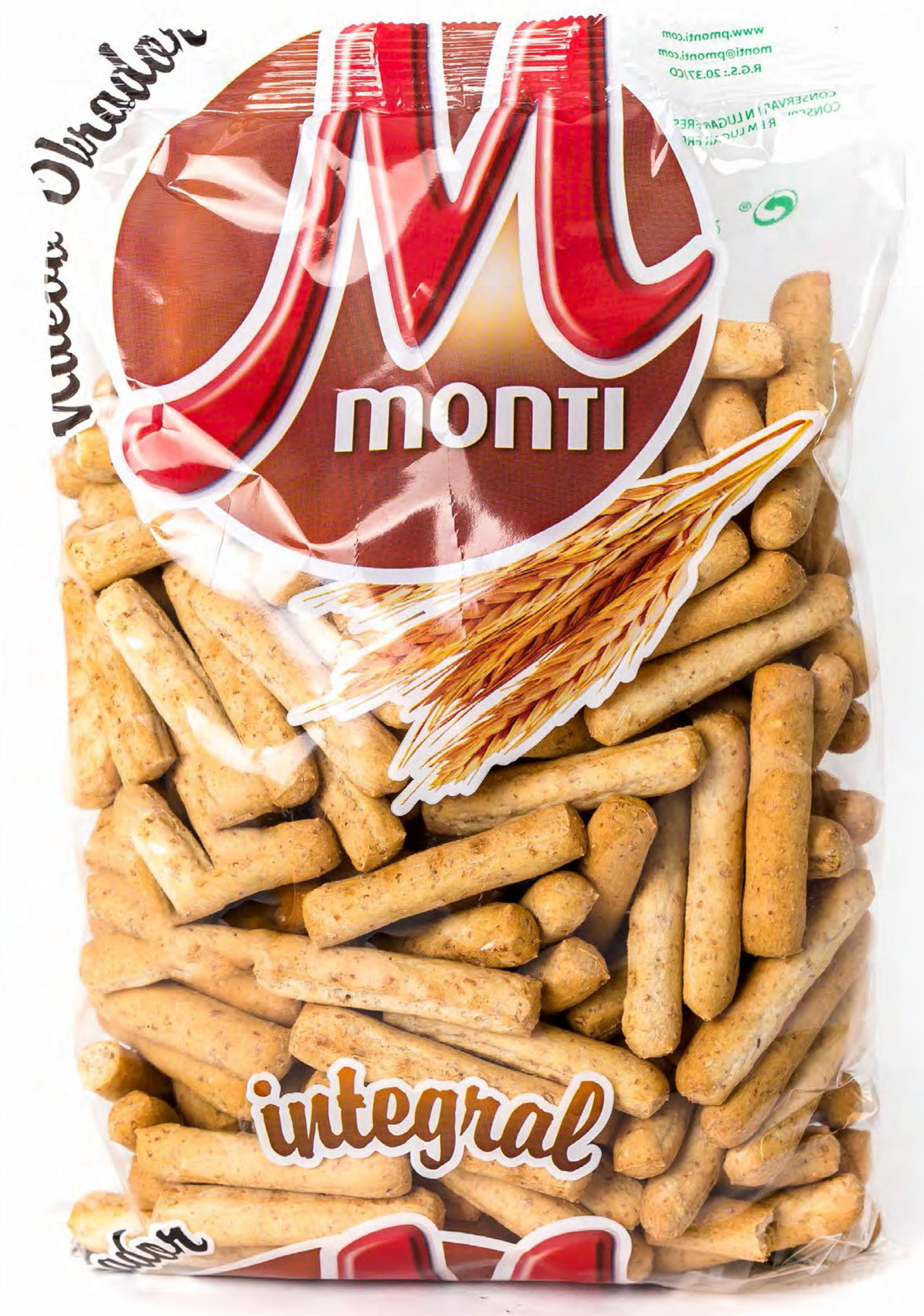
Colines Integrales 12 uds/Caja