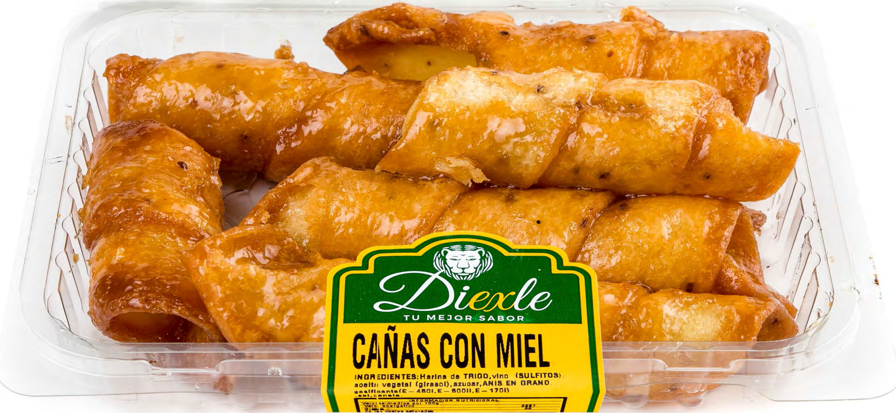
Cod.093017 - Borrachuelos Miel 16 uds/caja