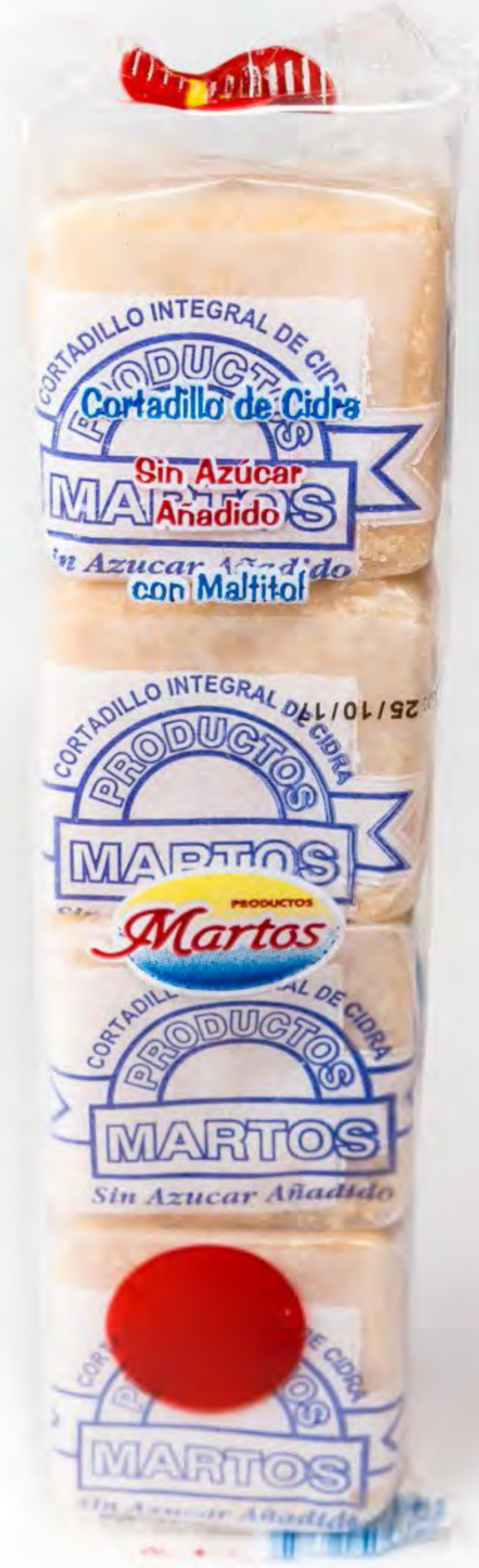
Cortadillos Cidra Sin Azucar 10 und/ caja