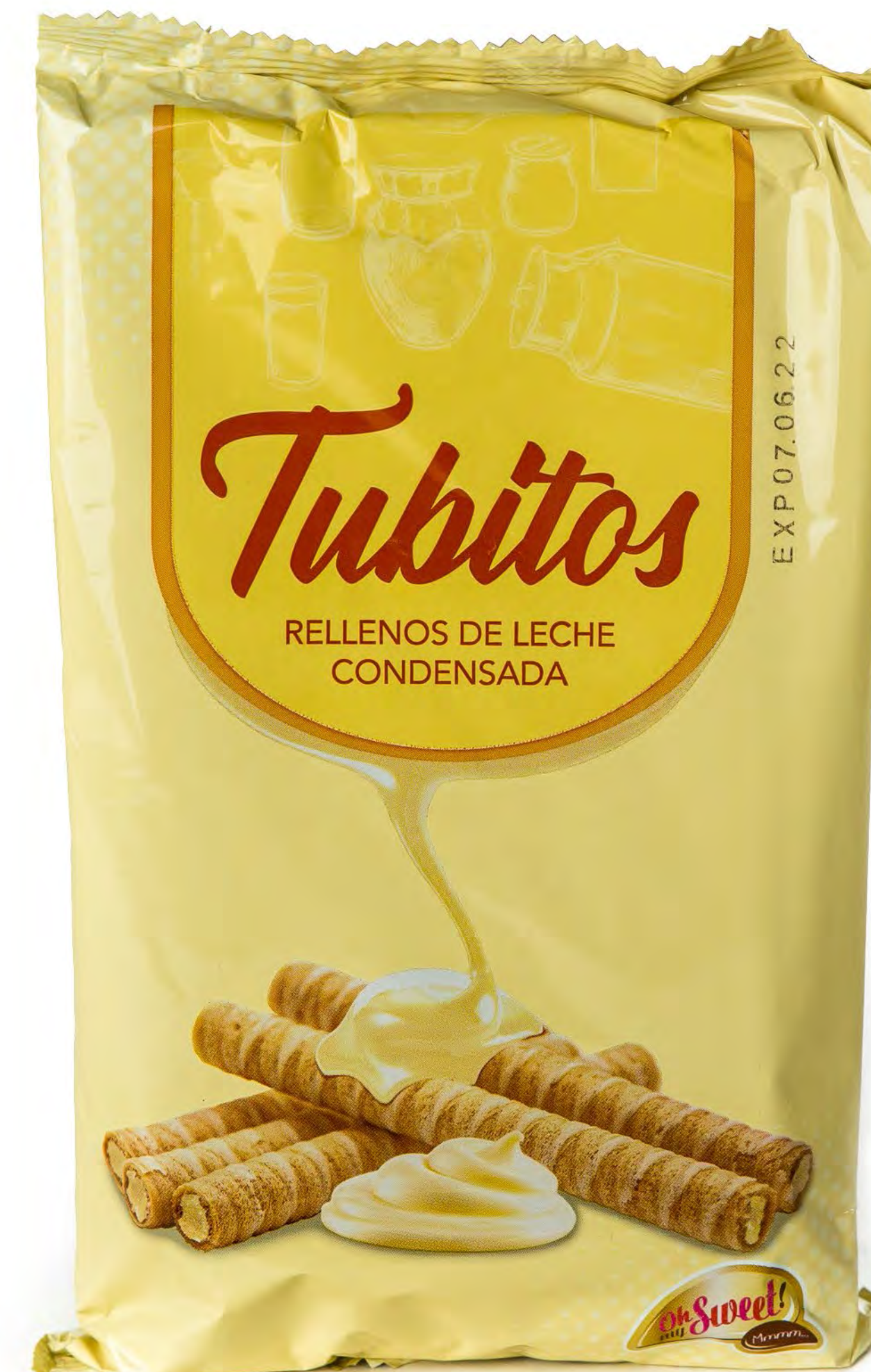
Cod. 059057 Gloski Tubito Leche Condensada 12 und/caja