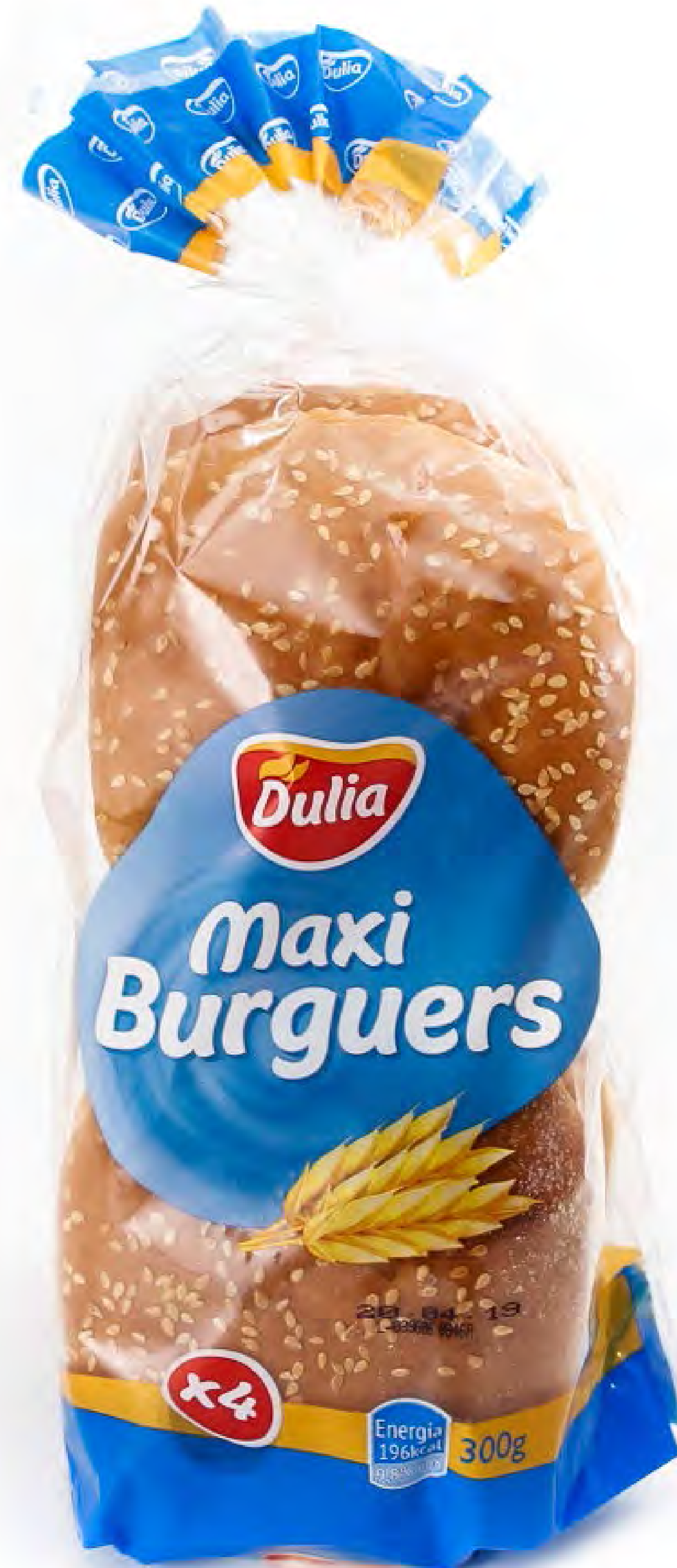
Pan Superburguer 300g. x 6 uds/caja