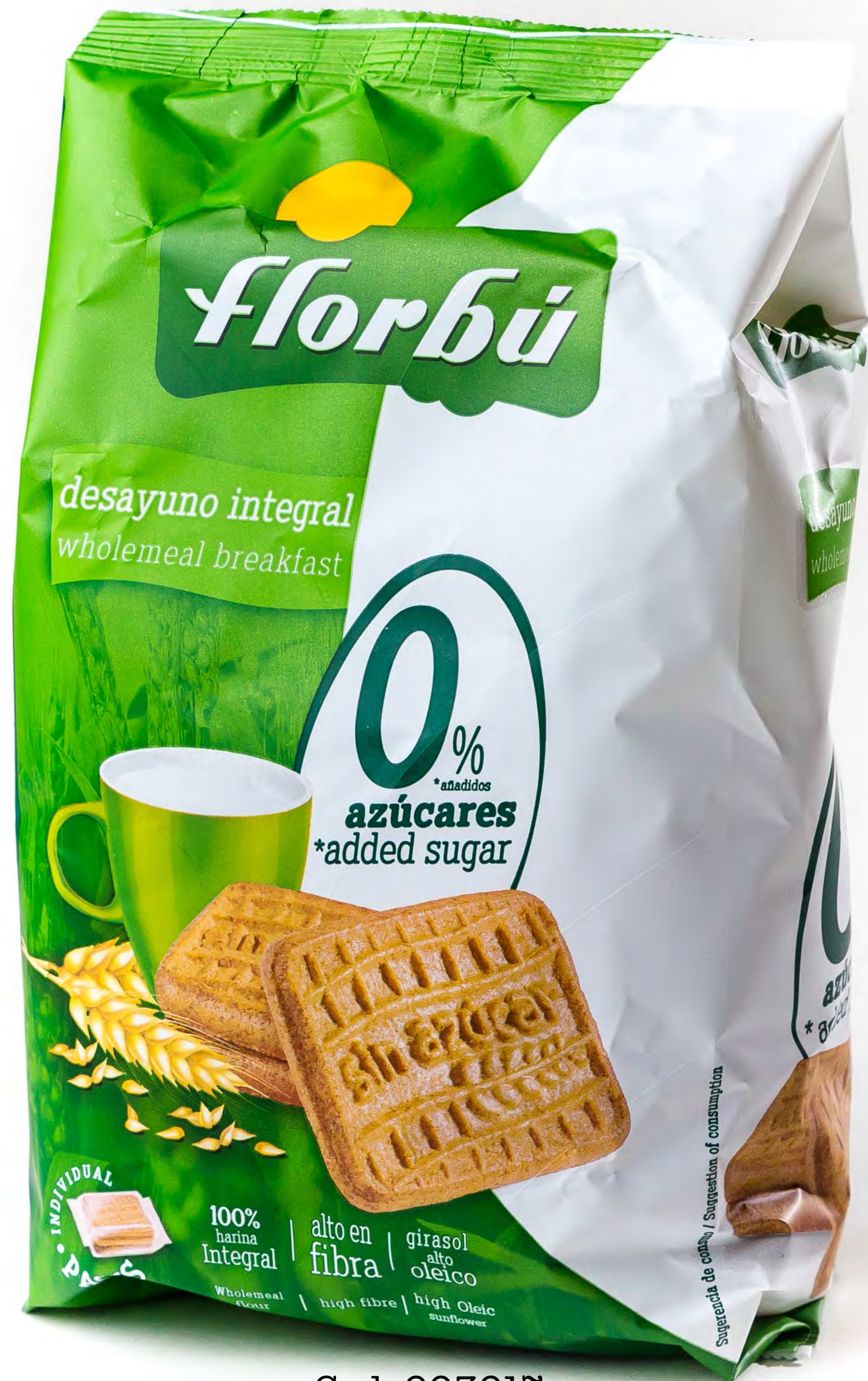
Cod. 003017 Desayuno integral 0% Azúcar 6 uds/caja