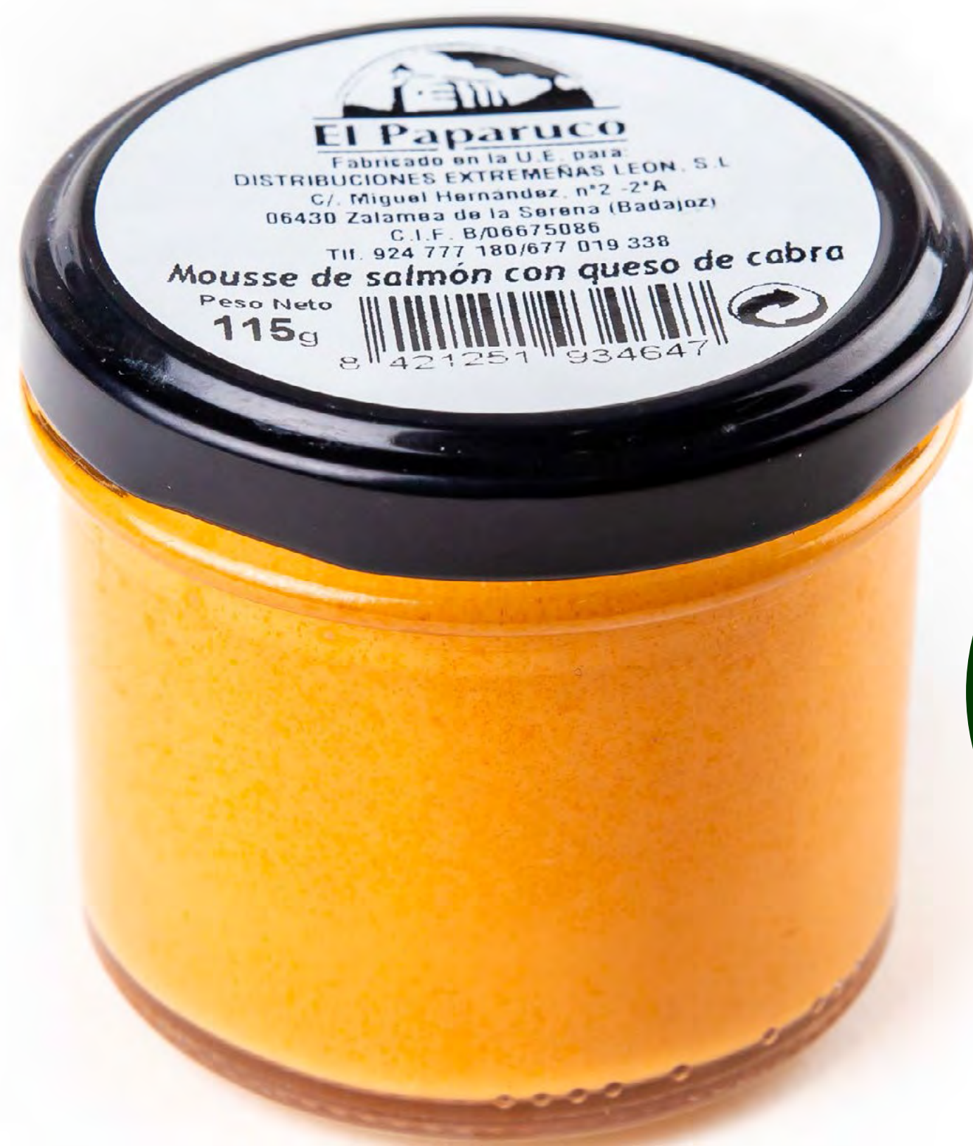
Cod. 048005 - Mousse Salmón Queso - 12 uds/caja