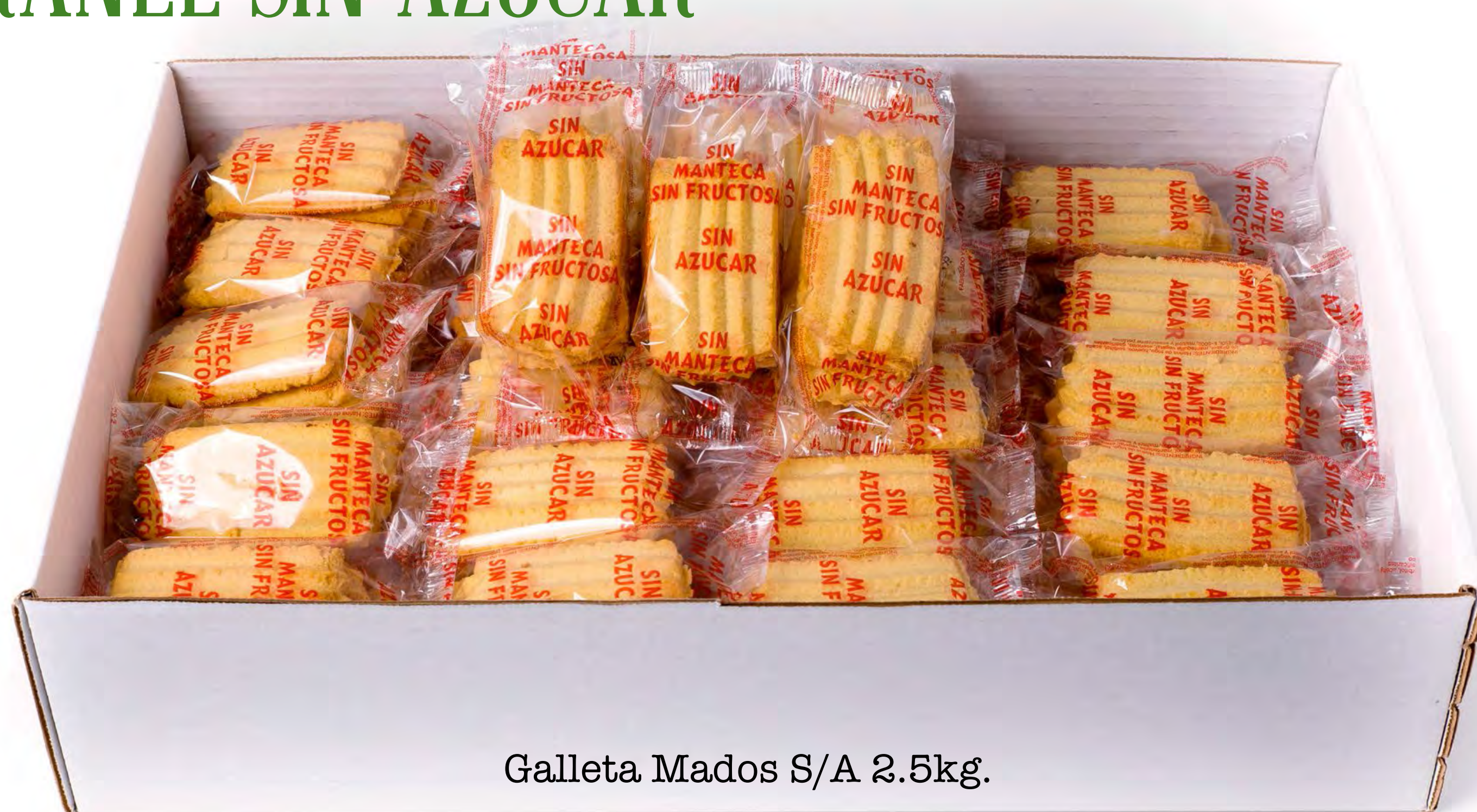
Galleta Mados S/A 2.5kg.