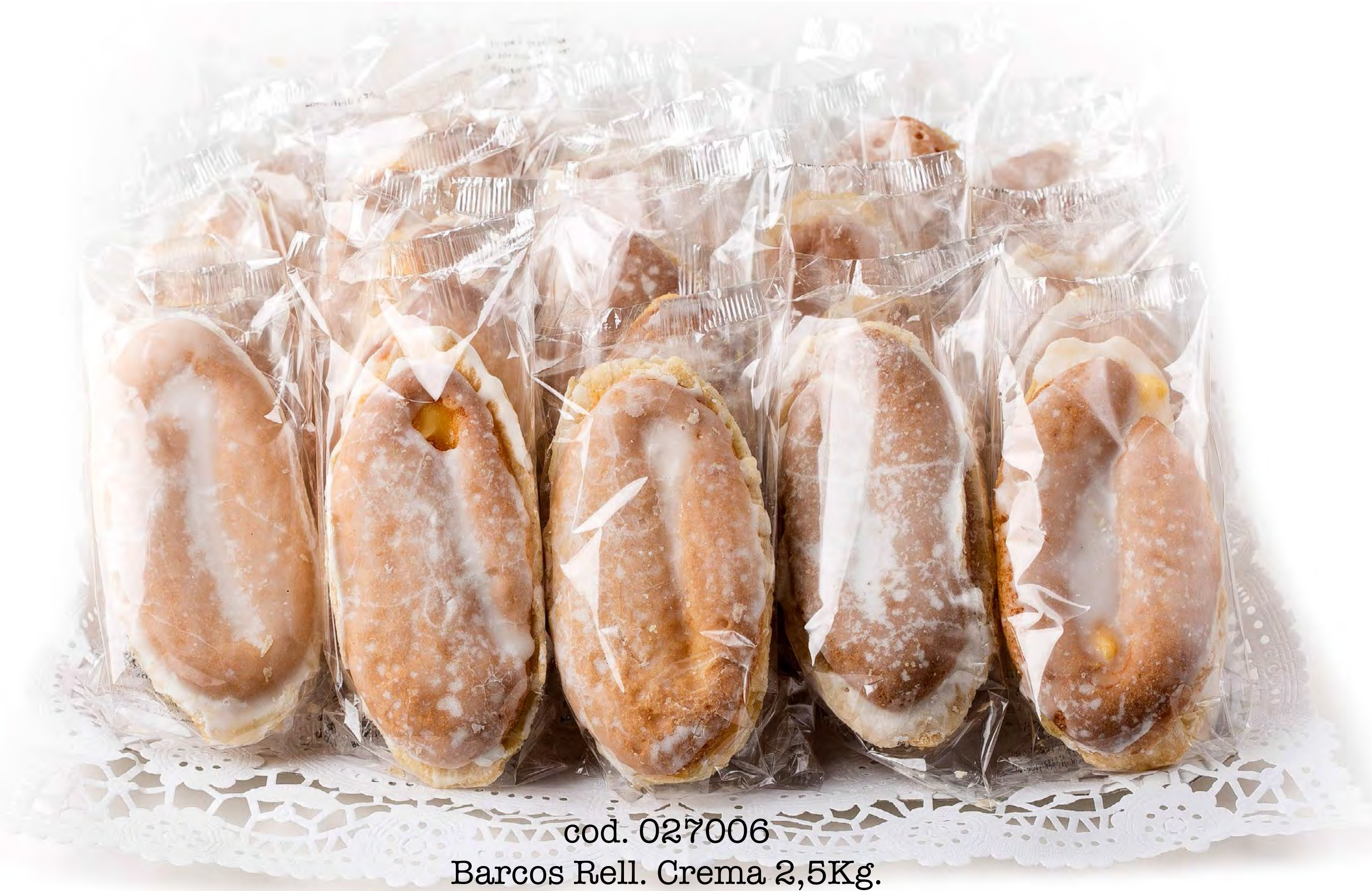
cod. 027006 Barcos Rell. Crema 2,5Kg.