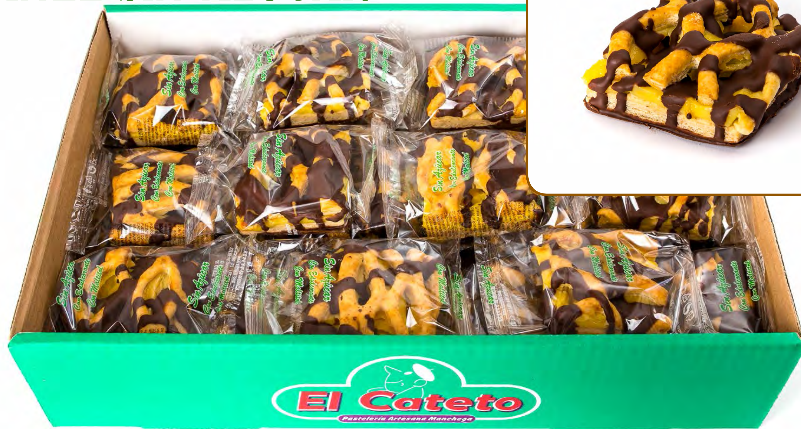
Rejas de Crema S/A 2 Kg.