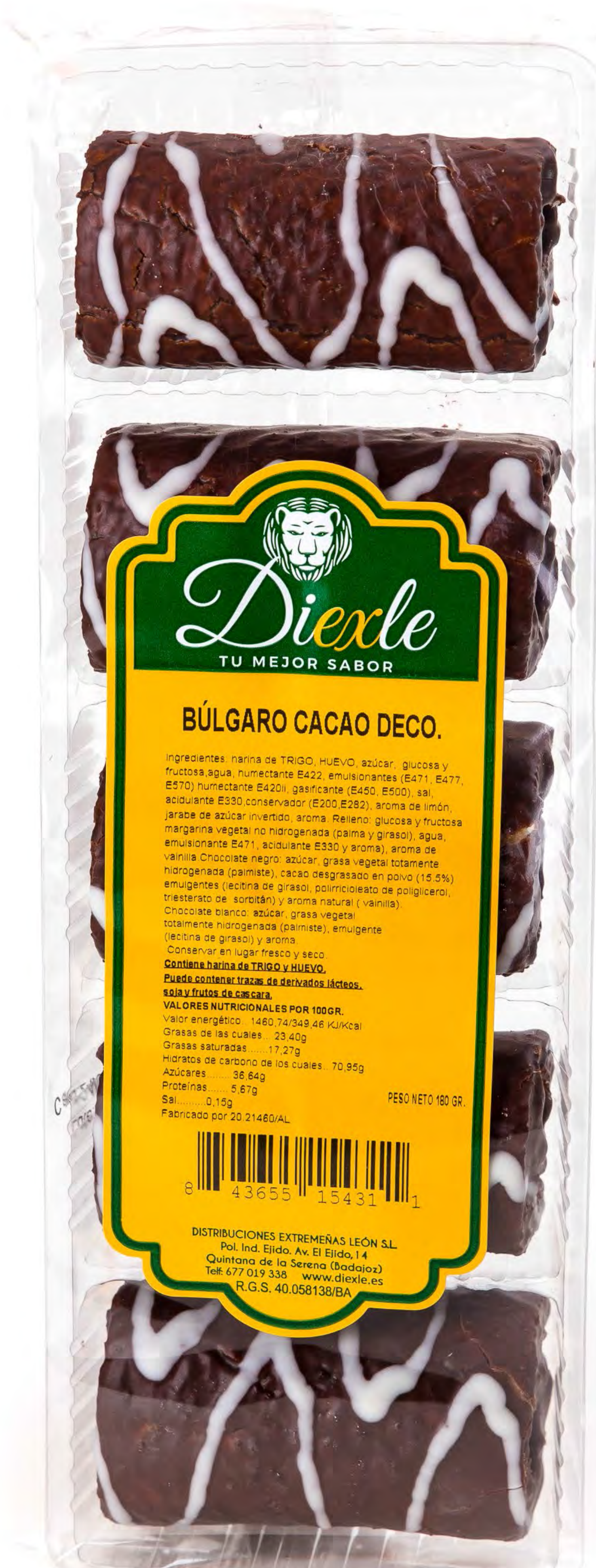
Búlgaros 180g. x 16 uds/caja