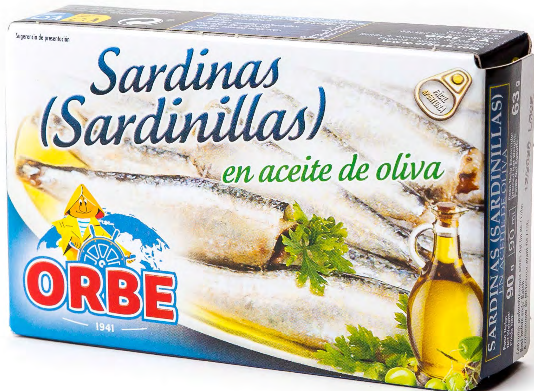
Cod. 256005 - Sardinias Aceite Oliva RR-90 - 25 uds/caja