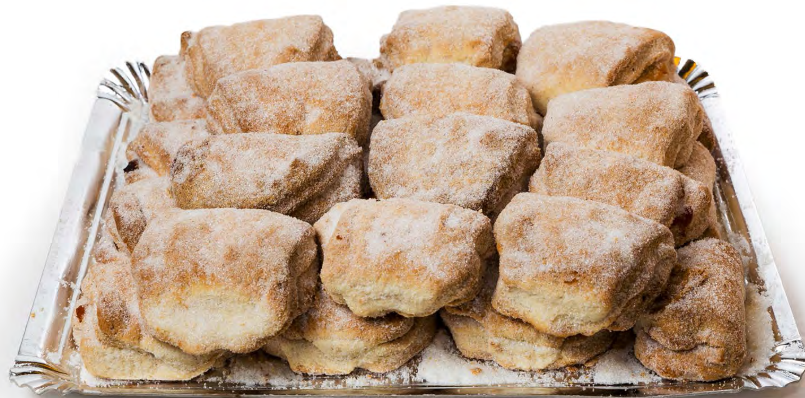
Empanadilla Mateca 2 Kg.