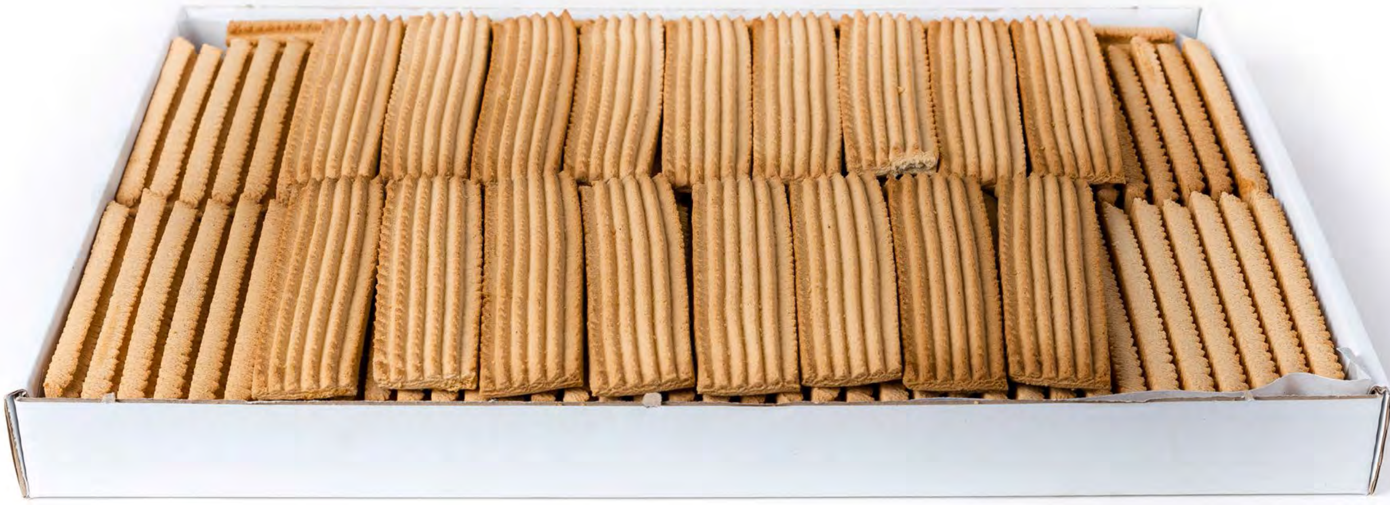
Galleta Rizada Pueblo 3 Kg.