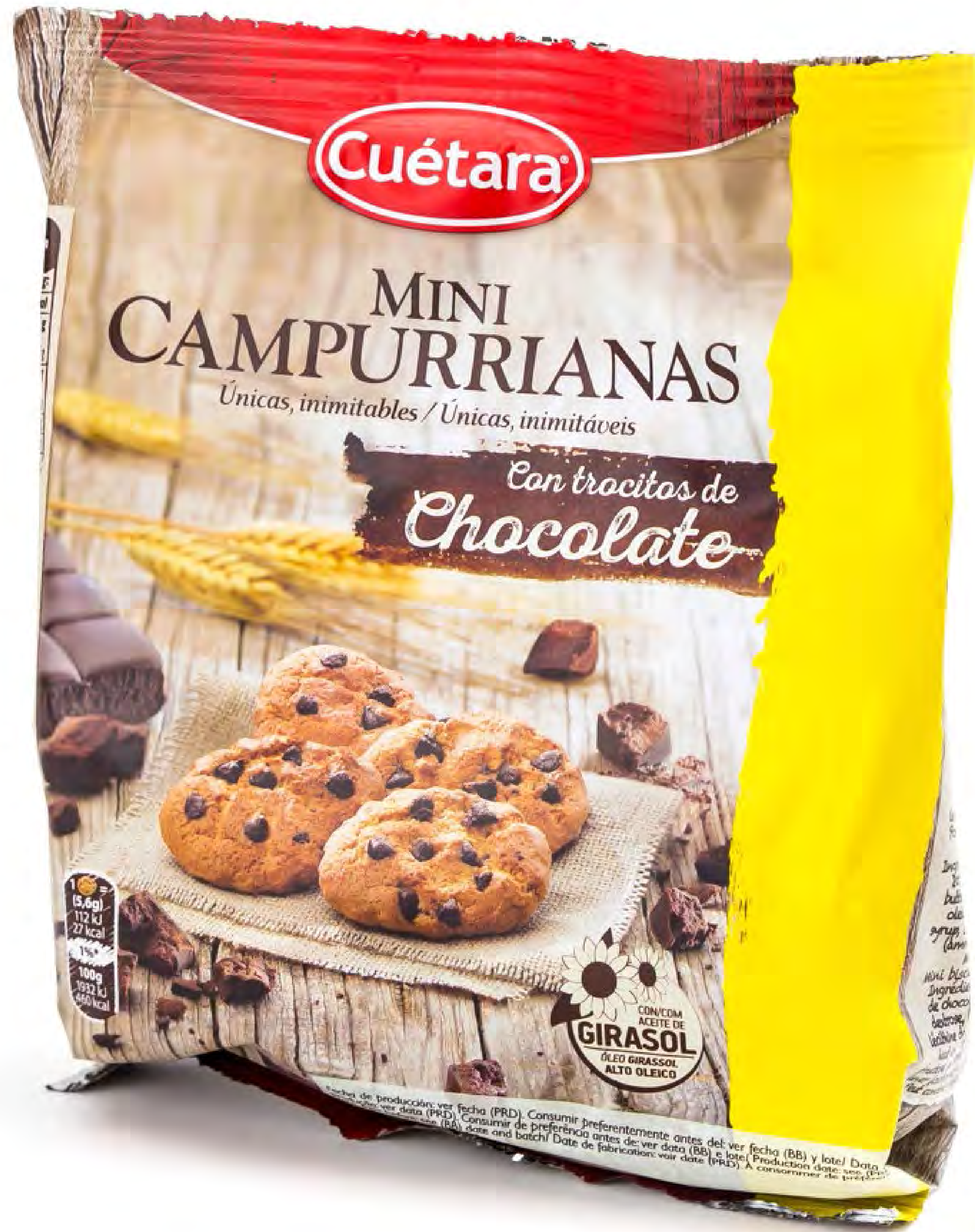
Campurrianas Choco - 7 uds/caja