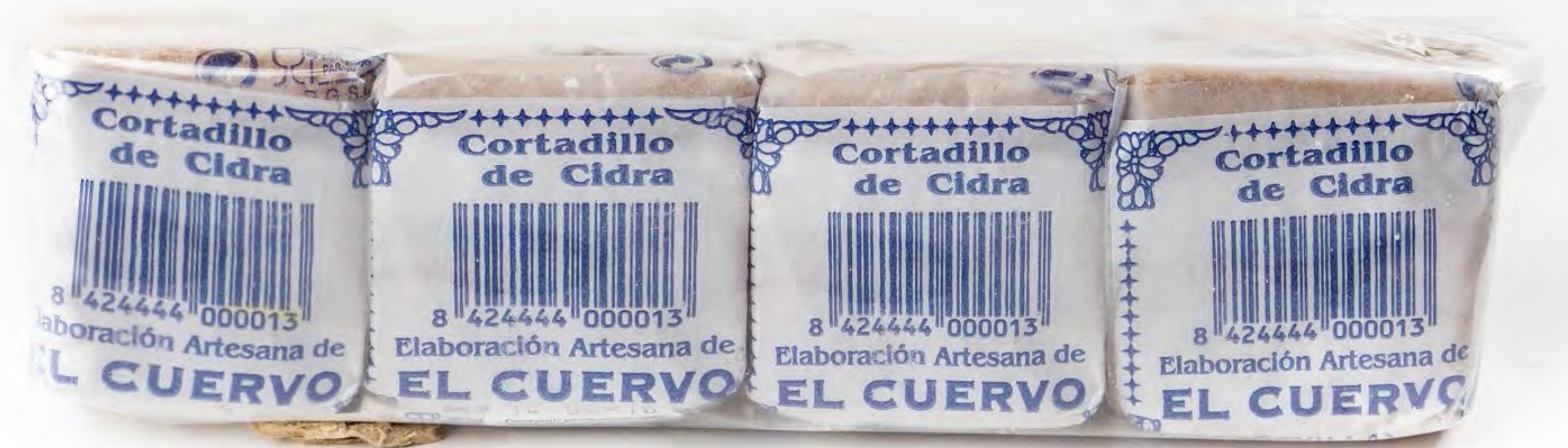
Cortadillo de Cidra 18 uds/caja