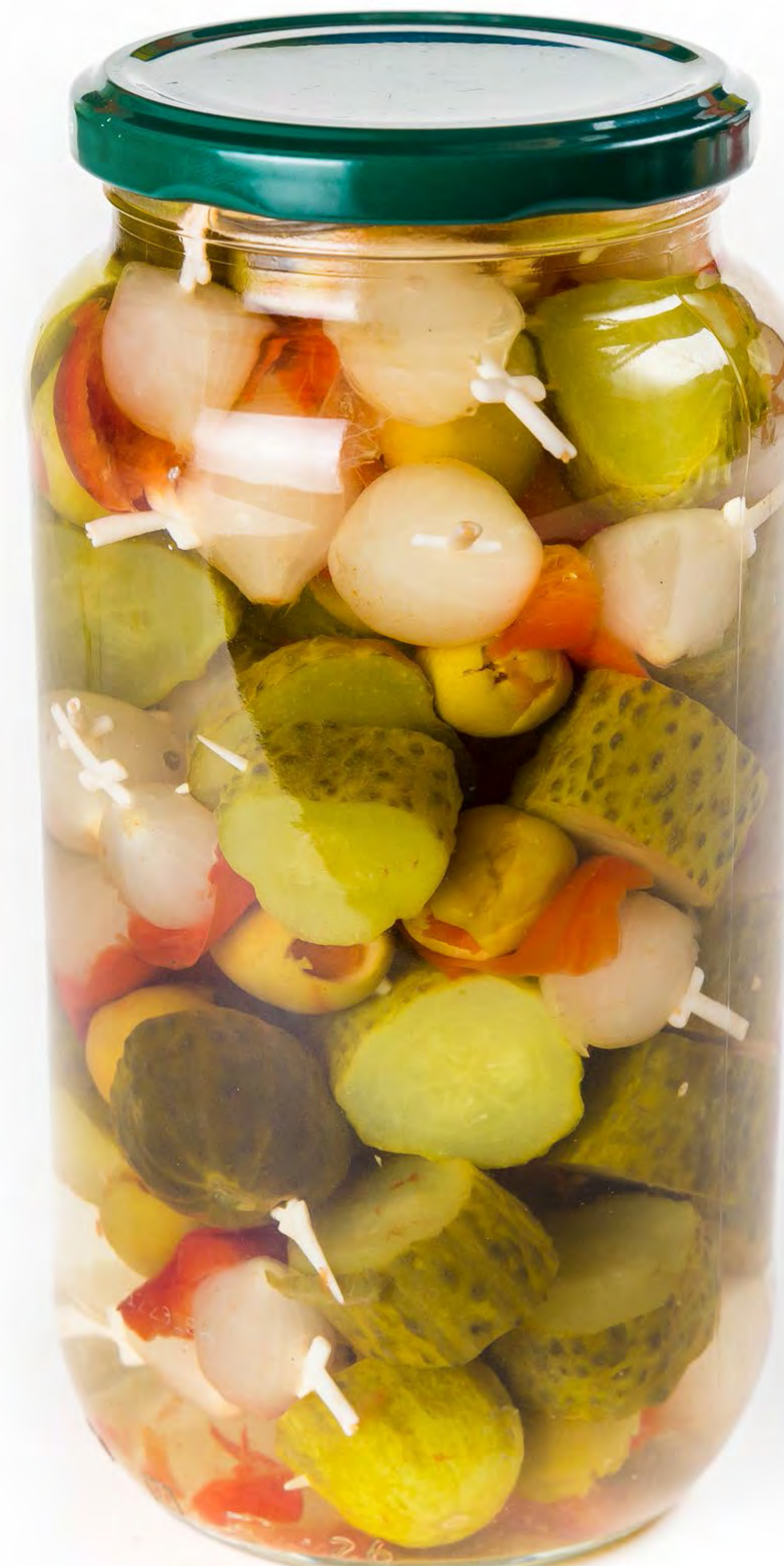
cod. 185011 - Tarro Banderilla Picante cod. 185012 - Tarro Banderilla Dulce 8 und/caja