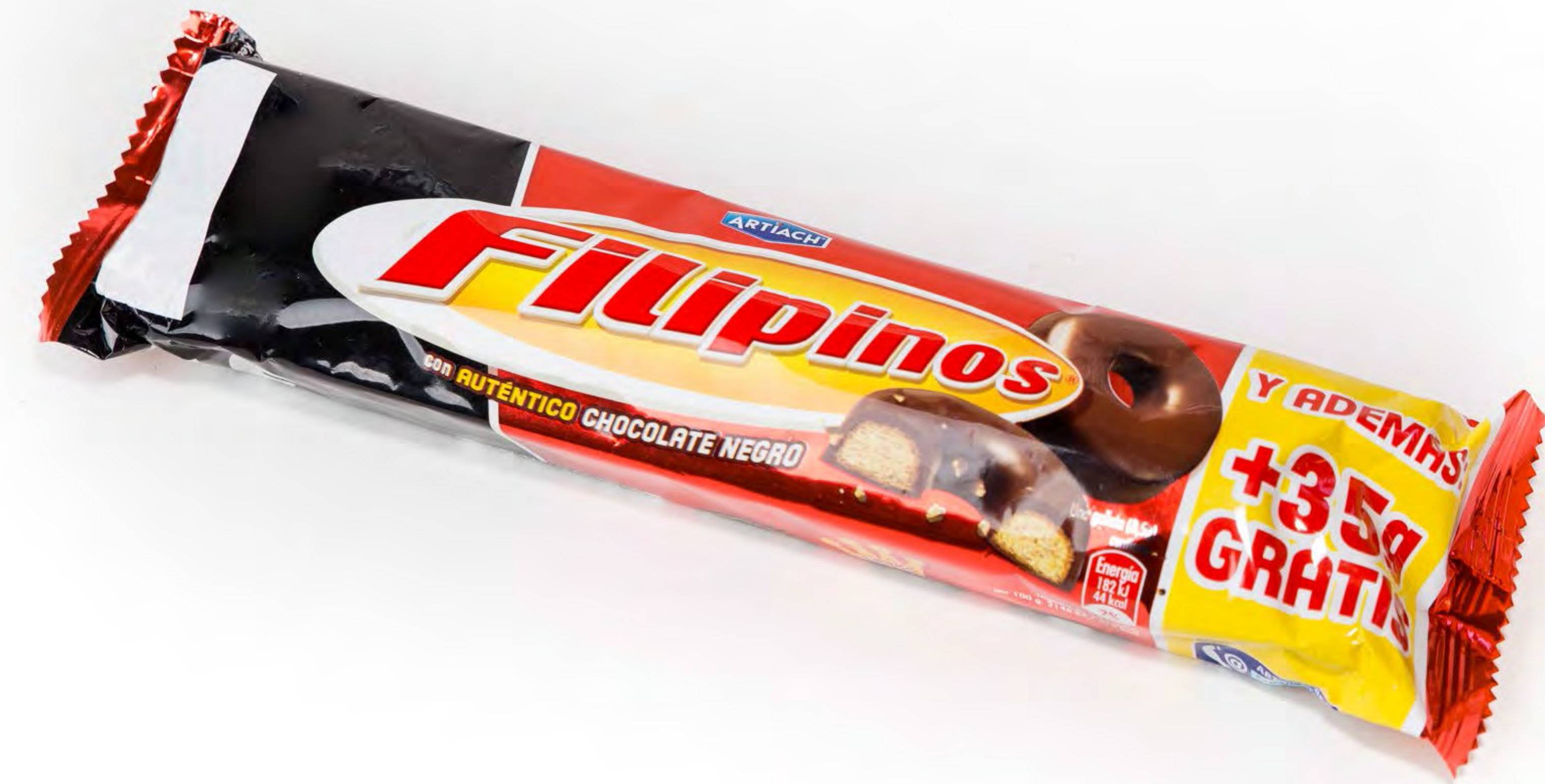
Filipinos Choco Negro uds/Caja