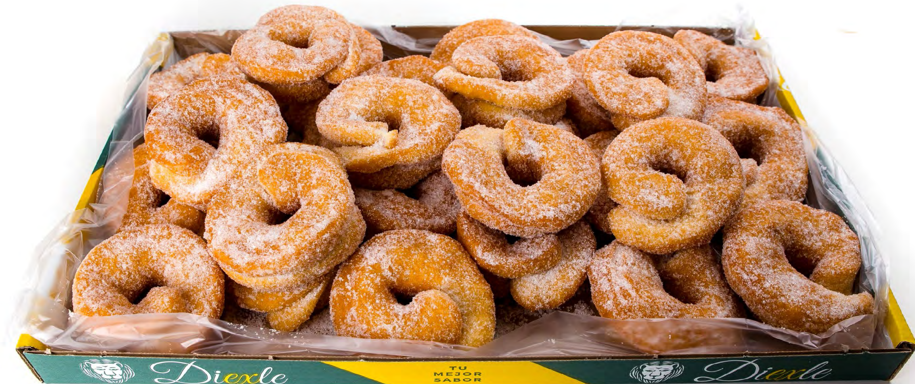
Cod. 122005 - Rosquillas Fritas Artesanas 2,5 kg.