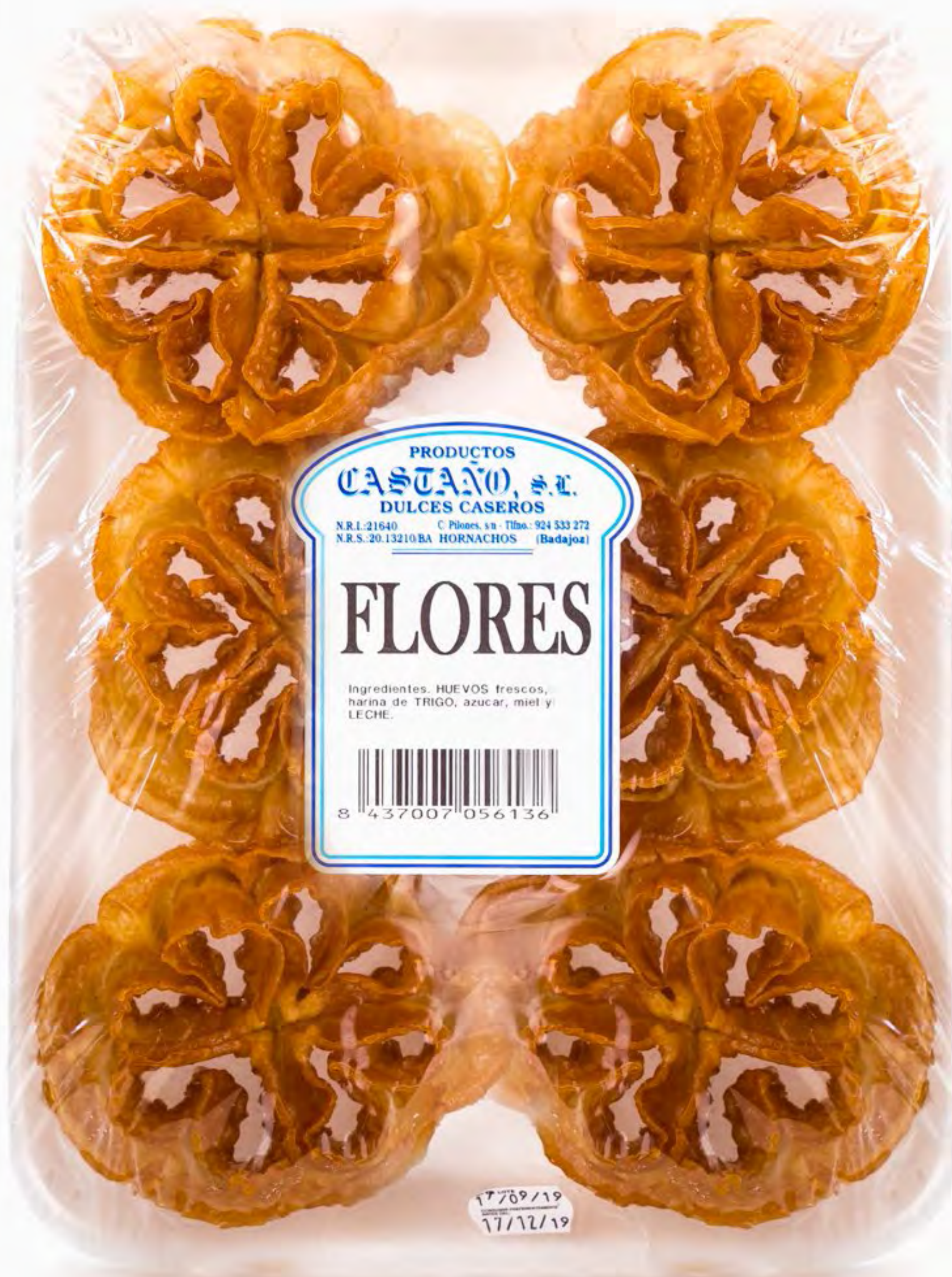
Flores en Miel 10 uds/caja