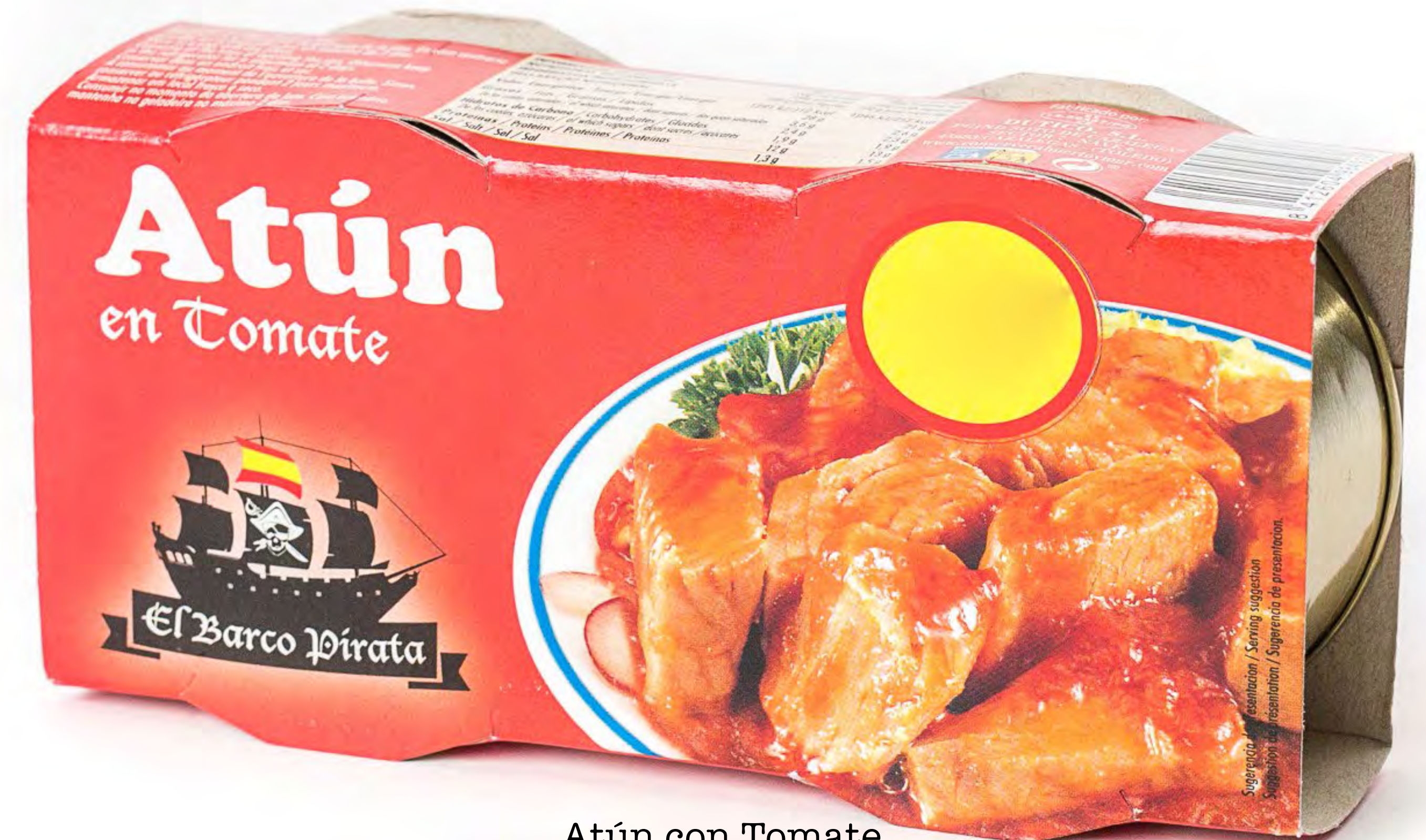
Atún con Tomate