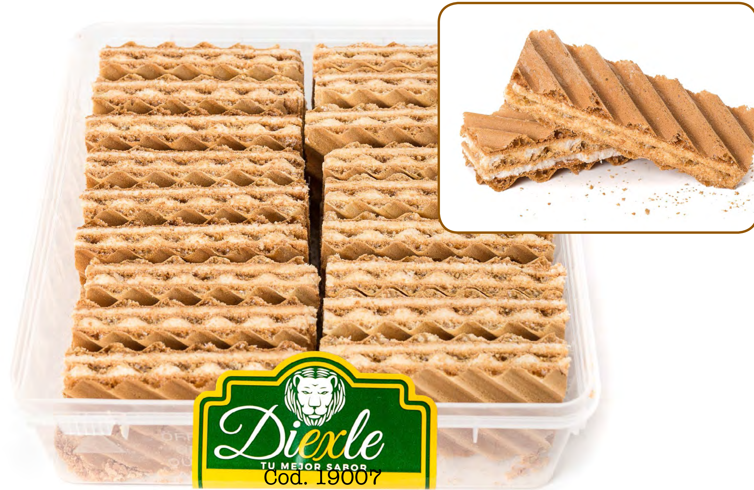
Galletas Garcinuez Coco 12und/caja