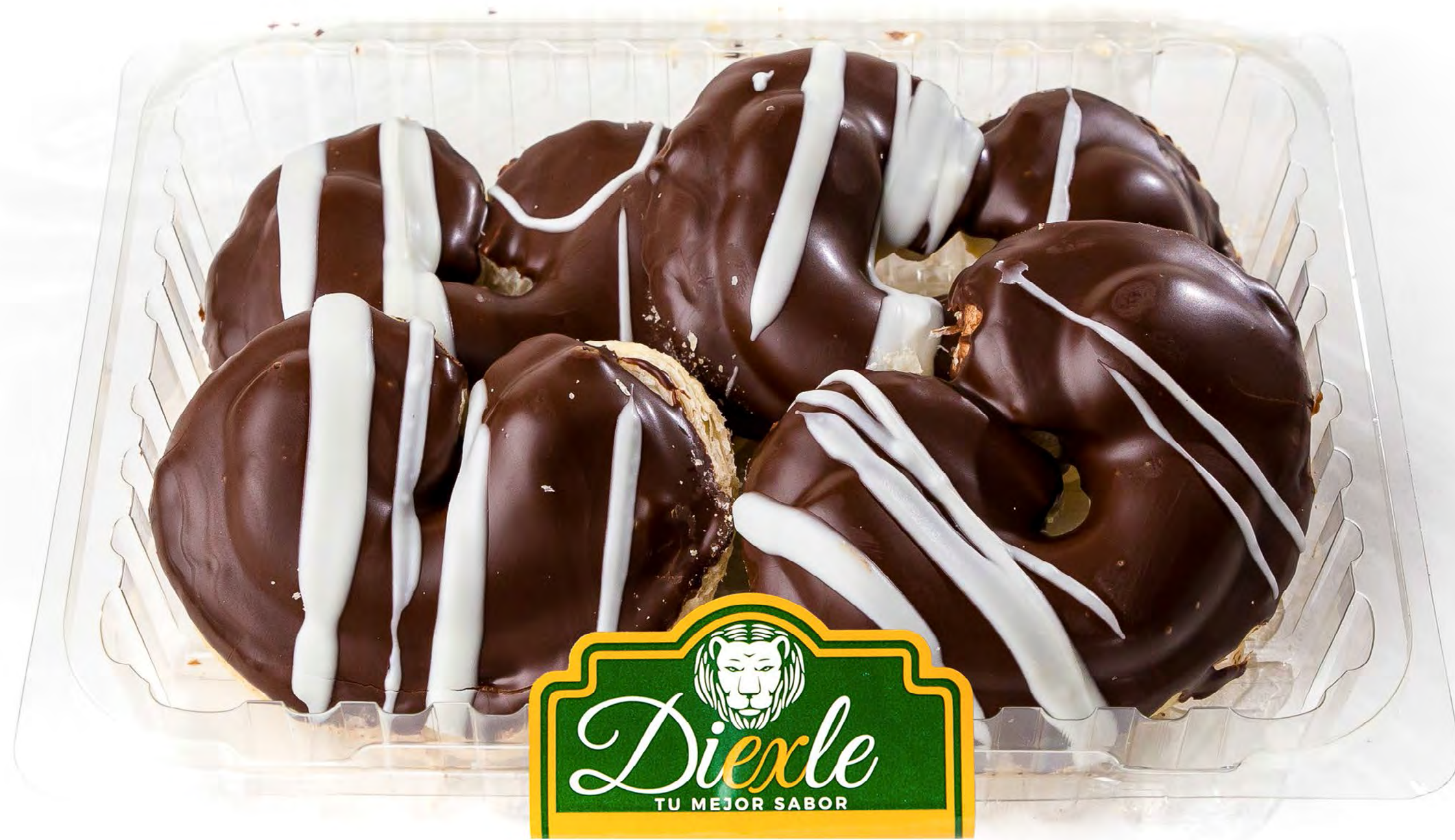
Cod. 253000 Blister Palmeritas KINDER 12 uds/caja