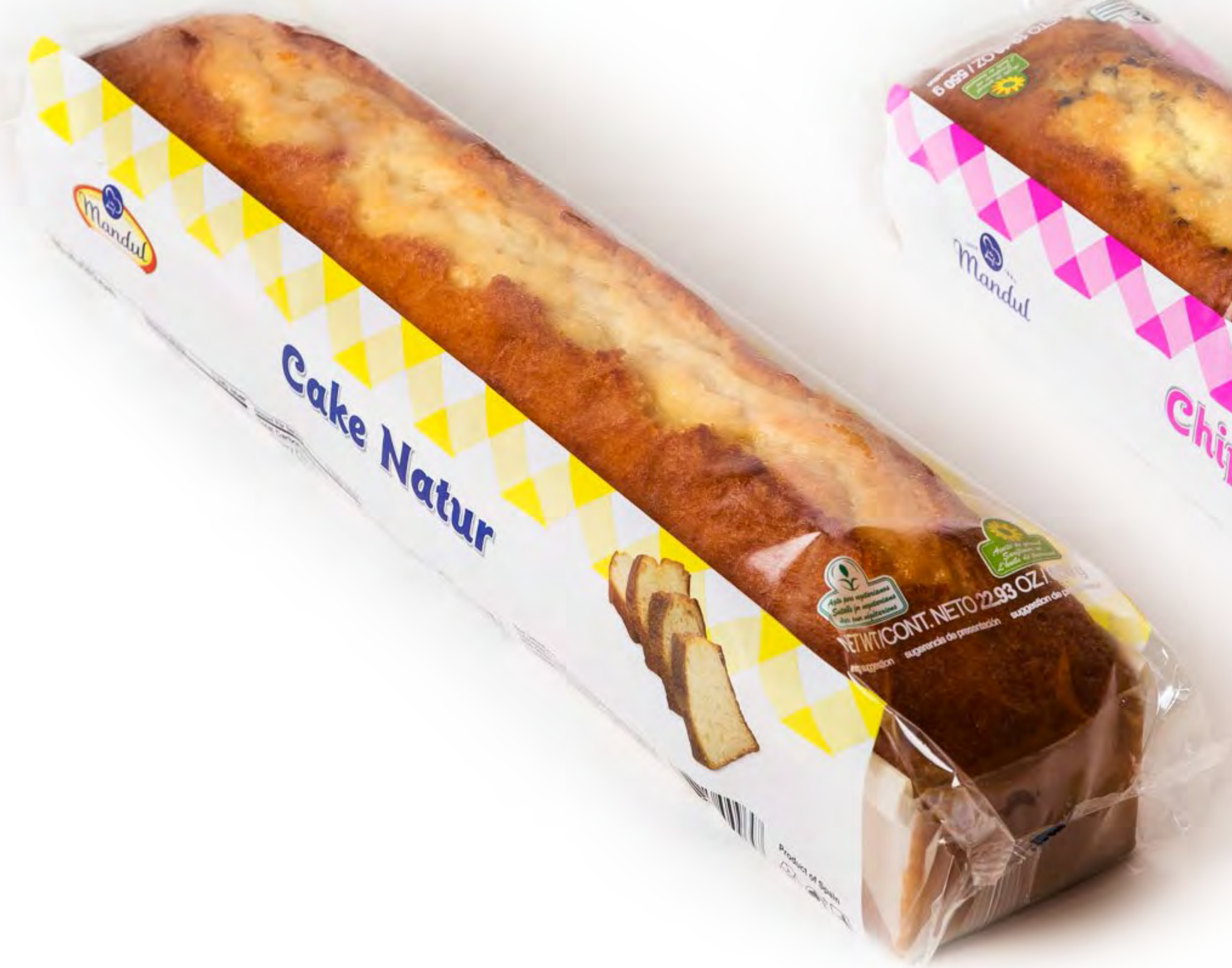
Cake Natur 5 uds/caja 500g.