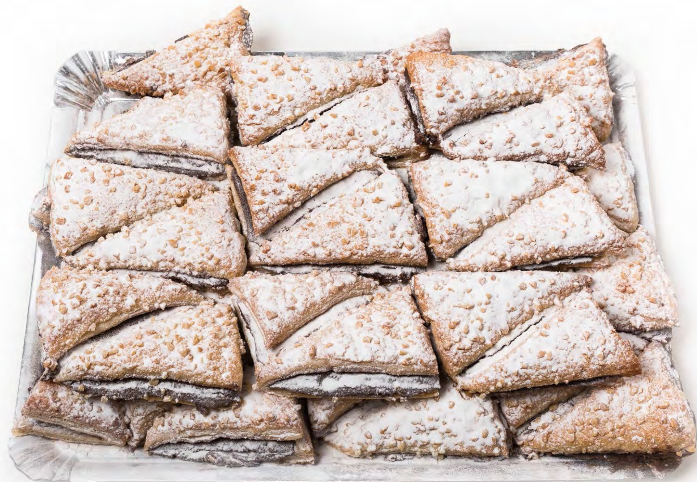
Triangulo Choco Almendra 2 Kg