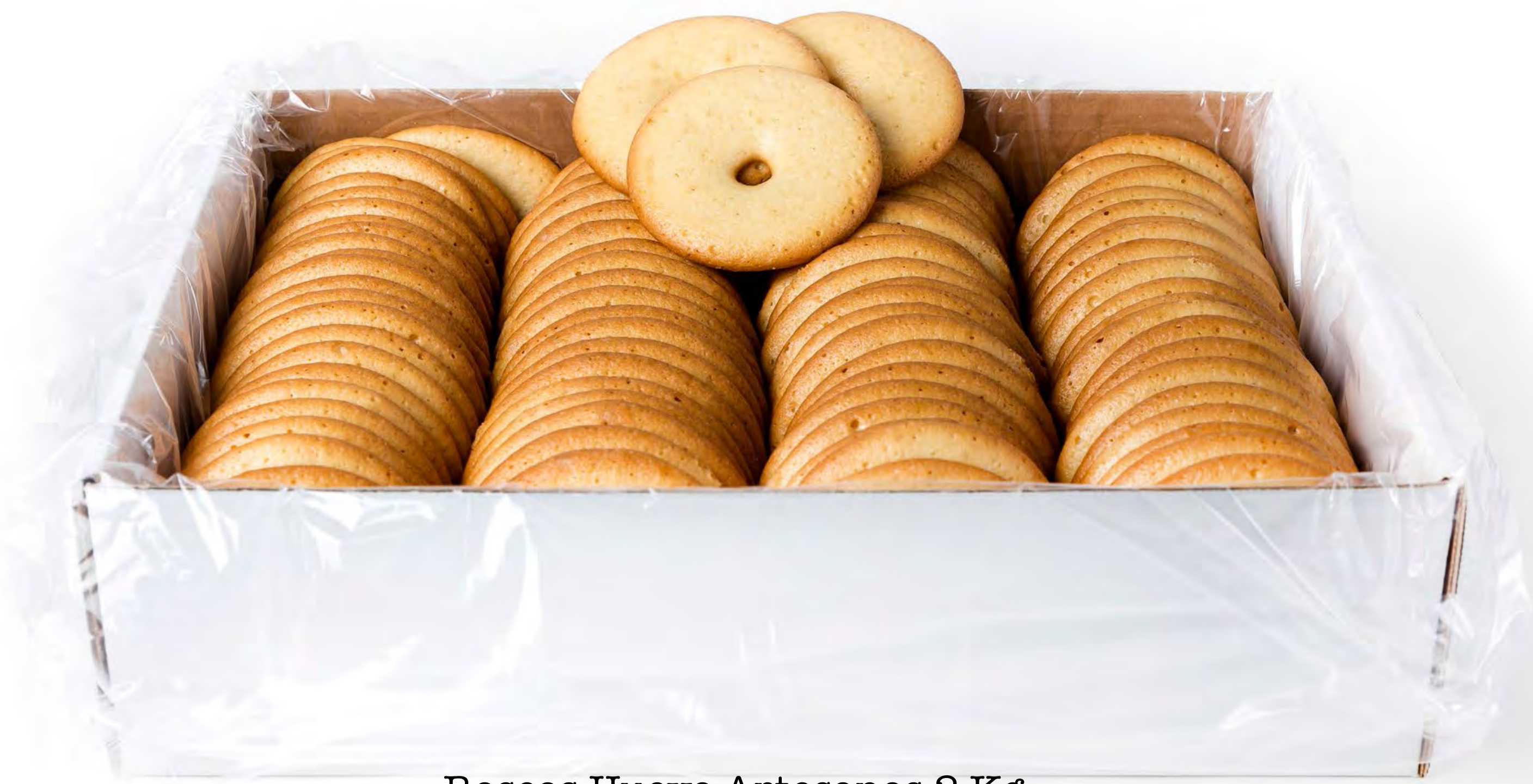
Roscos Huevo Artesanos 2 Kg.