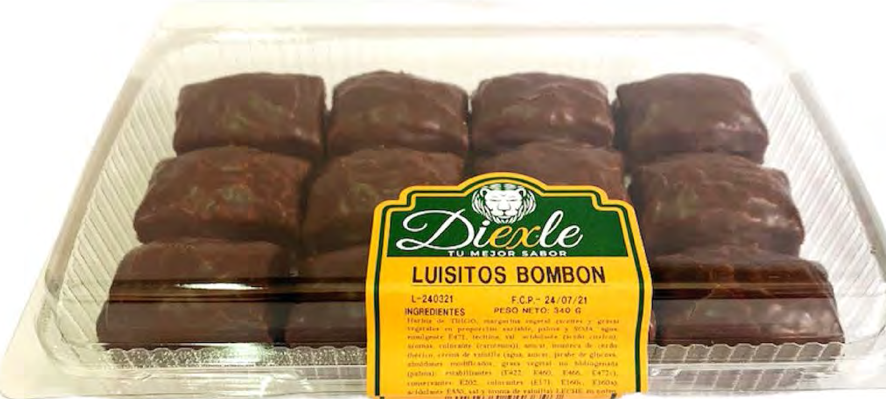
Cod. 216005 - Luisitos Bombón 8 uds/caja