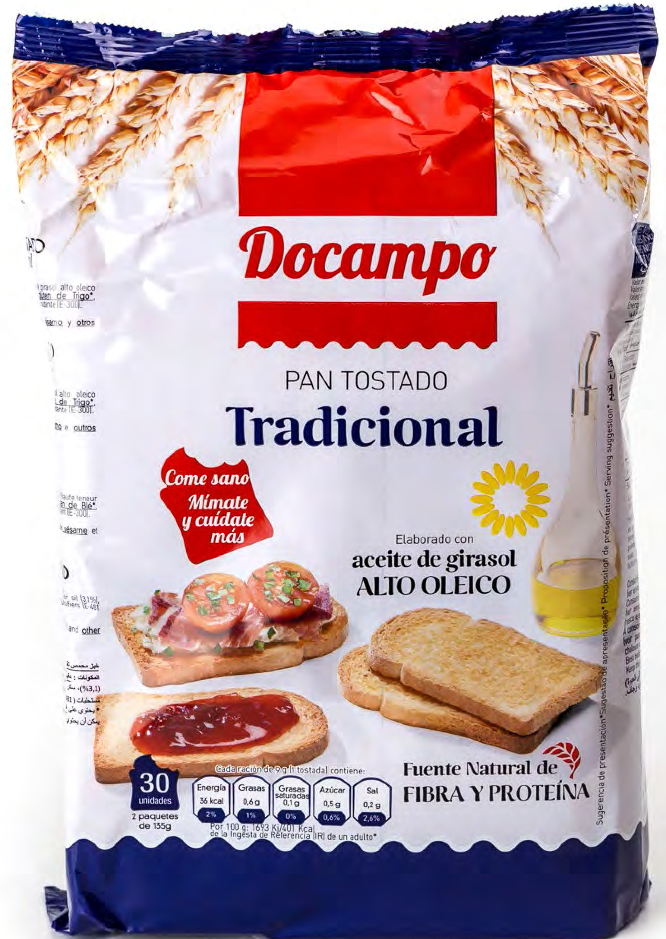
Pan Tostado Tradicional 16 uds/caja