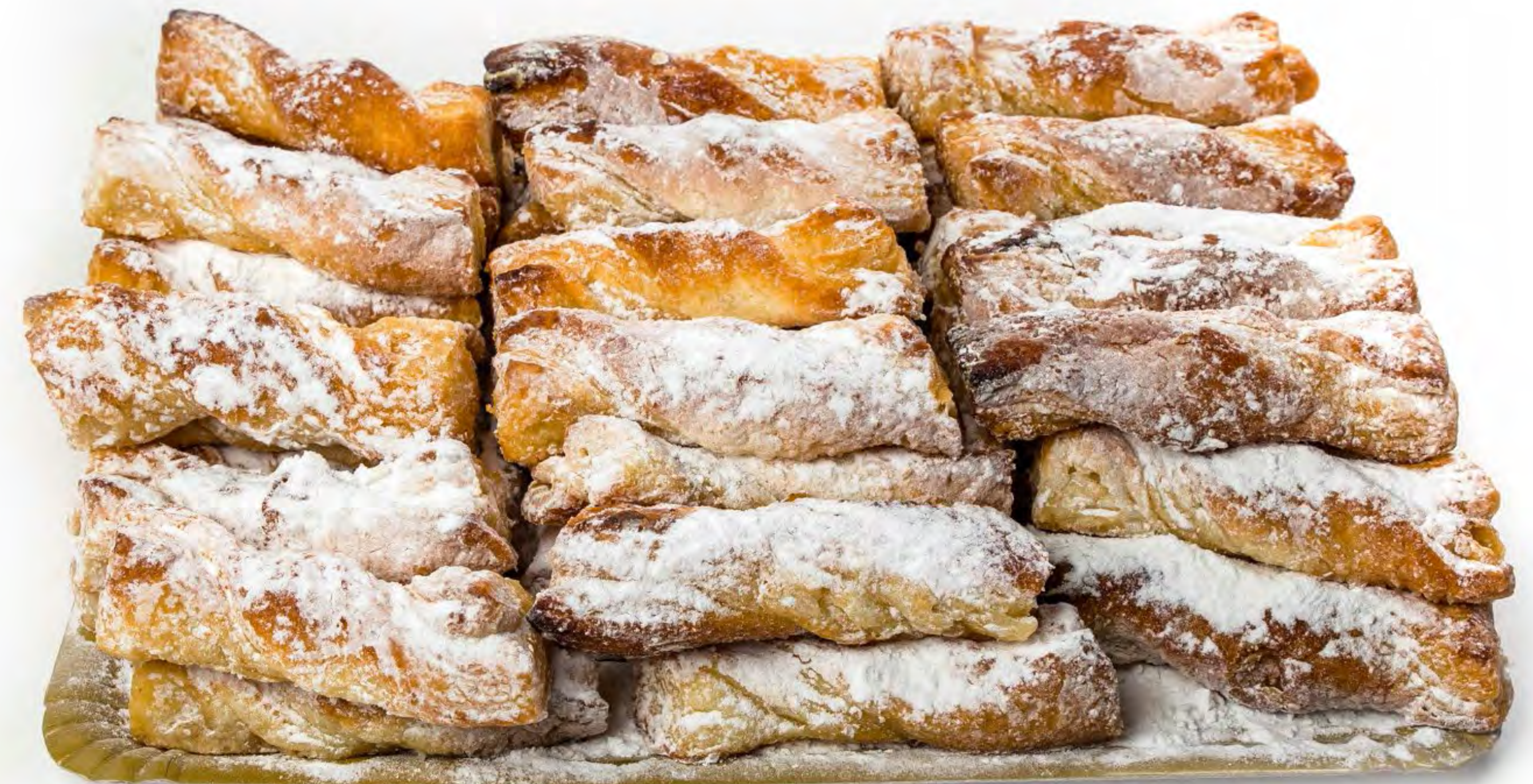
Lazos Glass 2 Kg.