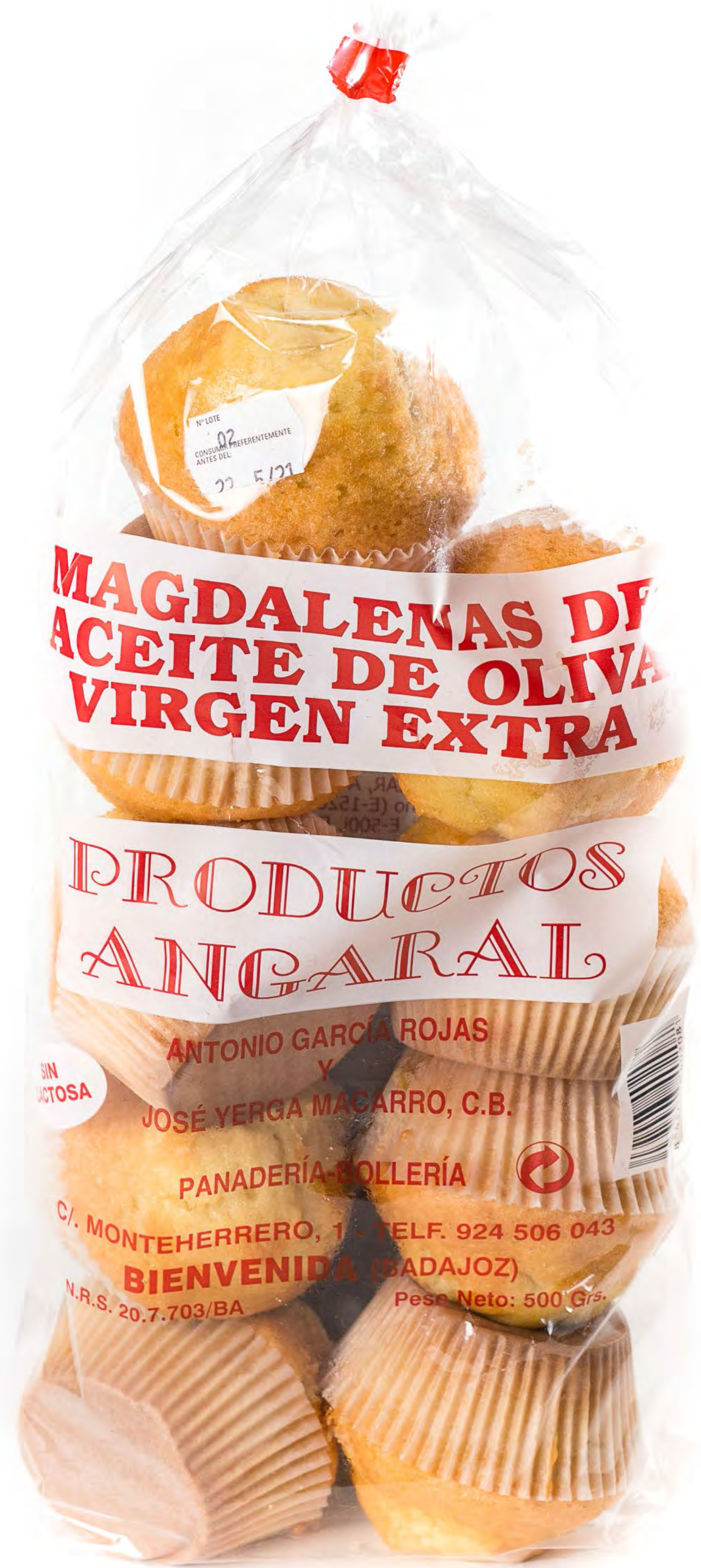
Magd aceite oliva 8und/caja