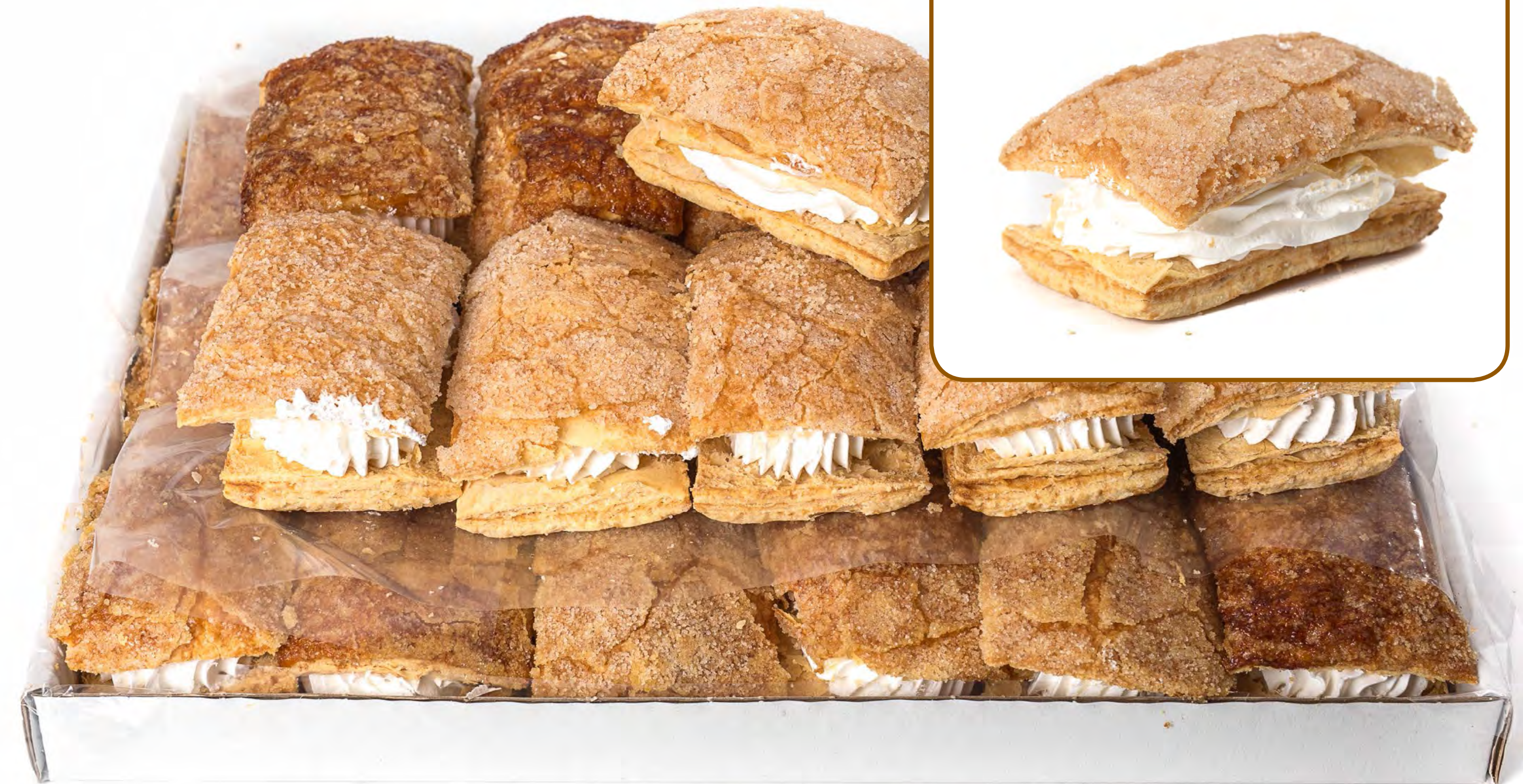
Hojaldre Nata 2 Kg.