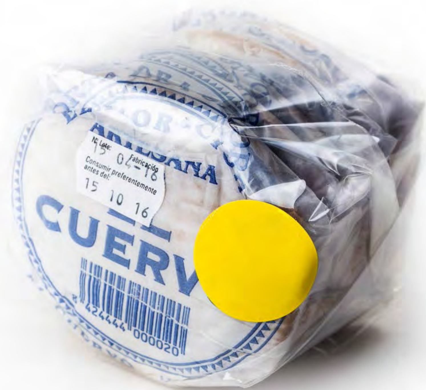
Torta de Polvorón 12 uds/caja