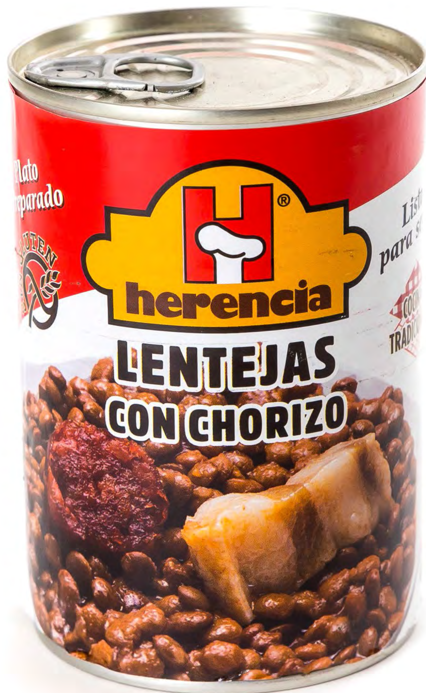
Cod. 225013 Lentejas Herencia 12 uds/caja