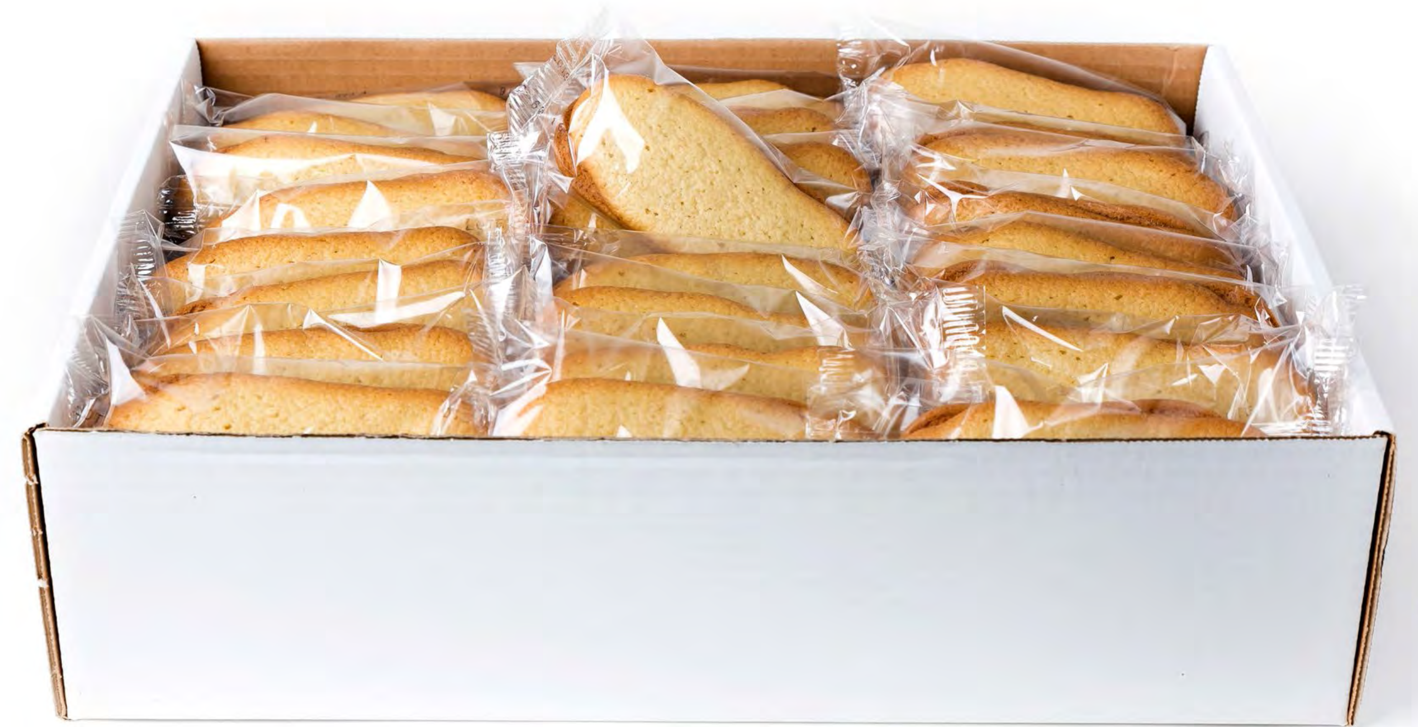
Lenguas S/A Maltitol 2,5 Kg.