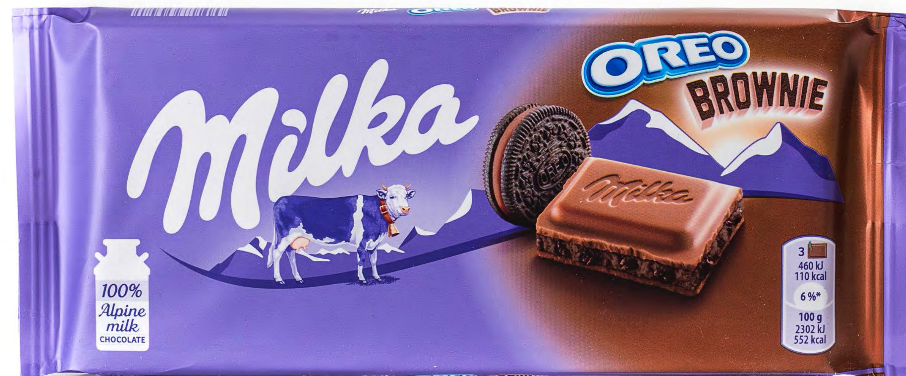
Milka Oreo Brownie 22 uds/caja