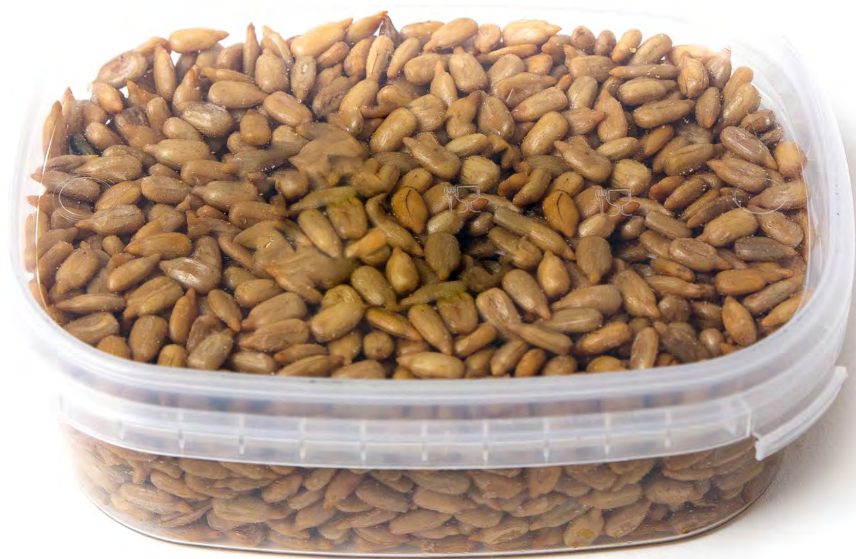
Pipas Peladas 12 uds/Caja