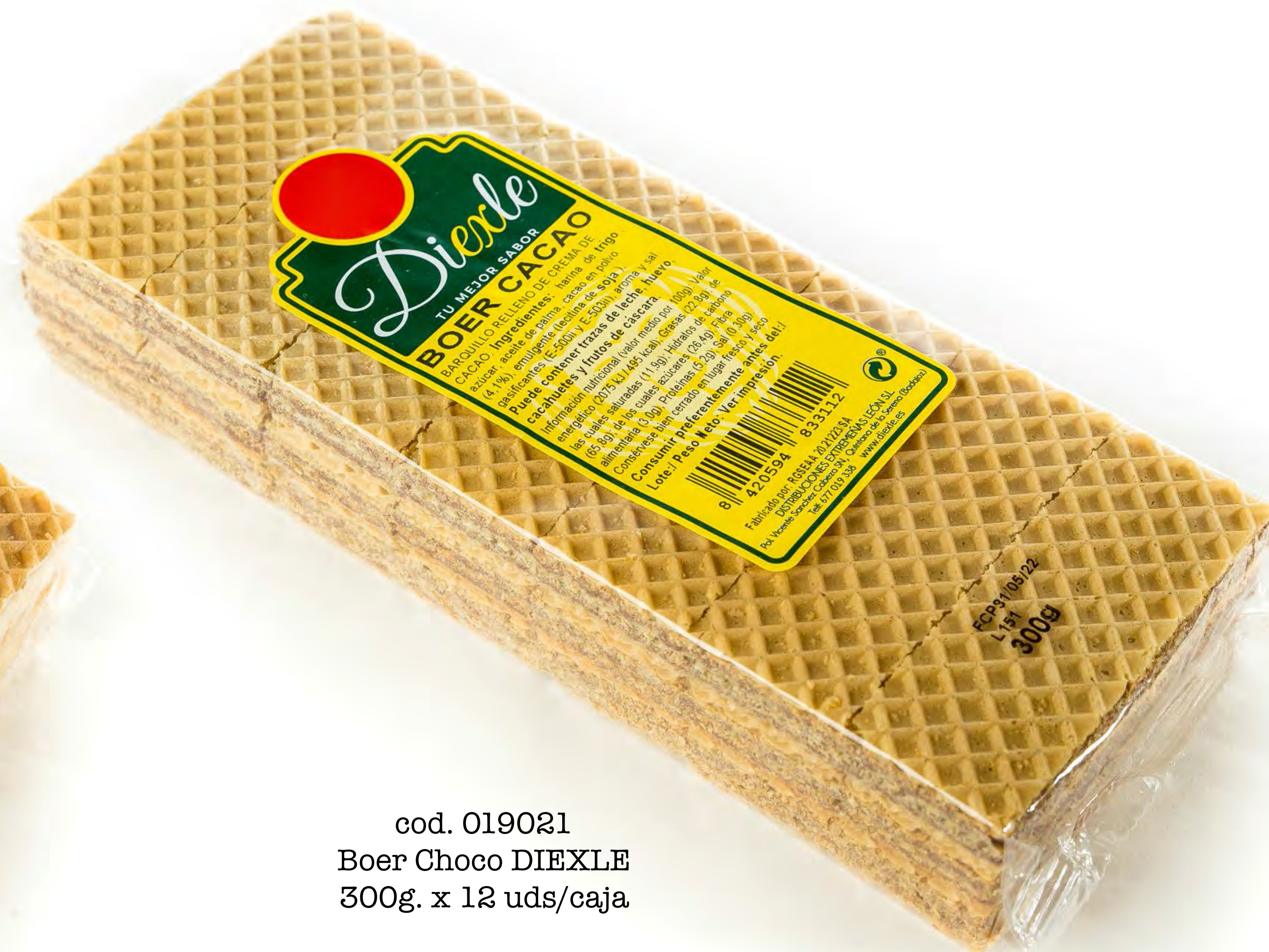
cod. 019021 Boer Choco DIEXLE 300g. x 12 uds/caja