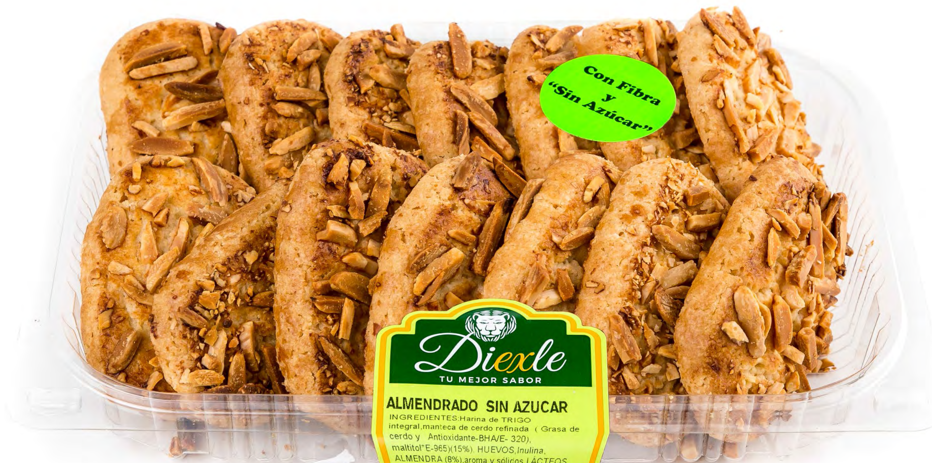
Cod. 258002 - Blister Almendrado S/A 8 uds/caja