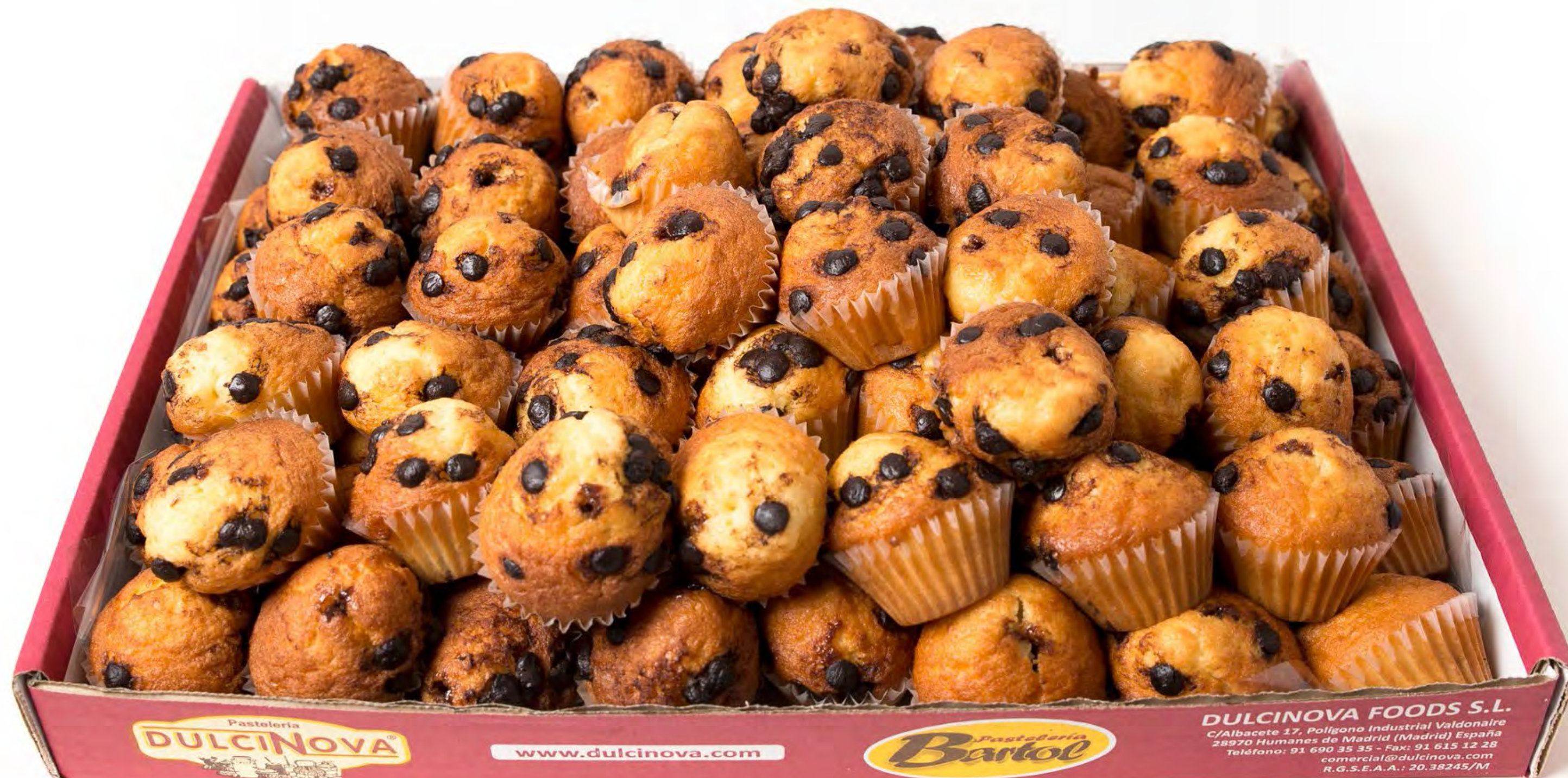
Mini Muffins Pepitas Rell. Choco 2,5 kg.