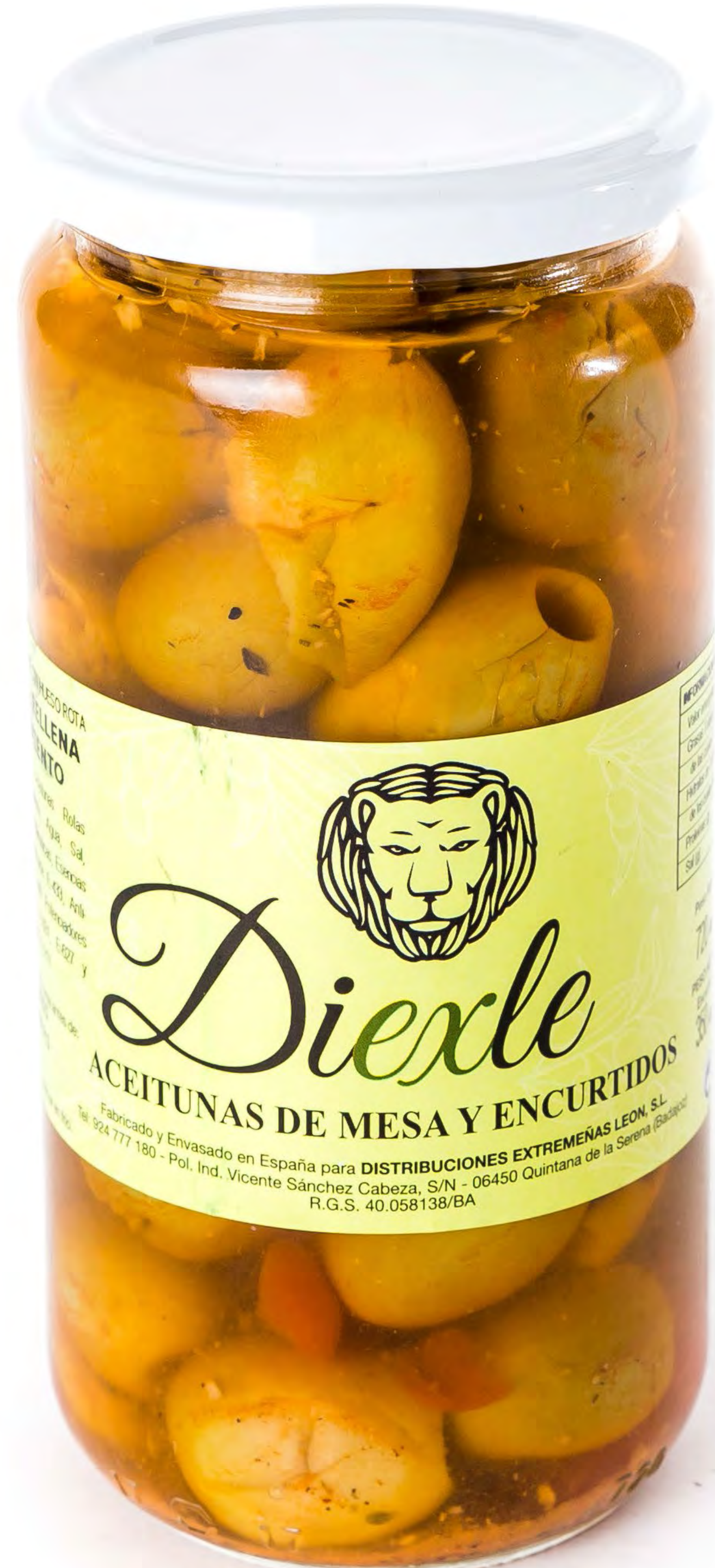
Aceituna Diexle Gordal 8 uds/caja