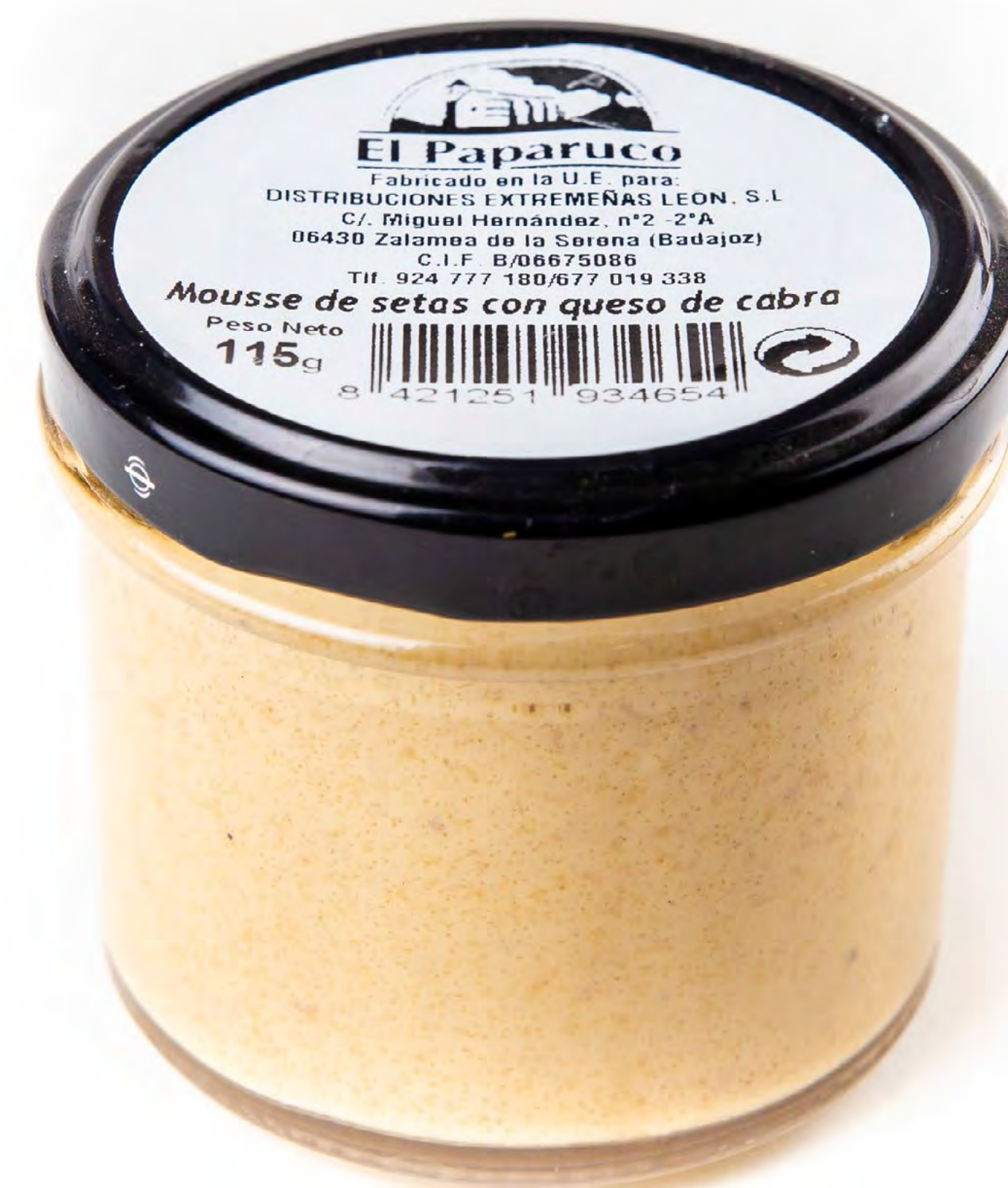
Cod. 048007 - Mousse de Setas con Queso 12 uds/caja