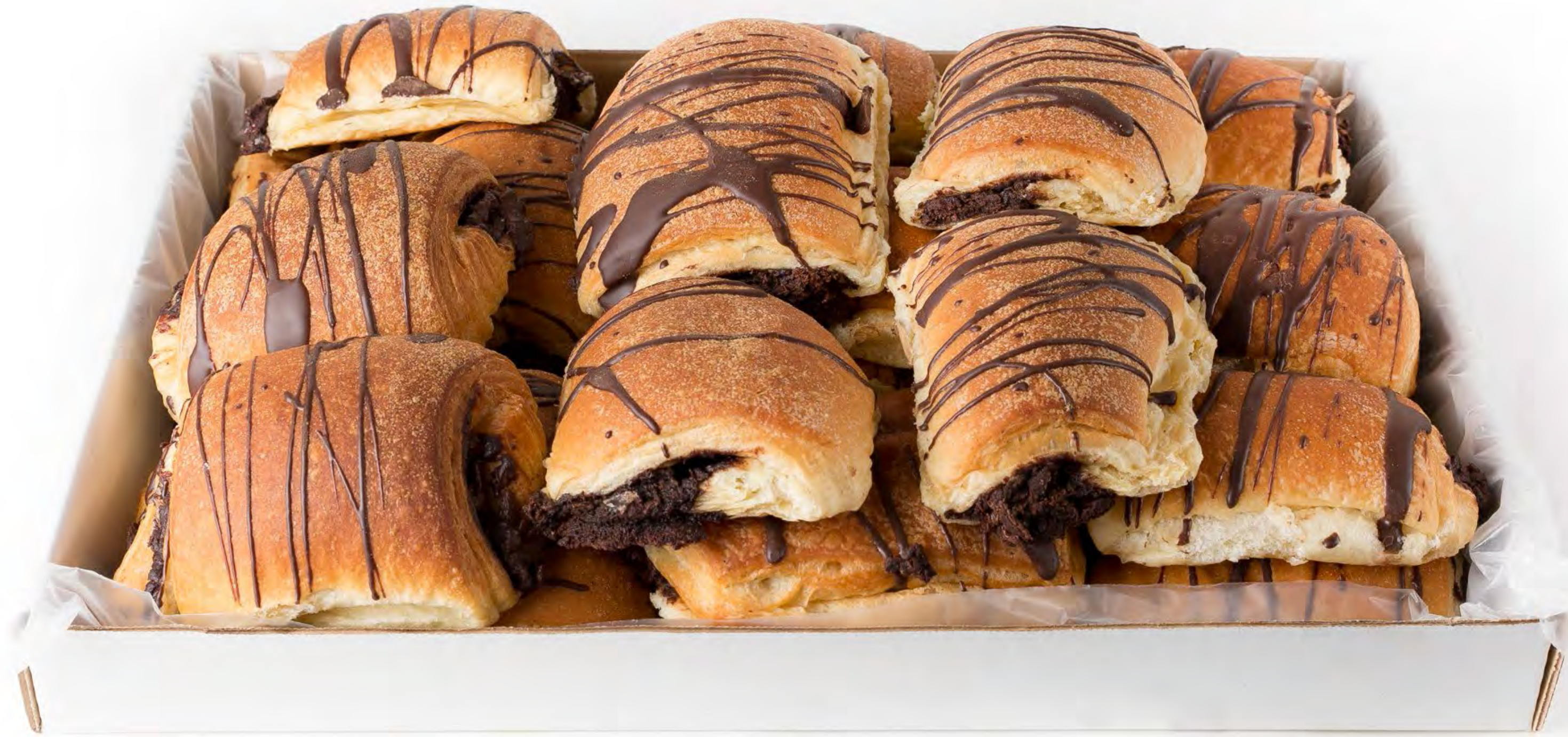
Napolitana Rell. Chocolate