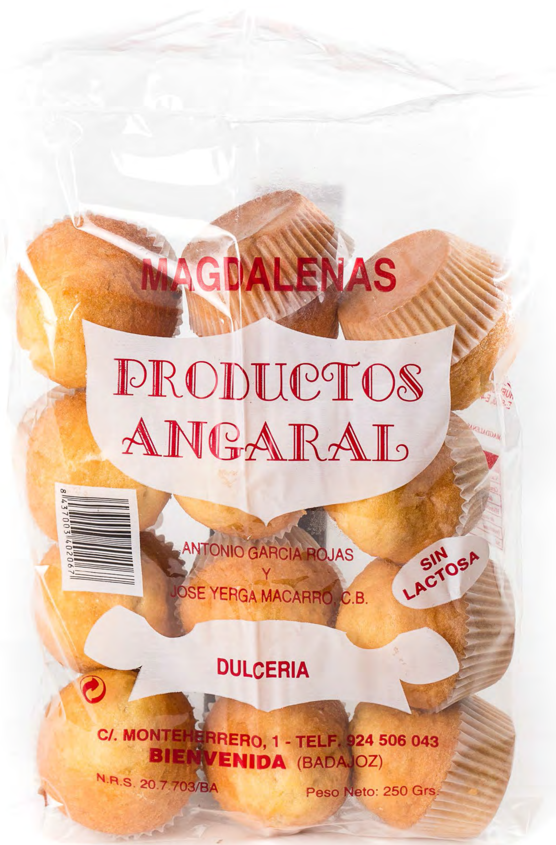
Magd chica aceite oliva 6und/caja