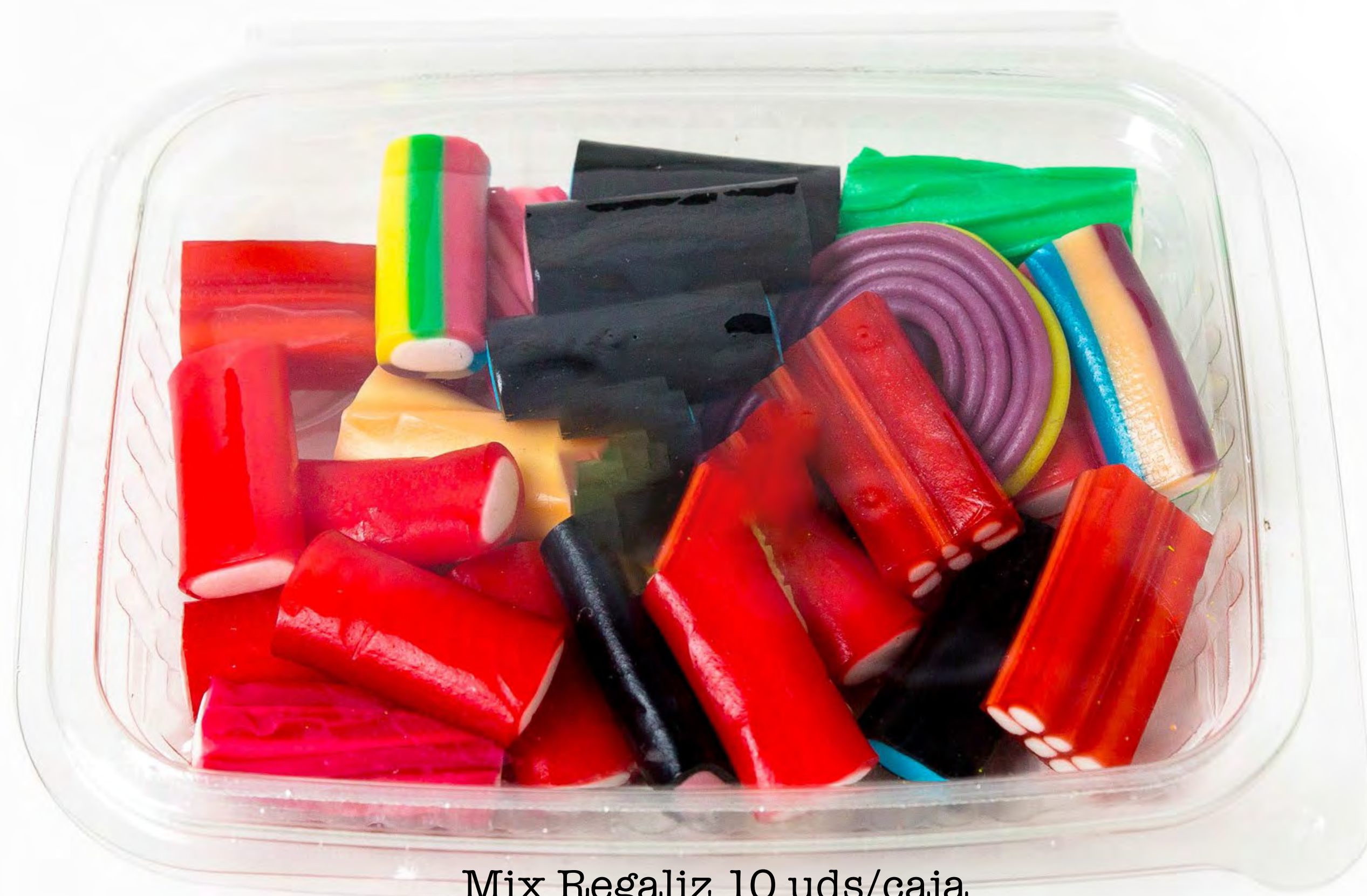
Mix Regaliz 10 uds/caja