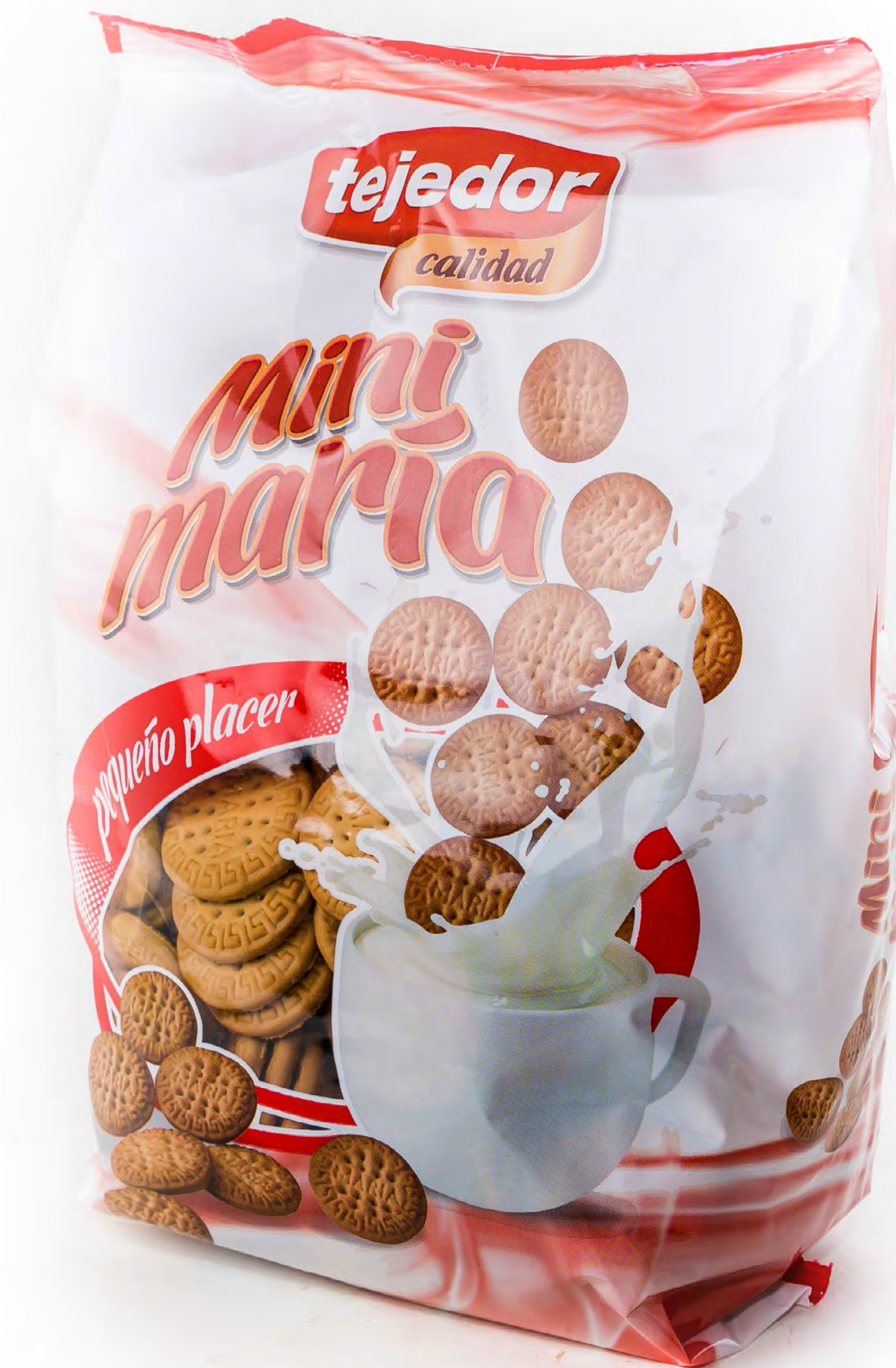
Cod. 0210036 Mini María Tejedor 10 uds/caja