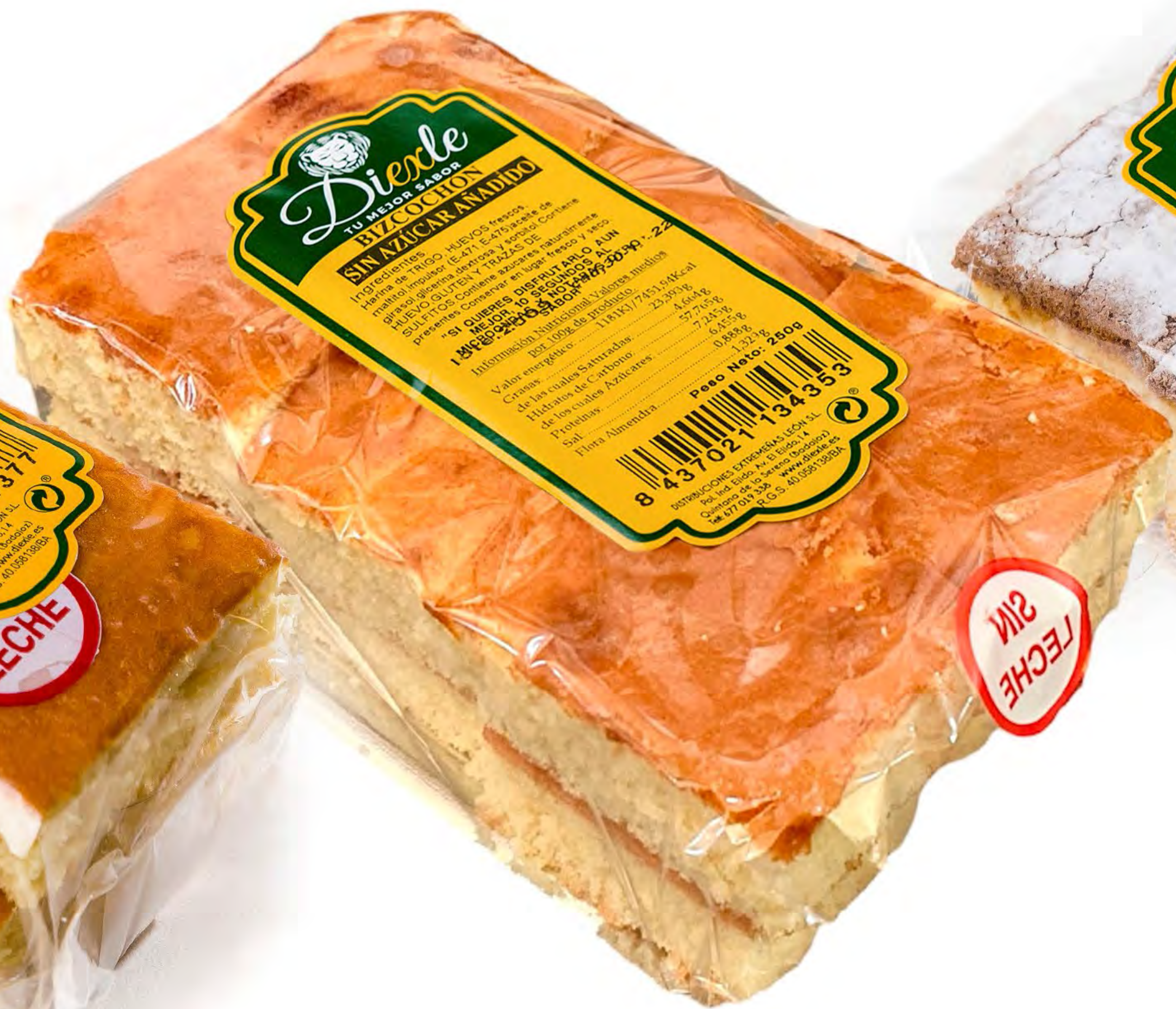
Cod. 242002 Bizcochón S/A Artesano 240g. 6 und/caja