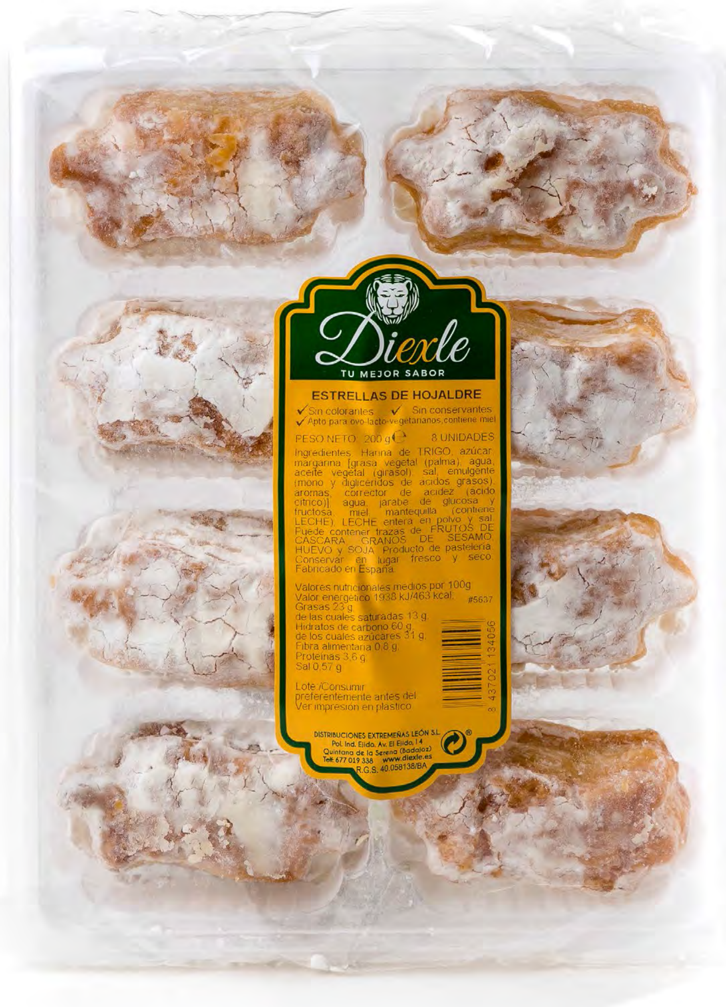
Cod. 054021 Lazos Hojaldres Blancos 10 uds/caja