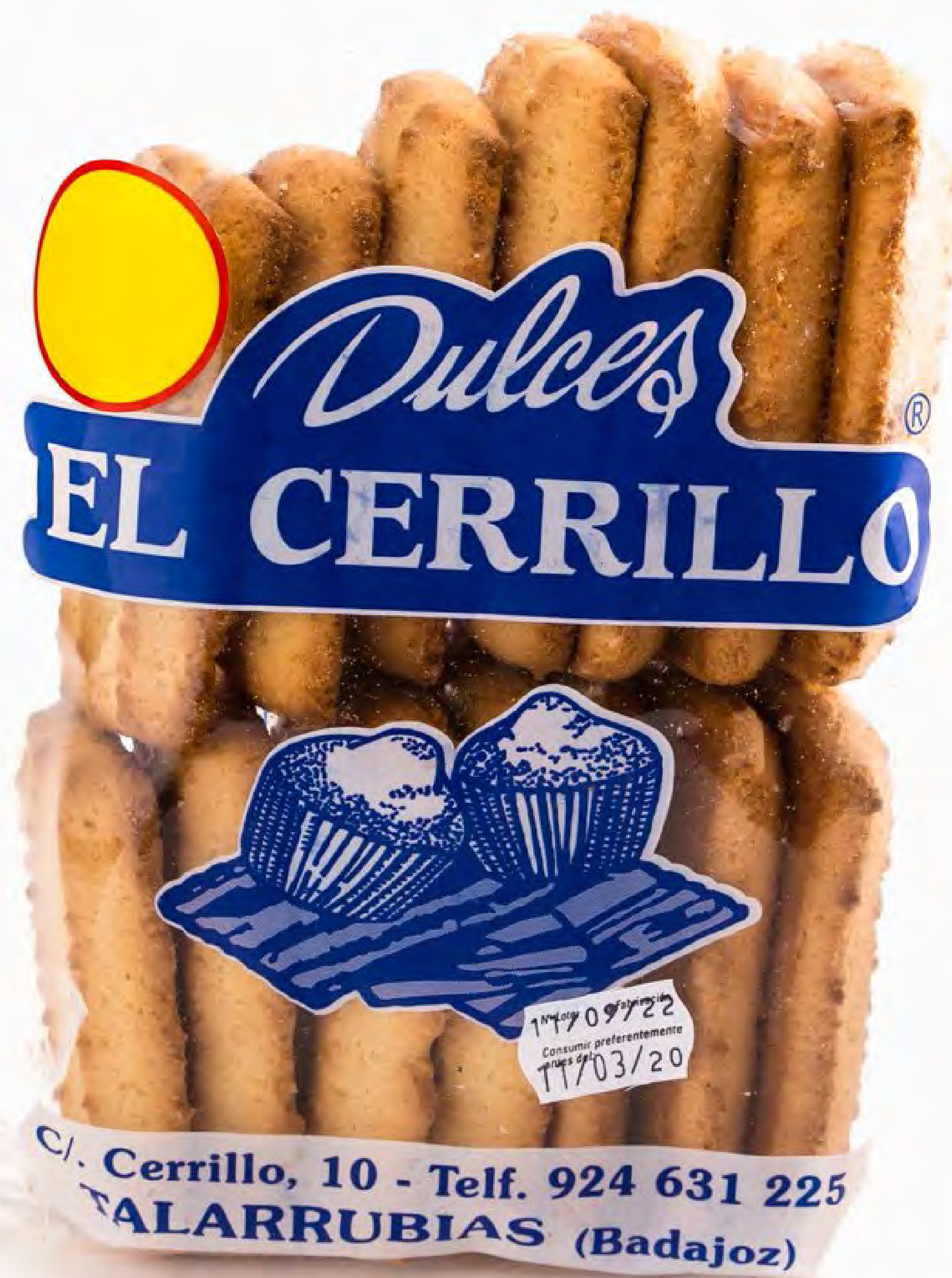
Galletitas Rizadas 12 uds/caja