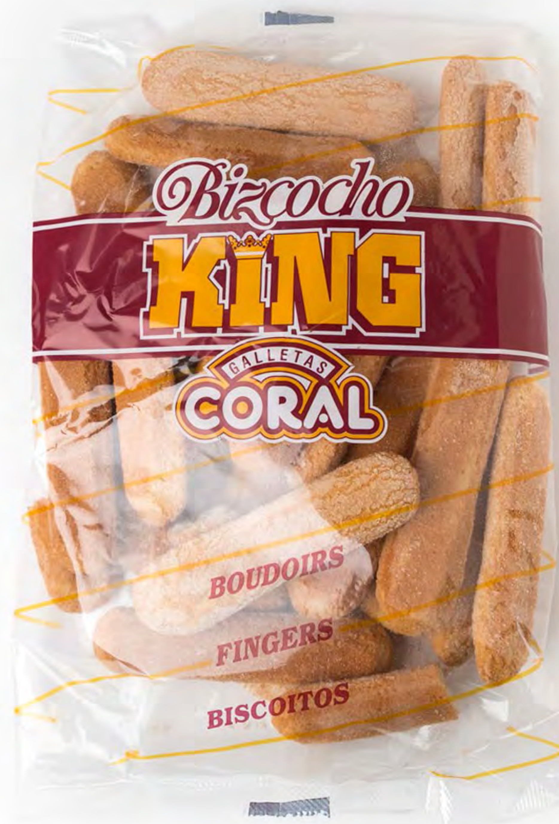
Bizcocho Duro 300g. x 12 uds/caja