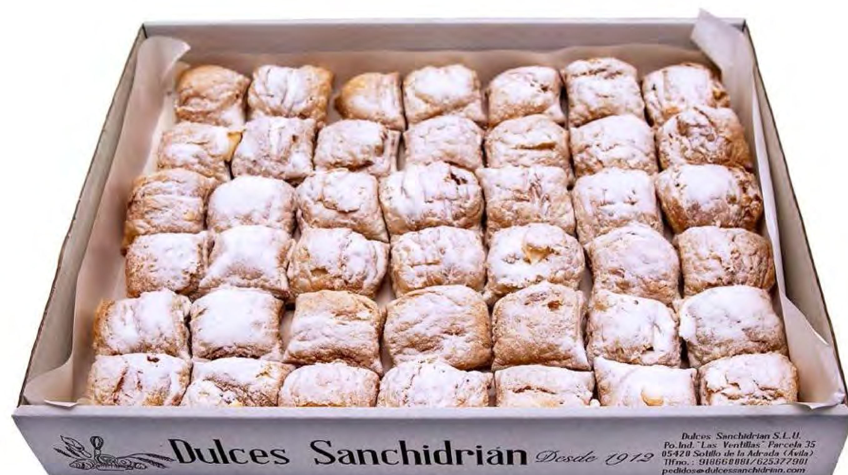
Cod. 260001 - Canelitos Rellenos Crema 2Kg