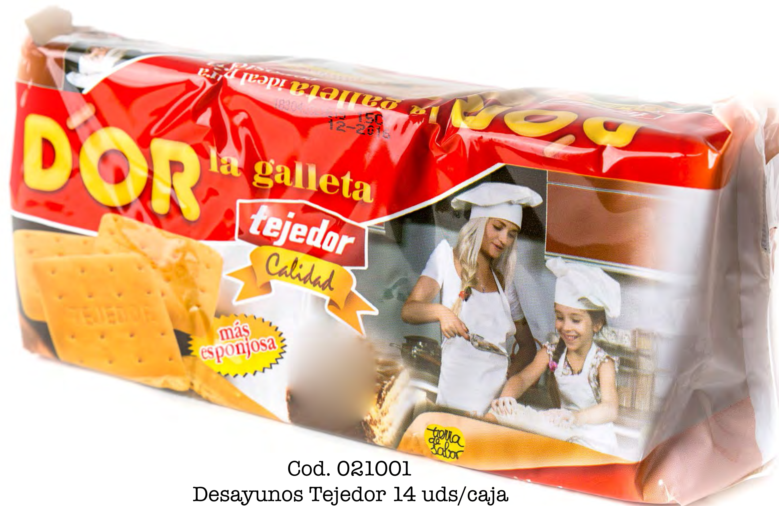
Cod. 021001 Desayunos Tejedor 14 uds/caja