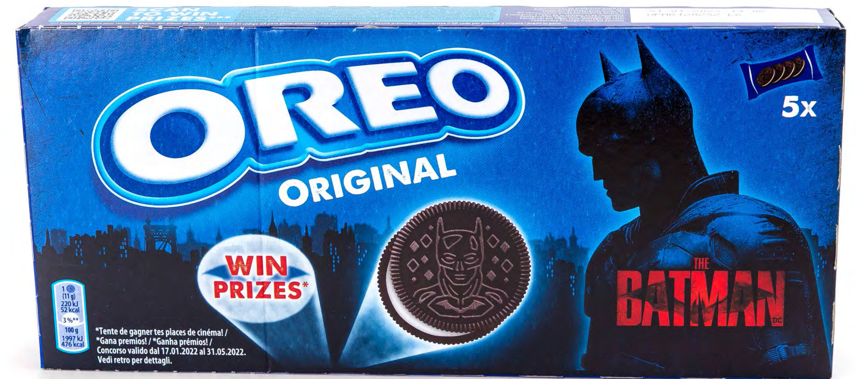
Cod. 190005 Galletas Oreo 220g 12 und/caja