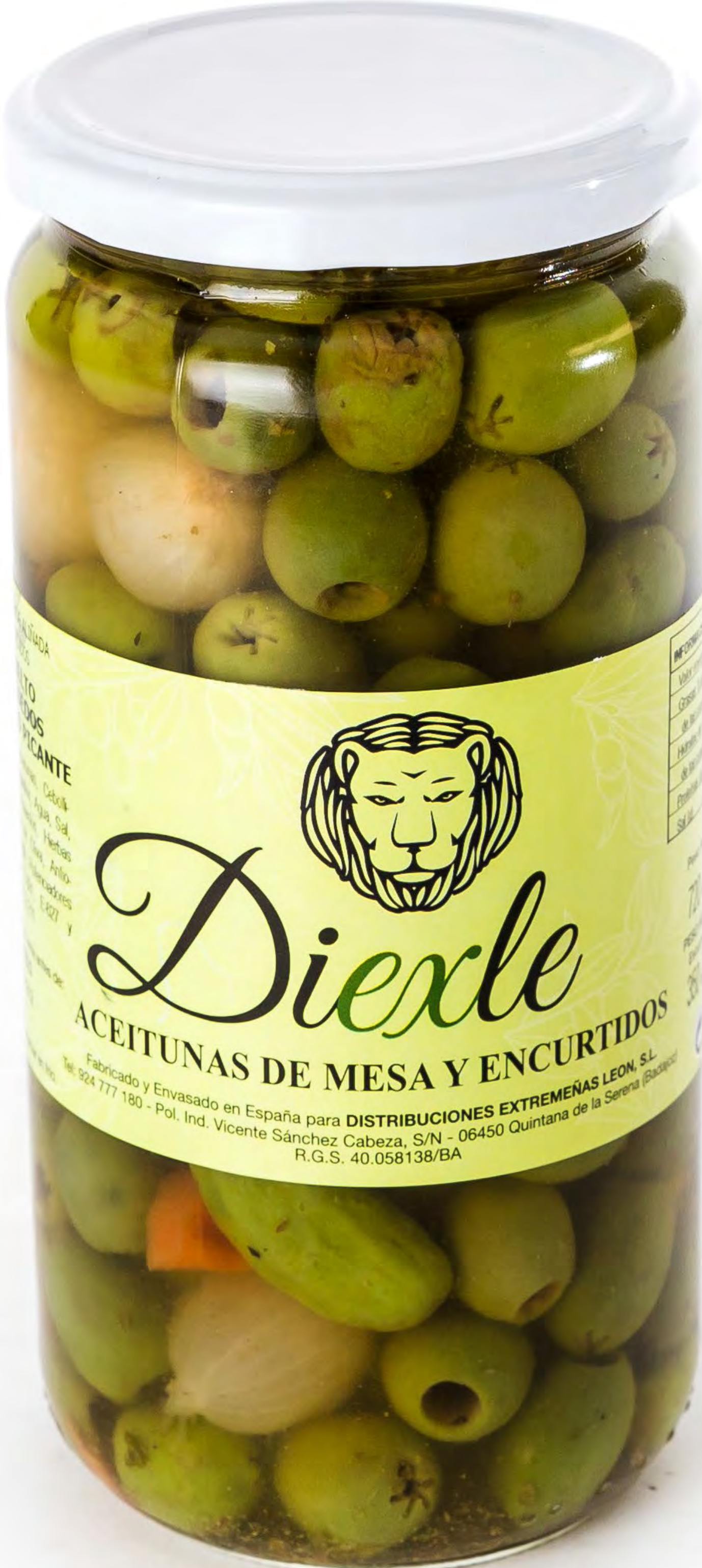
Aceituna Diexle Chupadado Sin Huevo Picate 8 uds/caja