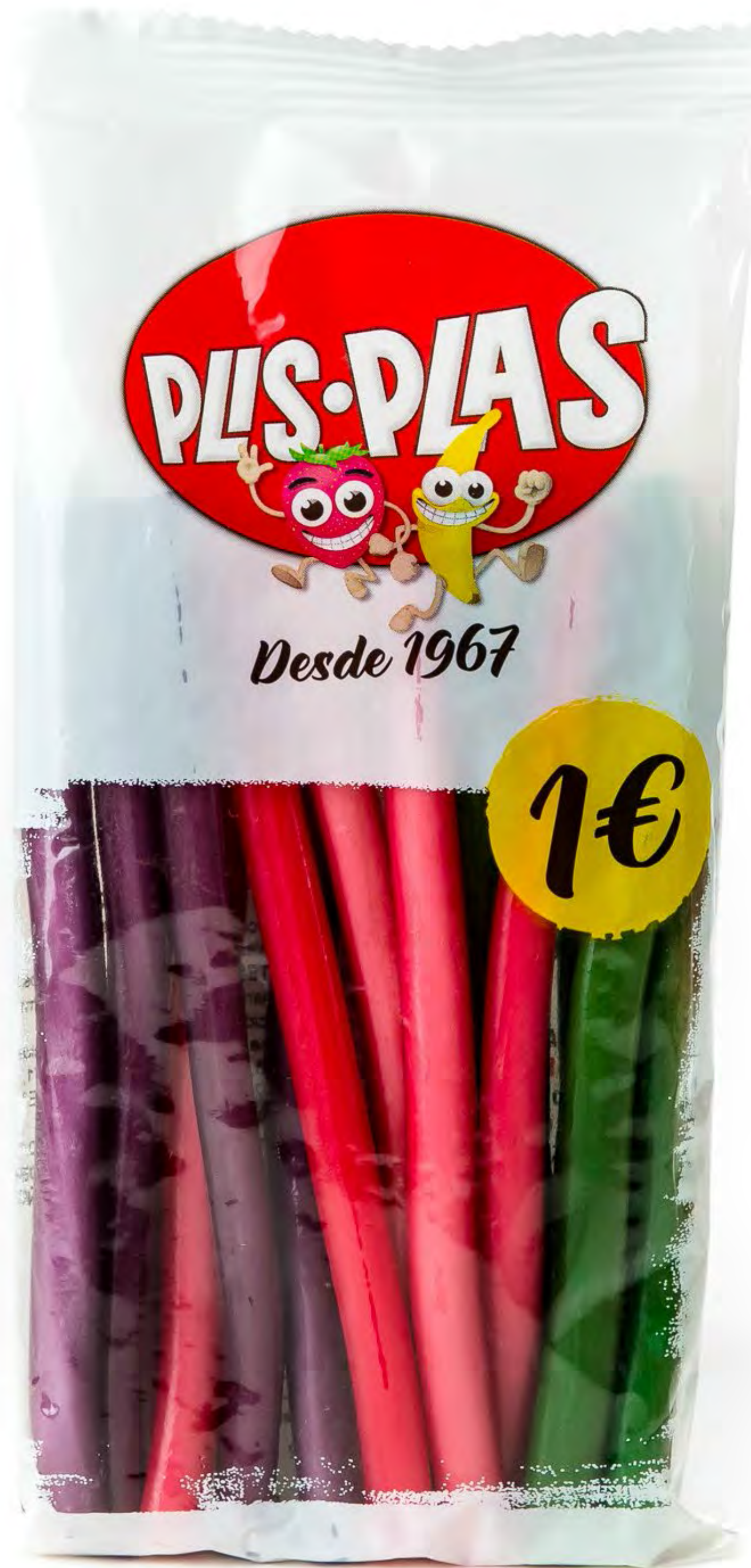
Cod.125056 Plispalitos brillo 12und/caja