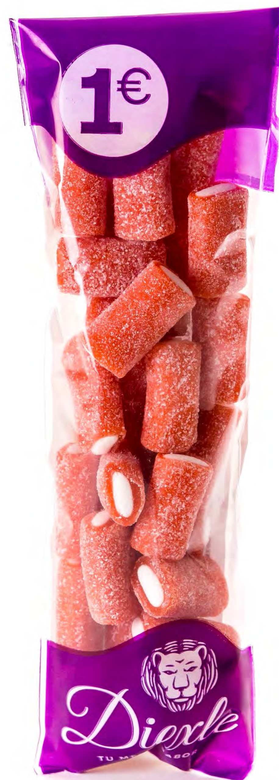
Cod: 193064 Tacos Rell. Pica Fresa 20 und/caja