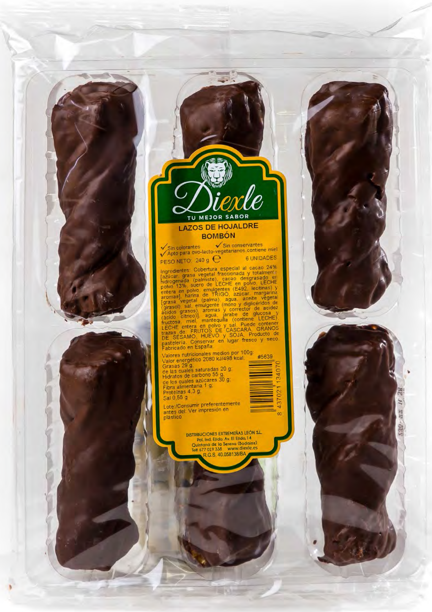
Cod. 054003 Lazos Choco 15 uds/caja