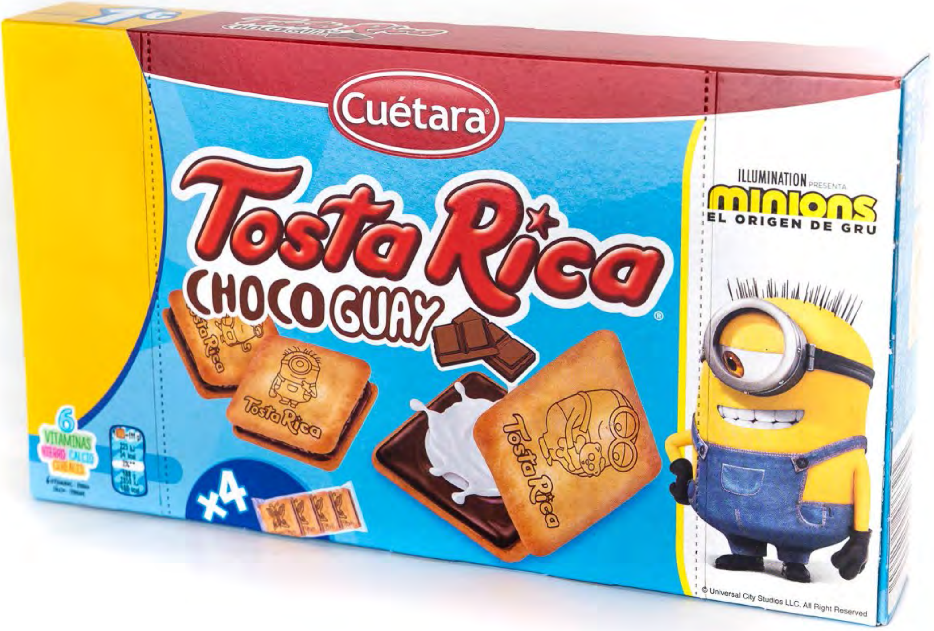
Tosta Rica Choco Guay