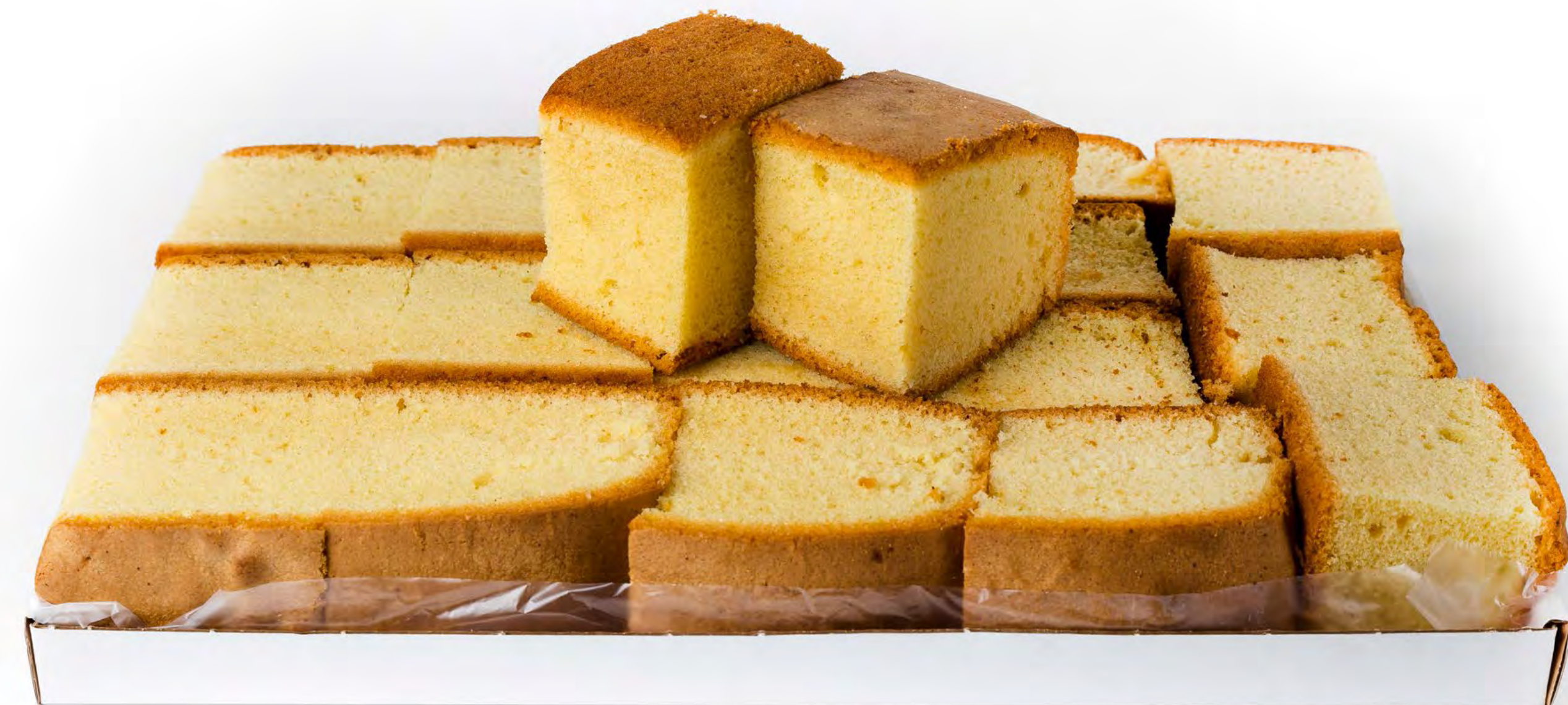
Bizcochos Cortados 3 Kg.