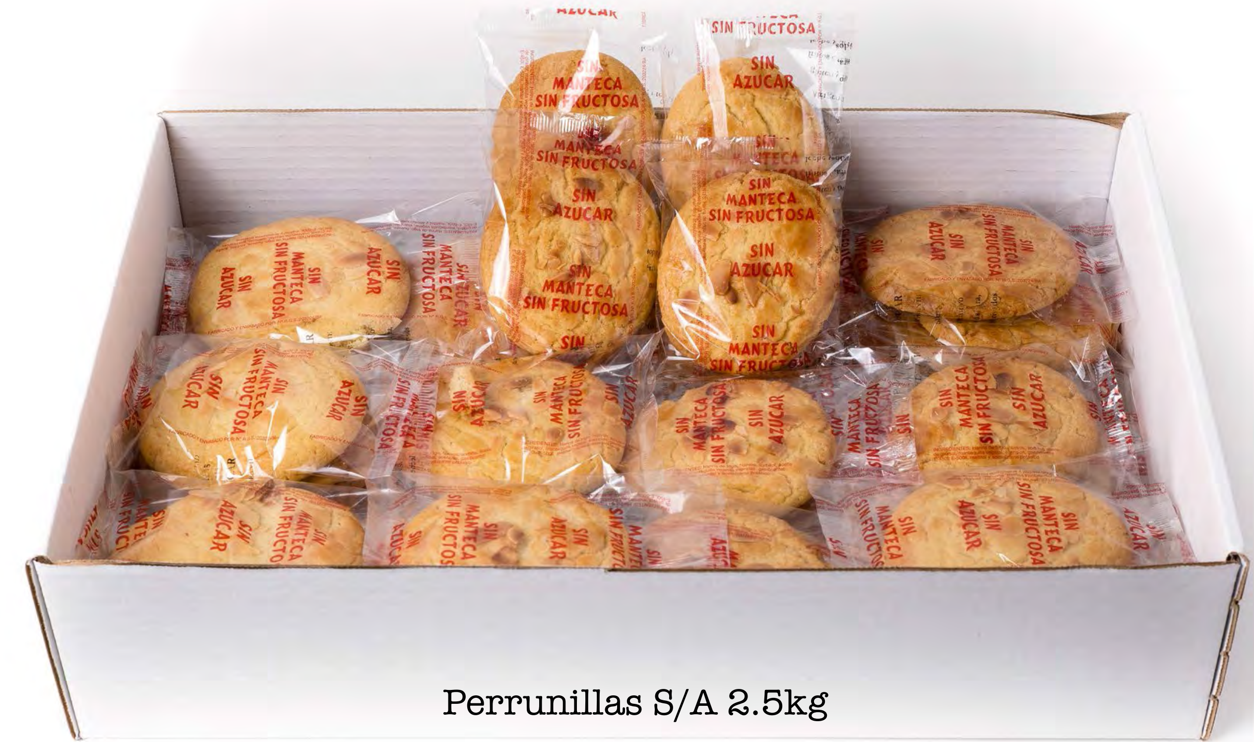
Perrunillas S/A 2.5kg