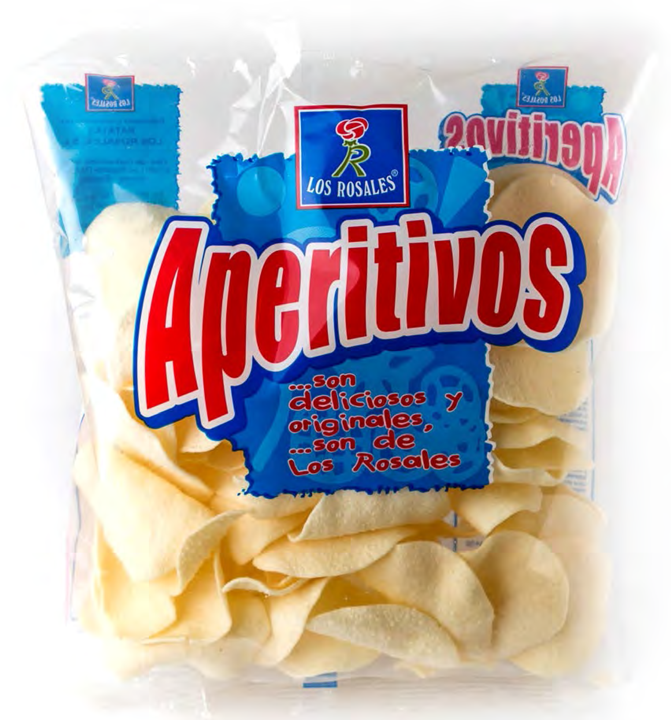
Cod. 002002 - Patata Deshidratada - 100g. x 12 uds/caja