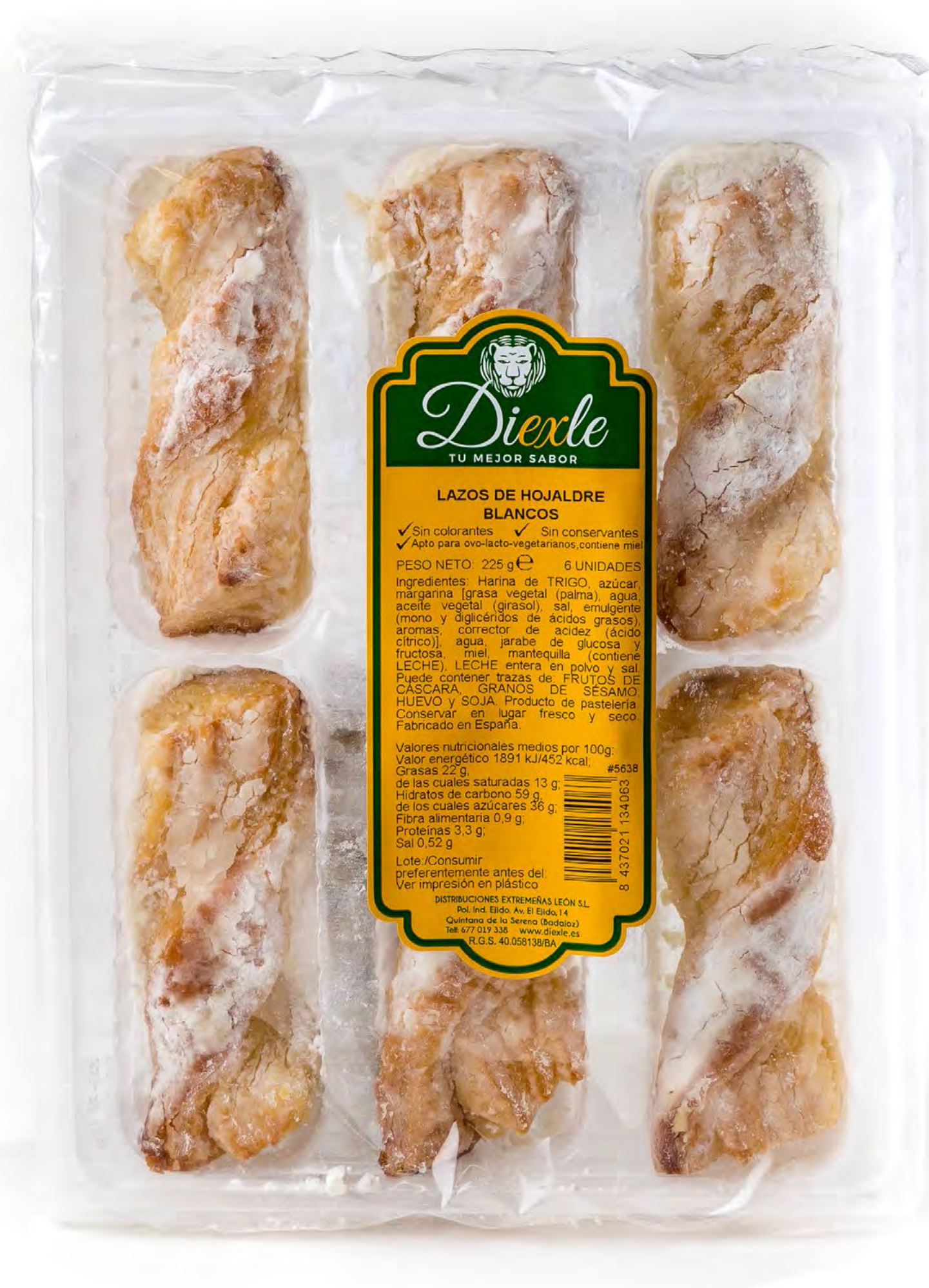
Cod. 054001 Lazos Blancos 15 uds/caja