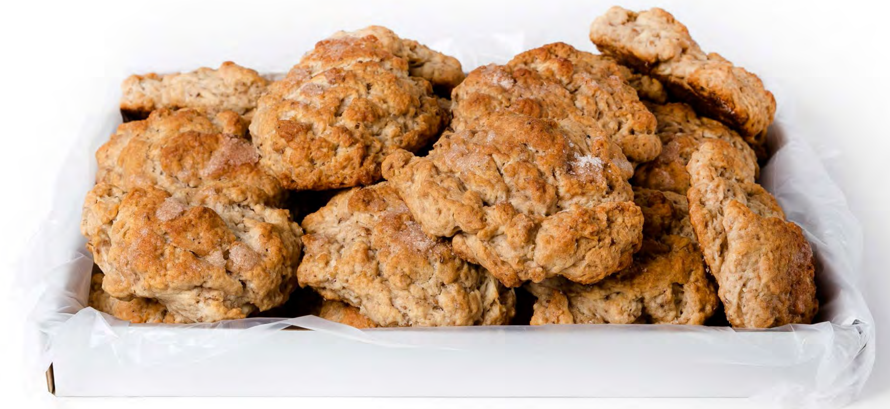
Tortas Chicharrón Caseras 3 Kg.