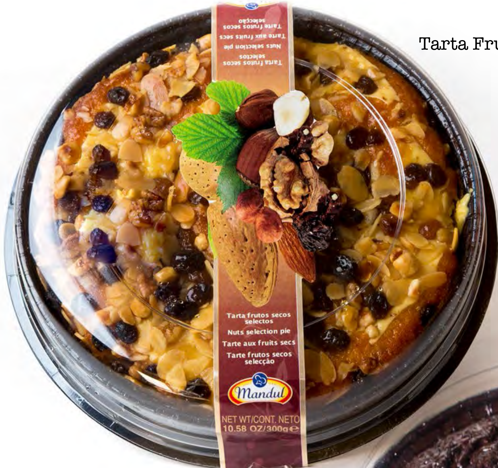
Tarta Frutos Secos 6 uds/caja