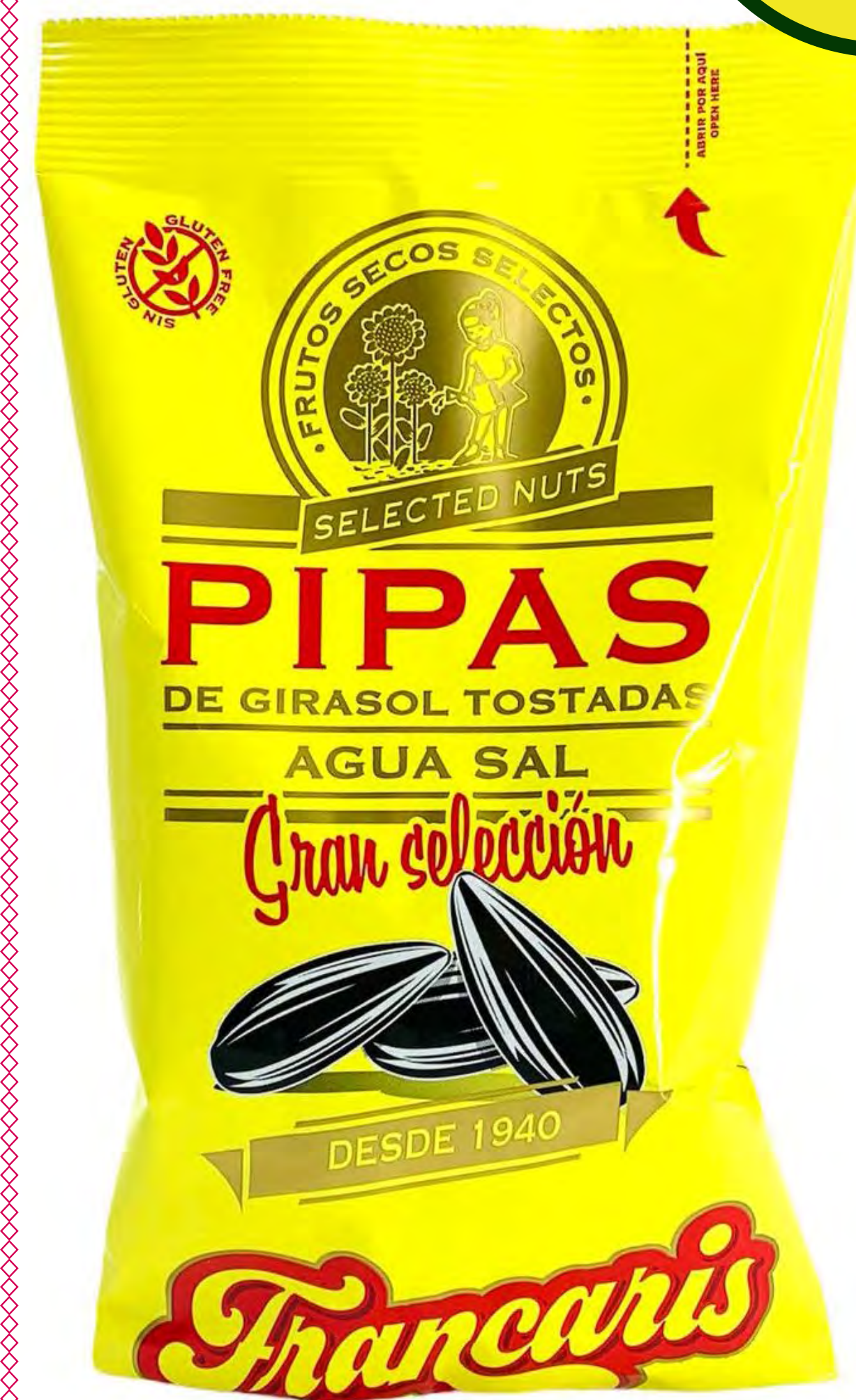
Pipas agusal 12 und/caja