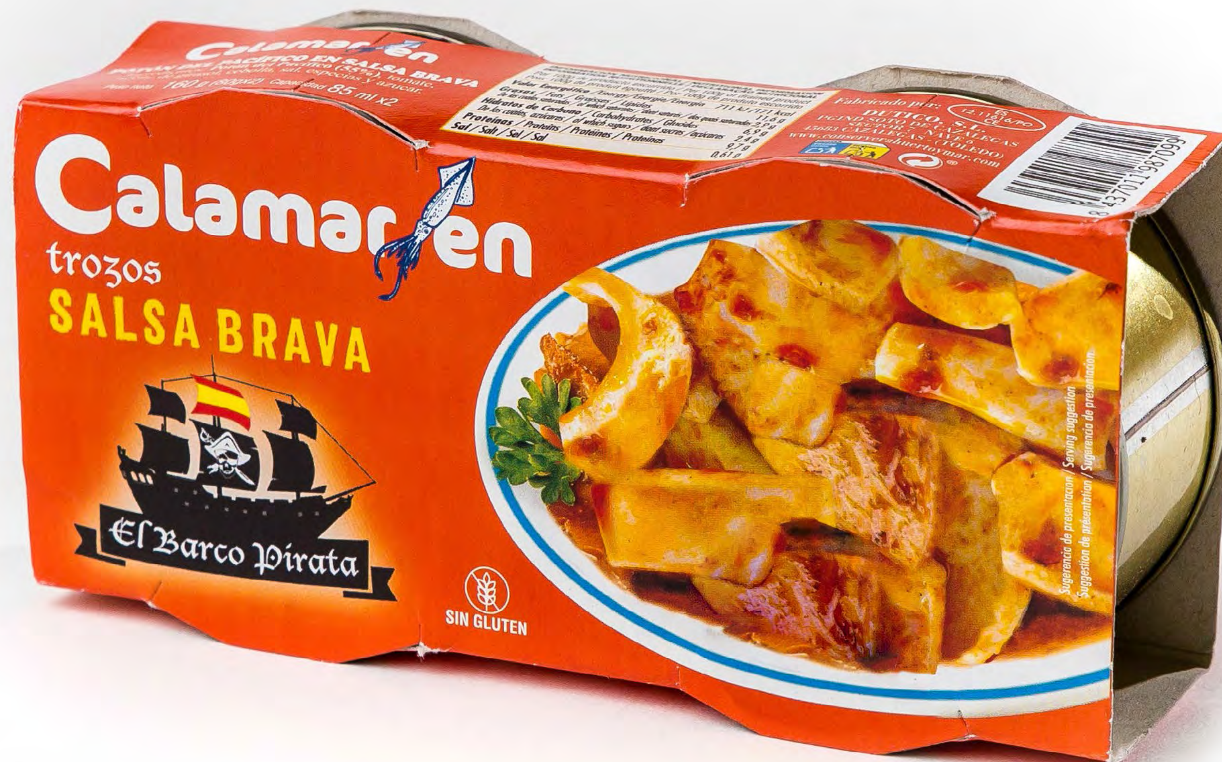
Calamares en Salsa Brava