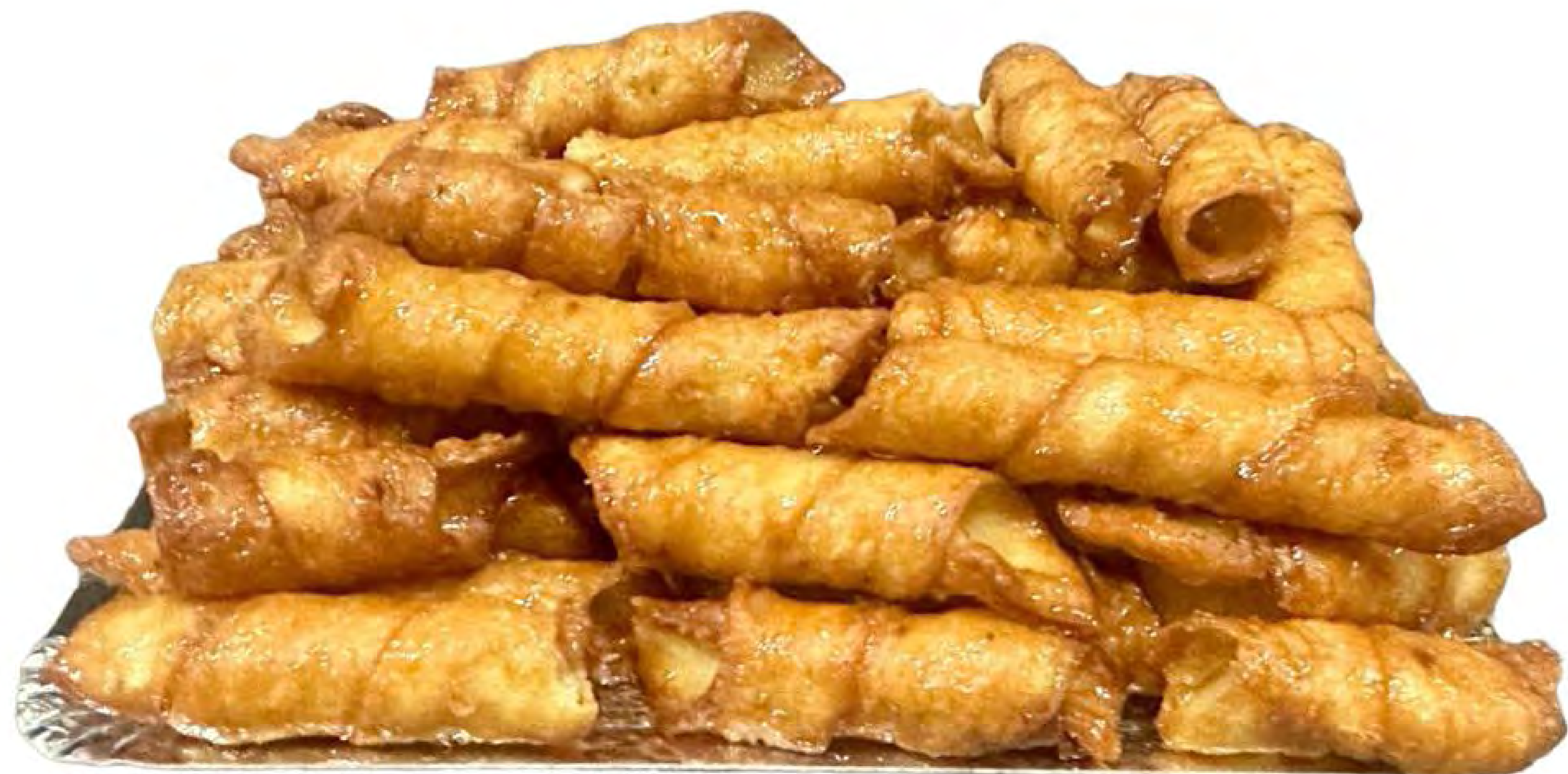
Borrachuelos Miel 2kg.