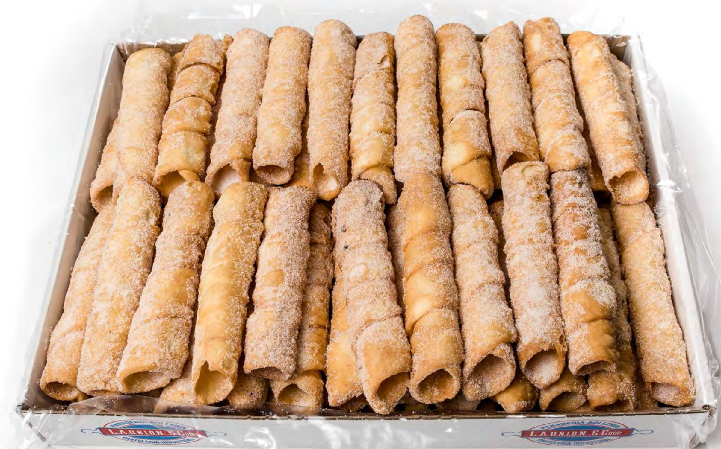
Borrachuelo de Azucar 2kg