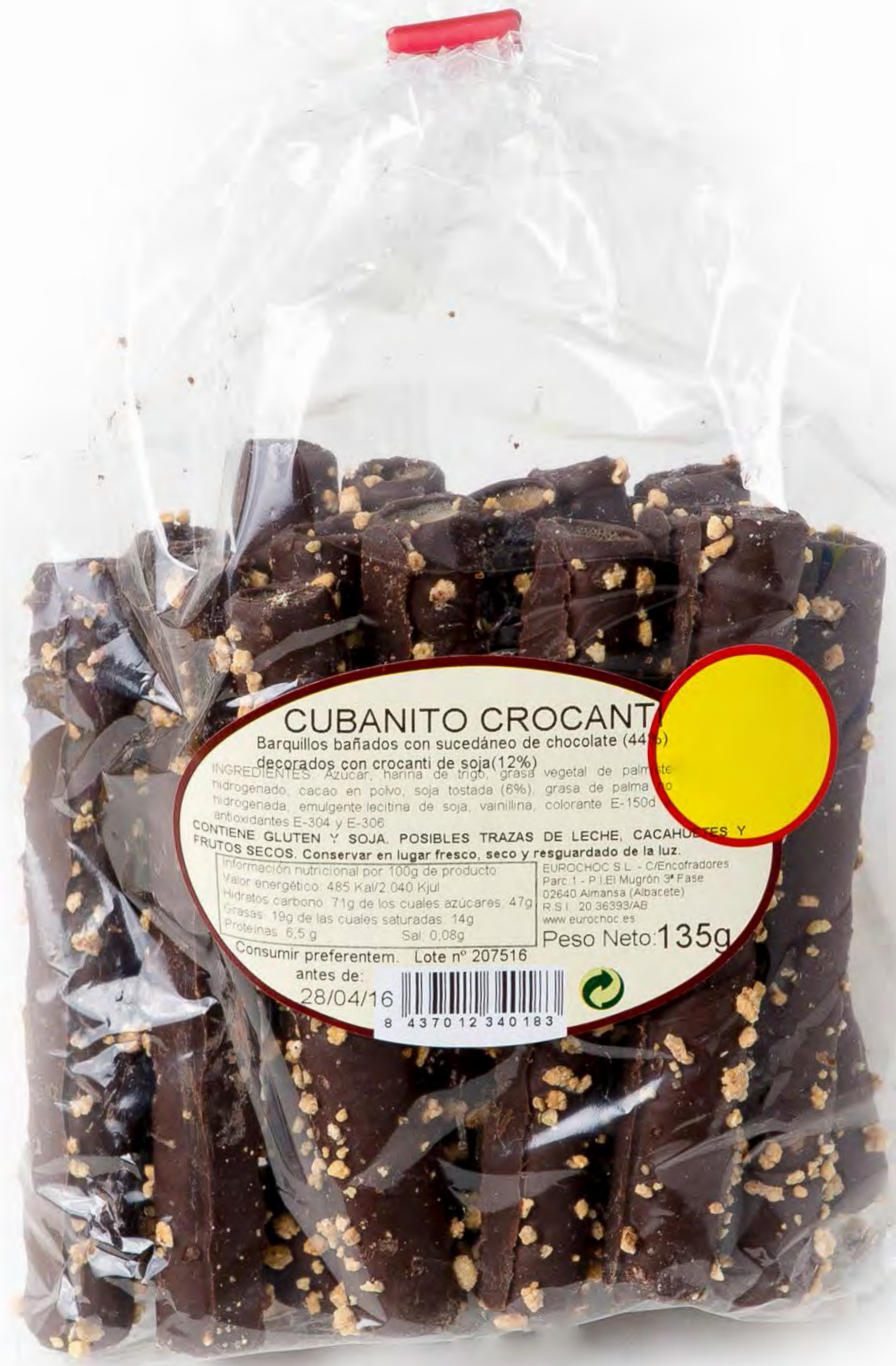
Cubanitos Crocanti 12 uds.