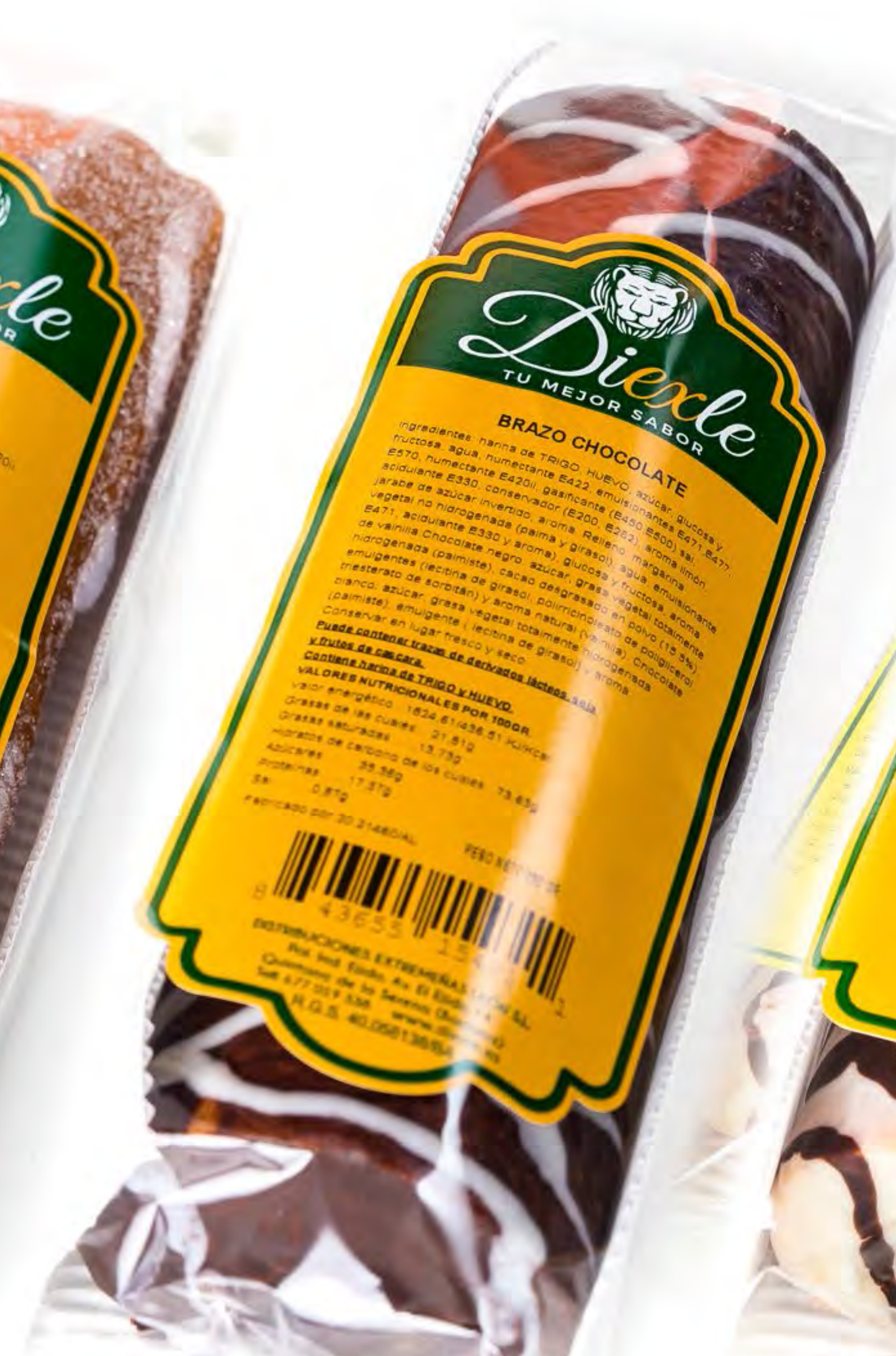
Brazo de Chocolate 10 uds/caja