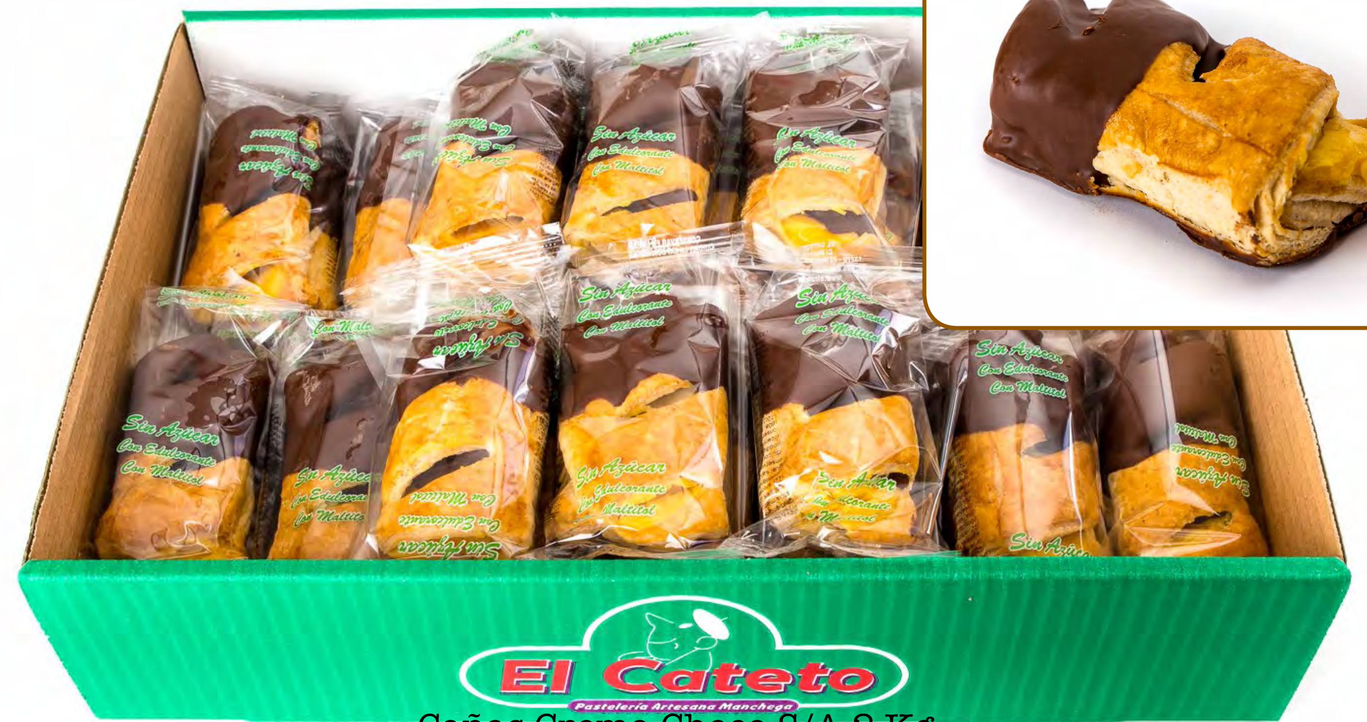
Cañas Crema Choco S/A 2 Kg.