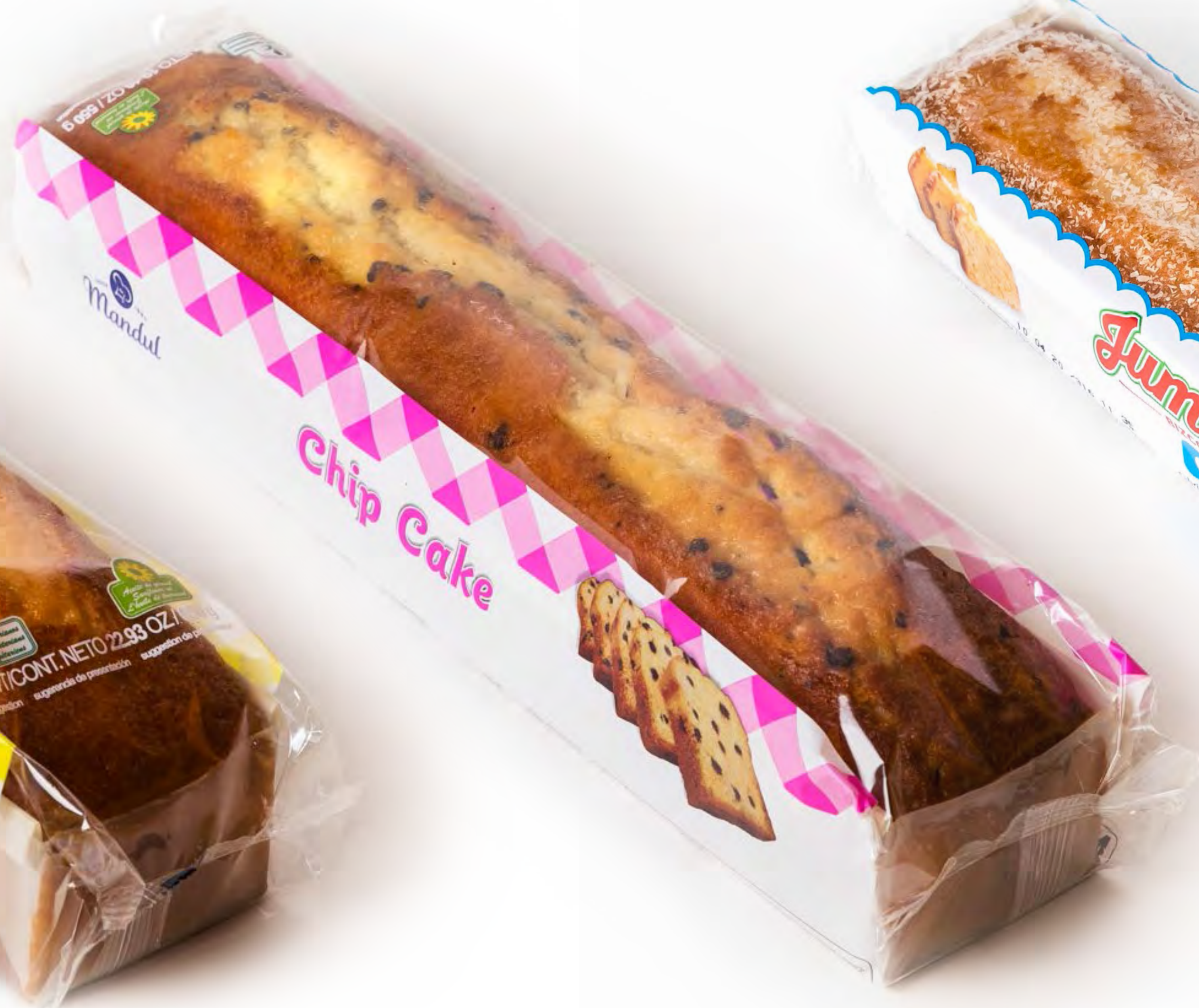
Cake Chispita 5 uds/caja 500g.