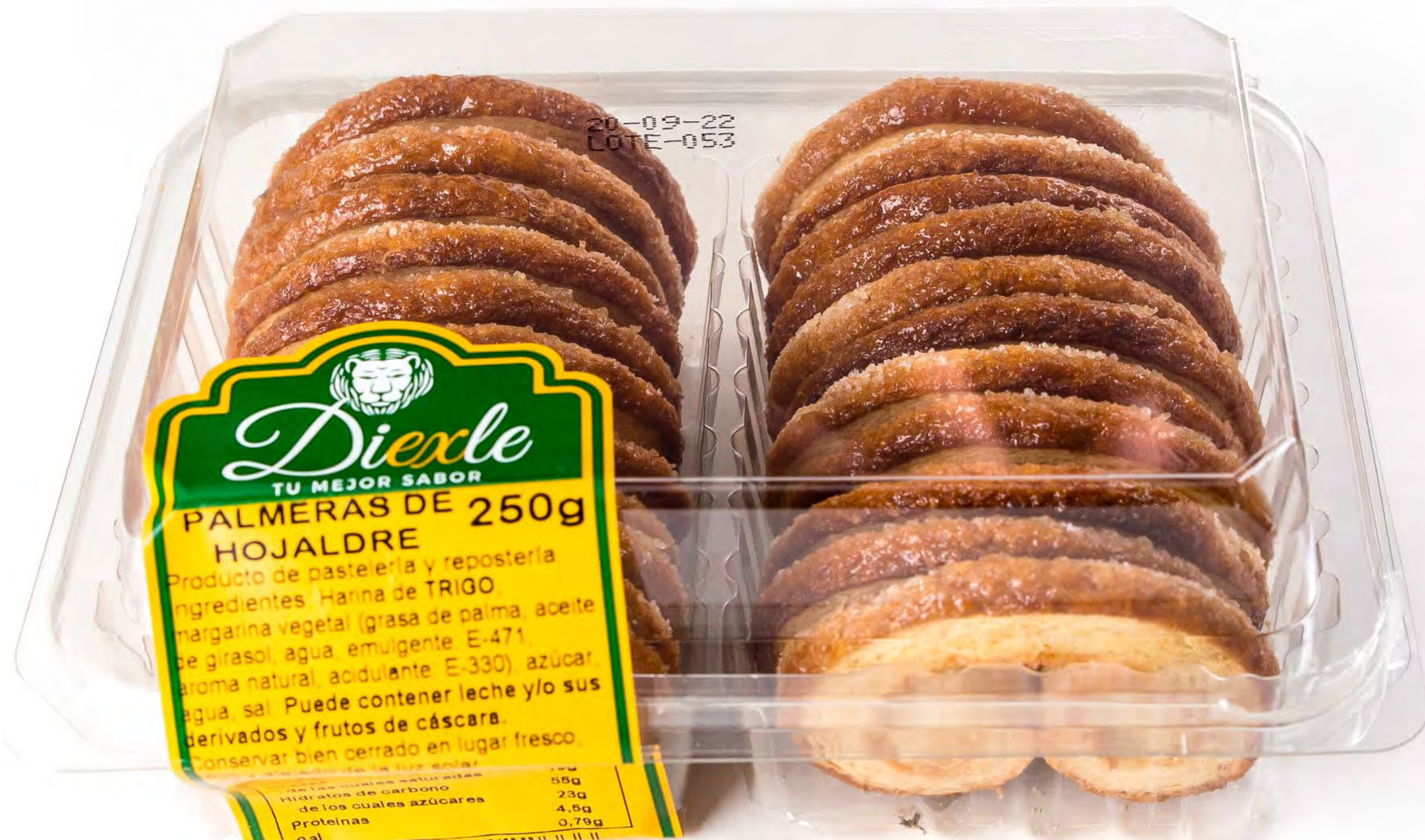
Cod. 018007 - Blíster Palmera Hojaldre Choco 8 und/caja