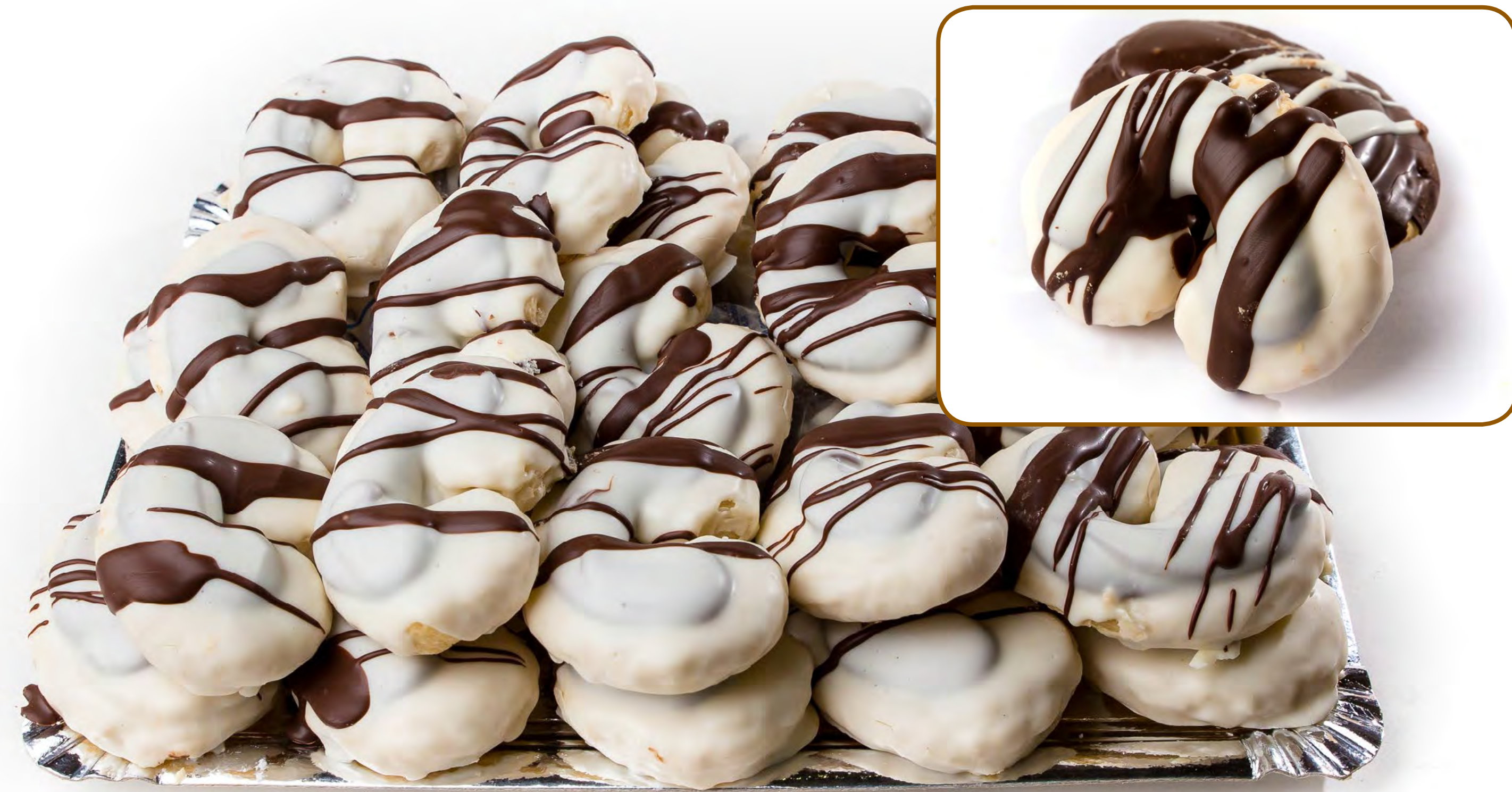
Cod. 253005 - Palmeritas Blanco - 1,5 Kg.