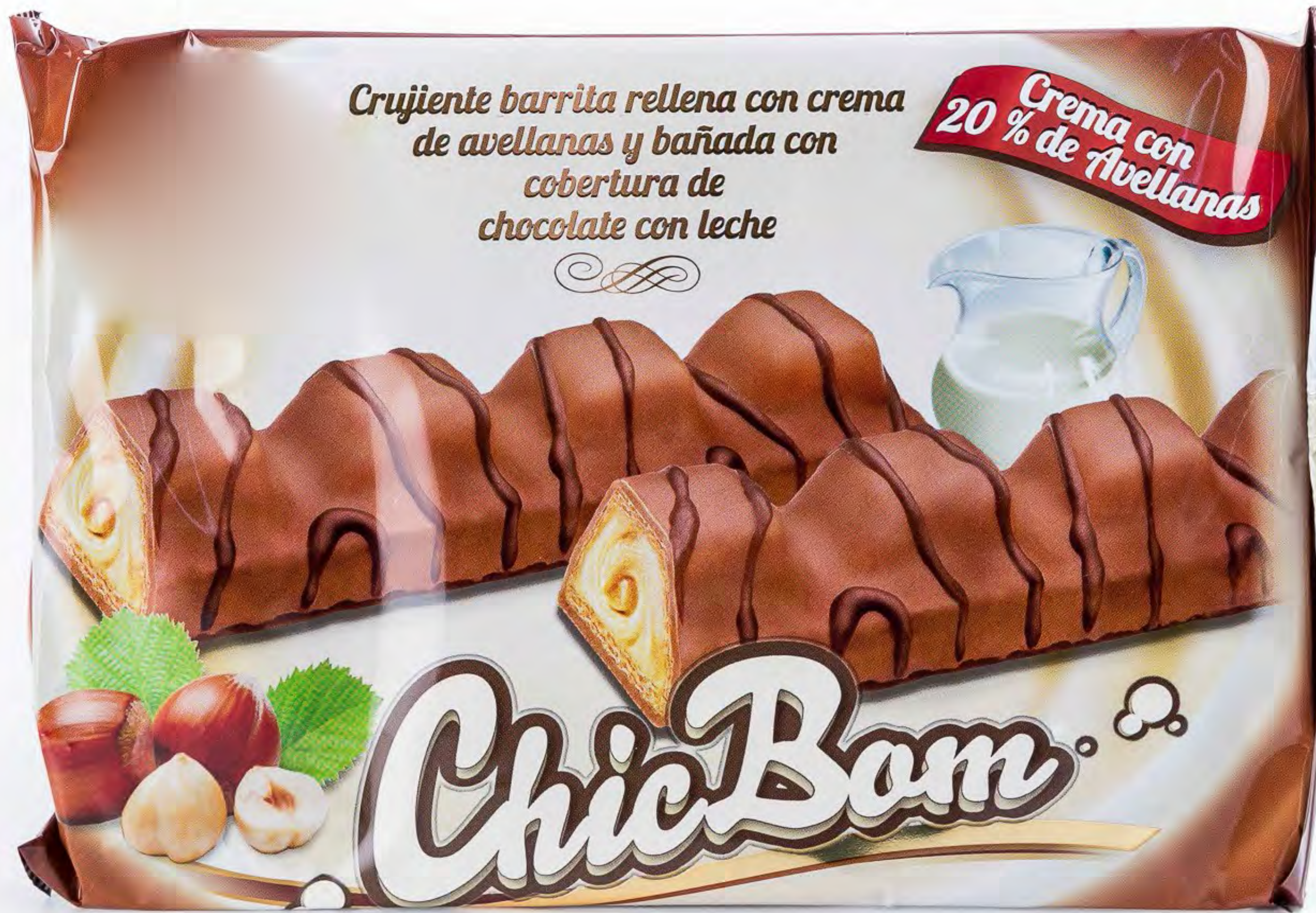
ChicBom Choco 18 uds/caja