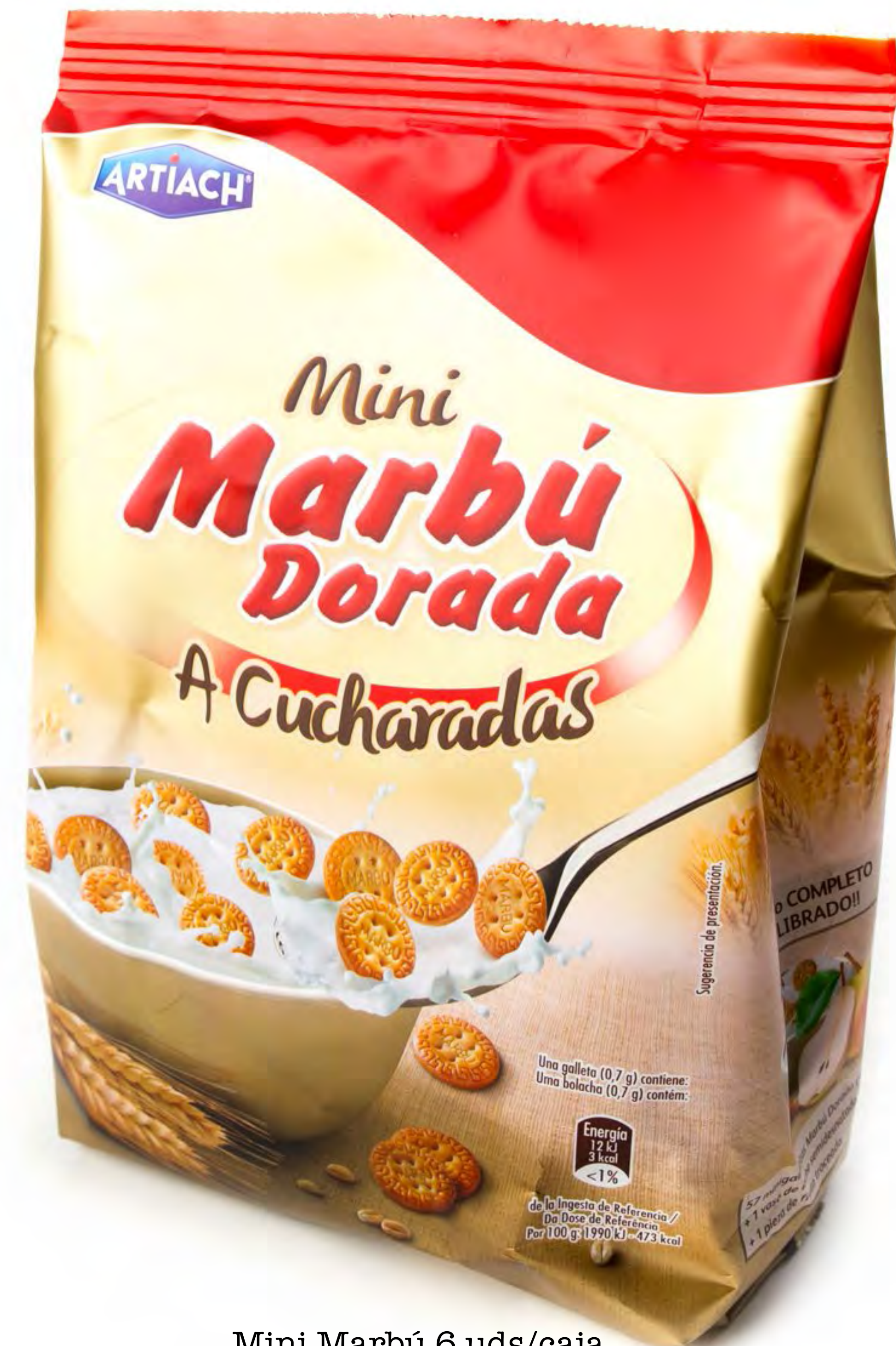
Mini Marbú 6 uds/caja