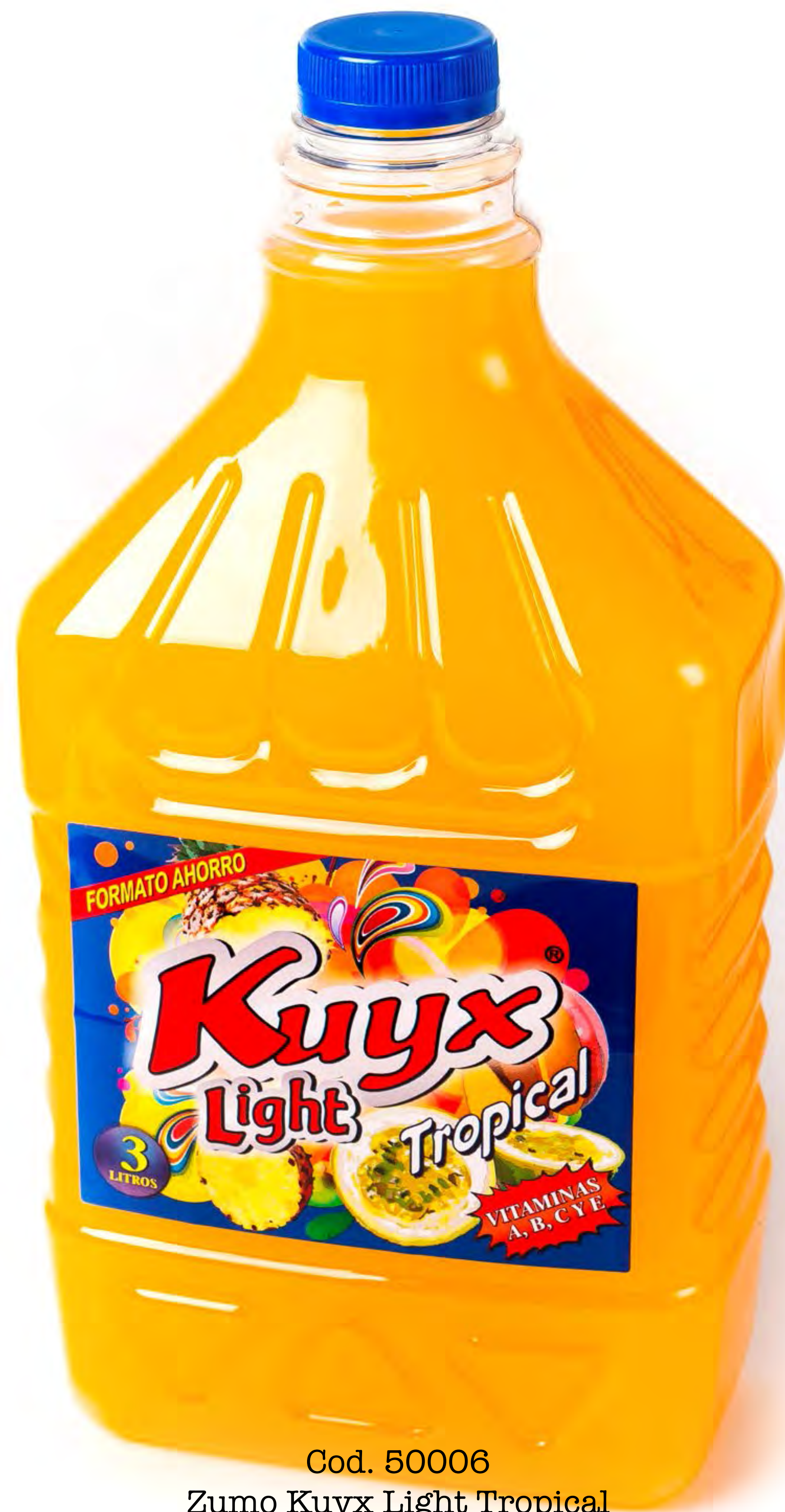
Cod. 50006 Zumo Kuyx Light Tropical 3L x 4 uds/caja