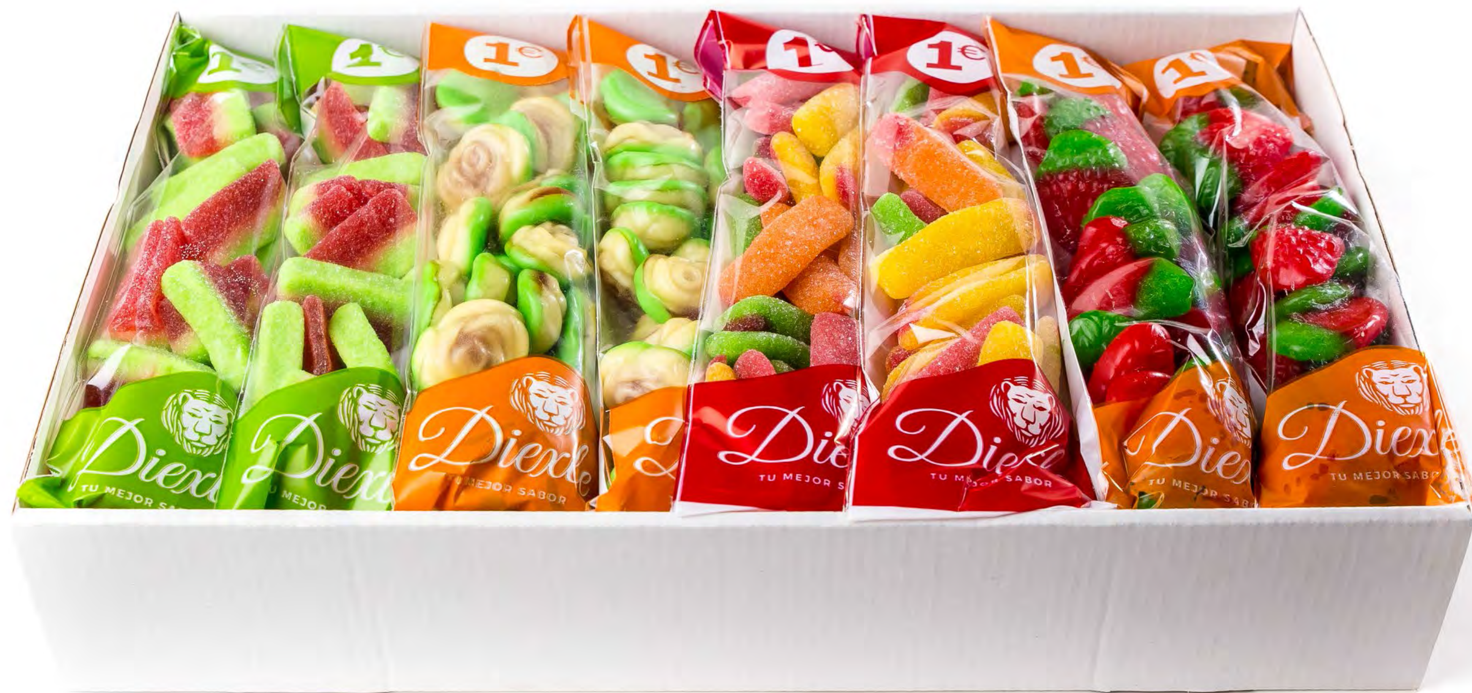
Cod. 198001 Gominolas Surtida Diexle 20 uds/caja