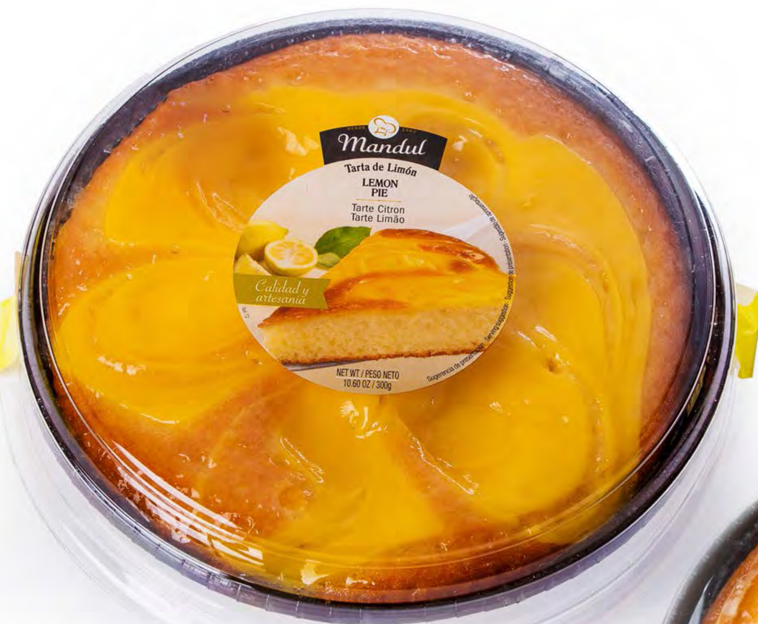
Tarta Limón 6 uds/caja