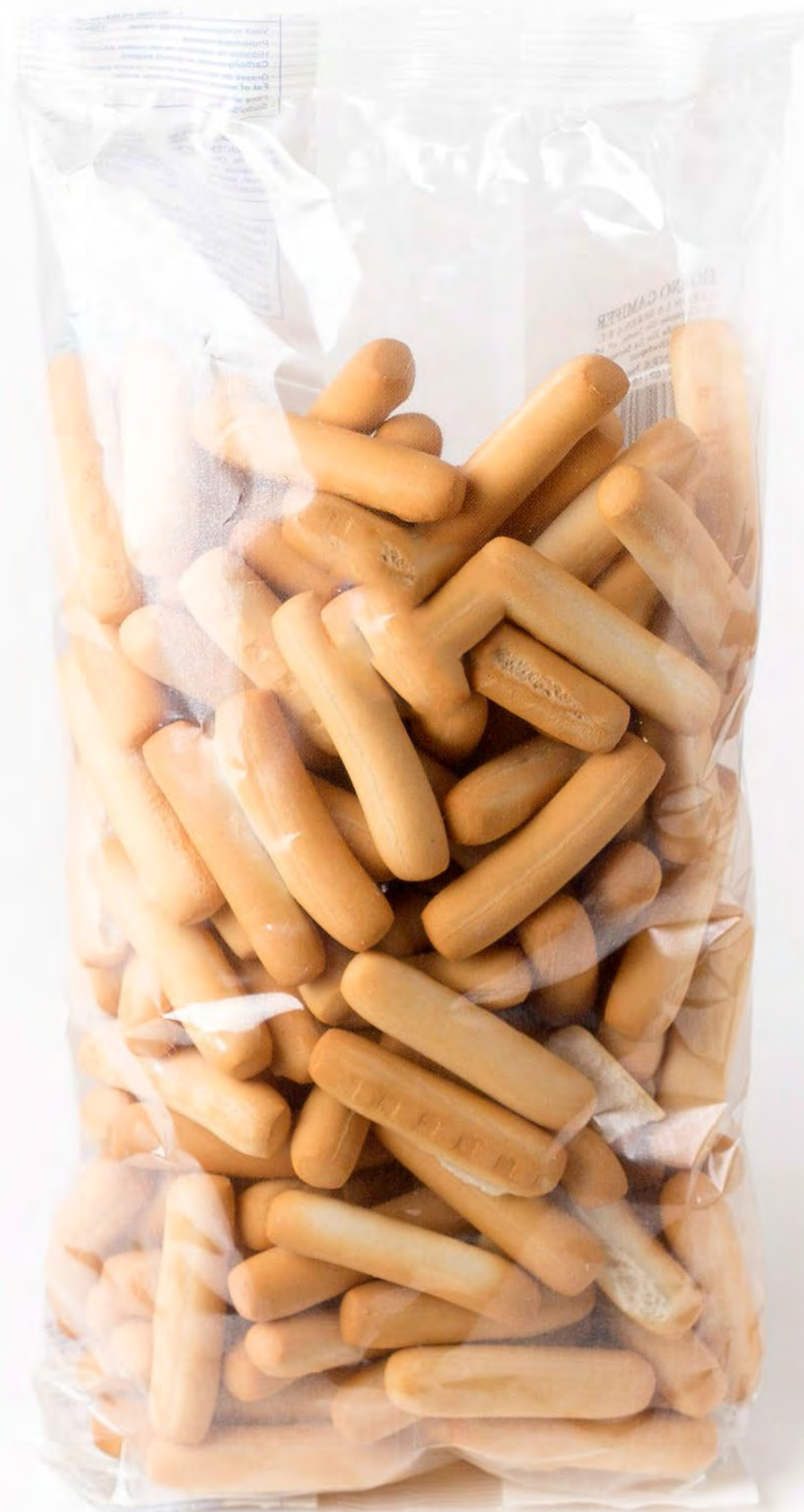
Cod. 164012 Picos Finos 12 uds/caja