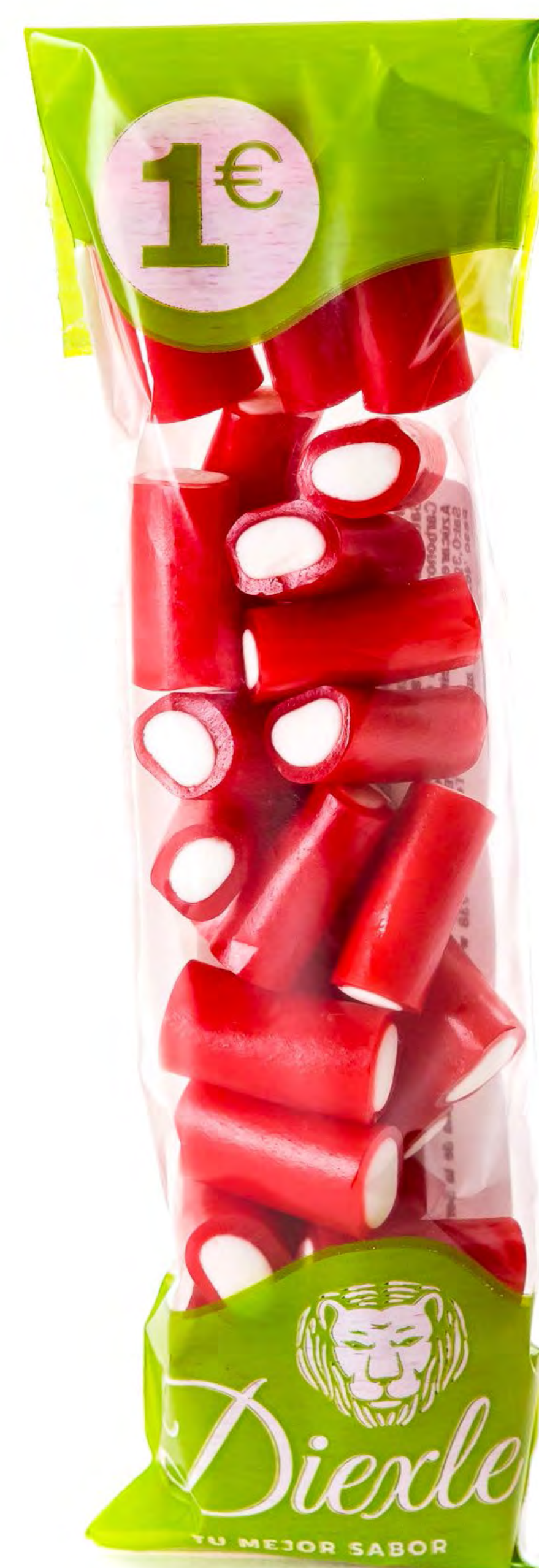
Cod: 193062 Tacos Rell. Fresa 20 und/caja