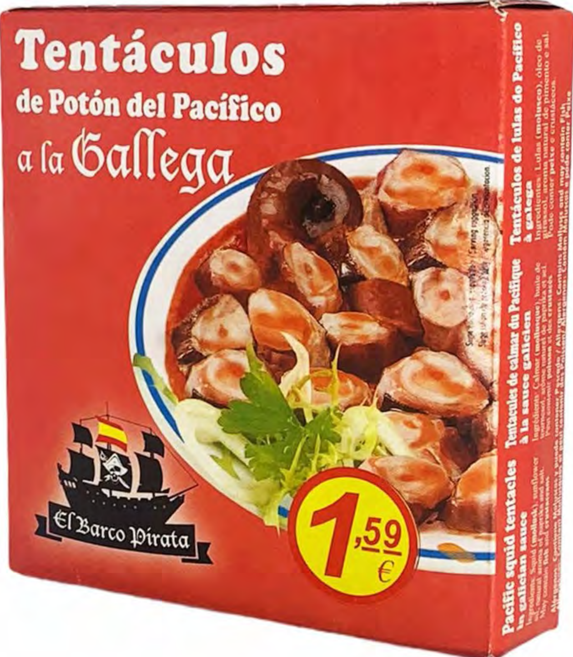
Tacos a la Gallega 26 und/caja