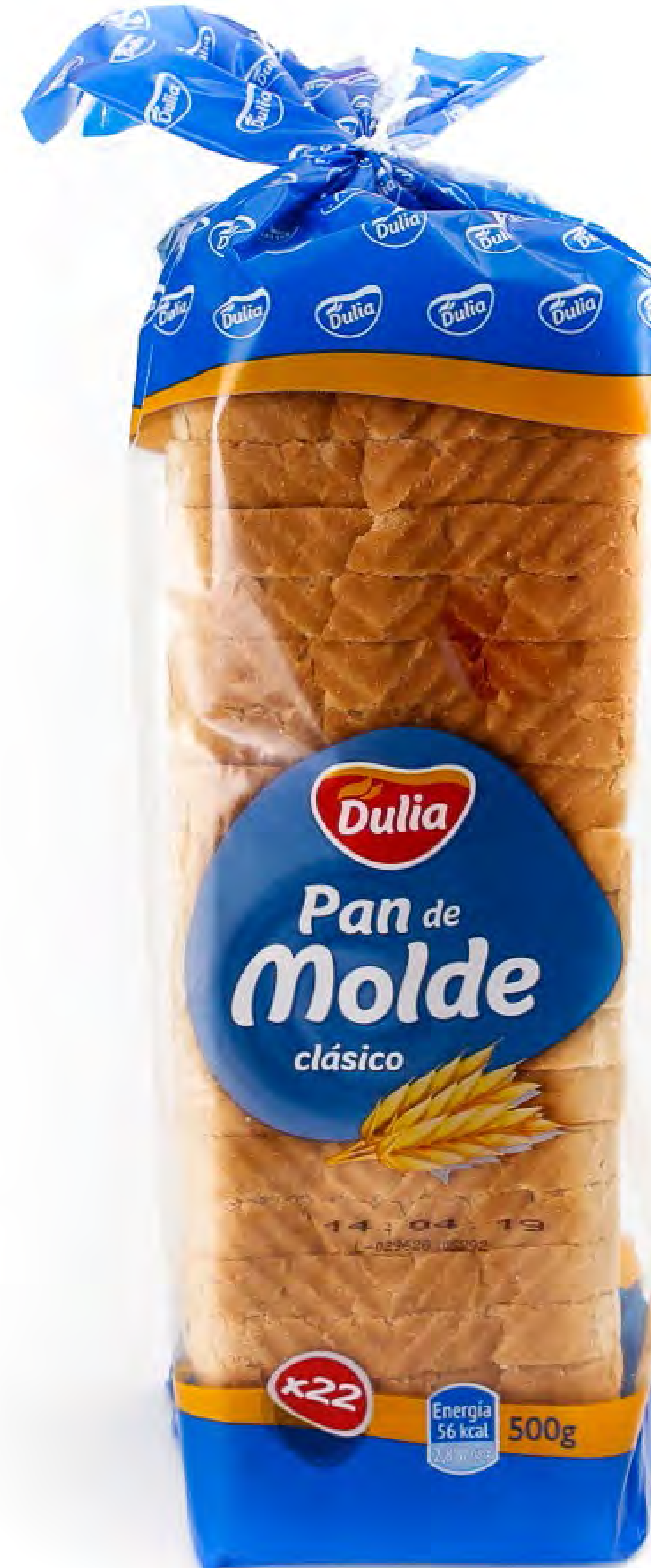
Pan de Molde 500g. x 7 uds/caja