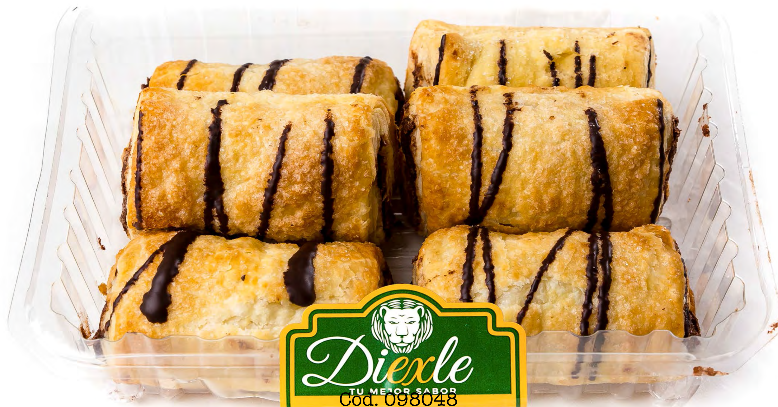
Cod. 098048 Blister Cañas Nutela 8 uds/caja